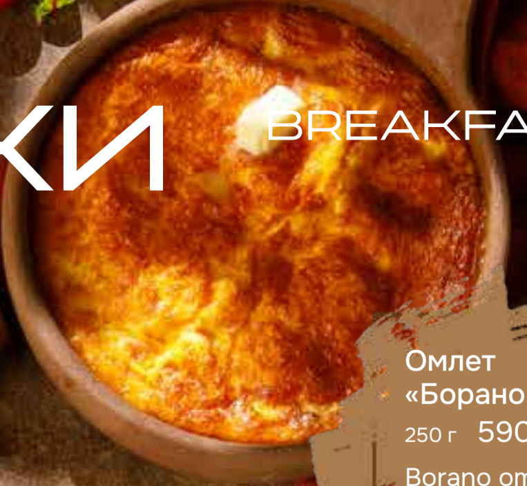
Омлет «Борано» 250 г 590 ₺ Borano omelette 干酪炒蛋