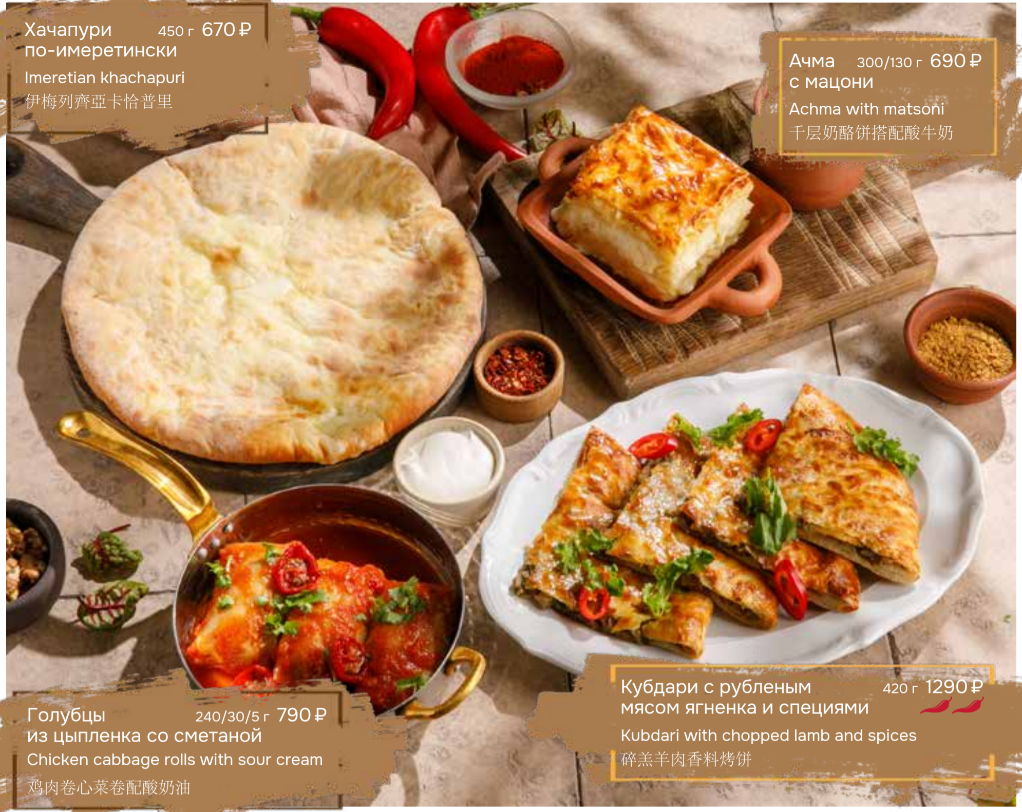
Хачапури 450 г 670 ₴ по-имеретински Imeretian khachapuri 伊梅列齊亞卡恰普里