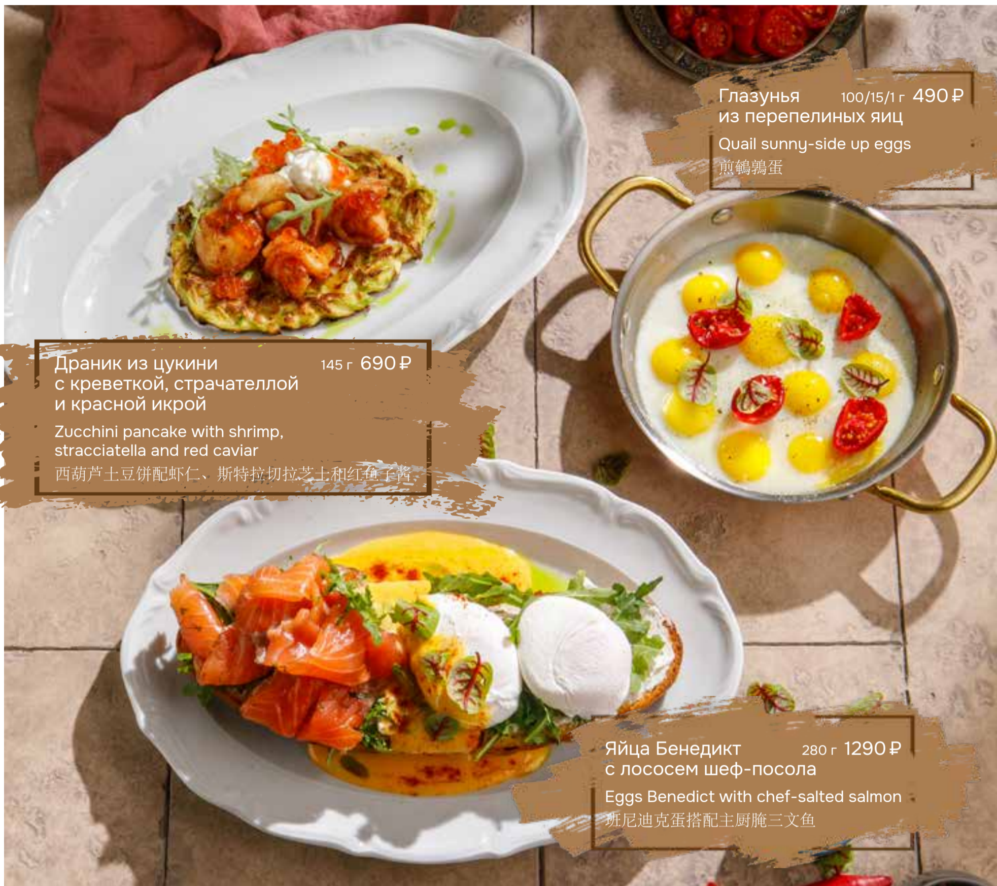
Глазунья 100/15/1 г 490 ₺ из перепелиных яиц Quail sunny-side up eggs 煎鹌鹑蛋