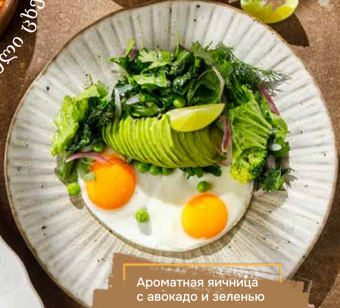
Ароматная яичница с авокадо и зеленью 80/65/40/10 г 690 ₺ Aromatic fried eggs with avocado and greens 牛油果青菜浓香煎蛋