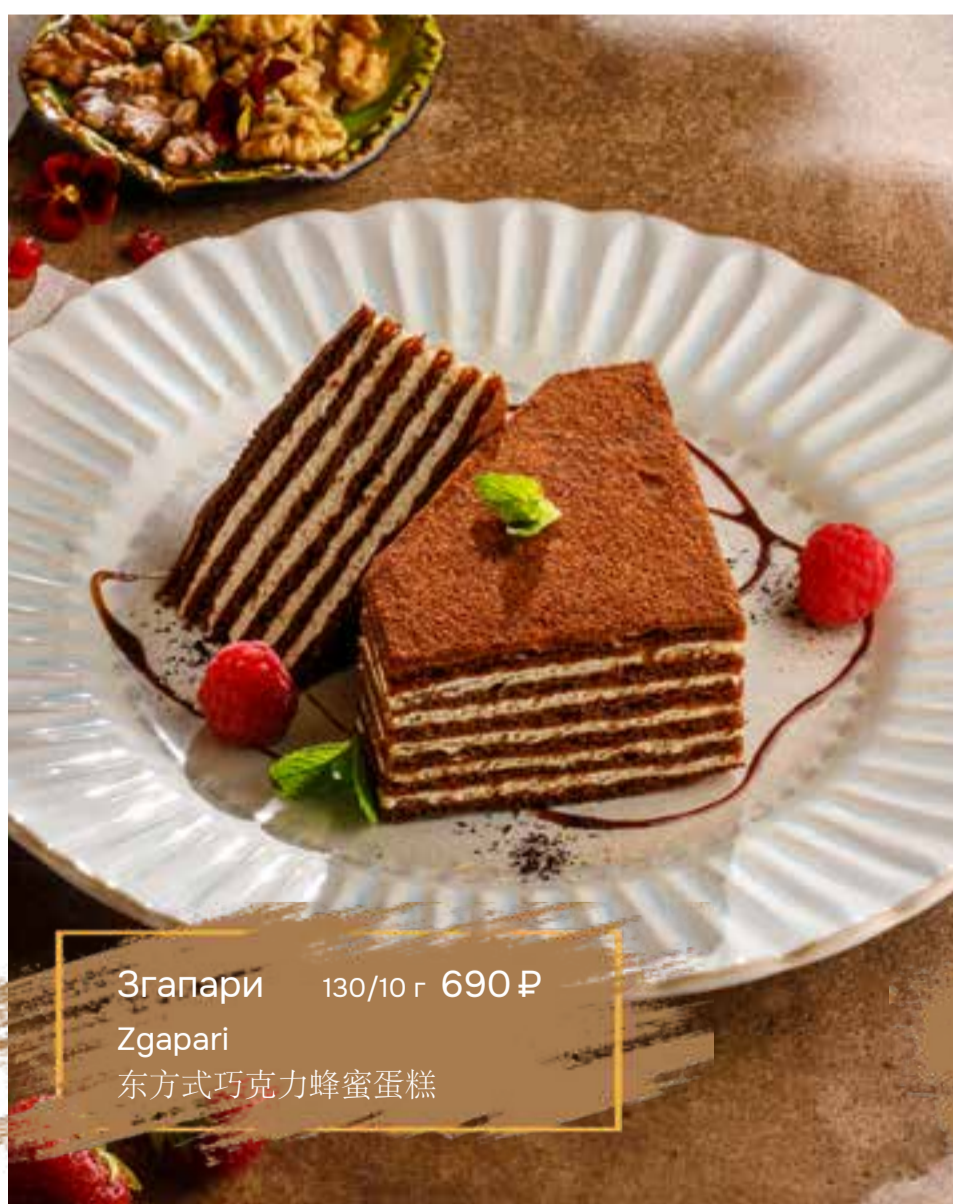
Згапари 130/10 г 690 ₺ Zgapari 东方式巧克力蜂蜜蛋糕