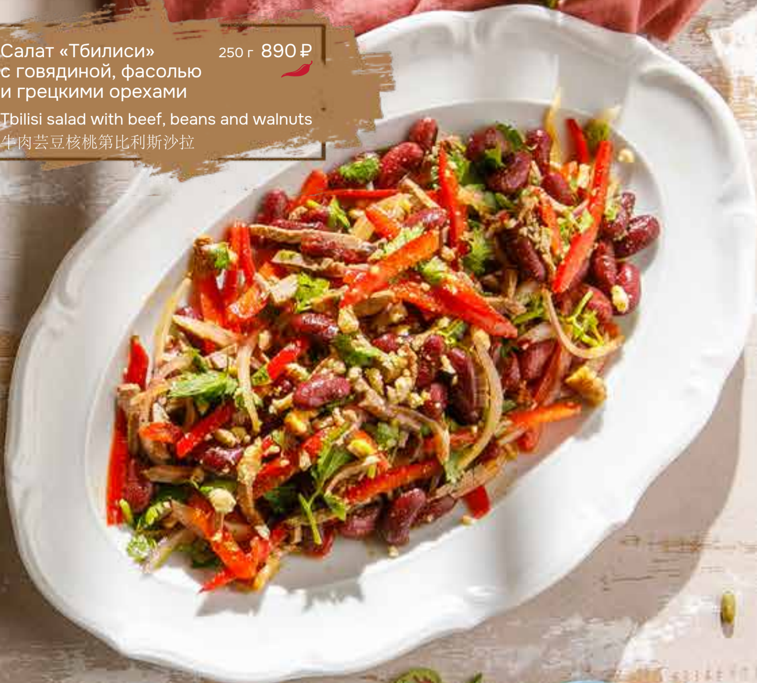
Салат «Тбилиси» с говядиной, фасолью и грецкими орехами 250 г 890 ₴ Tbilisi salad with beef, beans and walnuts 牛肉芸豆核桃第比利斯沙拉