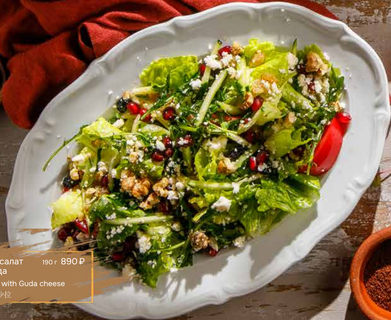
Восточный салат с сыром гуда 190 г 890 ₴ Oriental salad with Guda cheese 古达奶酪东方沙拉