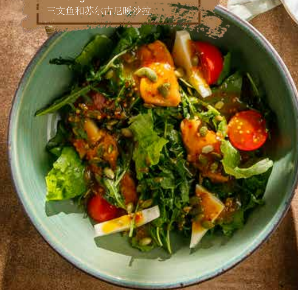
Теплый салат 220 г 1390 ₺ с лососем и сыром сулугуни Warm salad with salmon and Sulguni cheese 三文鱼和苏尔古尼暖沙拉