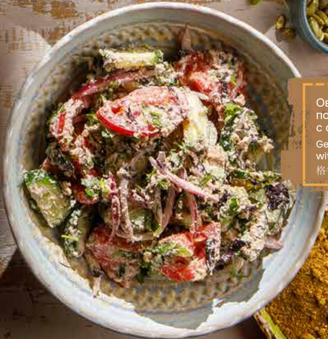
Овощной салат по-грузински с орехами 260 г 690 ₴ Georgian vegetable salad with nuts 格鲁吉亚式蔬菜坚果沙拉