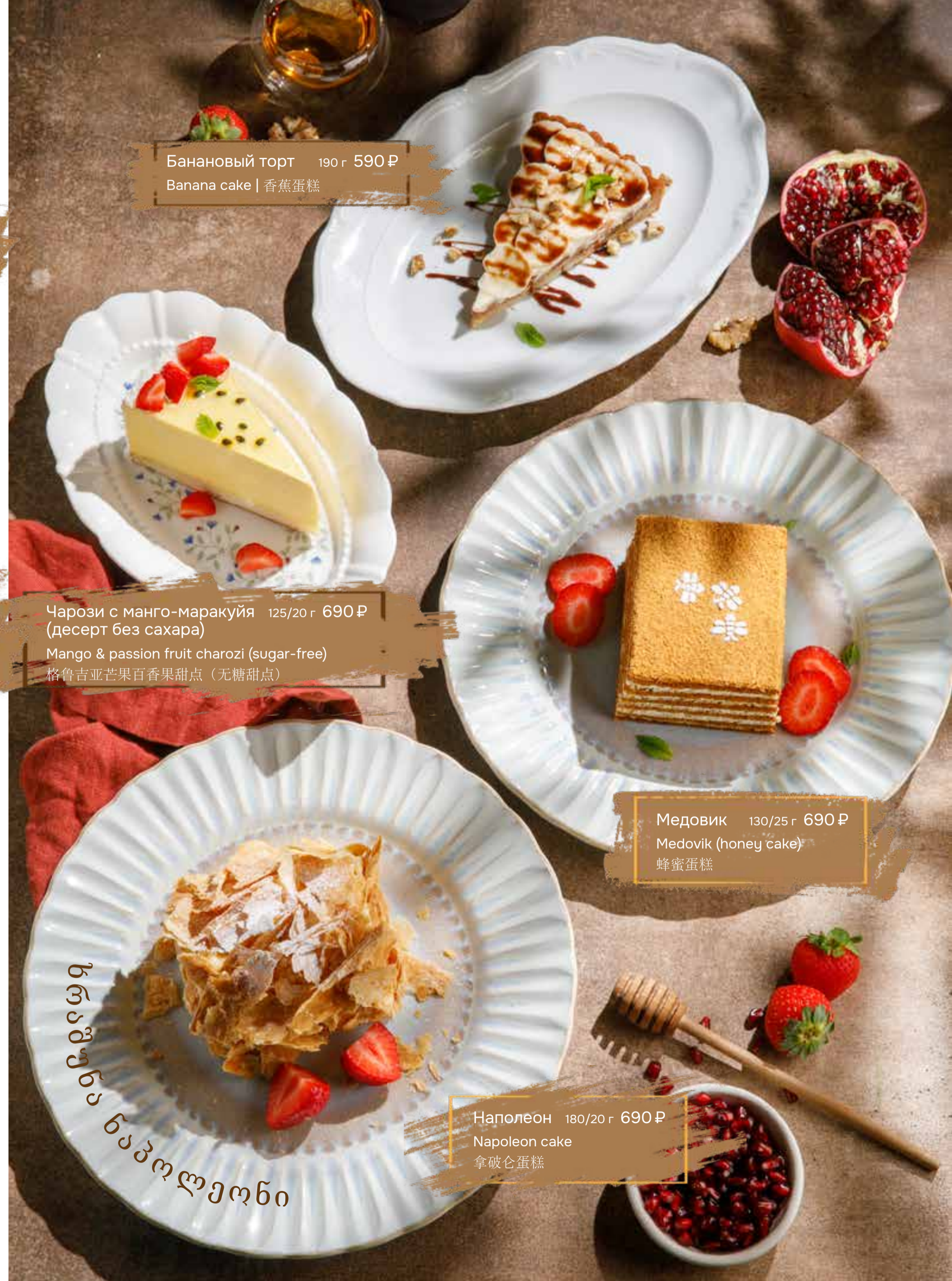
Банановый торт 190 г 590 ₺ Banana cake | 香蕉蛋糕