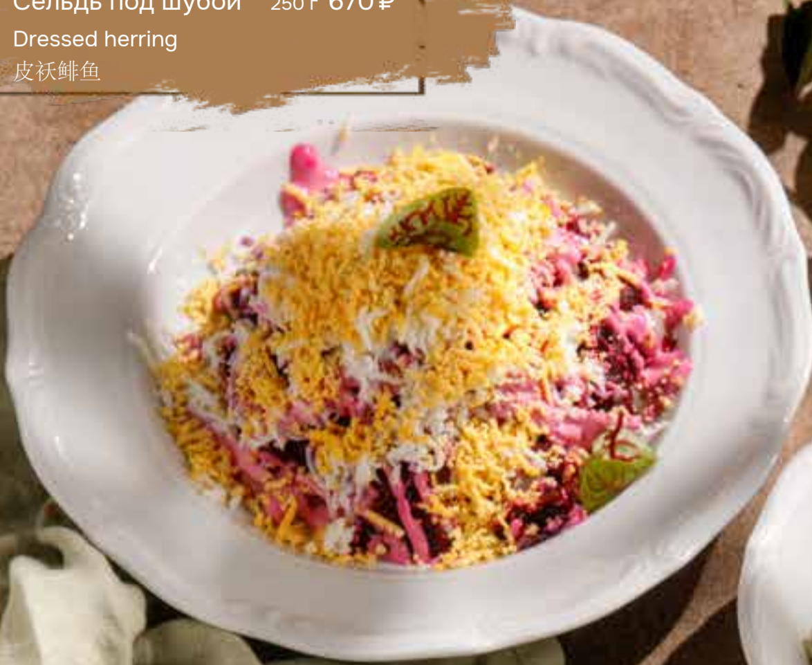
Сельдь под шубой 250 г 670 ₺ Dressed herring 皮祇鲱鱼