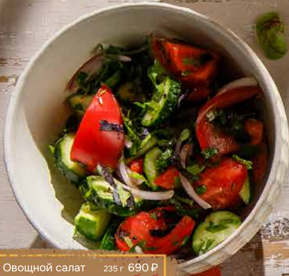
Овощной салат по-грузински со специями 235 г 690 ₴ Georgian vegetable salad with spices 格鲁吉亚式蔬菜沙拉加调料