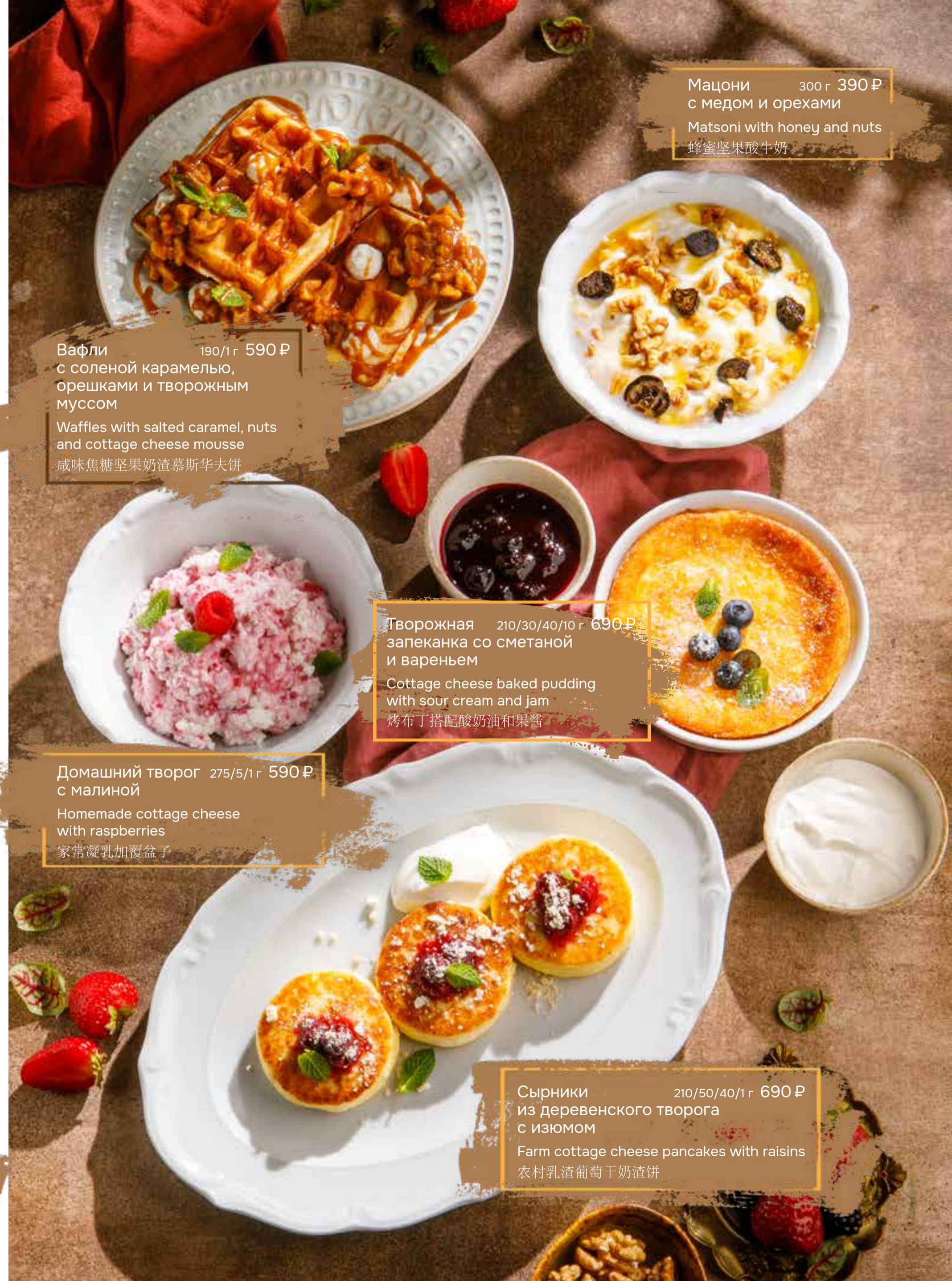
Мацони 300 г 390 ₺ с медом и орехами Matsoni with honey and nuts 蜂蜜坚果酸牛奶