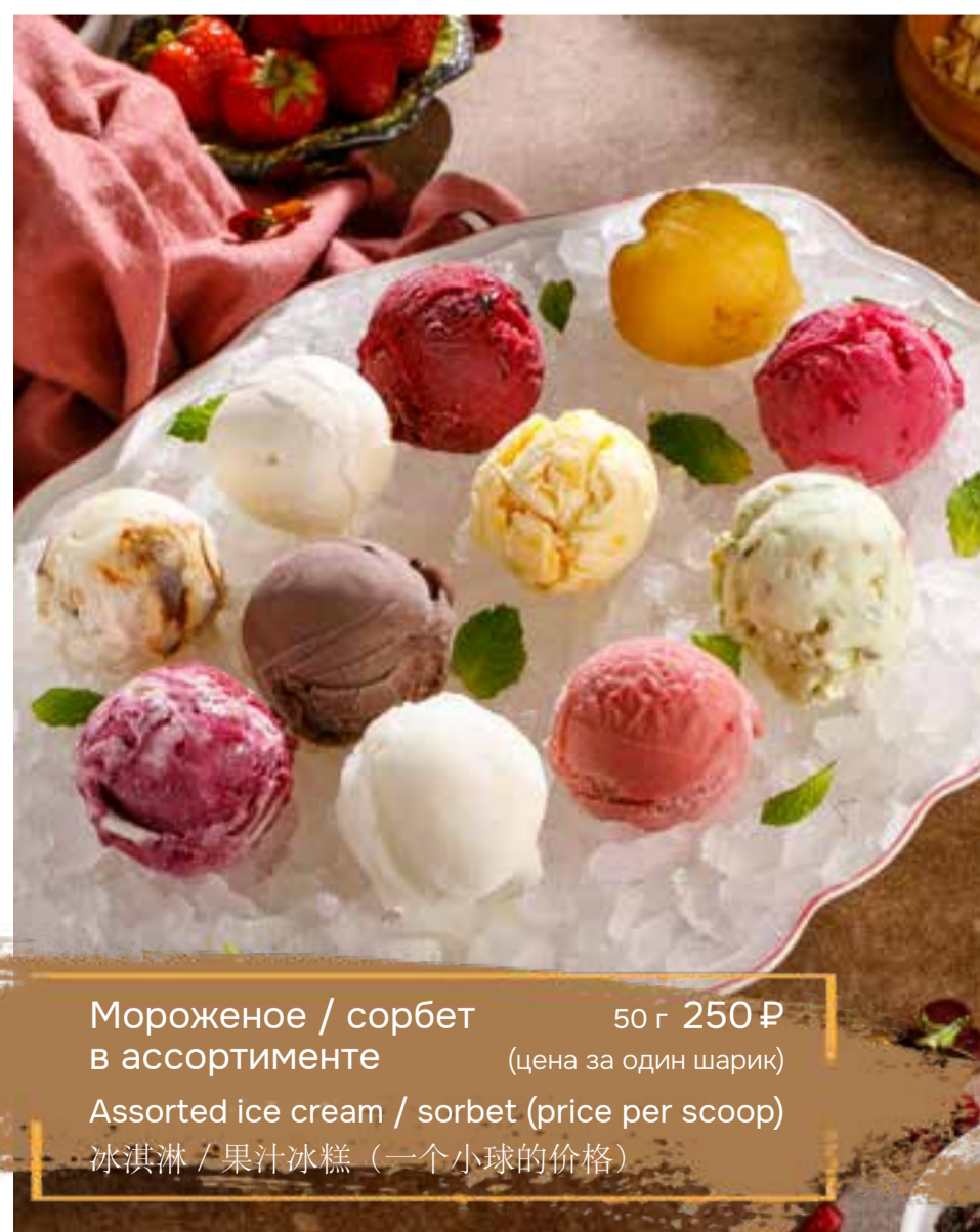
Мороженое / сорбет в ассортименте 50 г 250 ₺ (цена за один шарик) Assorted ice cream / sorbet (price per scoop) 冰淇淋 / 果汁冰糕 (一个小球的价格)