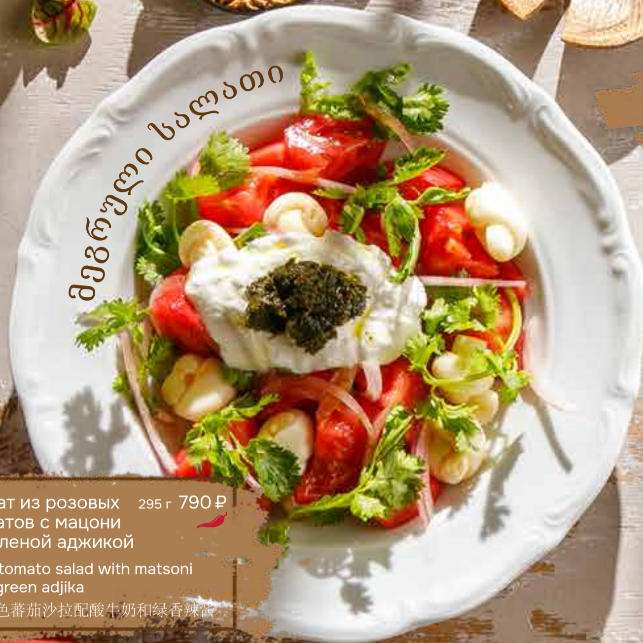
Салат из розовых томатов с мацони и зеленой аджикой 295 г 790 ₴ Pink tomato salad with matsoni and green adjika 桃红色蕃茄沙拉配酸牛奶和绿香辣酱