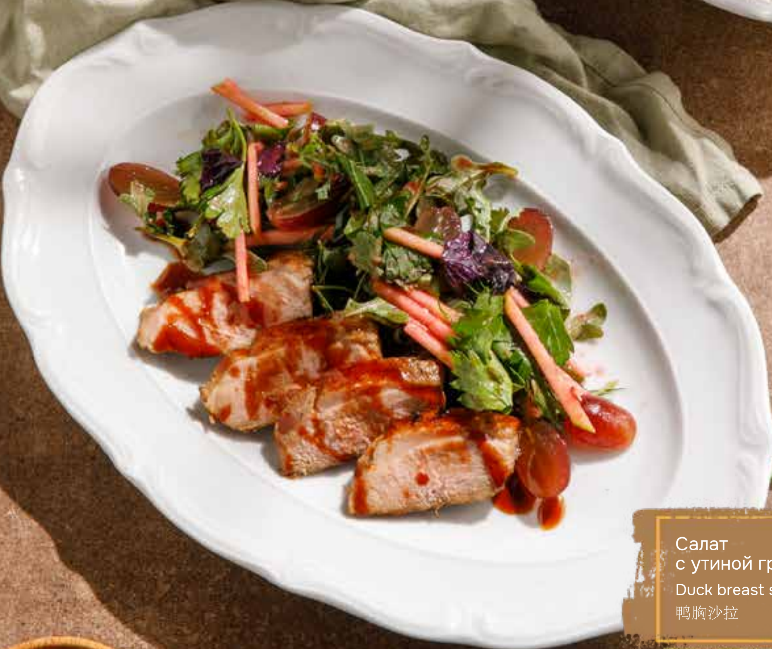
Салат 170 г 790 ₺ с утиной грудкой Duck breast salad 鸭胸沙拉