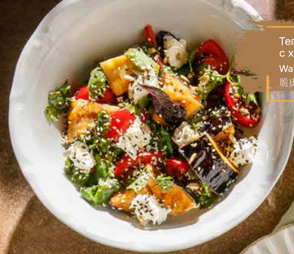
Теплый салат 250 г 990 ₺ с хрустящими баклажанами Warm salad with crispy eggplants 脆皮茄子暖沙拉