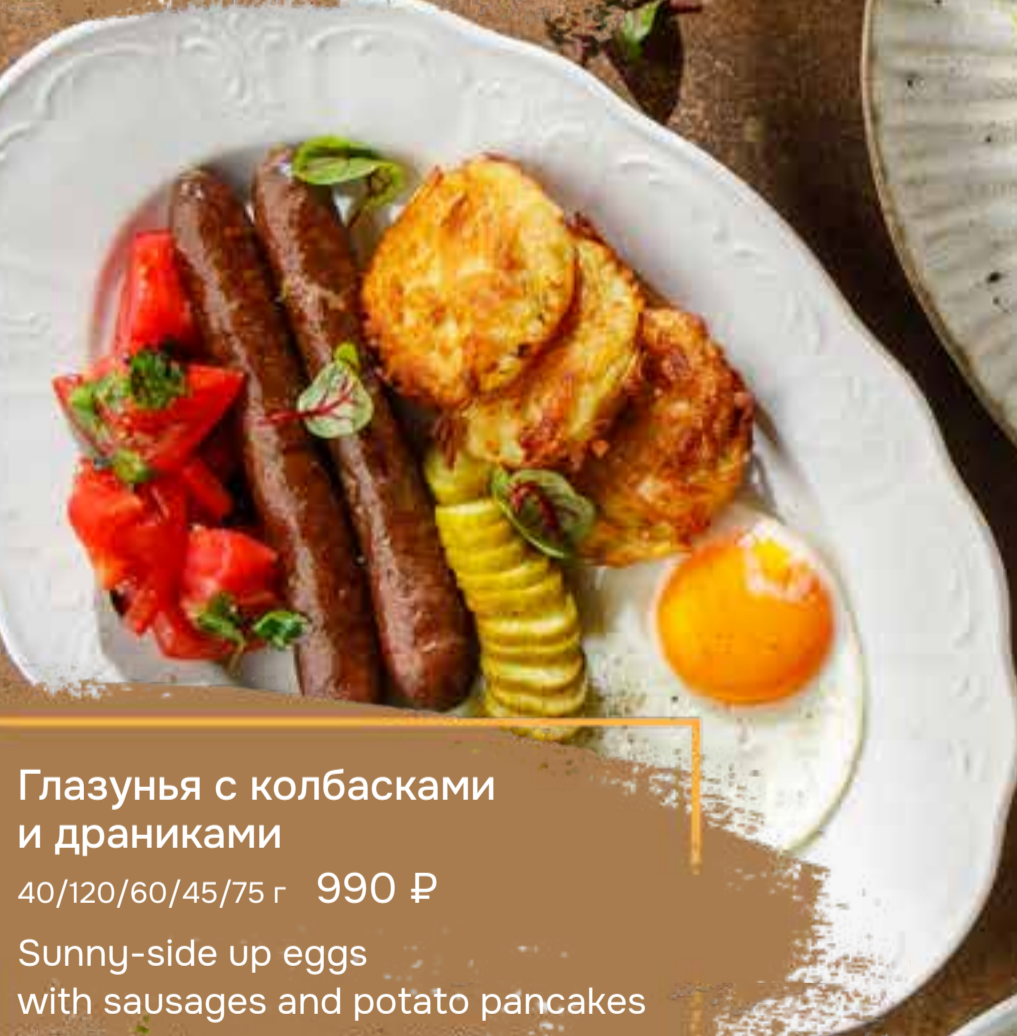
Глазунья с колбасками и драниками 40/120/60/45/75 г 990 ₺ Sunny-side up eggs with sausages and potato pancakes 香肠煎蛋搭配薯饼