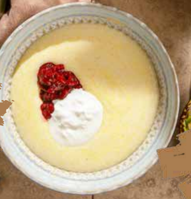
Овсяная каша с орехами и медом 350/20 г 490 ₺ Oatmeal porridge with nuts and honey 坚果蜂蜜燕麦粥