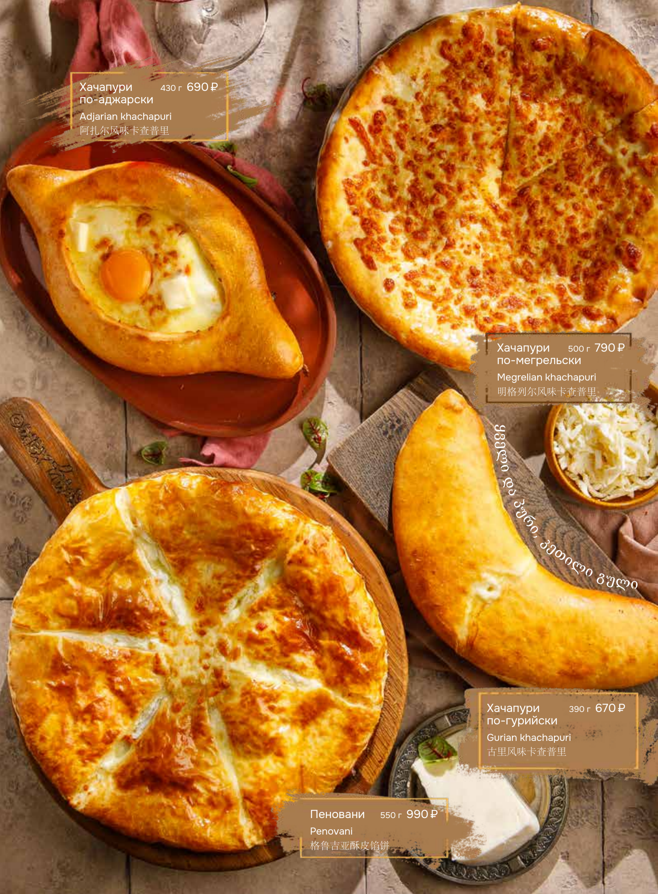
Хачапури 430 г 690 ₴ по-аджарски Adjarian khachapuri 阿扎尔风味卡查普里