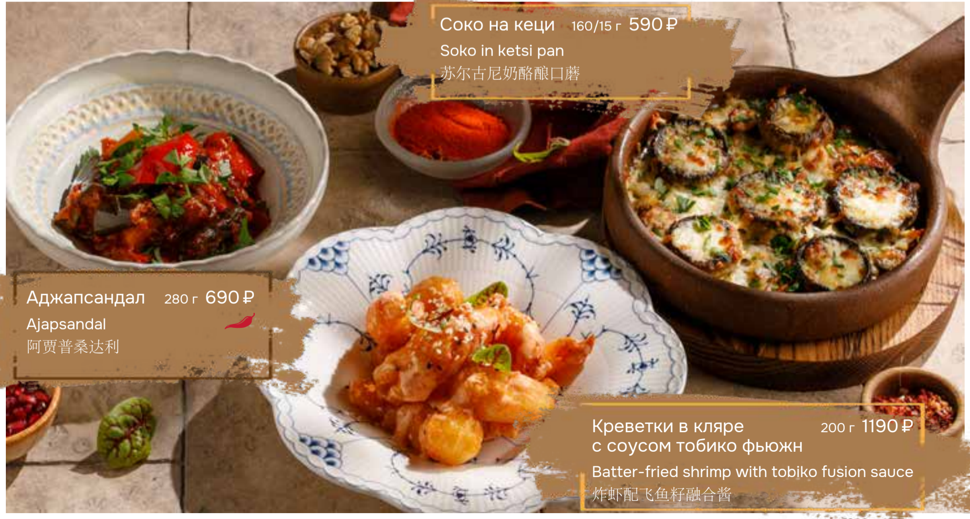
Соко на кеци 160/15 г 590 ₴ Soko in ketsi pan 苏尔古尼奶酪酿口蘑