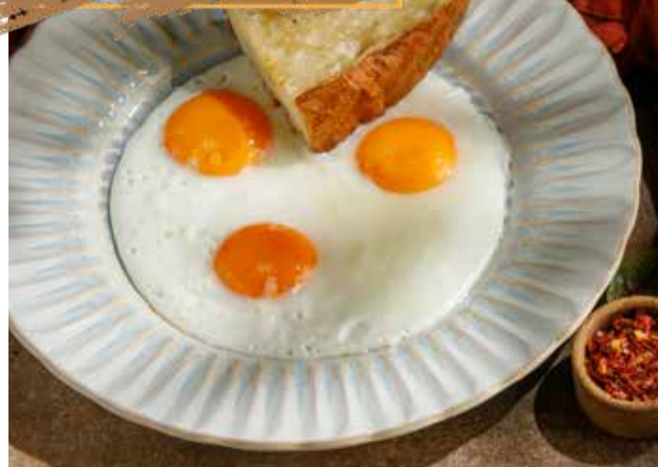
Глазунья из куриных яиц с тостами 140/40 г 390 ₺ Chicken sunny-side up eggs with toasts 吐司煎蛋