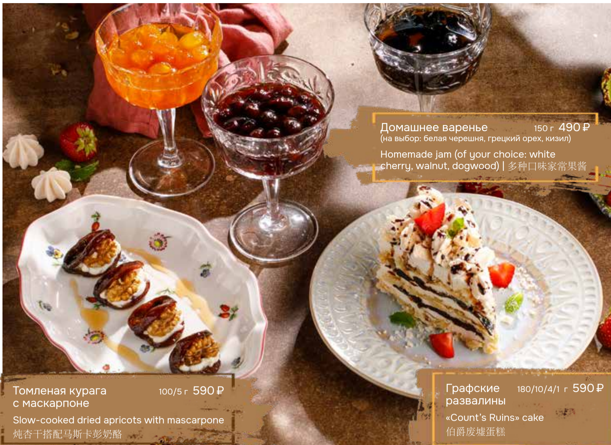
Домашнее варенье 150 г 490 ₺ (на выбор: белая черешня, грецкий орех, кизил) Homemade jam (of your choice: white cherry, walnut, dogwood) | 多种口味家常果酱