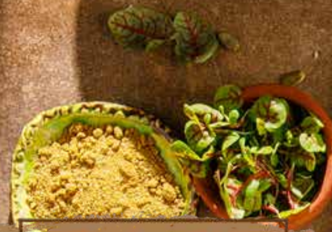
Теплый салат 220 г 1390 ₺ с лососем и сыром сулугуни Warm salad with salmon and Sulguni cheese 三文鱼和苏尔古尼暖沙拉