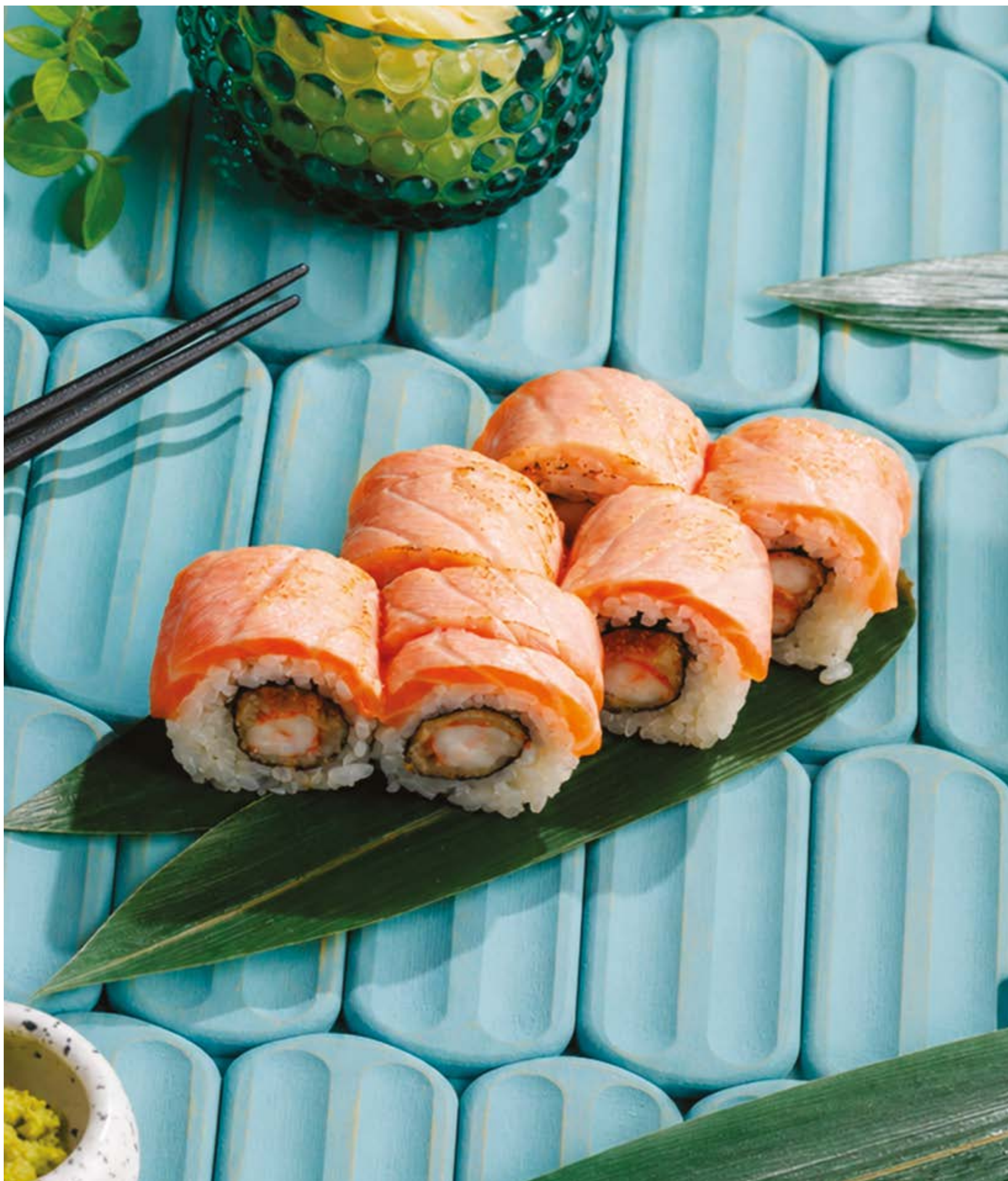
РОЛЛ С КРЕВЕТКОЙ В ТЕМПУРЕ, 1190Р Shrimp tempura roll

Просьба предупредить вашего официанта об имеющийся у вас аллергии на определённые продукты питания