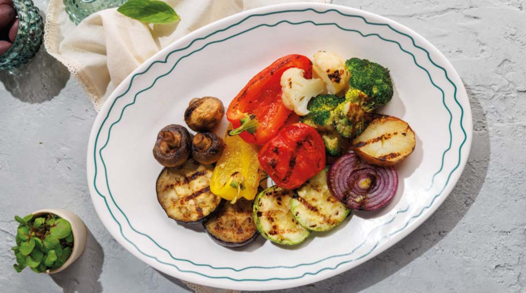
ОВОЩИ ГРИЛЬ, 850₽ Grilled vegetables