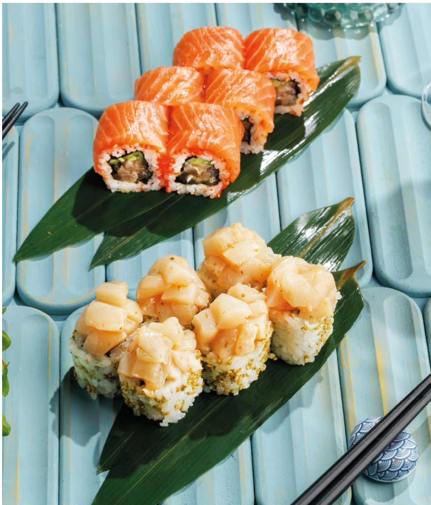
РОЛЛ ЛОСОСЬ С ТРЮФЕЛЬНЫМ ТУНЦОМ, 1090₽ Salmon with truffle tuna roll

Просьба предупредить вашего официанта об имеющийся у вас аллергии на определённые продукты питания