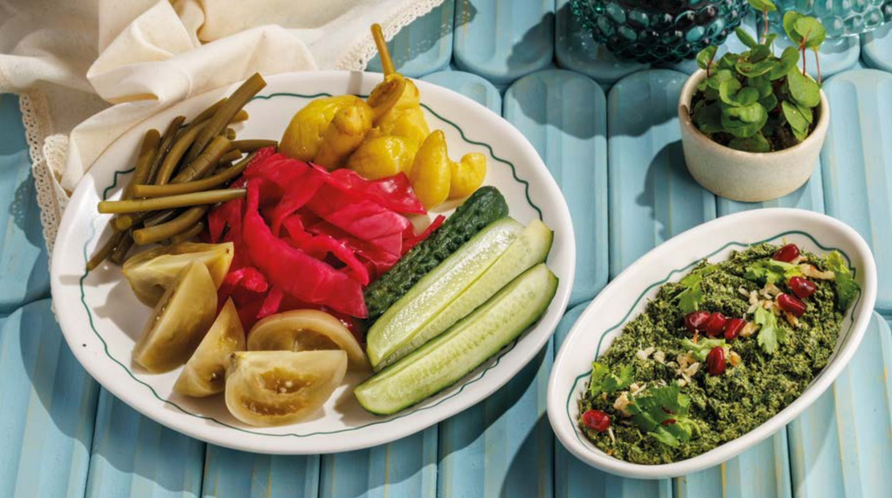
ДОМАШНИЕ СОЛЕНЬЯ (капуста, бурые томаты, огурцы, стручковый перец, черемша), 790₽ Homemade pickles (cabbage, brown tomatoes, cucumbers, peppers, wild garlic)