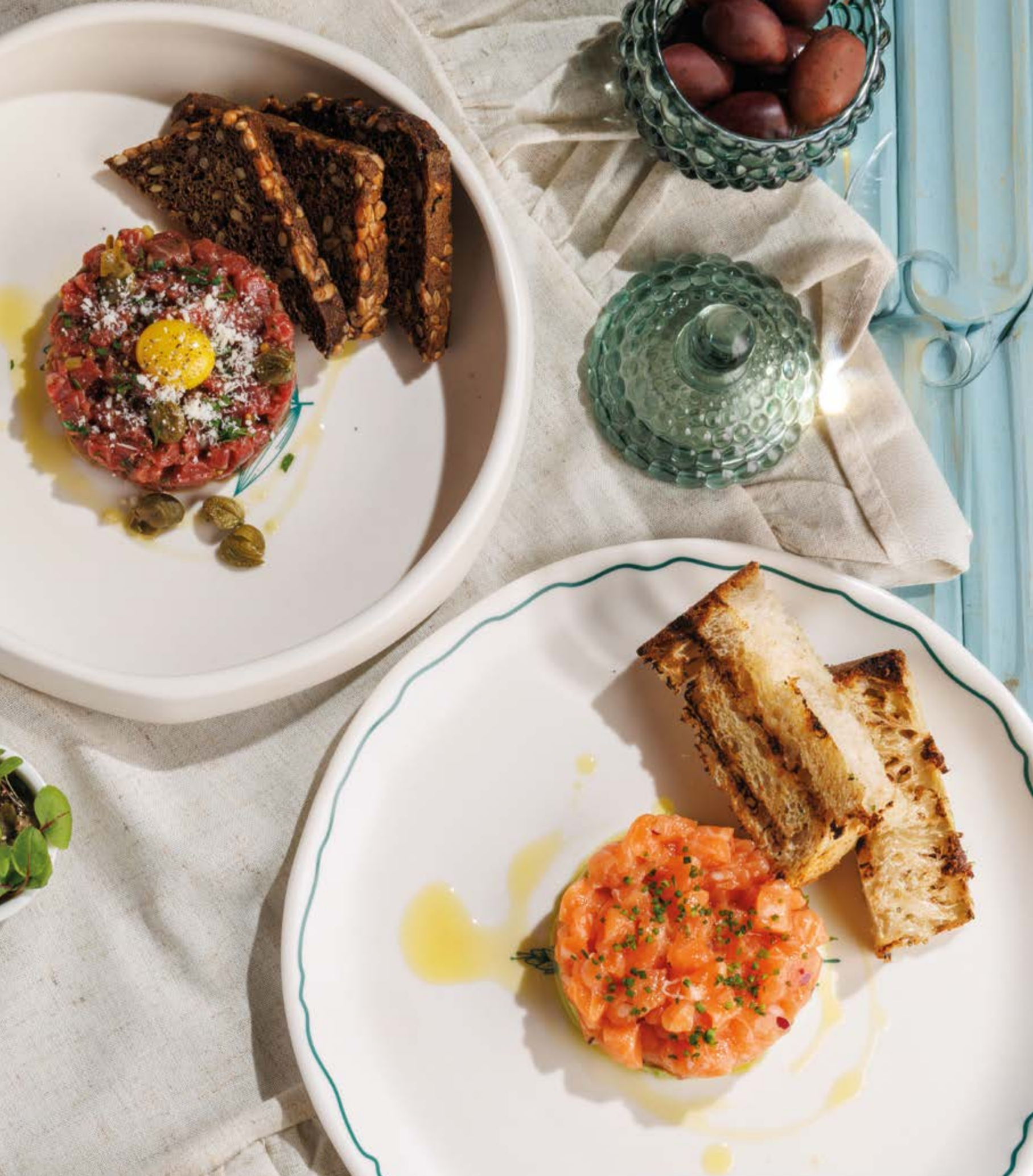
ТАРТАР ИЗ ГОВЯДИНЫ, 1050₽ Beef tartare