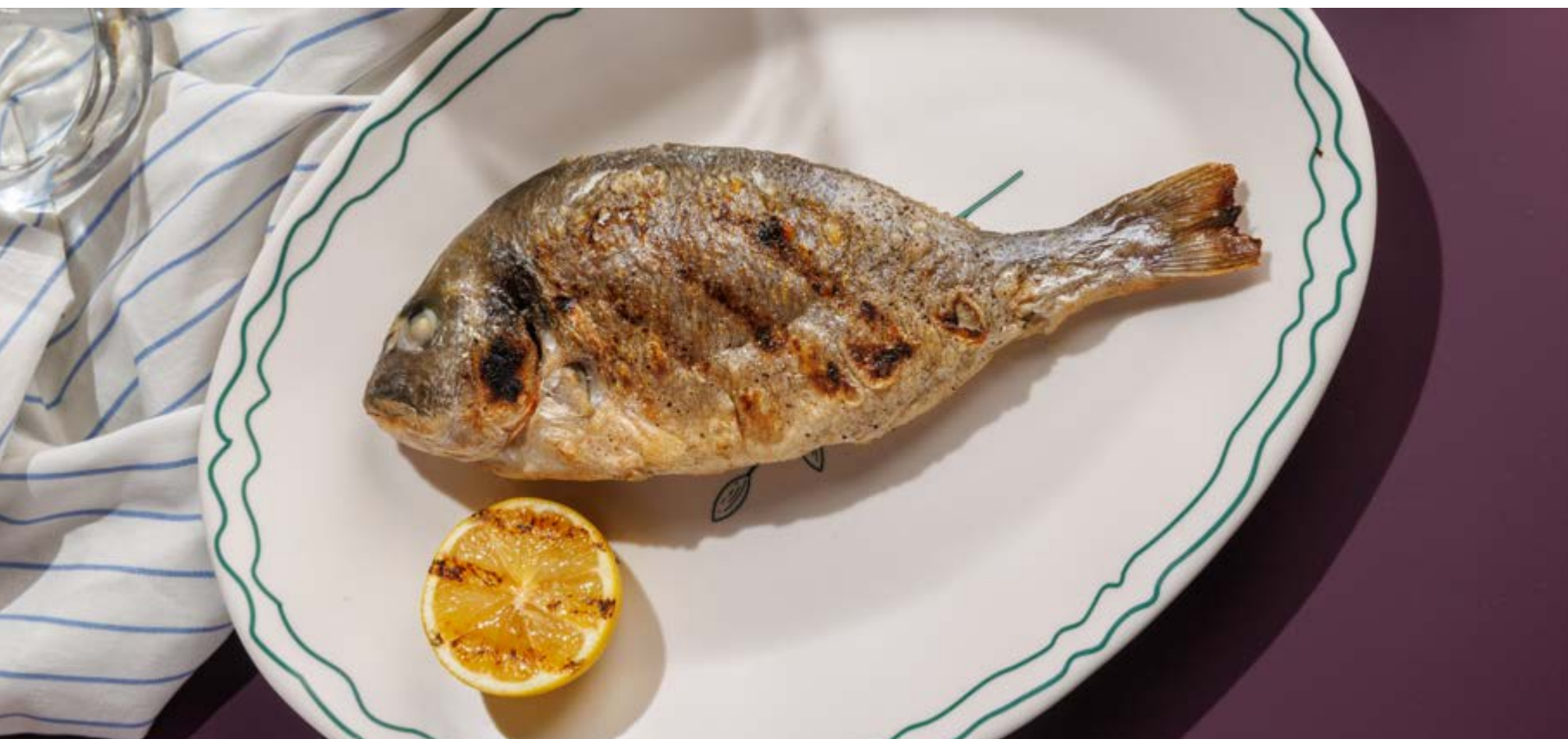
ДОРАДА НА ГРИЛЕ, 1390₽ Grilled dorado