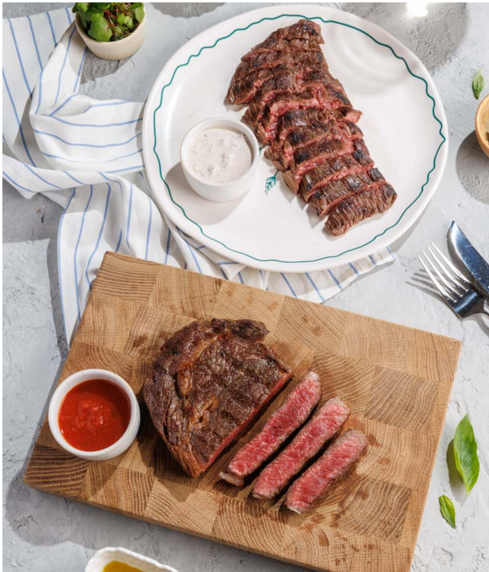
СТЕЙК МАЧЕТЕ, 2990₽ Machete steak

Просьба предупредить вашего официанта об имеющийся у вас аллергии на определённые продукты питания