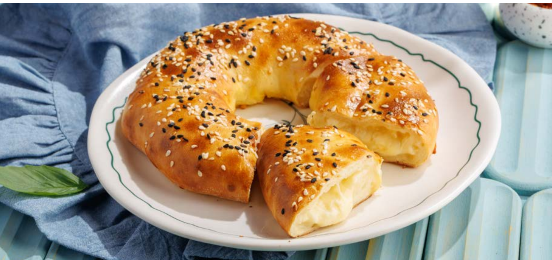
ЛЕПЕШКА / ЛЕПЕШКА С СЫРОМ, 450 / 550₽ Flatbread / Cheese flatbread