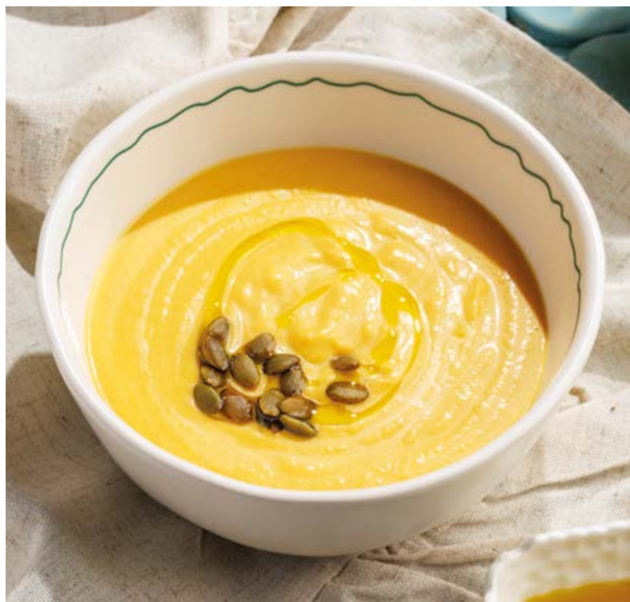
ТЫКВЕННЫЙ КРЕМ-СУП, 550₽ Cream of pumpkin soup