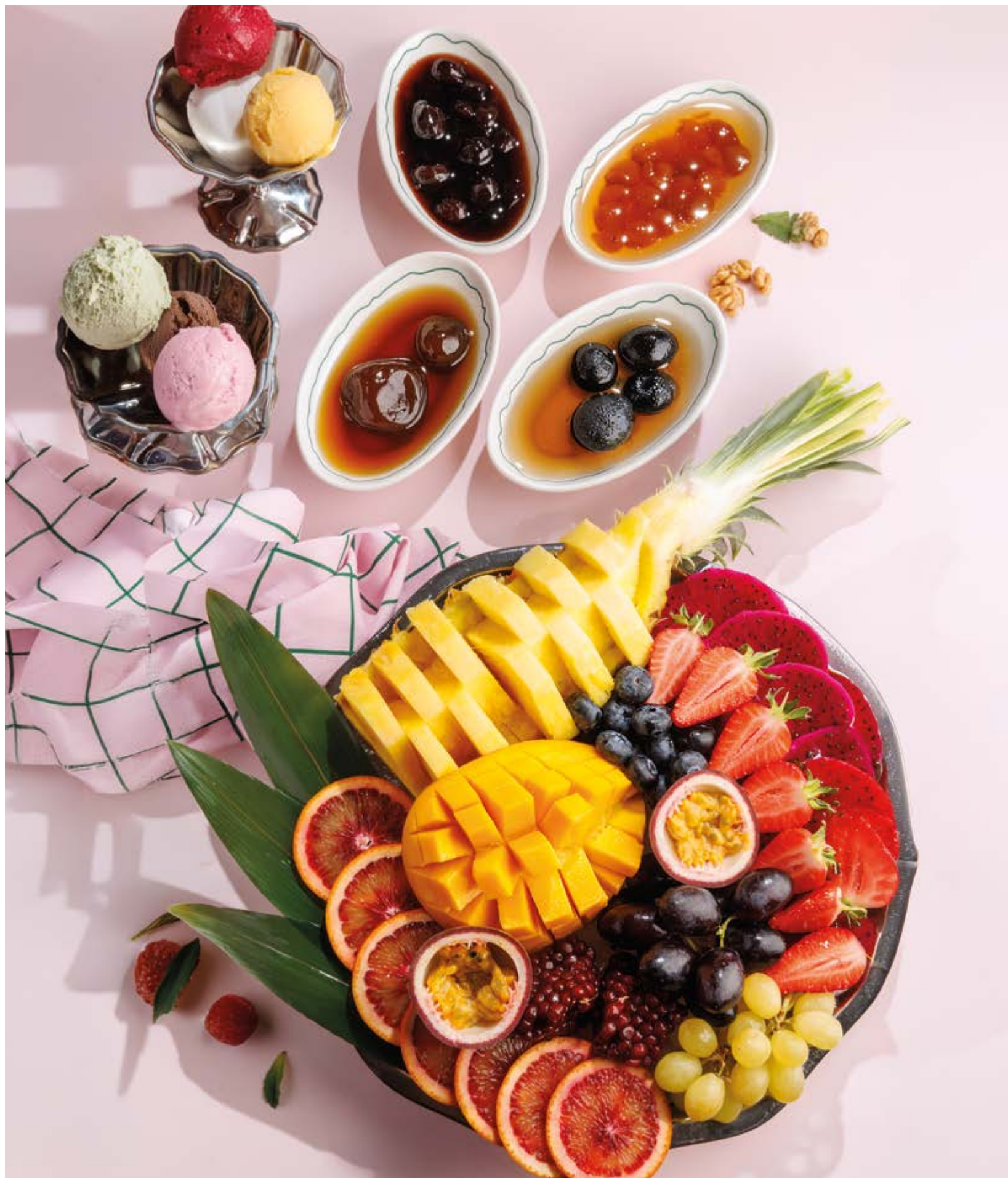
ФРУКТОВАЯ ТАРЕЛКА ПОЛОВИНА / ЦЕЛАЯ, 2090₽ / 3990₽ Fruit platter half / whole

Просьба предупредить вашего официанта об имеющийся у вас аллергии на определённые продукты питания