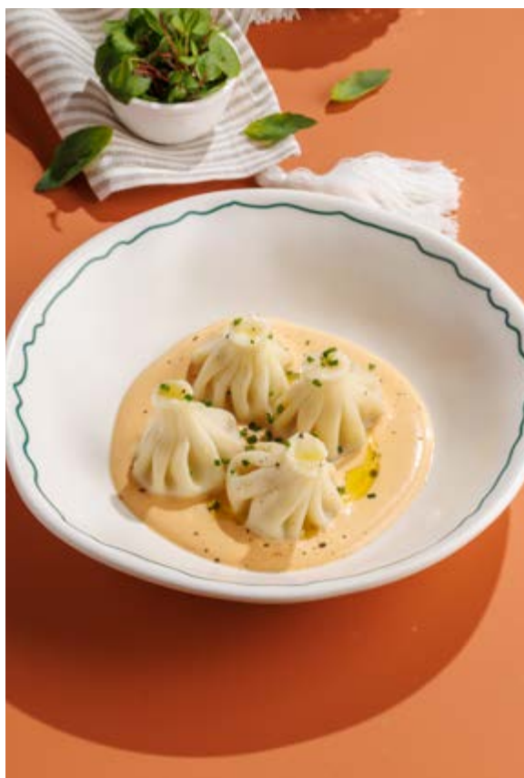
ПАТАРА-ХИНКАЛИ «ТОМ ЯМ», 750₽ Tom Yum patara khinkali