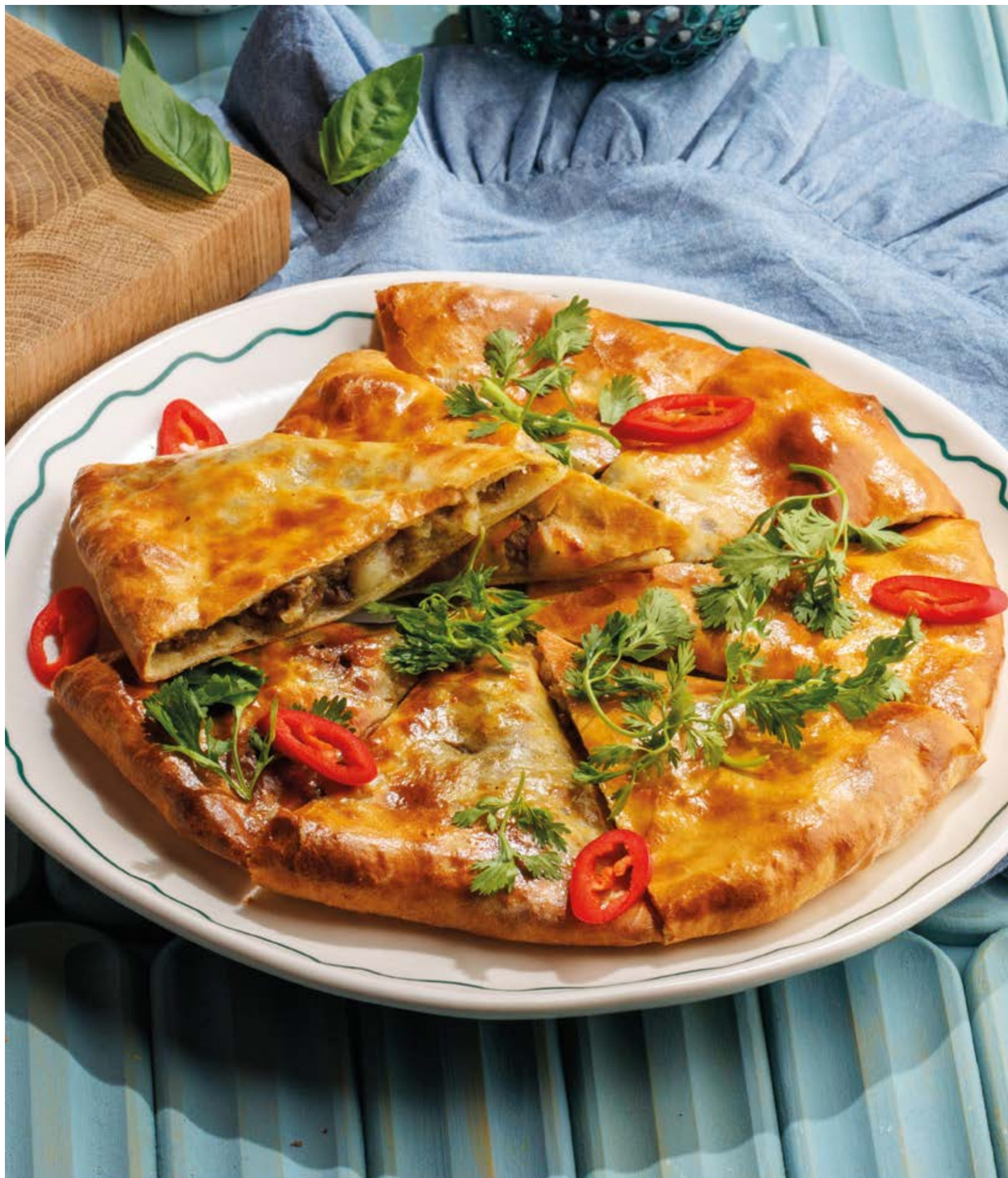
ПИРОГ С БАРАНИНОЙ И КАРТОФЕЛЕМ, 950Р Potato and lamb pie

Просьба предупредить вашего официанта об имеющийся у вас аллергии на определённые продукты питания