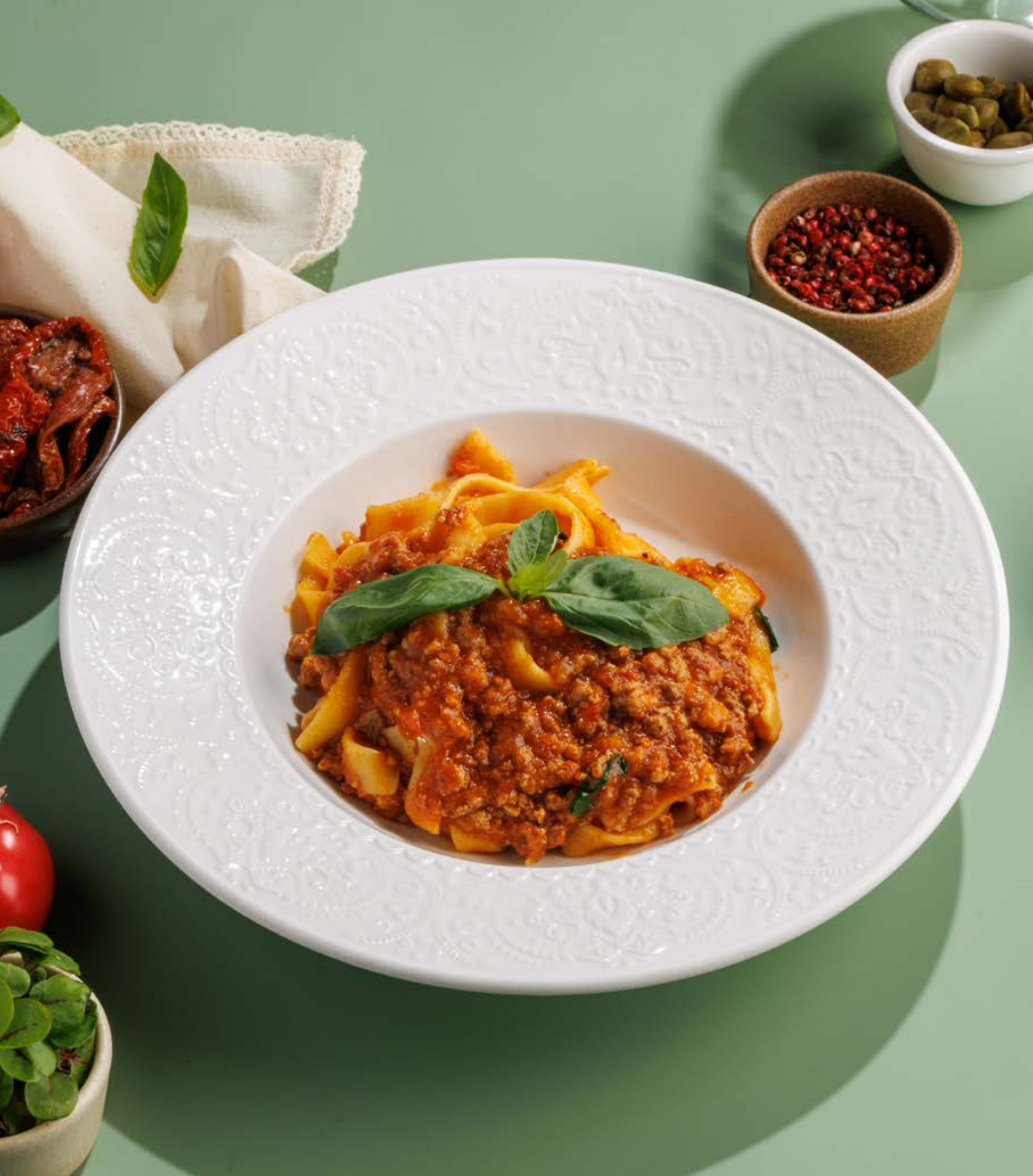
ПАСТА БОЛОНЬЕЗЕ, 890₽ pasta bolognese