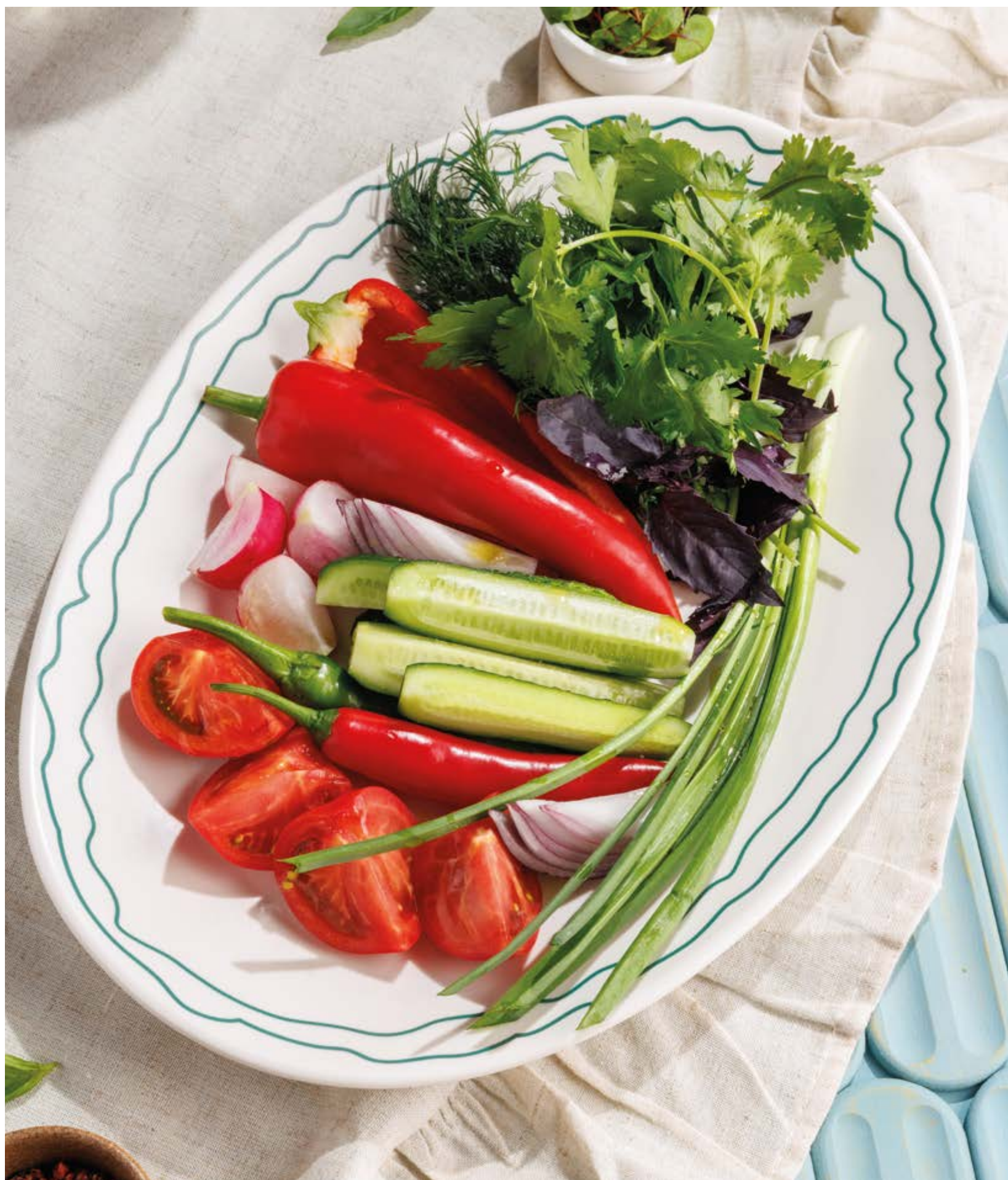
СЕЗОННЫЕ ОВОЩИ И ЗЕЛЕНЬ, 990Р Seasonal vegetables and greens

Просьба предупредить вашего официанта об имеющийся у вас аллергии на определённые продукты питания