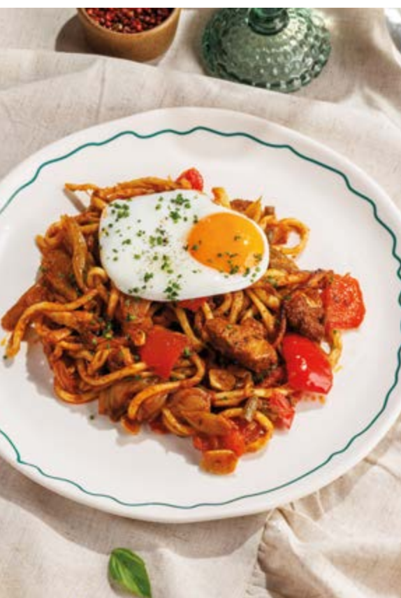
КОВУРМА ЛАГМАН, 850₽ Qovurma lagman