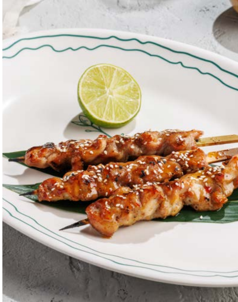
ЯКИТОРИ ИЗ КУРИЦЫ, 750₽ Chicken yakitori