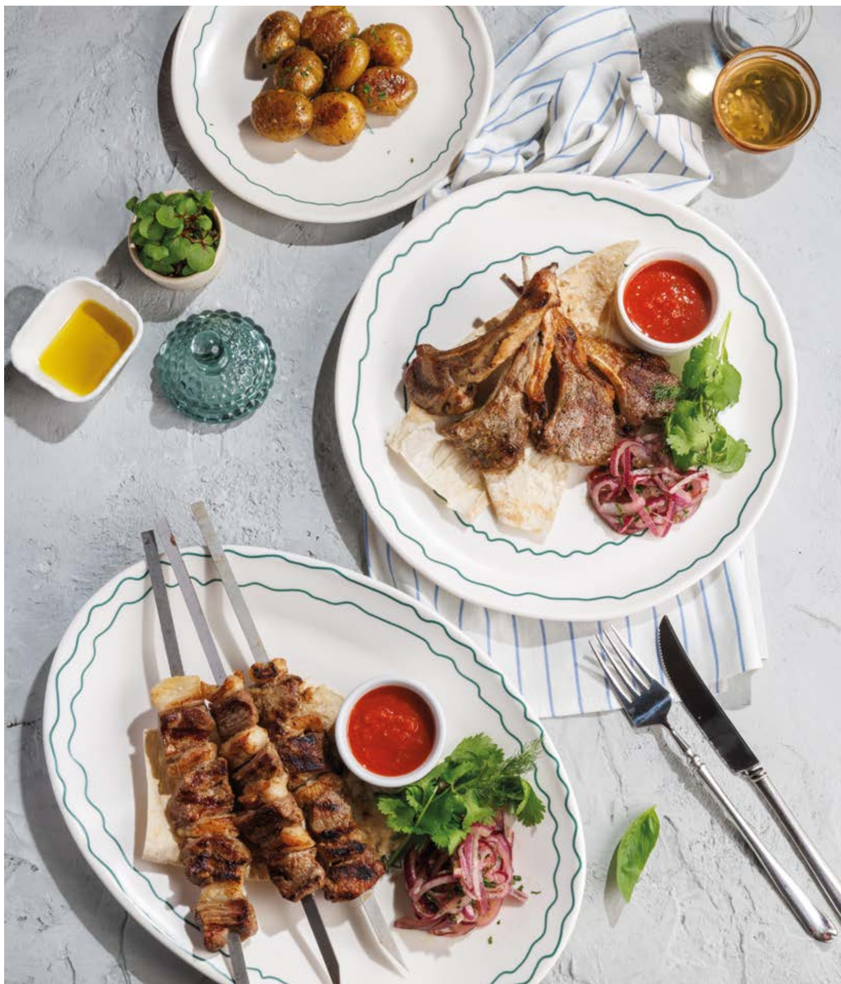
БЕБИ-КАРТОФЕЛЬ, 490₽ Baby potatoes

Просьба предупредить вашего официанта об имеющийся у вас аллергии на определённые продукты питания