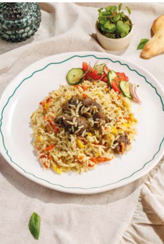
ПЛОВ УЗБЕКСКИЙ С ЯГНЕНКОМ, 950₽ Uzbek pilaf with lamb

Просьба предупредить вашего официанта об имеющийся у вас аллергии на определённые продукты питания