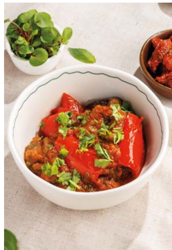
АДЖАПСАНДАЛ, 650₽ Adjapsandali