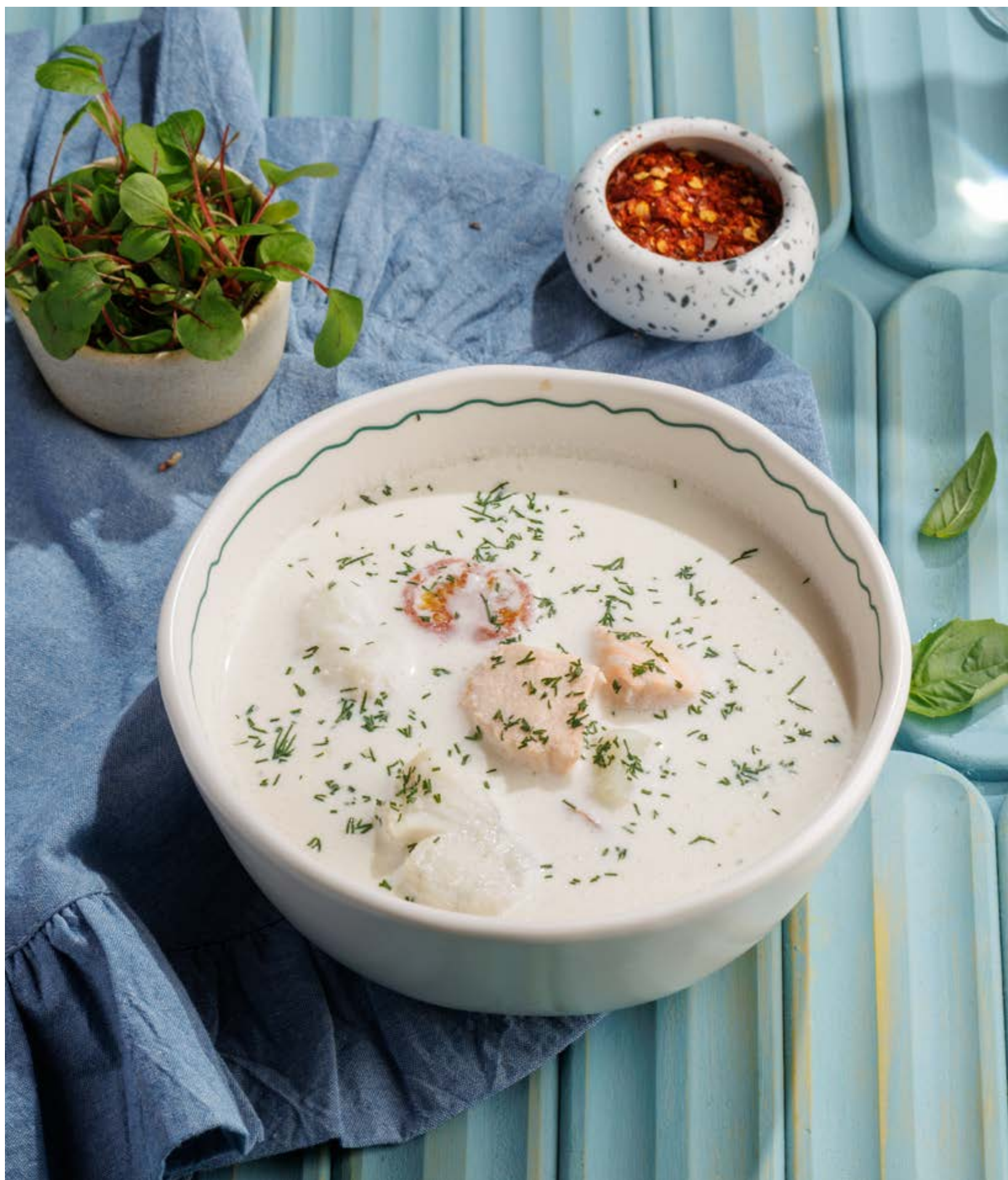
УХА СО СЛИВКАМИ, 990₽ Finnish salmon soup

Просьба предупредить вашего официанта об имеющийся у вас аллергии на определённые продукты питания