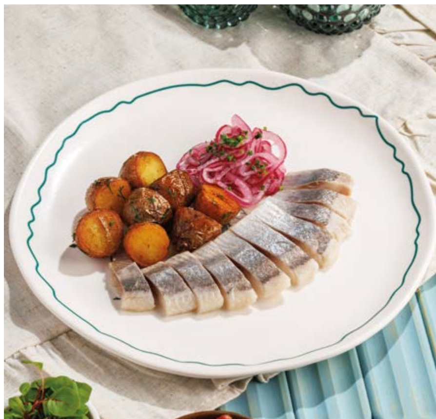
СЕЛЕДОЧКА С БЕБИ-КАРТОФЕЛЕМ, 590₽ Herring with baby potatoes