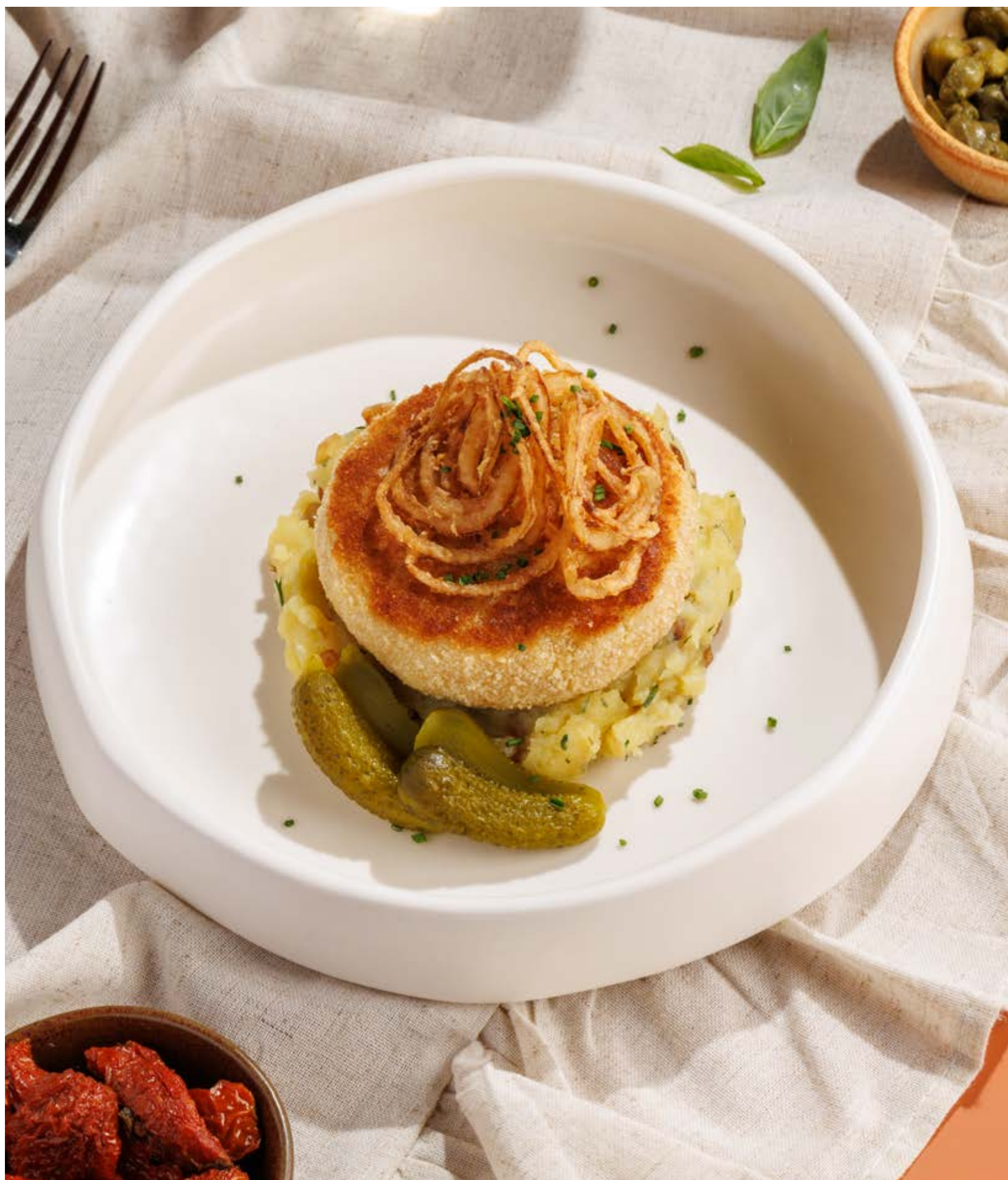
РЫБНАЯ КОТЛЕТА С ТОЛЧЕНЫМ КАРТОФЕЛЕМ, 990₽ Fish pattie with smashed potatoes

Просьба предупредить вашего официанта об имеющийся у вас аллергии на определённые продукты питания