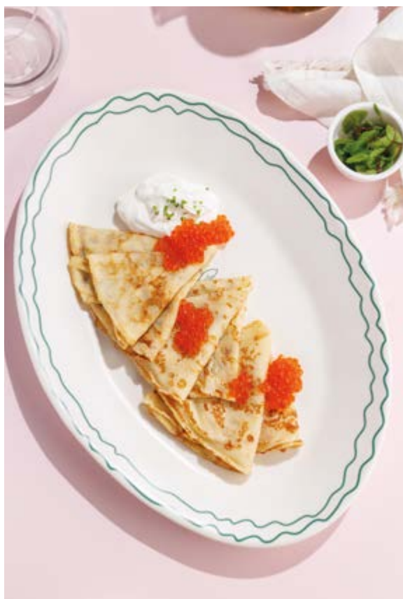
БЛИНЫ С ТОПИНГОМ НА ВЫБОР сметана / сгущенное молоко / варенье, 320₽ Crepes with topping of your choice sour cream / condensed milk / jam