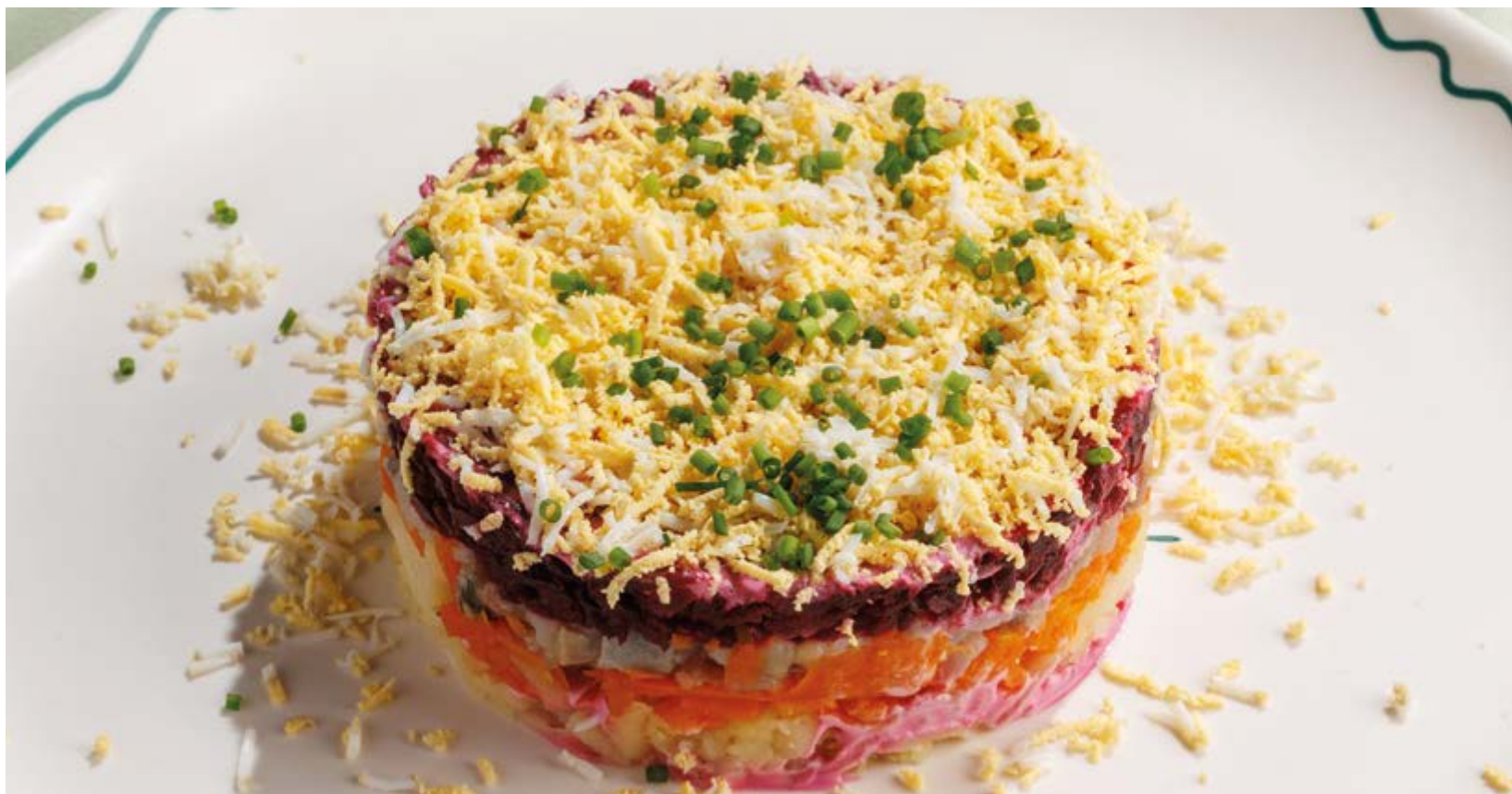
СЕЛЬДЬ ПОД ШУБОЙ, 590₽

Просьба предупредить вашего официанта об имеющийся у вас аллергии на определённые продукты питания