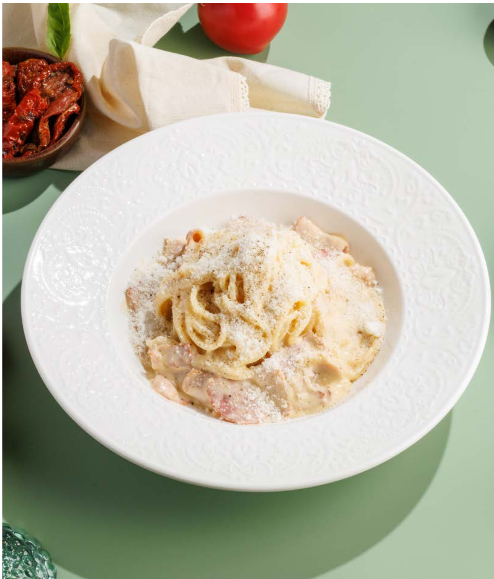
ПАСТА КАРБОНАРА, 890₽ Pasta carbonara

Просьба предупредить вашего официанта об имеющийся у вас аллергии на определённые продукты питания