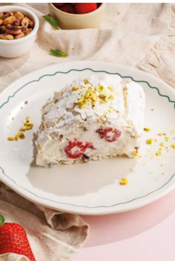
ФИСТАШКОВЫЙ РУЛЕТ С МАЛИНОЙ, 890₽ Pistachio roll with raspberries