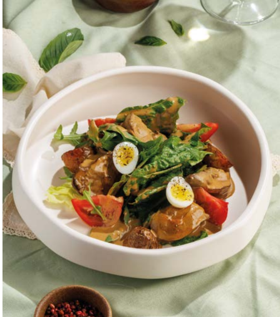
САЛАТ С КУРИНОЙ ПЕЧЕНЬЮ, 690₽ Chicken liver salad