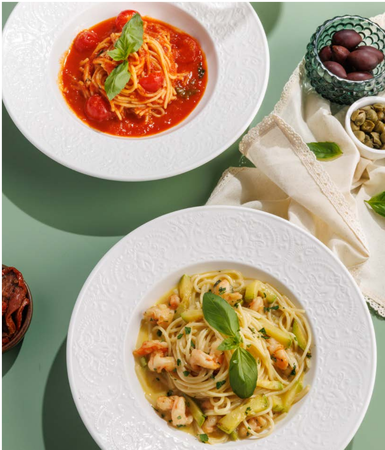
ПАСТА «ПОМИДОРНИ», 590₽ Pomodorini

Просьба предупредить вашего официанта об имеющийся у вас аллергии на определённые продукты питания