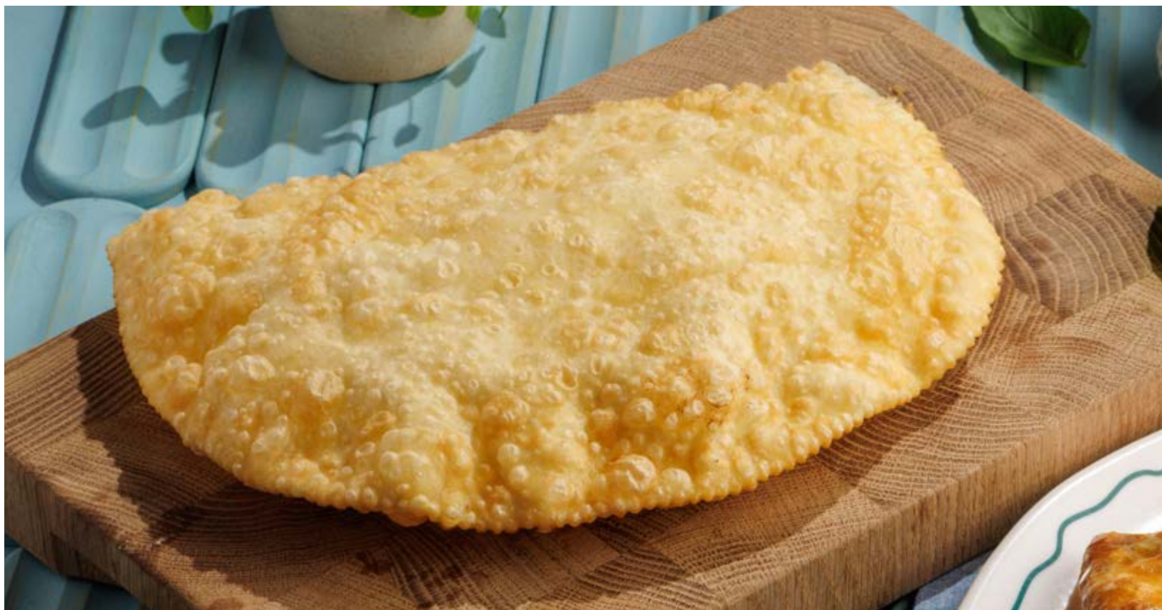
ЧЕБУРЕК С СЫРОМ / С БАРАНИНОЙ / С ТЕЛЯТИНОЙ, 590₽ / 750₽ / 590₽ Cheburek cheese / lamb / veal

Просьба предупредить вашего официанта об имеющийся у вас аллергии на определённые продукты питания