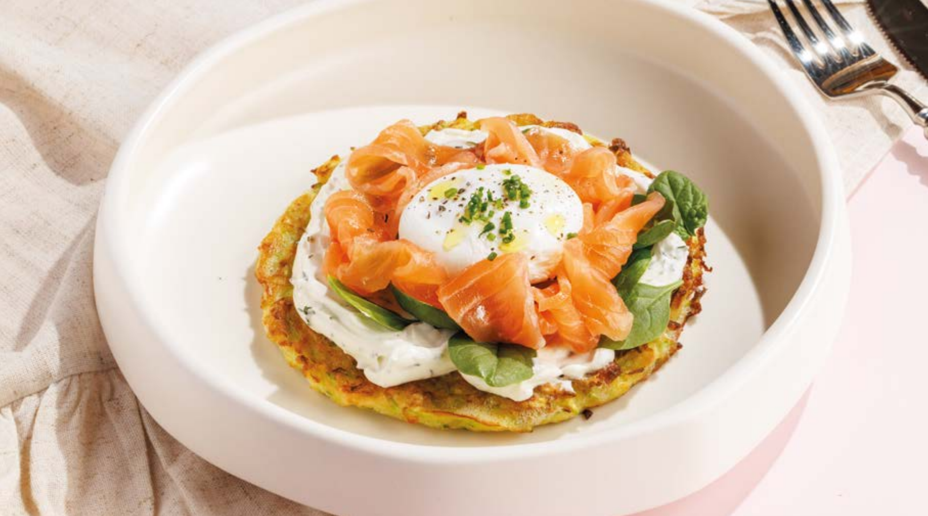
ОЛАДУШКА ИЗ КАБАЧКА С ЛОСОСЕМ И ЯЙЦОМ ПАШОТ, 1090₽ Zucchini pancake with salmon and sour cream