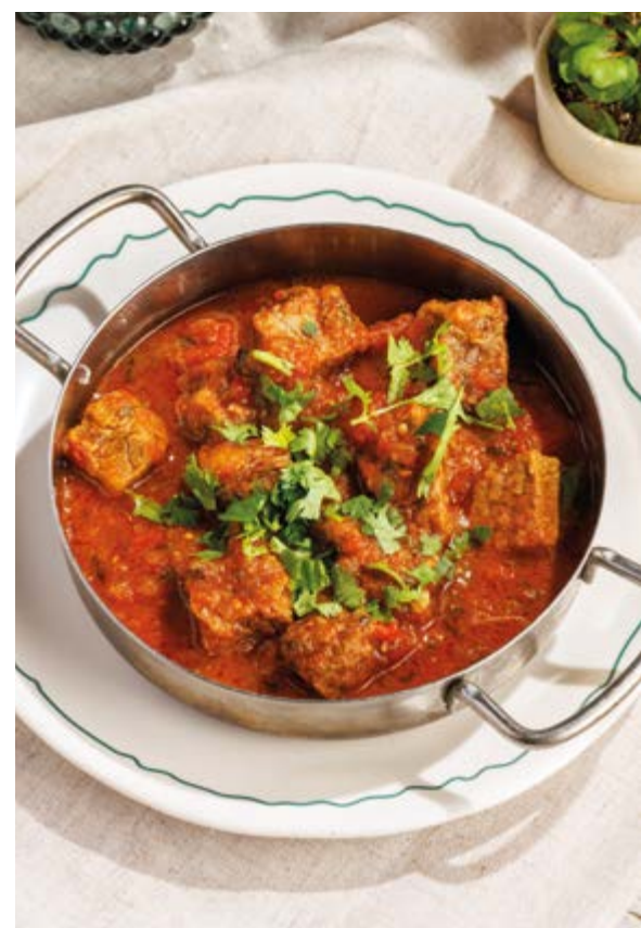
ЧАШУШУЛИ, 950₽ Chashushuli