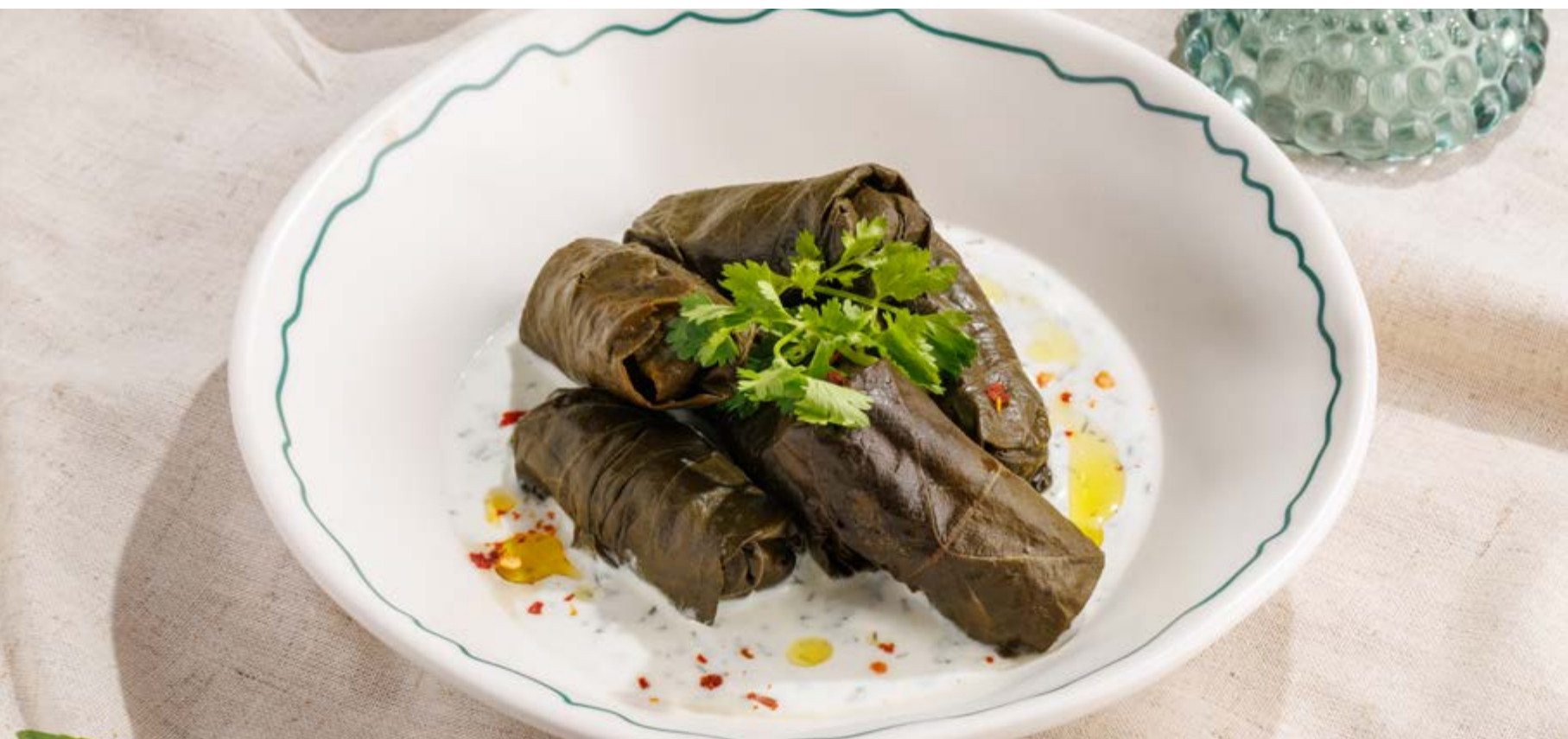
ДОЛМА СО СВИНИНОЙ И ГОВЯДИНОЙ, 790₽ Pork and beef dolma