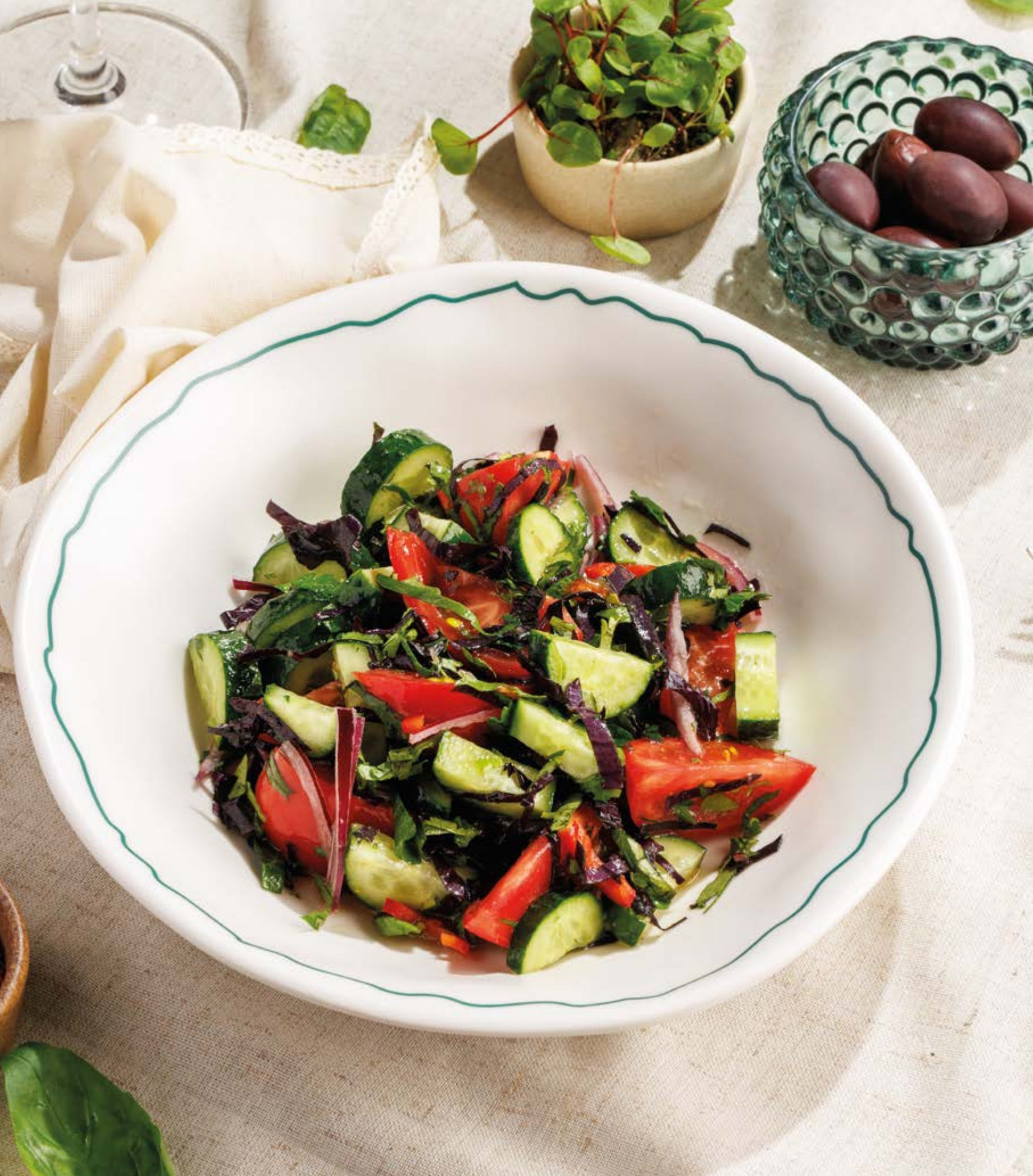
ОВОЦНОЙ САЛАТ ПО-ГРУЗИНСКИ СО СПЕЦИЯМИ / ОРЕХАМИ, 590₽ / 690₽ Georgian vegetable salad with spices / nuts