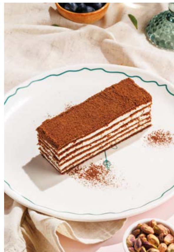
ЗГАПАРИ, 690₽ Zgapari