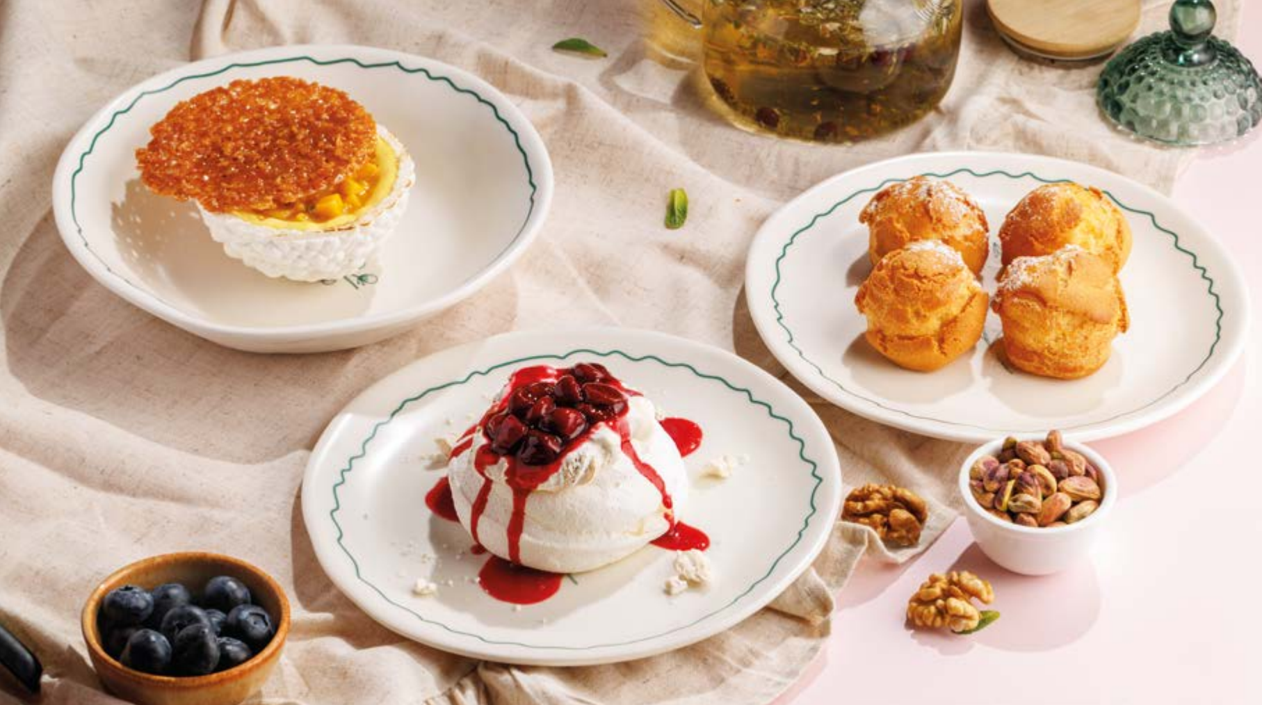
ДЕСЕРТ С ТРОПИЧЕСКИМИ ФРУКТАМИ, 850₽ Tropical fruit dessert