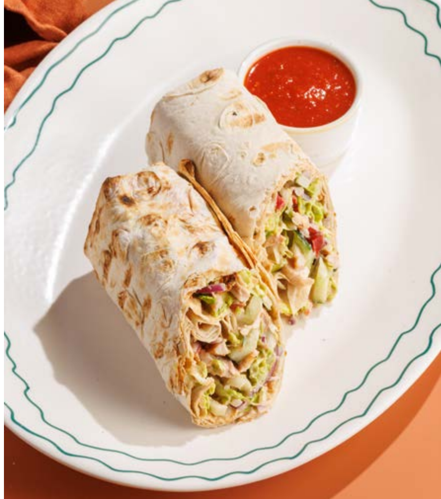
ШАВЕРМА С ЦЫПЛЕНКОМ, 750₽ Chicken shawarma