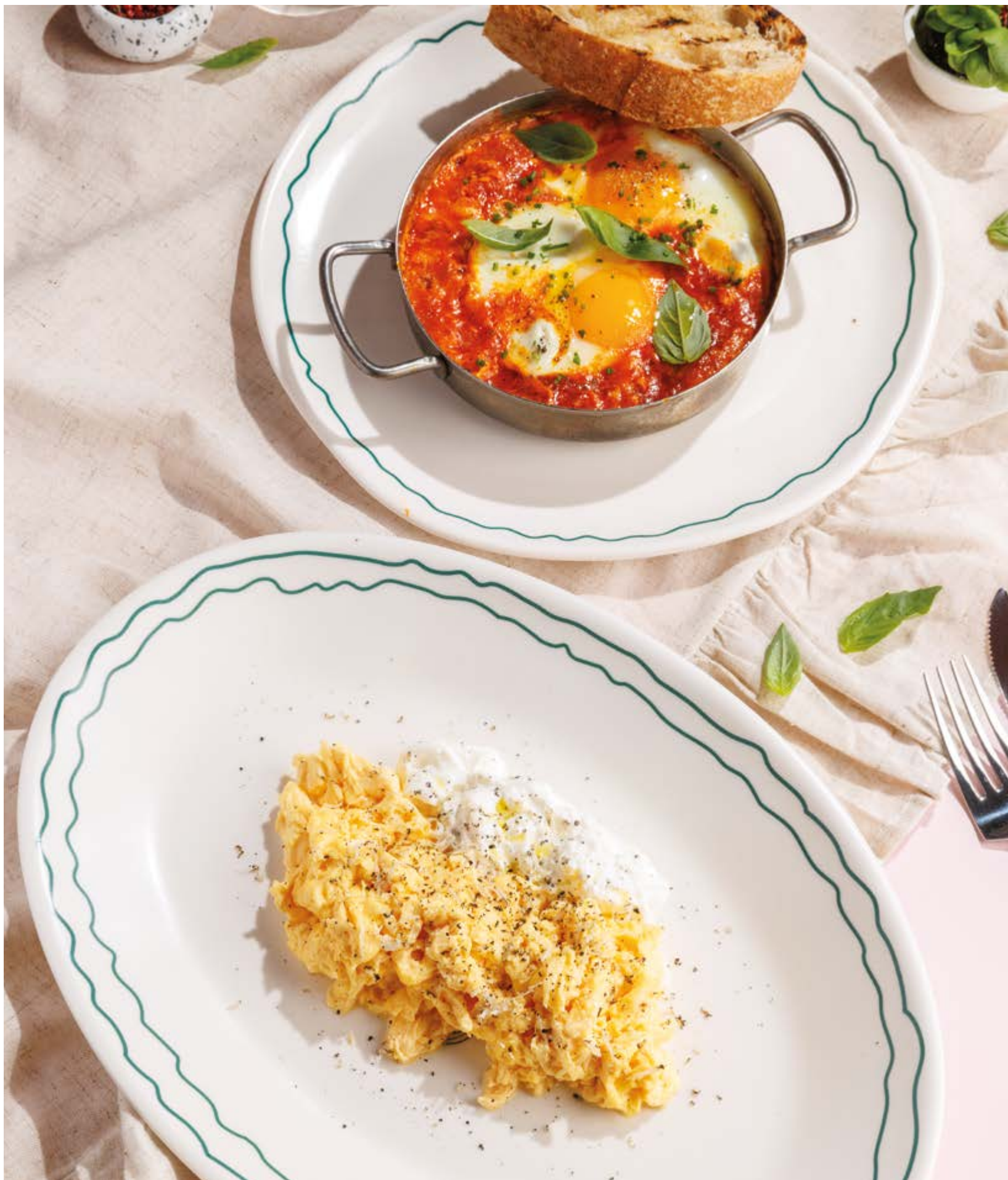
ШАКШУКА С ТОМАТАМИ И БАЗИЛИКОМ, 690₽ Shakshuka with tomatoes and basil

Просьба предупредить вашего официанта об имеющийся у вас аллергии на определённые продукты питания