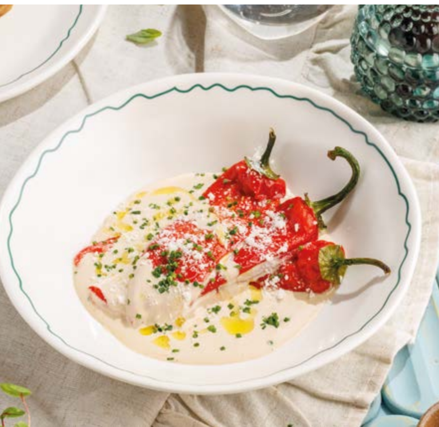
ПЕРЦЫ ТОННАТО, 590₽ Tonnato peppers