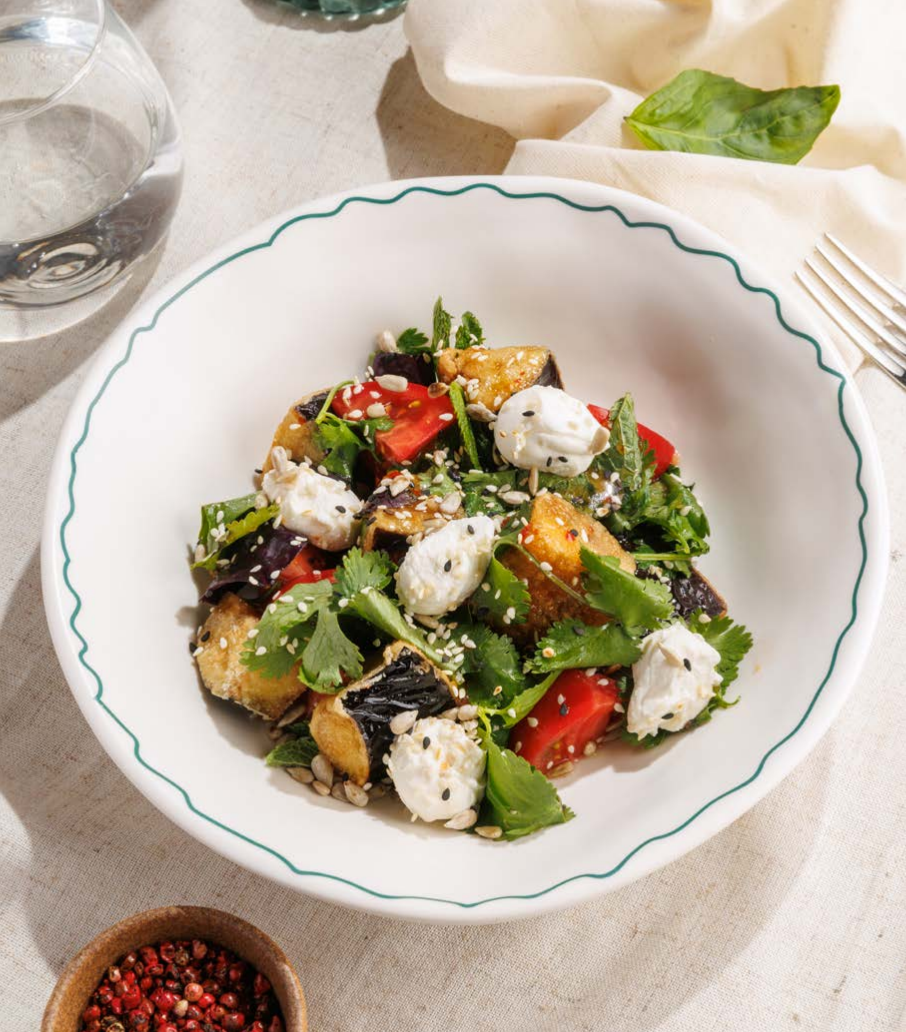
САЛАТ С ХРУСТЯЩИМИ БАКЛАЖАНАМИ, 890₽ Crispy eggplant salad