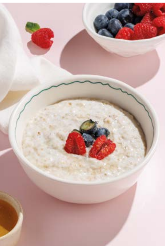
ОВСЯНАЯ КАША С ЯГОДАМИ И МЕДОМ, 490₽ Oatmeal with berries and honey