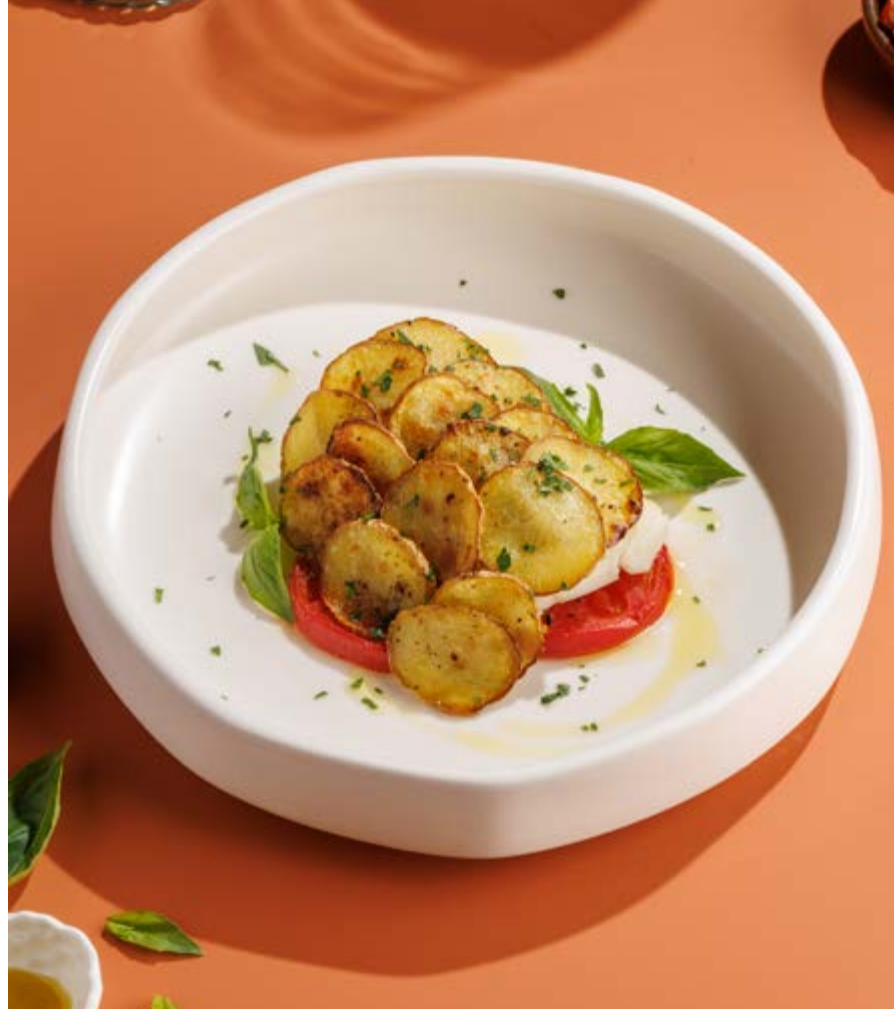
ОКУНЬ С ТОМАТАМИ И КАРТОФЕЛЕМ, 890₽ Sea bass with tomatoes and potatoes