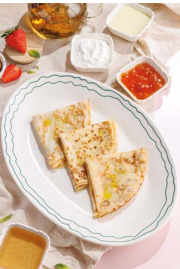
БЛИНЫ С КРАСНОЙ ИКРОЙ, 1190₽ Crepes with red caviar