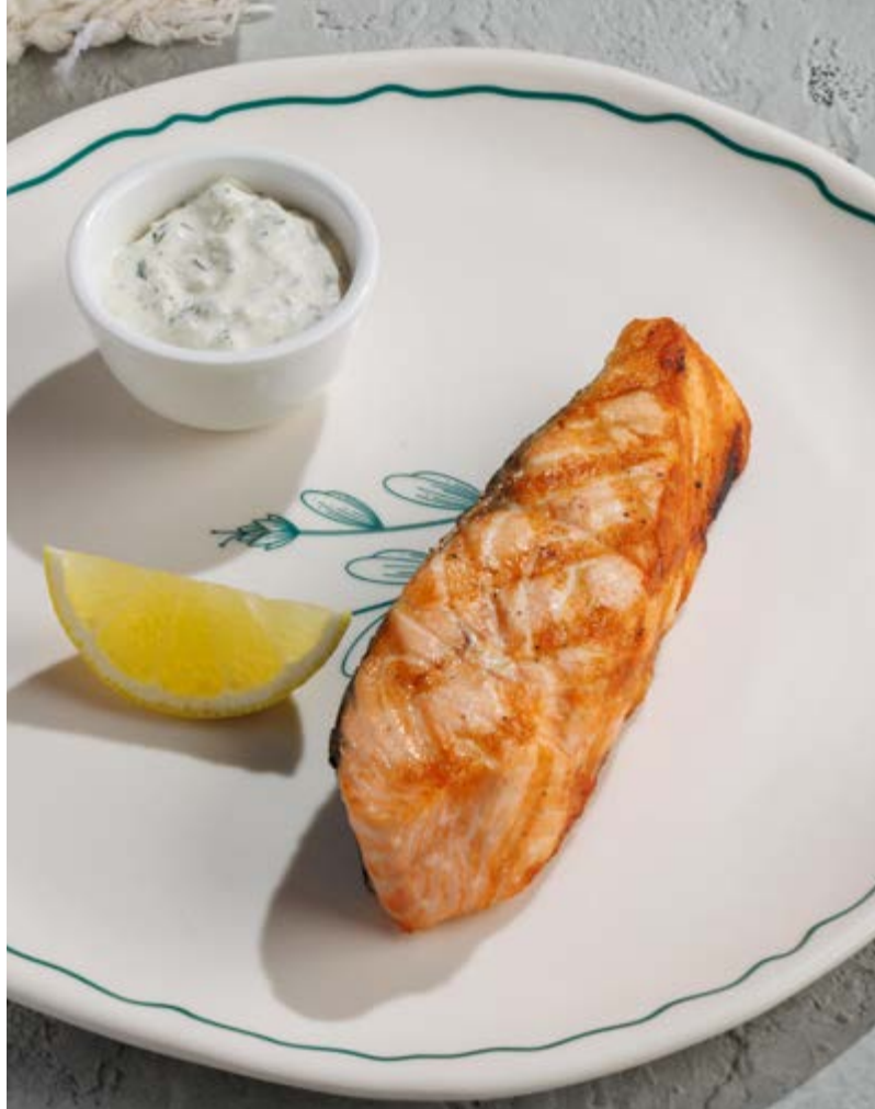
СТЕЙК ИЗ ЛОСОСЯ НА ГРИЛЕ, 1750₽ Grilled salmon steak