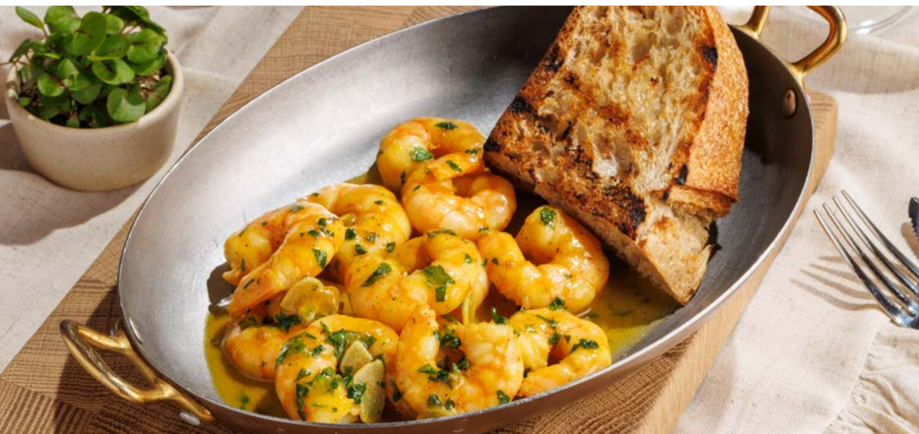
ЖАРЕННЫЕ КРЕВЕТКИ С ЧЕСНОКОМ И ШАФРАНОМ, 1290₽ Fried shrimp with garlic