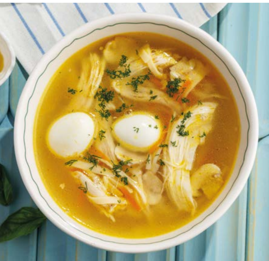
СУП С ЦЫПЛЕНКОМ И ГРИБАМИ, 550₽ Chicken soup with mushrooms