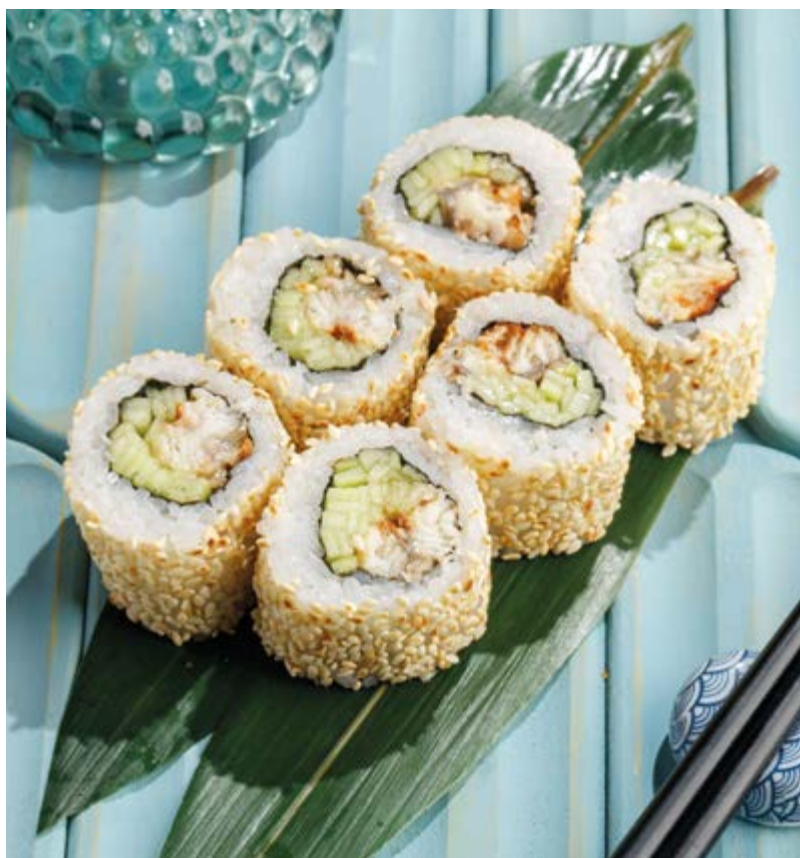
РОЛЛ УГОРЬ, 690₽ Eel roll