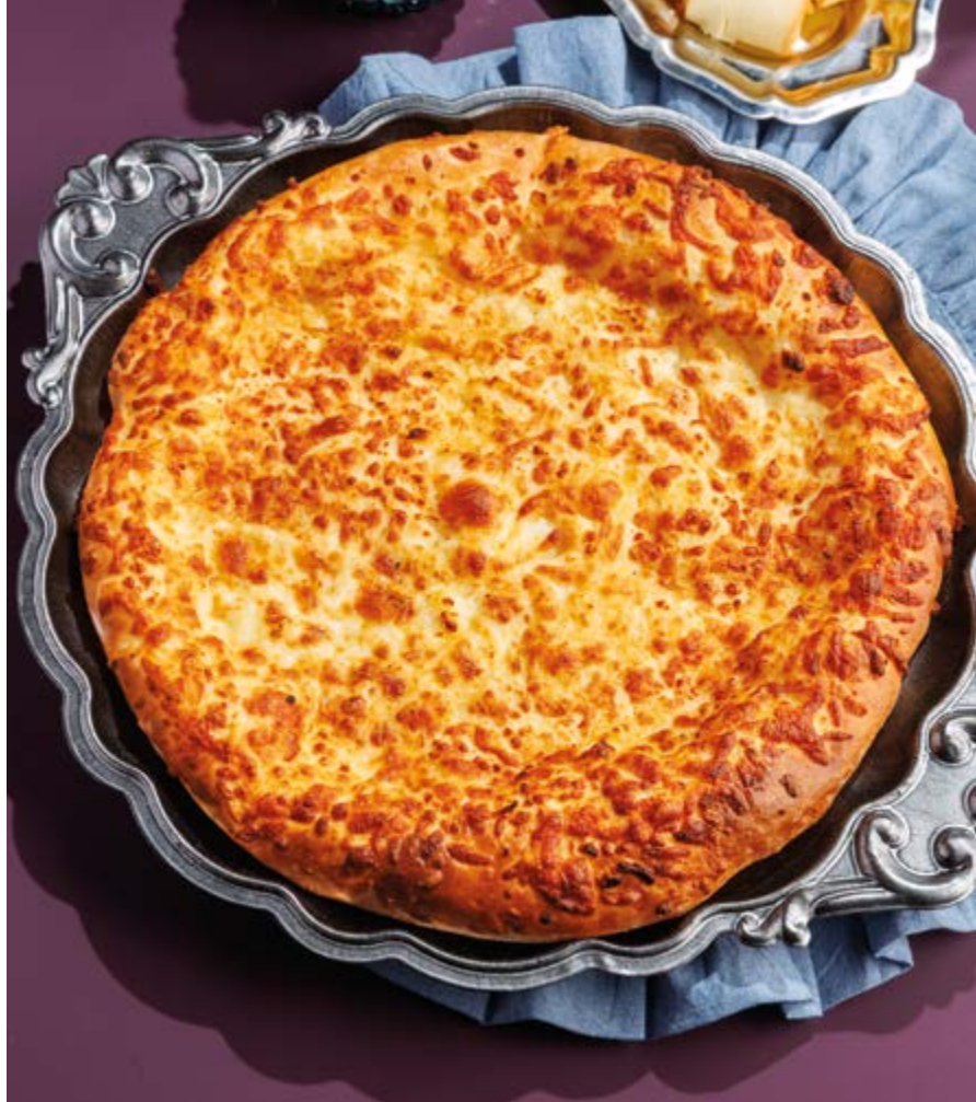
ХАЧАПУРИ ПО-МЕГРЕЛЬСКИ, 850₽ Megrelian khachapuri