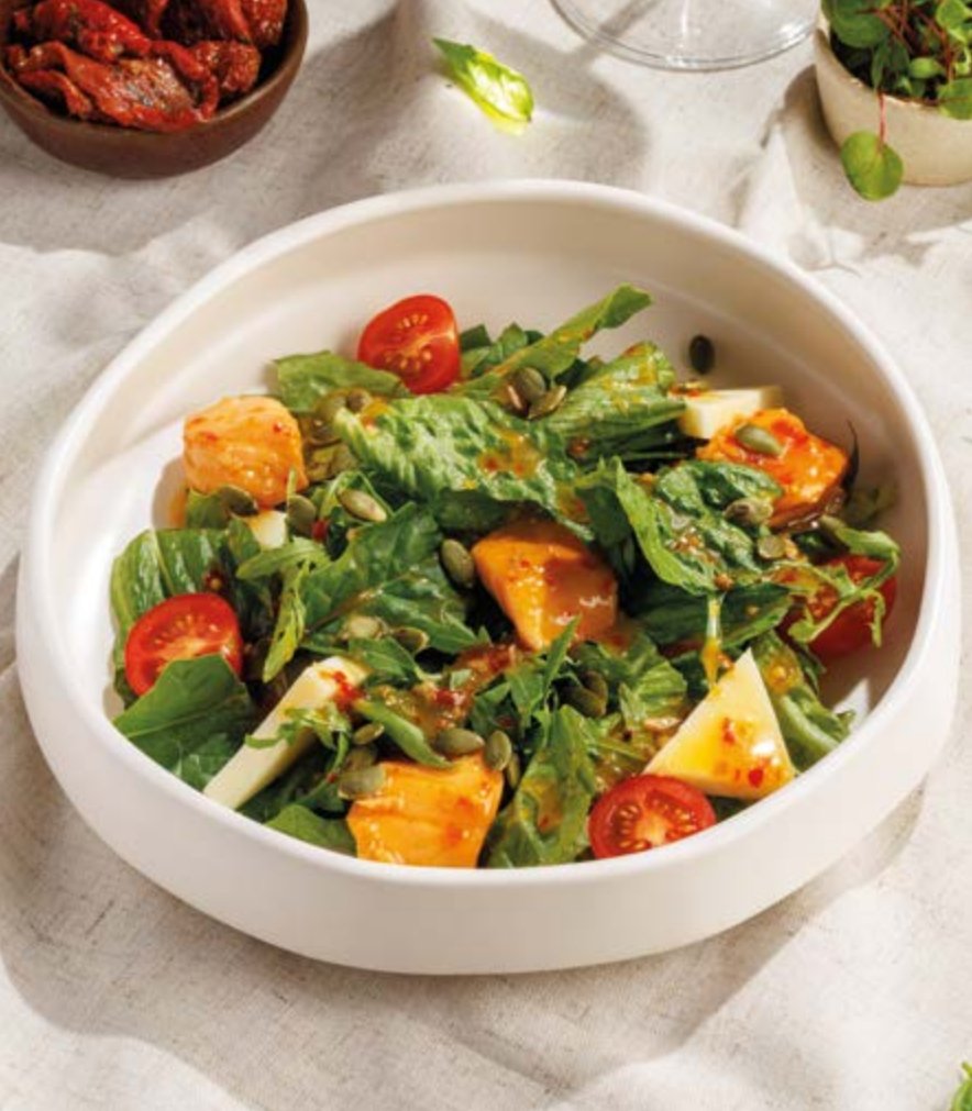
ТЕПЛЫЙ САЛАТ С ЛОСОСЕМ, 1190₽ Warm salmon salad