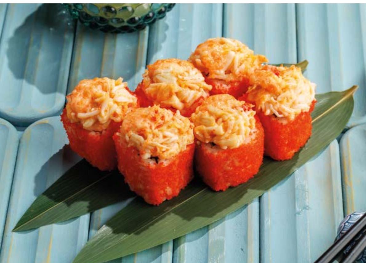
ЗАПЕЧЕННЫЕ РОЛЛЫ КРАБ / УГОРЬ / ЛОСОСЬ, 1290₽ / 1190₽ / 1190₽ Crab / eel / salmon baked rolls