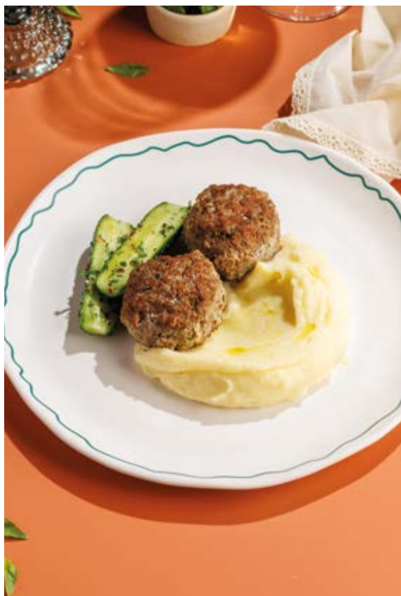
ДОМАШНИЕ КОТЛЕТЫ ОТ ПЕТРОВНЫ, 990₽ Homemade patties by Petrovna