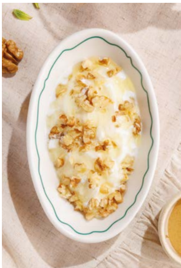
МАЦОНИ С МЕДОМ И ГРЕЦКИМИ ОРЕХАМИ, 290₽ Matsoni with honey and walnuts