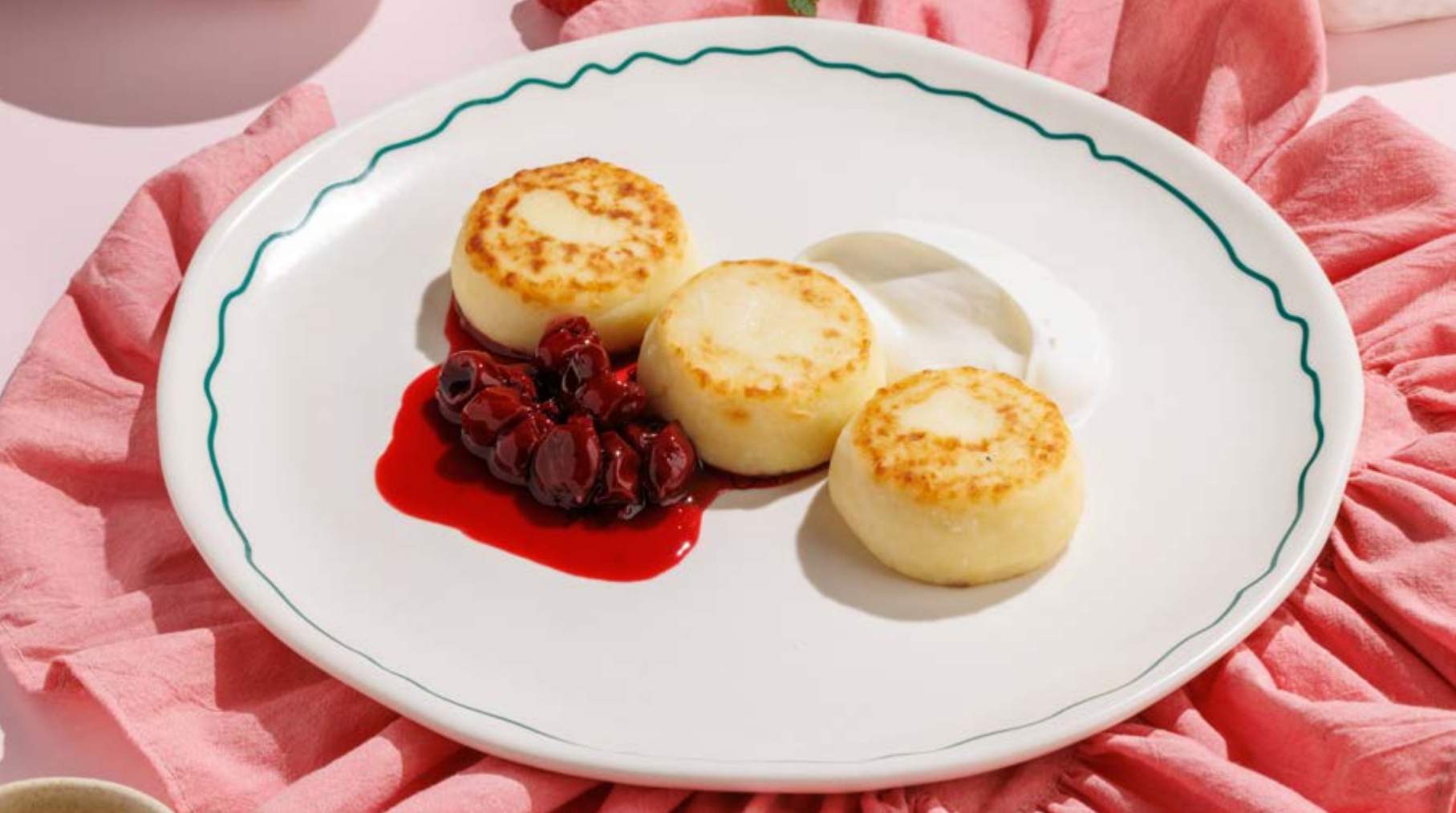
СЫРНИКИ СО СМЕТАНОЙ И ВИШНЕВЫМ ВАРЕНЬЕМ, 590₽ Cottage cheese pancakes with sour cream and cherry jam