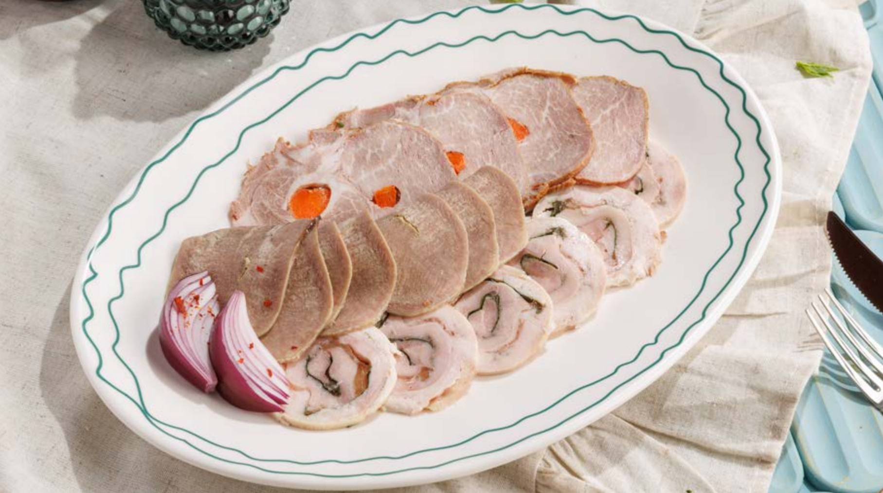
МЯСНОЕ АССОРТИ С СОУСОМ ИЗ ХРЕНА, 1590₽ Cold cuts platter