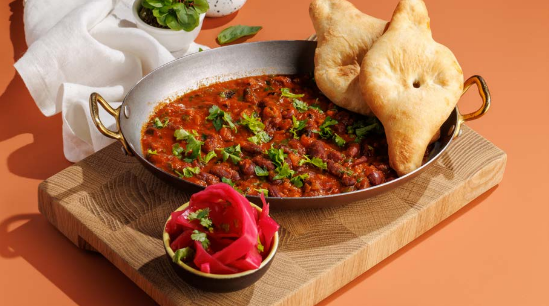
ЛОБИО «ХАРКАЛИЯ», 490₽ Kharkalia lobio