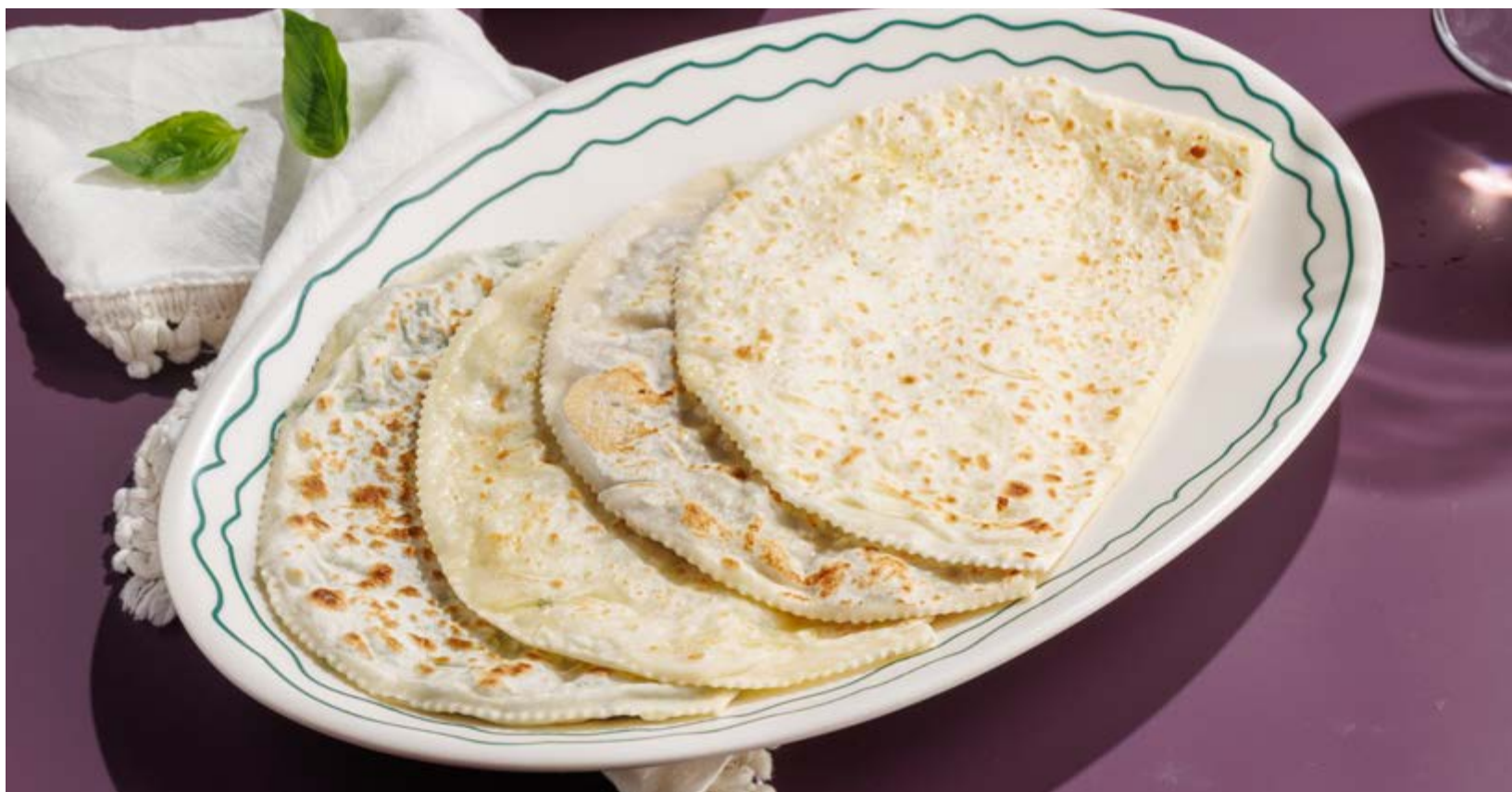
КУТАБЫ С КАРТОФЕЛЕМ / С ЗЕЛЕНЬЮ / С СЫРОМ / С БАРАНИНОЙ, 390₽ / 490₽ / 590₽ / 790₽ Qutabs potato / herb / cheese / lamb