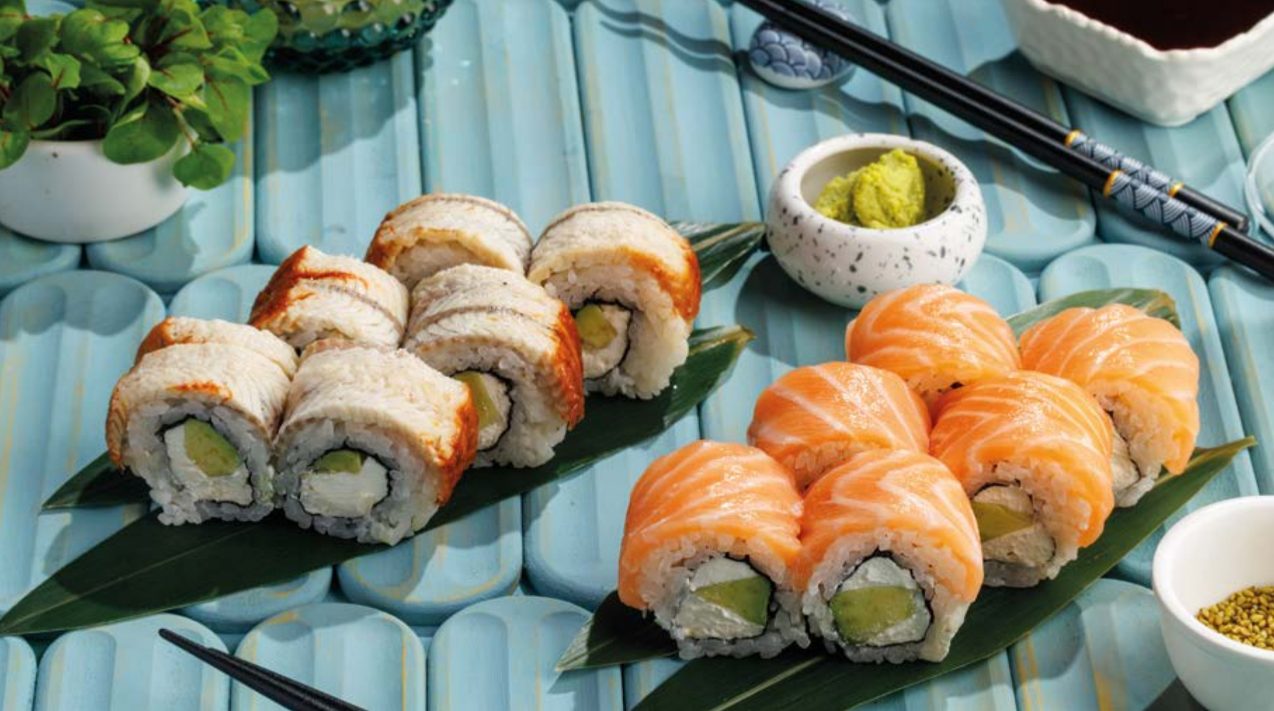
ФИЛАДЕЛЬФИЯ УГОРЬ, 1290₽ Eel Philadelphia roll