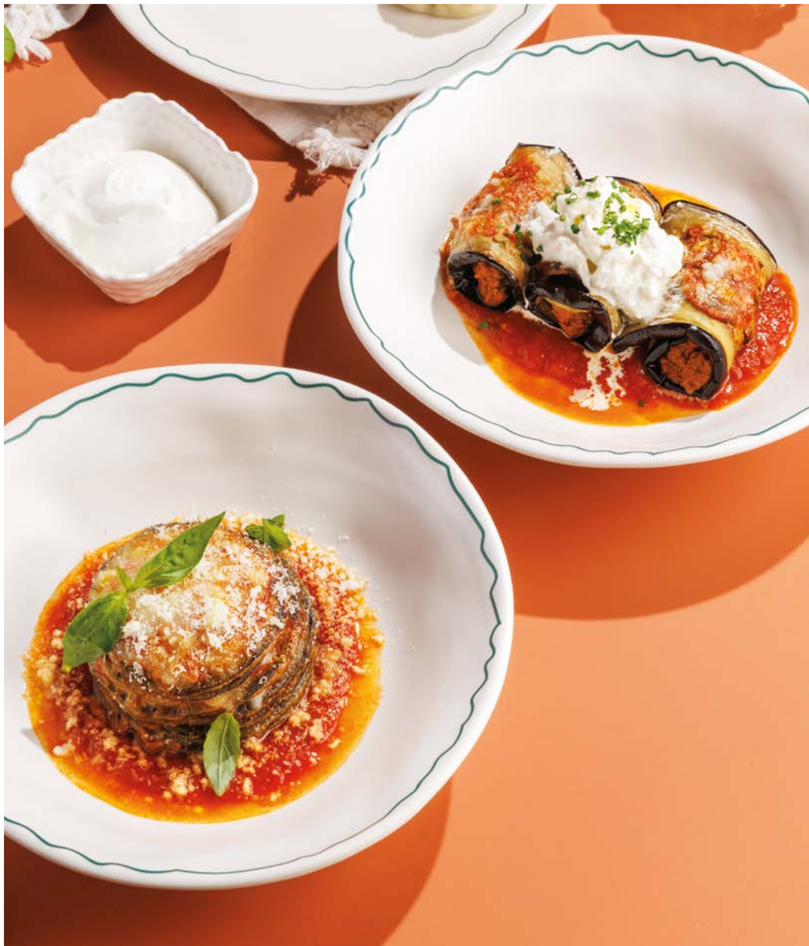
СЛОЕННЫЕ БАКЛАЖАНЫ С МОЦАРЕЛЛОЙ, 690₽ Layered eggplant with mozzarella

Просьба предупредить вашего официанта об имеющийся у вас аллергии на определённые продукты питания