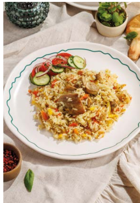
ПЛОВ ПО-БУХАРСКИ, 790₽ Bukhara-style pilaf