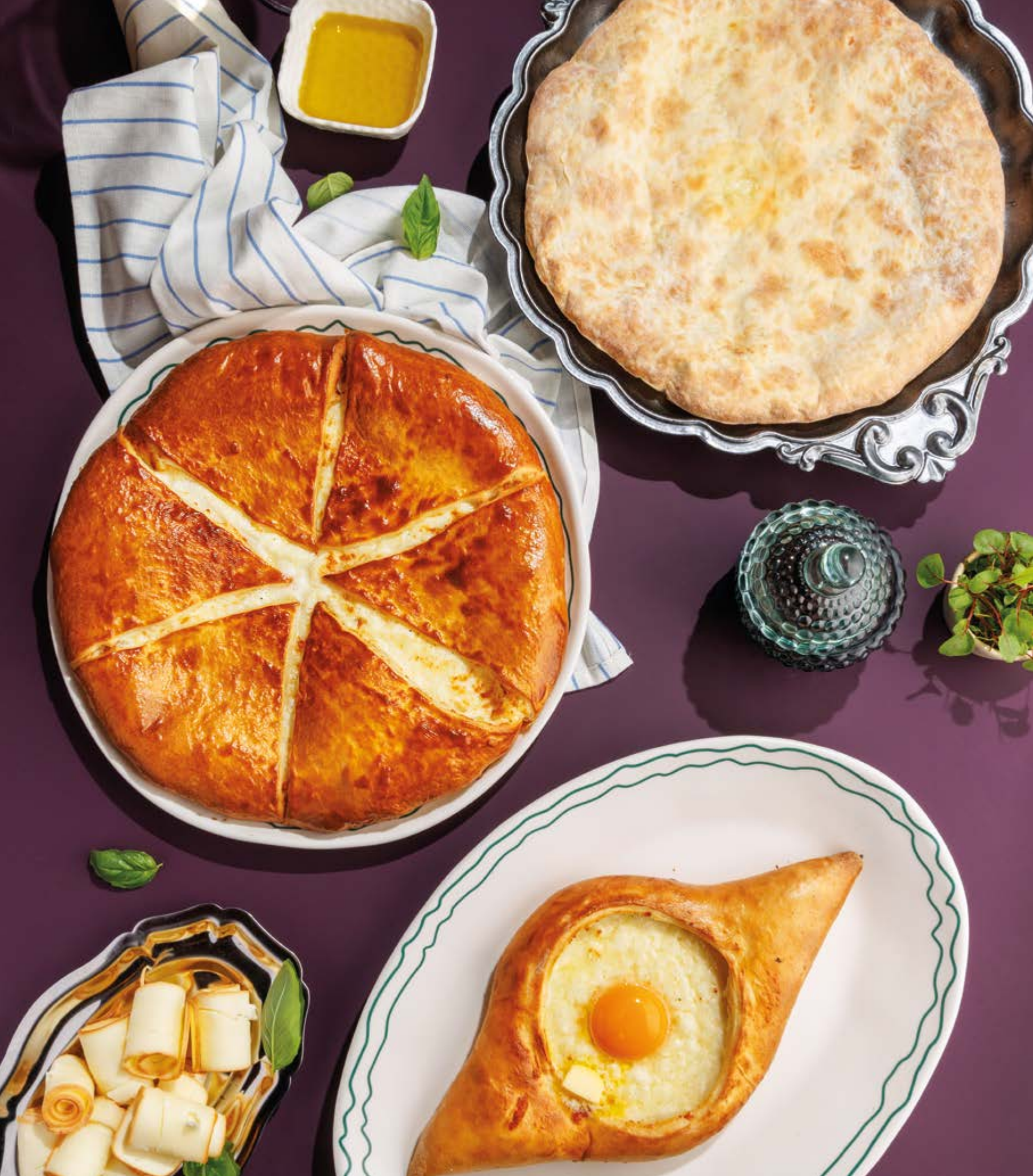
ХАЧАПУРИ ПО-СВАНСКИ, 850₽ Svanetian khachapuri