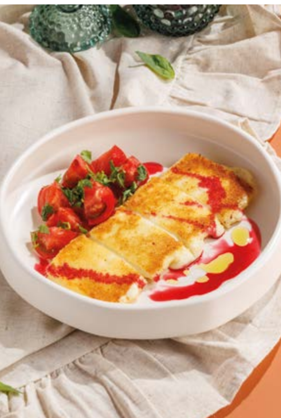
ЖАРЕННЫЙ СЫР СУЛУГУНИ С ТОМАТАМИ, 850₽ Fried sulguni with tomatoes