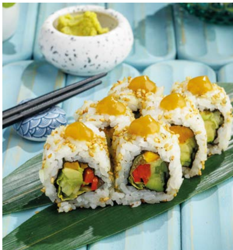
ОВОЦНОЙ РОЛЛ С ОГУРЕЧНЫМ ГЕЛЕМ, 590₽ Vegetable roll with cucumber gel