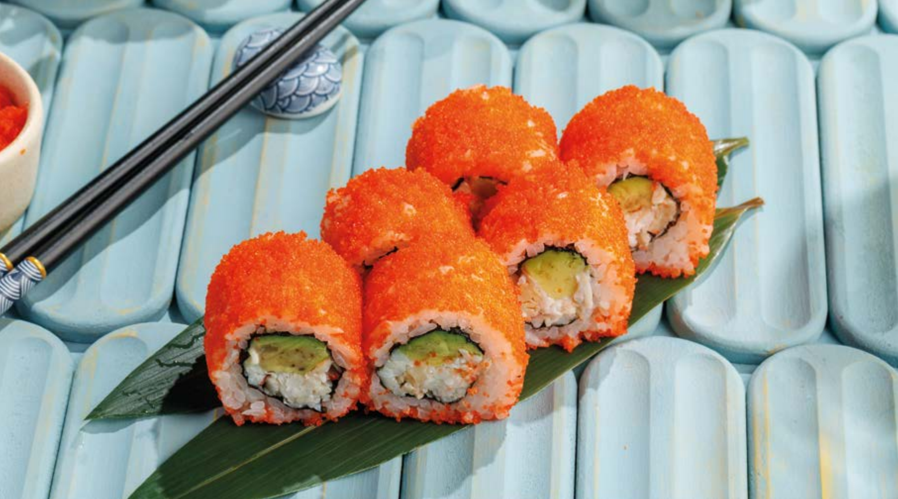
КАЛИФОРНИЯ С ЛОСОСЕМ / УГРЕМ / КРАБОМ, 990₽ / 990₽ / 1290₽ California roll with salmon / eel / crab