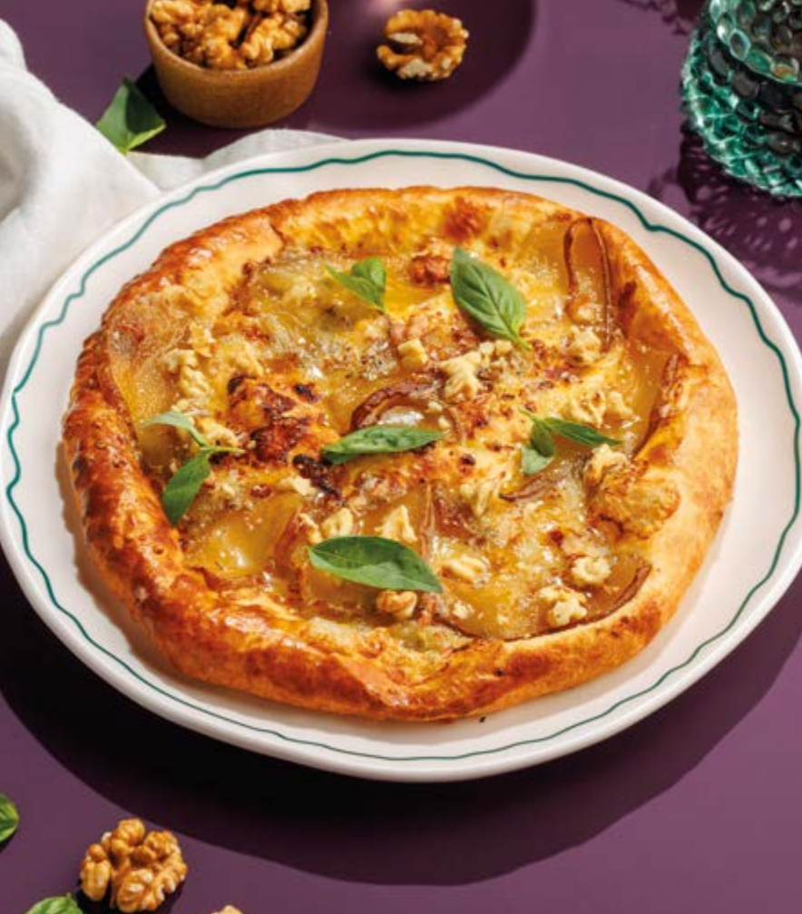
ХАЧАПУРИ С ГРУШЕЙ И СЫРОМ ГОРГОНЗОЛА, 890₽ Khachapuri with pear, gorgonzola and walnuts