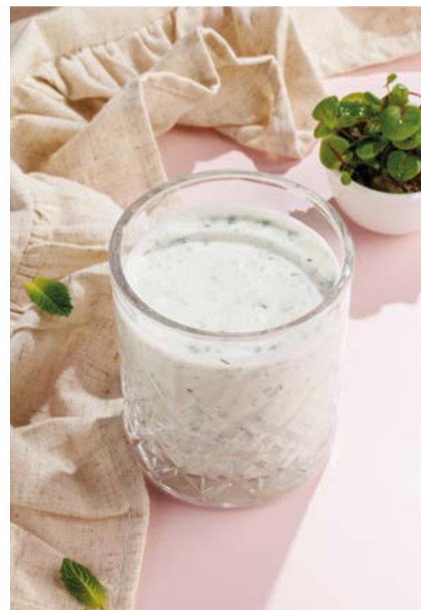
АЙРАНИ ОТ НАНИ, 390₽ Ayran from Nani