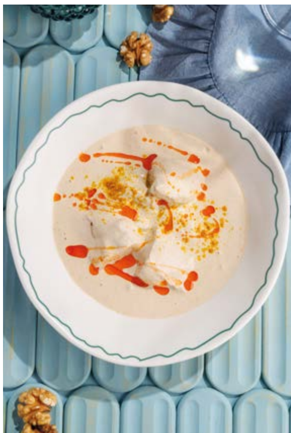
САЦИВИ ИЗ КУРИНОГО БЕДРА, 590₽ Chicken thigh satsivi