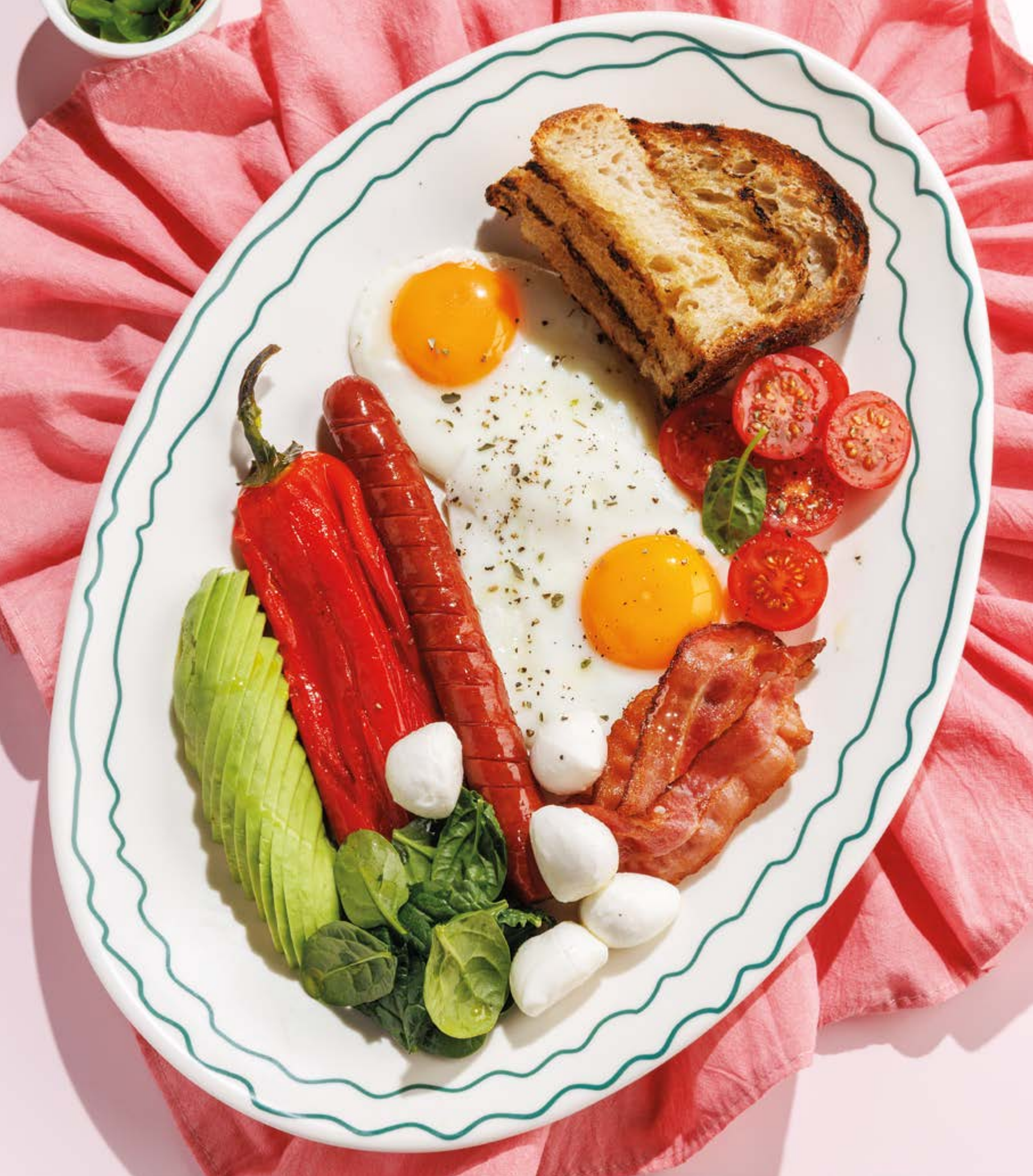
ФИРМЕННЫЙ ЗАВТРАК «БАКЛАЖАН», 1190Р «Baklazhan» signature breakfast