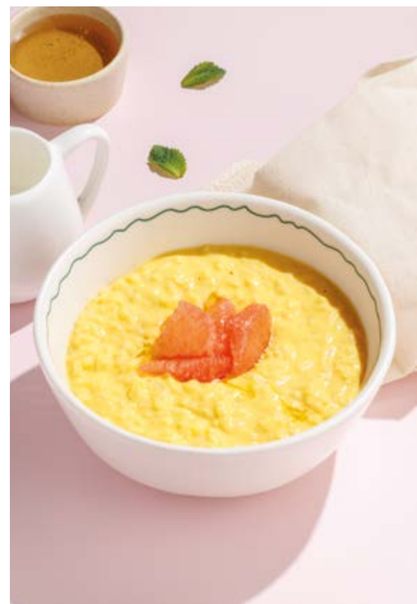
РИСОВАЯ КАША С МАНГОВЫМ СОУСОМ И ГРЕЙПФРУТОМ, 590₽ Rice porridge with mango sauce and grapefruit