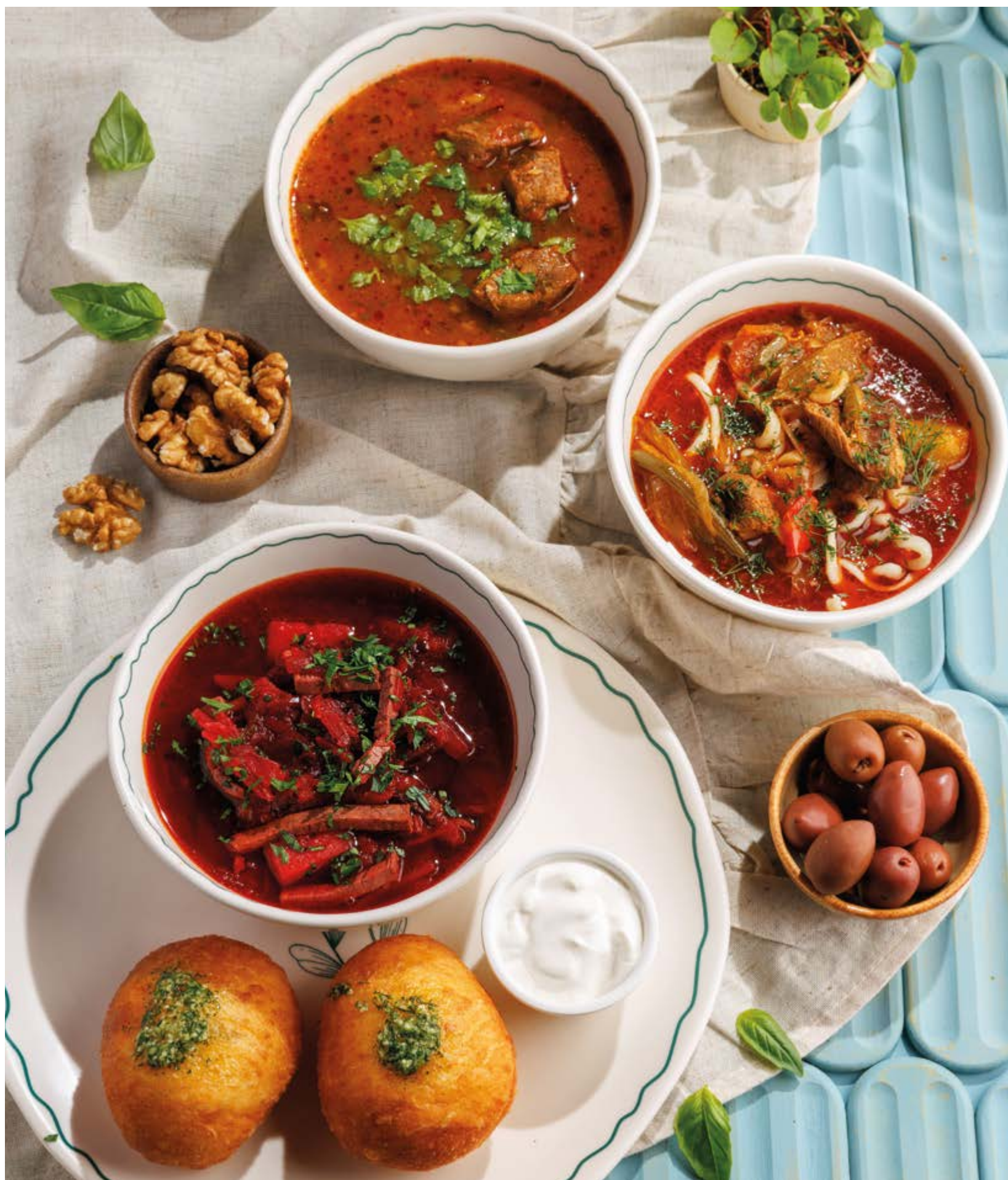
ХАРЧО С ГОВЯДИНОЙ, 690₽ Beef kharcho

Просьба предупредить вашего официанта об имеющийся у вас аллергии на определённые продукты питания