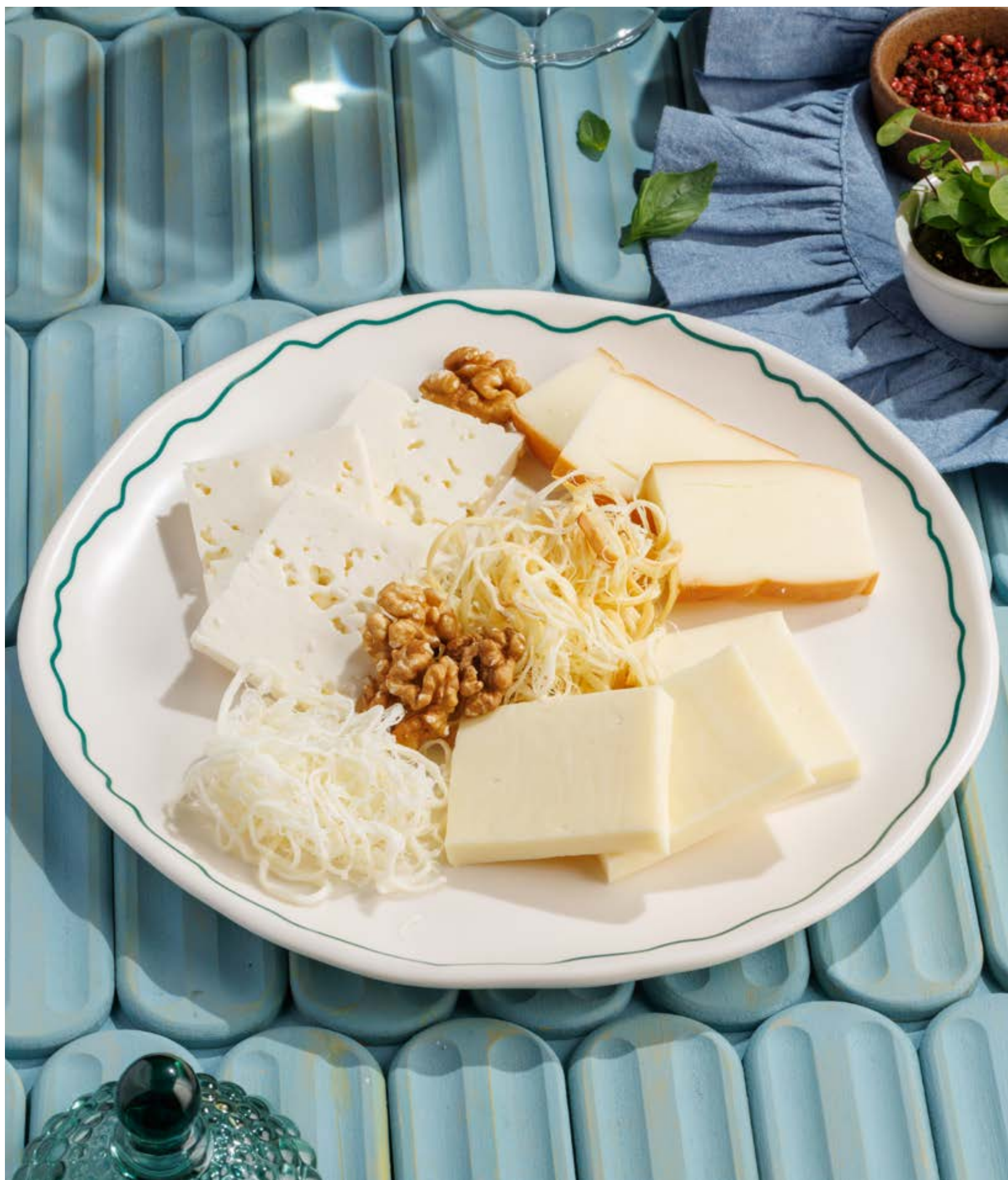
АССОРТИ ИЗ ДОМАШНИХ СЫРОВ, 890Р Assorted homemade cheese

Просьба предупредить вашего официанта об имеющийся у вас аллергии на определённые продукты питания