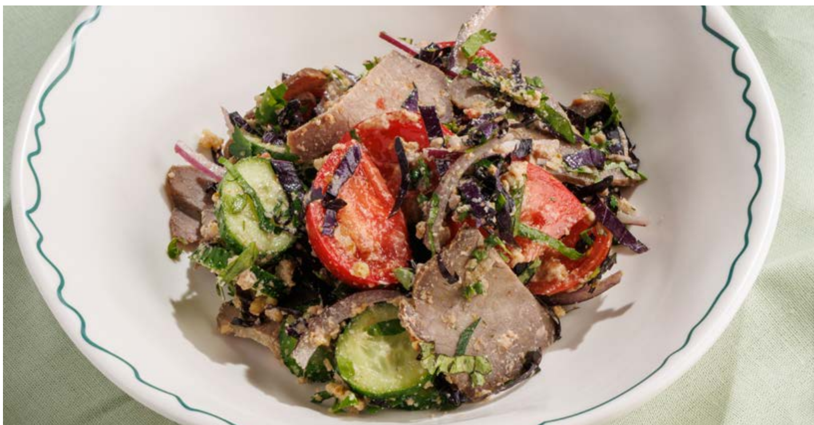
ГРУЗИНСКИЙ САЛАТ С ГОВЯДИНОЙ, 990₽