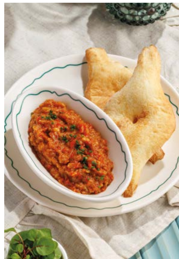
БАКЛАЖАННАЯ ИКРА, 550₽ Eggplant caviar