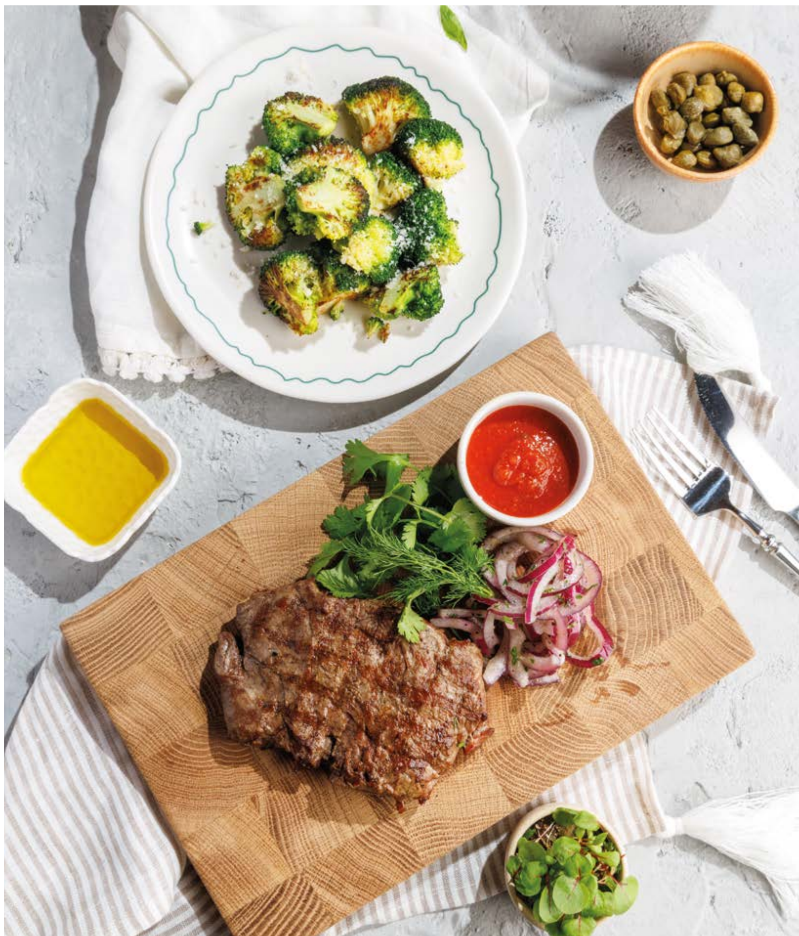
БРОККОЛИ С ПАРМЕЗАНОМ НА ГРИЛЕ / НА ПАРУ, 590Р Grilled / steamed broccoli with parmesan