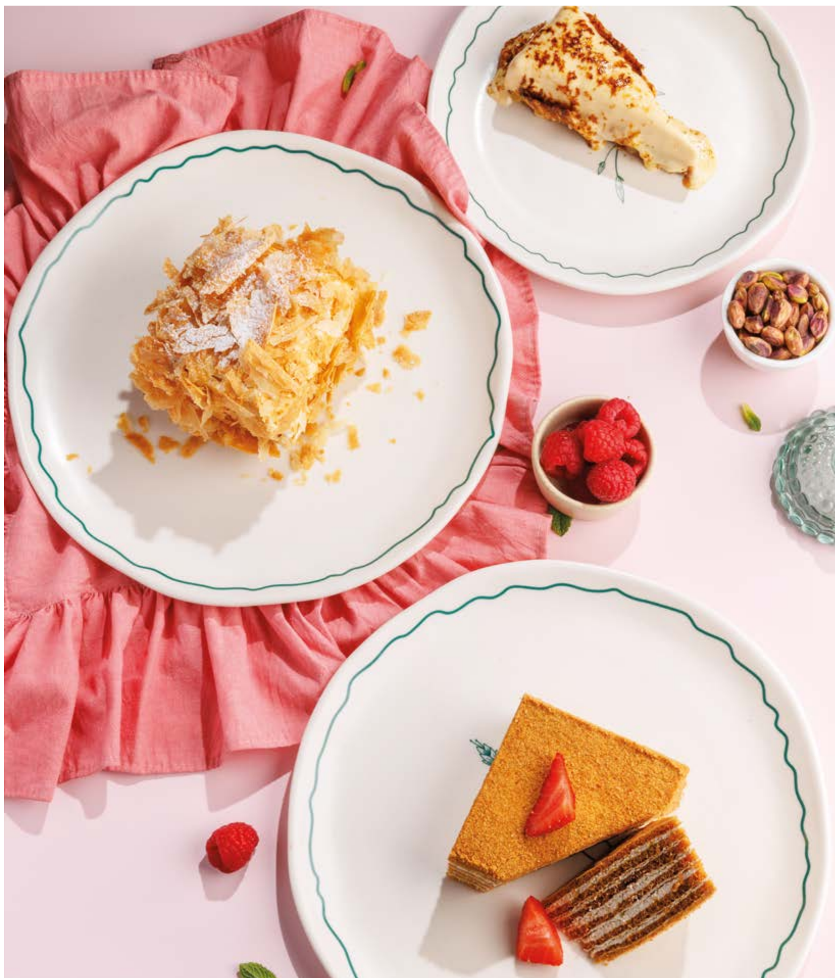
КВЕЛИАНИ, 590₽ Kveliani

Просьба предупредить вашего официанта об имеющийся у вас аллергии на определённые продукты питания