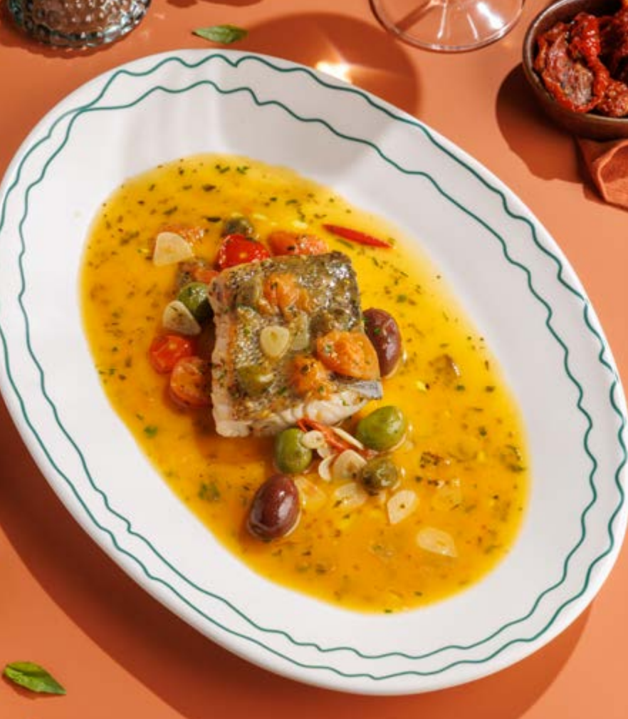
СУДАК В ГРЕЧЕСКОМ СТИЛЕ, 990₽ Greek-style pike perch