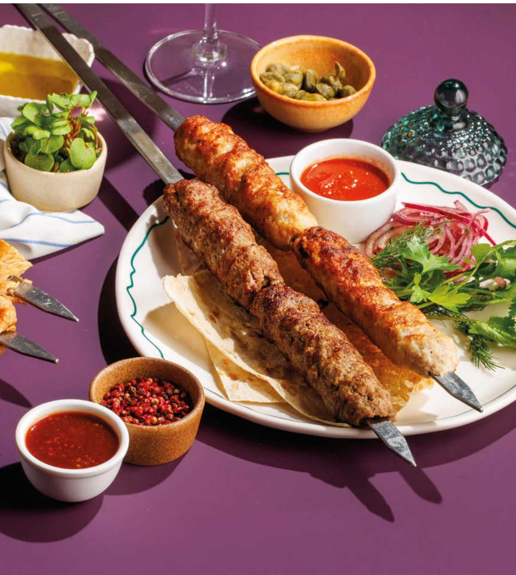
ЛЮЛЯ-КЕБАБ ИЗ БАРАНИНЫ / ИЗ КУРИЦЫ, 1290Р / 790Р Lamb / chicken lula-kebab