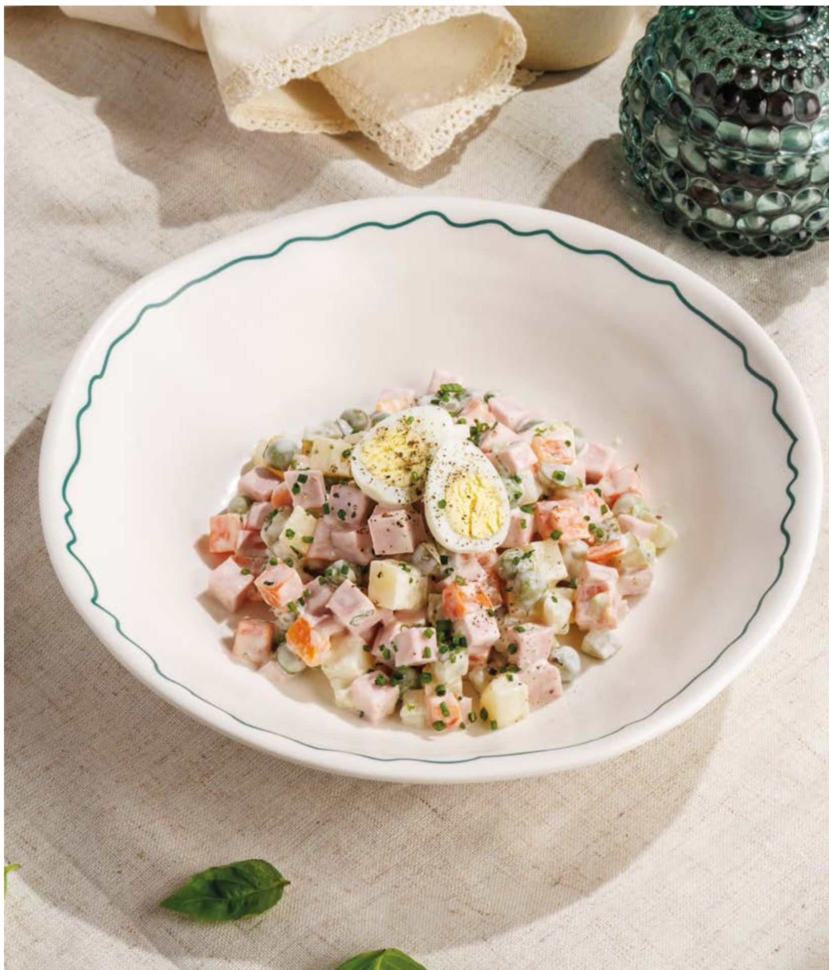
ОЛИВЬЕ ПО-ДОМАШНЕМУ С КОЛБАСОЙ, 590Р

Просьба предупредить вашего официанта об имеющийся у вас аллергии на определённые продукты питания