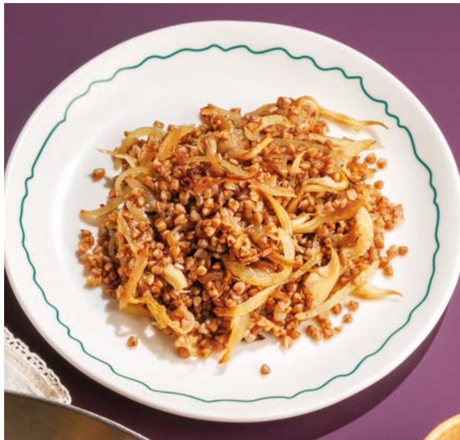
ЖАРЕННЫЙ КАРТОФЕЛЬ С СЕЗОННЫМИ ГРИБАМИ / ГРЕЧА С СЕЗОННЫМИ ГРИБАМИ, 590₽ / 490₽ Fried potatoes with seasonal mushrooms / buckwheat with seasonal mushrooms