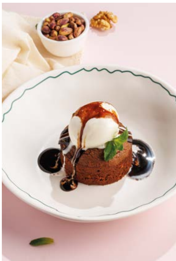
ШОКОЛАДНАЯ ШКАТУЛКА С ВАНИЛЬНЫМ МОРОЖЕНЫМ, 690₽ Chocolate box with vanilla ice cream