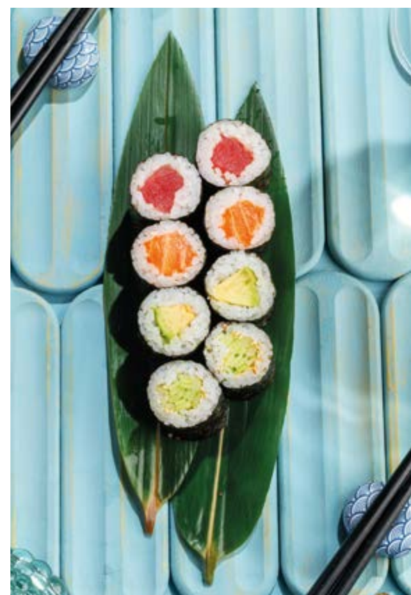
РОЛЛЫ АВОКАДО / ОГУРЕЦ / ТУНЕЦ / ЛОСОСЬ, 490₽ / 310₽ / 790₽ / 750₽ Avocado / cucumber / tuna / salmon rolls