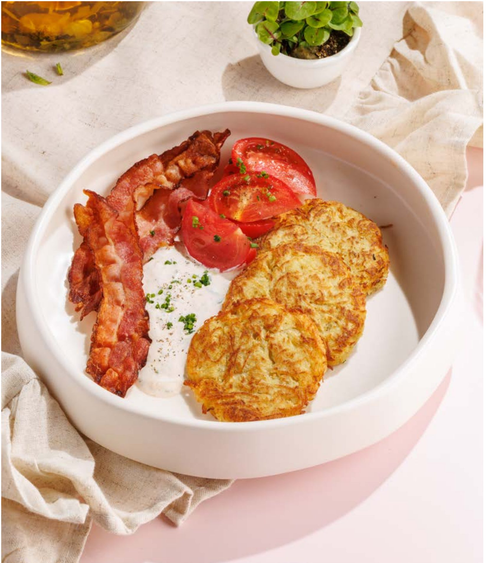
ДРАНИКИ С БЕКОНОМ, ТОМАТАМИ И ПРЯНЫМ СОУСОМ, 750Р Potato pancakes with bacon

Просьба предупредить вашего официанта об имеющийся у вас аллергии на определённые продукты питания