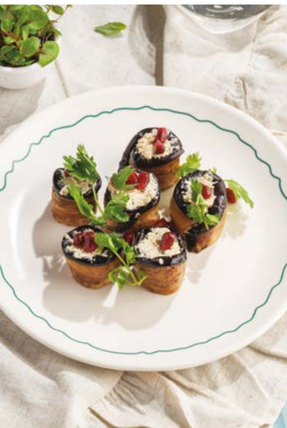
РУЛЕТЫ ИЗ ЖАРЕННЫХ БАКЛАЖАНОВ ПО-ГРУЗИНСКИ, 690₽ Georgian fried eggplant rolls