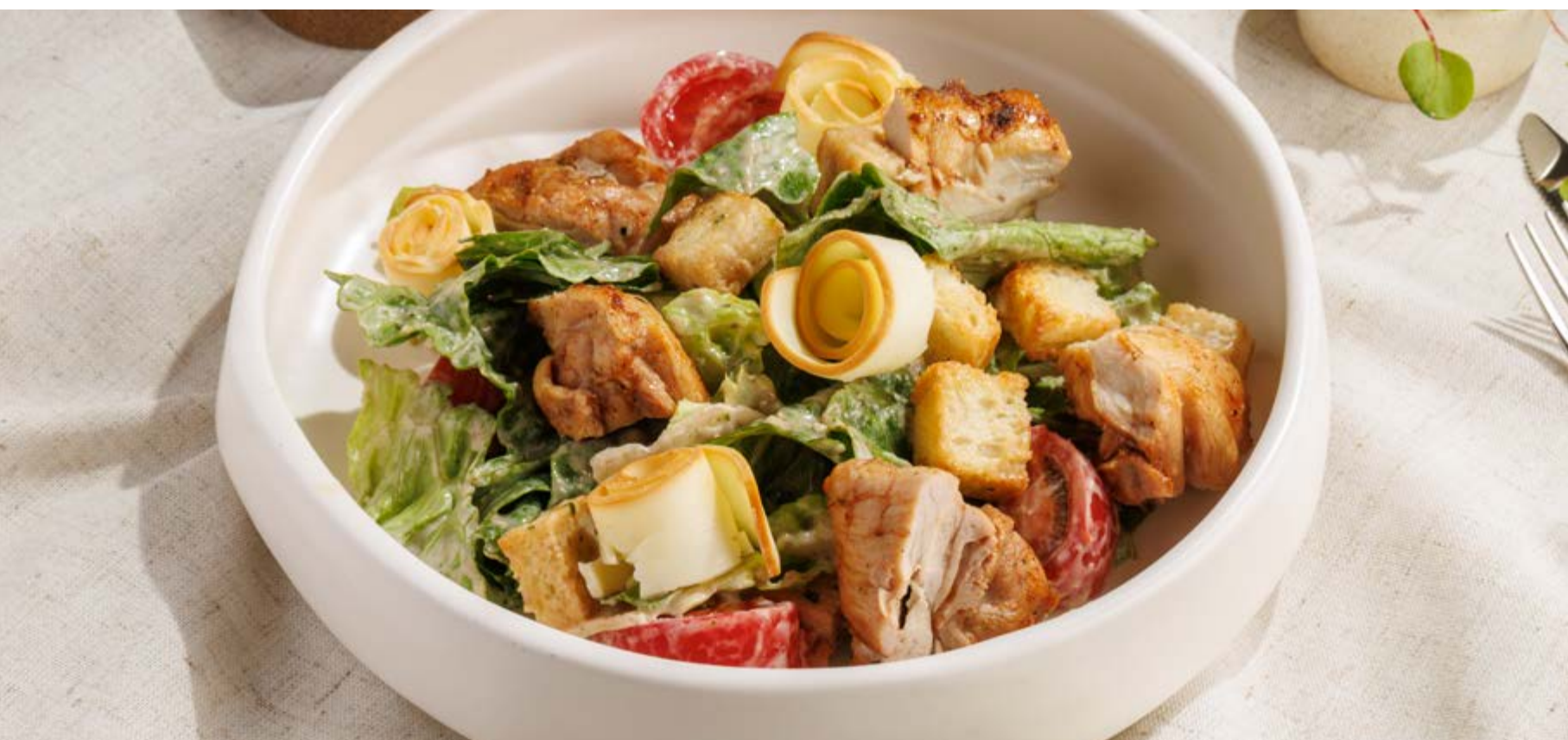
ТЕПЛЫЙ САЛАТ С ЦЫПЛЕНКОМ, 950₽ Warm chicken salad