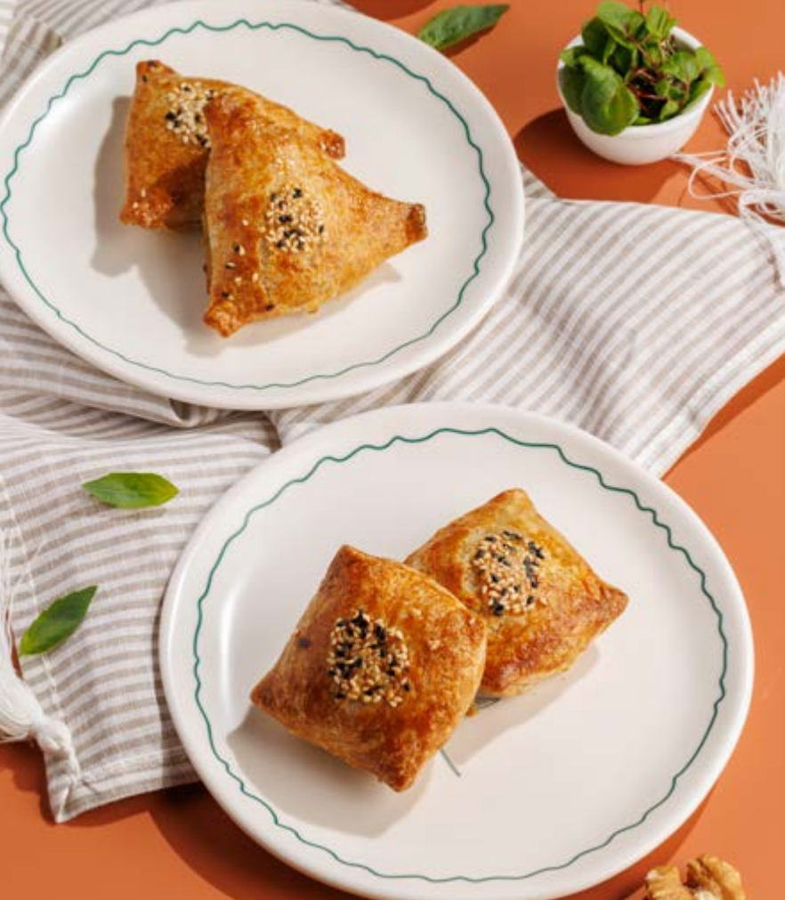
САМСА С БАРАНИНОЙ / С КУРИЦЕЙ, 550₽ Lamb/chicken samsa