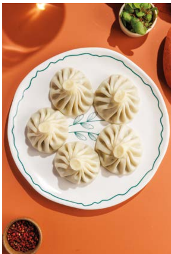
ХИНКАЛИ, 190₽ говядина-свинина / баранина / сыр-шпинат Khinkali with pork and beef / with lamb / with cheese and spinach