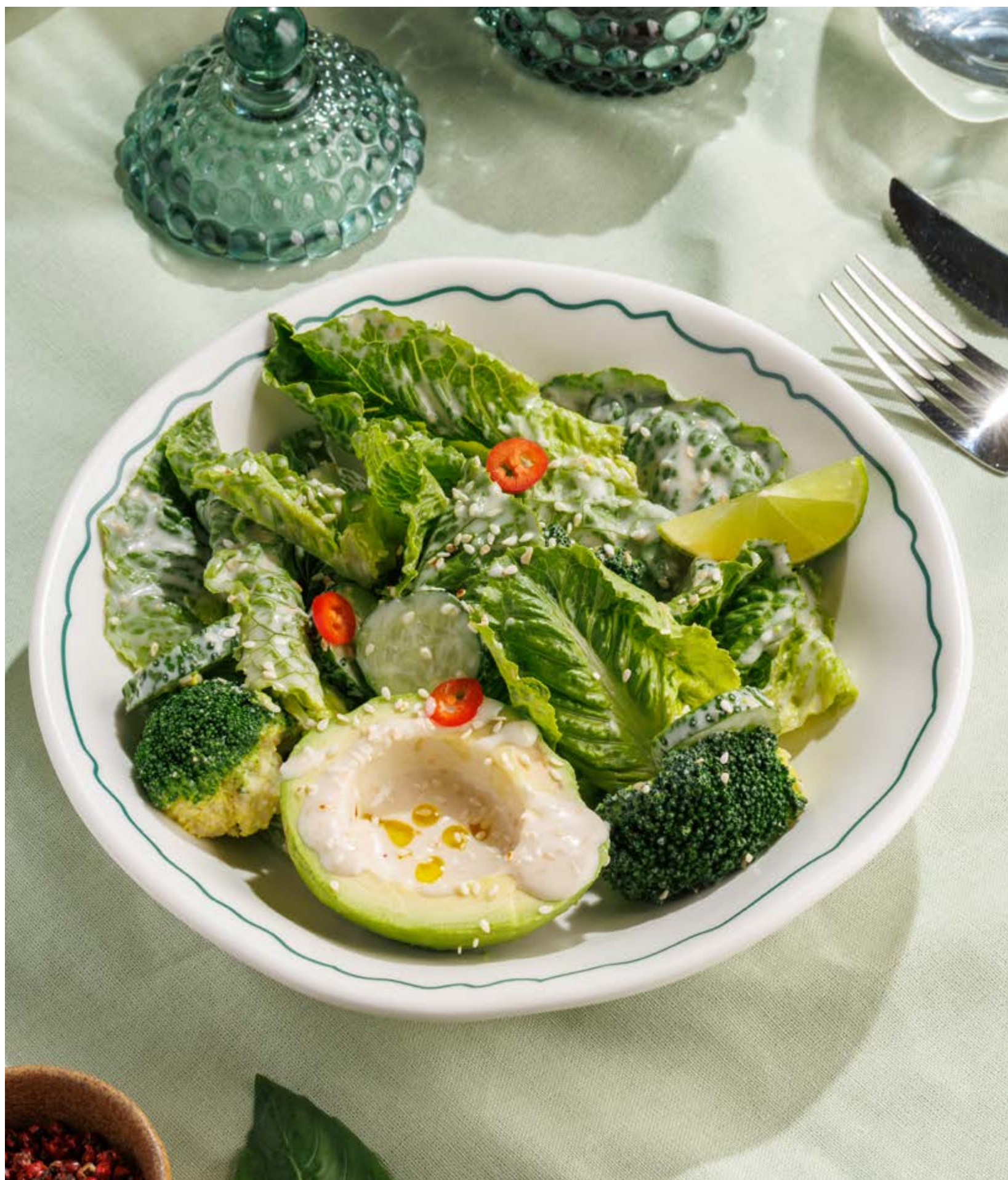
САЛАТ С АВОКАДО И ОРЕХОВОЙ ЗАПРАВКОЙ, 790₽ Avocado salad with nut dressing

Просьба предупредить вашего официанта об имеющийся у вас аллергии на определённые продукты питания