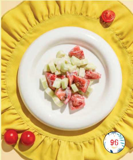
Овощная компания со сметаной/ с маслом