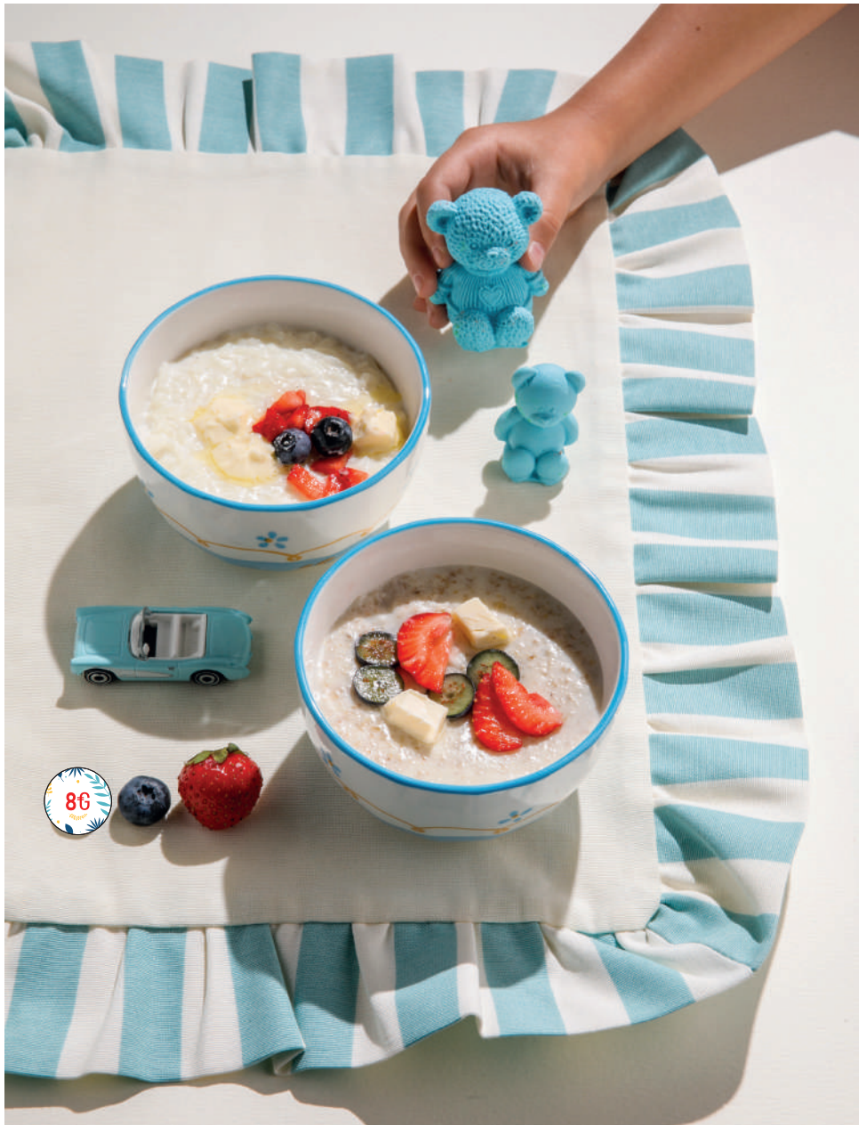
Каша (овсяная / рисовая / гречневая) с ягодами На молоке или на воде