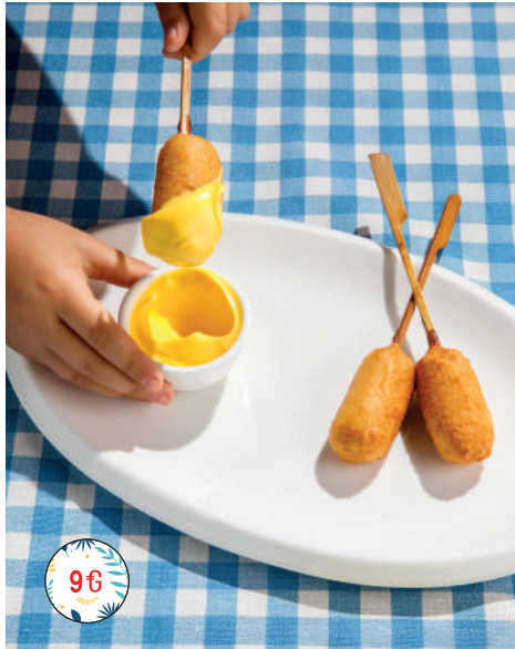
Сосиски в тесте с сырным соусом