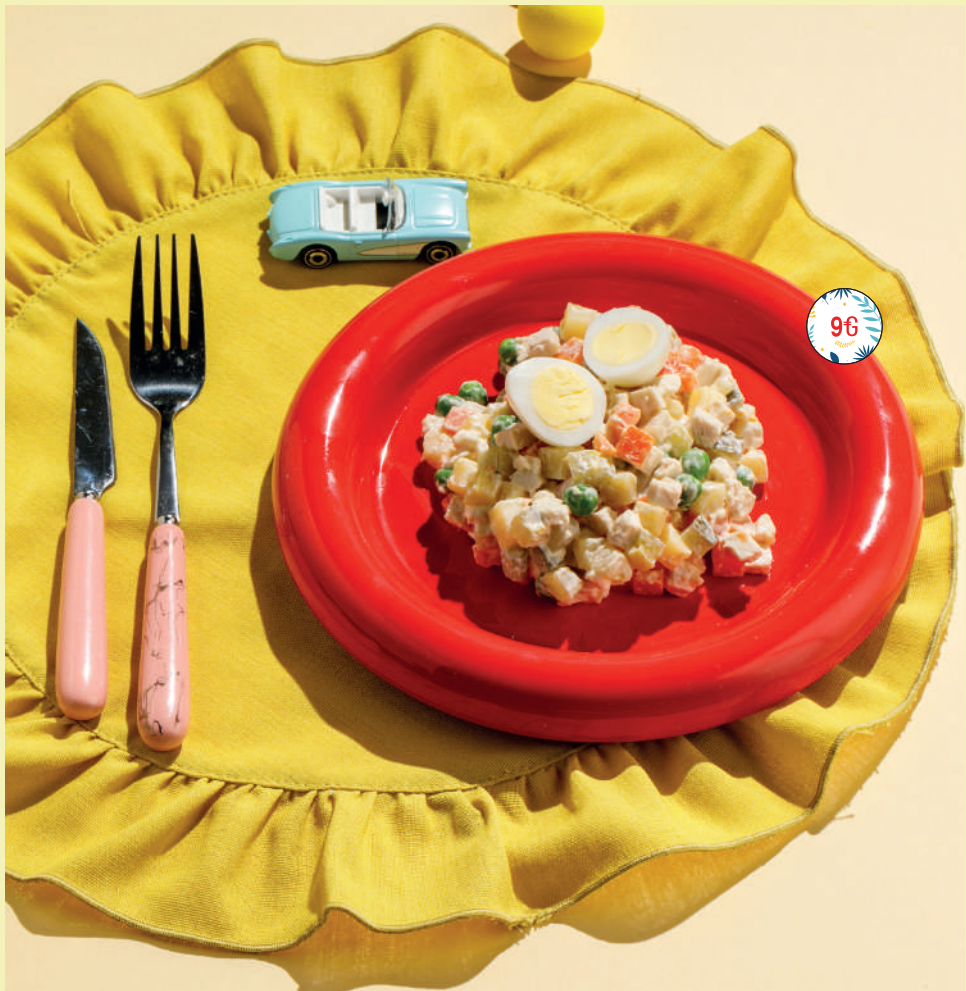
Оливье с курочкой