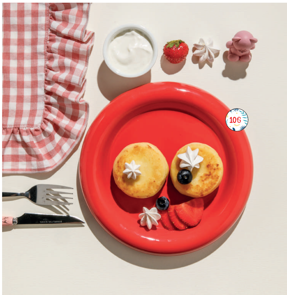
Сырники со сметаной (изюма тут нет)