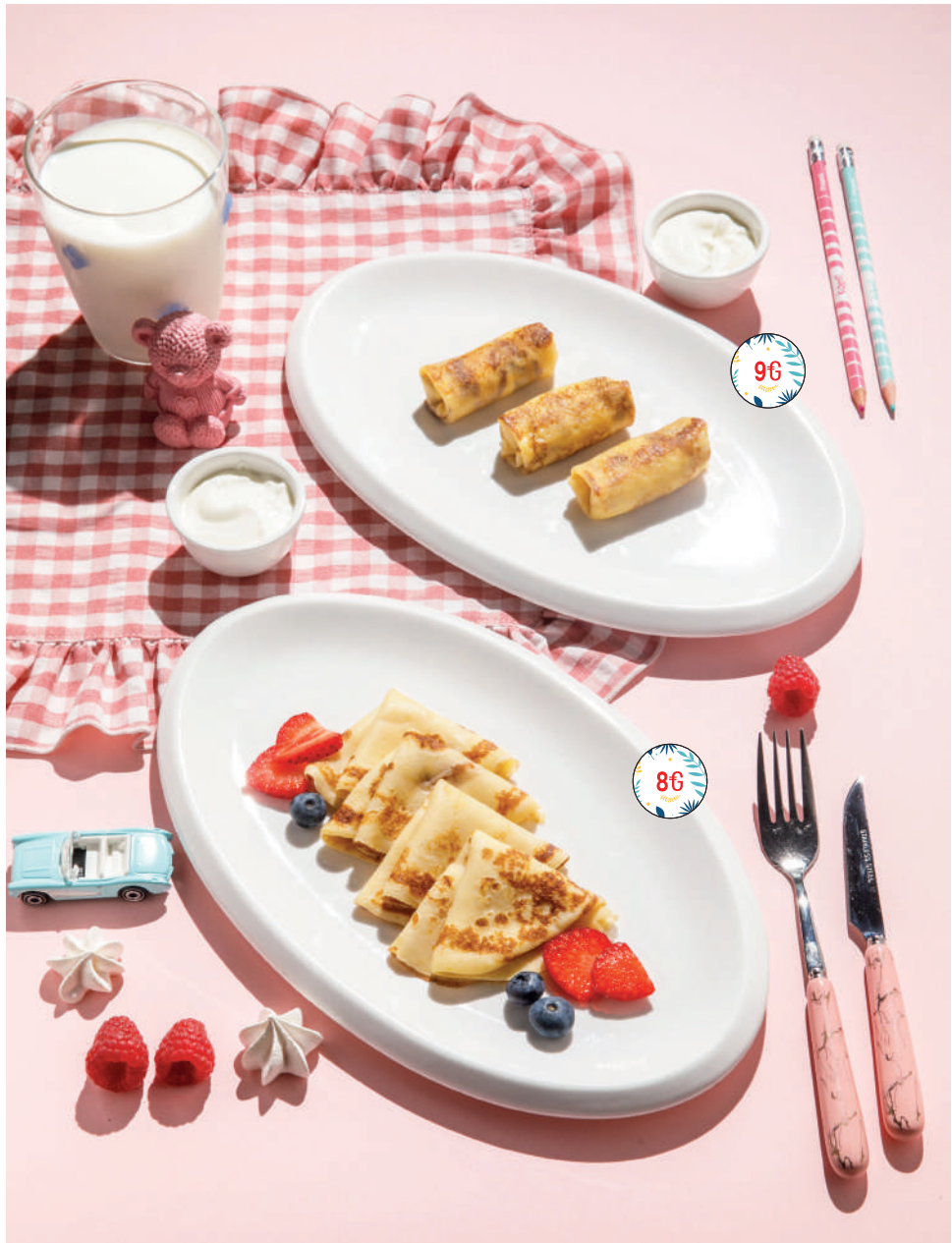
Блинчики с ягодами