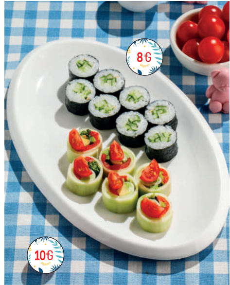
Ролл с огурцом / с овощами гриль