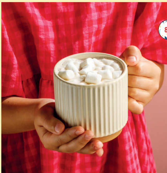
Какао с маршмеллоу