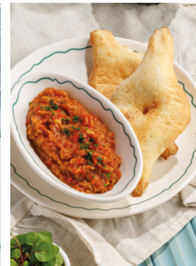
БАКЛАЖАННАЯ ИКРА, 590₽ Eggplant caviar