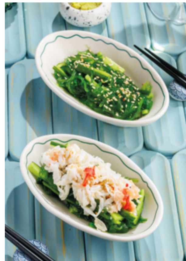
САЛАТ «КАЙСО» / С КРАБОМ, 590₽ / 1090₽ Kaiso salad / with crab