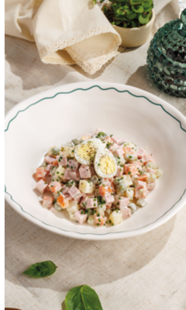
ОЛИВЬЕ ПО-ДОМАШНЕМУ С КОЛБАСОЙ, 590₽ Homemade Olivier Russian salad with sausage