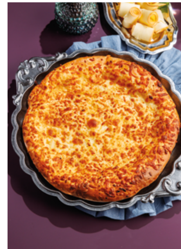
ХАЧАПУРИ ПО-МЕГРЕЛЬСКИ, 890₽ Megrelian khachapuri