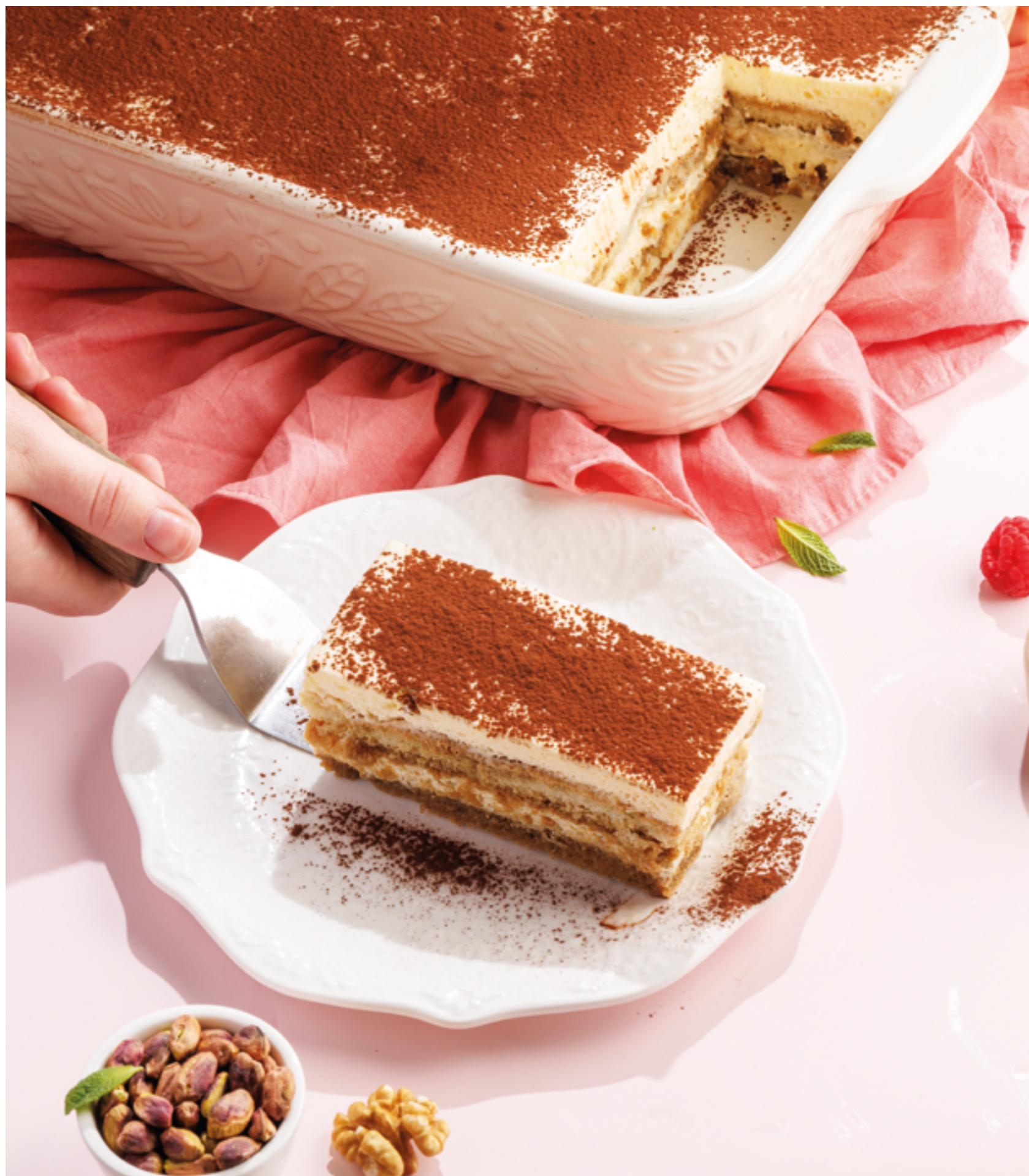
ТИРАМИСУ, 690₽ Tiramisu