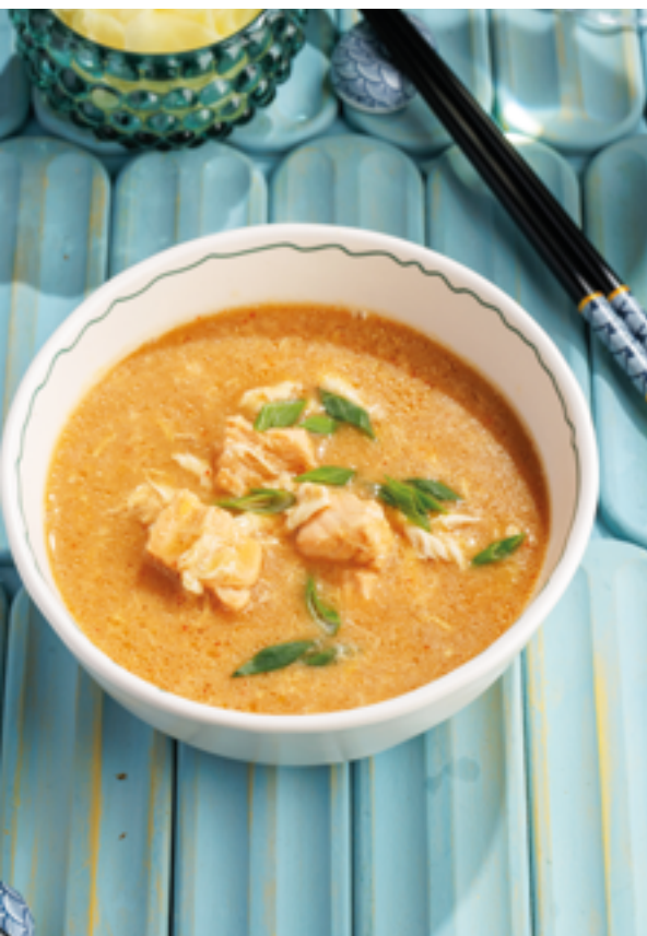
КИМЧИ С ЛОСОСЕМ, 890₽ Kimchi soup with salmon