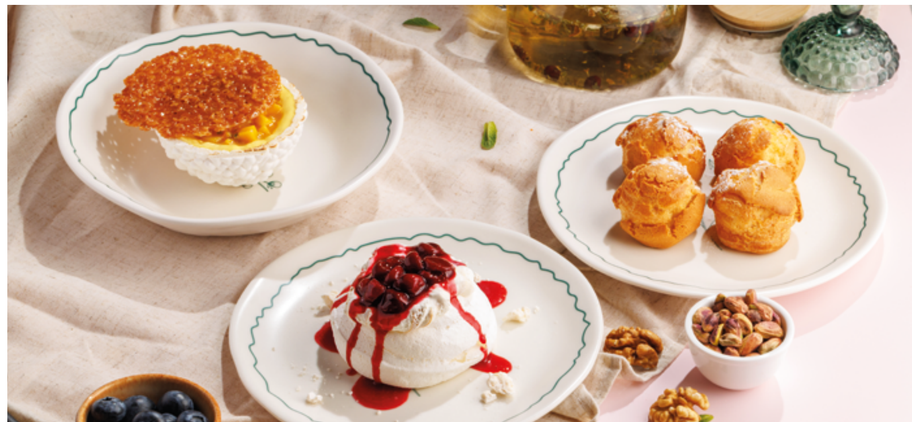
ДЕСЕРТ С ТРОПИЧЕСКИМИ ФРУКТАМИ, 850₽ Tropical fruit dessert