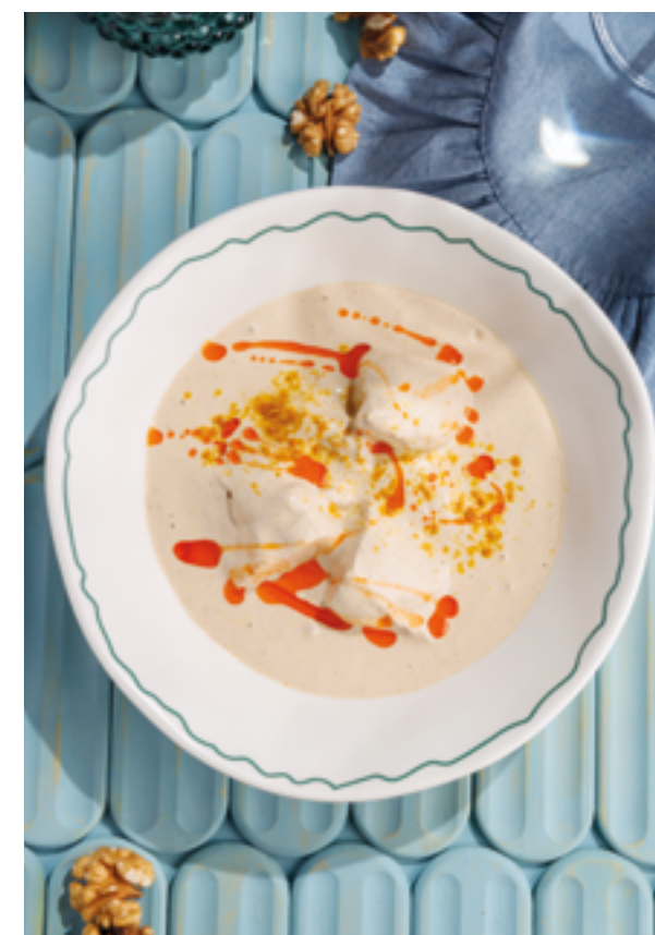
САЦИВИ ИЗ КУРИНОГО БЕДРА, 690₽ Chicken thigh satsivi