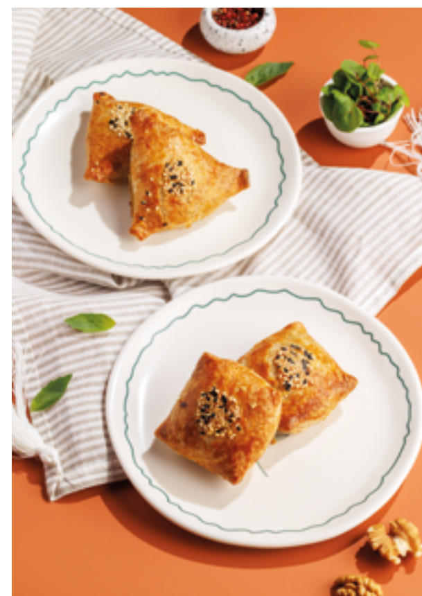
САМСА С БАРАНИНОЙ / С КУРИЦЕЙ, 790₽ / 590₽ Lamb samsa / Chicken samsa