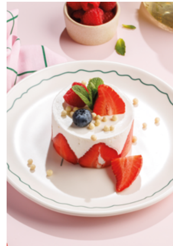
СМЕТАНИК, 890₽ Smetannik (sour cream cake)