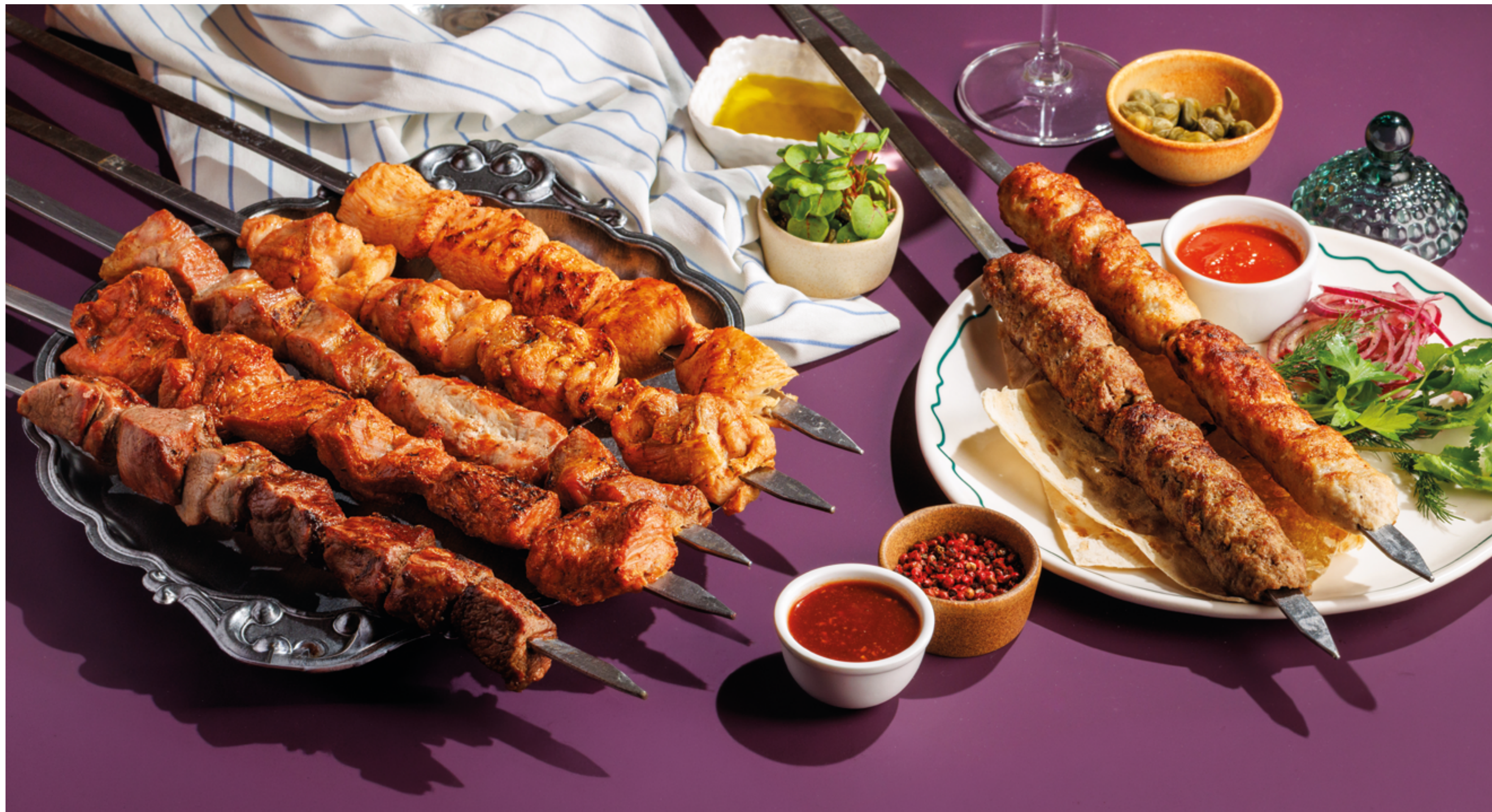
ШАШЛЫК ИЗ ИНДЕЙКИ / ИЗ КУРИНОГО БЕДРА / ИЗ КУРИНОГО ФИЛЕ / ИЗ МЯКОТИ ЯГНЕНКА / ИЗ СВИНИНЫ 990₽ / 890₽ / 890₽ / 1790₽ / 990₽ Turkey / chicken thigh / chicken breast / lamb / pork shashlik