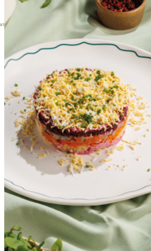
СЕЛЬДЬ ПОД ШУБОЙ, 690₽ Dressed herring