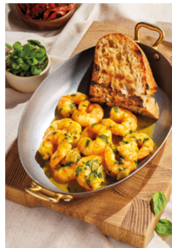
ЖАРЕНЫЕ КРЕВЕТКИ С ЧЕСНОКОМ И ШАФРАНОМ, 1390₽ Fried shrimp with garlic