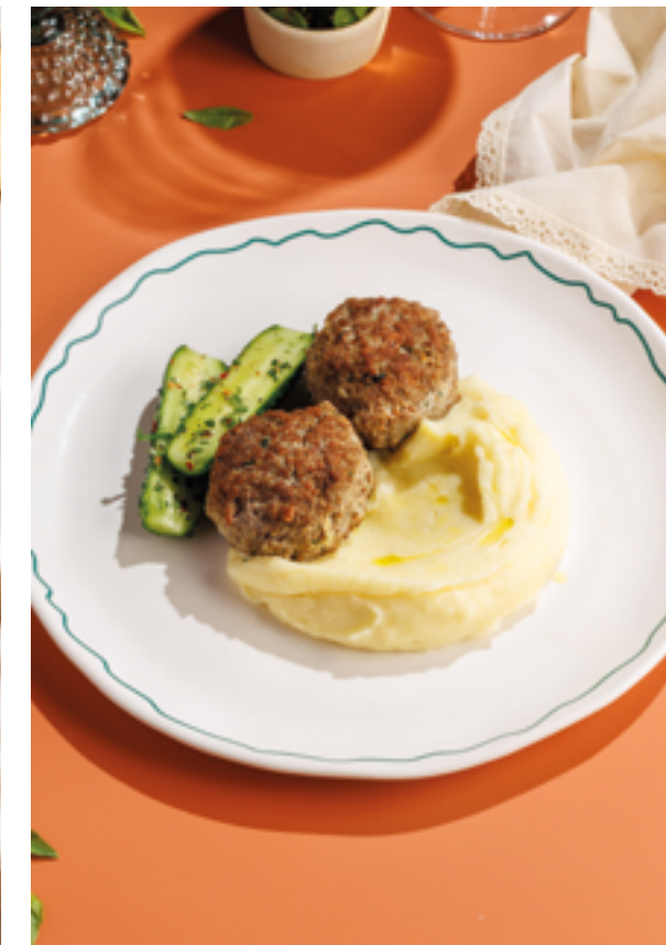
ДОМАШНИЕ КОТЛЕТЫ ОТ ПЕТРОВНЫ, 990₽ Homemade patties by Petrovna