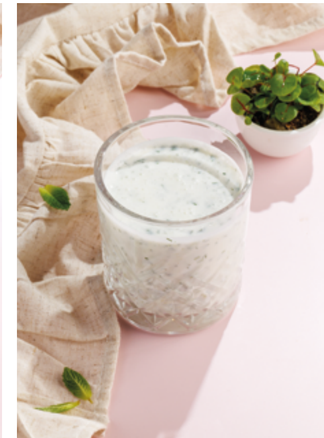
АЙРАНИ ОТ НАНИ, 390₽ Ayran from Nani