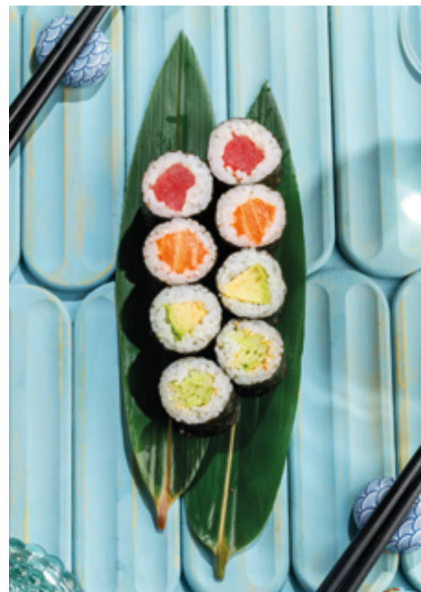
РОЛЛЫ АВОКАДО / ОГУРЕЦ / ТУНЕЦ / ЛОСОСЬ, 490₽ / 390₽ / 790₽ / 890₽ Avocado / cucumber / tuna / salmon rolls