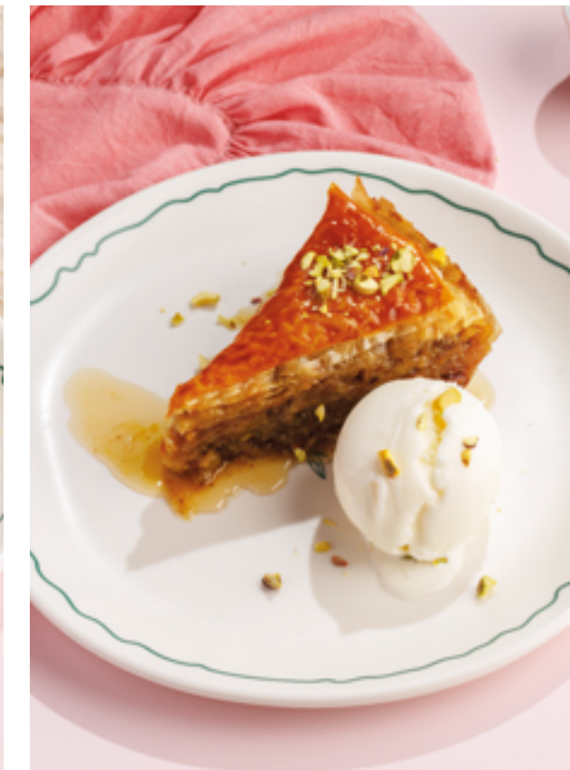
ФИСТАШКОВАЯ ПАХЛАВА С МОРОЖЕНЫМ, 790₽ Pistachio baklava with ice cream