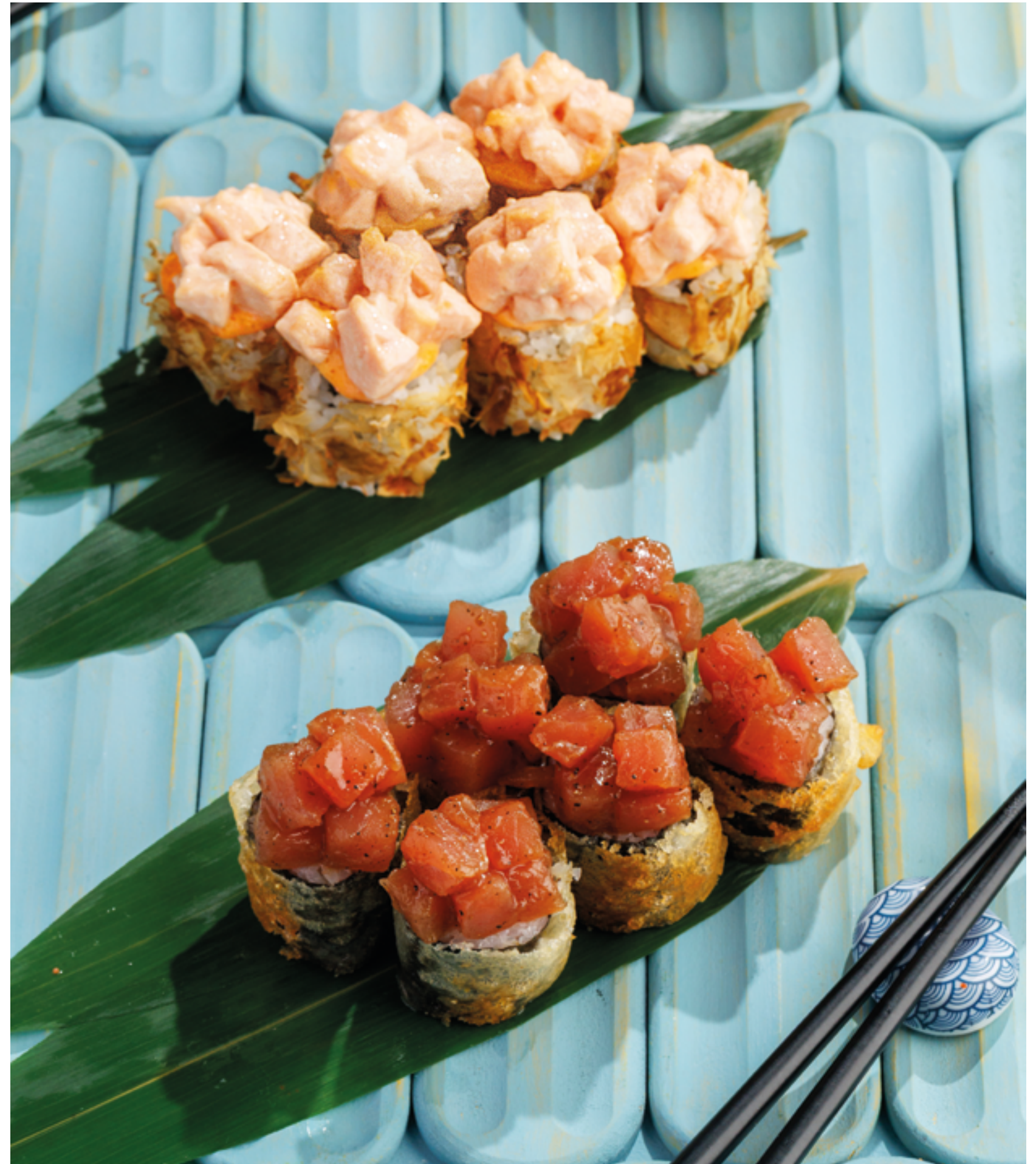
ФИЛАДЕЛЬФИЯ ЛОСОСЬ / ОБОЖЕННАЯ ФИЛАДЕЛЬФИЯ ЛОСОСЬ, 1290₽ Salmon Philadelphia / Seared salmon Philadelphia roll