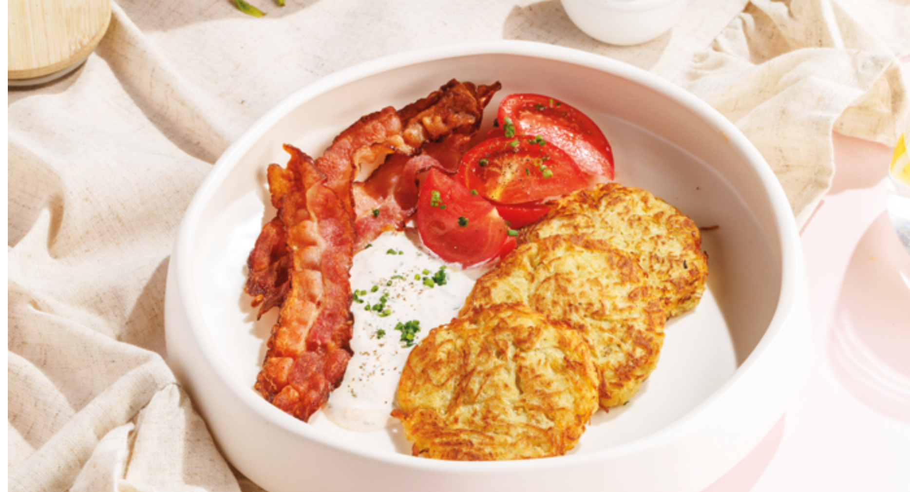
ДРАНИКИ С БЕКОНОМ, ТОМАТАМИ И ПРЯНЫМ СОУСОМ, 790₽ Potato pancakes with bacon, tomatoes and spiced sauce