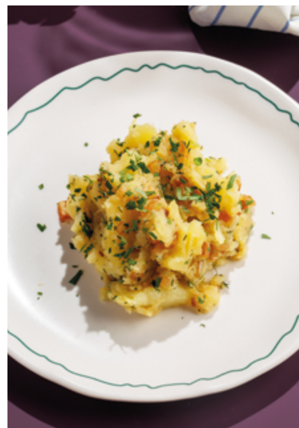
ТОЛЧЕНЫЙ КАРТОФЕЛЬ / ПЮРЕ, 290Р / 390Р Smashed / mashed potatoes