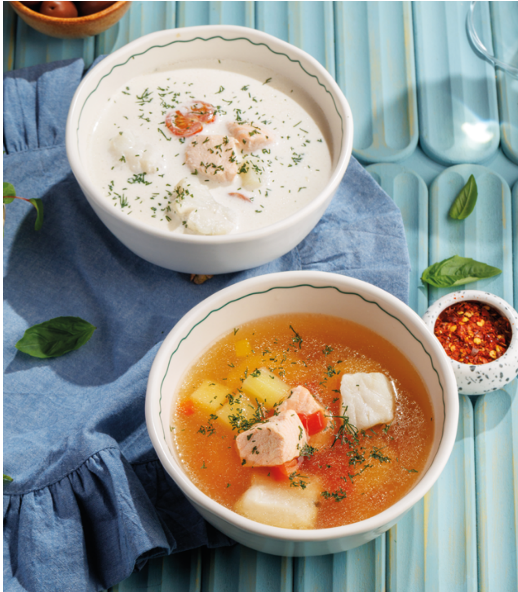
УХА СО СЛИВКАМИ, 990₽ Finnish salmon soup

Просьба предупредить вашего официанта об имеющихся у вас аллергиях на определённые продукты питания