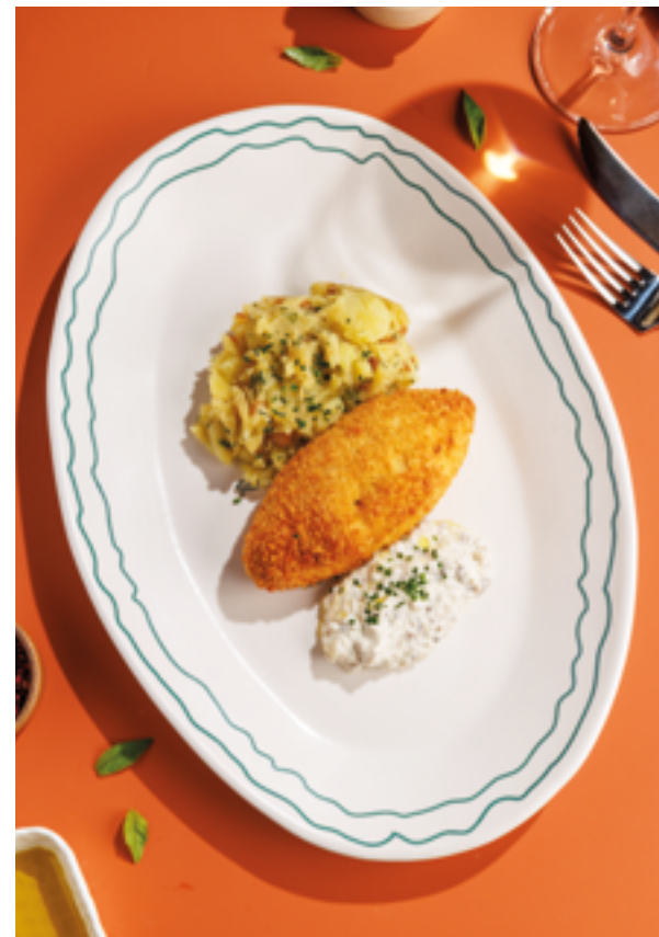
КУРИНАЯ КОТЛЕТА В ХРУСТЯЩЕЙ ПАНИРОВКЕ С ТОЛЧЕНЫМ КАРТОФЕЛЕМ, 890₽ Crispy breaded chicken cutlet with mashed potatoes