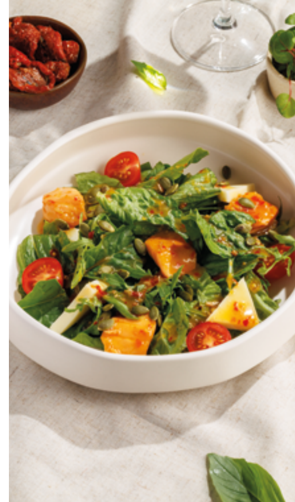
ТЕПЛЫЙ САЛАТ С ЛОСОСЕМ, 1590₽ Warm salmon salad