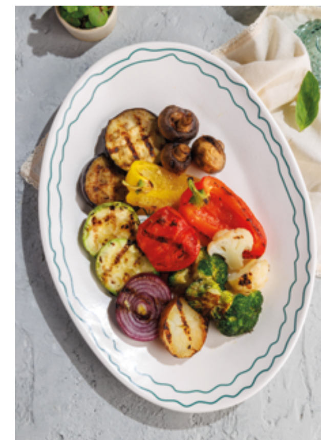
ОВОЩИ ГРИЛЬ, 890Р Grilled vegetables