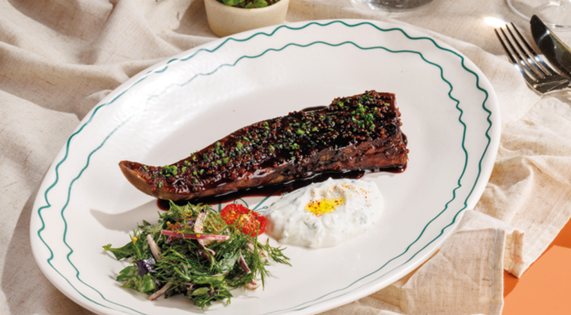
ГЛАЗИРОВАННЫЙ В СОУСЕ ПОРТО ГОВЯЖИЙ ЯЗЫК, 2990₽ Port-glazed beef tongue served with fresh herbs