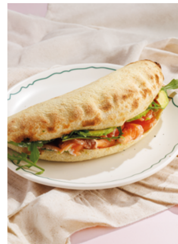
ПАНИНИ С ЛОСОСЕМ И АВОКАДО, 990₽ Salmon and avocado panini