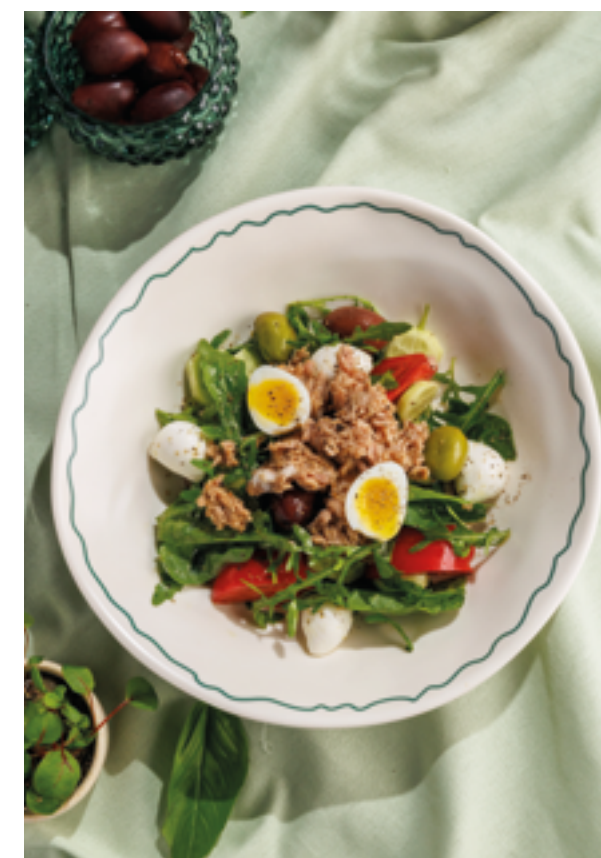
ИТАЛЬЯНСКИЙ САЛАТ С ТУНЦОМ И ОЛИВКАМИ, 1190₽ Italian salad with tuna and olives