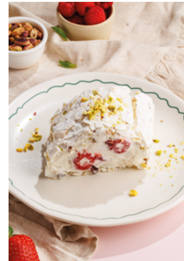
ФИСТАШКОВЫЙ РУЛЕТ С МАЛИНОЙ, 890₽ Pistachio roll with raspberries