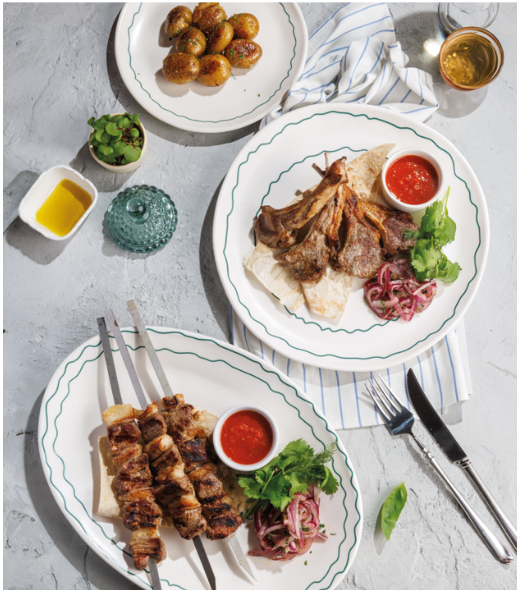
БЕБИ-КАРТОФЕЛЬ, 490Р Baby potatoes

Просьба предупредить вашего официанта об имеющийся у вас аллергии на определённые продукты питания