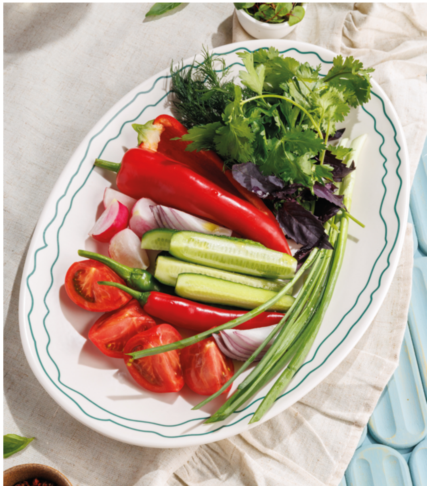
СЕЗОННЫЕ ОВОЩИ И ЗЕЛЕНЬ, 990₽ Seasonal vegetables and greens

Просьба предупредить вашего официанта об имеющихся у вас аллергиях на определённые продукты питания