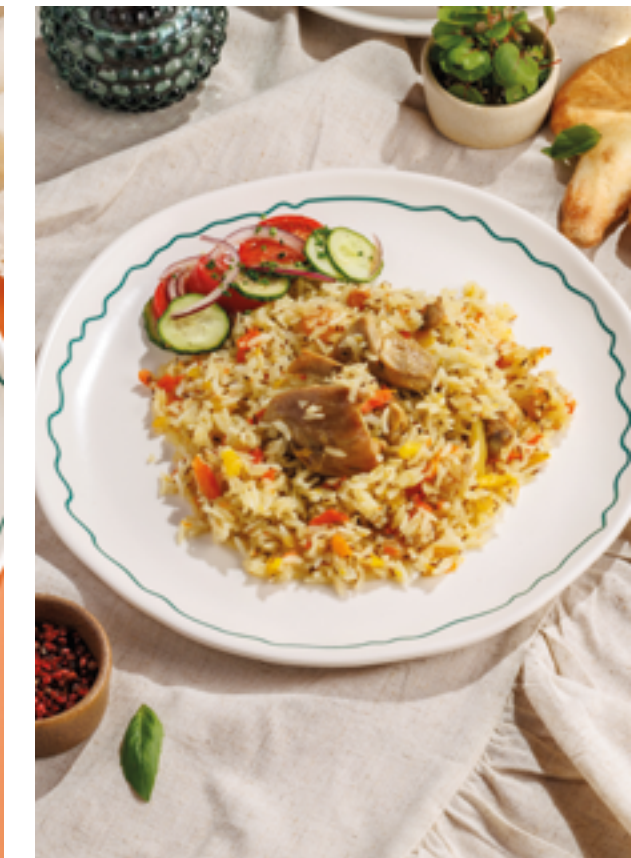
ПЛОВ ПО-БУХАРСКИ, 890₽ Bukhara-style pilaf