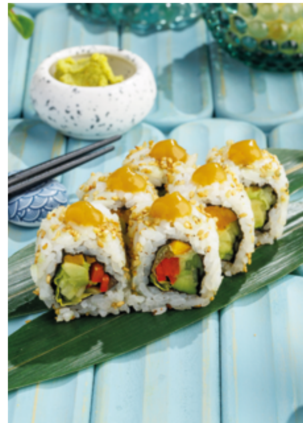
ОВОЩНОЙ РОЛЛ С ОГУРЕЧНЫМ ГЕЛЕМ, 590₽ Vegetable roll with cucumber gel