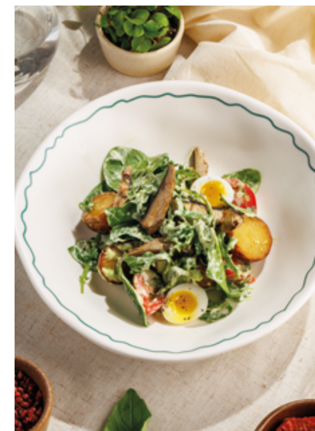
САЛАТ СО ШПРОТАМИ И БАЗИЛИКОВЫМ АЙОЛИ, 790₽ Sprat salad with basil aioli