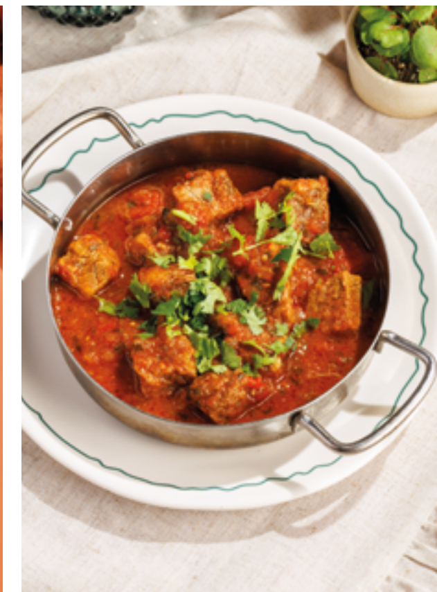
ЧАШУШУЛИ, 990₽ Chashushuli