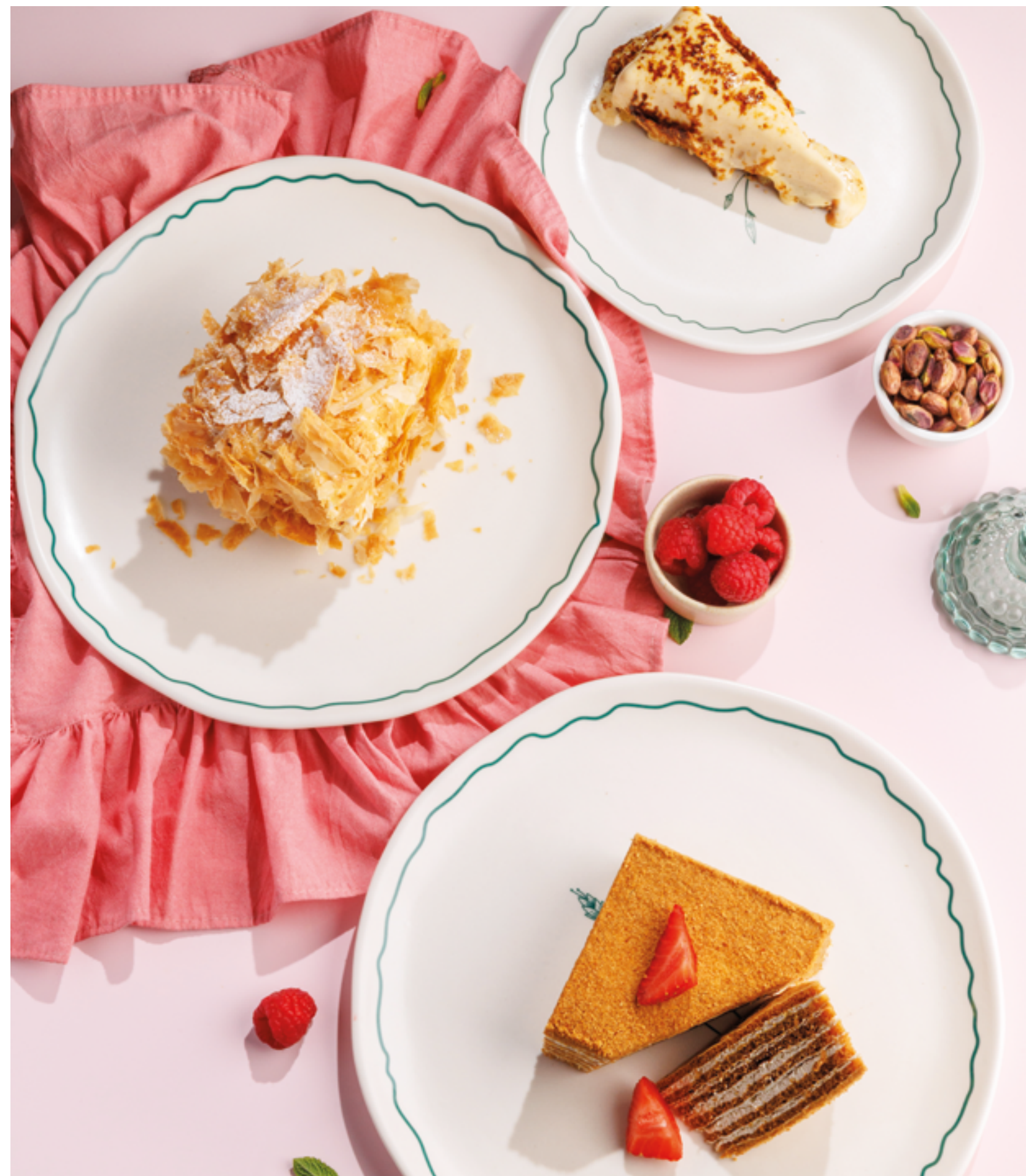
КВЕЛИАНИ, 590₽ Kveliani

ОРЕШКИ СО СГУЩЕНКОЙ, 490₽ КОФЕ ПО-СУХУМСКИ, 390₽ Walnut shaped cookies with dulce de leche Sukhumi coffee