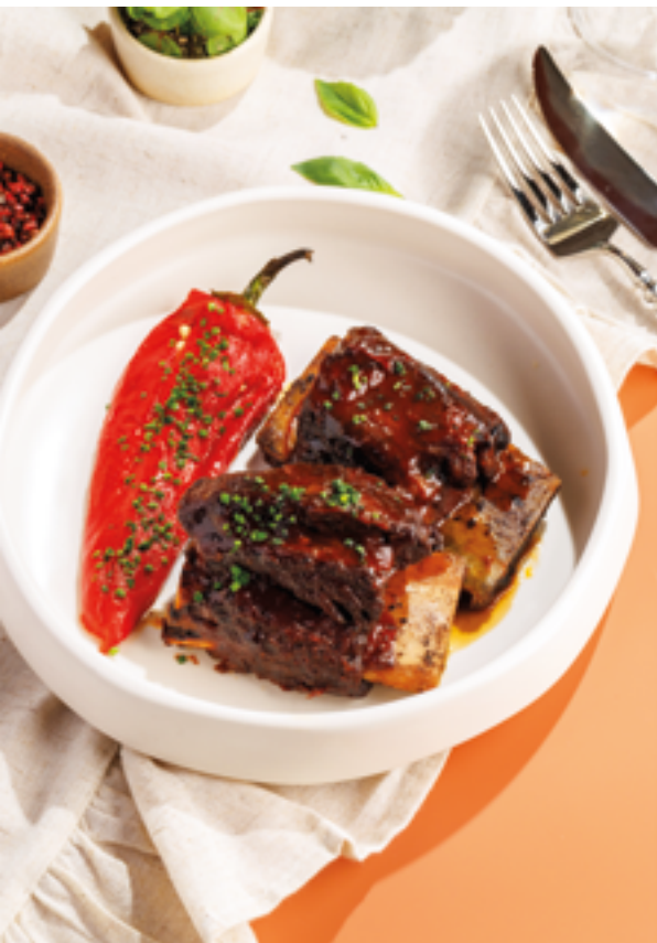
ТОМЛЕННЫЕ 12 ЧАСОВ В ПЕЧИ ГОВЯЖЬИ РЕБРА, 1890₽ 12-hour slow-cooked beef ribs