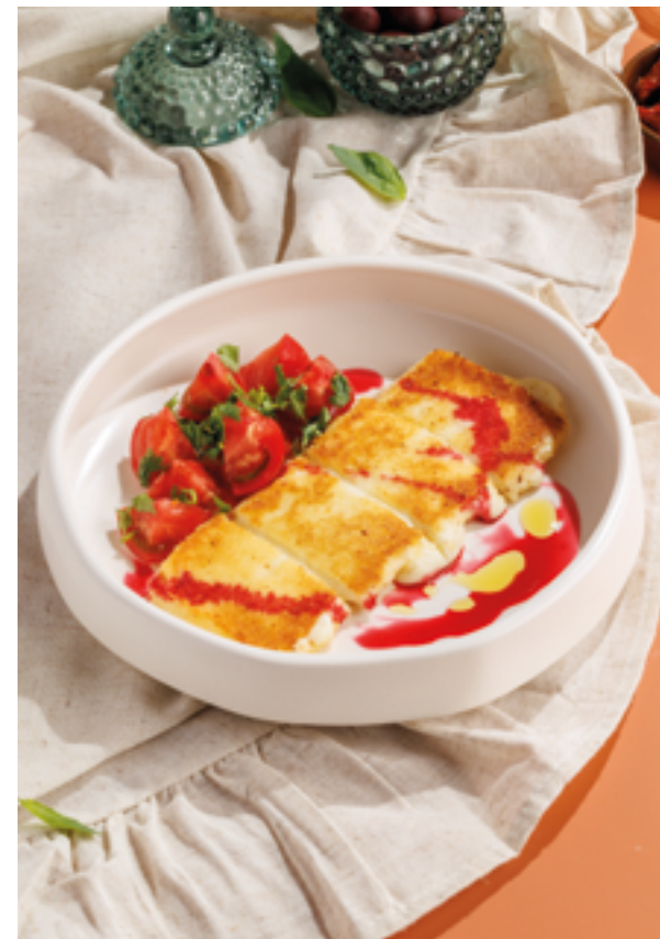
ЖАРЕННЫЙ СЫР СУЛУГУНИ С ТОМАТАМИ, 890₽ Fried suluguni with tomatoes