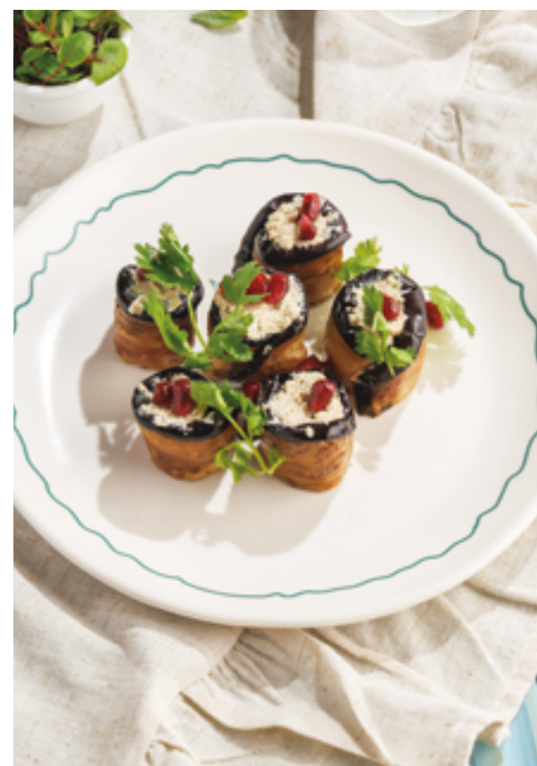
РУЛЕТЫ ИЗ ЖАРЕННЫХ БАКЛАЖАНОВ ПО-ГРУЗИНСКИ, 790₽ Georgian fried eggplant rolls