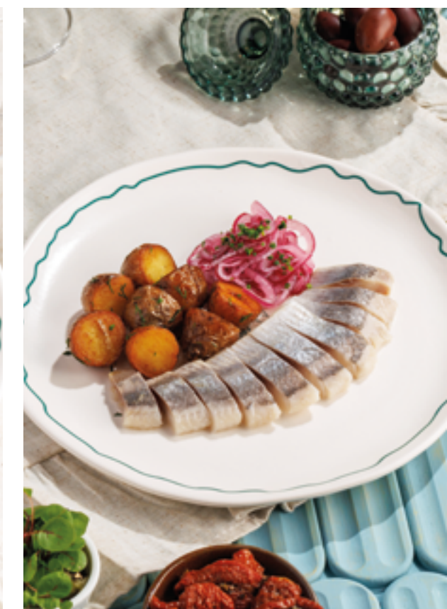
СЕЛЕДОЧКА С БЕБИ-КАРТОФЕЛЕМ, 690₽ Herring with baby potatoes