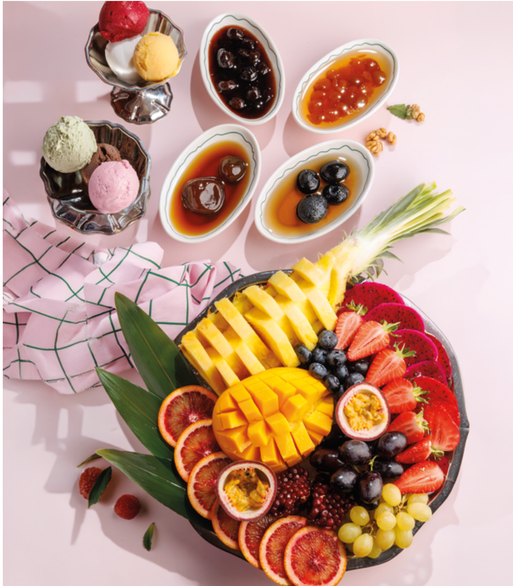
ФРУКТОВАЯ ТАРЕЛКА ПОЛОВИНА / ЦЕЛАЯ, 2090₽ / 3990₽ Fruit platter half / whole