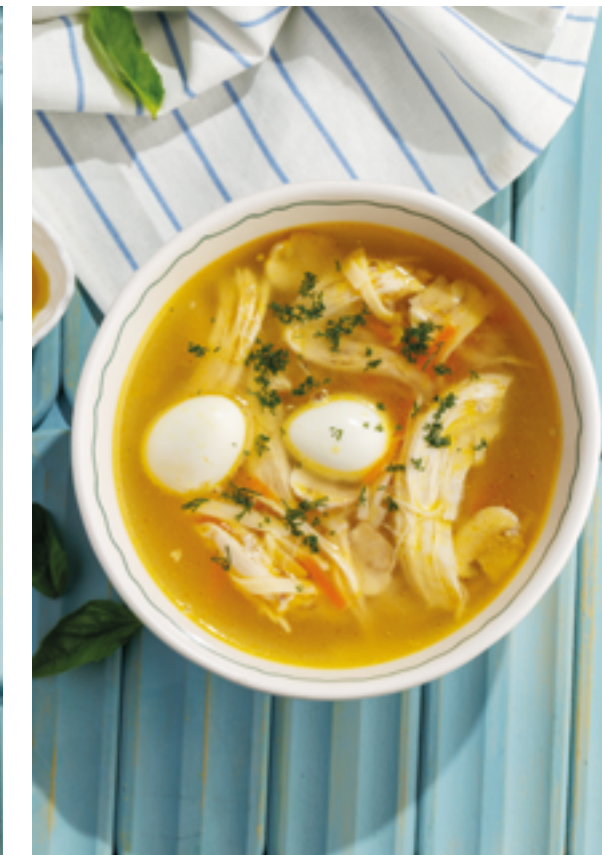
СУП С ЦЫПЛЕНКОМ И ГРИБАМИ, 590₽ Chicken soup with mushrooms