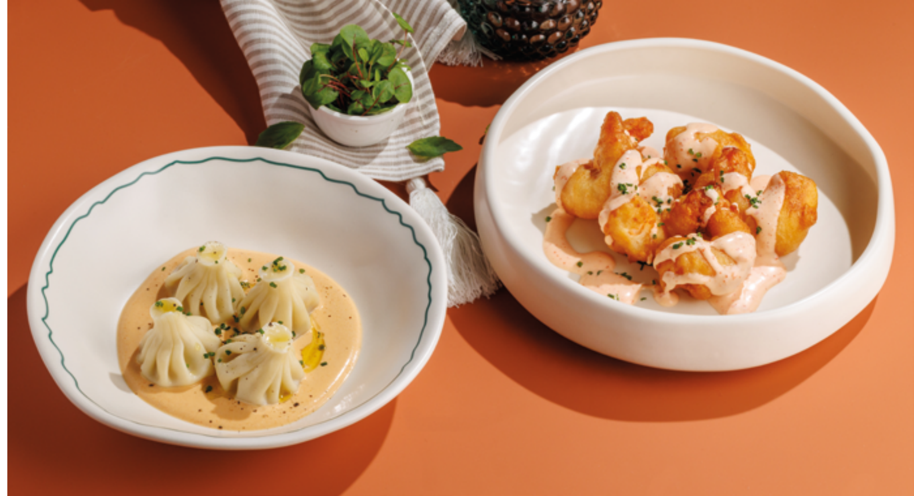
ПАТАРА-ХИНКАЛИ «ТОМ ЯМ», 990₽ Tom Yum patara khinkali

Близ от шефа: - Какую закуску ты чаще всего готовила в детстве? - слоеные баклажаны - Какая новинка будет хитом? - Костный мозг