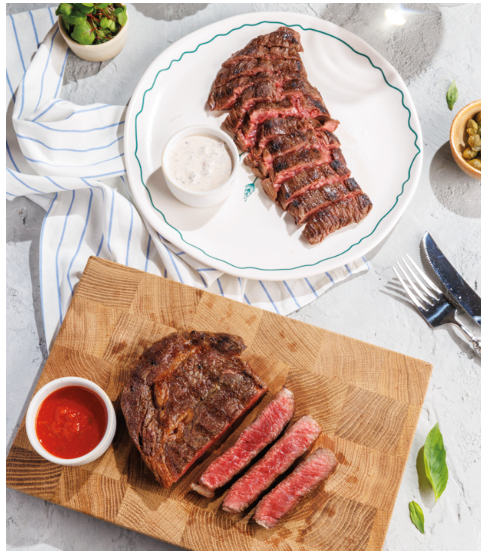
СТЕЙК МАЧЕТЕ, 2990₽ Machete steak