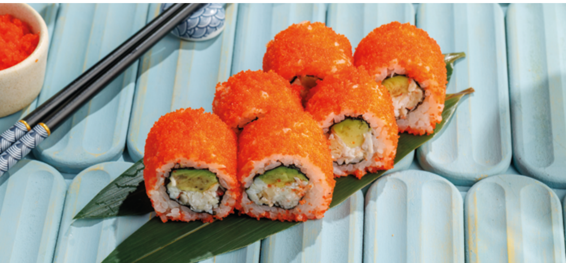
КАЛИФОРНИЯ С ЛОСОСЕМ / УГРЕМ / КРАБОМ, 990₽ / 990₽ / 1290₽ California roll with salmon / eel / crab