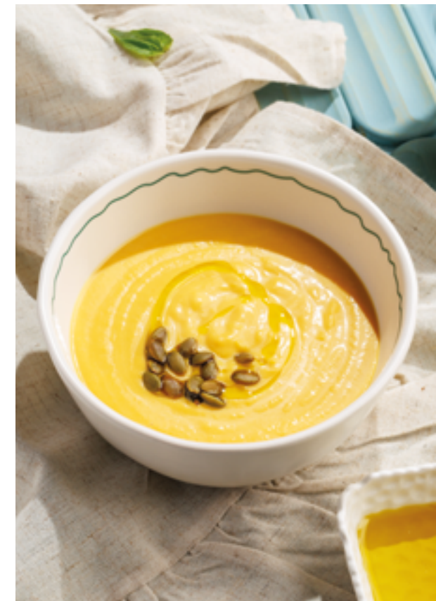
ТЫКВЕННЫЙ КРЕМ-СУП, 590₽ Cream of pumpkin soup