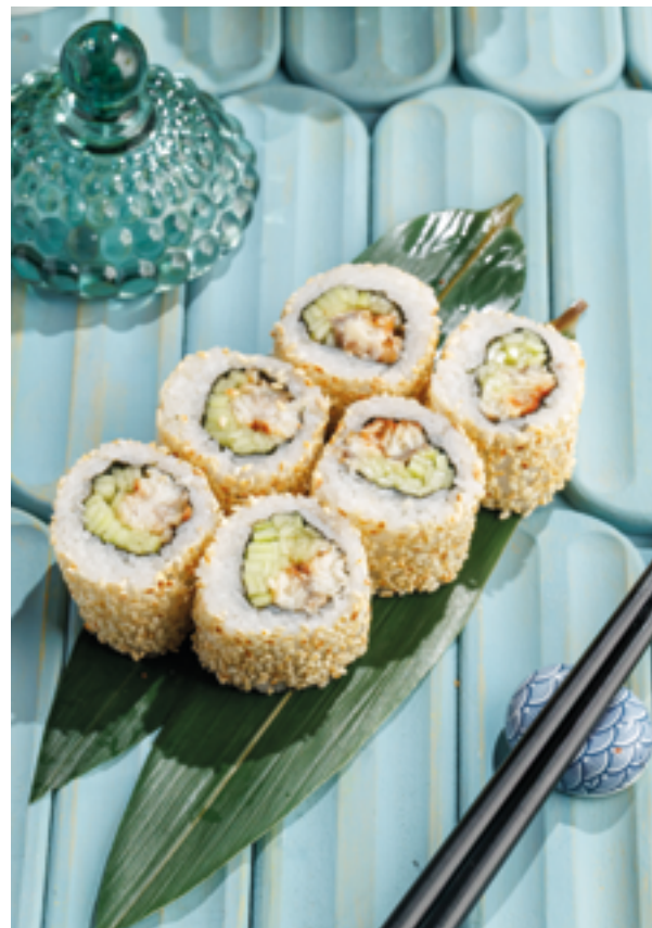
РОЛЛ УГОРЬ, 790₽ Eel roll