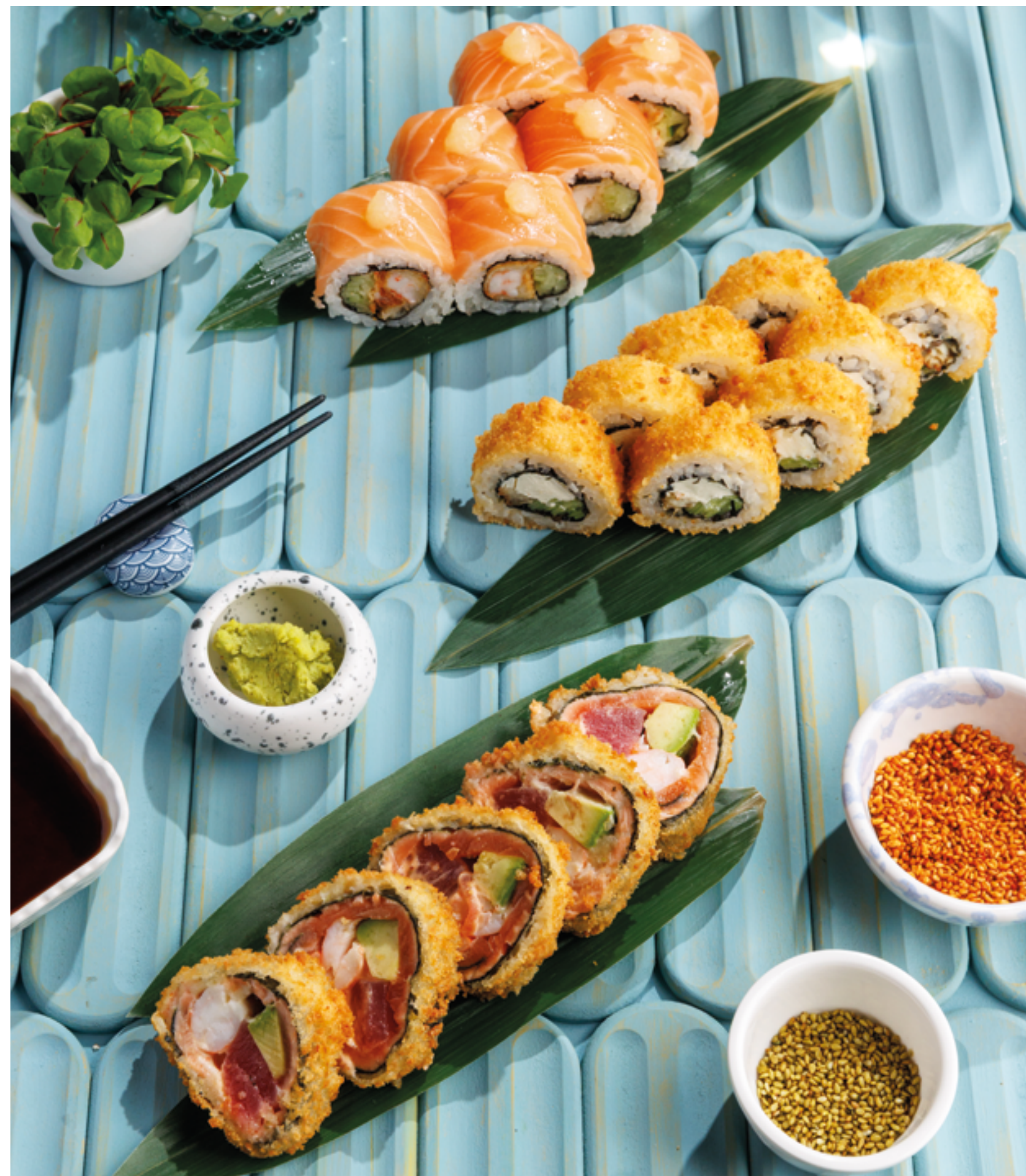
РОЛЛ ТЕМПУРА КРЕВЕТКА С ЛИМОННЫМ ГЕЛЕМ, 990₽ Shrimp tempura roll with lemon gel