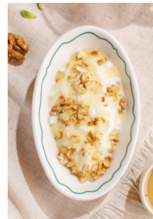
МАЦОНИ С МЕДОМ И ГРЕЦКИМИ ОРЕХАМИ, 290₽ Matsoni with honey and walnuts