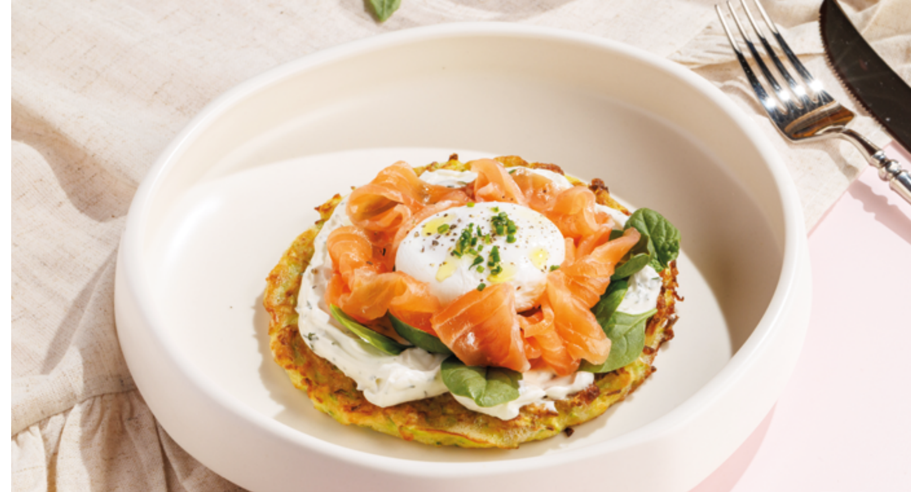
ОЛАДУШКА ИЗ КАБАЧКА С ЛОСОСЕМ И ЯЙЦОМ ПАШОТ, 1090₽ Zucchini pancake with salmon and sour cream