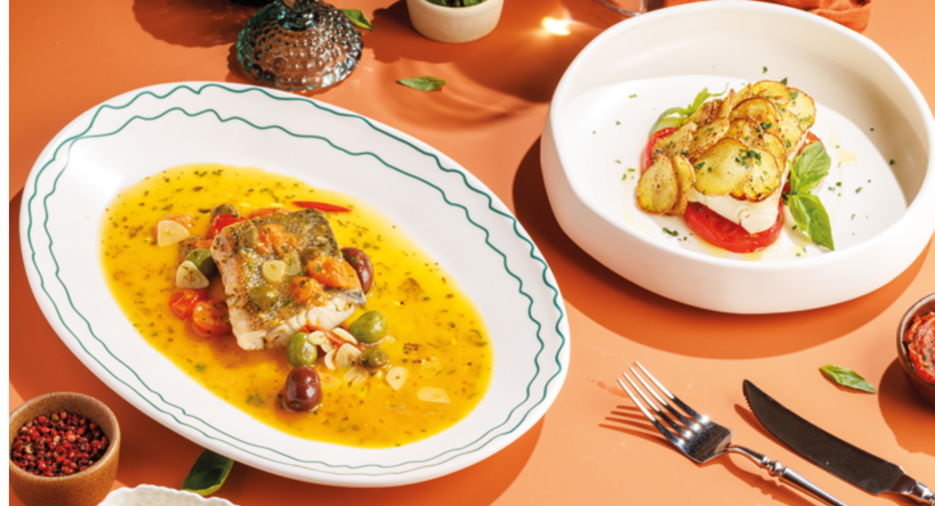
СУДАК В ГРЕЧЕСКОМ СТИЛЕ, 1090₽ Greek-style pike perch

Сердце меню, где собраны главные хиты ресторана «Бахчатам»