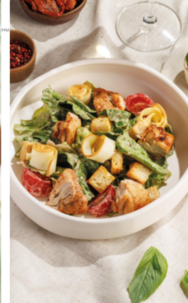
ТЕПЛЫЙ САЛАТ С ЦЫПЛЕНКОМ, ТОМАТАМИ И КОПЧЕНЫМ СУЛУГУНИ, 990₽ Warm chicken salad with tomatoes and smoked suluguni