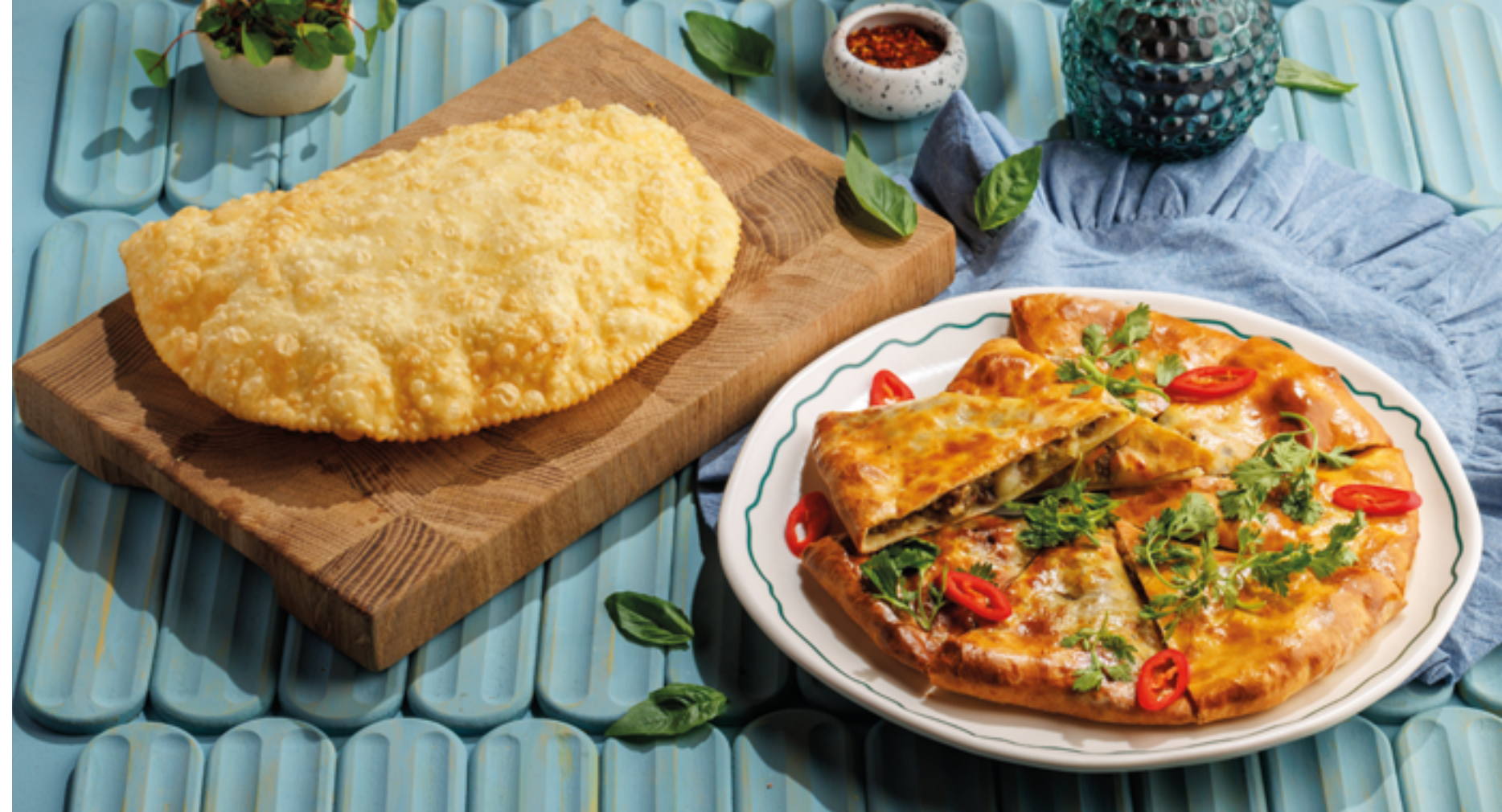
ЧЕБУРЕК С СЫРОМ / С БАРАНИНОЙ / С ТЕЛЯТИНОЙ, 590₽ / 790₽ / 690₽ Cheburek cheese / lamb / veal