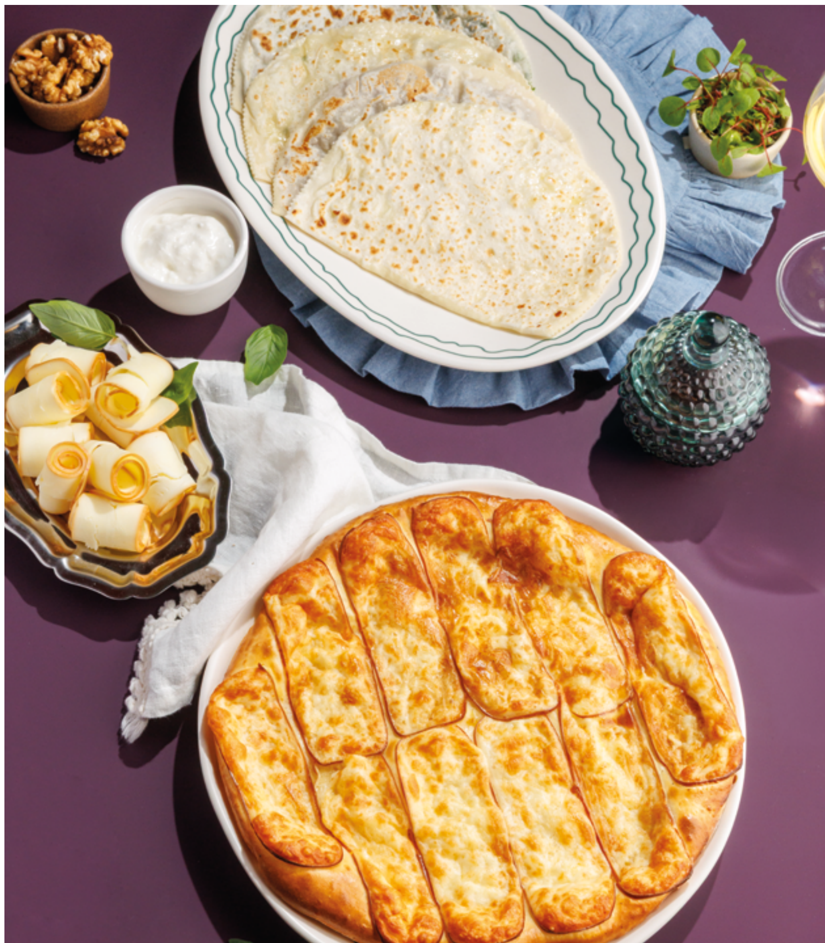
КУТАБЫ С КАРТОФЕЛЕМ / С ЗЕЛЕНЬЮ / С СЫРОМ / С БАРАНИНОЙ, 390₽ / 490₽ / 590₽ / 790₽ Qutabs potato / herb / cheese / lamb

Просьба предупредить вашего официанта об имеющихся у вас аллергии на определённые продукты питания