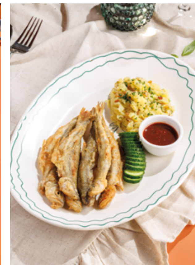
КОРЮШКА С КАРТОФЕЛЕМ И СОУСОМ ТКЕМАЛИ, 1190₽ Fried smelt with potatoes and tkemali sauce