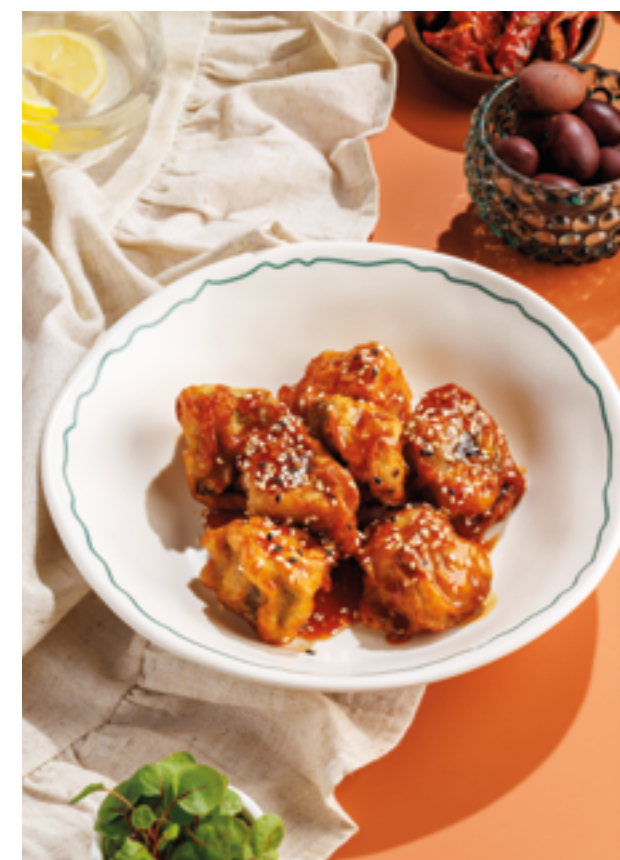
ХРУСТЯЩИЕ БАКЛАЖАНЫ, 890₽ Crispy eggplant