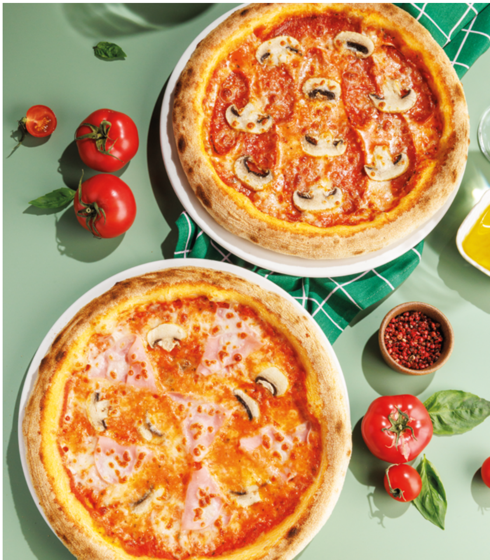
ПИЦЦА «ТОСКАНА», 890₽ Toscana