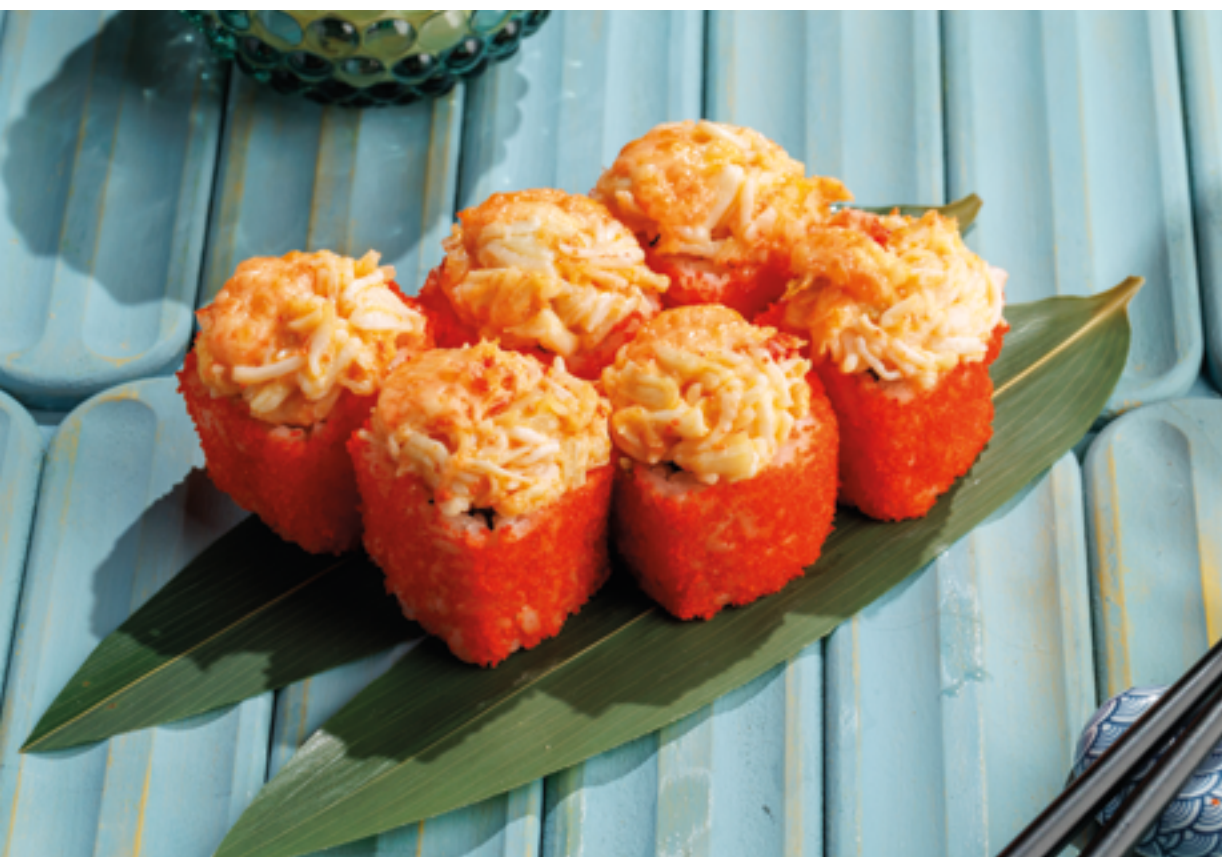
ЗАПЕЧЕННЫЕ РОЛЛЫ КРАБ / УГОРЬ / ЛОСОСЬ, 1290₽ / 1190₽ / 1190₽ Crab / eel / salmon baked rolls