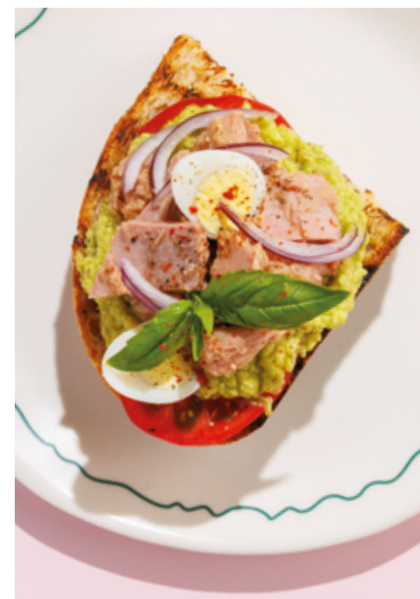
БРУСКЕТТА С ТУНЦОМ И АВОКАДО, 710₽ Bruschetta with tuna and avocado