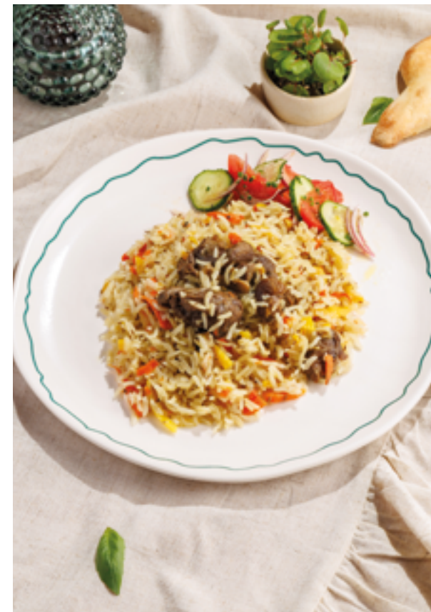
ПЛОВ УЗБЕКСКИЙ С ЯГНЁНКОМ, 990₽ Uzbek pilaf with lamb