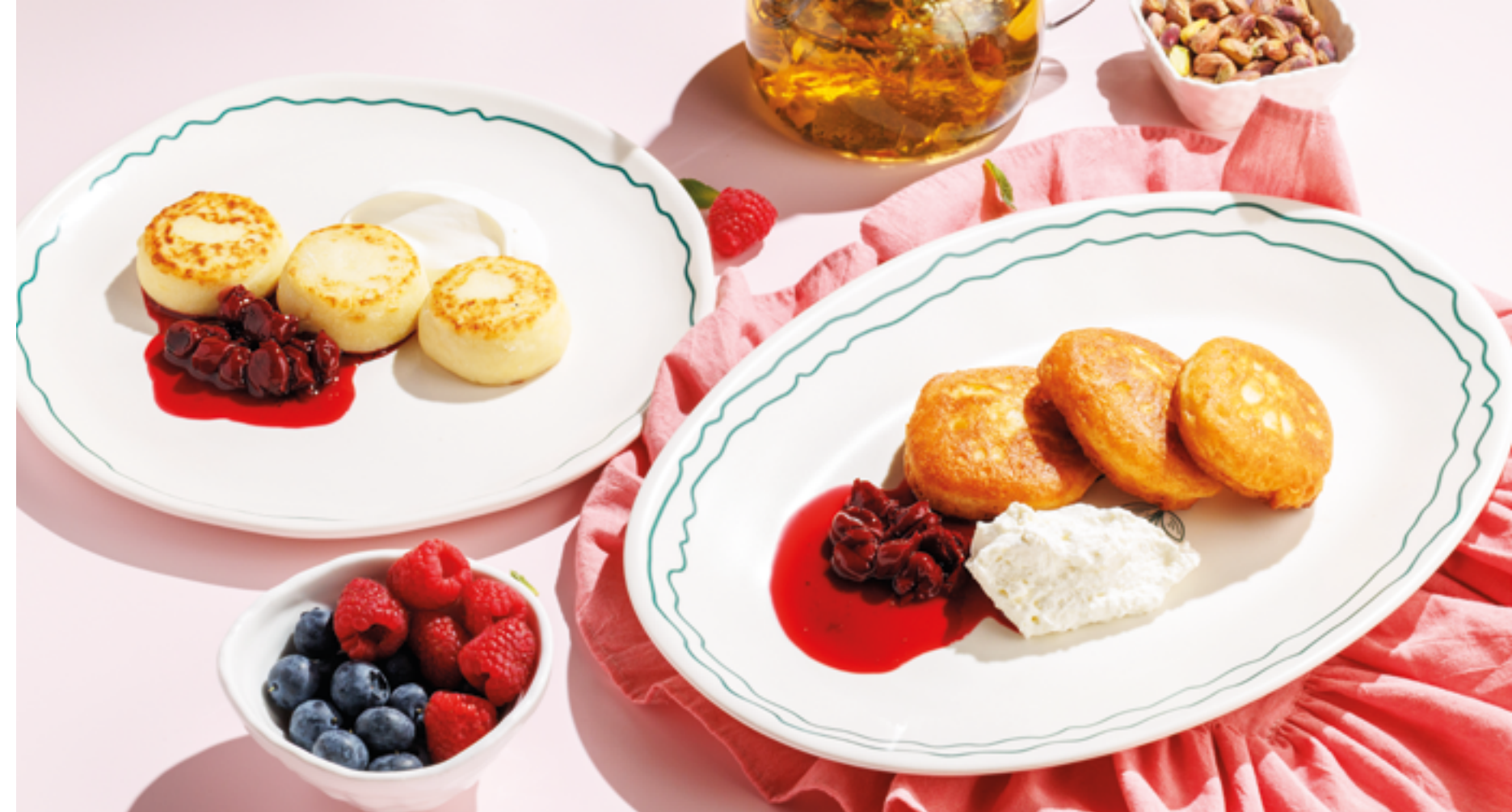
СЫРНИКИ СО СМЕТАНОЙ И ВИШНЕВЫМ ВАРЕНЬЕМ, 590₽ Cottage cheese pancakes with sour cream and cherry jam

Момент, который объединяет ежедневно с 10:00 до 14:00