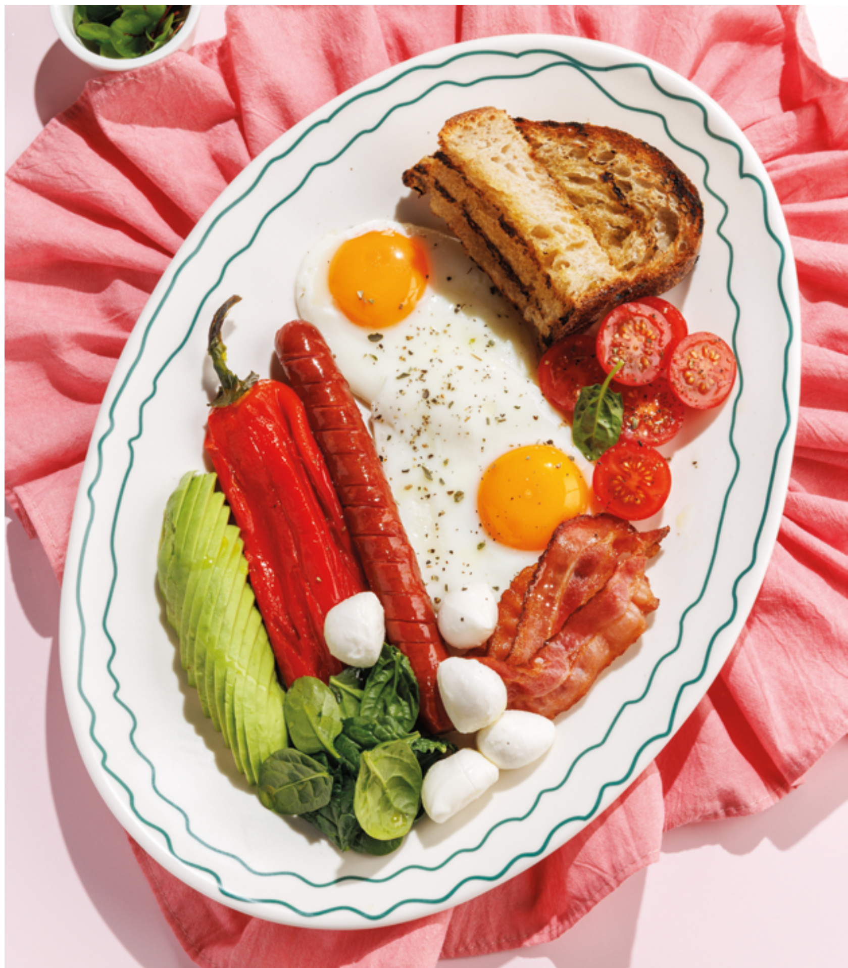
ФИРМЕННЫЙ ЗАВТРАК «БАКЛАЖАН», 1190₽ «Baklazhan» signature breakfast