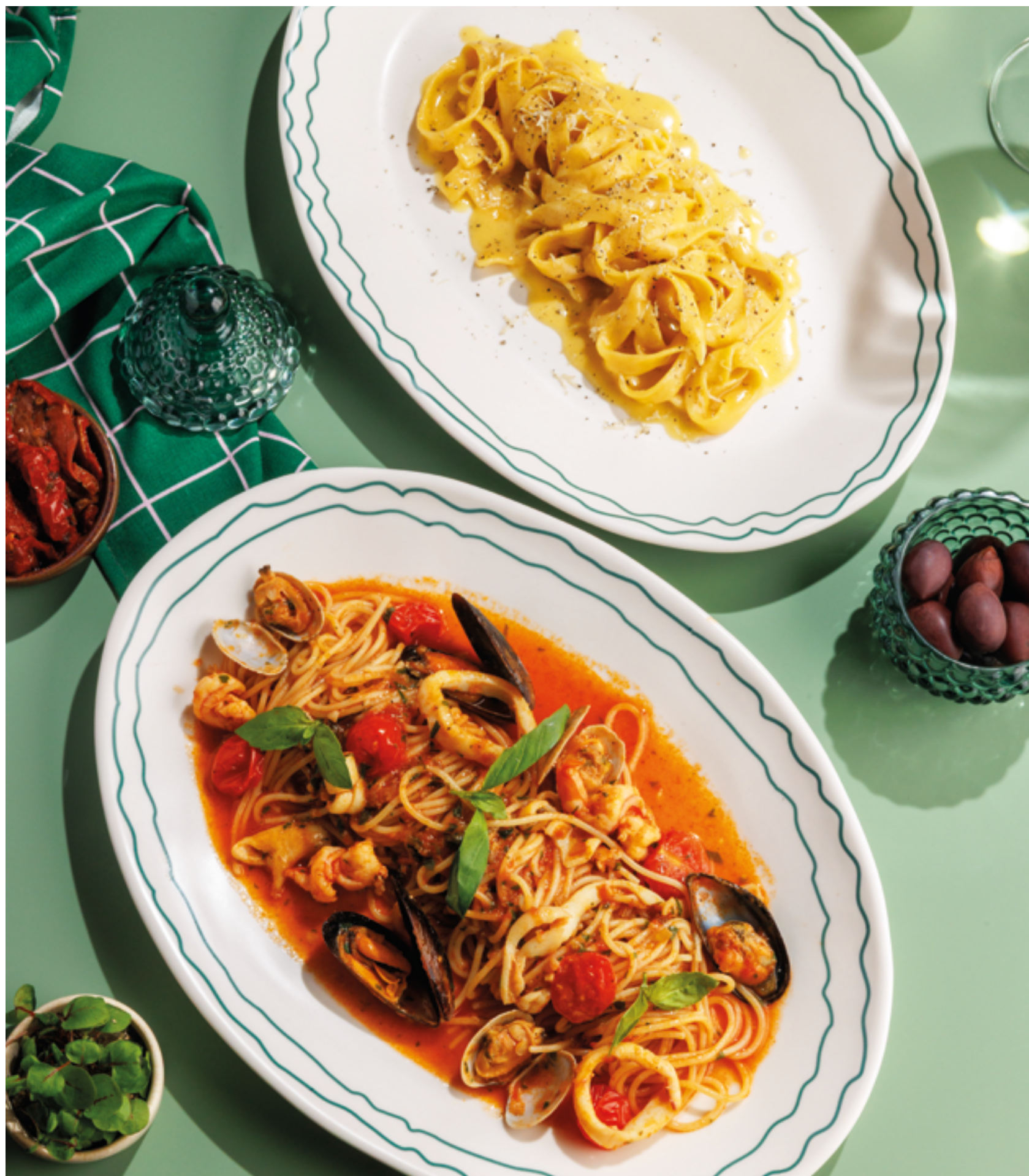
ФЕТУЧИНИ С ЧЕРНЫМ ТРЮФЕЛЕМ, 990₽ Fettuccini with truffle