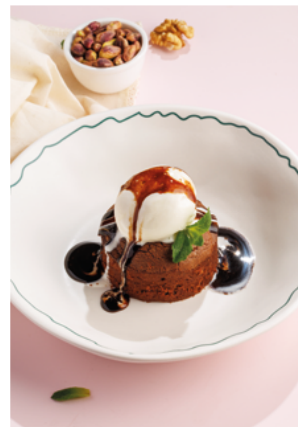
ШОКОЛАДНАЯ ШКАТУЛКА С ВАНИЛЬНЫМ МОРОЖЕНЫМ, 690₽ Chocolate box with vanilla ice cream