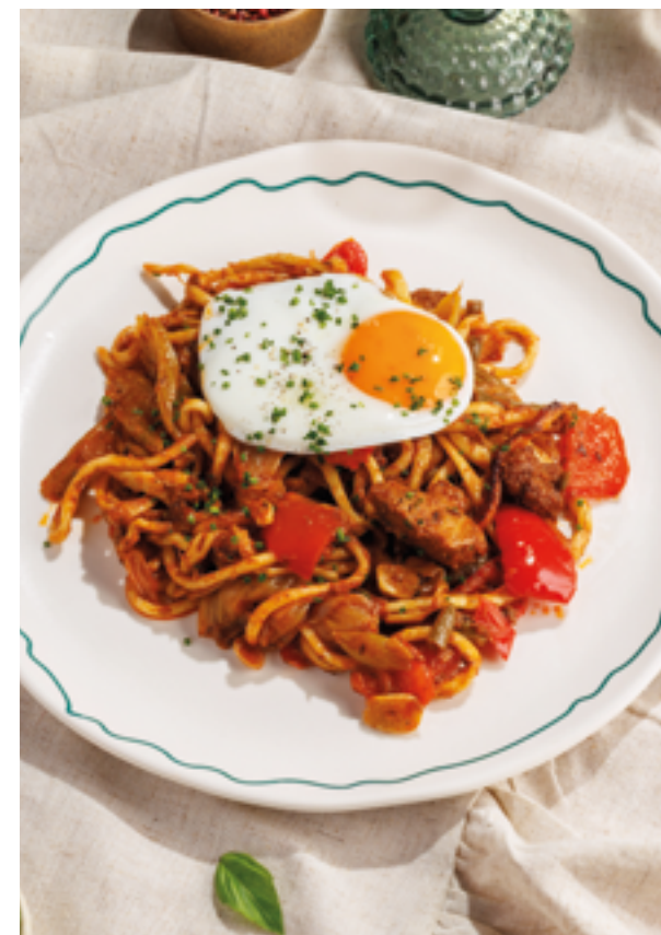
КОВУРМА ЛАГМАН, 890₽ Qovurma lagman