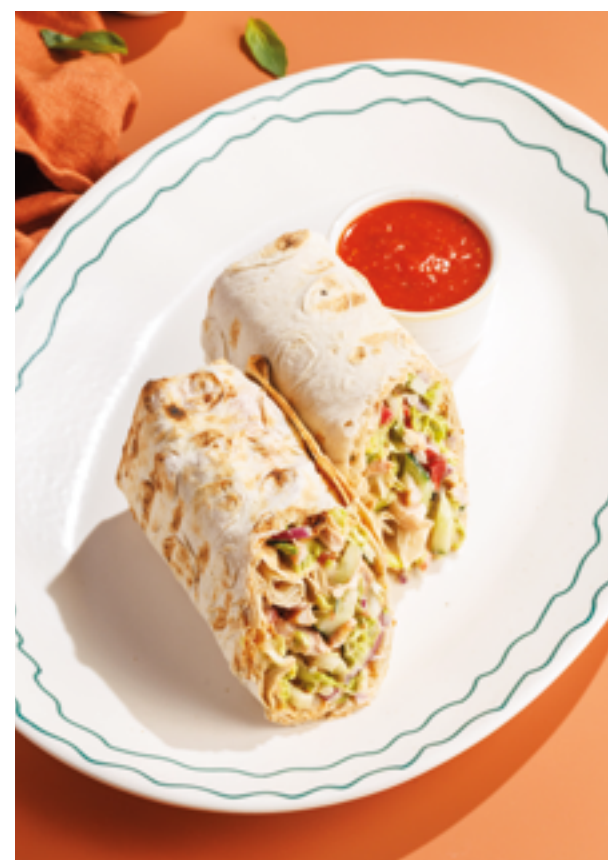
ШАВЕРМА С ЦЫПЛЕНКОМ, 790₽ Chicken shawarma