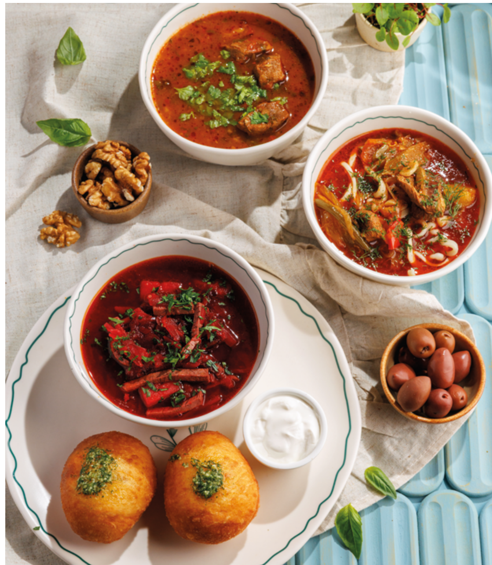
ХАРЧО С ГОВЯДИНОЙ, 790₽ Beef kharcho

Рекомендуем добавить лаваш из тапдыра и ассорти домашнего сала