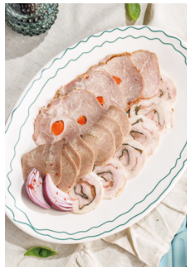
МЯСНОЕ АССОРТИ С СОУСОМ ИЗ ХРЕНА (ростбиф, куриный рулет, говяжий язык), 1690₽ Cold cuts platter with horseradish sauce roast beef, chicken roll, boiled beef tongue

сало подается холодным. идеальная закуска