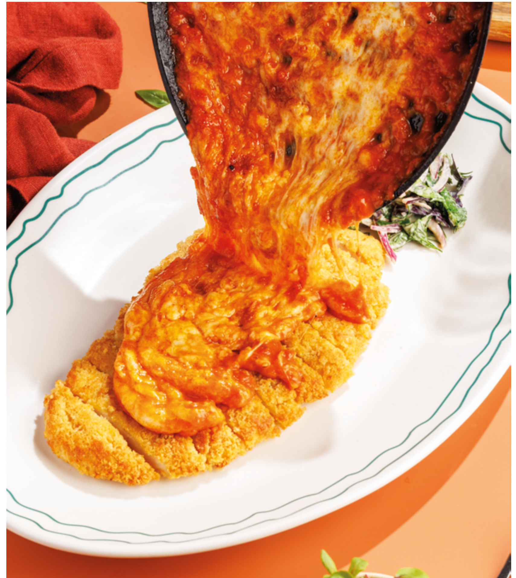
КУРИНЫЙ ШНИЦЕЛЬ Поливается соусом из моцареллы и томатов, 1290₽ Chicken schnitzel, served with mozzarella and tomato sauce