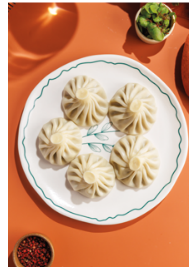
ХИНКАЛИ, 250₽ баранина / свинина и говядина / телятина / грибы / сыр и шпинат Khinkali, lamb / pork and beef / veal / mushroom / cheese and spinach