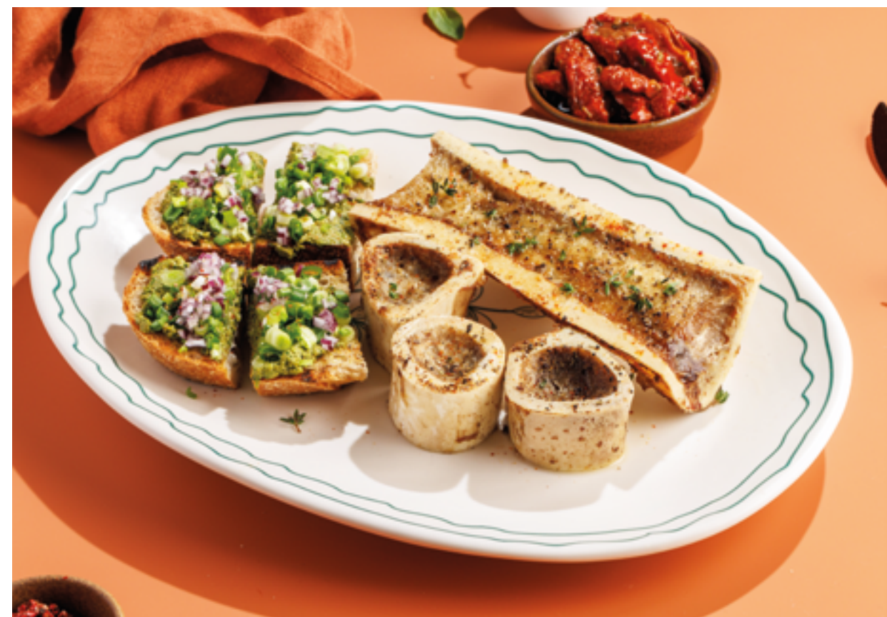
ЗАПЕЧЁННЫЙ КОСТНЫЙ МОЗГ С ТАРТИНОМ, 1390₽ Roasted bone marrow with tartine bread