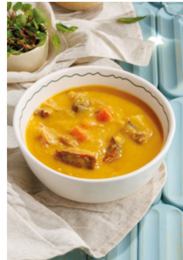
ГОРОХОВЫЙ СУП С КОПЧЕНОСТЯМИ, 590₽ Pea soup with smoked meats