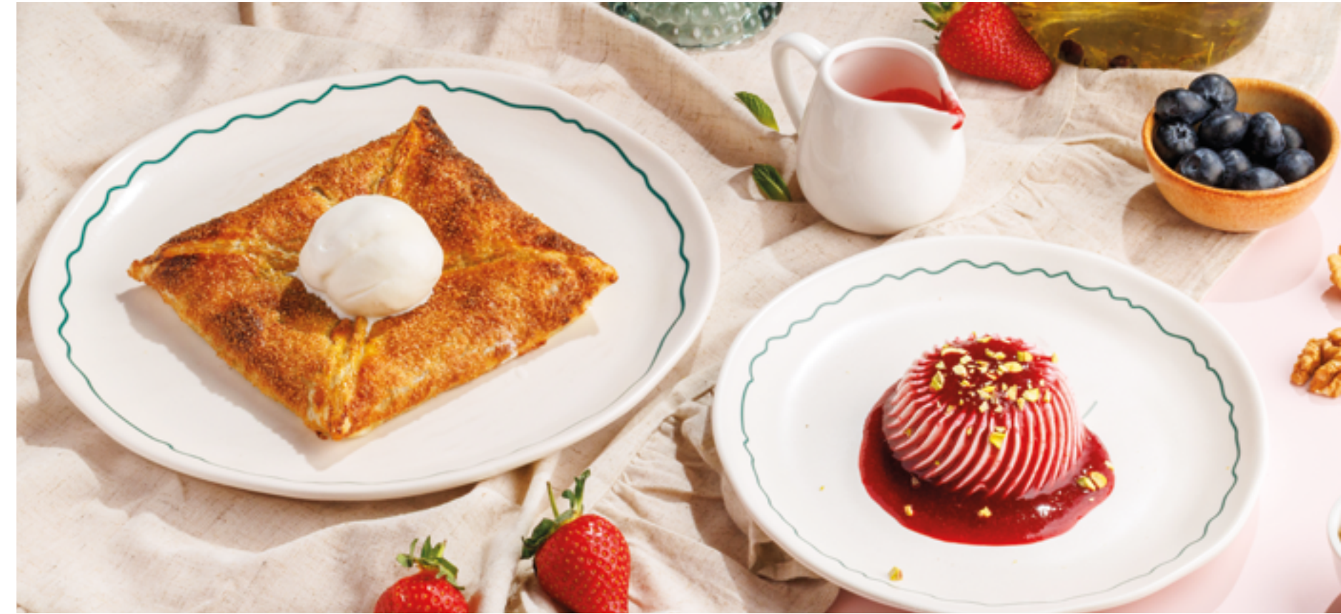
ТЕПЛЫЙ МАКОВЫЙ ПИРОГ С МОРОЖЕНЫМ, 890₽ Warm poppy seed pie with ice cream