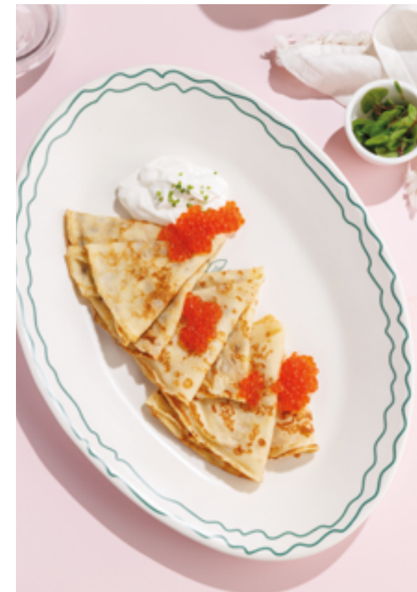
БЛИНЫ С КРАСНОЙ ИКРОЙ, 1390₽ Crepes with red caviar