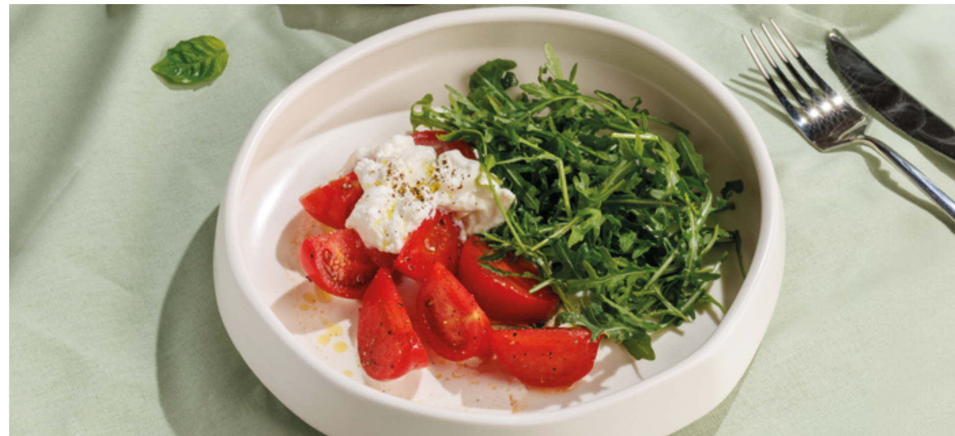
САЛАТ С РУКОЛОЙ, СТРАЧАТЕЛЛОЙ И БАКИНСКИМИ ТОМАТАМИ, 1190₽ Arugula with stracciatella and Baku tomatoes