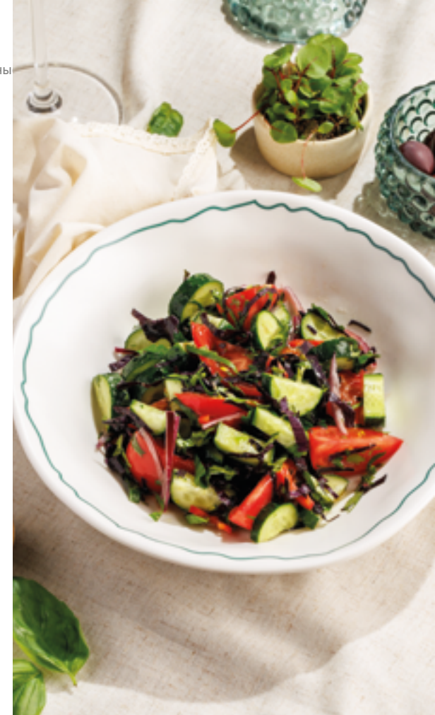
ОВОЩНОЙ САЛАТ ПО-ГРУЗИНСКИ СО СПЕЦИЯМИ / ОРЕХАМИ, 590₽ / 690₽ Georgian vegetable salad with spices / nuts