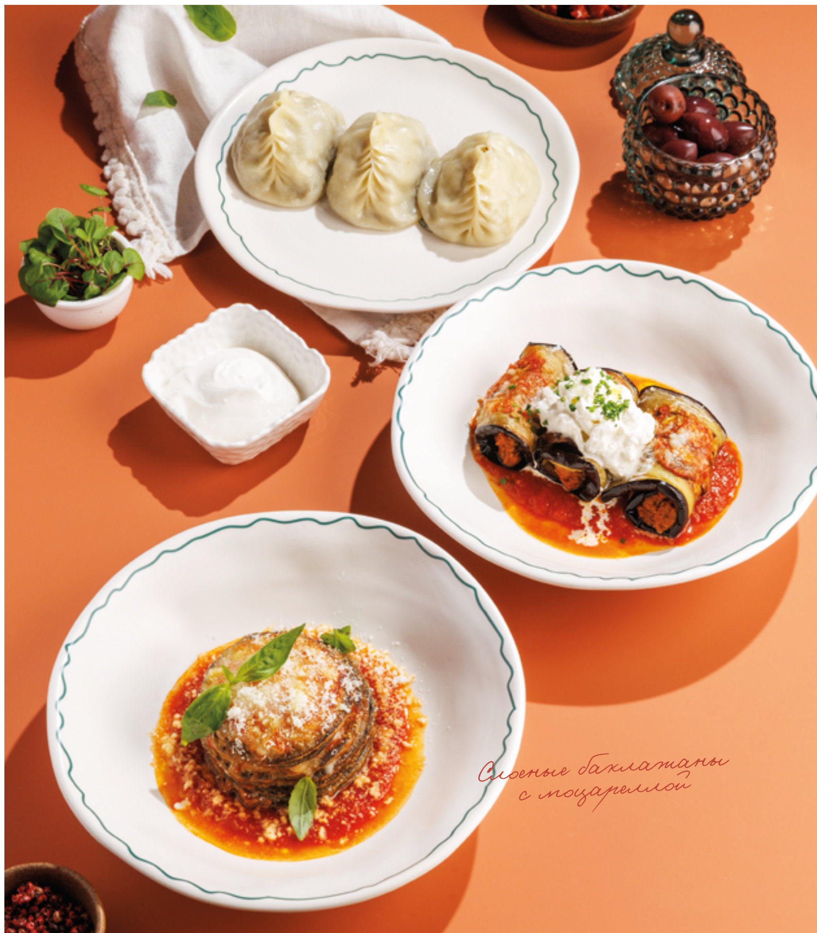
МАНТЫ С МЯСОМ ЯГНЕНКА, 890₽ Lamb manti (dumplings)