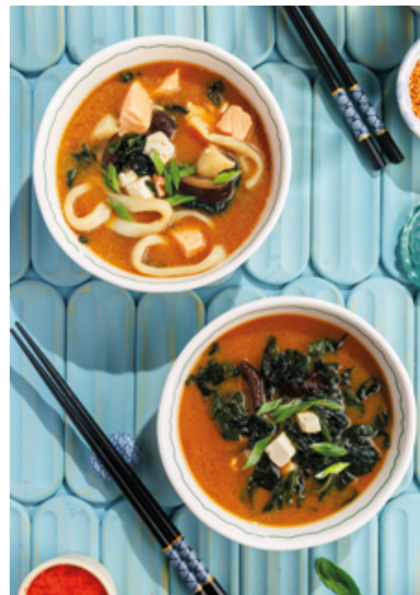
МИСО-СУП / МИСО-СУП С МОРЕПРОДУКТАМИ, 450₽ / 790₽ Miso soup / with seafood