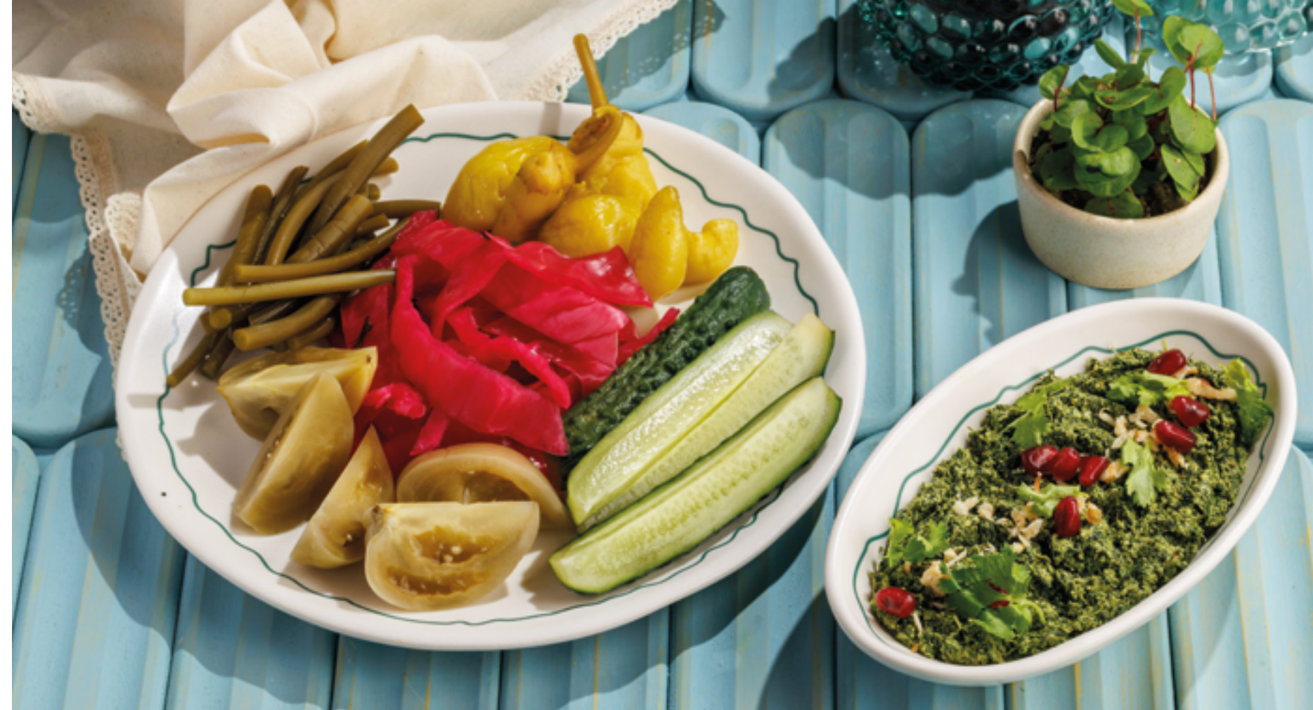
ДОМАШНИЕ СОЛЕНЬЯ (капуста, бурые томаты, огурцы, стручковый перец, черемша), 990₽ Homemade pickles (cabbage, brown tomatoes, cucumbers, peppers, wild garlic)