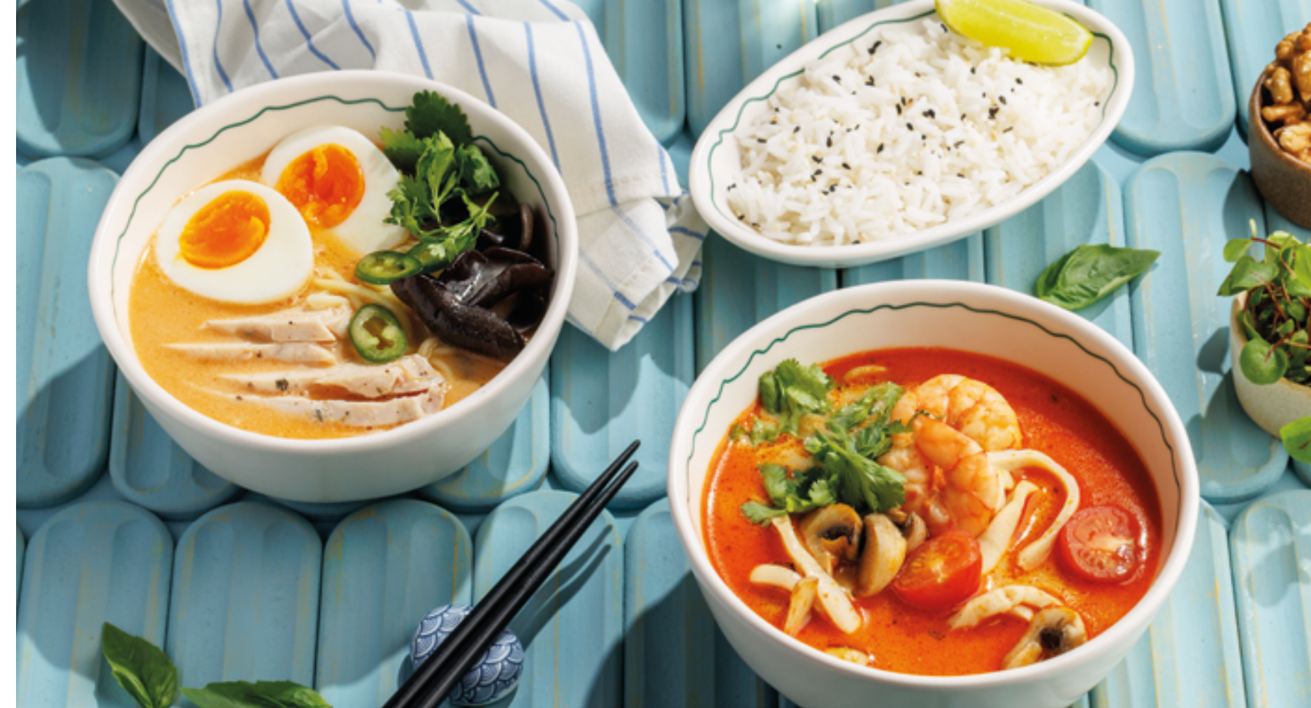
РАМЕН С КУРИЦЕЙ, 790₽ Chicken ramen