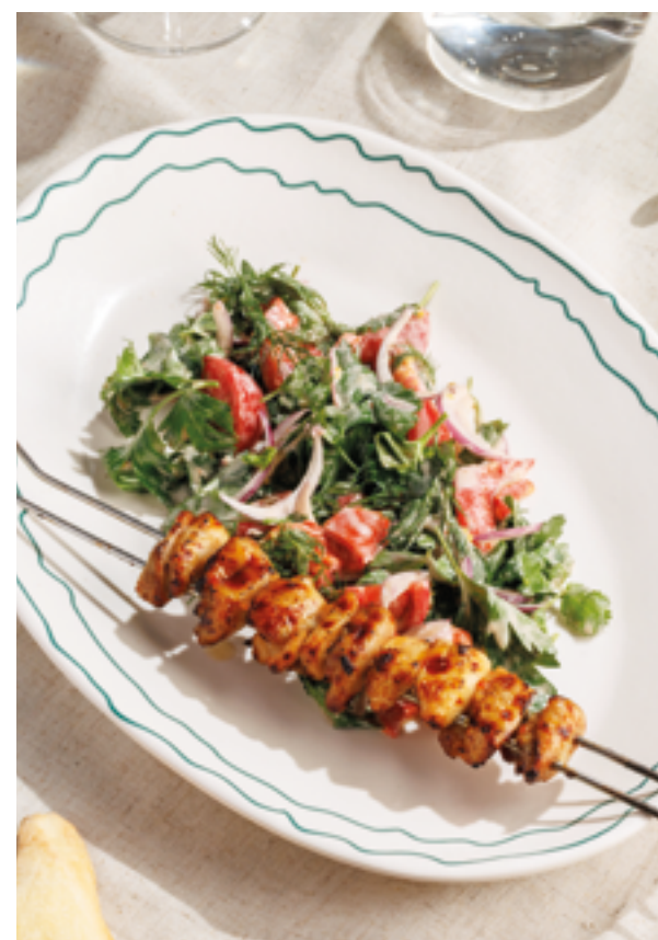
САЛАТ «ЯКИТОРИЯ», 790₽ Yakitori salad