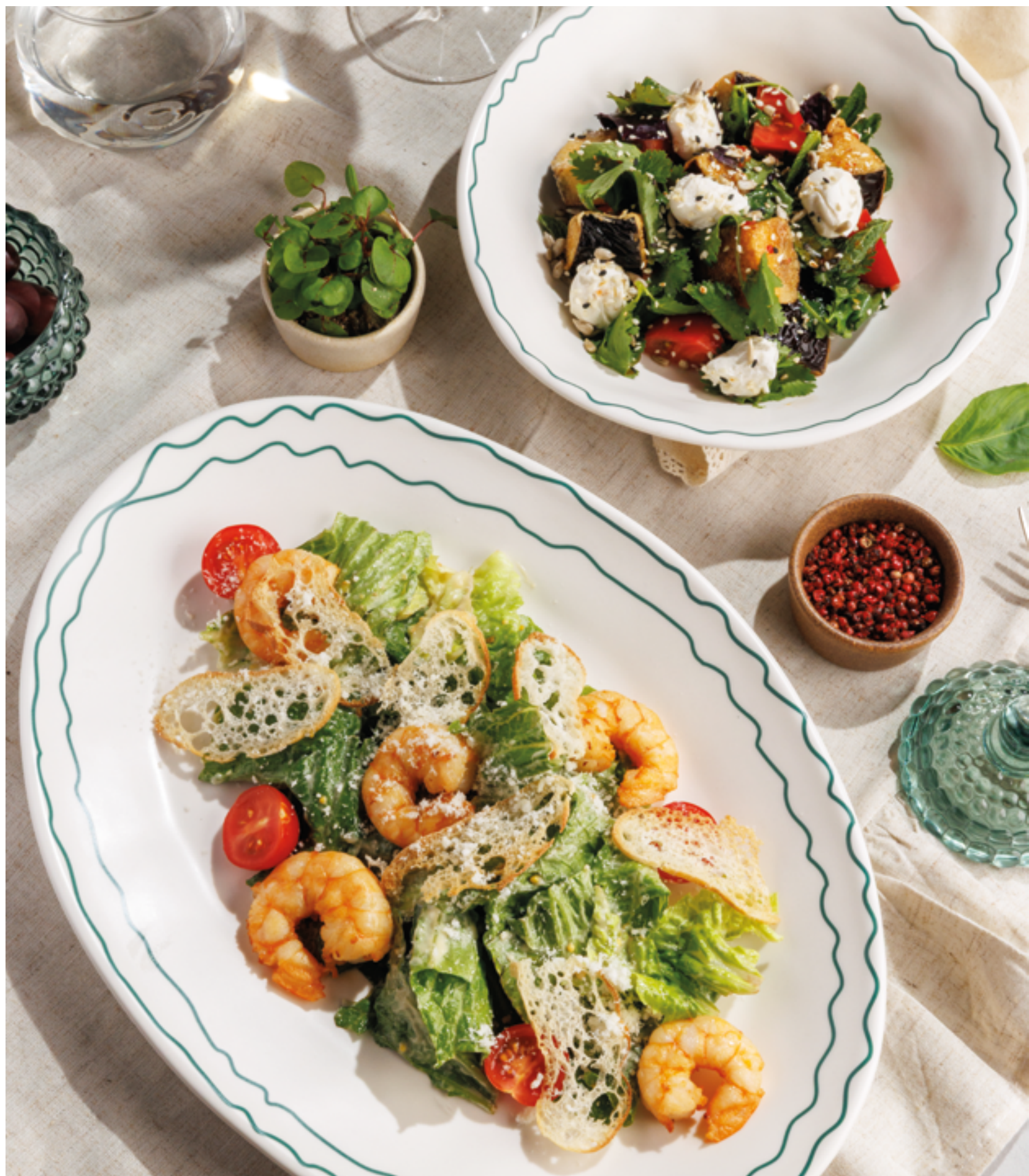
САЛАТ С ХРУСТЯЩИМИ БАКЛАЖАНАМИ, 990₽ Crispy eggplant salad