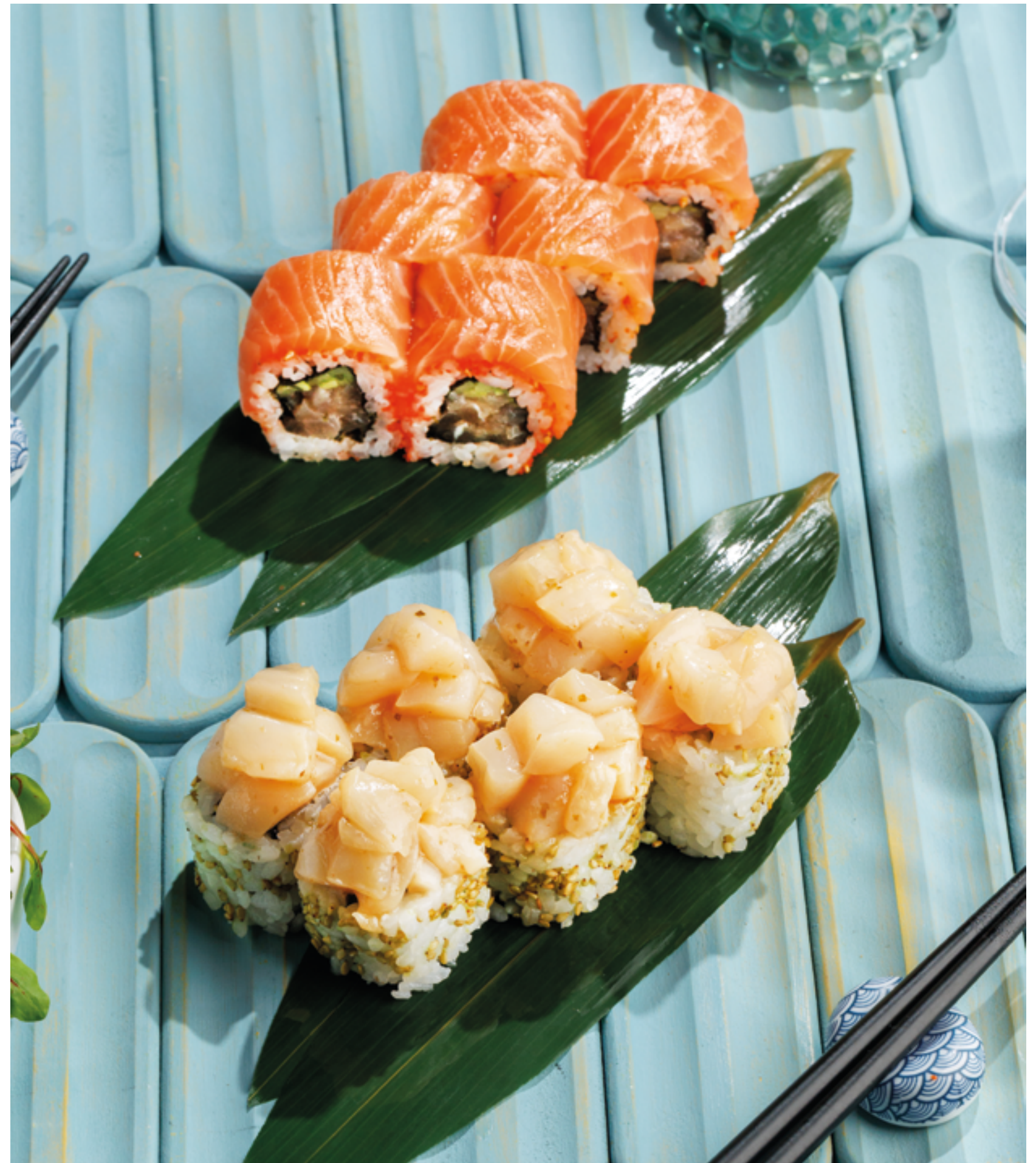
РОЛЛ ЛОСОСЬ С ТРЮФЕЛЬНЫМ ТУНЦОМ, 1190₽ Salmon with truffle tuna roll