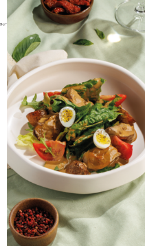
САЛАТ С КУРИНОЙ ПЕЧЕНЬЮ, 790₽ Chicken liver salad