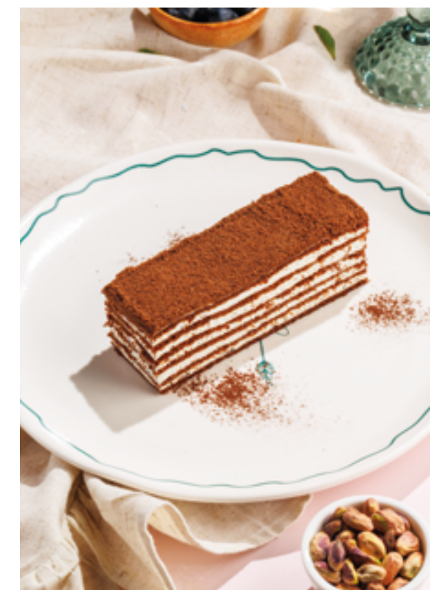
ЗГАПАРИ, 690₽ Zgapari