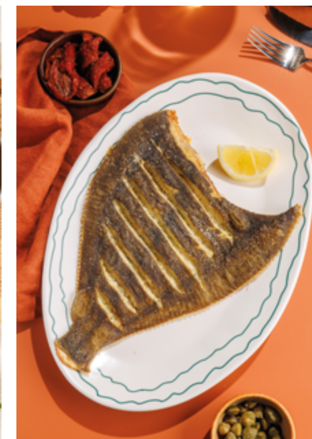
КАМБАЛА, 1190₽ Flounder