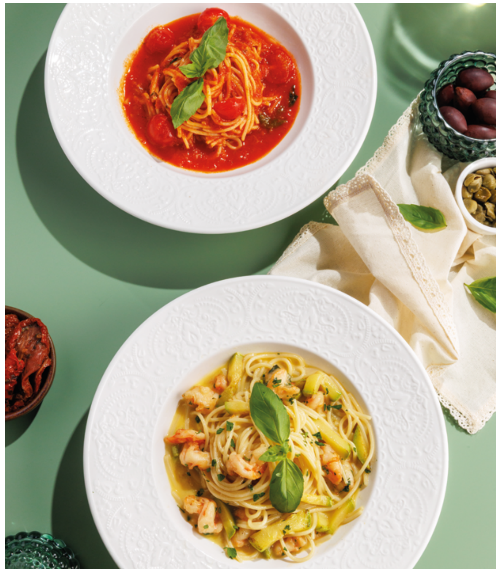
ПАСТА «ПОМИДОРНИ», 790Р Pomodorini