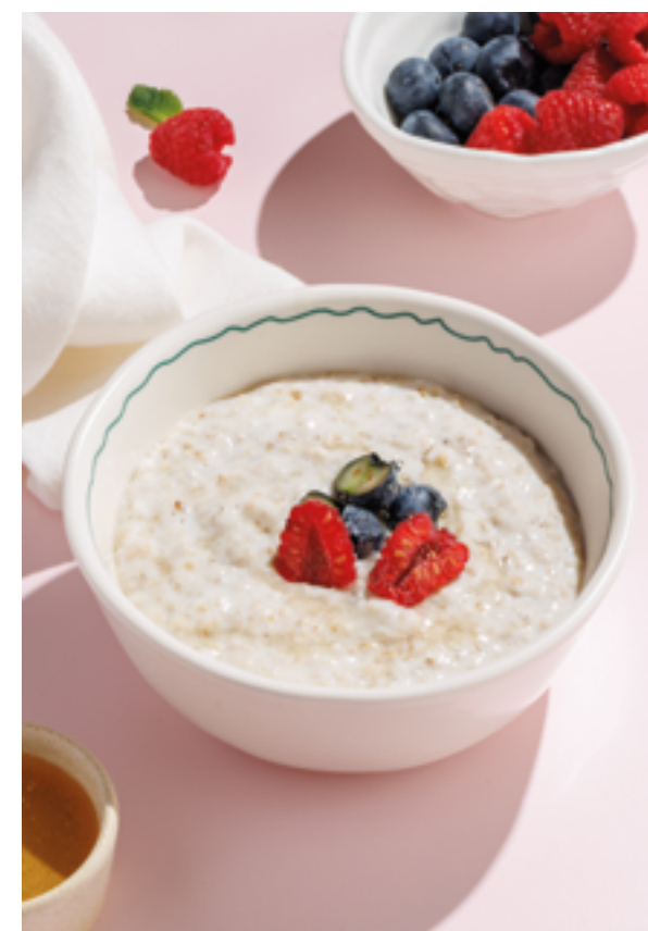
ОВСЯНАЯ КАША С ЯГОДАМИ И МЕДОМ, 490₽ Oatmeal with berries and honey