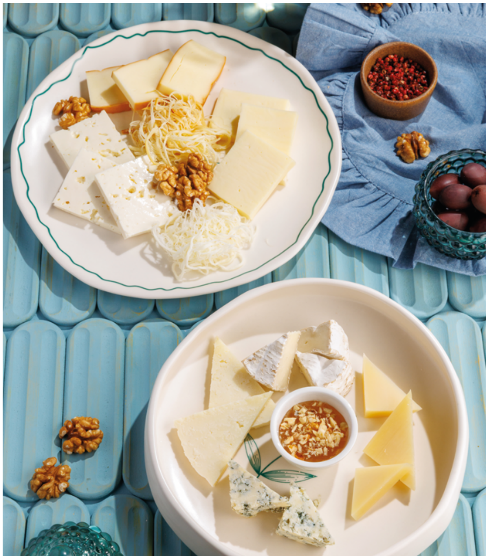
АССОРТИ ИЗ ДОМАШНИХ СЫРОВ, 990₽ Assorted homemade cheese