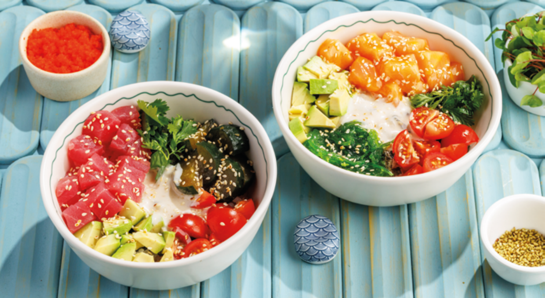
ПОКЕ С ТУНЦОМ / С ЛОСОСЕМ, 790₽ / 990₽ Tuna / salmon poke