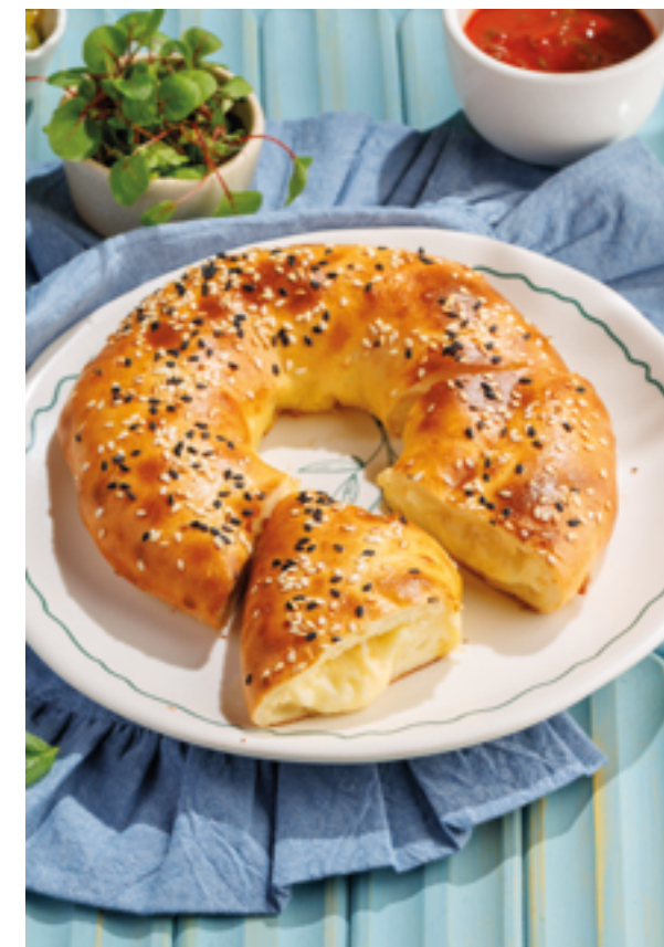
ЛЕПЕШКА / ЛЕПЕШКА С СЫРОМ, 490₽ / 590₽ Flatbread / Cheese flatbread