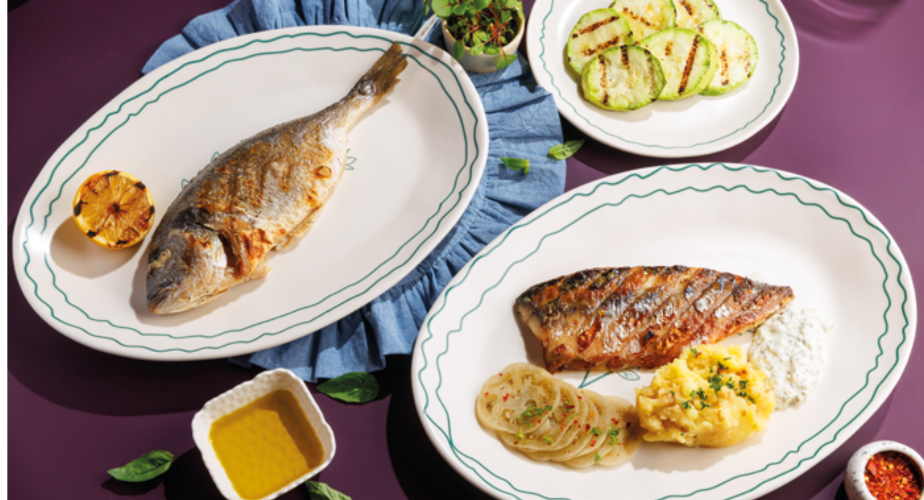
ДОРАДА НА ГРИЛЕ, 1490Р Grilled dorado