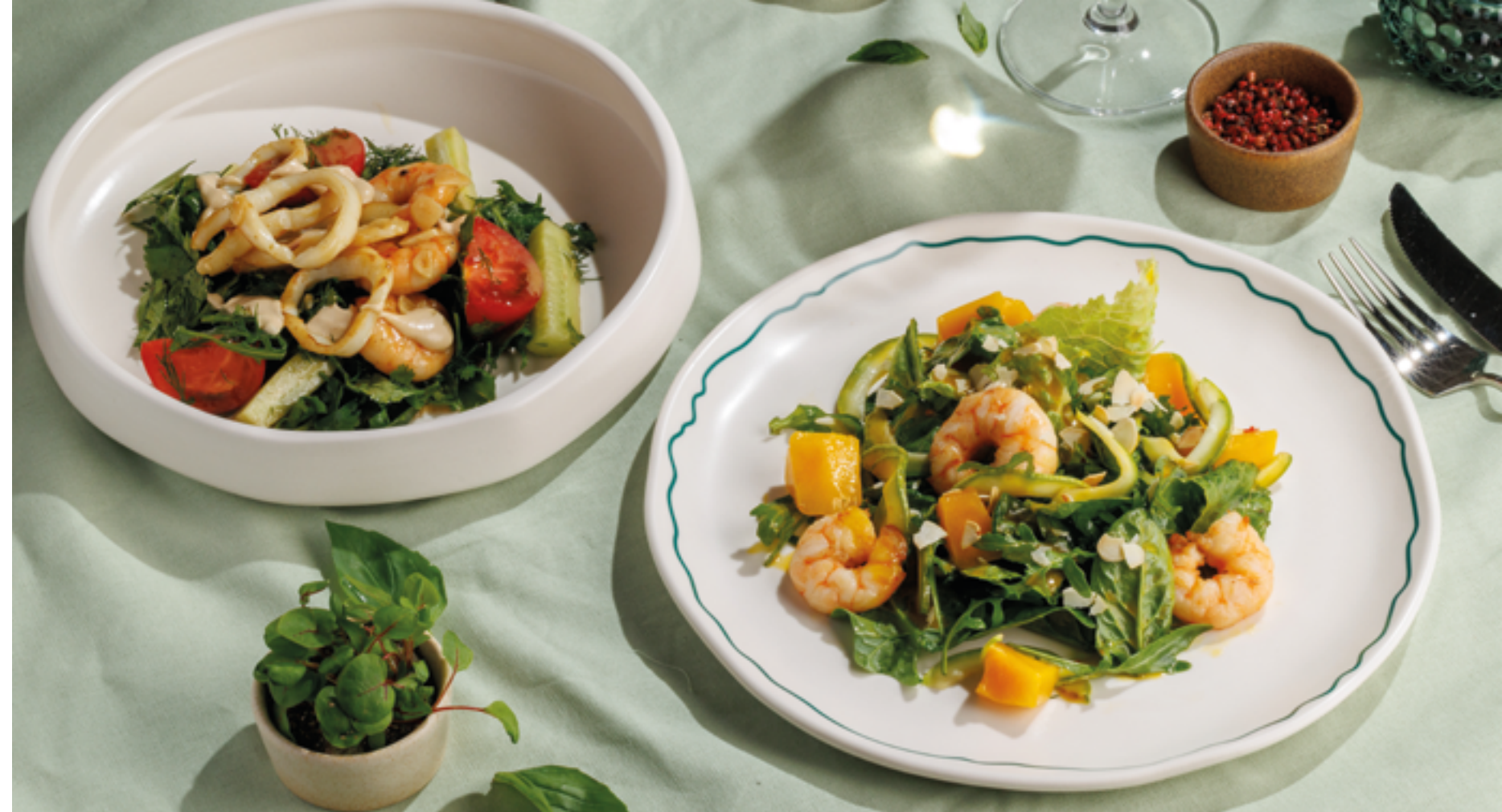
САЛАТ С КАЛЬМАРОМ И КРЕВЕТКАМИ, 1290₽ Salad with squid and shrimp

Попробуйте наши бакинские томаты - вкус, который говорит сам за себя.