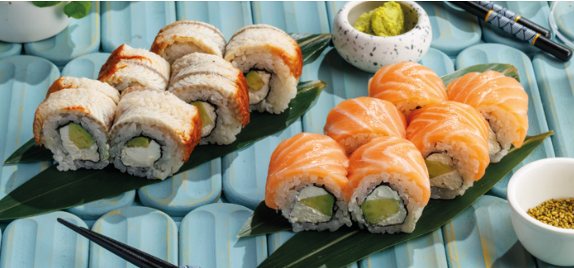
ФИЛАДЕЛЬФИЯ УГОРЬ, 1290₽ Eel Philadelphia roll