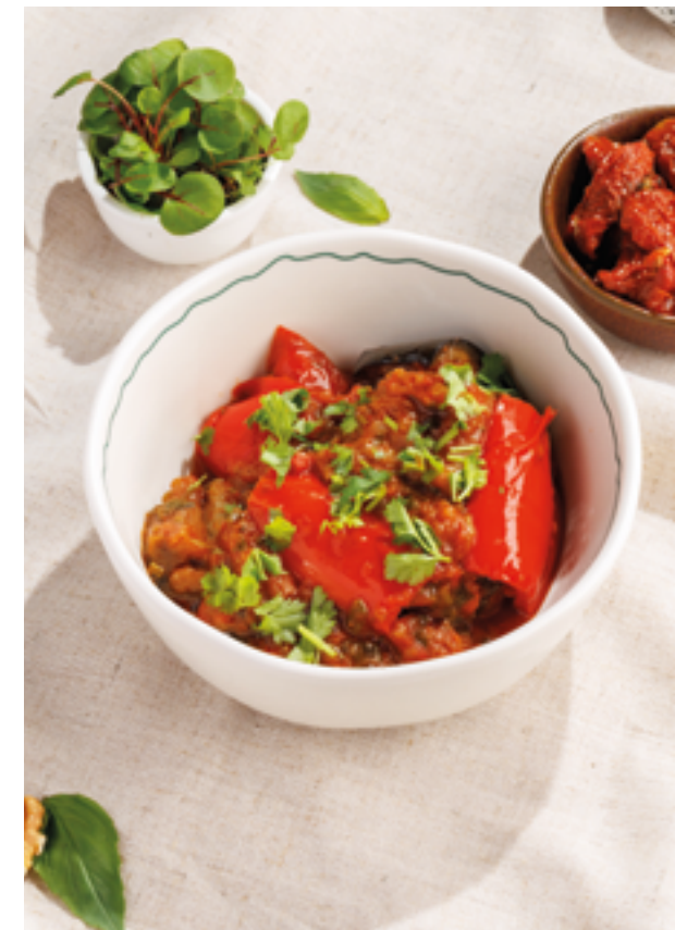
АДЖАПСАНДАЛ, 790₽ Adjapsandali