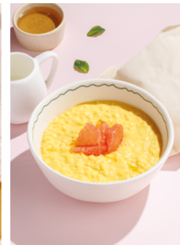
РИСОВАЯ КАША С МАНГОВЫМ СОУСОМ И ГРЕЙПФРУТОМ, 590₽ Rice porridge with mango sauce and grapefruit