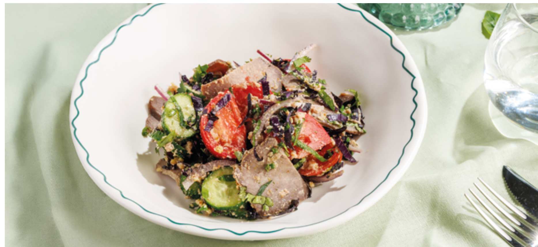
ГРУЗИНСКИЙ САЛАТ С ГОВЯДИНОЙ, 990₽ Georgian salad with beef