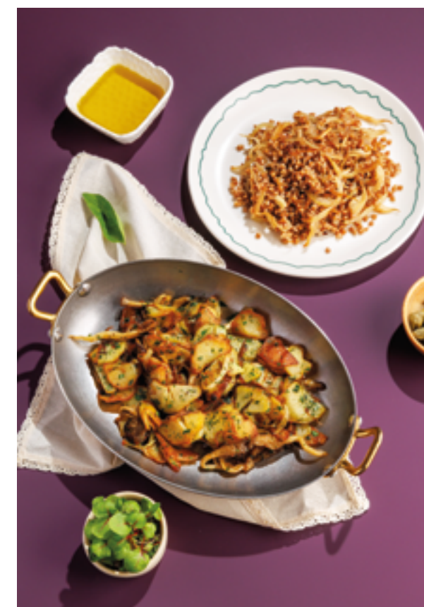
ЖАРЕНый КАРТОФЕЛЬ С СЕЗОННЫМИ ГРИБАМИ / ГРЕЧА С СЕЗОННЫМИ ГРИБАМИ, 590Р / 490Р Fried potatoes with seasonal mushrooms / buckwheat with seasonal mushrooms