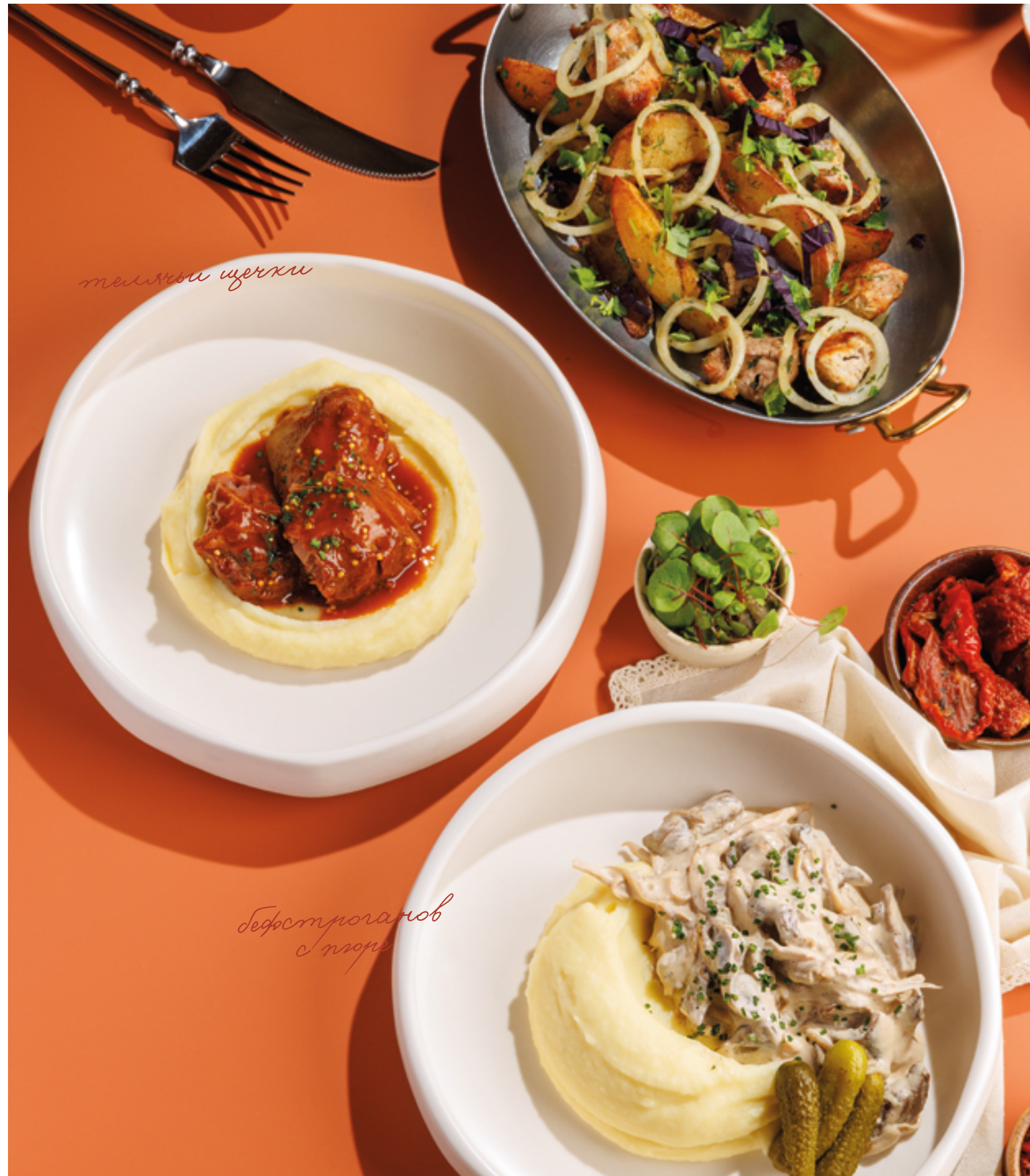
ОДЖАХУРИ ИЗ СВИНИНЫ, 990₽ Pork ojakhuri