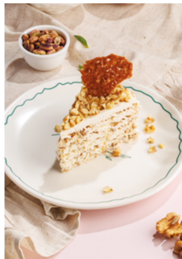
ТОРТ «ГРЕЦКИЙ ОРЕХ», 790₽ Walnut cake