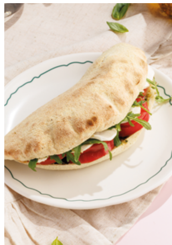
ПАНИНИ С МОЦАРЕЛЛОЙ И ТОМАТАМИ, 890₽ Mozzarella and tomato panini