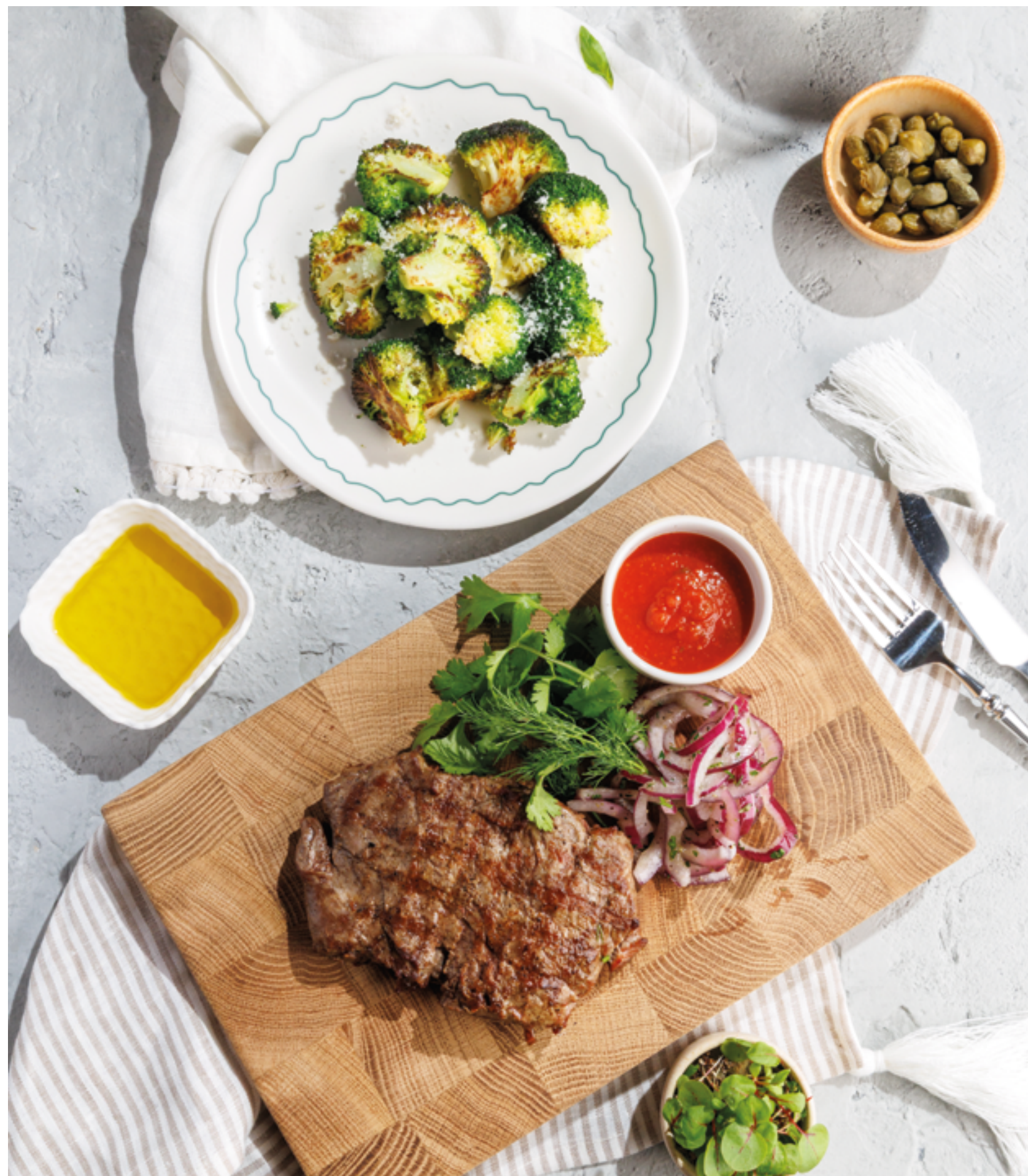
БРОККОЛИ С ПАРМЕЗАНОМ НА ГРИЛЕ / НА ПАРУ, 590₽ Grilled / steamed broccoli with parmesan