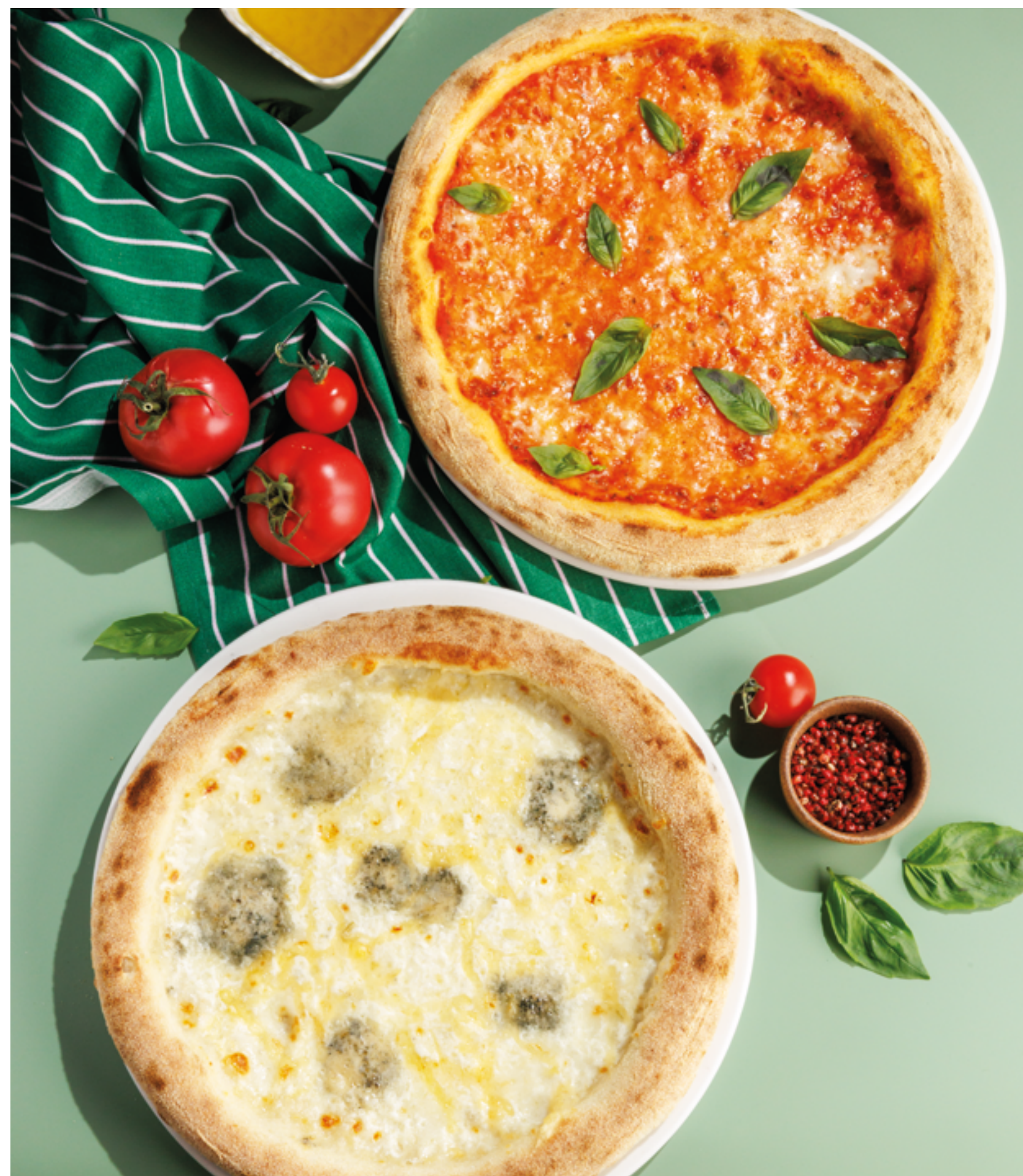
ПИЦЦА «МАРГАРИТА», 790₽ Margherita