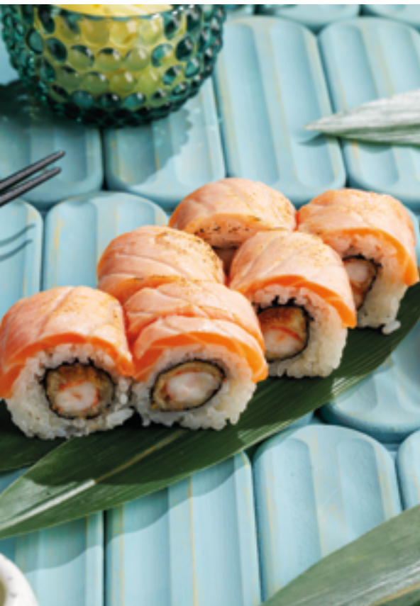
РОЛЛ С КРЕВЕТКОЙ В ТЕМПУРЕ, 1190₽ Shrimp tempura roll