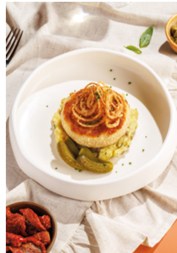
РЫБНАЯ КОТЛЕТА С ТОЛЧЕНЫМ КАРТОФЕЛЕМ, 990₽ Fish patty with smashed potatoes