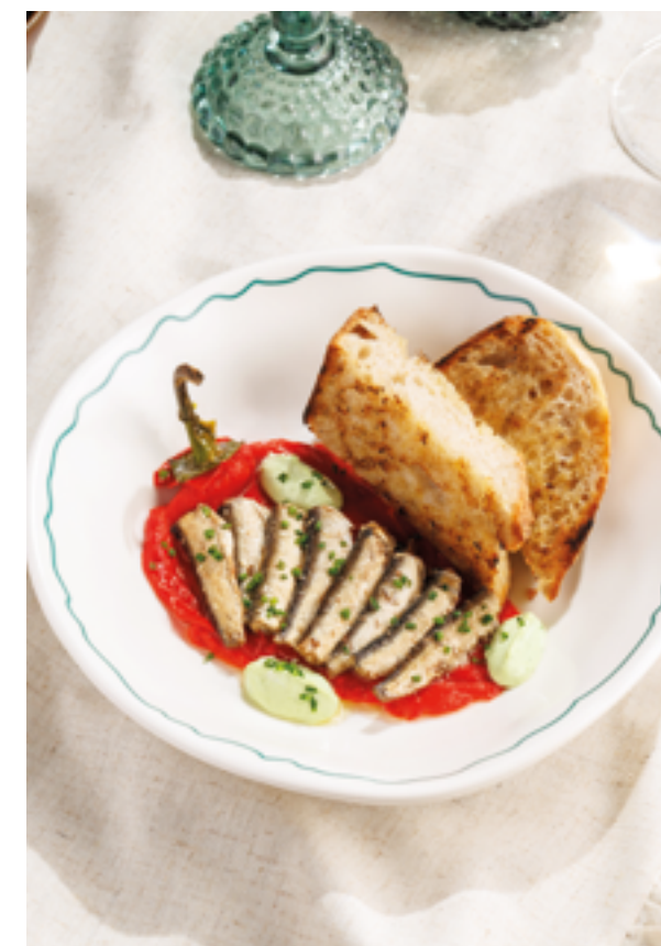
ШПРОТЫ С ПЕРЦЕМ РАМИРО, 490₽ Sprats with Ramiro peppers