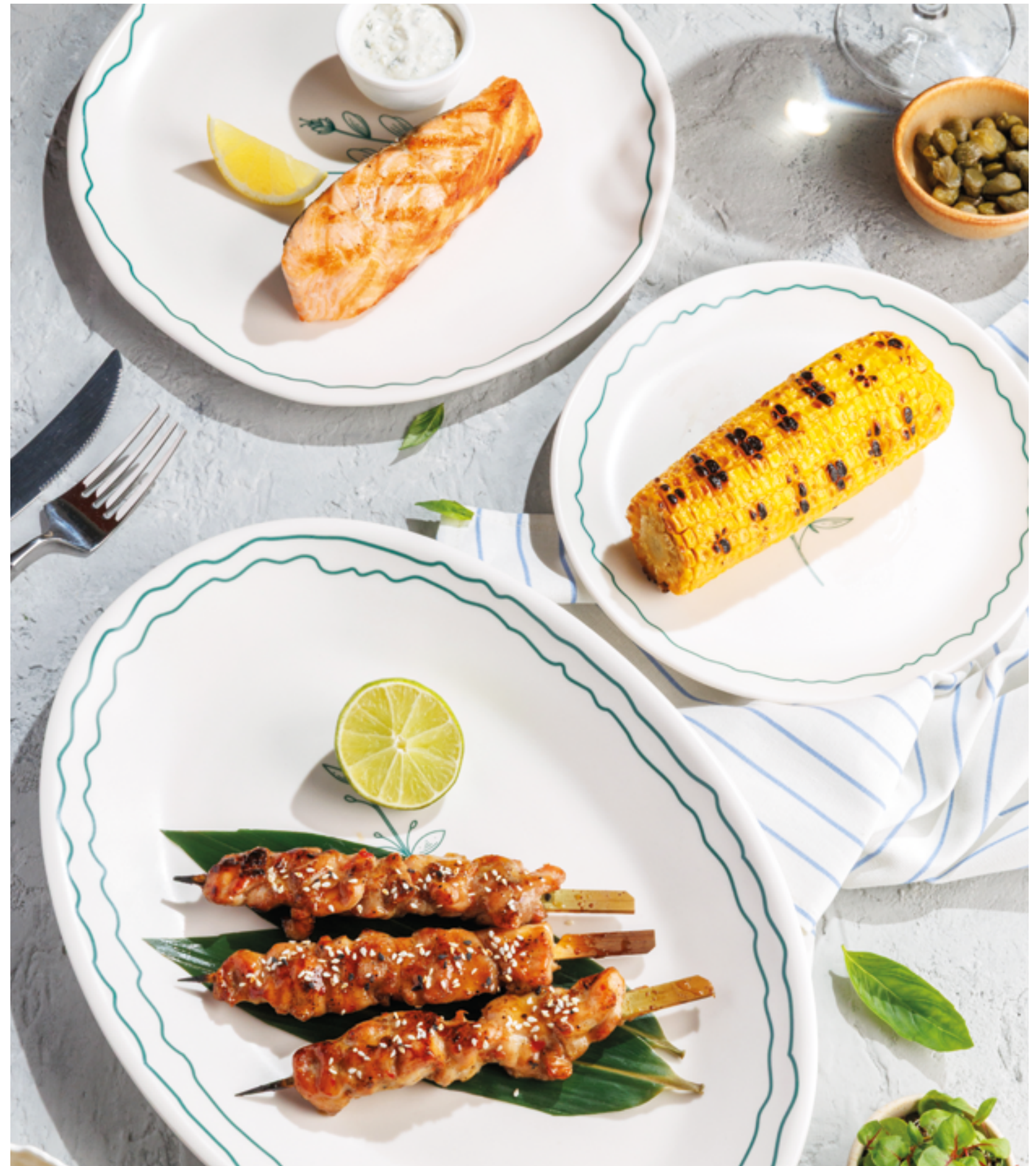
СТЕЙК ИЗ ЛОСОСЯ НА ГРИЛЕ, 1990₽ Grilled salmon steak