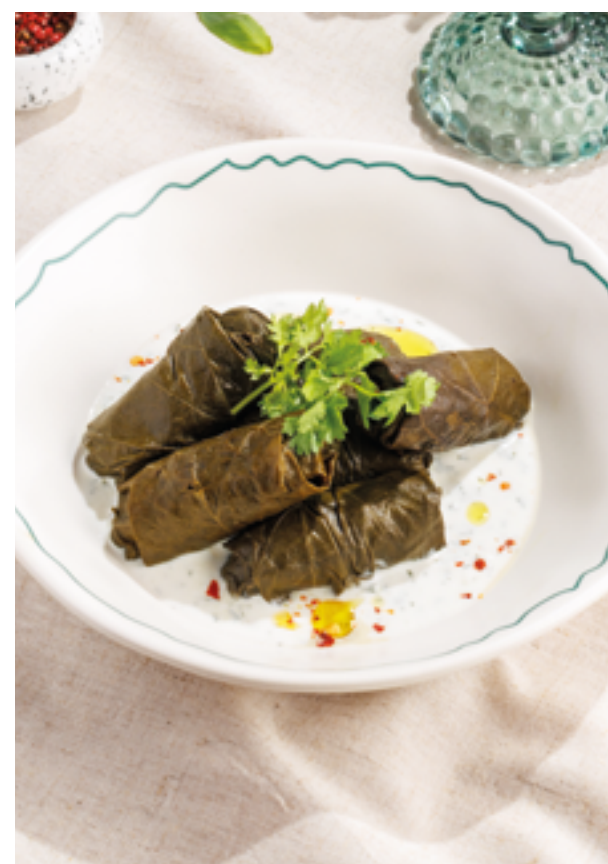
ДОЛМА СО СВИНИНОЙ И ГОВЯДИНОЙ / С БАРАНИНОЙ, 790₽ / 990₽ Pork and beef / lamb dolma