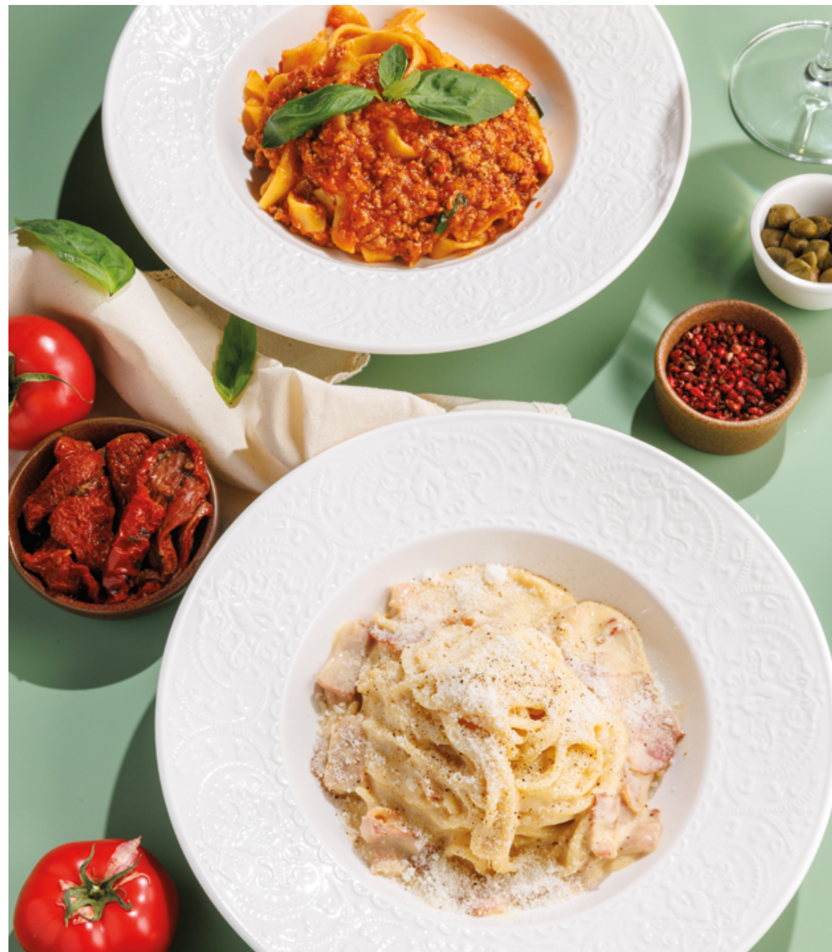
ПАСТА БОЛОНЬЕЗЕ, 990₽ pasta bolognese