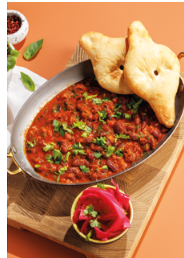
ЛОБИО «ХАРКАЛИЯ», 690₽ Kharkatia lobio