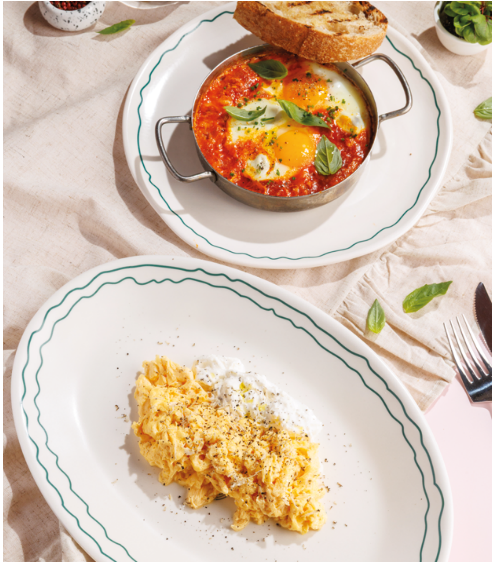
ШАКШУКА С ТОМАТАМИ И БАЗИЛИКОМ, 690₽ Shakshuka with tomatoes and basil

Просьба предупредить вашего официанта об имеющийся у вас аллергии на определённые продукты питания