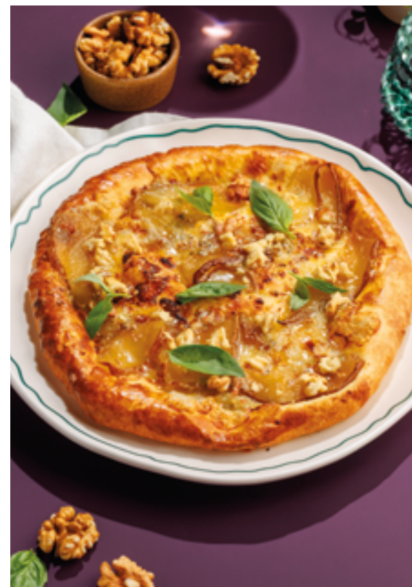
ХАЧАПУРИ С ГРУШЕЙ И СЫРОМ ГОРГОНЗОЛА, 990₽ Khachapuri with pear, gorgonzola and walnuts