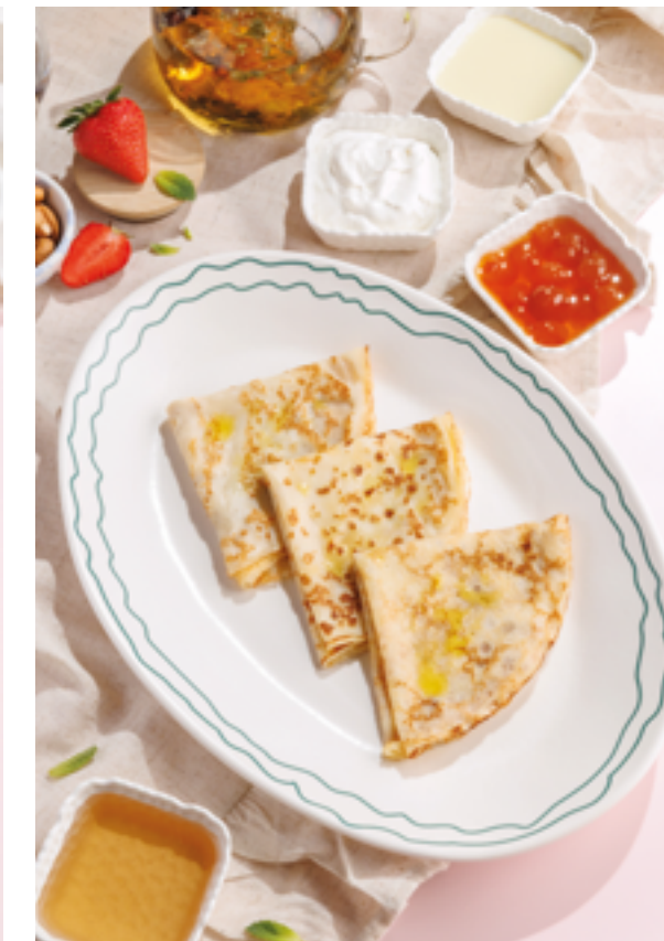
БЛИНЫ С ТОПИНГОМ НА ВЫБОР сметана / сгущенное молоко / варенье, 390₽ Crepes with topping of your choice sour cream / condensed milk / jam