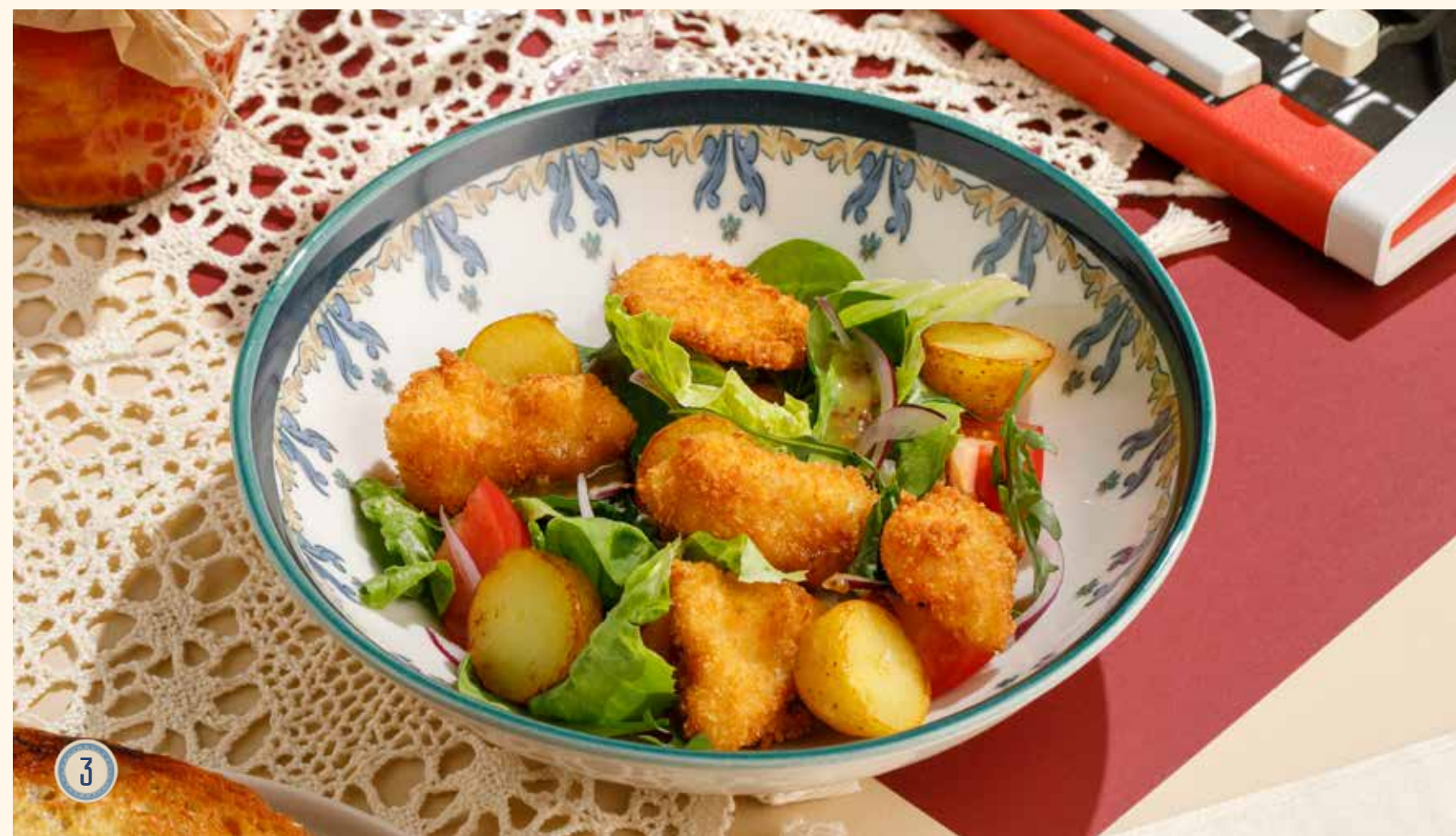
3 САЛАТ С ПЕЧЕНЫМ КАРТОФЕЛЕМ И ТРЕСКОЙ 850 Р