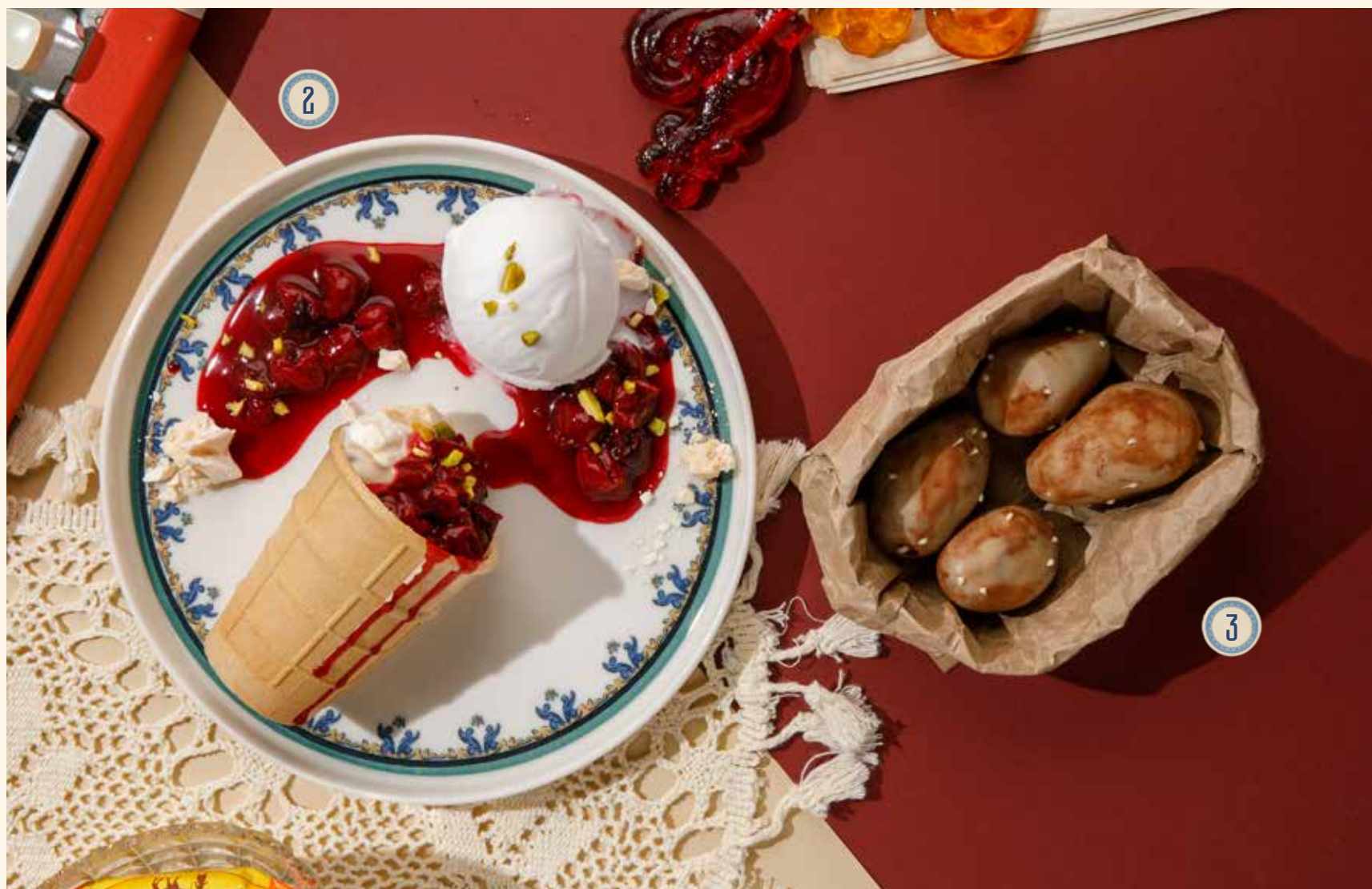
2 СТАКАНЧИК МОРОЖЕНОГО С ВИШНЕЙ