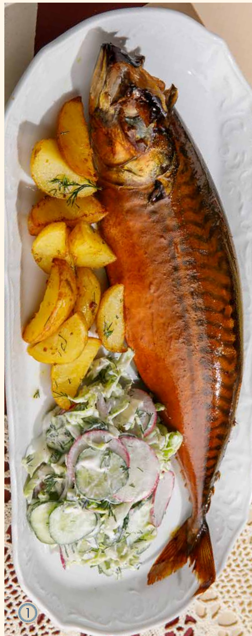
1 СКУМБРИЯ ИЗ КОПТИЛЬНИ 1250 Р