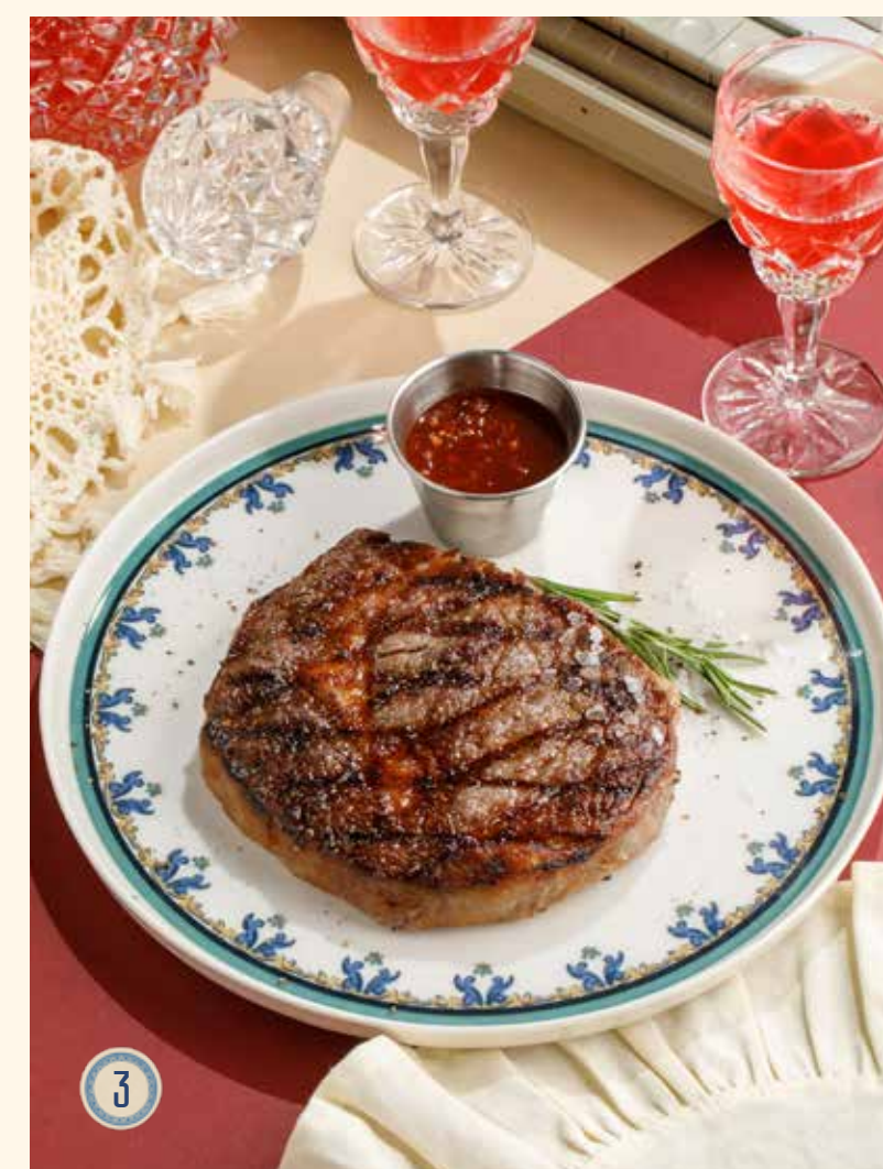
3 СТЕЙК РИБАЙ 3990 Р