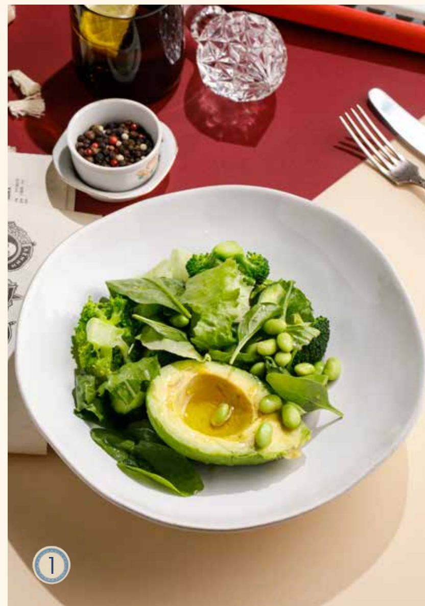
1 ЗЕЛЕНЬ САЛАТ С АВОКАДО И БРОККОЛИ 730 Р