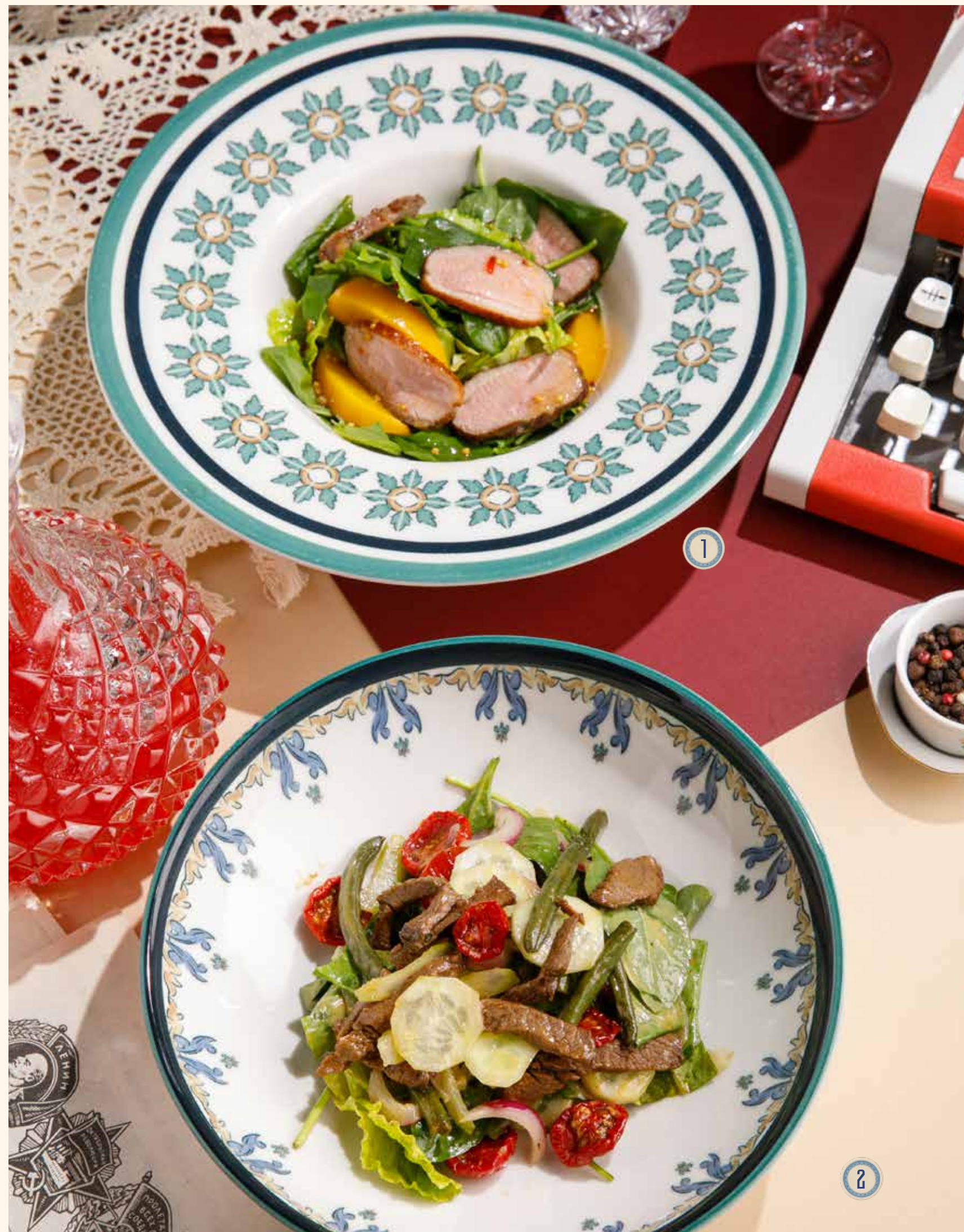
1 САЛАТ С УТКОЙ И ПЕРСИКАМИ 890 Р