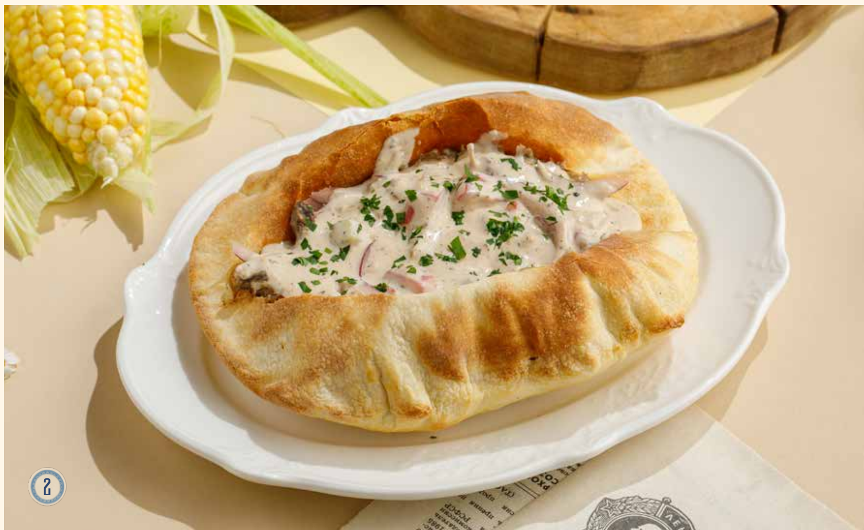
2 ЛЕПЕШКА С РВАННОЙ ГОВЯДИНОЙ И ПЕРЕЧНЫМ СОУСОМ 930 Р 🍴