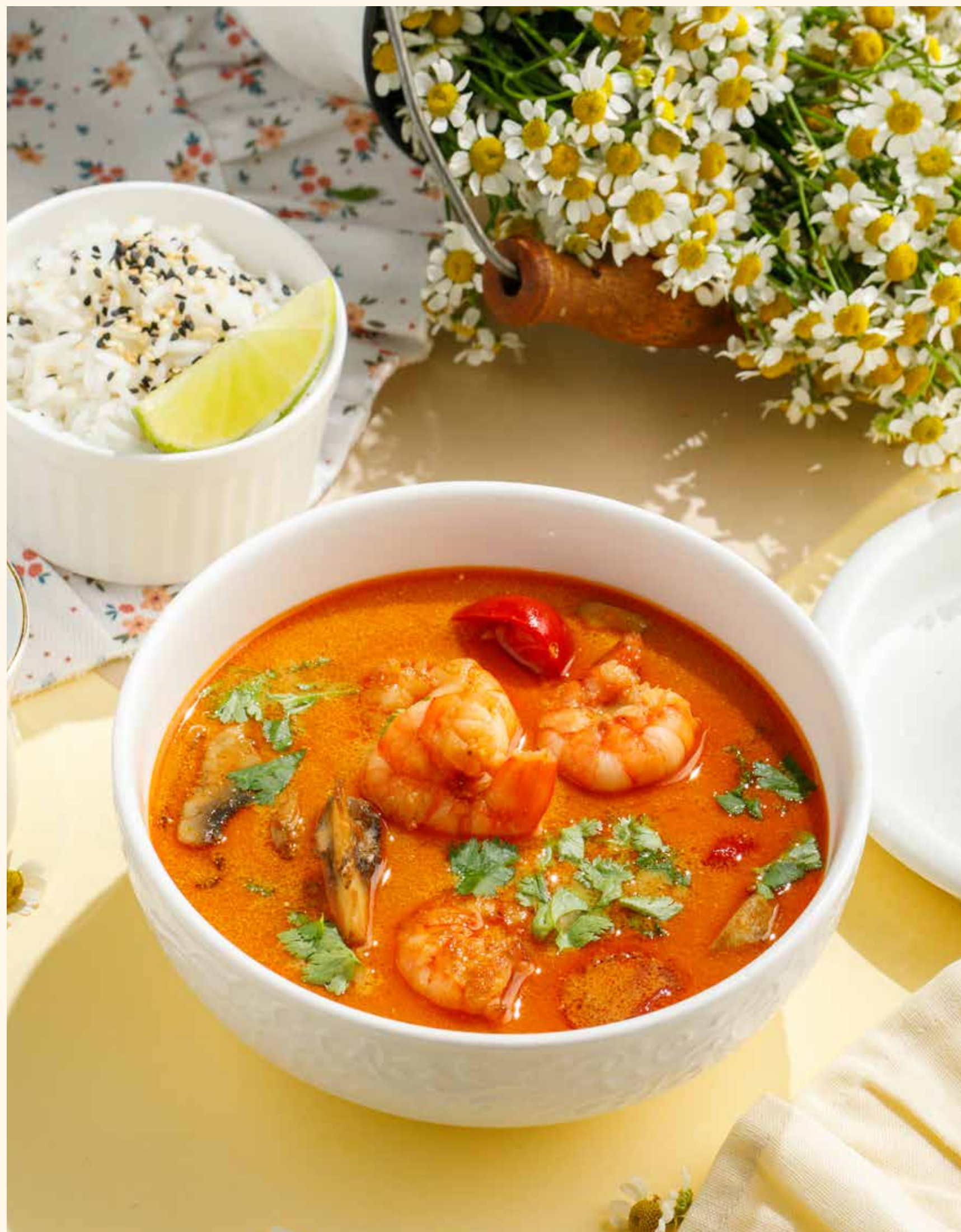
ТОМ ЯМ С КРЕВЕТКАМИ