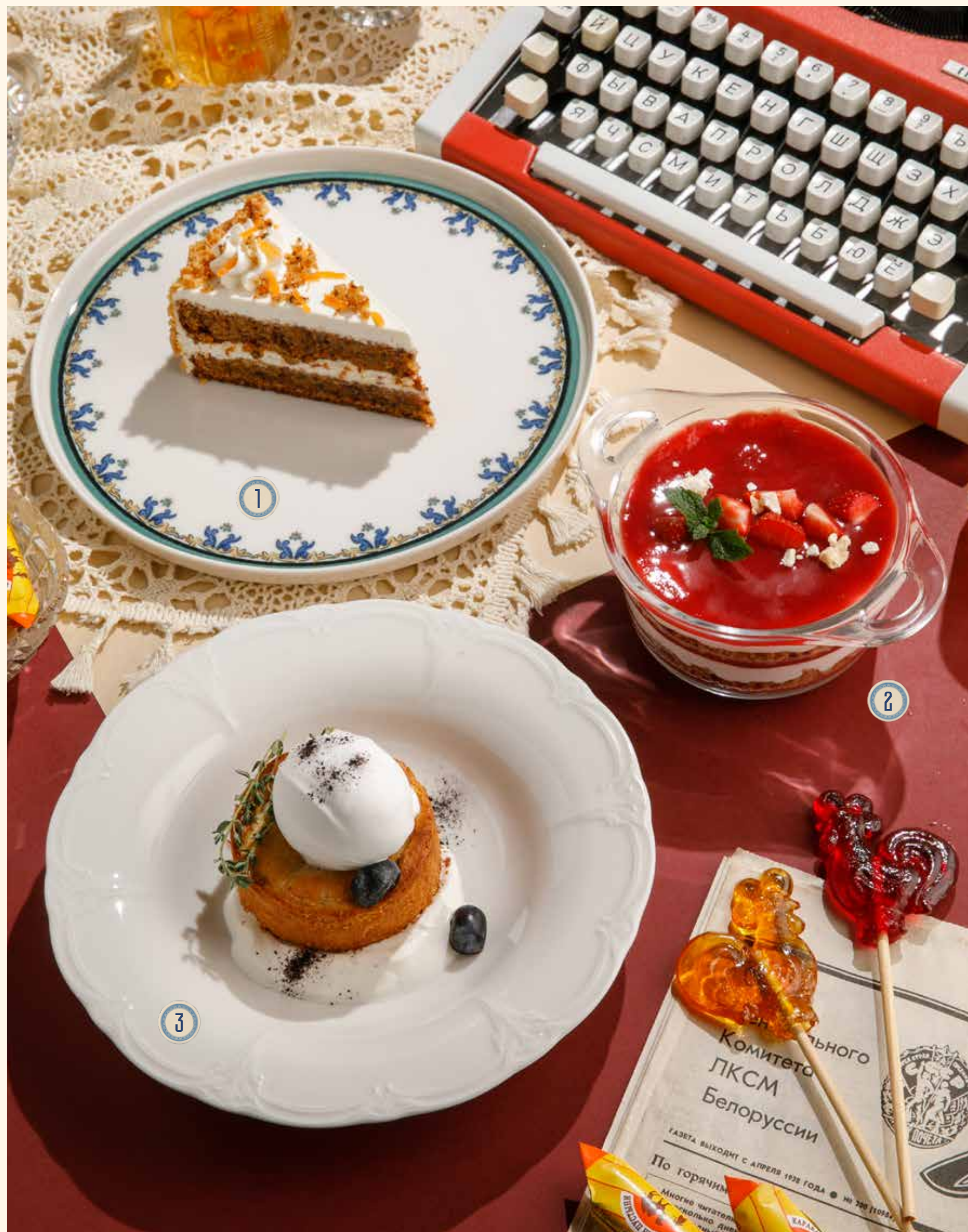
1 МОРКОВНЫЙ ТОРТ