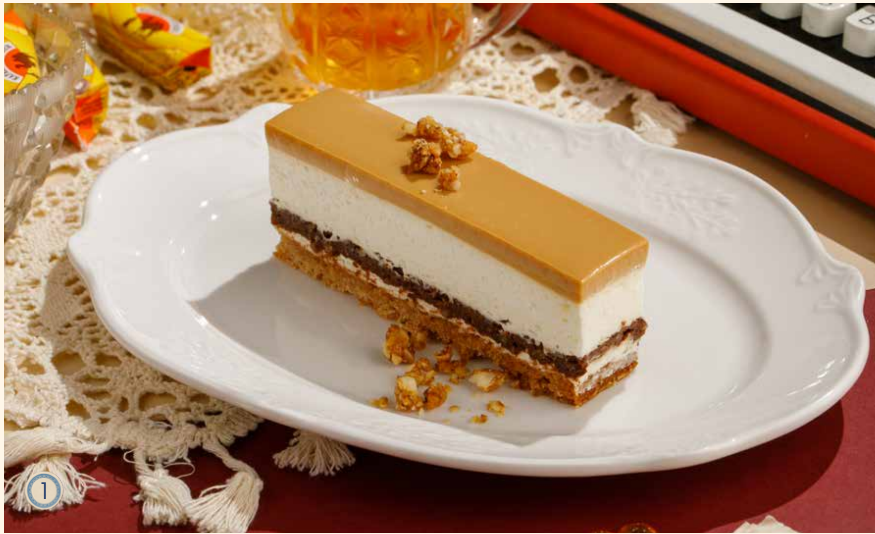
1 КАРАМЕЛЬНЫЙ ЧИЗКЕЙК