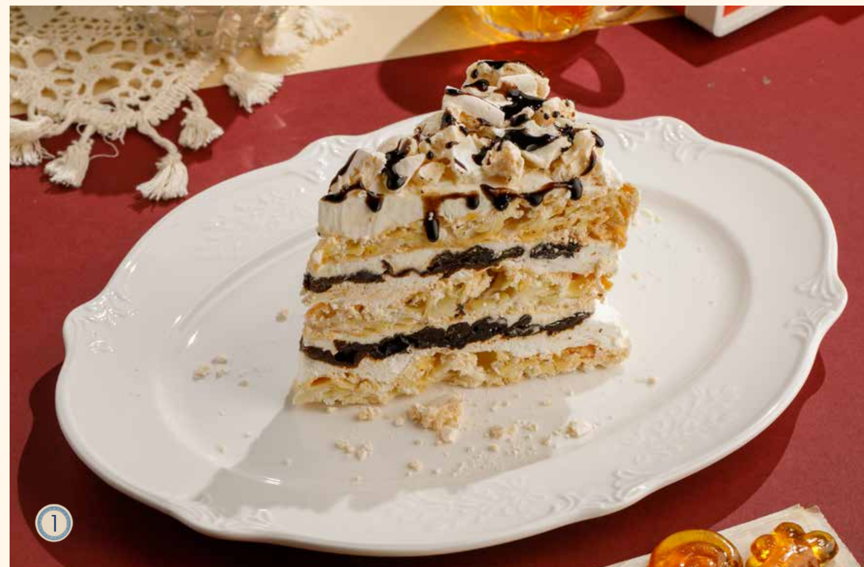
1 ГРАФСКИЕ РАЗВАЛИНЫ С ЧЕРНОСЛИВОМ