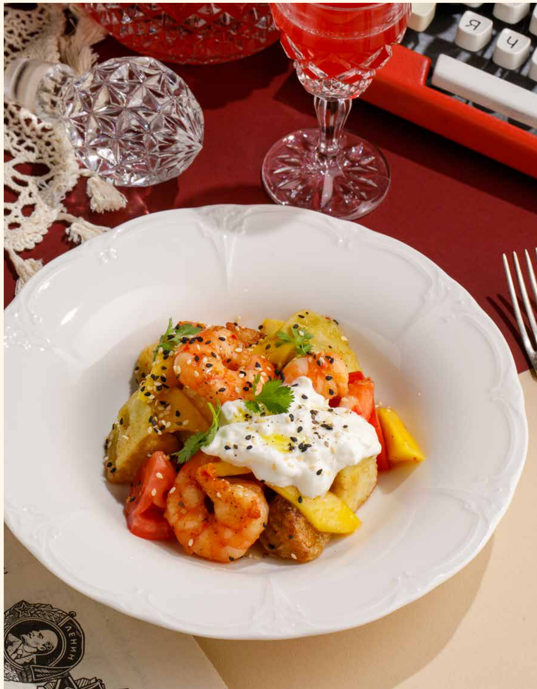
САЛАТ С КРЕВЕТКАМИ, ХРУСТЯЩИМИ БАКЛАЖАНАМИ И ФЕРМЕРСКИМ СЫРОМ