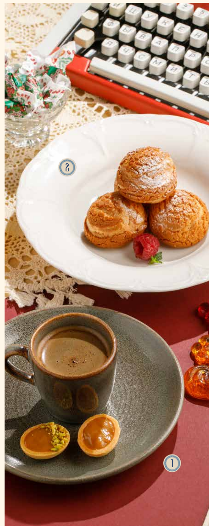
1 КОФЕ ПО-СУХУМСКИ