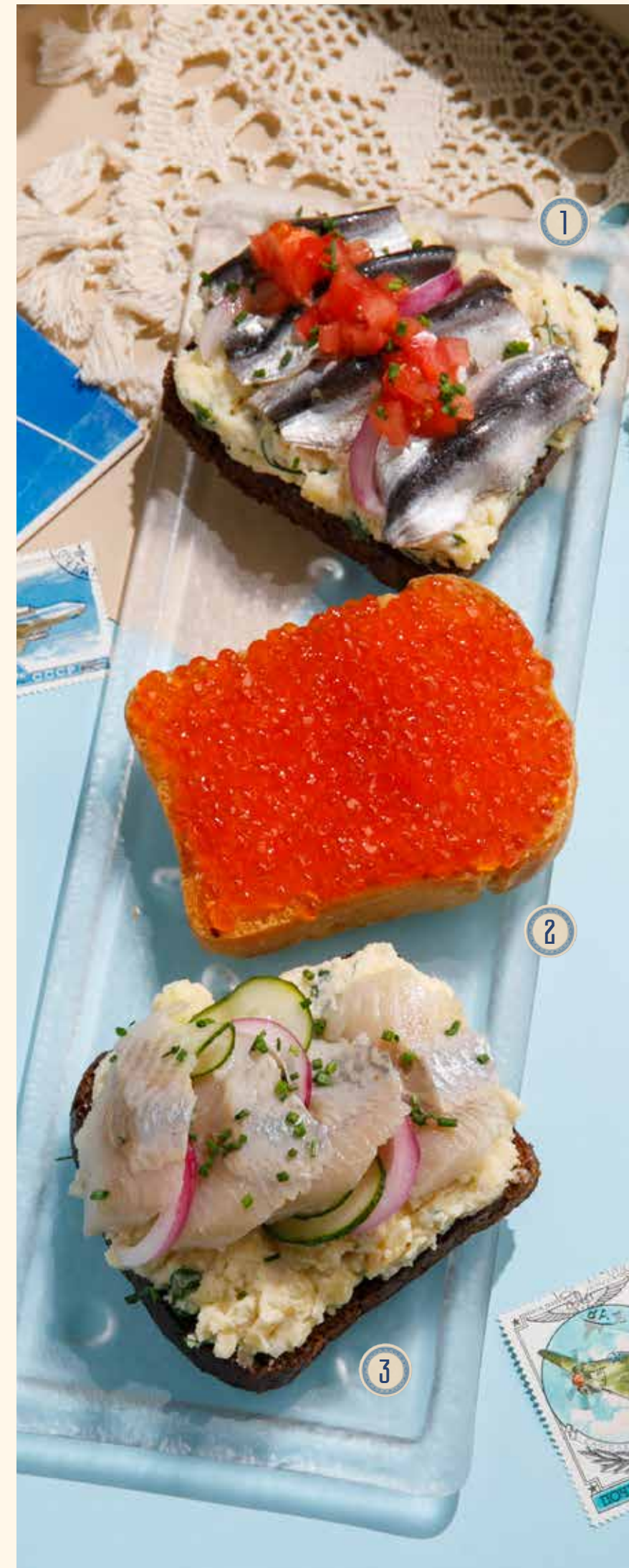
1 БУТЕРБРОД С ТЮЛЬКОЙ 390 Р