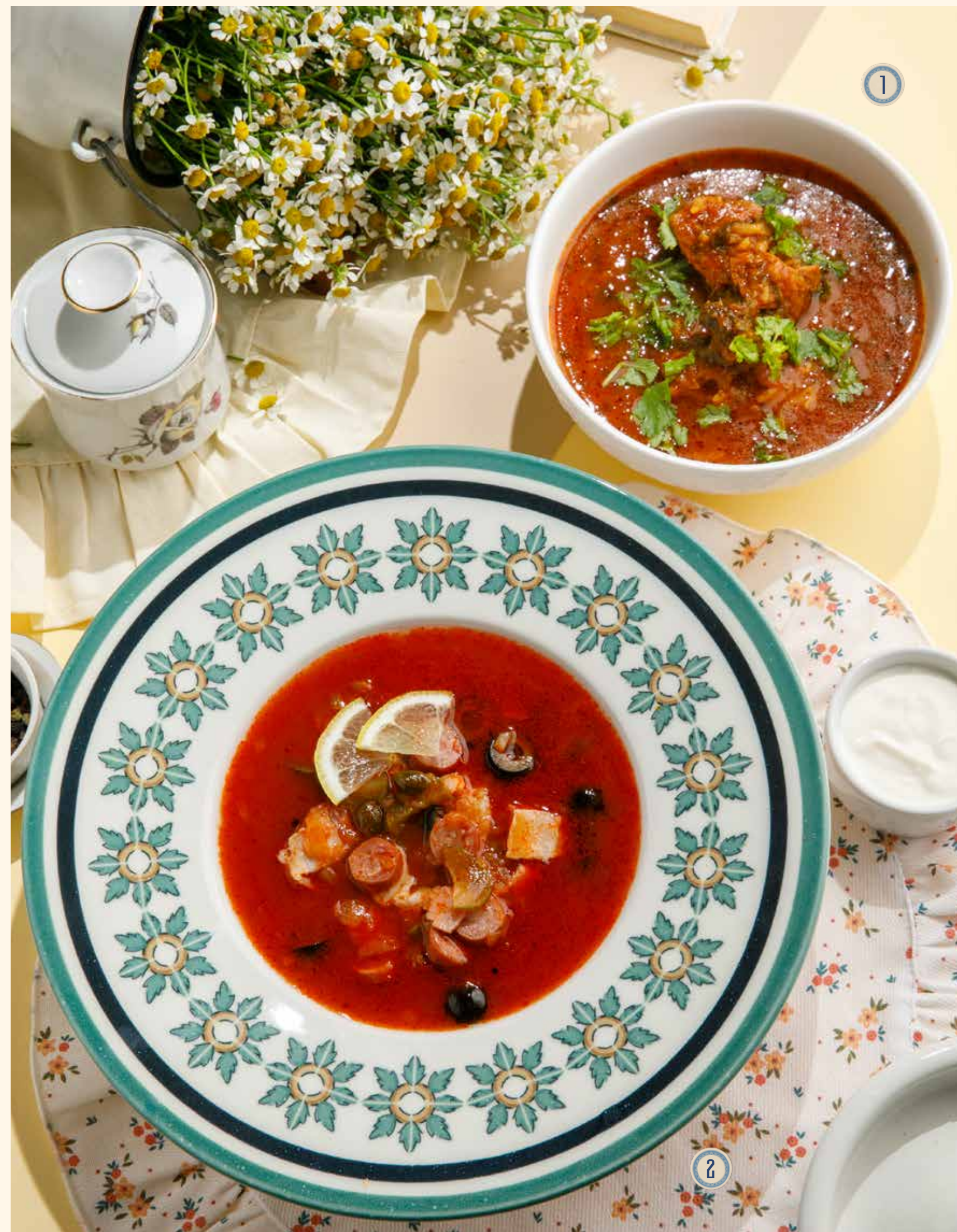
1 ХАРЧО С БАРАНЬЕЙ 750 Р 🌶️