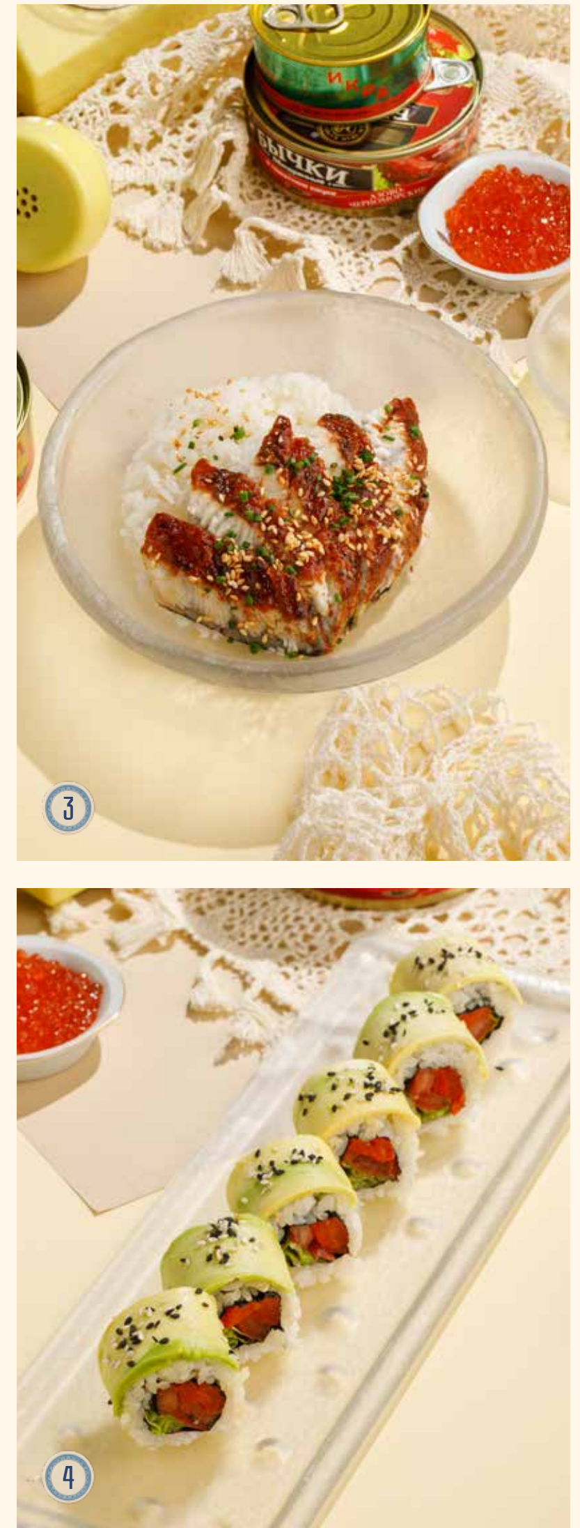
3 УГОРЬ НА РИСЕ 790 Р