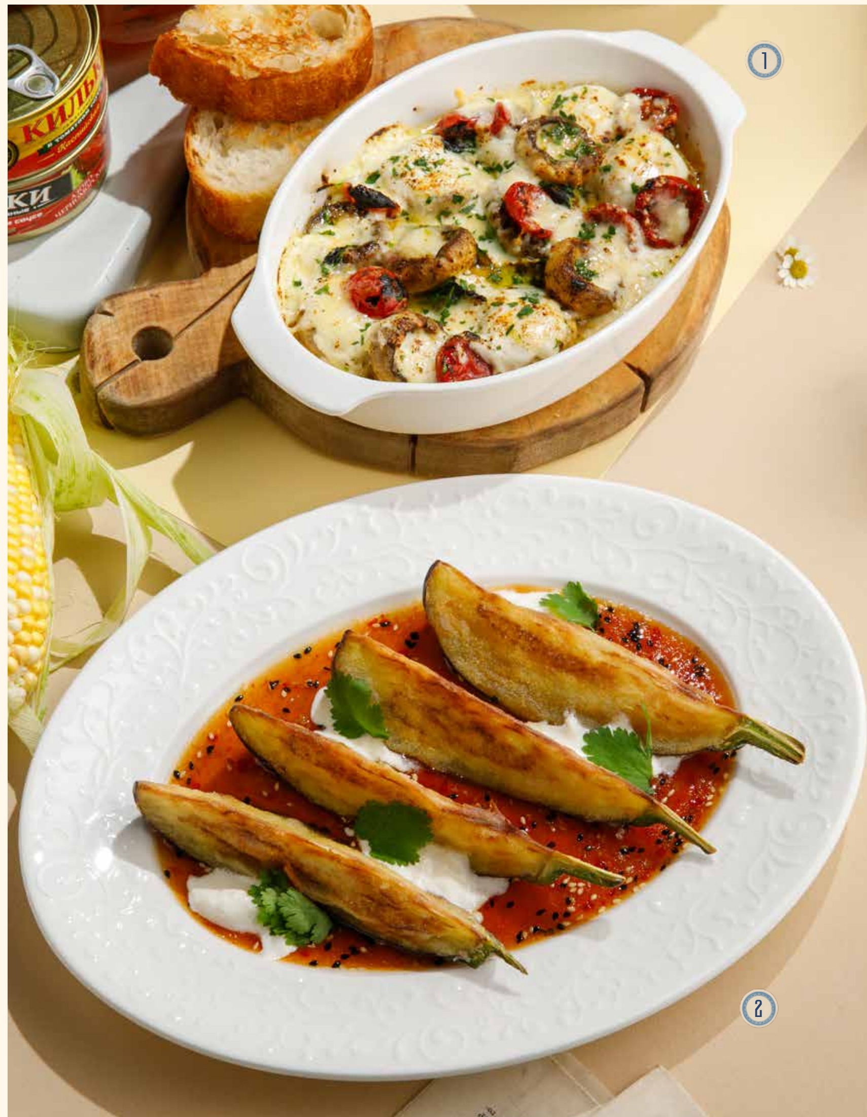
1 ШАМПИньОНЫ ПО-ГРУЗИНСКИ 890 Р 🍴