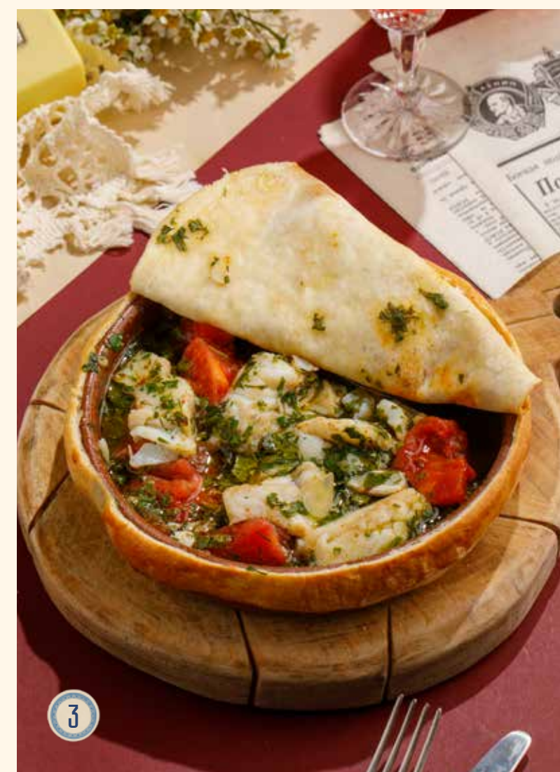
3 АРОМАТНЫЙ СУДАК, ТОМЛЕННЫЙ С ТОМАТАМИ И ТРАВАМИ 990 Р