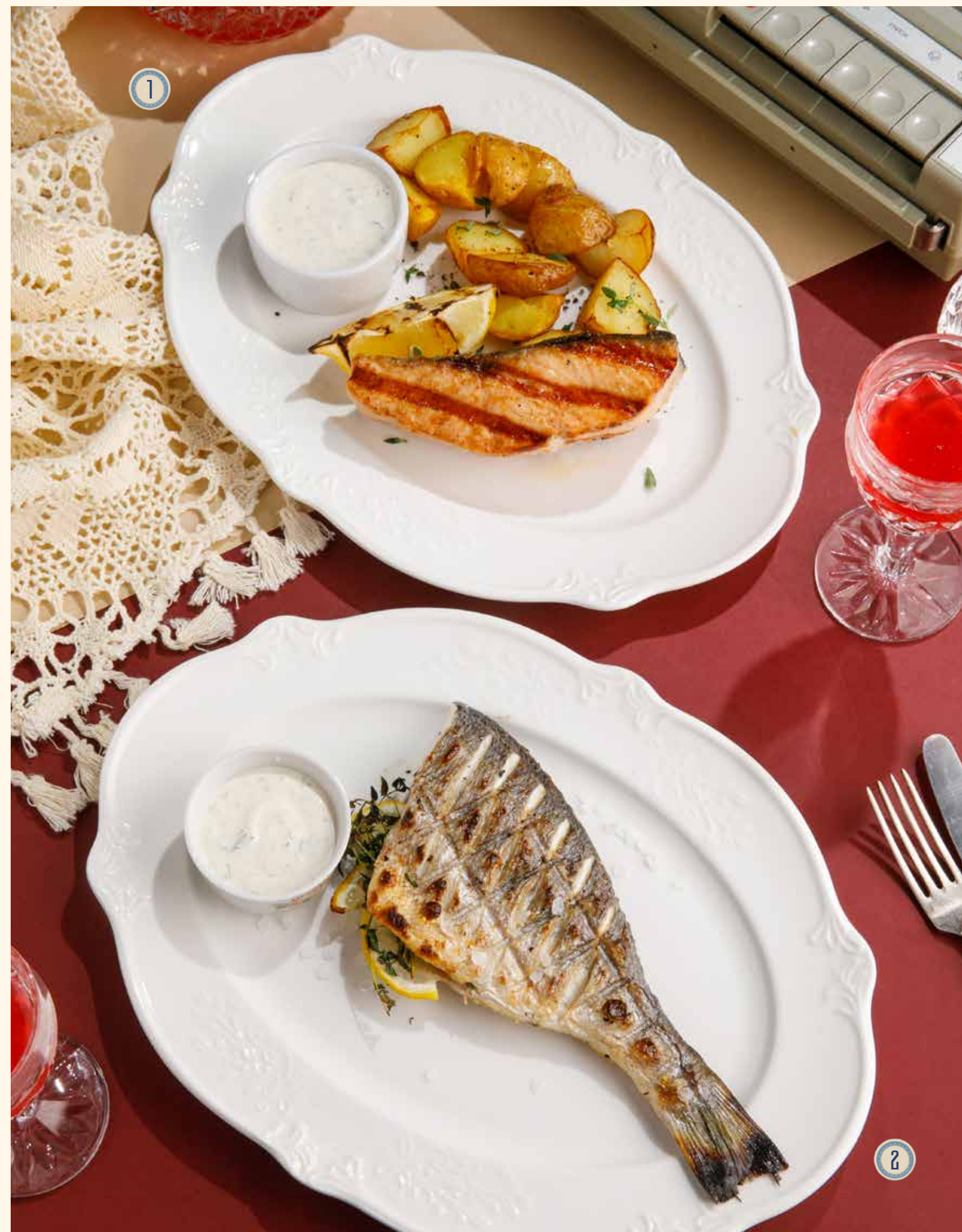
1 ЛОСОСЬ С КАРТОФЕЛЕМ ПО-ДОМАШНЕМУ