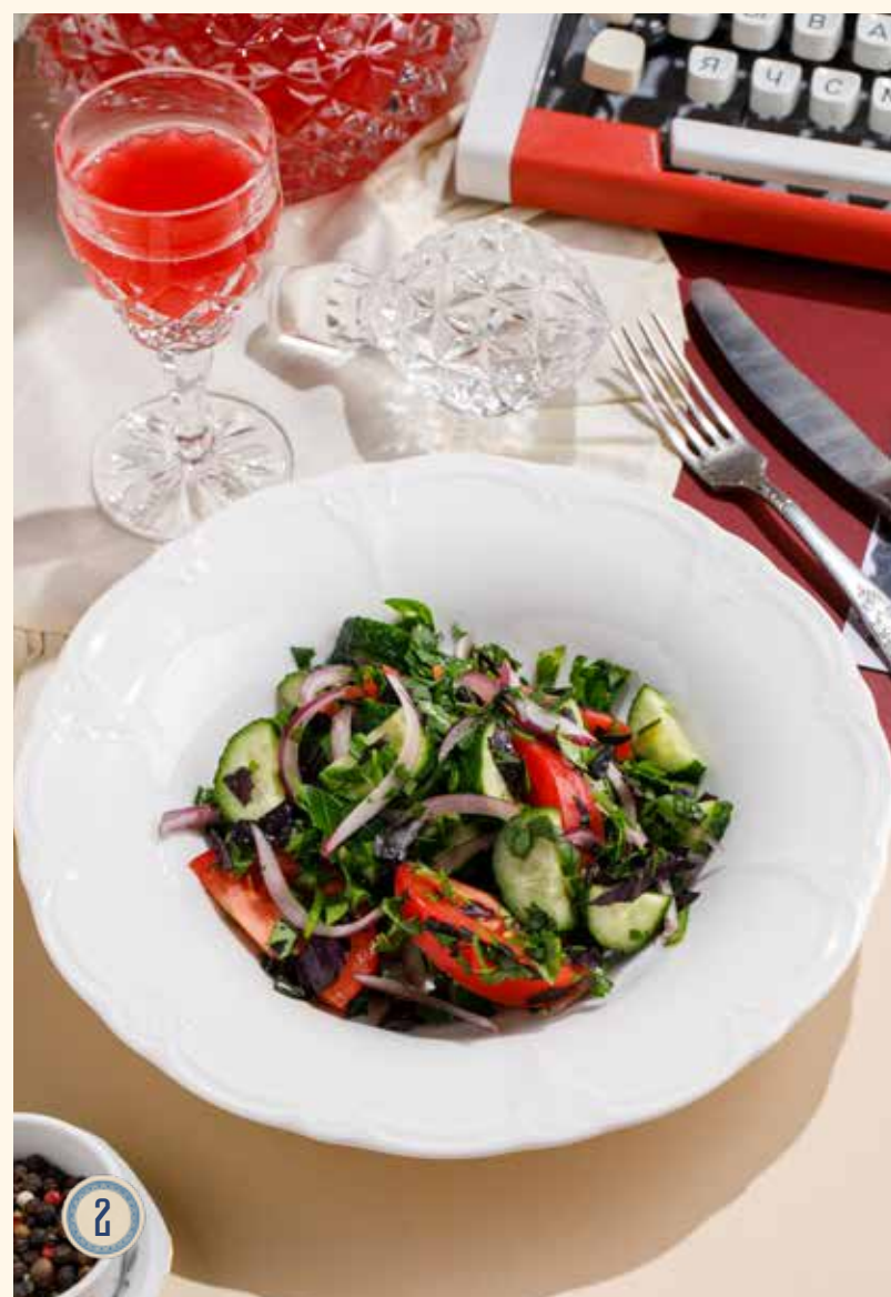
1 САЛАТ С КУРИНОЙ ПЕЧЕНЬЮ 690 Р