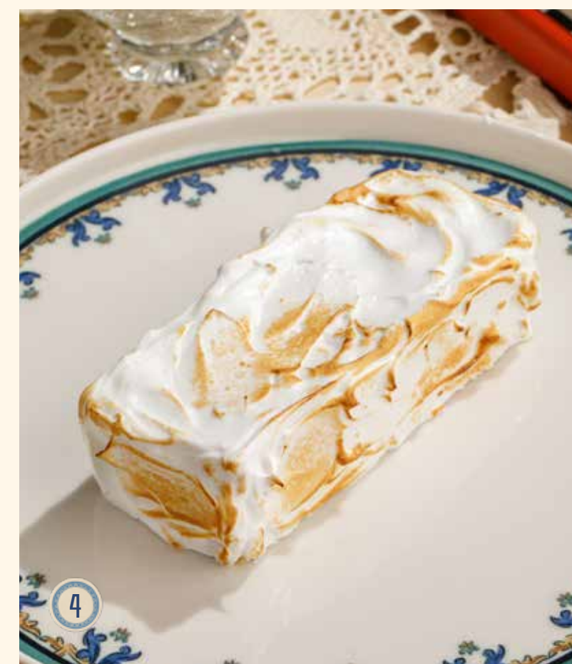
4 ЛИМОННЫЙ ТАРТ С ОБОЖЖЕННОЙ МЕРЕНГОЙ