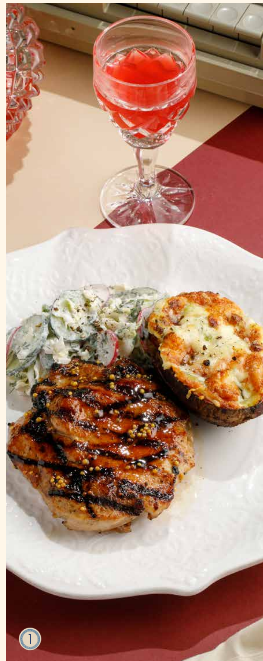
1 ОТБИВНАЯ ИЗ СВИНИНЫ С ДОМАШНИМ КАРТОФЕЛЕМ 1100 Р