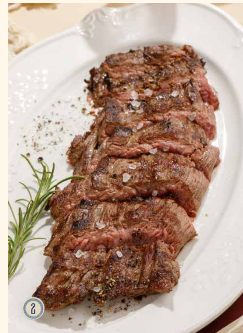
2 СТЕЙК МАЧЕТЕ 2390 Р