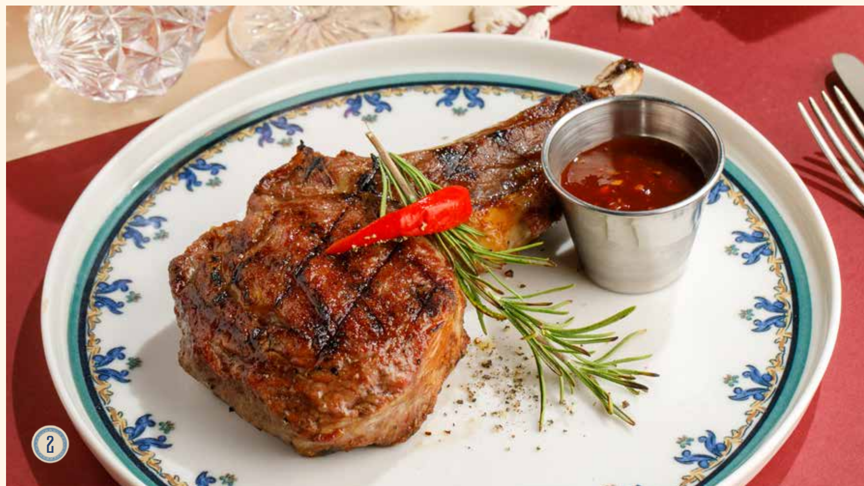
2 ТЕЛЯТИНА НА КОСТИ