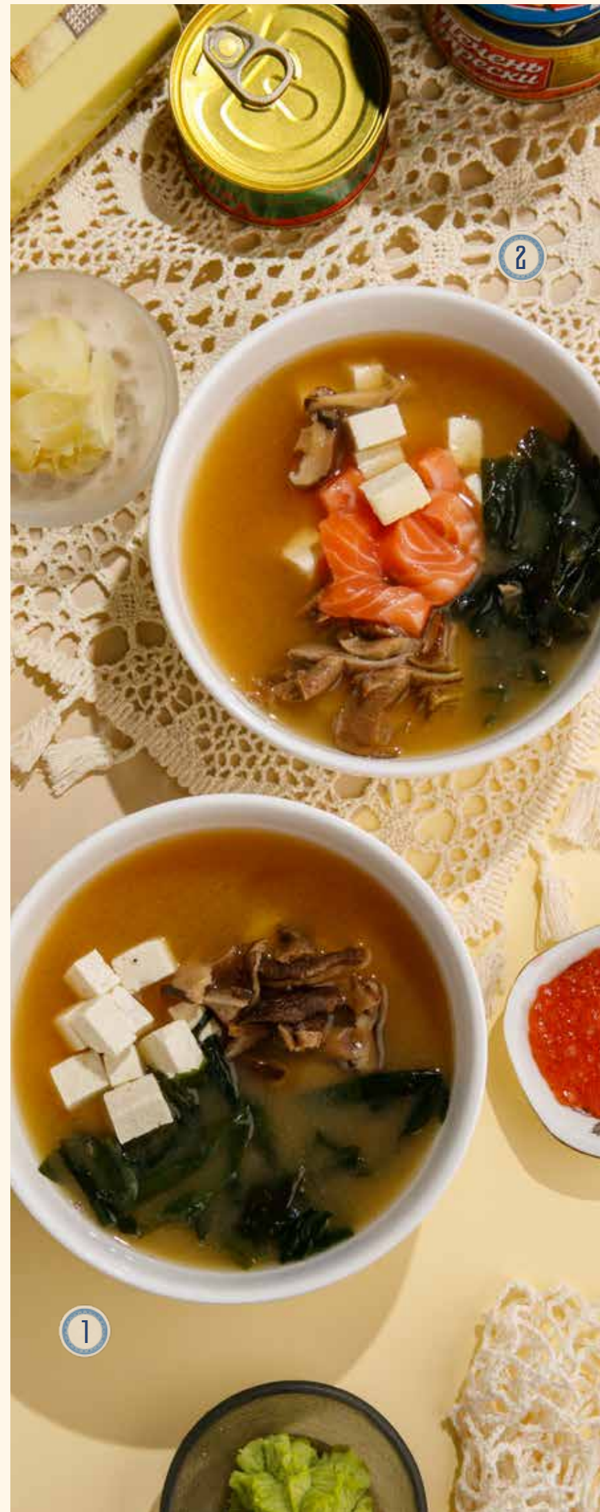
1 МИСО-СУП 390 Р