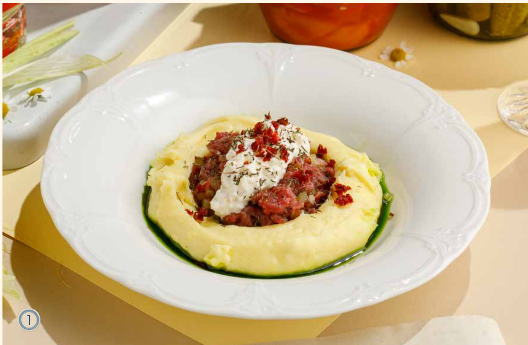
1 ТАРТАР ИЗ БЫЧКА С СОУСОМ ИЗ СУЛУГУНИ 990 Р