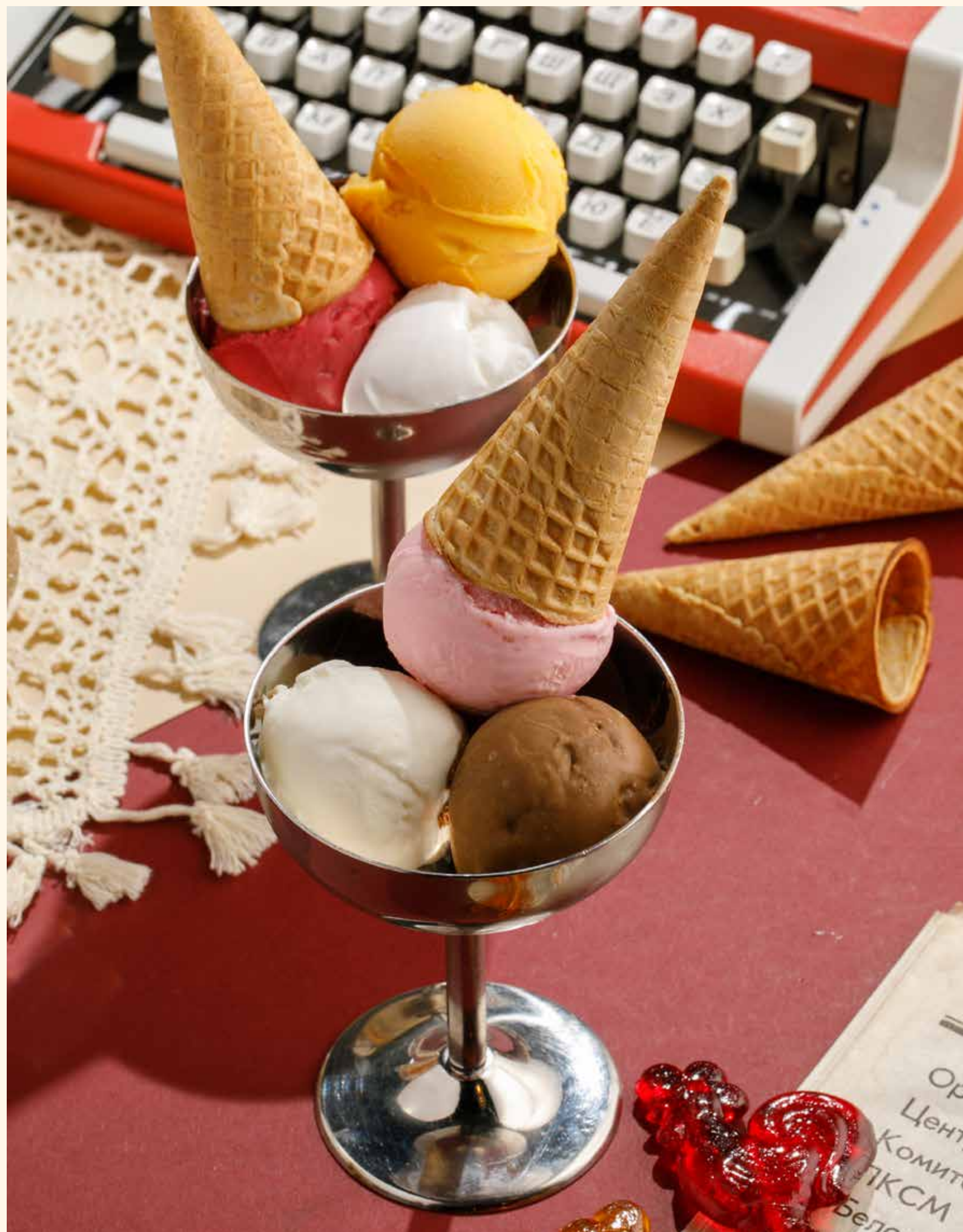
СОРБЕТ / МОРОЖЕНОЕ (1 ШАРИК)