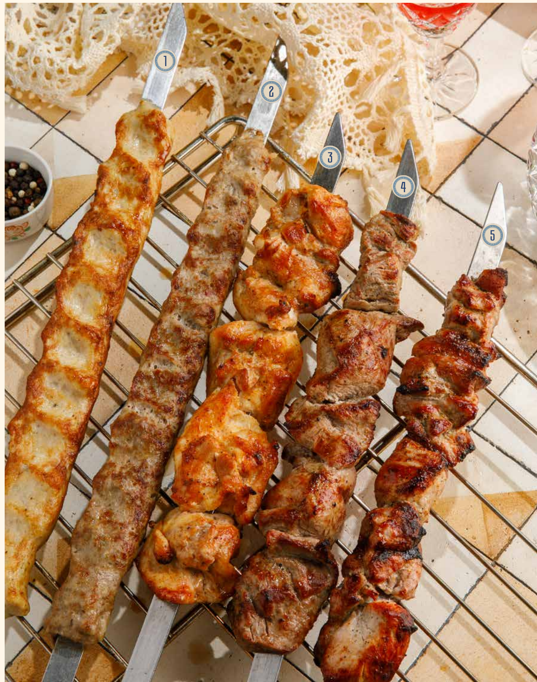
1 ЛЮЛЯ-КЕБАБ ИЗ КУРИЦЫ 790 Р