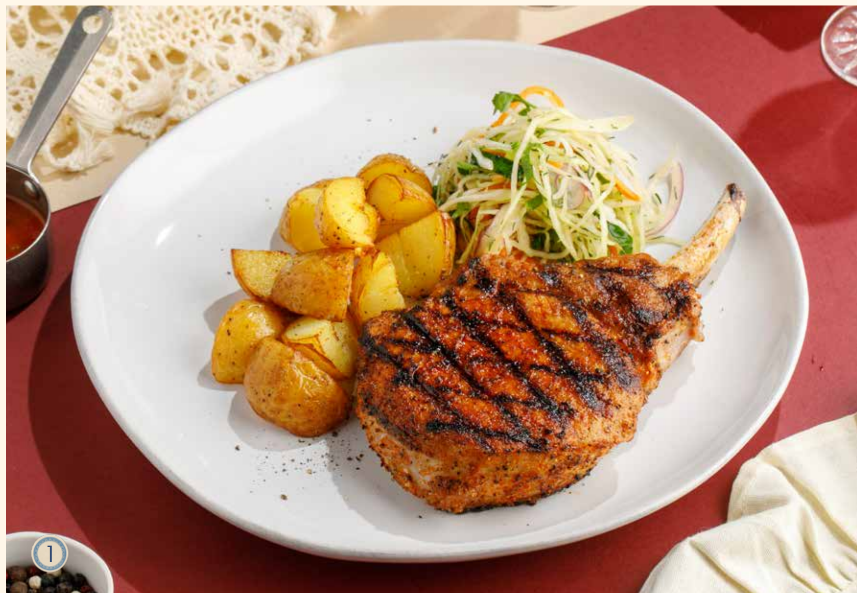
1 СВИНАЯ КОРЕЙКА С БЕБИ-КАРТОФЕЛЕМ