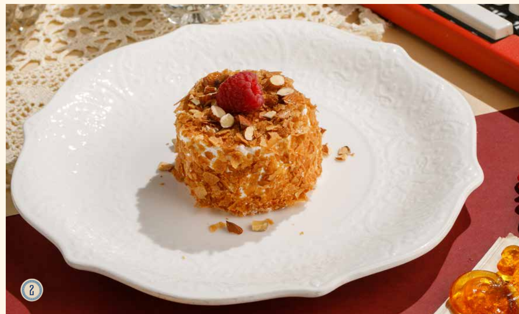
2 ВОЗДУШНЫЙ ДЕСЕРТ БЕЗ САХАРА