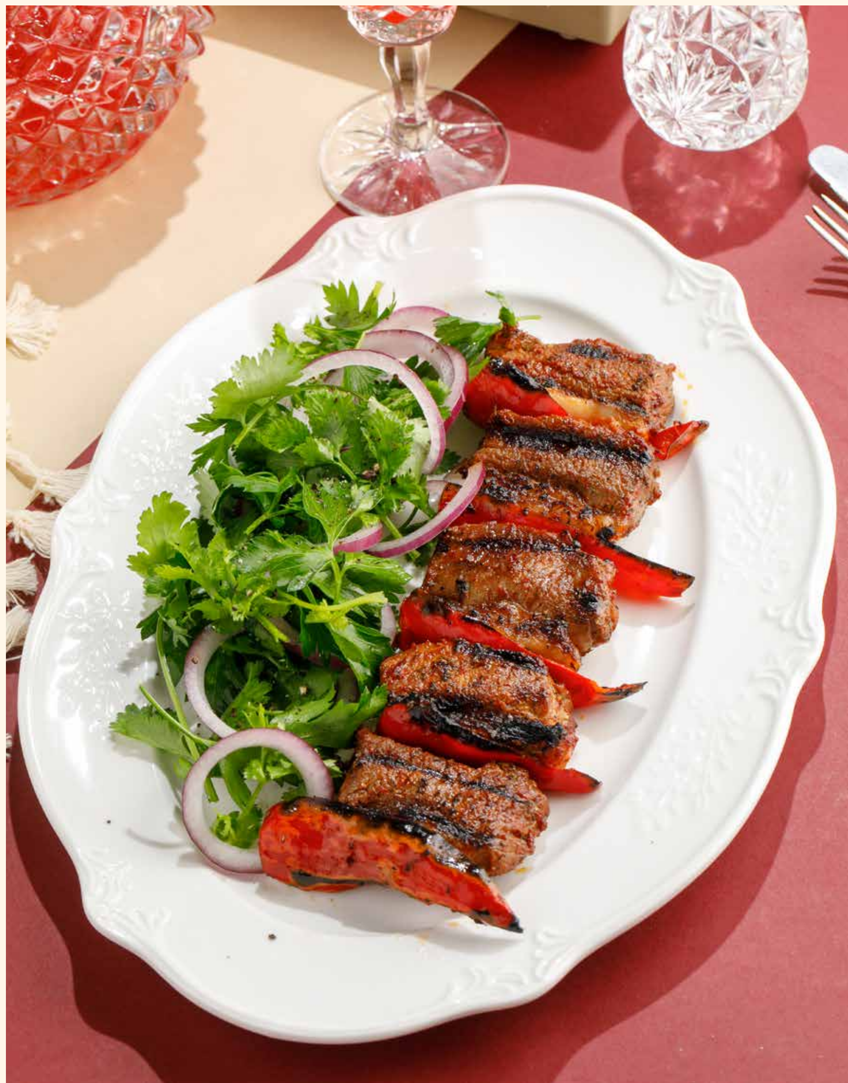
СЕДЛО ЯГНЕНКА С АРОМАТНОЙ ЗЕЛЕНЬЮ