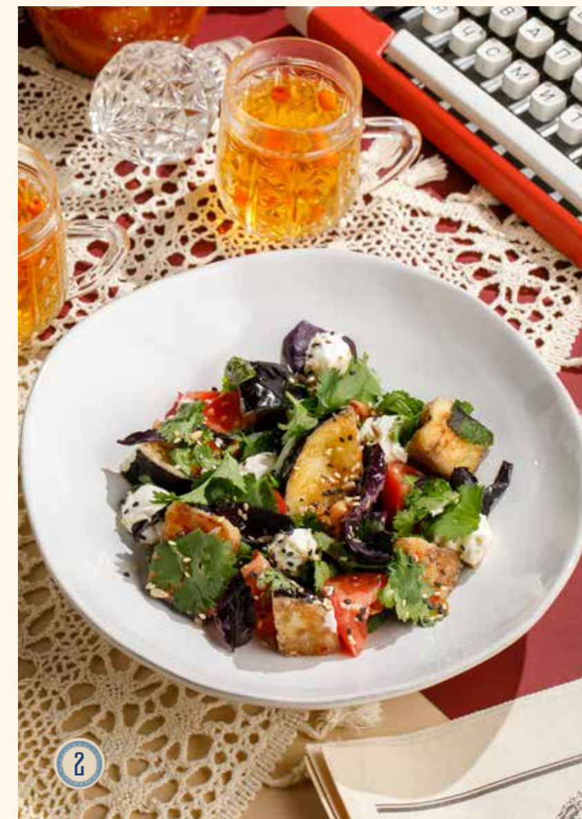
2 САЛАТ С ХРУСТЯЩИМИ БАКЛАЖАНАМИ 790 Р