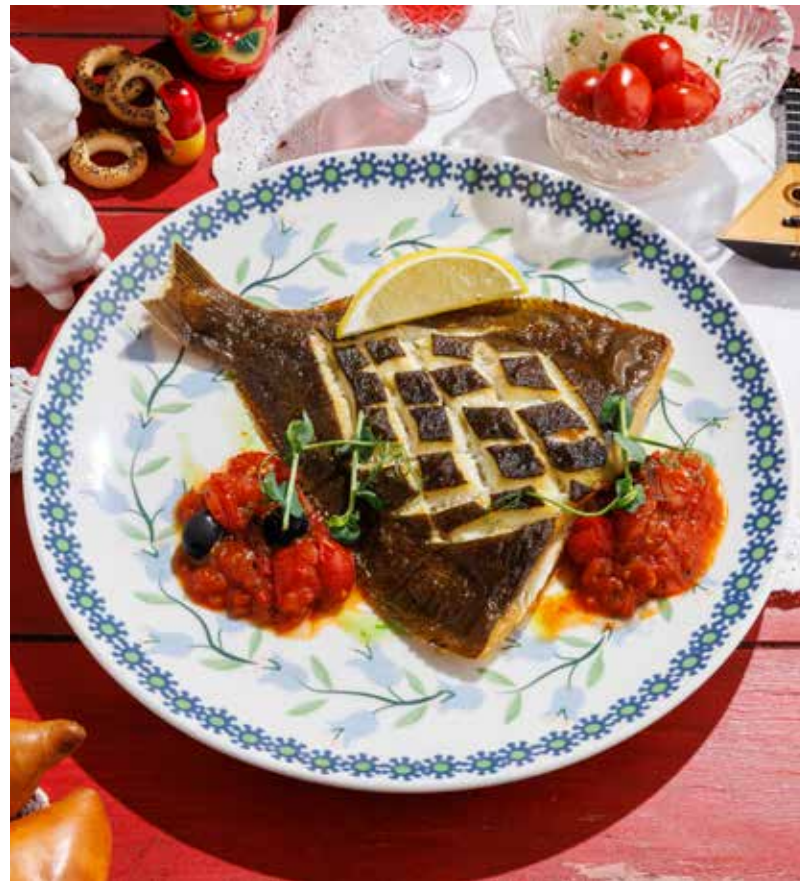
КАМБАЛА С ТОМАТНОЙ САЛЬСОЙ FLOUNDER WITH TOMATO SALSA 番茄沙司比目魚