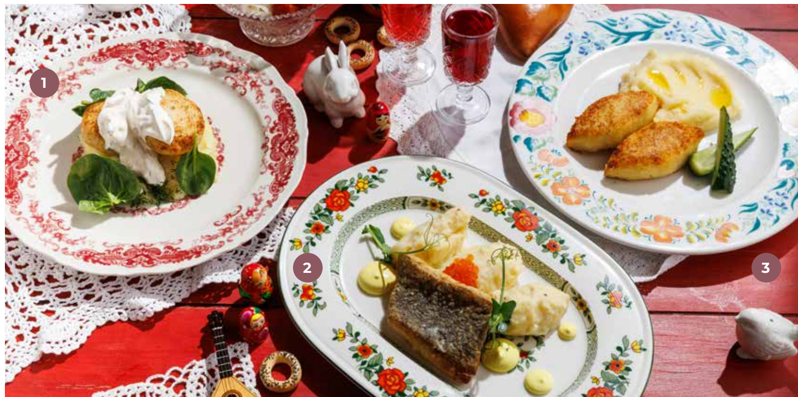
① ЩУЧЬИ КОТЛЕТЫ 790 Р с мятым картофелем и шпинатом PIKE PATTIES WITH SMASHED POTATOES AND SPINACH 狗鱼肉饼搭配烤土豆和菠菜