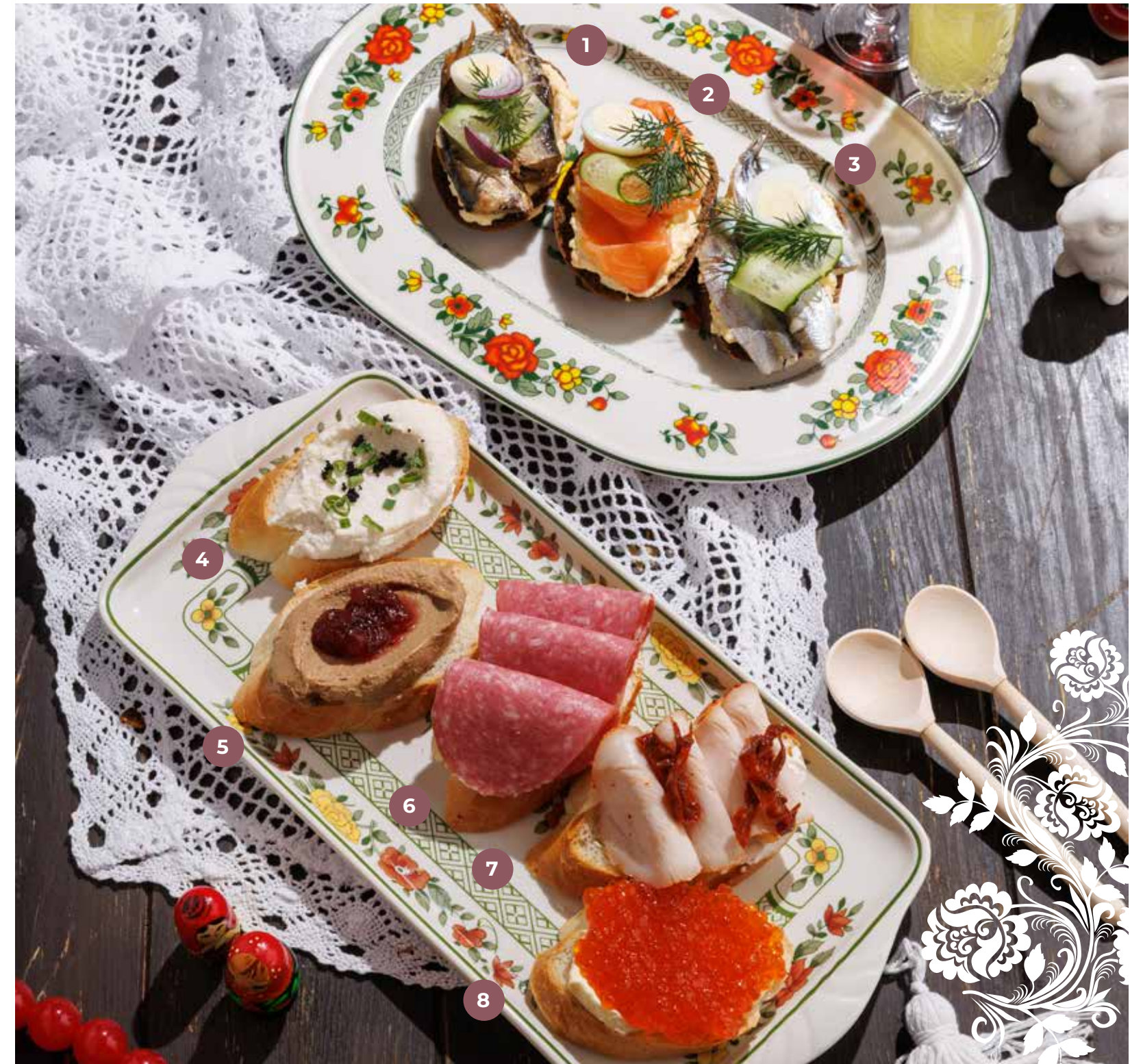
БУТЕРБРОД SANDWICH | 三明治