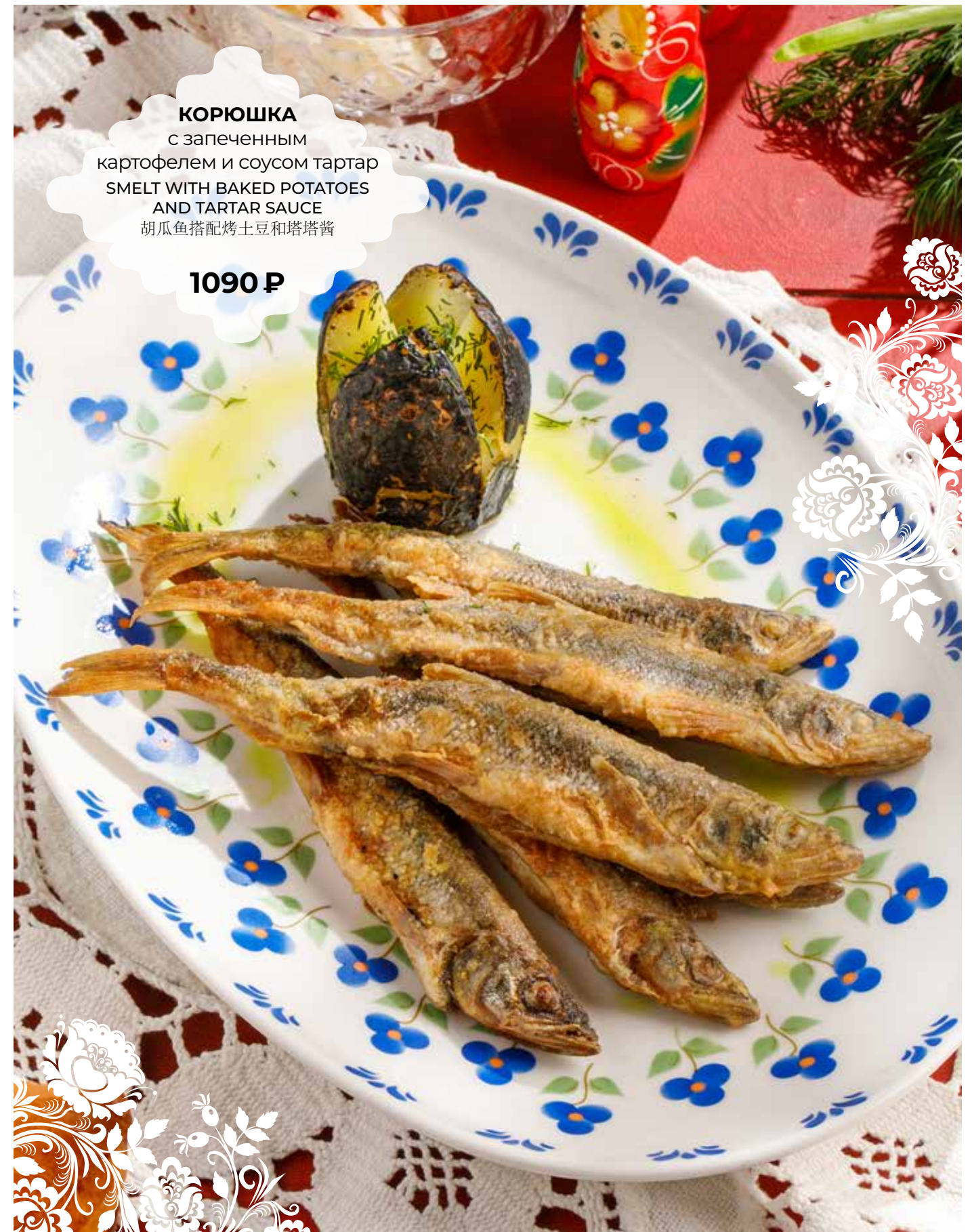
КОРЮШКА с запеченным картофелем и соусом тартар SMELT WITH BAKED POTATOES AND TARTAR SAUCE 胡瓜鱼搭配烤土豆和塔塔酱