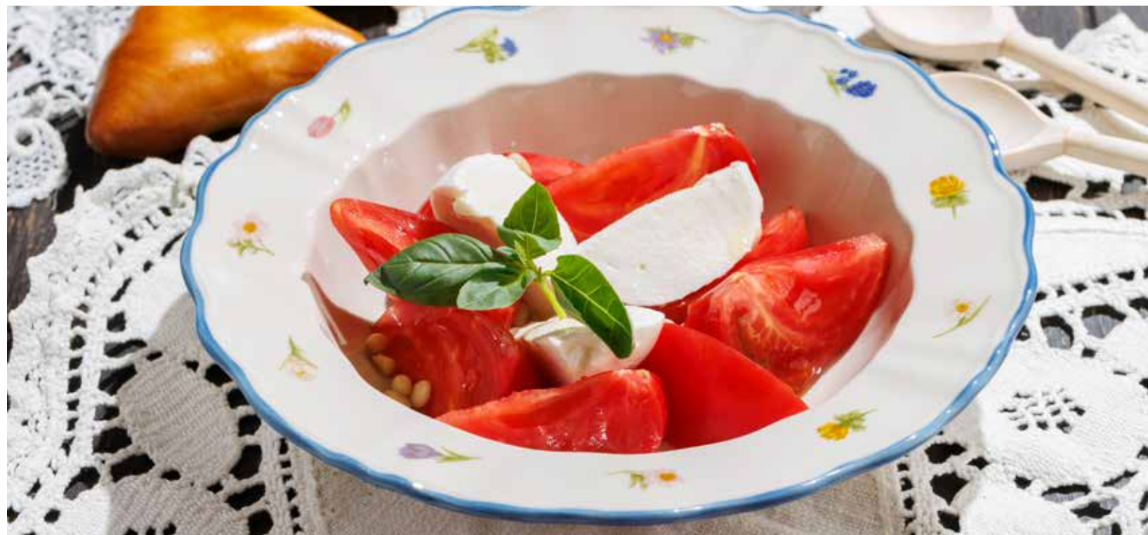
МОЦАРЕЛЛА С ТОМАТАМИ MOZZARELLA WITH TOMATOES | 马苏里拉起司配番茄