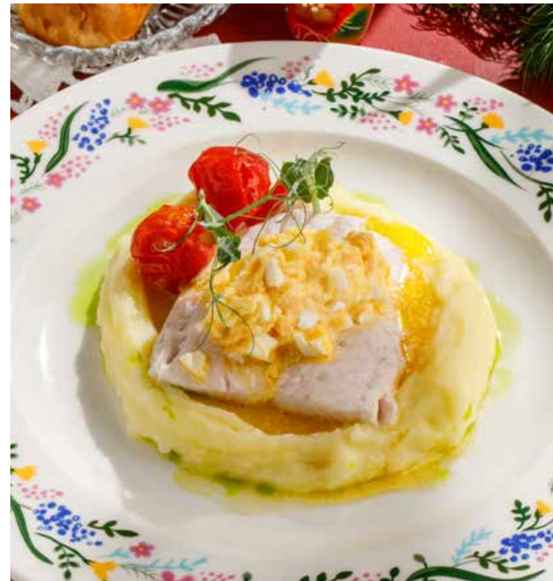
ФИЛЕ СУДАКА ПО-ПОЛЬСКИ С КАРТОФЕЛЬНЫМ ПЮРЕ POLISH-STYLE PIKE PERCH FILLET WITH MASHED POTATOES 波兰风味梭鲈排搭配土豆泥