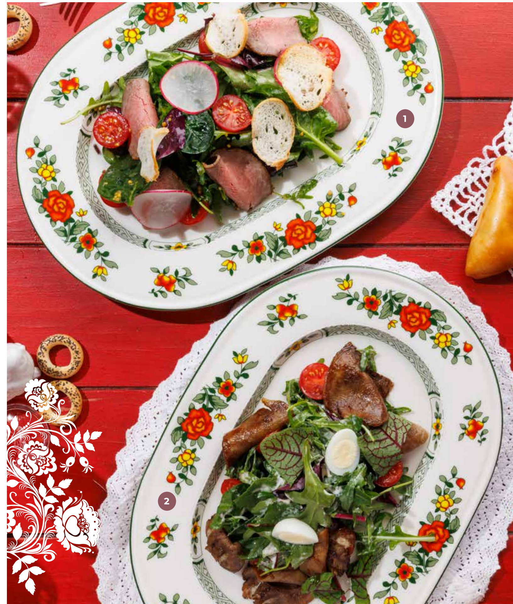
① САЛАТ С РОСТБИФОМ ROAST BEEF SALAD 烤牛肉沙拉