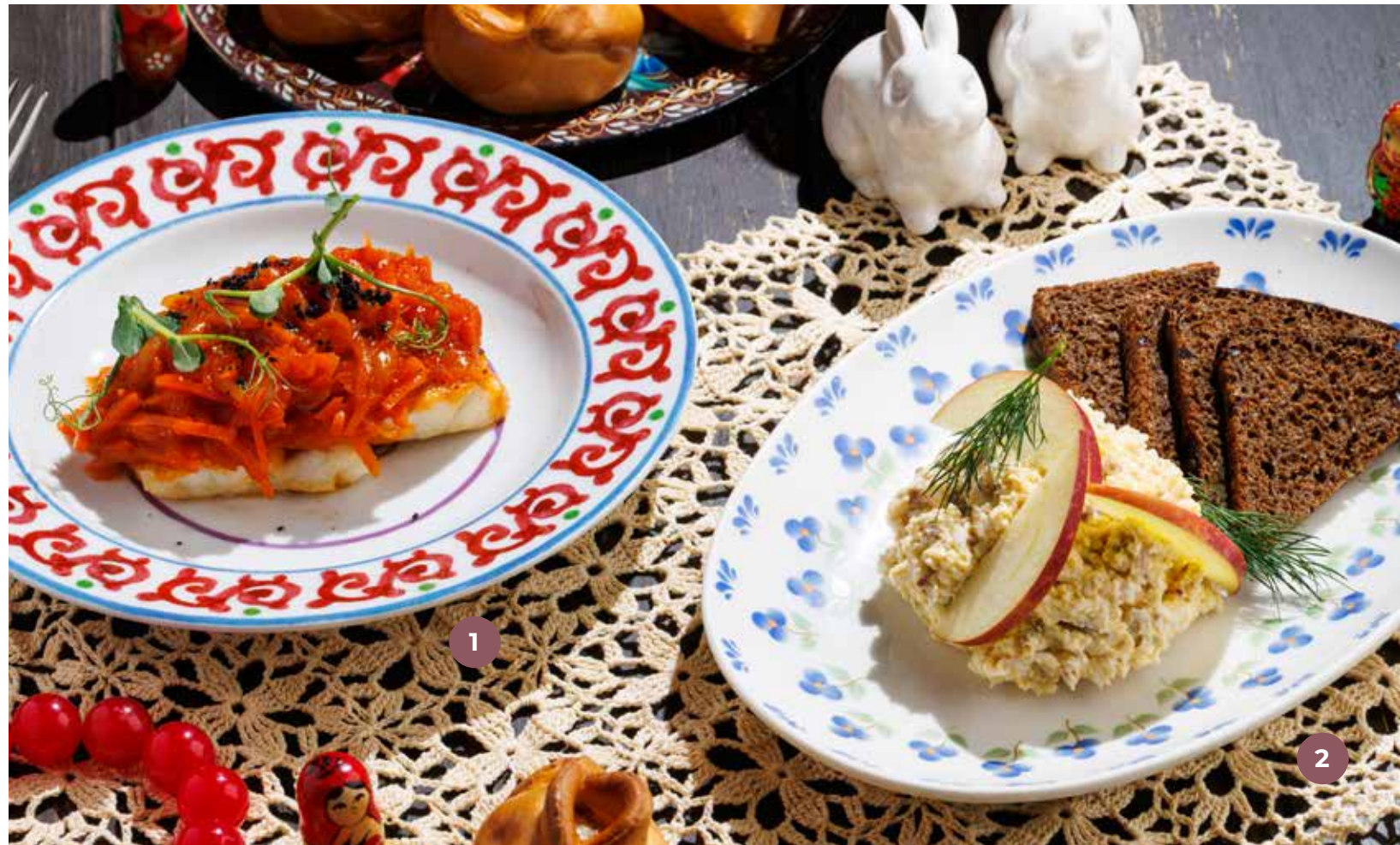
① ТРЕСКА ПОД МАРИНАДОМ COD WITH MARINADE 腌料下的鳕鱼