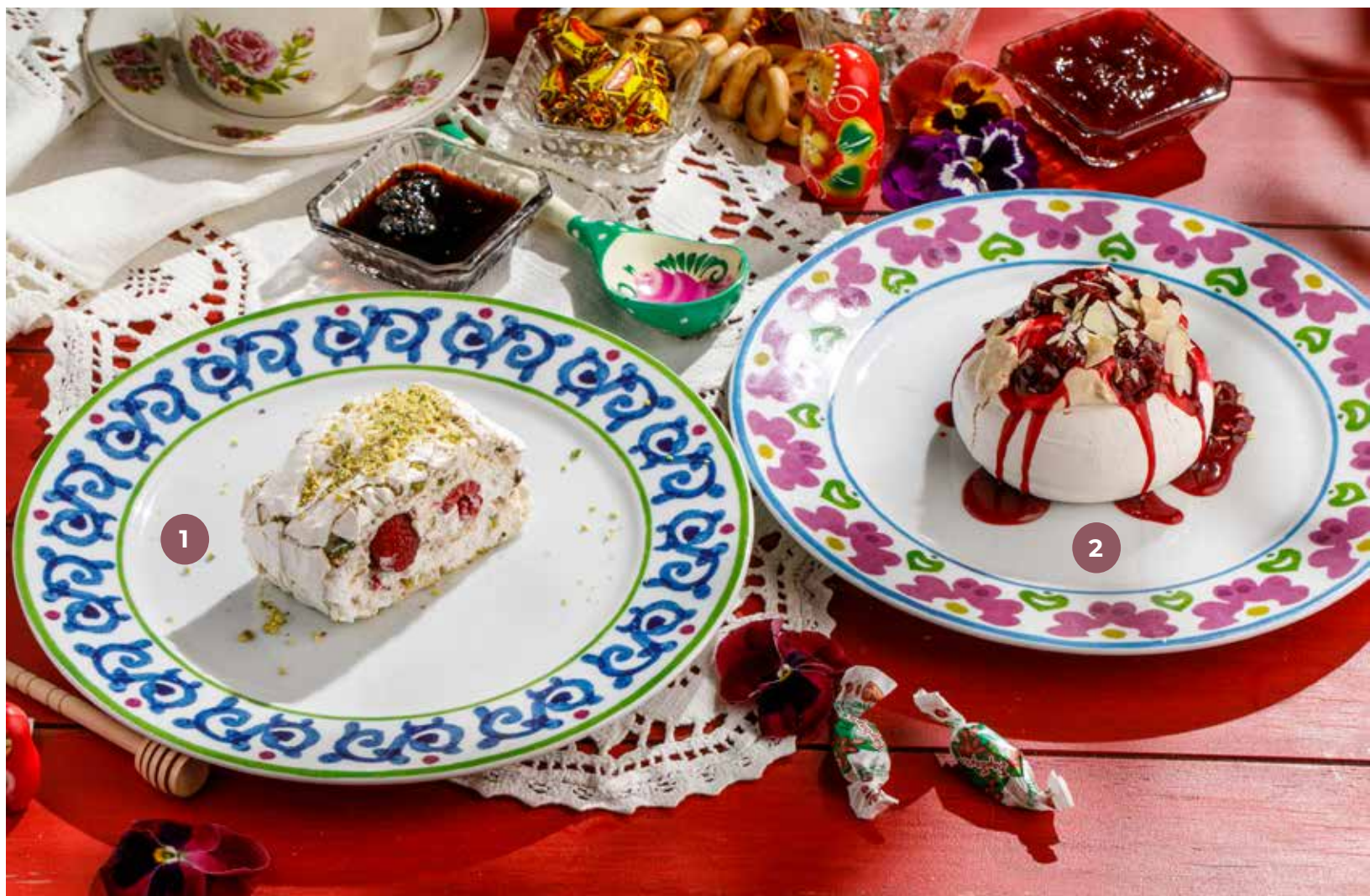
① ФИСТАШКОВЫЙ РУЛЕТ PISTACHIO ROLL | 开心果卷