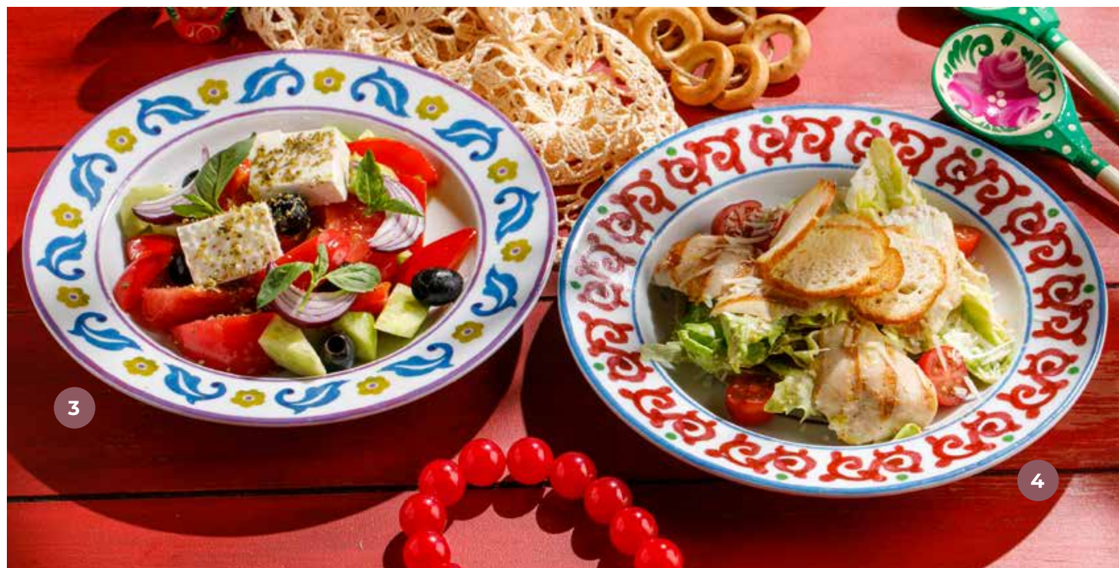
③ ОВОЩНОЙ САЛАТ С БРЫНЗОЙ VEGETABLE SALAD WITH BRYNDZA 奶酪蔬菜沙拉