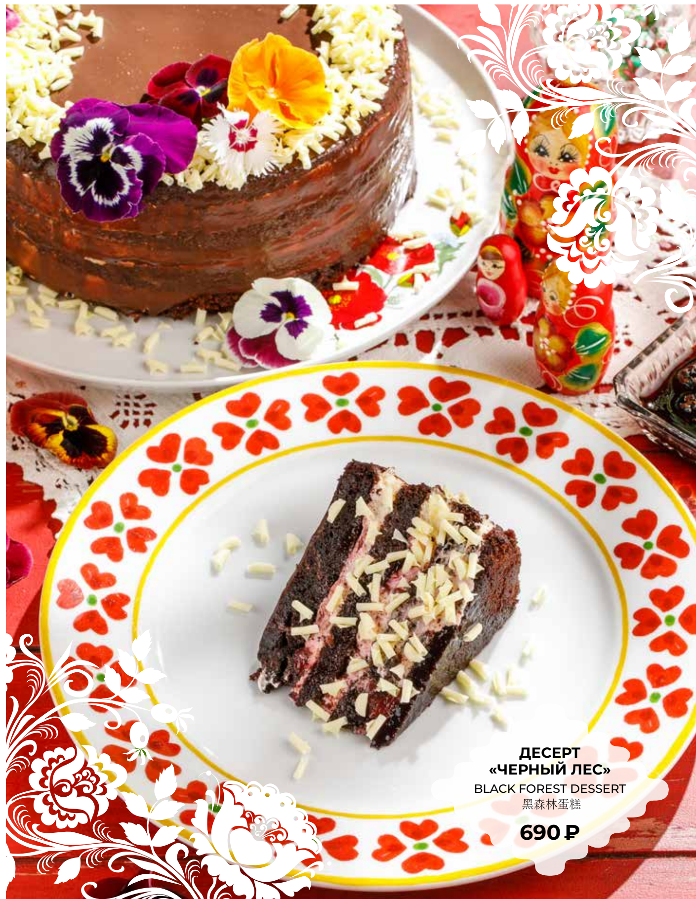
ДЕСЕРТ «ЧЕРНЫЙ ЛЕС» BLACK FOREST DESSERT 黑森林蛋糕