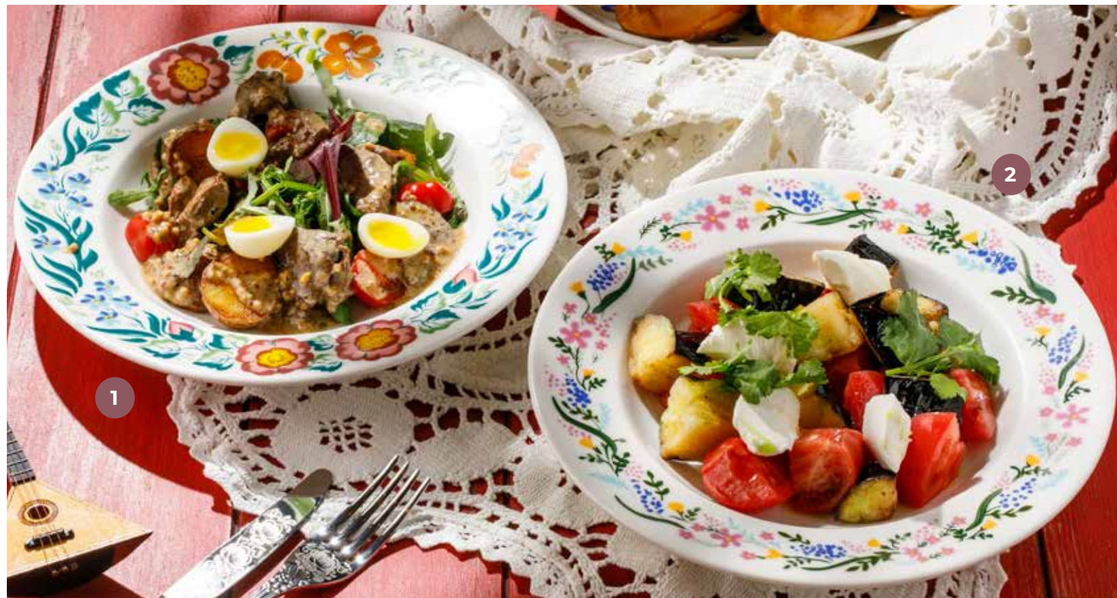
① САЛАТ С ПЕЧЕНЬЮ ЦЫПЛЕНКА CHICKEN LIVER SALAD 雞肝沙拉