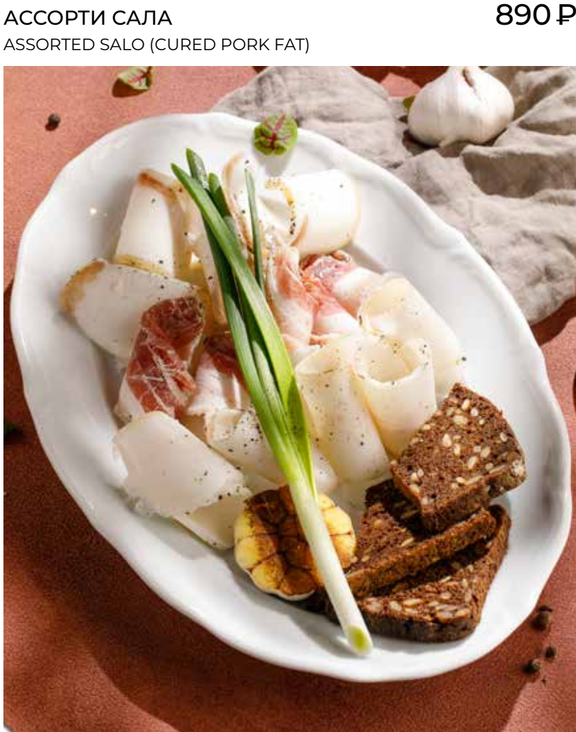
АССОРТИ САЛА ASSORTED SALO (CURED PORK FAT)