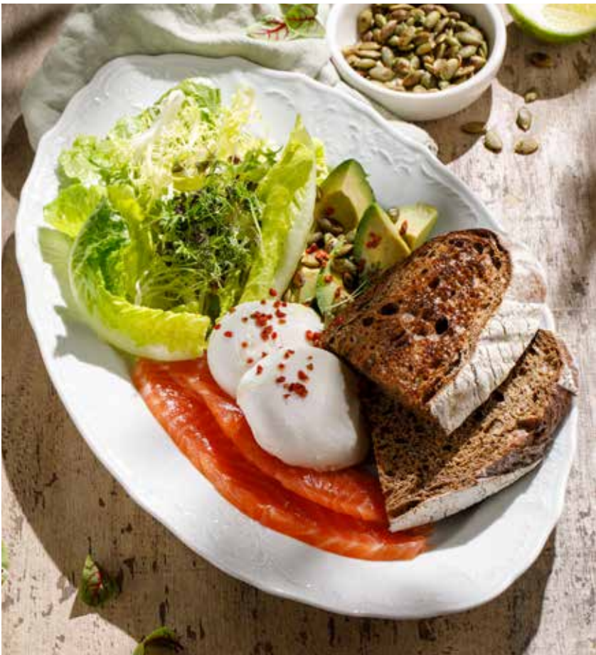
ЗЕЛЕНЫЙ ЗАВТРАК GREEN BREAKFAST