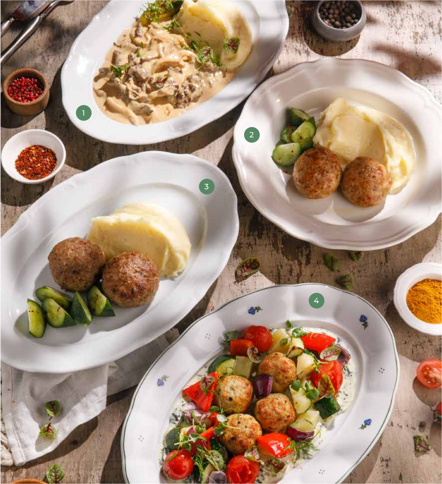
① БЕФСТРОГАНОВ С КАРТОФЕЛЬНЫМ ПЮРЕ BEEF STROGANOFF WITH MASHED POTATOES 1350 Р