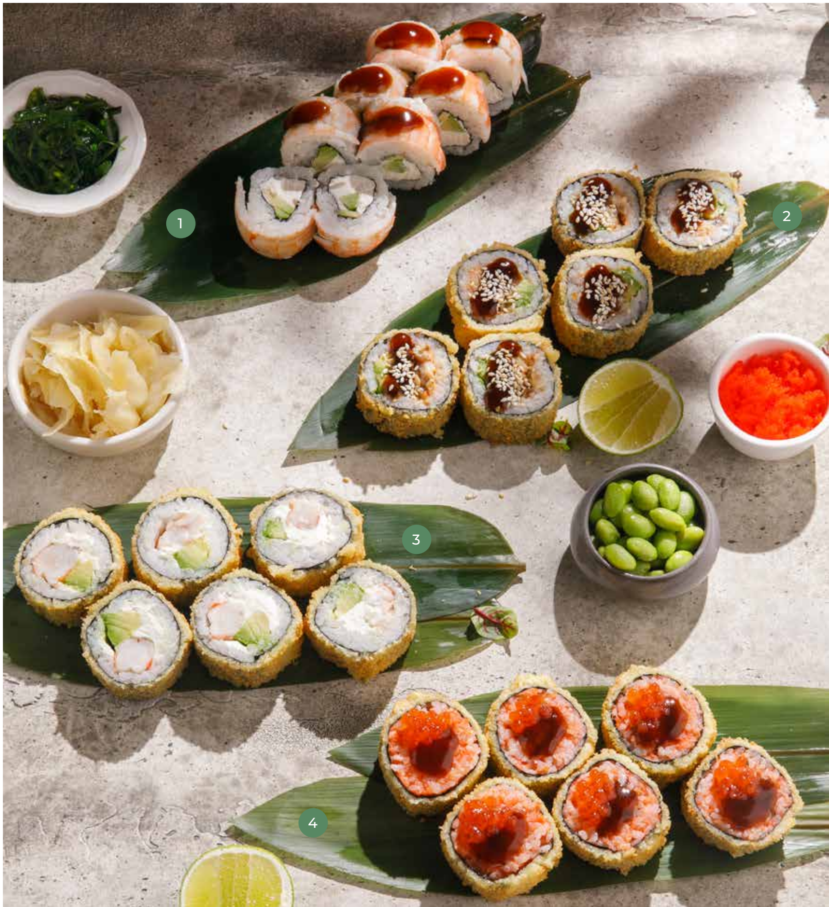
① ФИЛАДЕЛЬФИЯ С КРЕВЕТКОЙ И УНАГИ СОУСОМ SHRIMP PHILADELPHIA ROLL WITH UNAGI SAUCE