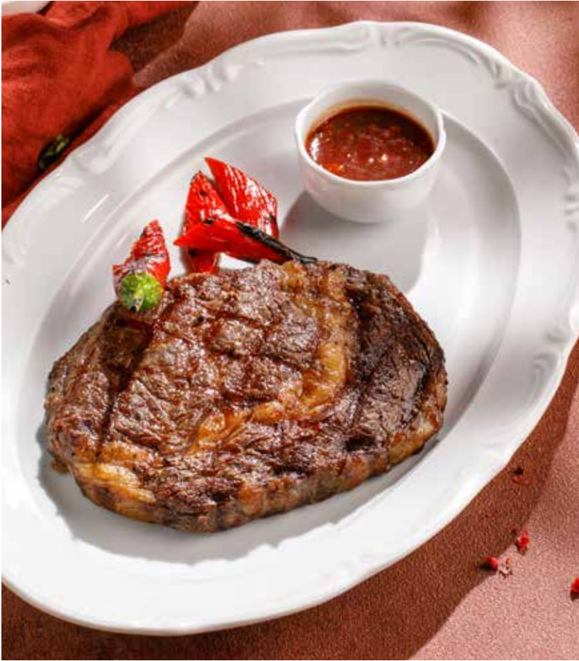
СТЕЙК РИБАЙ RIB EYE STEAK