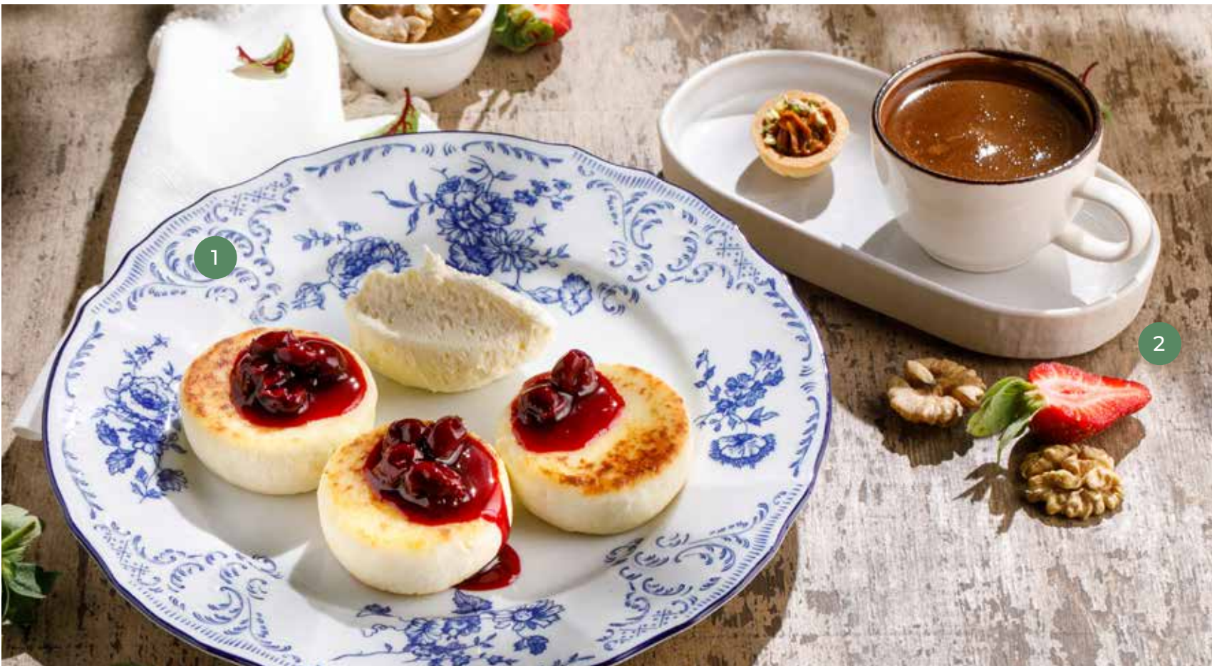
③ СЫРНИКИ С МУССОМ ИЗ БЕЛОГО ШОКОЛАДА COTTAGE CHEESE PANCAKES WITH WHITE CHOCOLATE MOUSSE