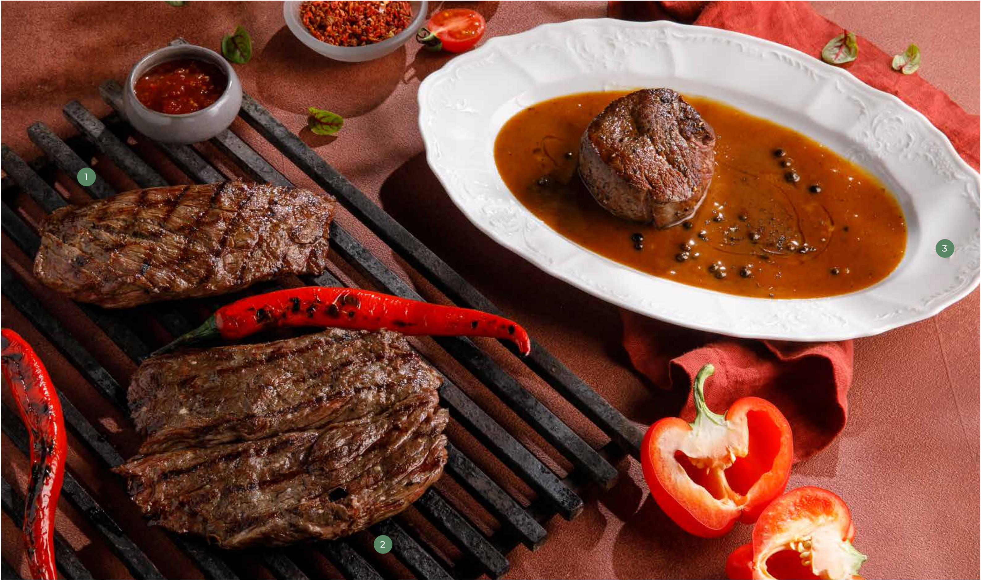
① БАВЕТ BAVETTE STEAK