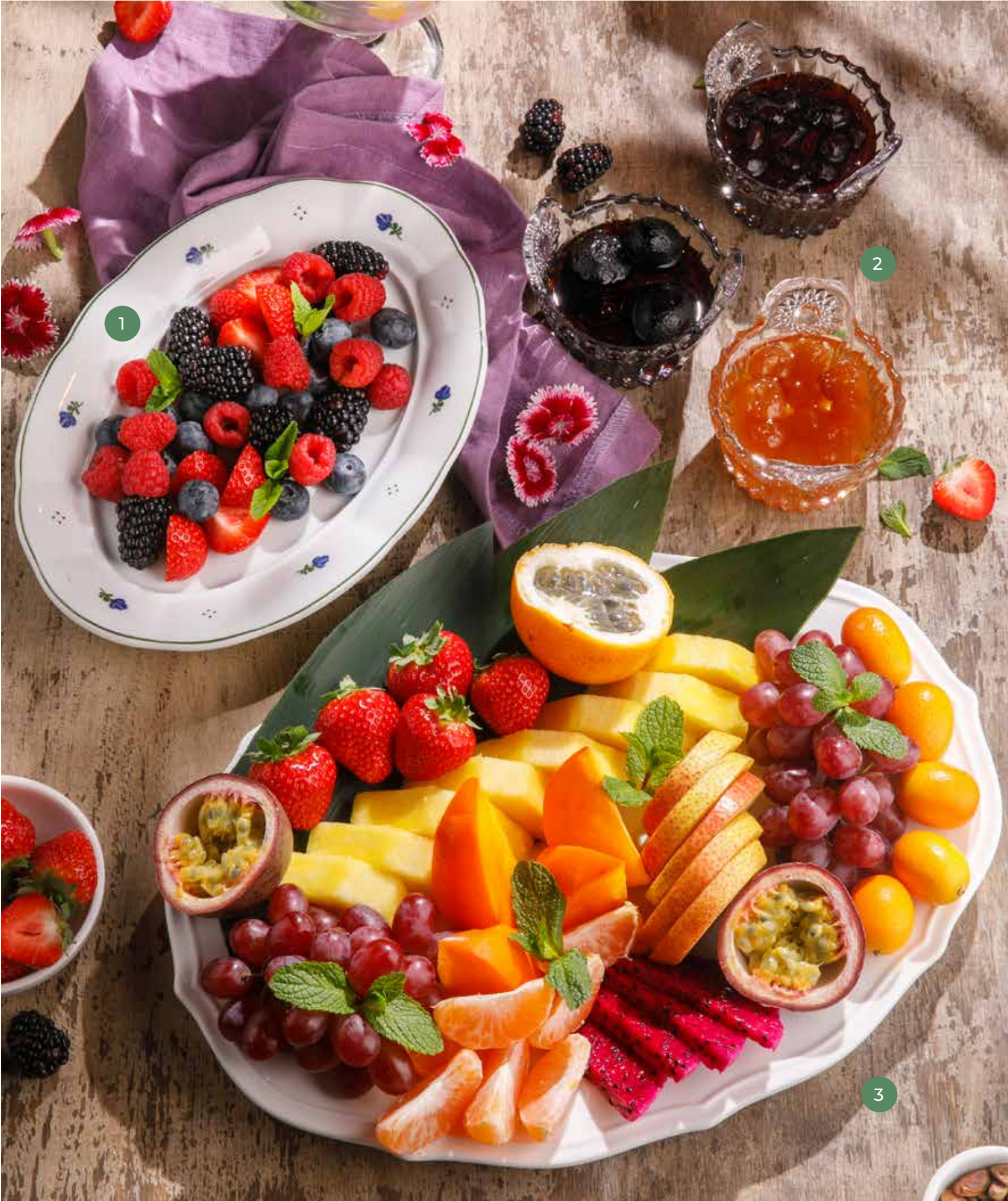
① СЕЗОННЫЕ ЯГОДЫ SEASONAL BERRIES