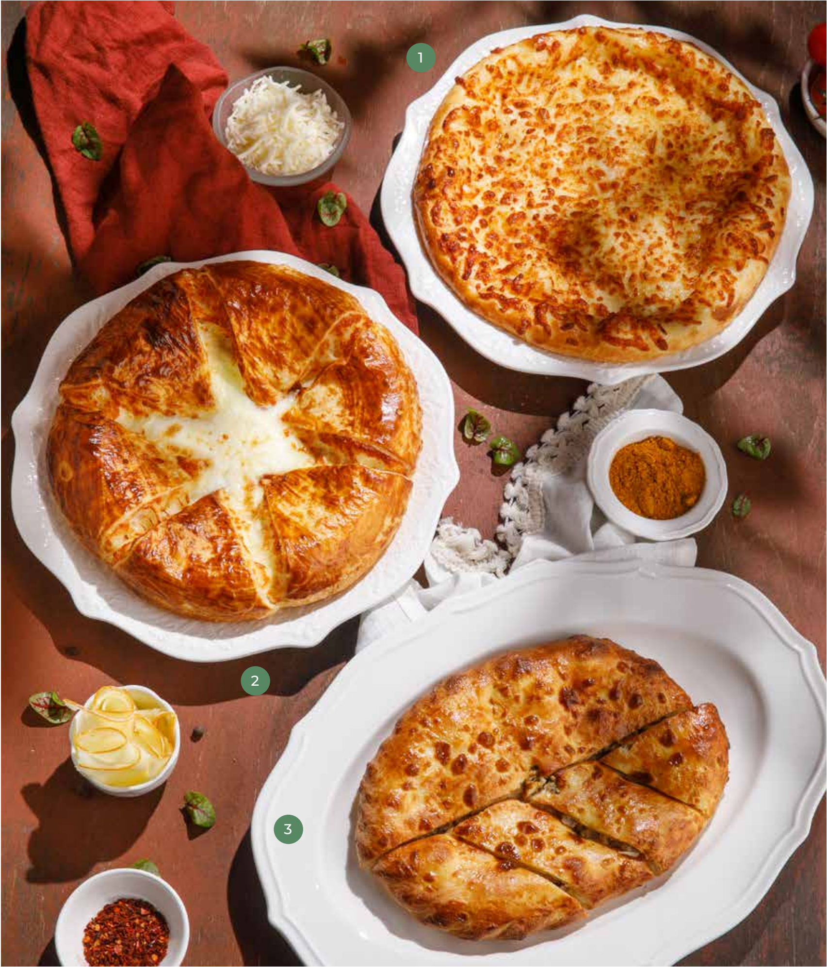
① ХАЧАПУРИ ПО-МЕГРЕЛЬСКИ MEGRELIAN KHACHAPURI