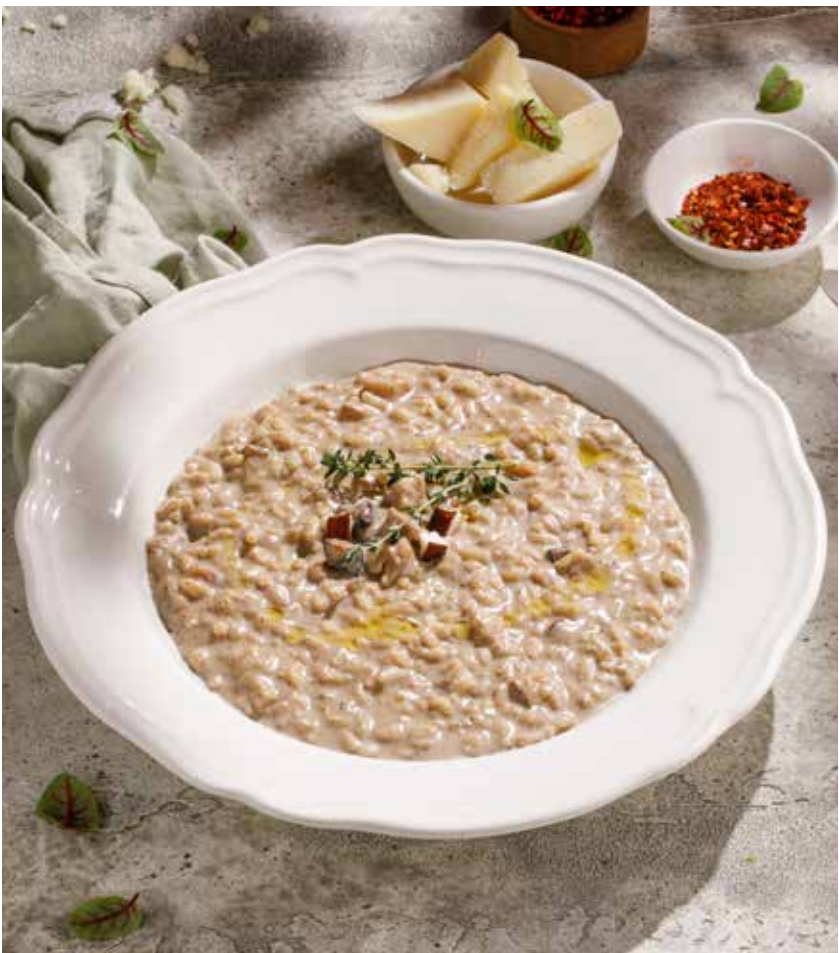
РИЗОТТО С БЕЛЫМИ ГРИБАМИ PORCINI MUSHROOM RISOTTO