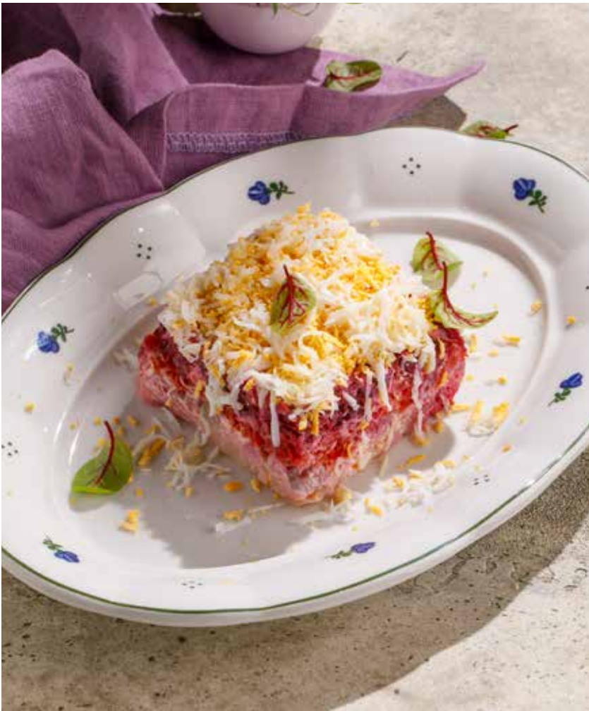
СЕЛЬДЬ ПОД ШУБОЙ DRESSED HERRING