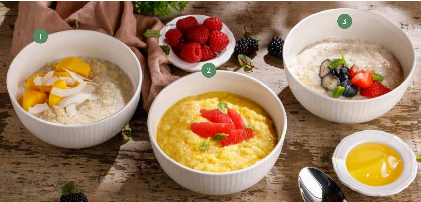
① КИНОА НА КОКОСОВОМ МОЛОКЕ QUINOA PORRIDGE ON COCONUT MILK