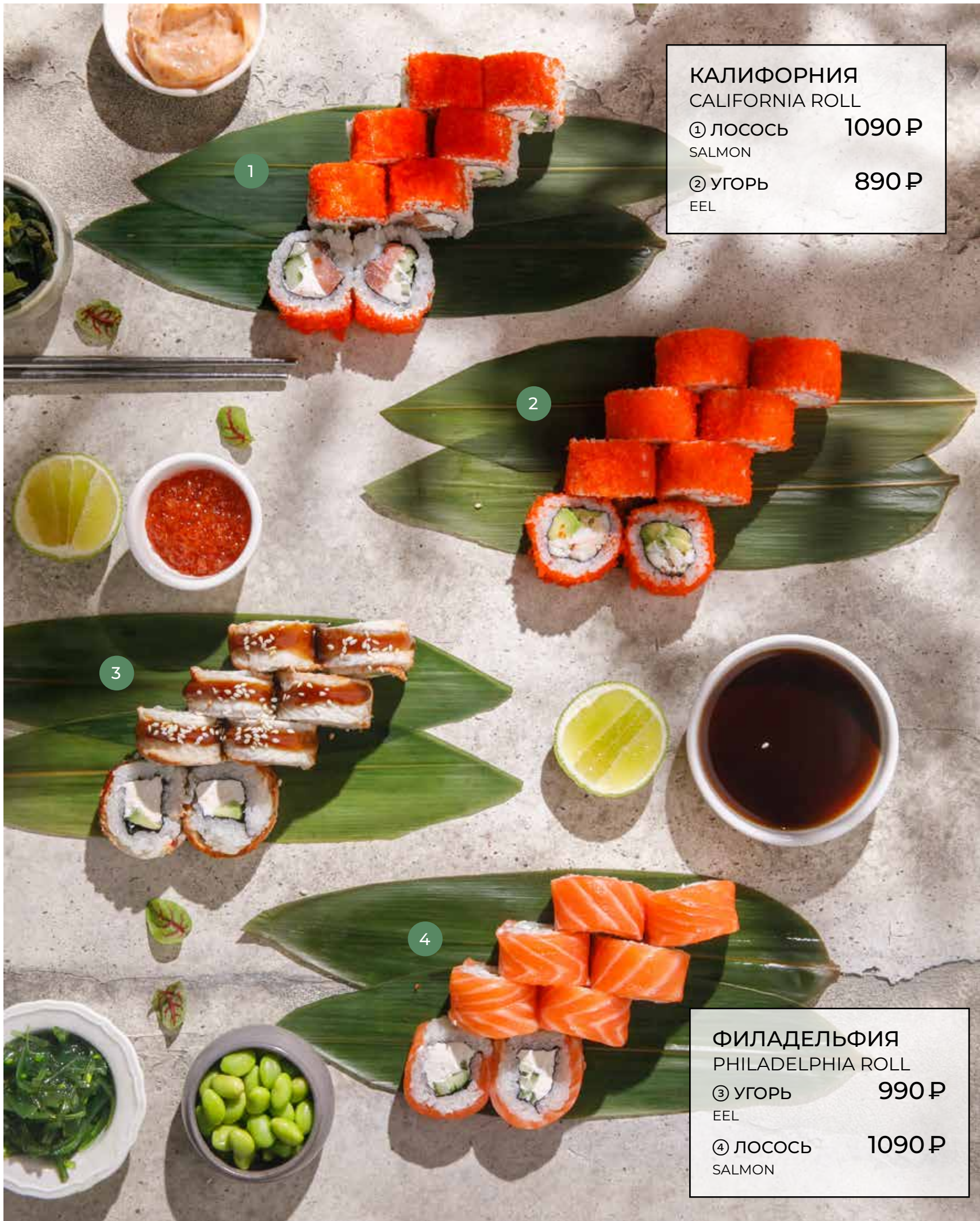
КАЛИФОРНИЯ CALIFORNIA ROLL ① ЛОСОСЬ 1090 Р SALMON ② УГОРЬ 890 Р EEL