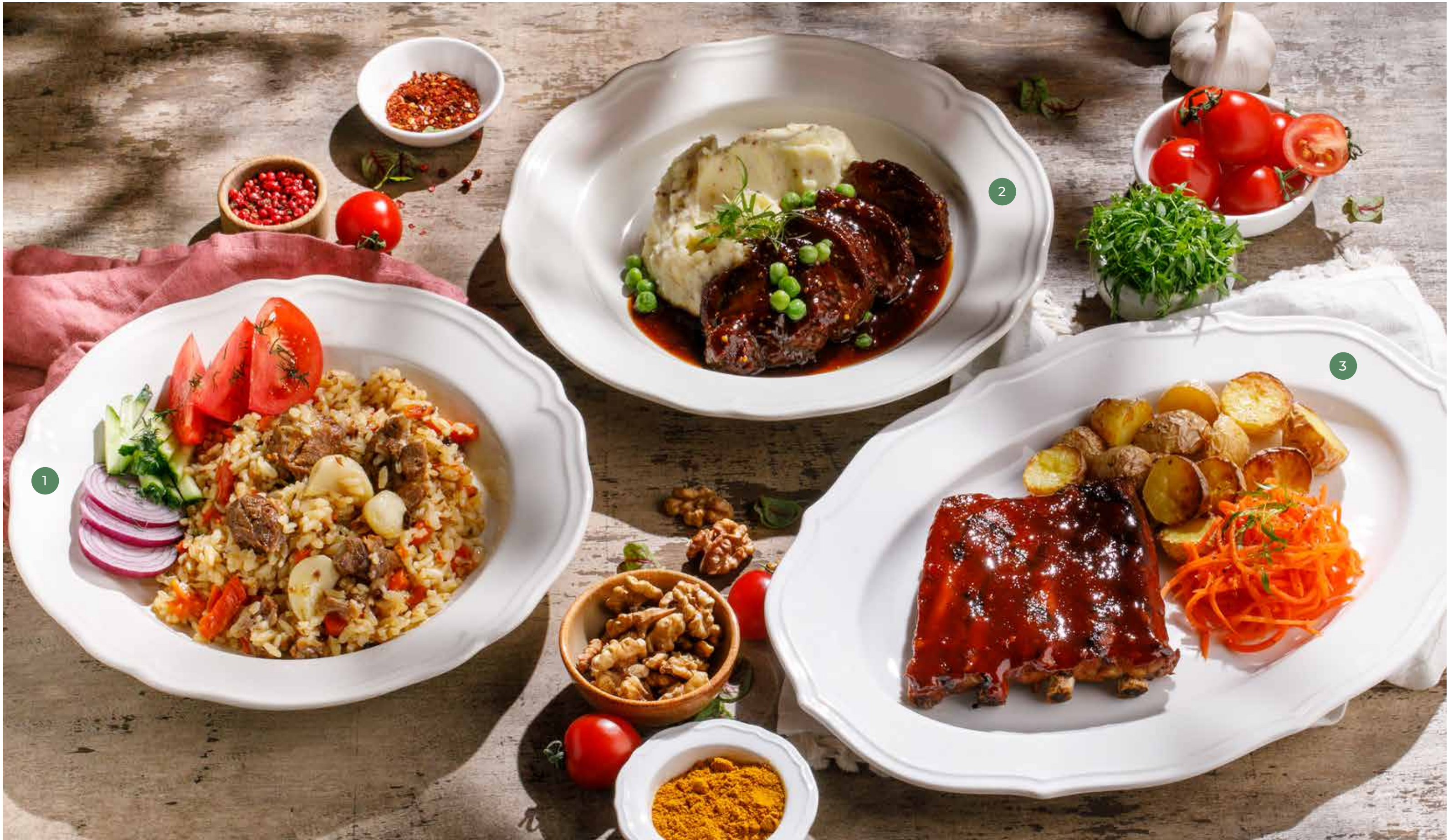
① ПЛОВ С БАРАНИНОЙ И ОВОЩАМИ LAMB PILAF WITH VEGETABLES