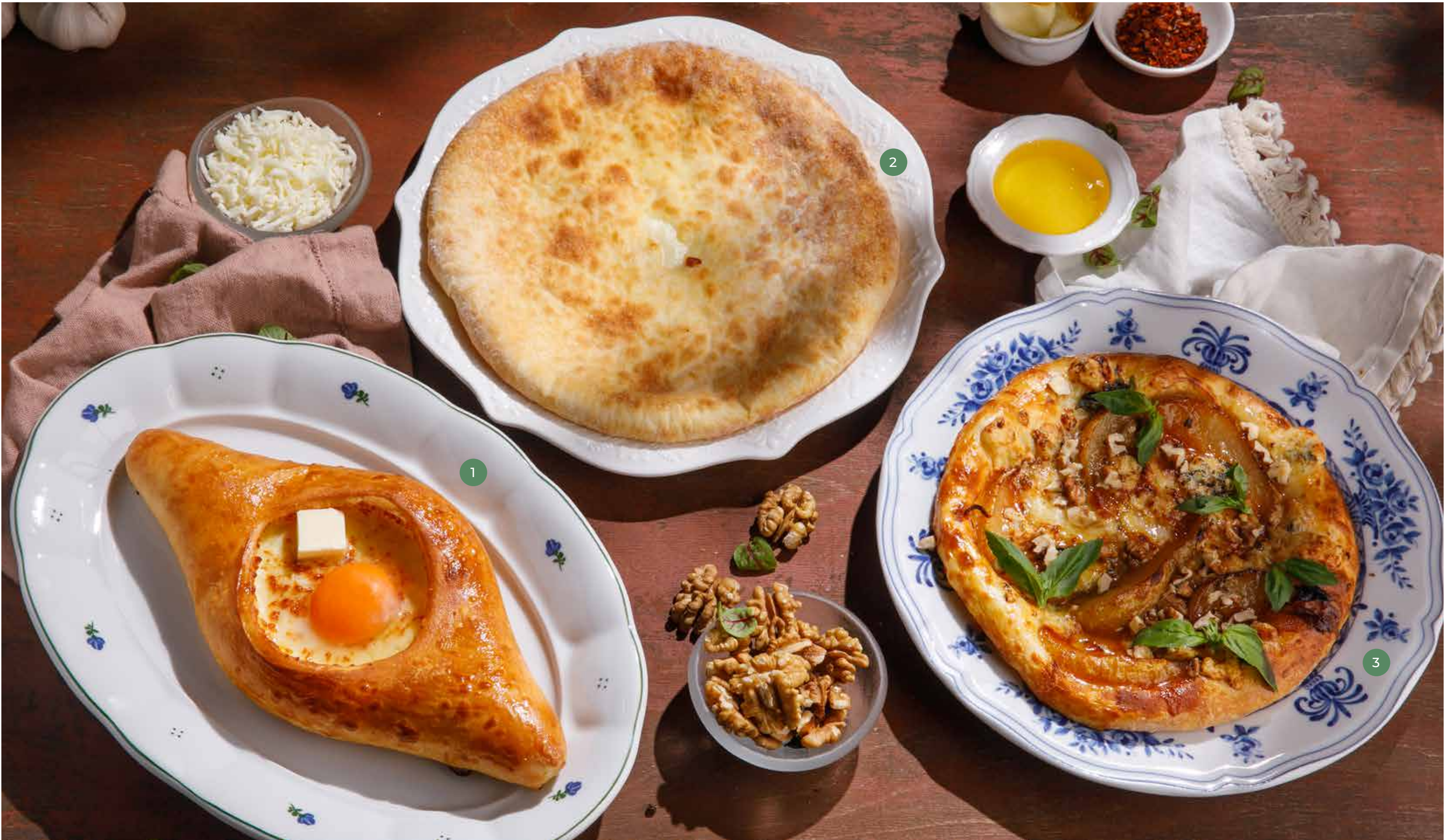
① ХАЧАПУРИ ПО-АДЖАРСКИ ADJARIAN KHACHAPURI

ПРОСЬБА ПРЕДУПРЕЖДАТЬ ВАШЕГО ОФИЦИАНТА ОБ ИМЕЮЩЕЙСЯ У ВАС АЛЛЕРГИИ НА ОПРЕДЕЛЕННЫЕ ПРОДУКТЫ ПИТАНИЯ. ВСЕ ЦЕНЫ УКАЗАНЫ В РУБЛЯХ. НА ФОТО ИСПОЛЬЗОВАНЫ ЭЛЕМЕНТЫ ДЕКОРА. PLEASE, TELL YOUR WAITER IF YOU HAVE ANY FOOD ALLERGY TO CERTAIN PRODUCTS. ALL PRICES ARE IN RUBLES. THE PICTURES HAVE DECORATIVE ELEMENTS