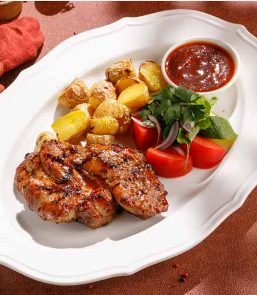
ОТБИВНАЯ ИЗ СВИНИНЫ PORK CHOP