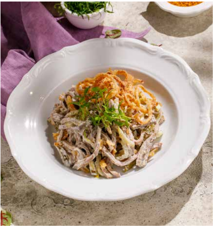
САЛАТ С ГОВЯЖЬИМ ЯЗЫКОМ И ЛУКОМ ФРИ SALAD WITH BOILED BEEF TONGUE AND FRENCH FRIED ONIONS