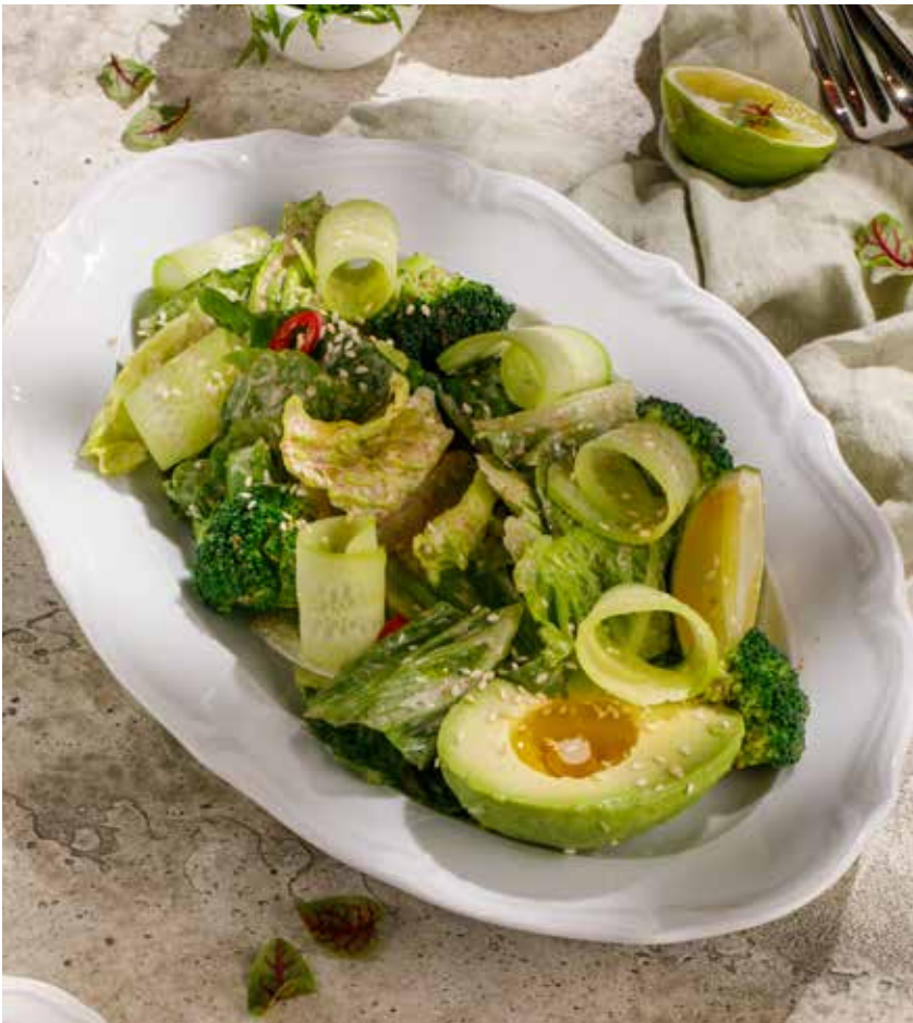
САЛАТ С АВОКАДО, листьями ромейна и ореховым соусом AVOCADO SALAD WITH ROMAINE AND NUT SAUCE