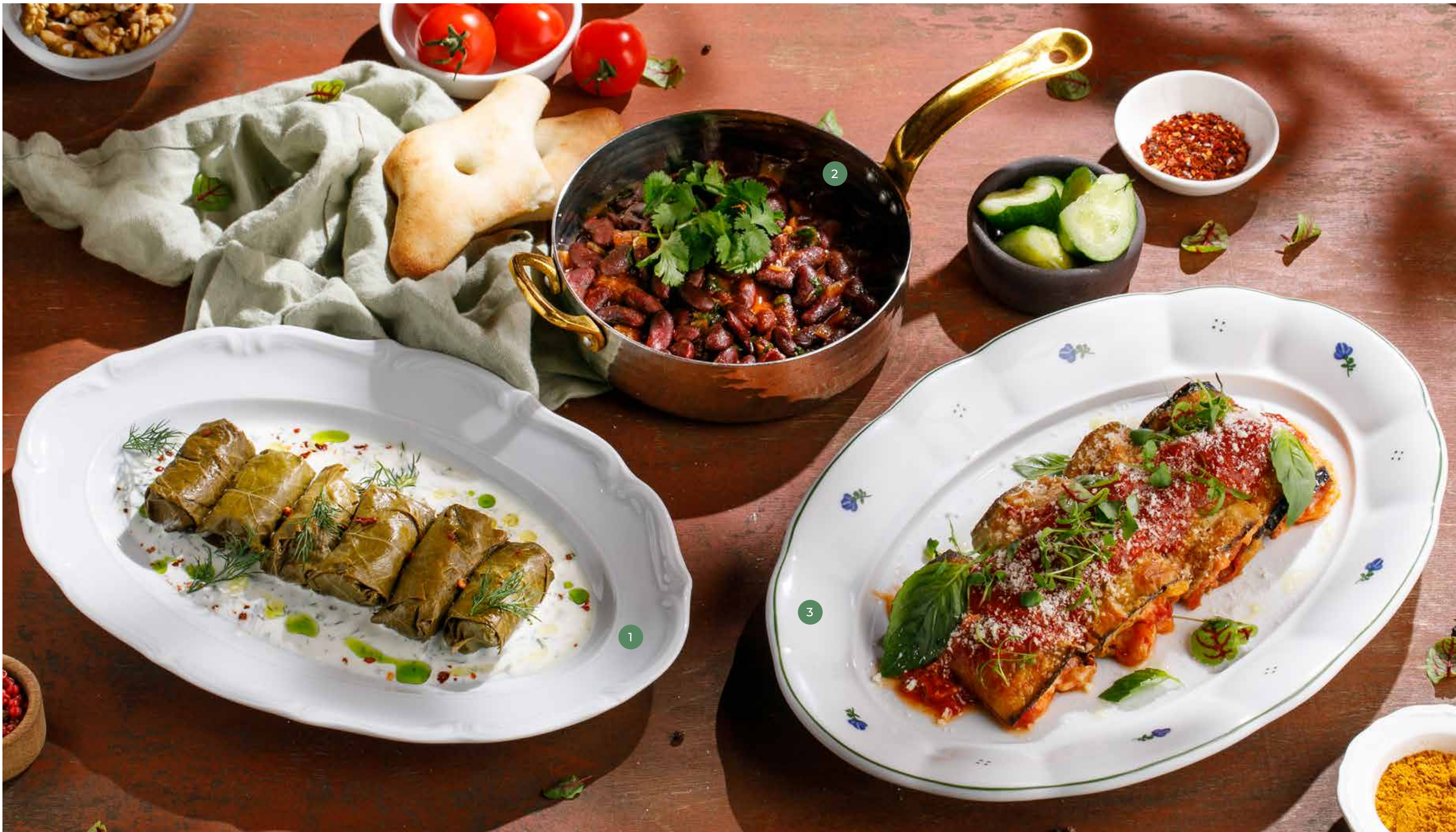
① ДОЛМА С БАРАНИНОЙ LAMB DOLMA