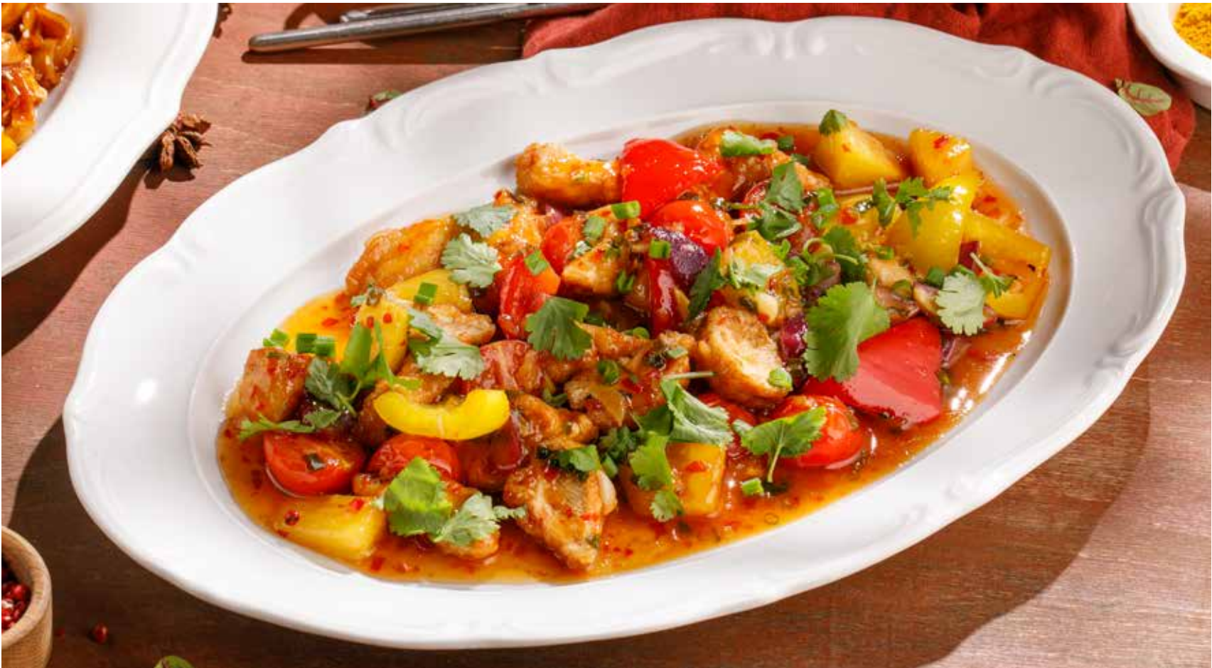
КУРИЦА С АНАНАСАМИ PINEAPPLE CHICKEN