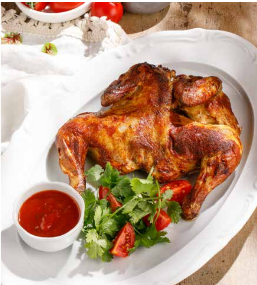
ФЕРМЕРСКИЙ ЦЫПЛЕНОК С АДЖИКОЙ FARM CHICKEN WITH ADJIKA