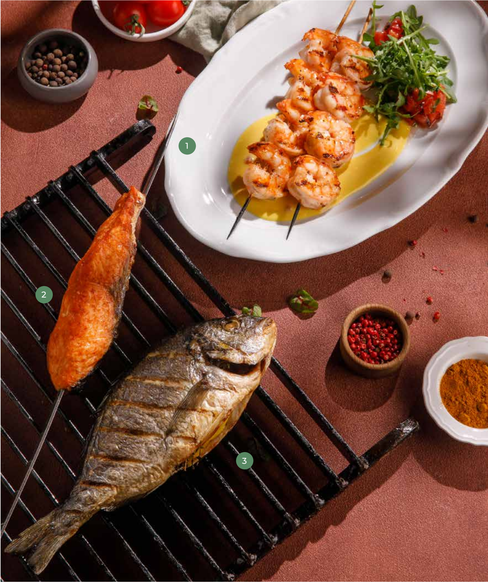
① КРЕВЕТКИ НА ГРИЛЕ GRILLED SHRIMP