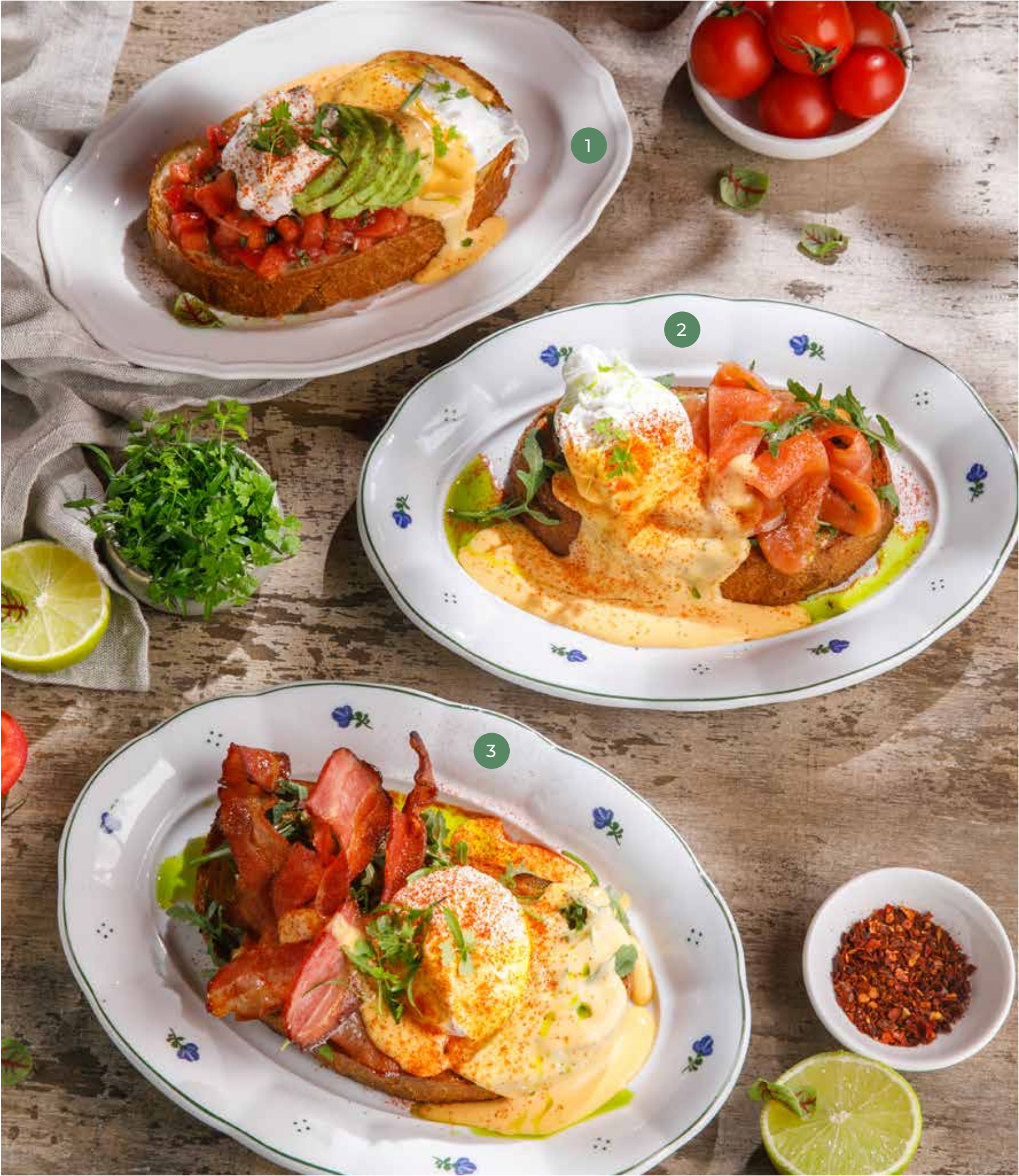
① ЯЙЦО БЕНЕДИКТ С АВОКАДО И СТРАЧАТЕЛЛОЙ EGG BENEDICT WITH AVOCADO AND STRACCIATELLA