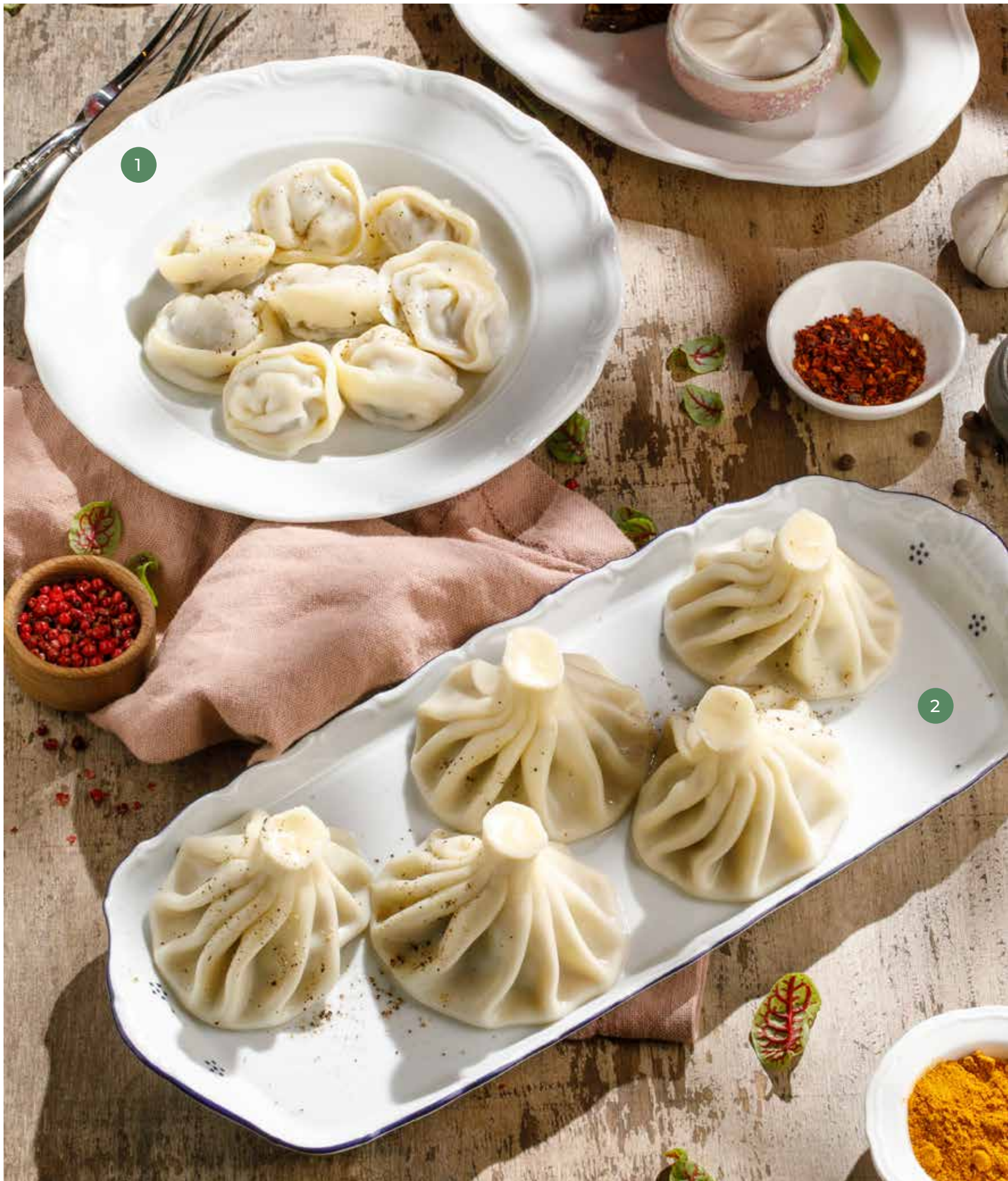
① СИБИРСКИЕ ПЕЛЬМЕНИ SIBERIAN DUMPLINGS