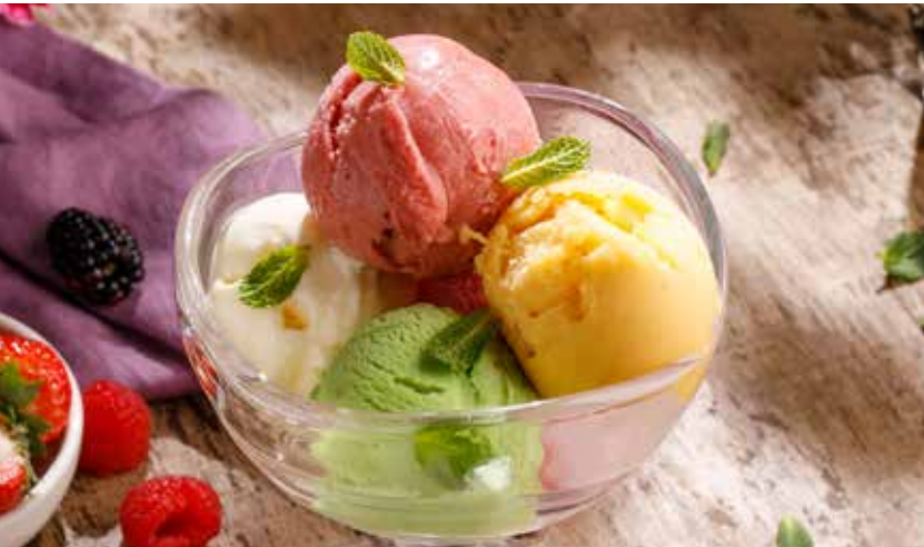
МОРОЖЕНОЕ / СОРБЕТ в ассортименте ASSORTED ICE CREAM / SORBET