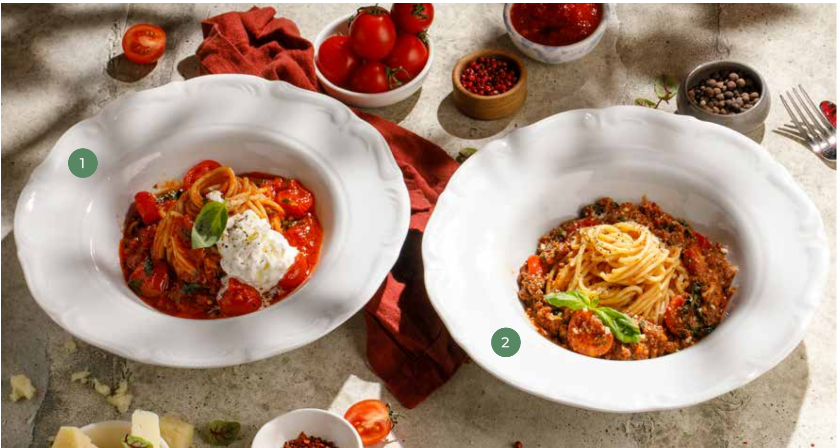
① СПАГЕТТИ «ПОМИДОРНИ» СО СТРАЧАТЕЛЛОЙ SPAGHETTI POMODORINI WITH STRACCIATELLA