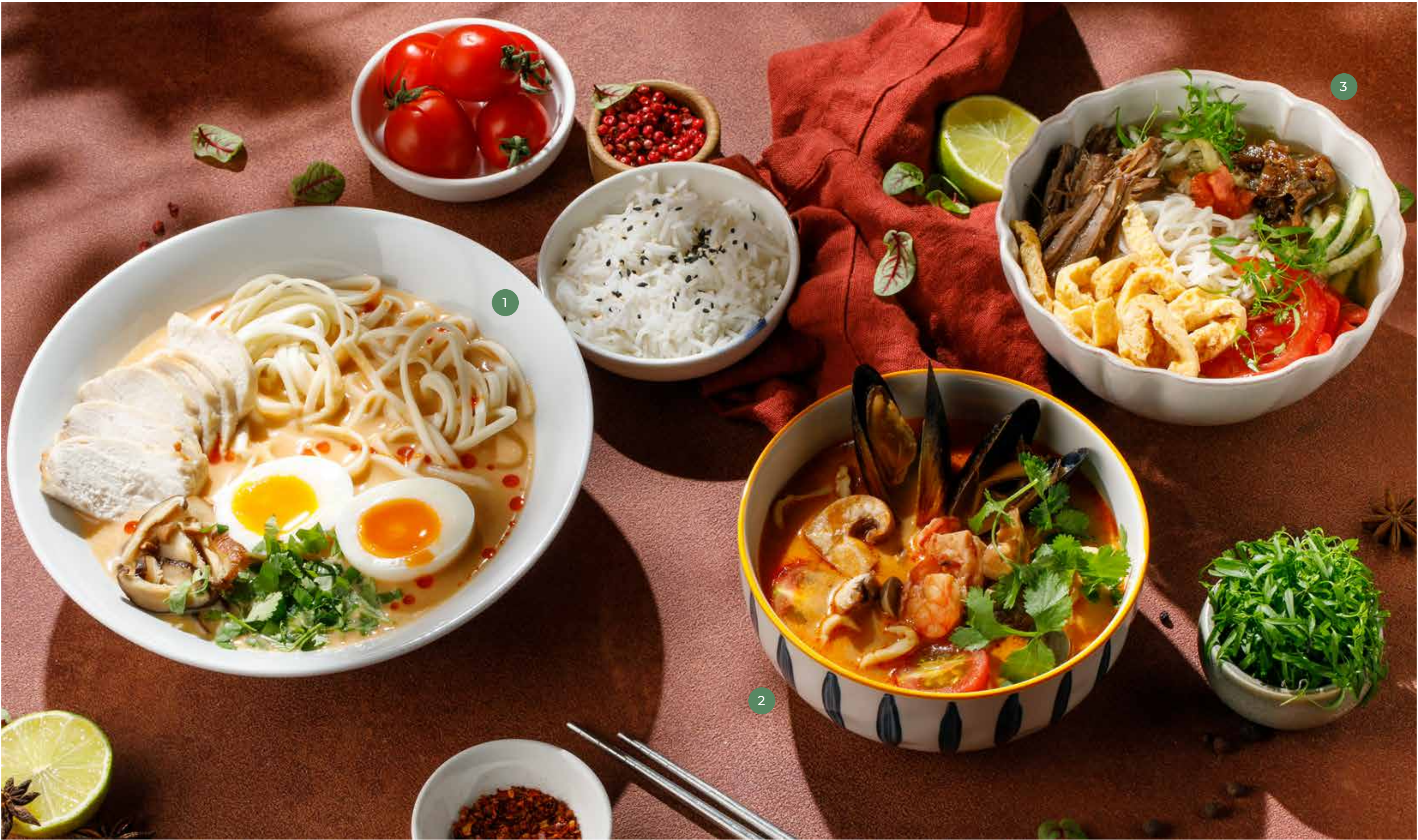
① РАМЕН С КУРИЦЕЙ CHICKEN RAMEN

ПРОСЬБА ПРЕДУПРЕЖДАТЬ ВАШЕГО ОФИЦИАНТА ОБ ИМЕЮЩЕЙСЯ У ВАС АЛЛЕРГИИ НА ОПРЕДЕЛЕННЫЕ ПРОДУКТЫ ПИТАНИЯ. ВСЕ ЦЕНЫ УКАЗАНЫ В РУБЛЯХ. НА ФОТО ИСПОЛЬЗОВАНЫ ЭЛЕМЕНТЫ ДЕКОРА. PLEASE, TELL YOUR WAITER IF YOU HAVE ANY FOOD ALLERGY TO CERTAIN PRODUCTS. ALL PRICES ARE IN RUBLES. THE PICTURES HAVE DECORATIVE ELEMENTS