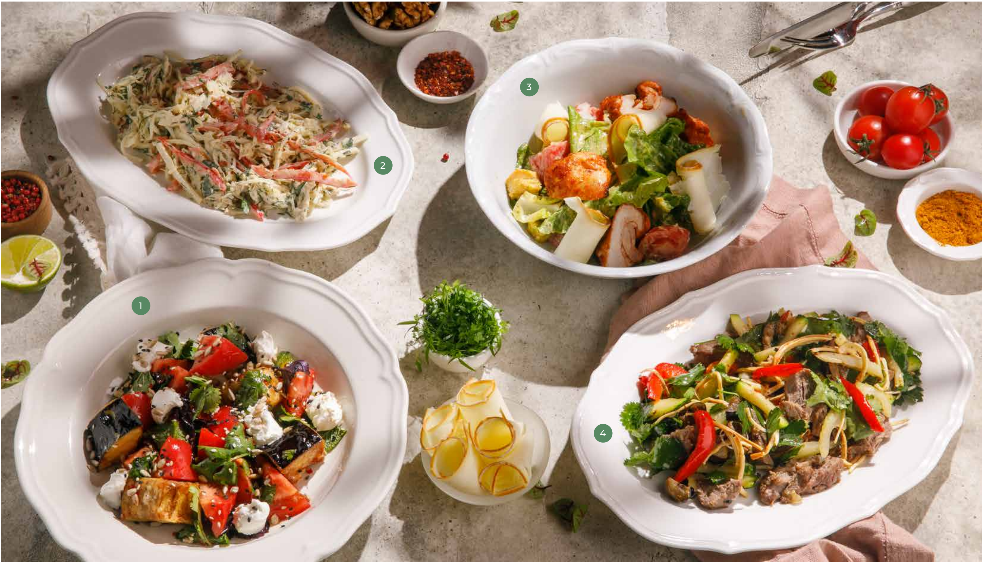
① САЛАТ С ХРУСТЯЩИМИ БАКЛАЖАНАМИ, ТОМАТОМ И СЛИВОЧНЫМ СЫРОМ CRISPY EGGPLANT SALAD WITH TOMATO AND CREAM CHEESE 890 Р

ПРОСЬБА ПРЕДУПРЕЖДАТЬ ВАШЕГО ОФИЦИАНТА ОБ ИМЕЮЩЕЙСЯ У ВАС АЛЛЕРГИИ НА ОПРЕДЕЛЕННЫЕ ПРОДУКТЫ ПИТАНИЯ. ВСЕ ЦЕНЫ УКАЗАНЫ В РУБЛЯХ. НА ФОТО ИСПОЛЬЗОВАНЫ ЭЛЕМЕНТЫ ДЕКОРА. PLEASE, TELL YOUR WAITER IF YOU HAVE ANY FOOD ALLERGY TO CERTAIN PRODUCTS. ALL PRICES ARE IN RUBLES. THE PICTURES HAVE DECORATIVE ELEMENTS