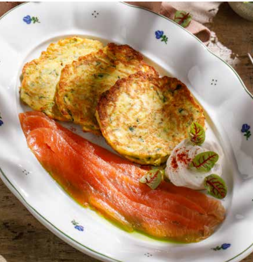
ОЛАДЬИ ИЗ ЦУКИНИ с форелью шеф-посола и соусом крем-чиз ZUCCHINI PANCAKES WITH CHEF'S SALTED TROUT AND CREAM CHEESE SAUCE