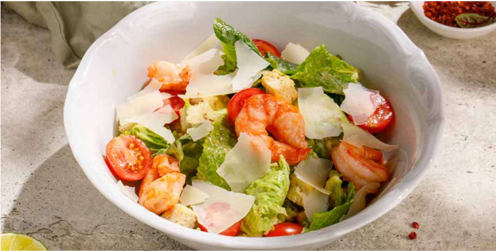
САЛАТ «ЦЕЗАРЬ» С КУРИЦЕЙ / С КРЕВЕТКАМИ CAESAR SALAD WITH CHICKEN / WITH SHRIMP