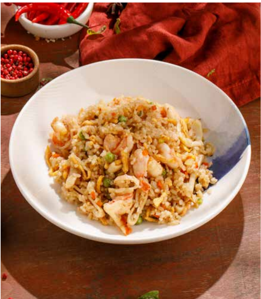
РИС С МОРЕПРОДУКТАМИ SEAFOOD RICE