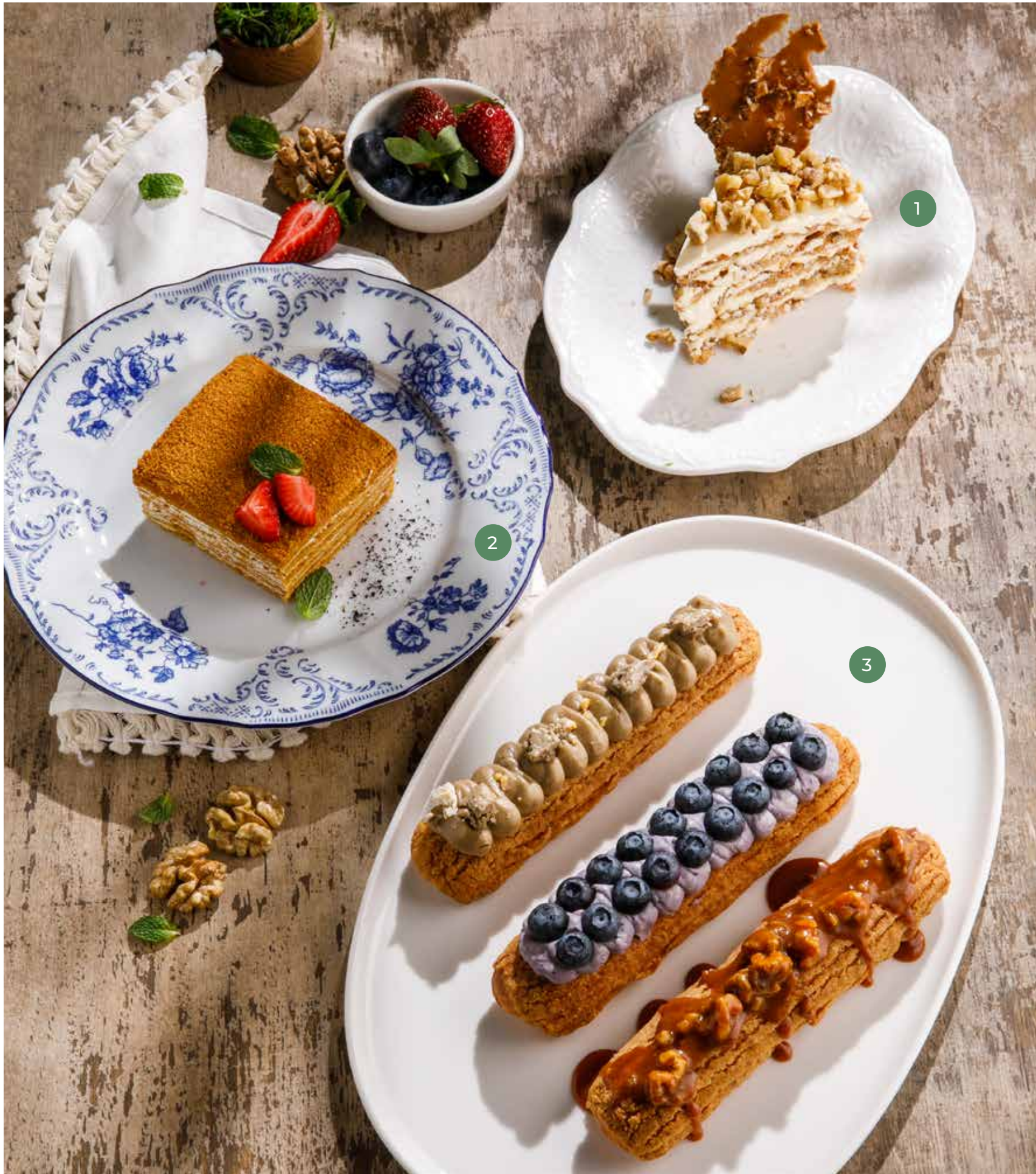
① ОРЕХОВЫЙ ТОРТ NUT CAKE