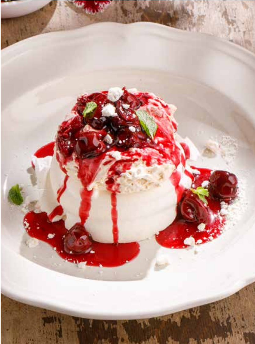
ПАВЛОВА С ВИШНЕВЫМ СОУСОМ PAVLOVA WITH CHERRY SAUCE