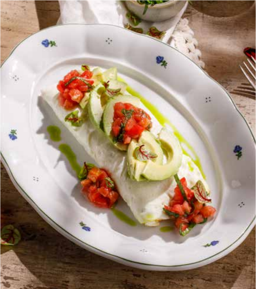
БЕЛКОВЫЙ ОМЛЕТ С АВОКАДО И ТОМАТНОЙ САЛЬСОЙ EGG WHITE OMELETTE WITH AVOCADO AND TOMATO SALSA