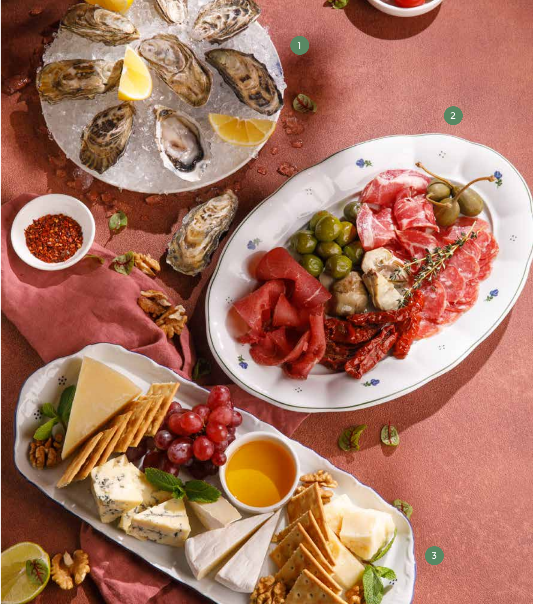
① УСТРИЦА OYSTER 1 PC. 1 шт. 590 Р ДЮЖИНА СВЕЖИХ УСТРИЦ A DOZEN OYSTERS 6900 Р