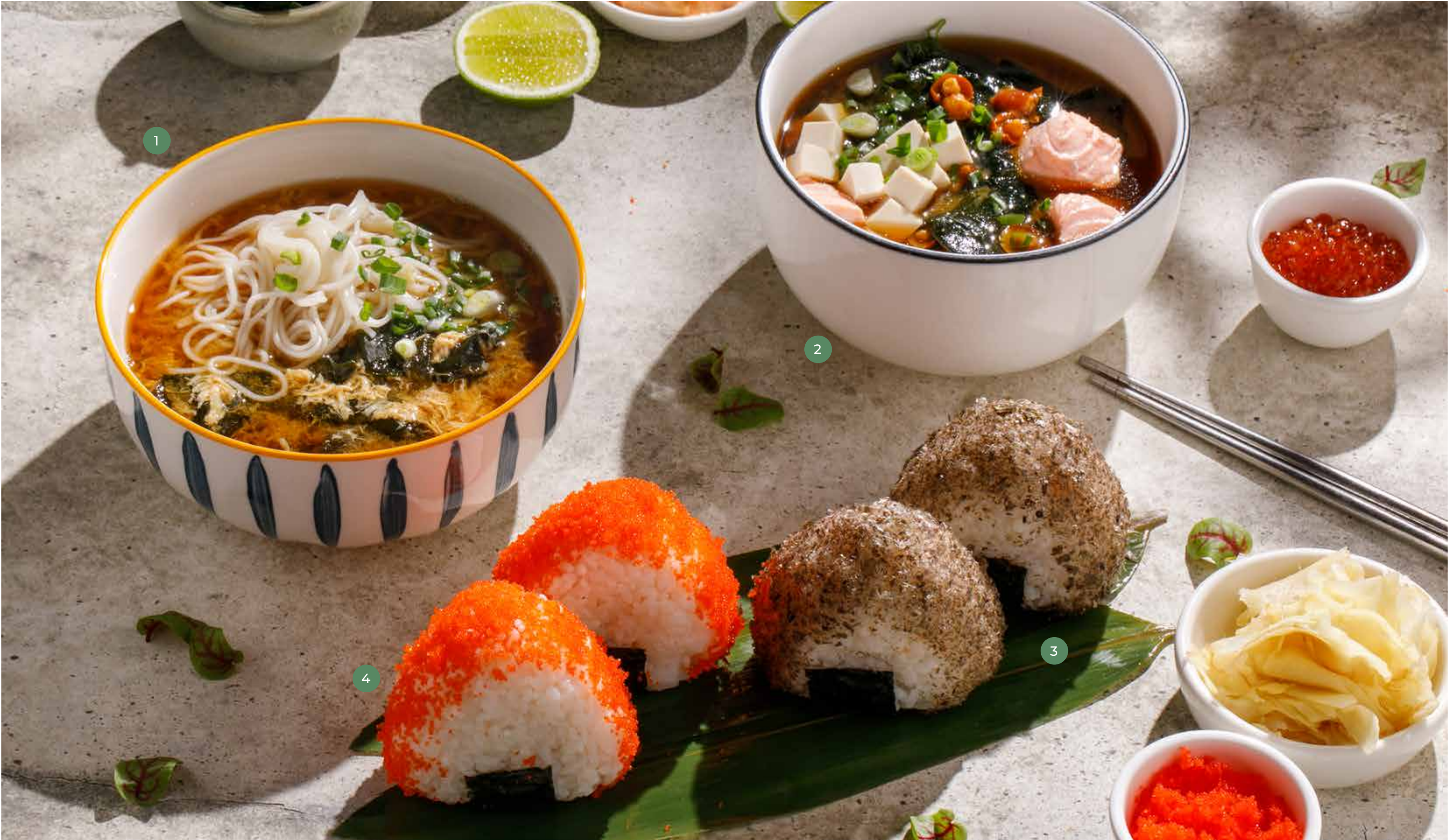
① КИМЧИ KIMCHI

ПРОСЬБА ПРЕДУПРЕЖДАТЬ ВАШЕГО ОФИЦИАНТА ОБ ИМЕЮЩЕЙСЯ У ВАС АЛЛЕРГИИ НА ОПРЕДЕЛЕННЫЕ ПРОДУКТЫ ПИТАНИЯ. ВСЕ ЦЕНЫ УКАЗАНЫ В РУБЛЯХ. НА ФОТО ИСПОЛЬЗОВАНЫ ЭЛЕМЕНТЫ ДЕКОРА. PLEASE, TELL YOUR WAITER IF YOU HAVE ANY FOOD ALLERGY TO CERTAIN PRODUCTS. ALL PRICES ARE IN RUBLES. THE PICTURES HAVE DECORATIVE ELEMENTS