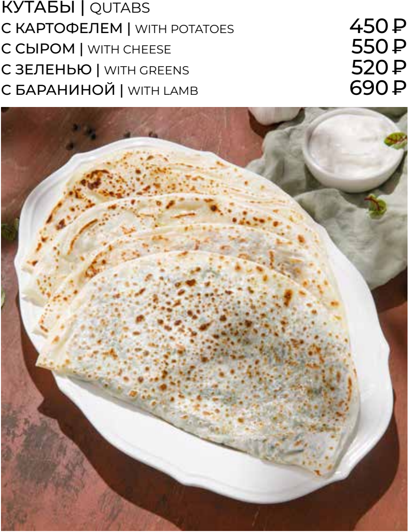
КУТАБЫ | QUTABS С КАРТОФЕЛЕМ | WITH POTATOES С СЫРОМ | WITH CHEESE С ЗЕЛЕНЬЮ | WITH GREENS С БАРАНИНОЙ | WITH LAMB