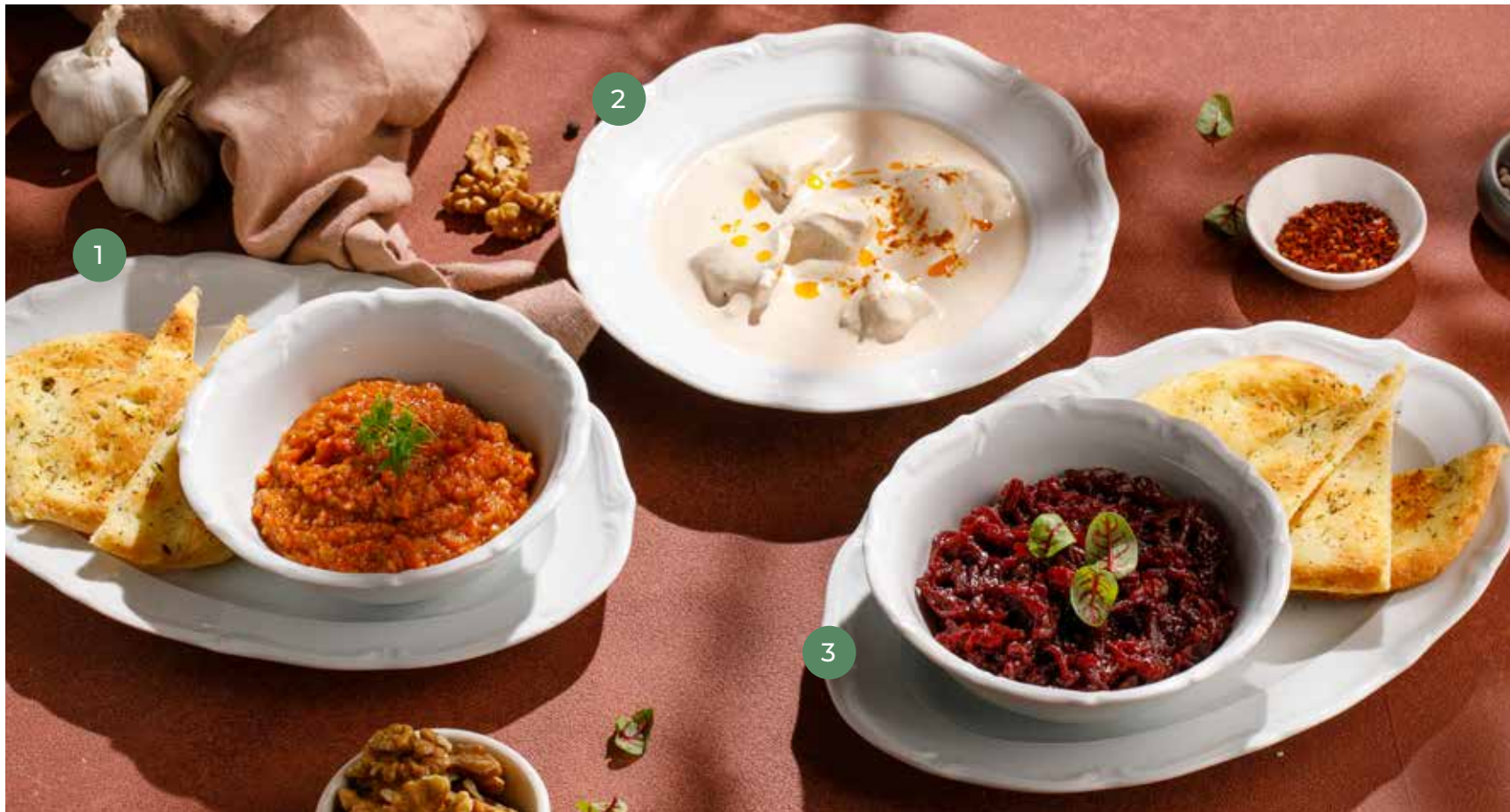
① БАКЛАЖАННАЯ ИКРА EGGPLANT CAVIAR