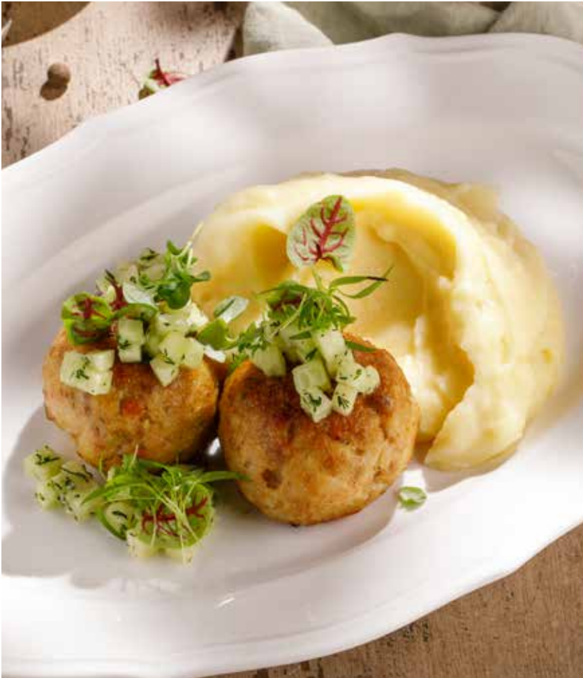
РЫБНЫЕ КОТЛЕТЫ FISH PATTIES 1290 Р