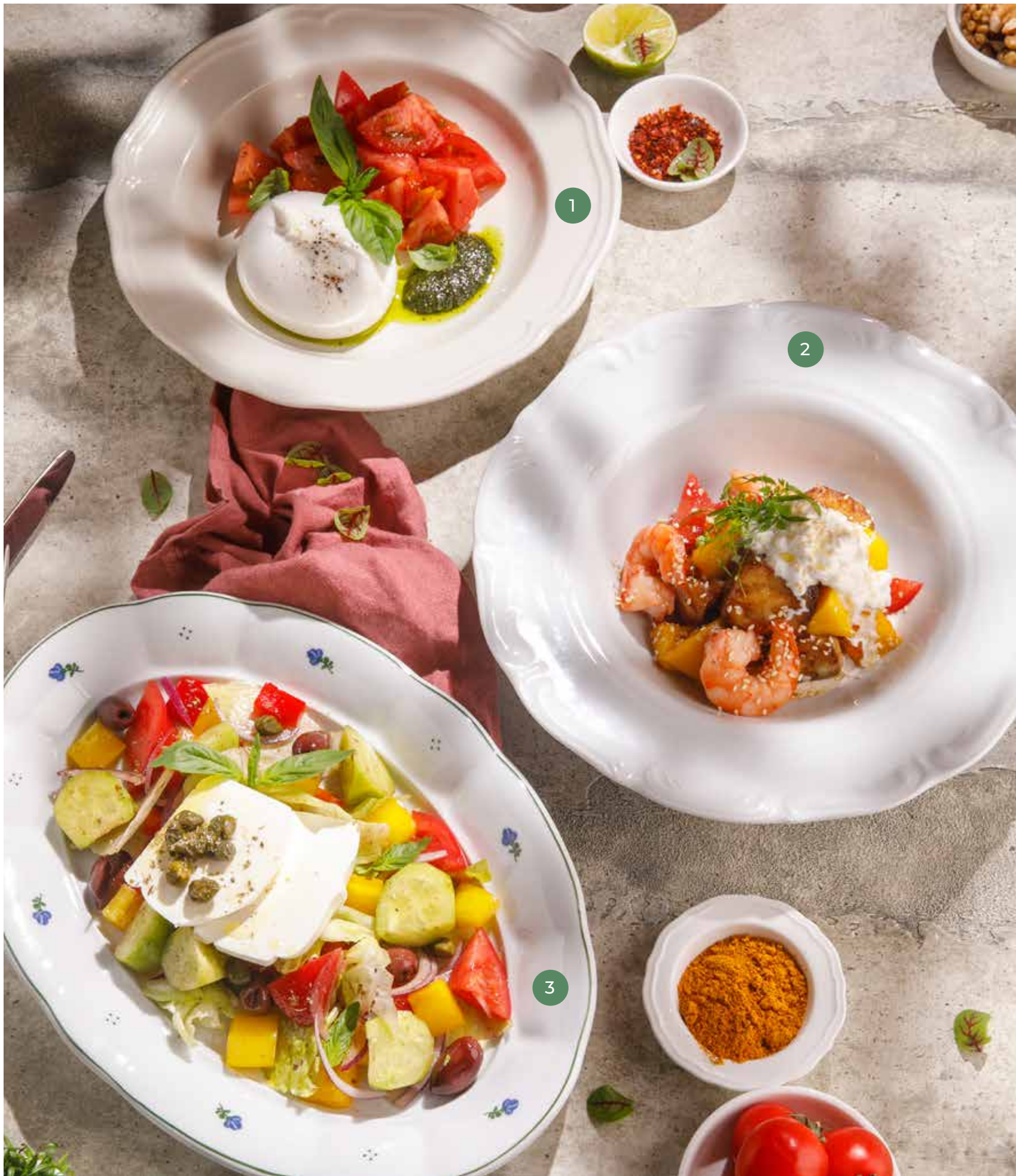
① БУРРАТА С ТОМАТАМИ BURRATA WITH TOMATOES