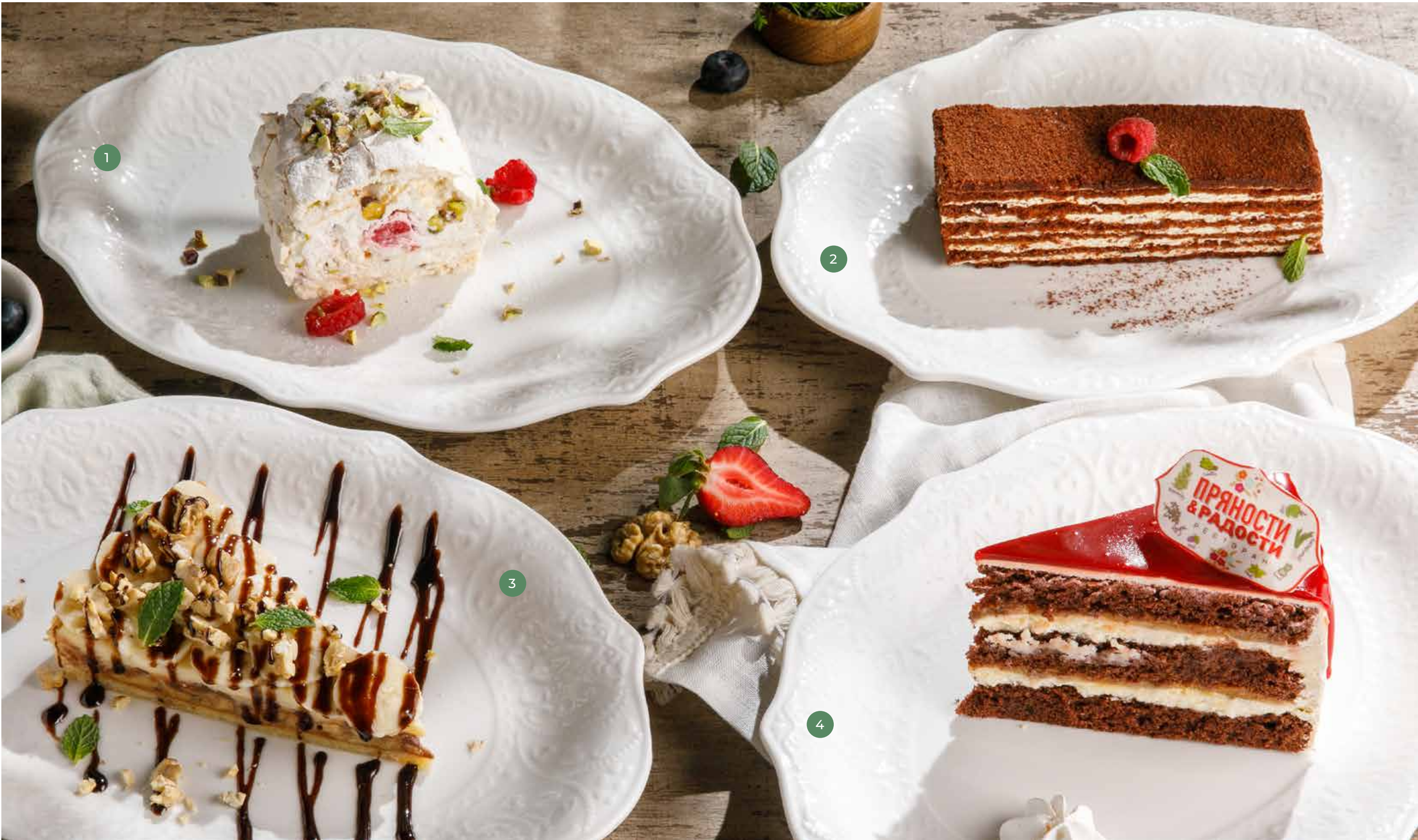
❶ ФИСТАШКОВЫЙ РУЛЕТ PISTACHIO ROLL

ПРОСЬБА ПРЕДУПРЕЖДАТЬ ВАШЕГО ОФИЦИАНТА ОБ ИМЕЮЩЕЙСЯ У ВАС АЛЛЕРГИИ НА ОПРЕДЕЛЕННЫЕ ПРОДУКТЫ ПИТАНИЯ. ВСЕ ЦЕНЫ УКАЗАНЫ В РУБЛЯХ. НА ФОТО ИСПОЛЬЗОВАНЫ ЭЛЕМЕНТЫ ДЕКОРА. PLEASE, TELL YOUR WAITER IF YOU HAVE ANY FOOD ALLERGY TO CERTAIN PRODUCTS. ALL PRICES ARE IN RUBLES. THE PICTURES HAVE DECORATIVE ELEMENTS