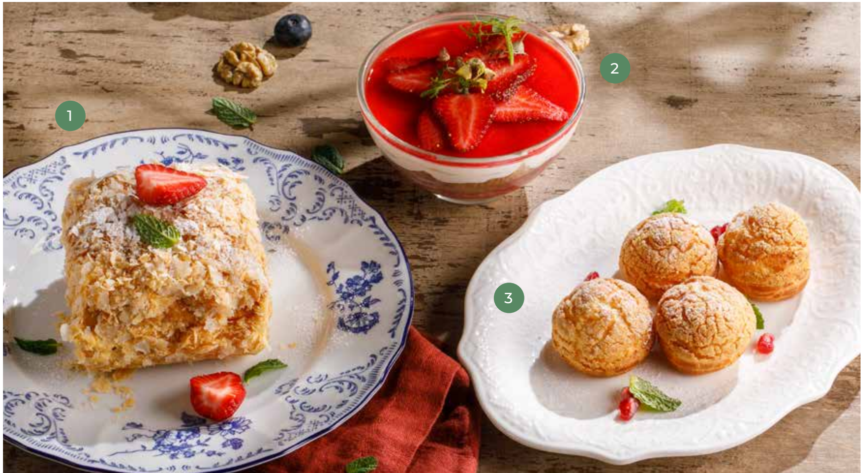
① НАПОЛЕОН С ЗАВАРНЫМ КРЕМОМ NAPOLEON CAKE WITH CUSTARD CREAM