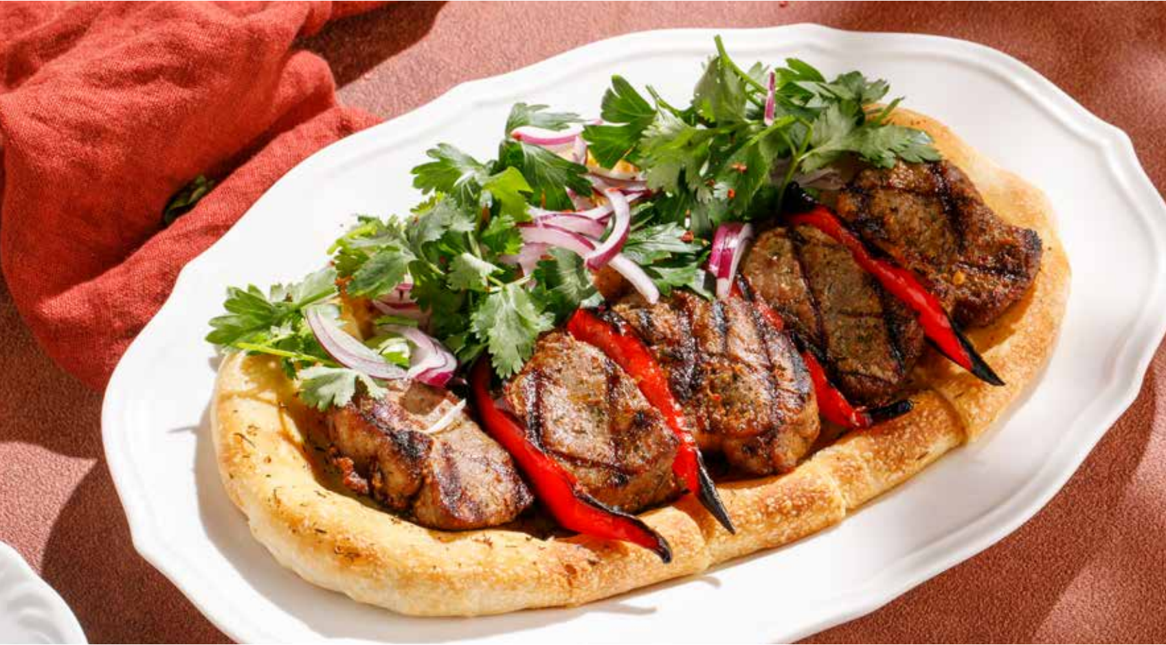
СЕДЛО ЯГНЕНКА SADDLE OF LAMB