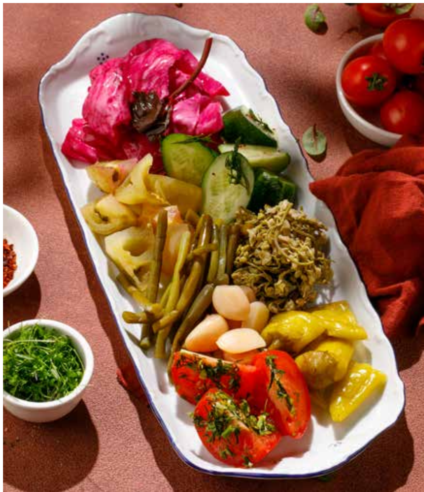
АССОРТИ СОЛЕНИЙ ASSORTED PICKLES