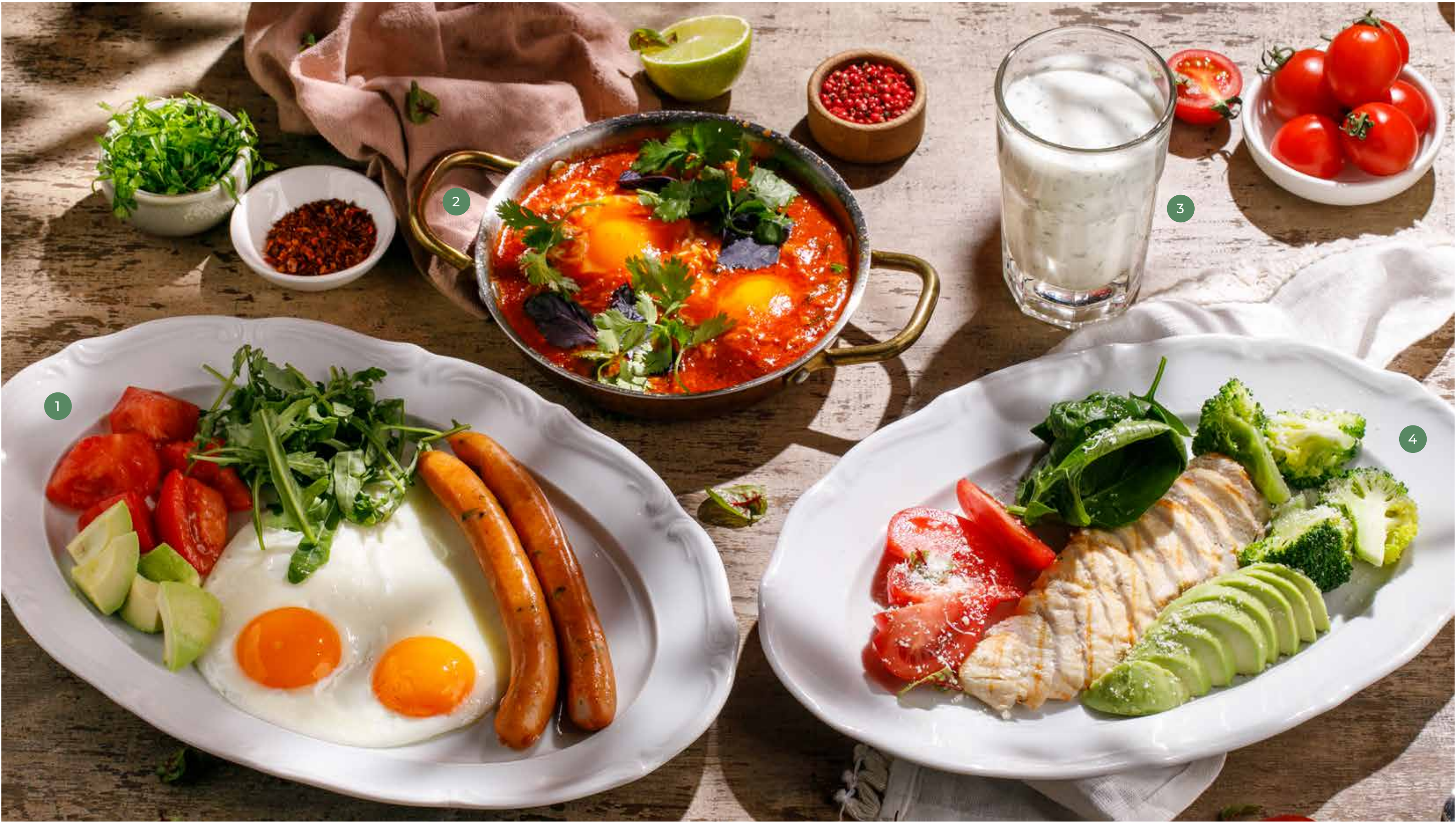
① ЯИЧНИЦА ГЛАЗУНЯ С СОСИСКАМИ И ОВОЩАМИ SUNNY-SIDE UP EGGS WITH SAUSAGE AND VEGETABLES

ПРОСЬБА ПРЕДУПРЕЖДАТЬ ВАШЕГО ОФИЦИАНТА ОБ ИМЕЮЩЕЙСЯ У ВАС АЛЛЕРГИИ НА ОПРЕДЕЛЕННЫЕ ПРОДУКТЫ ПИТАНИЯ. ВСЕ ЦЕНЫ УКАЗАНЫ В РУБЛЯХ. НА ФОТО ИСПОЛЬЗОВАНЫ ЭЛЕМЕНТЫ ДЕКОРА. PLEASE, TELL YOUR WAITER IF YOU HAVE ANY FOOD ALLERGY TO CERTAIN PRODUCTS. ALL PRICES ARE IN RUBLES. THE PICTURES HAVE DECORATIVE ELEMENTS