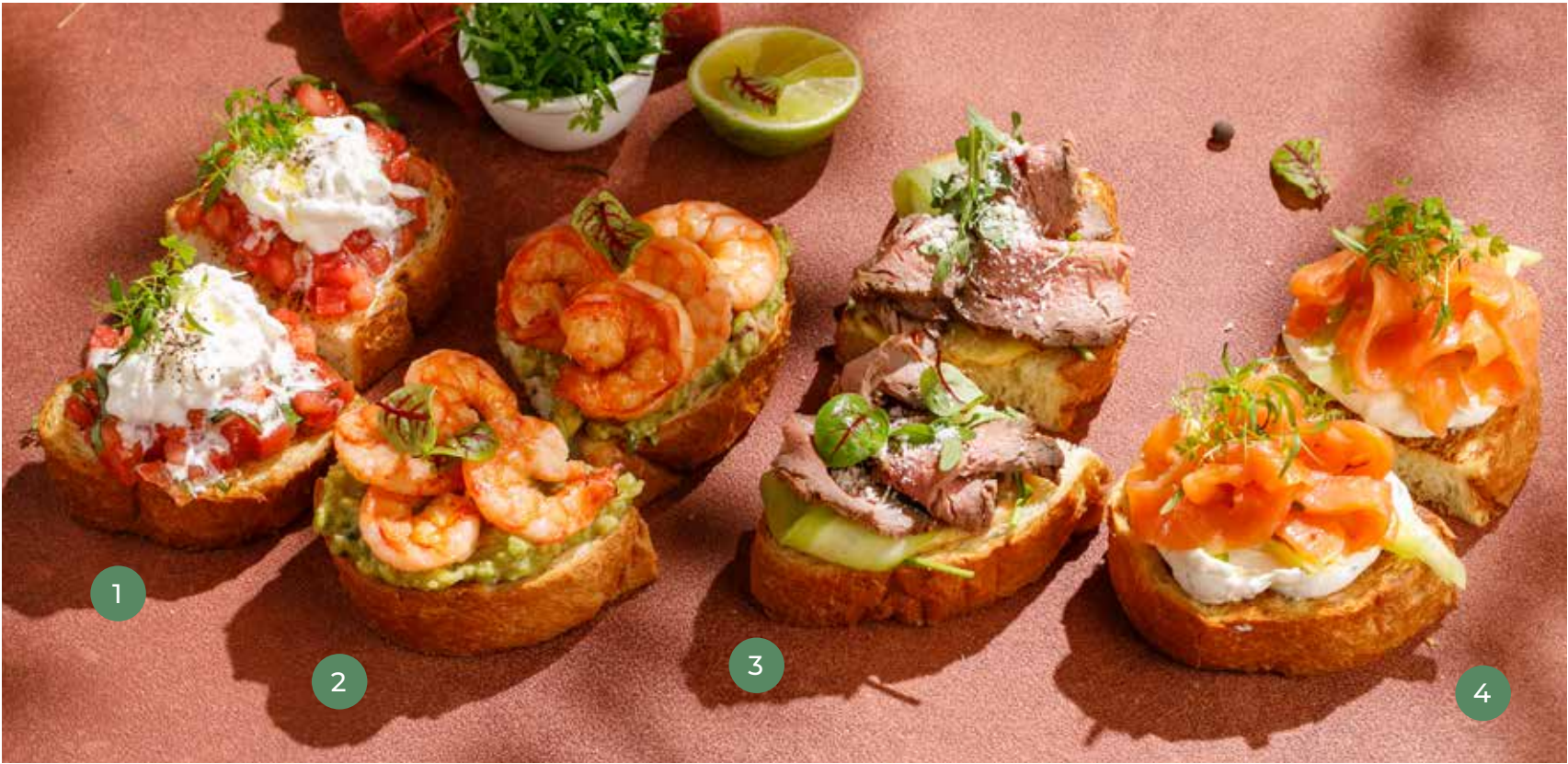
БРУСКЕТТА | BRUSCHETTA ① С ТОМАТАМИ И СТРАЧАТЕЛЛОЙ WITH TOMATOES AND STRACCIATELLA 590 Р ② С КРЕВЕТКАМИ И ГУАКАМОЛЕ WITH SHRIMP AND GUACAMOLE 690 Р ③ С РОСТБИФОМ WITH ROAST BEEF 790 Р ④ С ФОРЕЛЬЮ WITH TROUT 790 Р