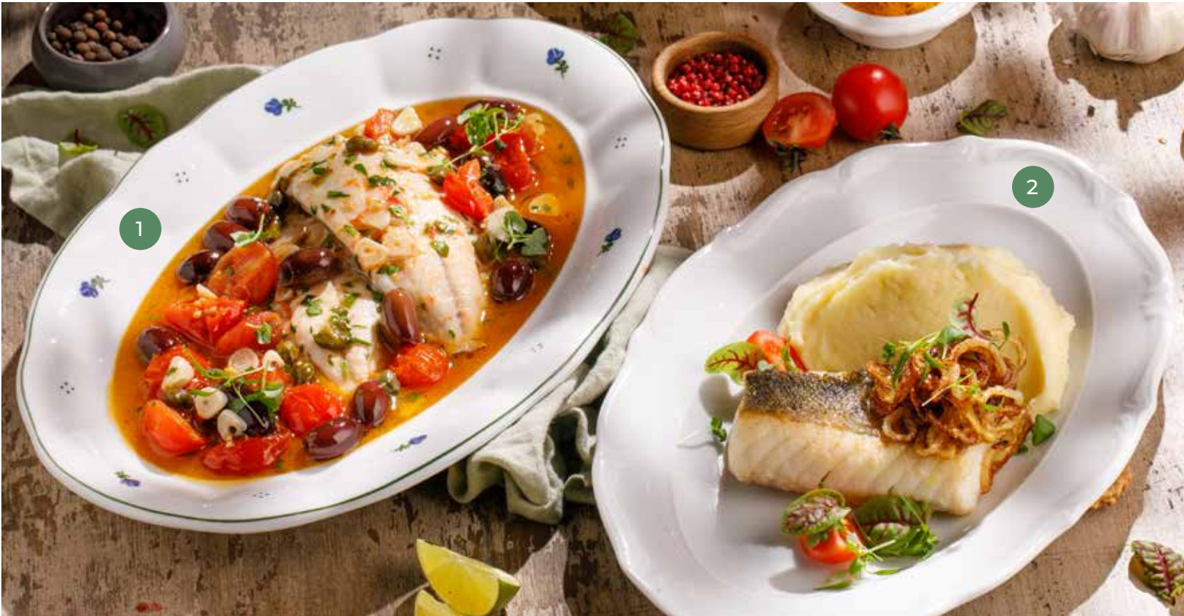
③ ФИЛЕ ДОРАДО С ЧЕРРИ ТОМАТАМИ И МАСЛИНАМИ КАЛАМАТА DORADO FILLET WITH CHERRY TOMATOES AND KALAMATA OLIVES 1690 Р