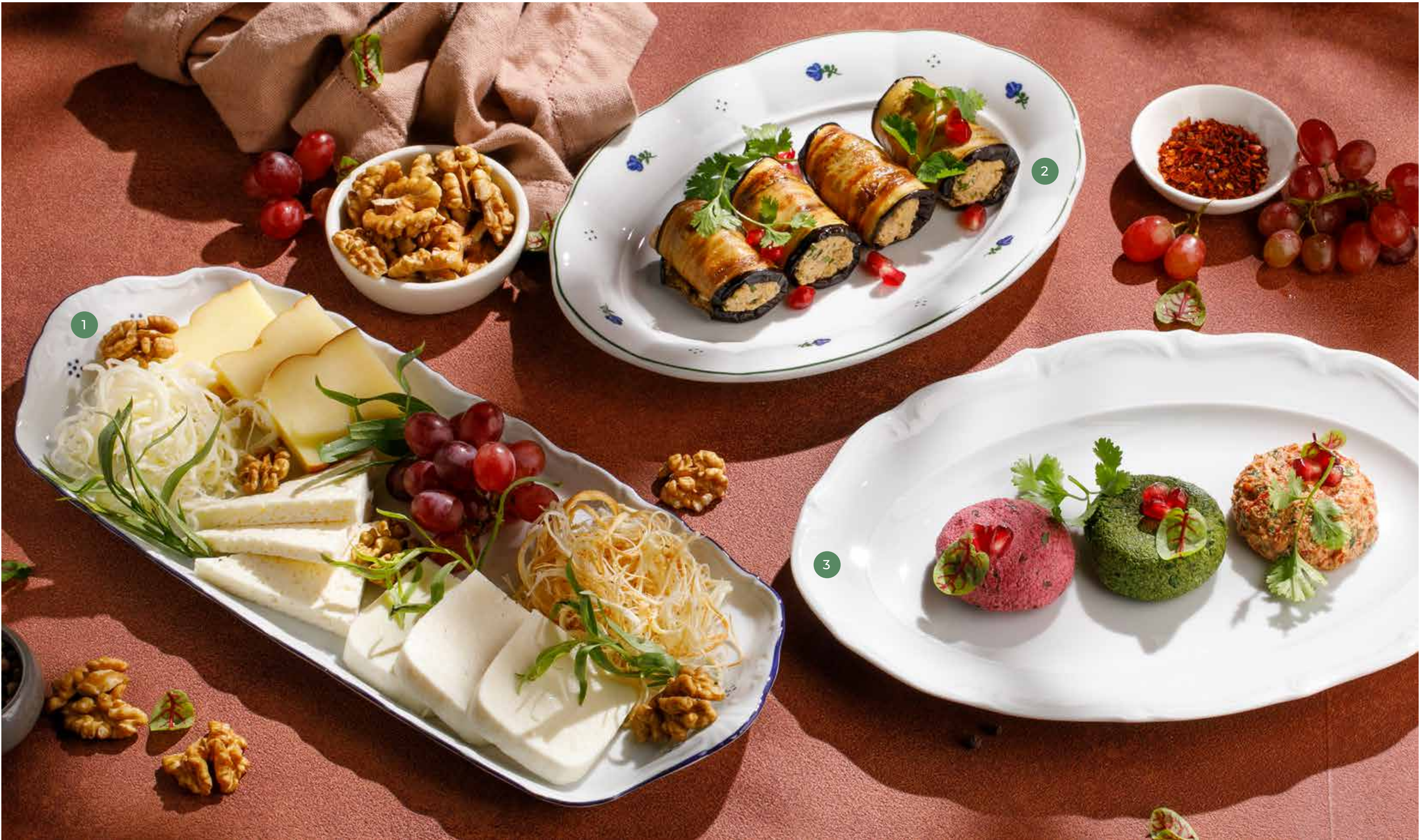
❶ АССОРТИ ДОМАШНИХ СЫРОВ HOMEMADE CHEESE PLATTER

ПРОСЬБА ПРЕДУПРЕЖДАТЬ ВАШЕГО ОФИЦИАНТА ОБ ИМЕЮЩЕЙСЯ У ВАС АЛЛЕРГИИ НА ОПРЕДЕЛЕННЫЕ ПРОДУКТЫ ПИТАНИЯ. ВСЕ ЦЕНЫ УКАЗАНЫ В РУБЛЯХ. НА ФОТО ИСПОЛЬЗОВАНЫ ЭЛЕМЕНТЫ ДЕКОРА. PLEASE, TELL YOUR WAITER IF YOU HAVE ANY FOOD ALLERGY TO CERTAIN PRODUCTS. ALL PRICES ARE IN RUBLES. THE PICTURES HAVE DECORATIVE ELEMENTS