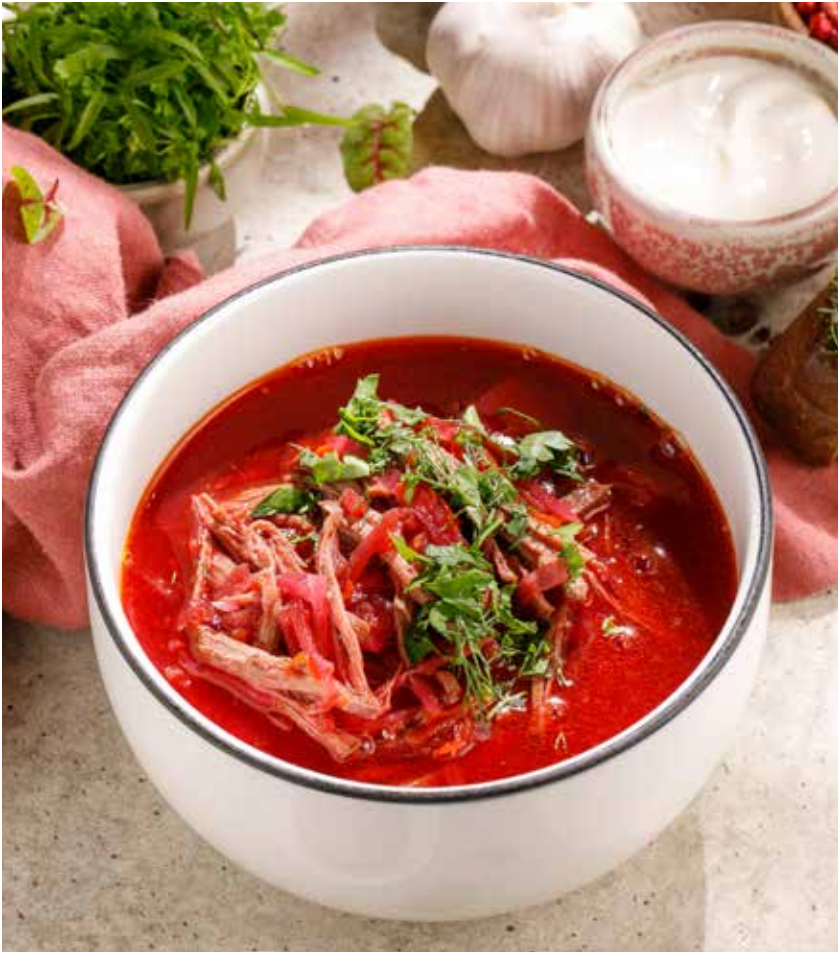
БОРЩ BORSCH 690 Р

PLEASE, TELL YOUR WAITER IF YOU HAVE ANY FOOD ALLERGY TO CERTAIN PRODUCTS. ALL PRICES ARE IN RUBLES. THE PICTURES HAVE DECORATIVE ELEMENTS