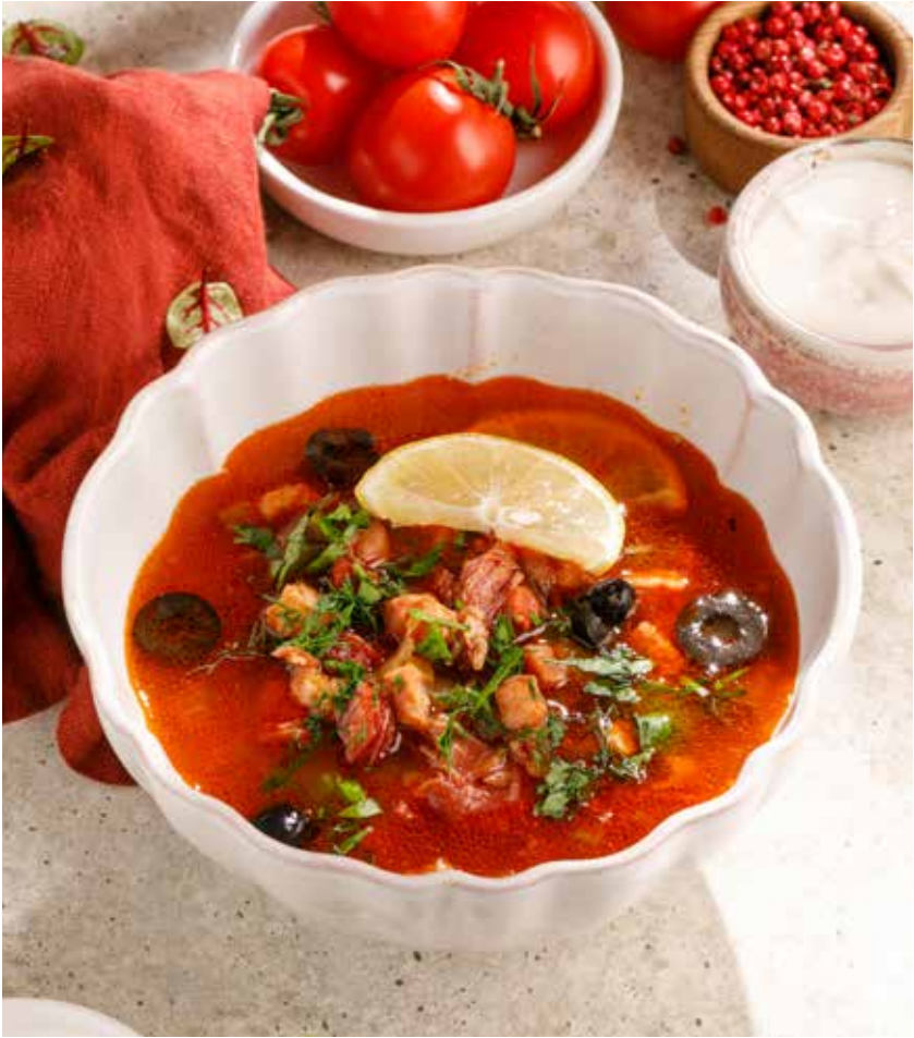
СОЛЯНКА SOLYANKA 790 Р