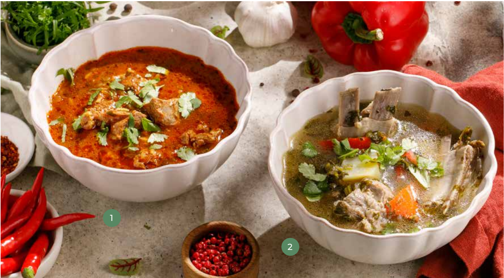
① ХАРЧО С ГОВЯДИНОЙ BEEF KHARCHO 790 Р