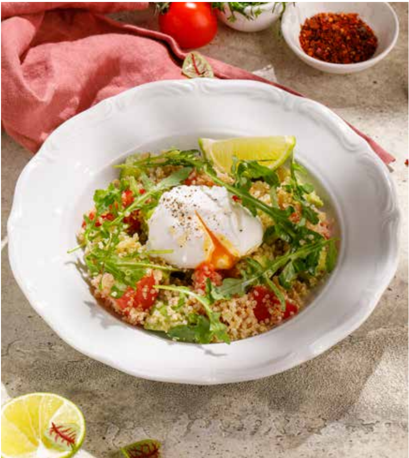
САЛАТ С КИНОА, АВОКАДО И ЯЙЦОМ ПАШОТ QUINOA SALAD WITH AVOCADO AND POACHED EGG