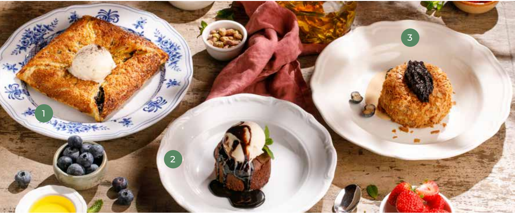
① МАКОВЫЙ ПИРОГ POPPY SEED PIE