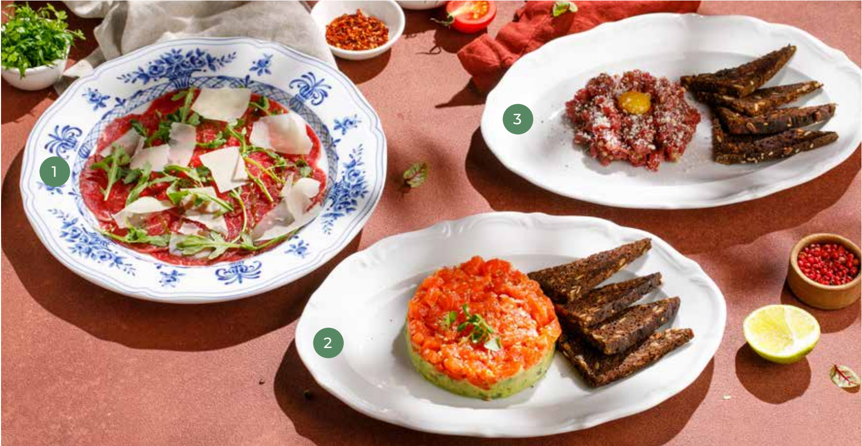
① КАРПАЧЧО ИЗ ГОВЯДИНЫ BEEF CARPACCIO 1290 Р ② ТАРТАР ИЗ ФОРЕЛИ TROUT TARTARE 1590 Р ③ ТАРТАР ИЗ ГОВЯДИНЫ BEEF TARTARE 990 Р