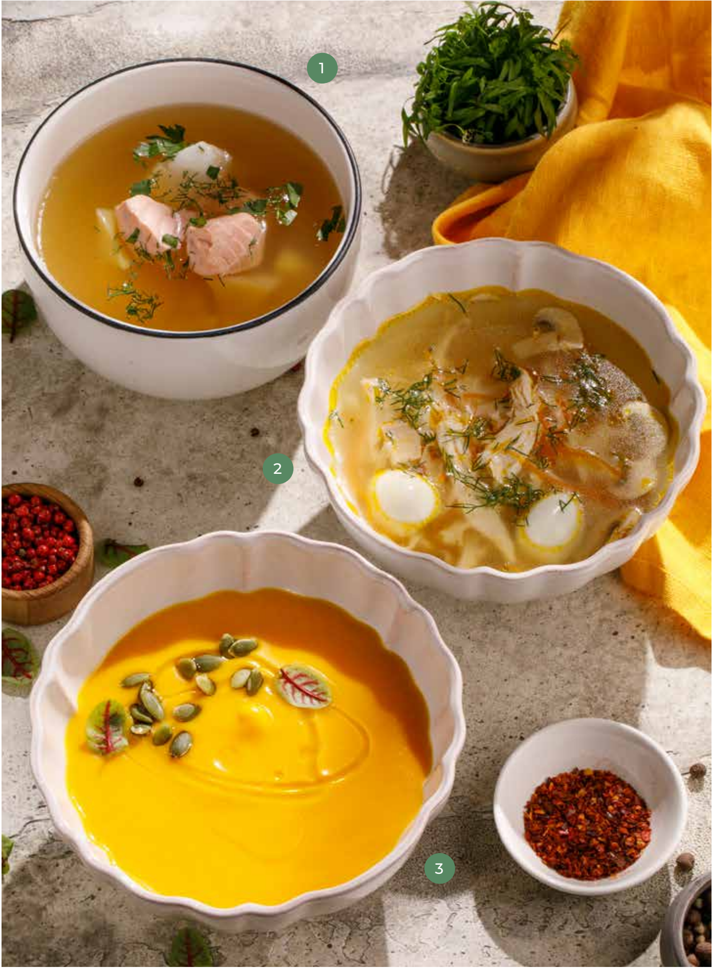
① УХА FISH SOUP 790 Р