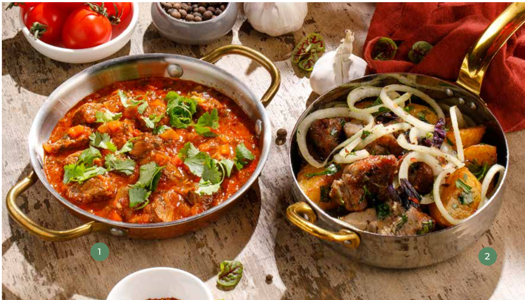
① ЧАШУШУЛИ CHASHUSHULI