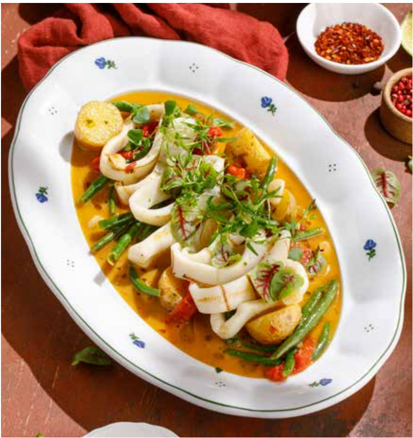
КОМАНДОРСКИЙ КАЛЬМАР НА ГРИЛЕ С ОВОЩАМИ COMMANDER GRILLED SQUID WITH VEGETABLES