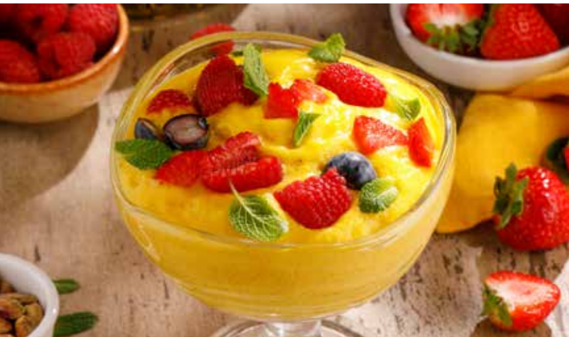
МУСС ИЗ МАНГО MANGO MOUSSE