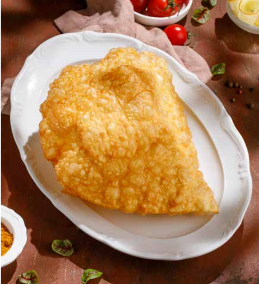
ЧЕБУРЕК | CHEBUREK С СЫРОМ | WITH CHEESE С ТЕЛЯТИНОЙ | WITH VEAL С БАРАНИНОЙ | WITH LAMB