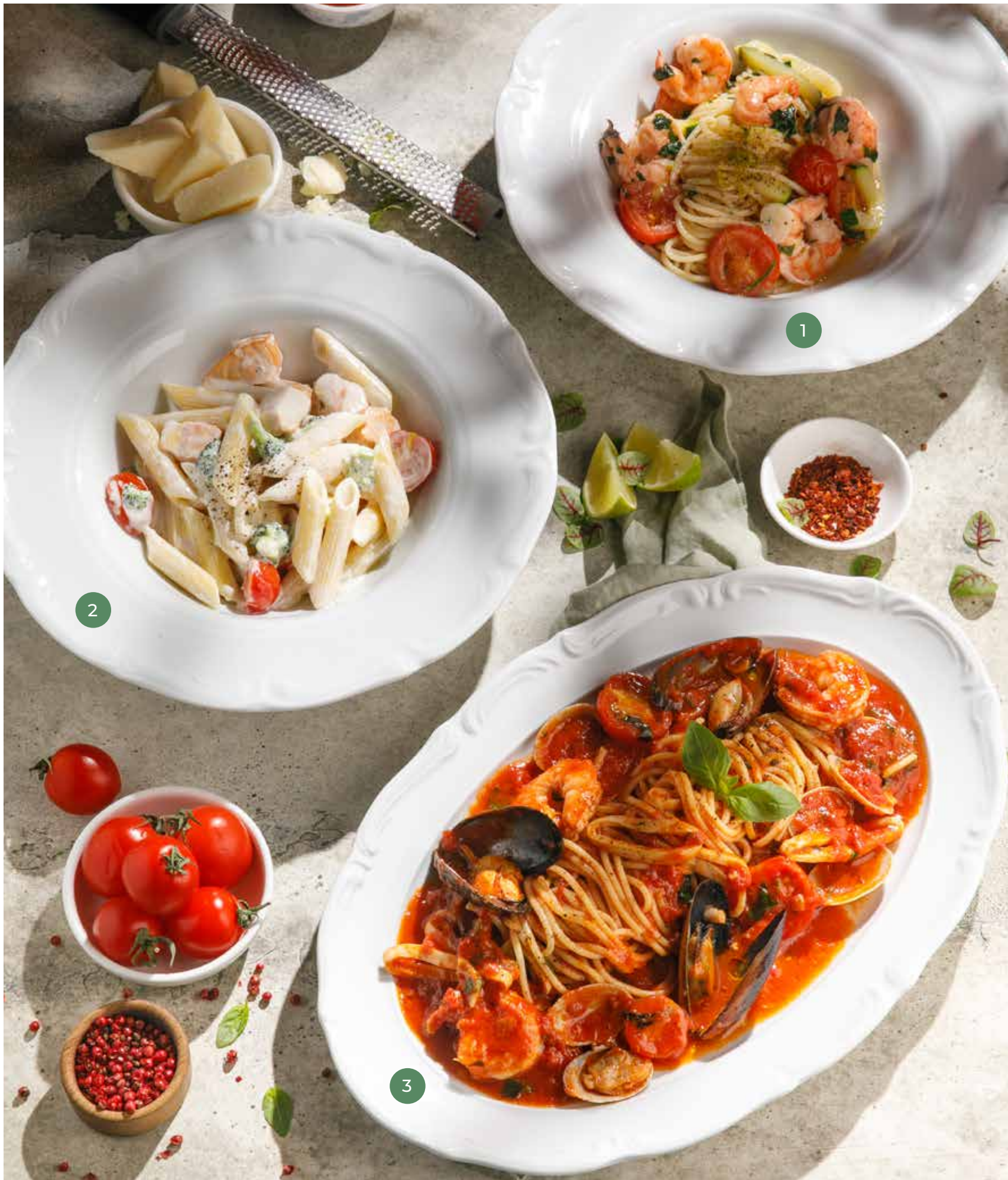
① ПАСТА С ЦУКИНИ И КРЕВЕТКАМИ PASTA WITH ZUCCHINI AND SHRIMP