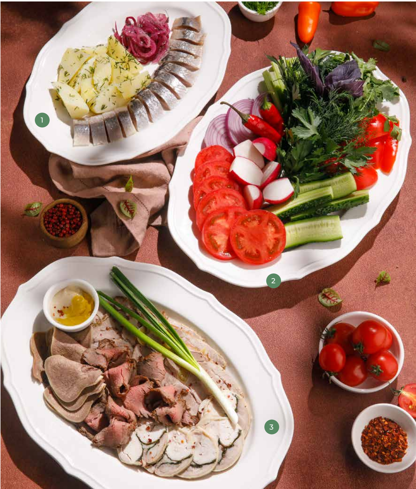
① СЕЛЬДЬ С КАРТОФЕЛЕМ HERRING WITH POTATOES