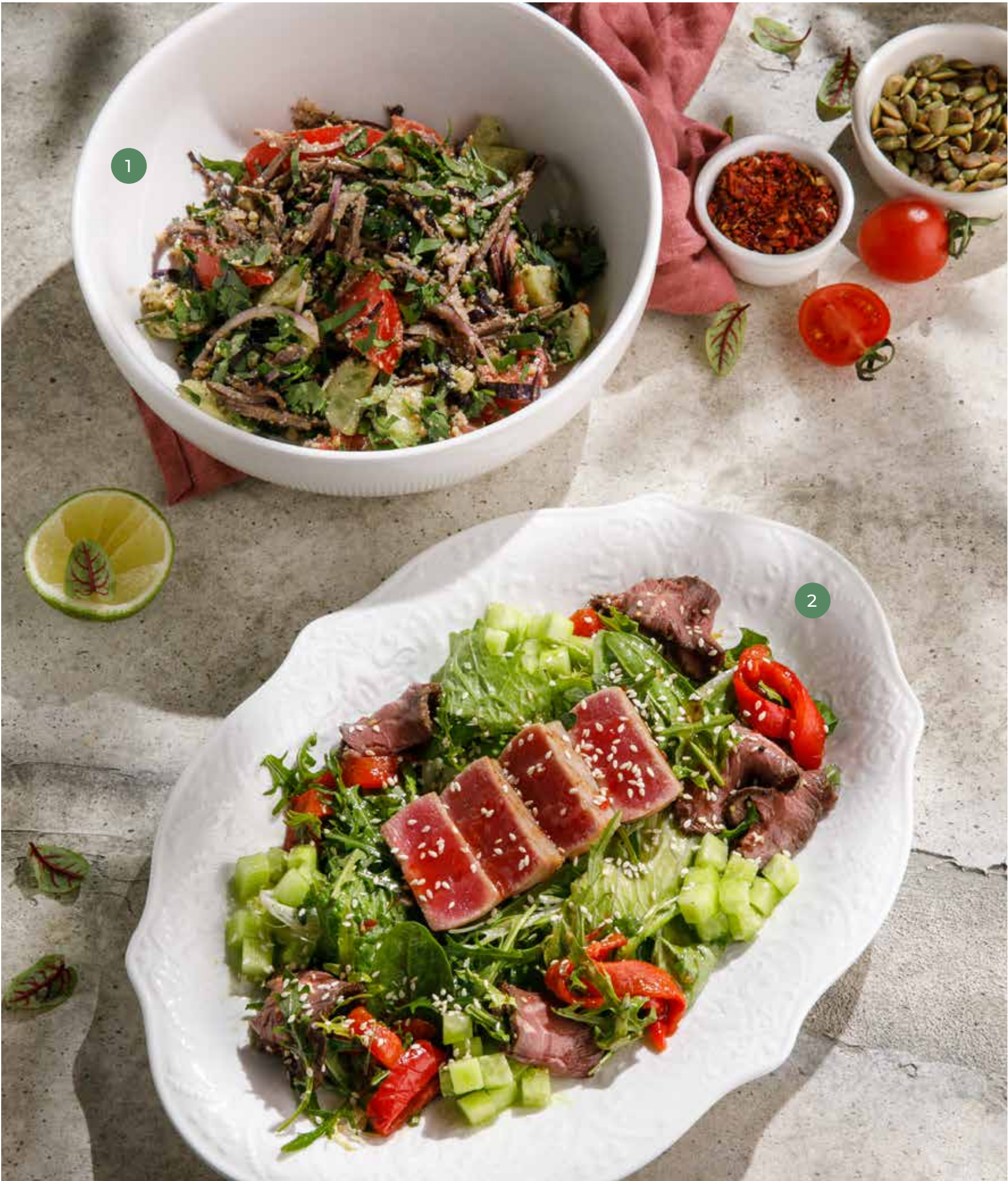
① САЛАТ С ОВОЩАМИ, ГОВЯДИНОЙ И ГРЕЦКИМИ ОРЕХАМИ VEGETABLE SALAD WITH BEEF AND WALNUTS