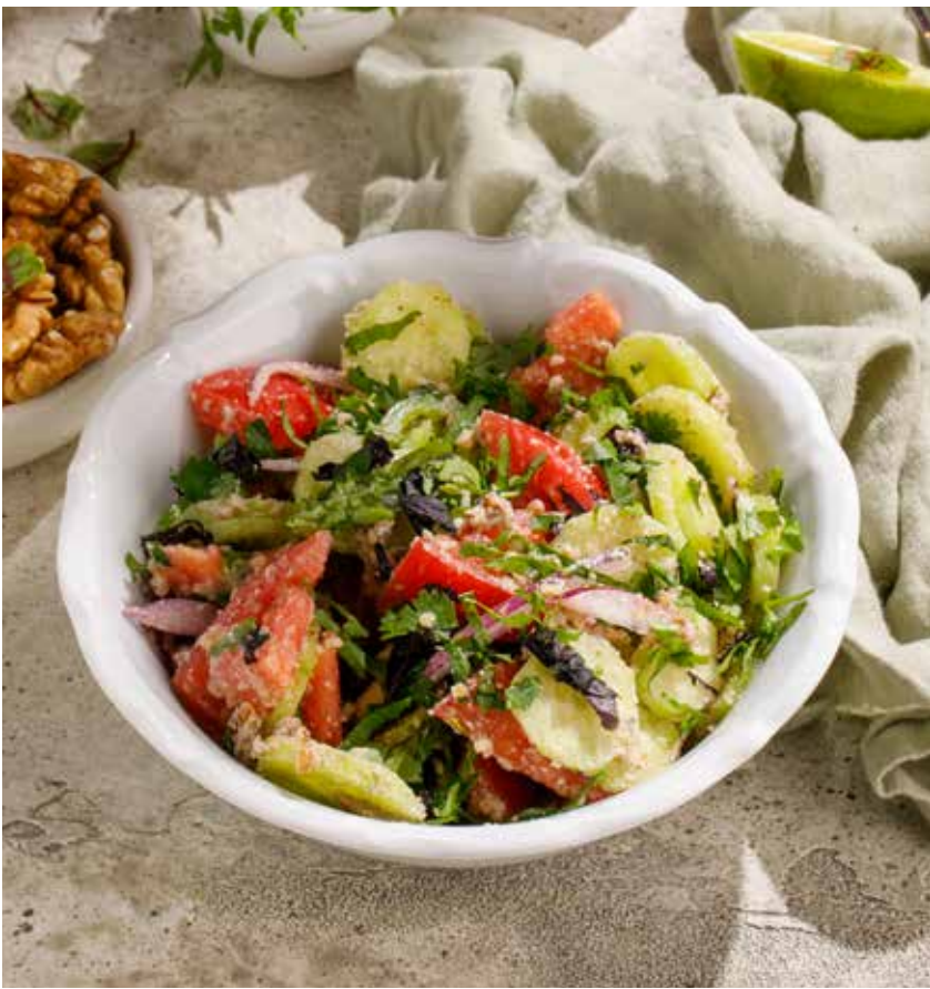
ОВОЩНОЙ САЛАТ ПО-ГРУЗИНСКИ со специями / с орехами GEORGIAN VEGETABLE SALAD WITH SPICES / WITH NUTS