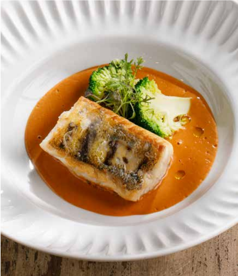
СУДАК В СОУСЕ БИСК PIKE PERCH IN BISQUE SAUCE 1490 Р