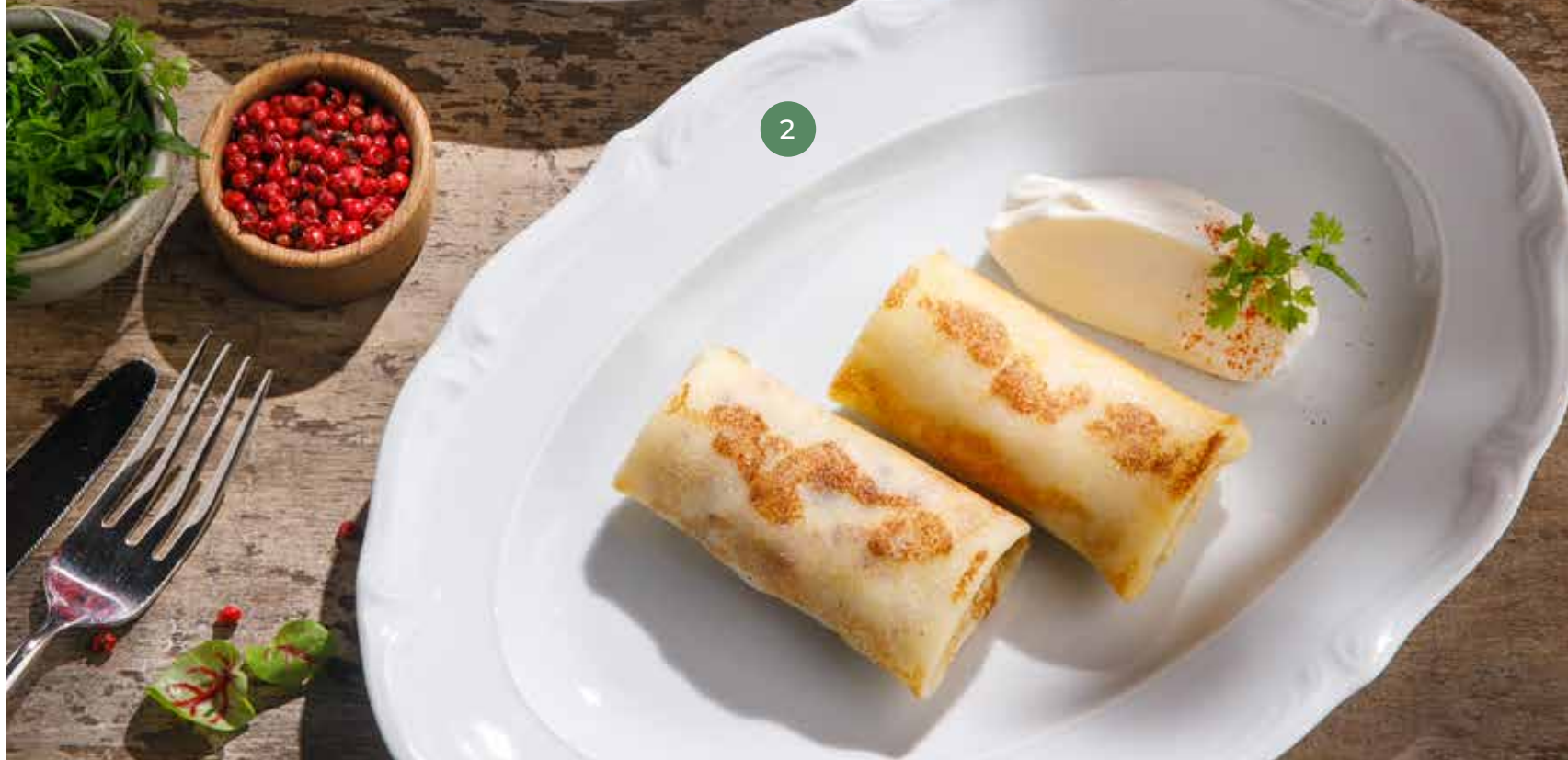
① БЛИНЫ С КРАСНОЙ ИКРОЙ CREPES WITH RED CAVIAR