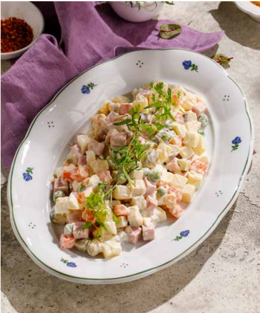
ОЛИВЬЕ С КОЛБАСОЙ HOMEMADE OLIVIER RUSSIAN SALAD WITH SAUSAGE