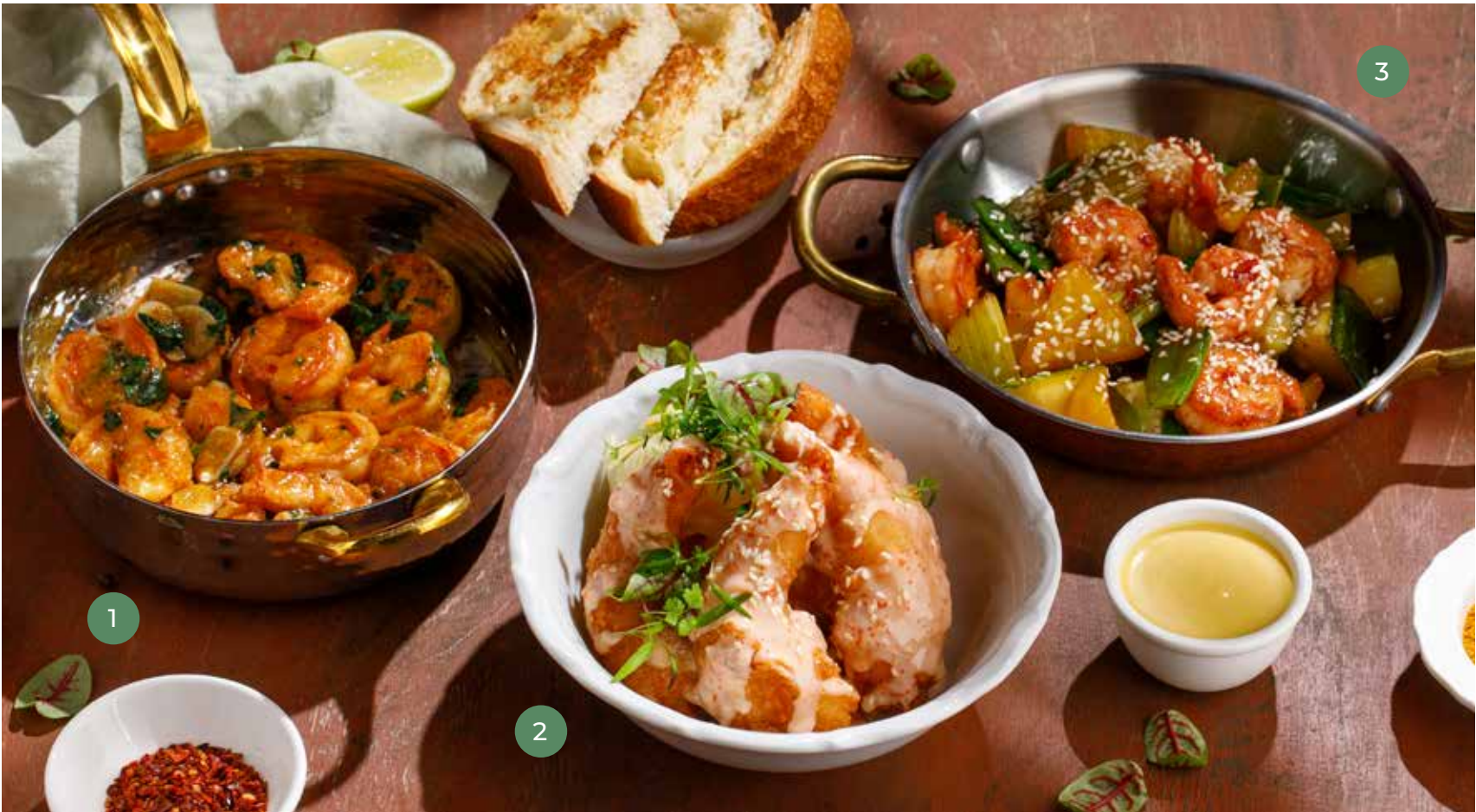
① КРЕВЕТКИ С ЧЕСНОКОМ И ПЕТРУШКОЙ FRIED SHRIMP WITH GARLIC AND PARSLEY