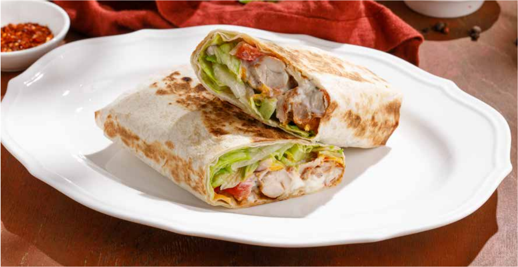
ШАВЕРМА С КУРОЙ CHICKEN SHAWARMA