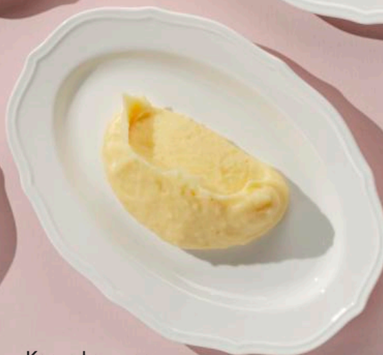
Картофельное пюре с копченым перцем чипотле 100 г 190 ₽