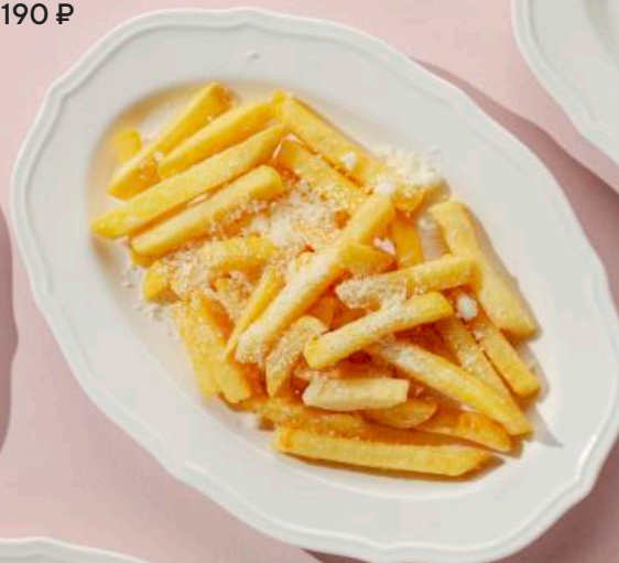
Картофель фри 100 г 190 ₽