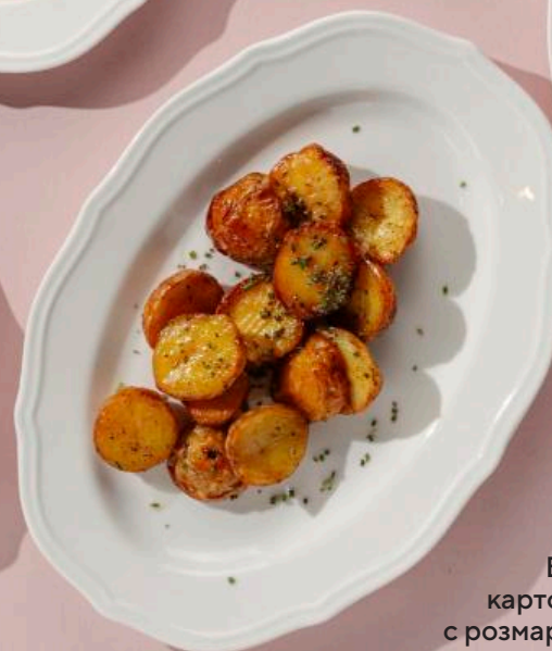
Бейби картофель с розмарином 100 г 190 ₽