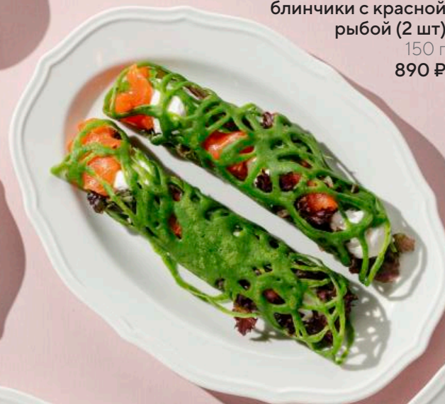
Шпинатные блинчики с красной рыбой (2 шт) 150 г 890 ₽