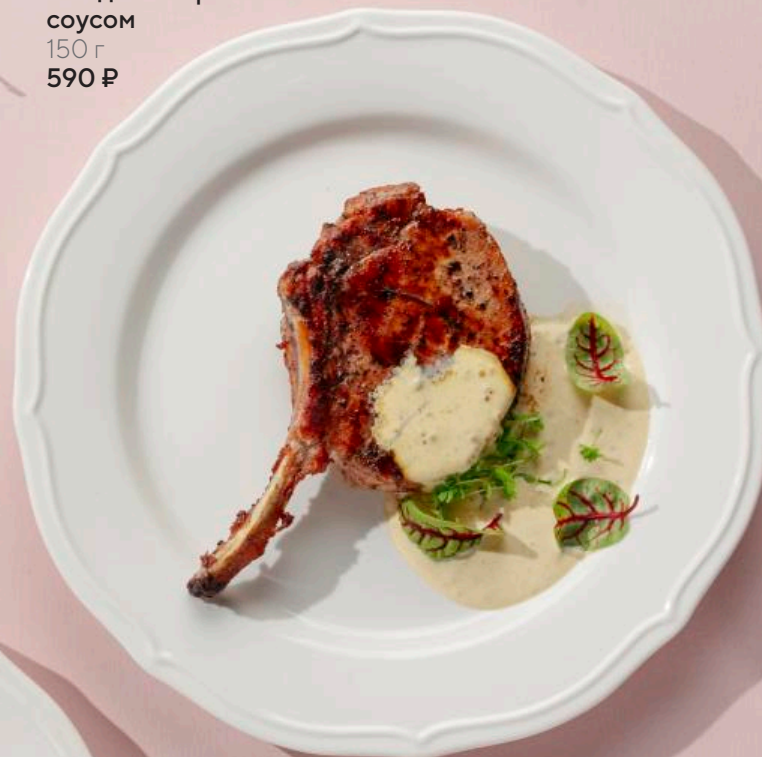
Стейк из свинины с медово-горчичным соусом 150 г 590 ₽