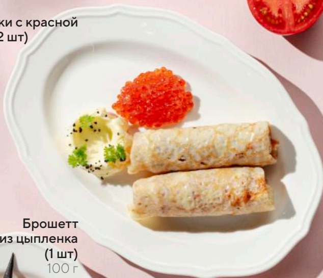
Блинчики с красной икрой (2 шт) 100 г 790 ₽