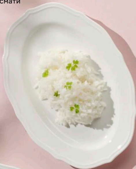
Рис басмати 100 г 190 ₽