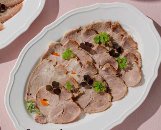
Домашняя буженина со сливочным хреном 100/30 г 590 ₽