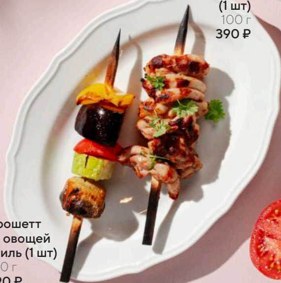
Брошетт из овощей гриль (1 шт) 100 г 290 ₽