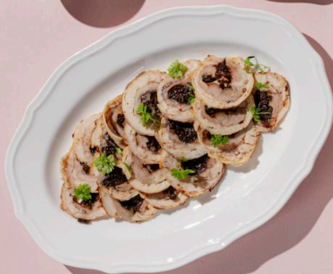
Куриный рулет 100 г 390 ₽