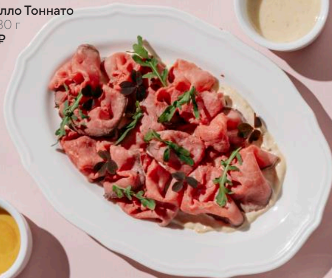
Вителло Тоннато 100/30 г 890 ₽