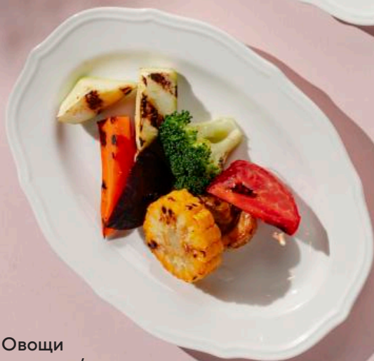
Овощи на гриле/на пару 100 г 190 ₽