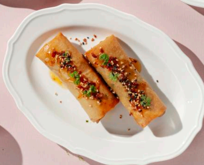
Спринг роллы с телятиной и овощами (1 шт) 100 г 390 ₽