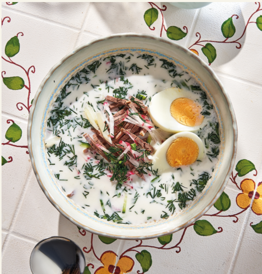
ХОЛОДНЫЙ СУП ОТ БАБУШКИ НАДЭ, 590 ₽