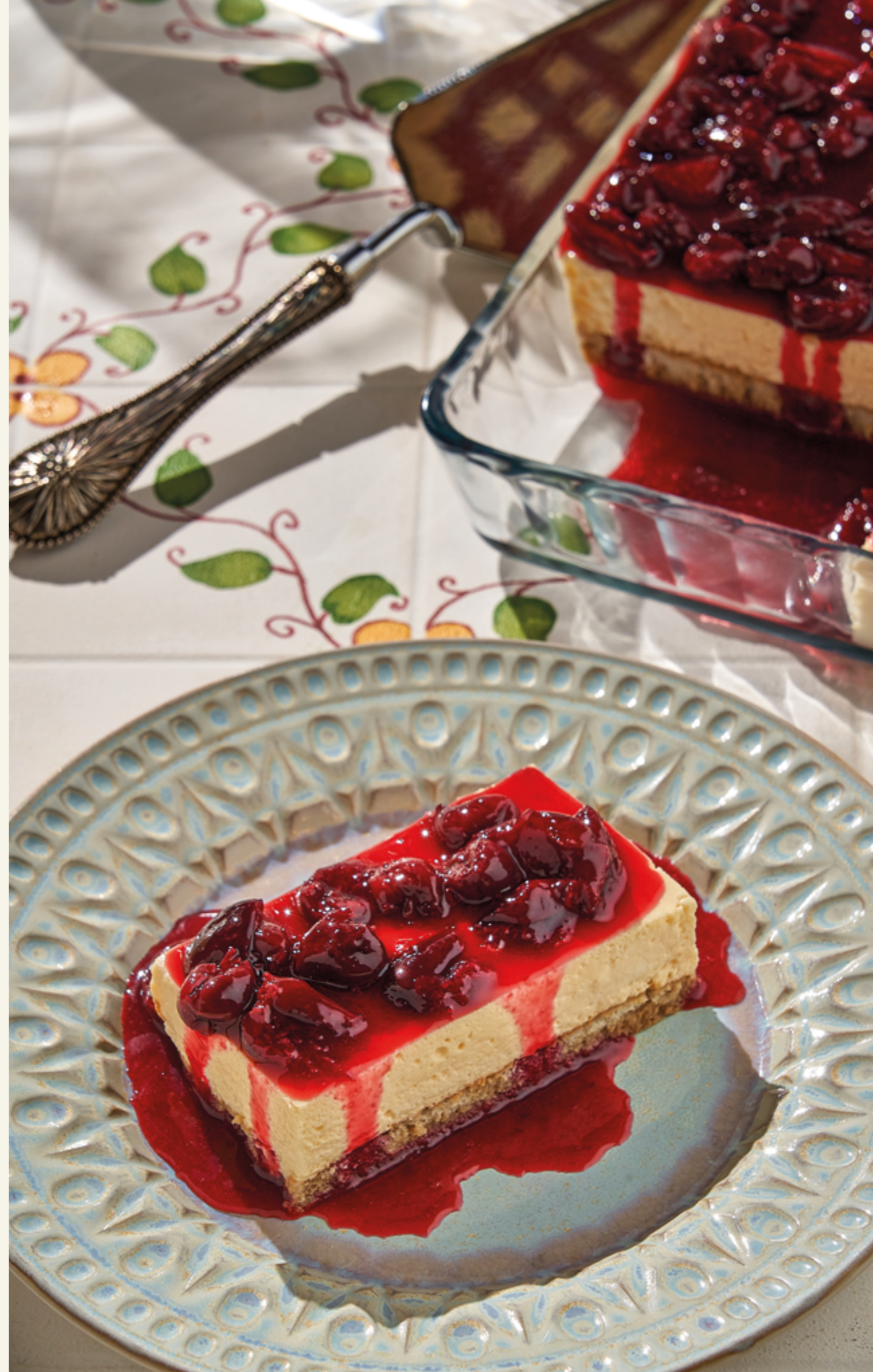
ТИРАМИСУ С ЧЕРЕШНЕЙ И ВИШНЕЙ, 650 ₽