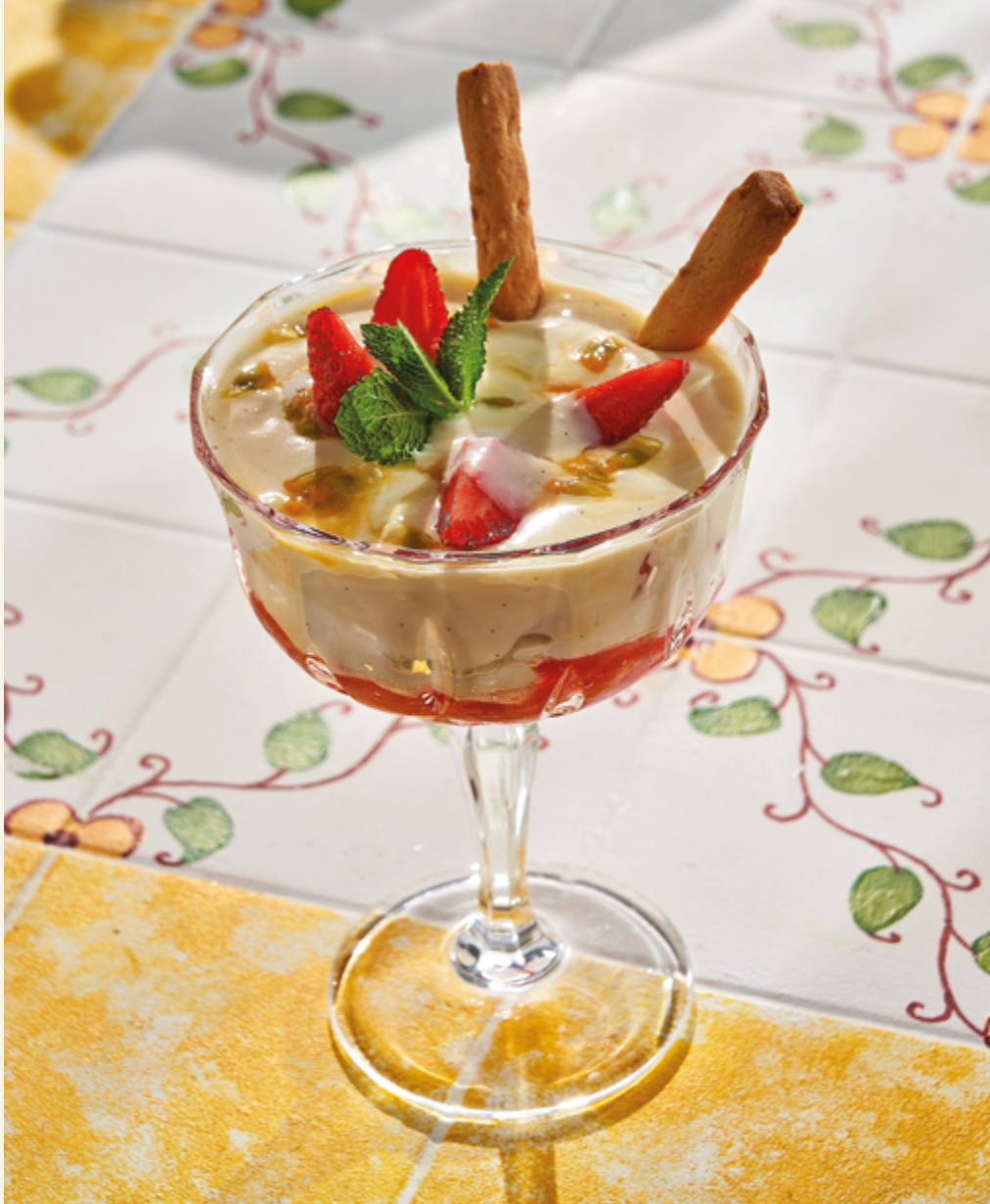
ДЕСЕРТ С МАСКАРПОНЕ И КЛУБНИКОЙ, 790 ₽