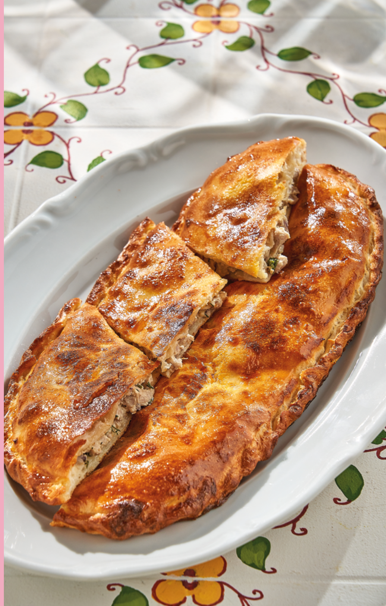
ХАЧАПУРИ С ТУНЦОМ, 1190 ₽