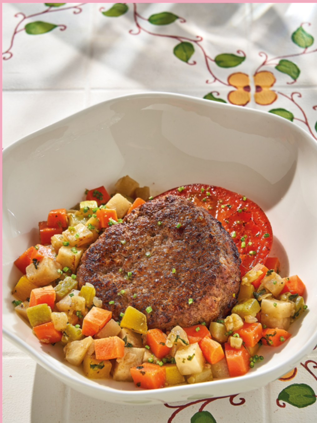
КОТЛЕТА ИЗ БАРАНИНЫ С ПРОВАНСКИМ РАТАТУЕМ, 990 ₽