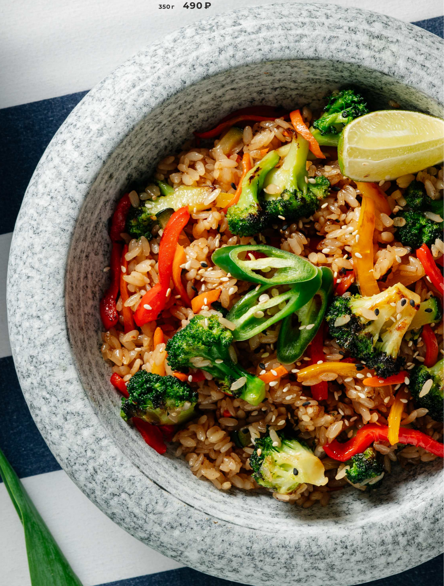
РИС С ОВОЩАМИ В АЗИАТСКОМ СТИЛЕ 350г 490 Р