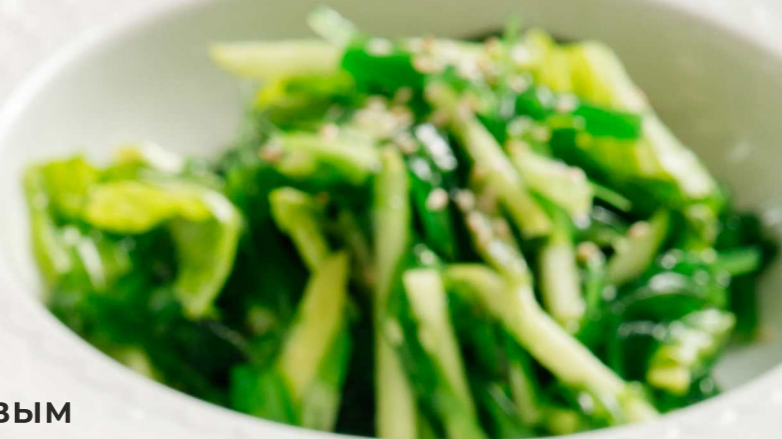
САЛАТ ЧУККА С КУНЖУТНО-ОРЕХОВЫМ СОУСОМ 150г 390 Р