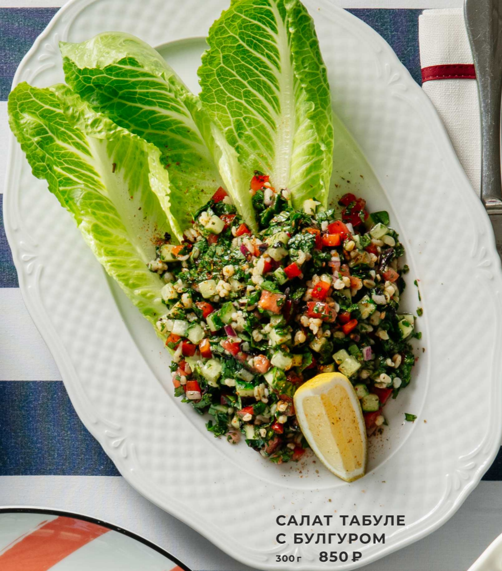
САЛАТ ТАБУЛЕ С БУЛГУРОМ 300г 850 Р