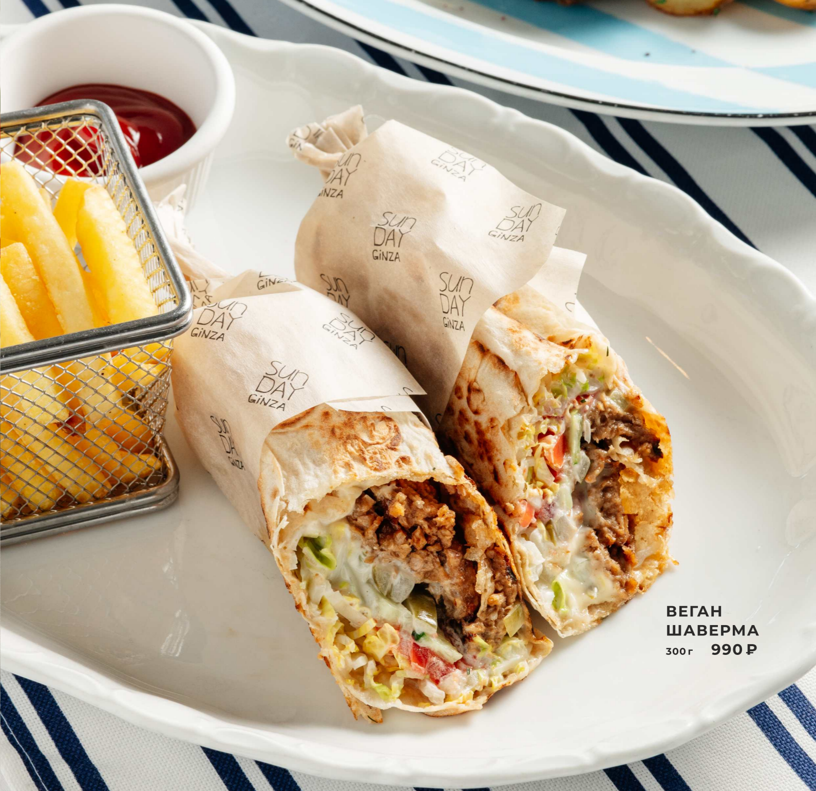
ВЕГАН ШАВЕРМА 300г 990 Р