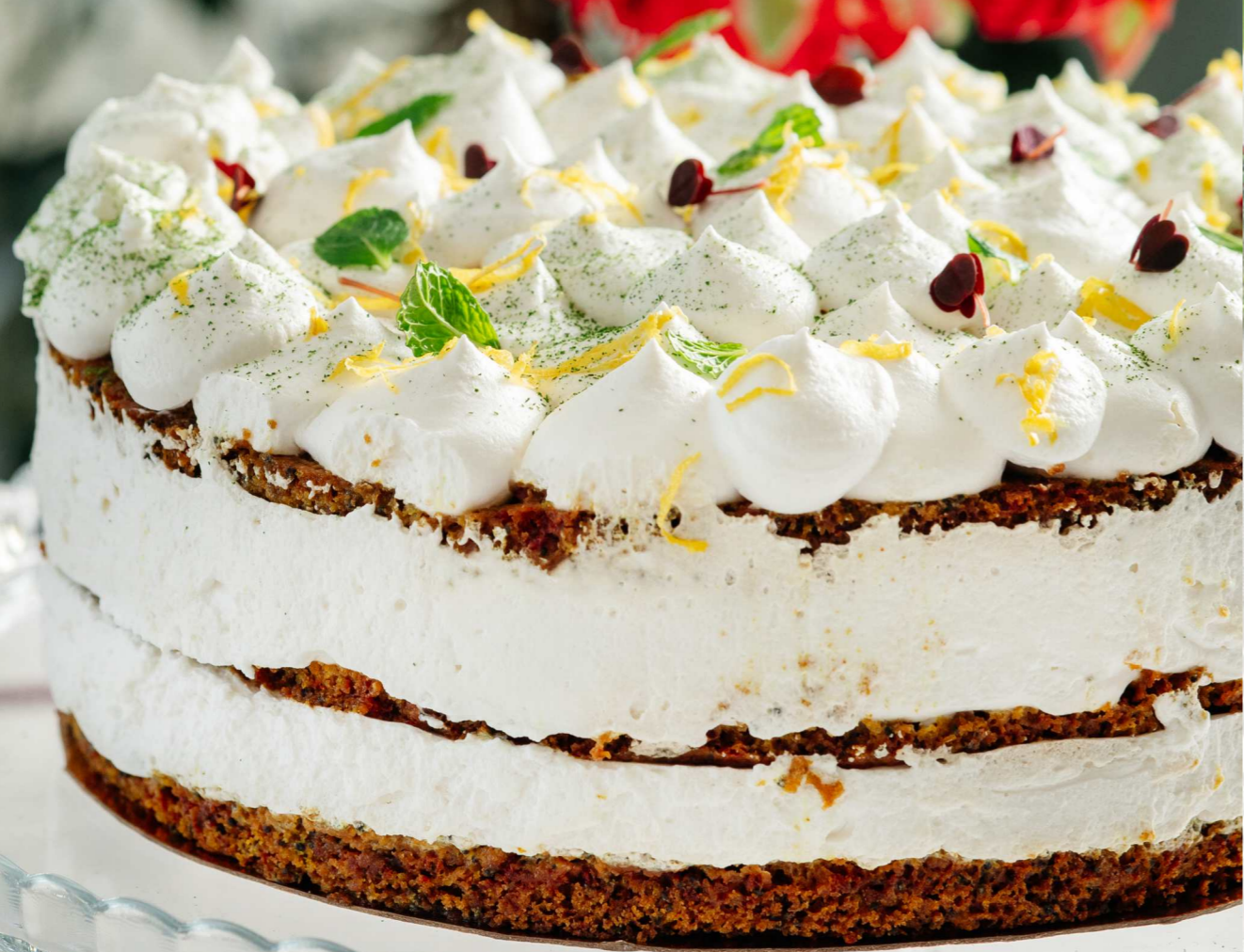
ЛИМОННО-МАКОВЫЙ ТОРТ 150г 590 Р