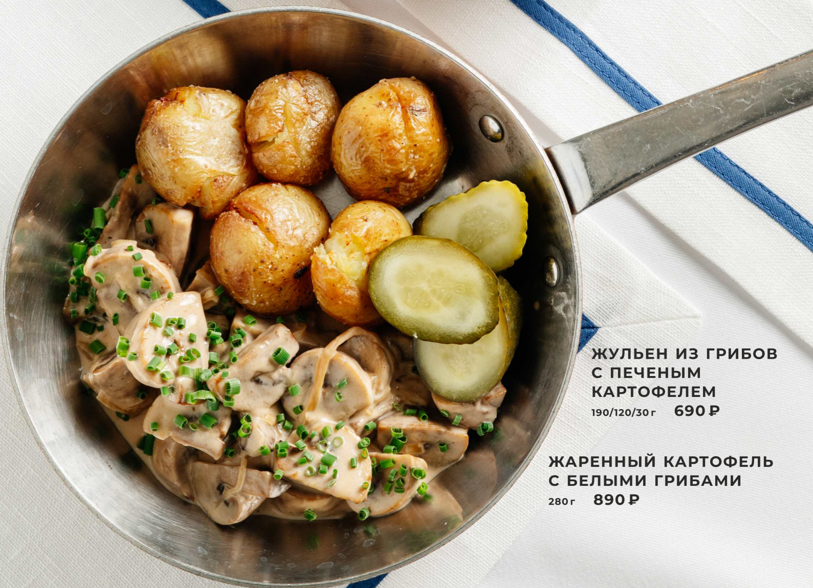
ЖУЛЬЕН ИЗ ГРИБОВ С ПЕЧЕНЫМ КАРТОФЕЛЕМ