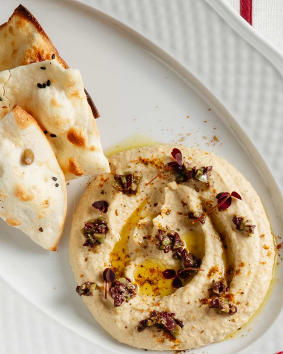
ХУМУС 140/35г 450 Р