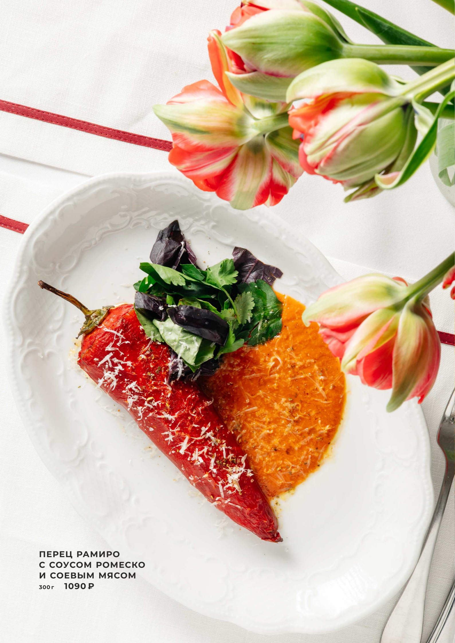
ПЕРЕЦ РАМИРО С СОУСОМ РОМЕСКО И СОЕВЫМ МЯСОМ 300г 1090 Р