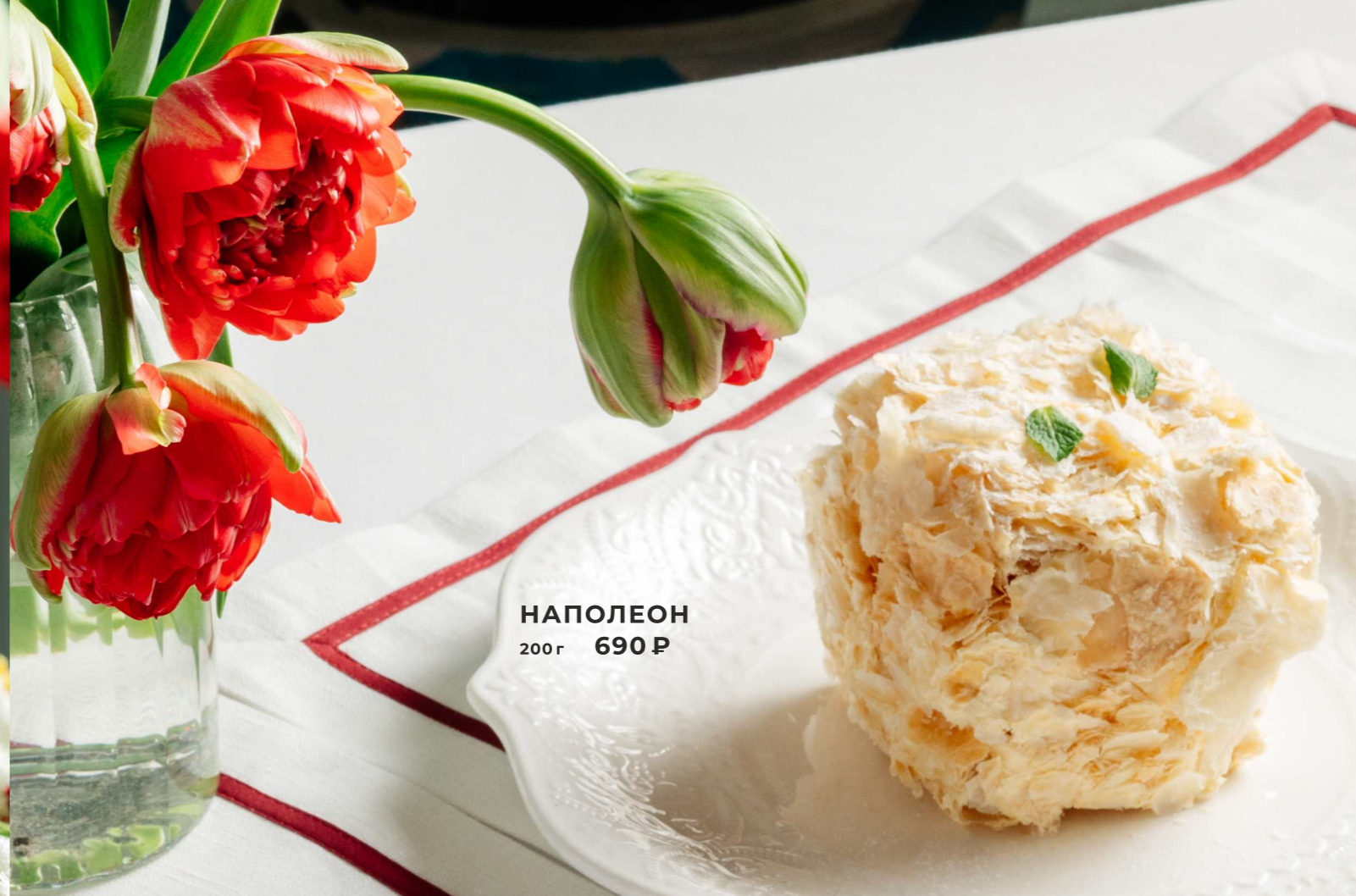
НАПОЛЕОН 200г 690 Р