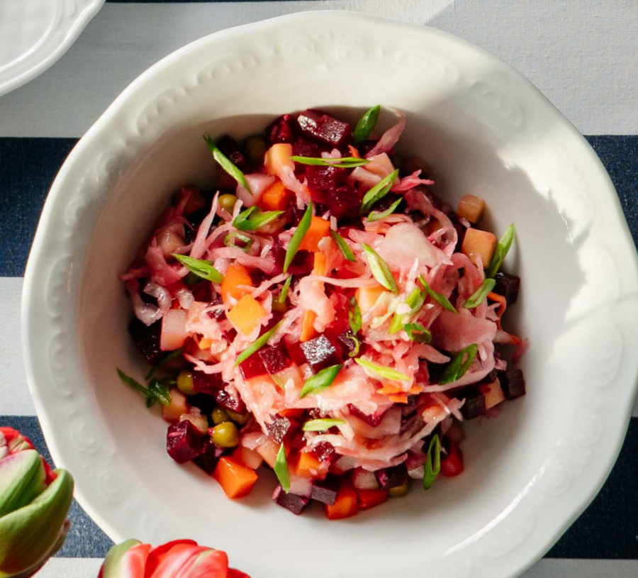
ВИНЕГРЕТ С КВАШЕНОЙ КАПУСТОЙ 220г 350 Р