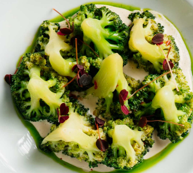
БРОККОЛИ В АЗИАТСКОМ СТИЛЕ С СОУСОМ ИЗ ТОФУ 170г 590 Р