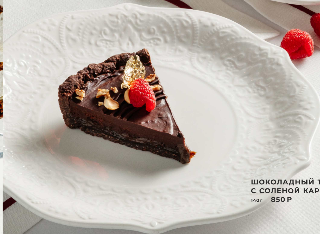
ШОКОЛАДНЫЙ ТАРТ С СОЛЕНОЙ КАРАМЕЛЬЮ 140г 850 Р