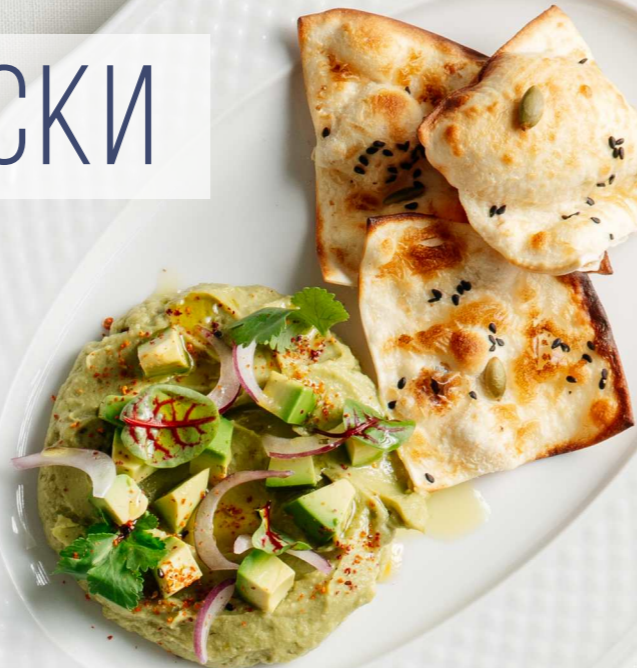
ХУМУС ИЗ АВОКАДО 160г 550 Р