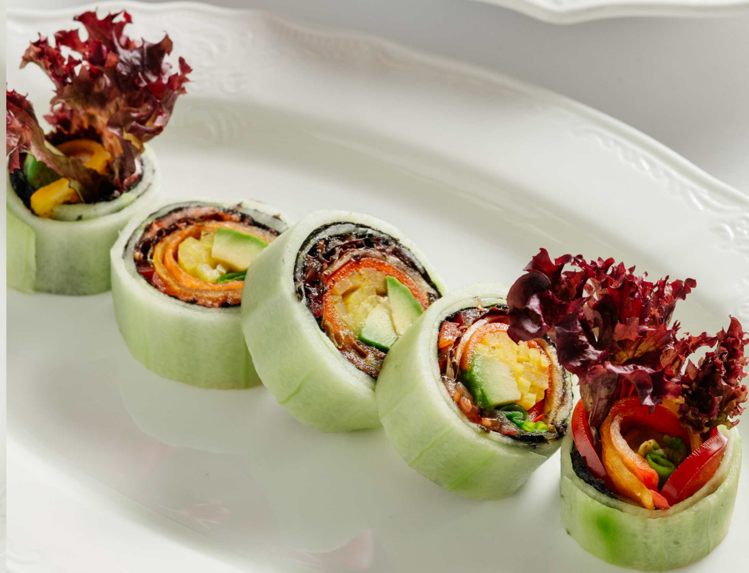
ФИРМЕННЫЙ ФРЕШ РОЛЛ 150г 690 Р