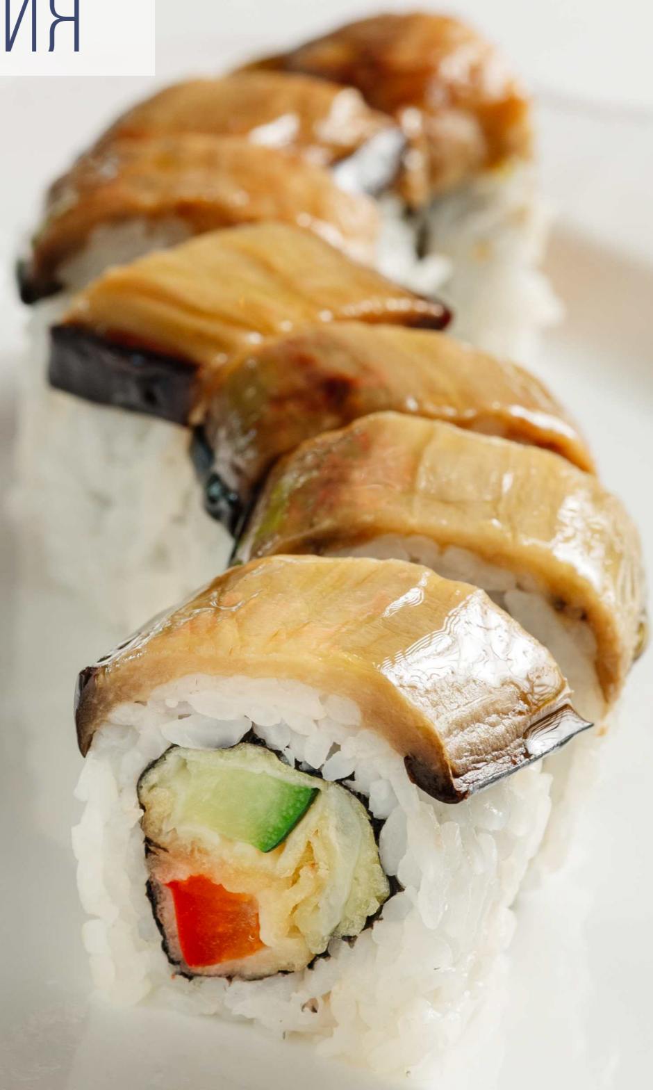
РОЛЛ С ПЕЧеным БАКЛАЖАНОМ И ОВОЩАМИ ТЕМПУРА 210г 590 Р