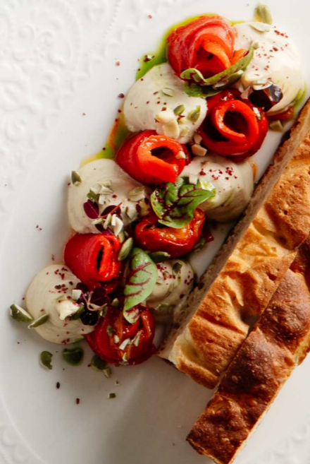
МАРИНОВАННЫЙ ПЕРЧИК РАМИРО С ОРЕХОВЫМ КРЕМОМ 170/70г 650 Р