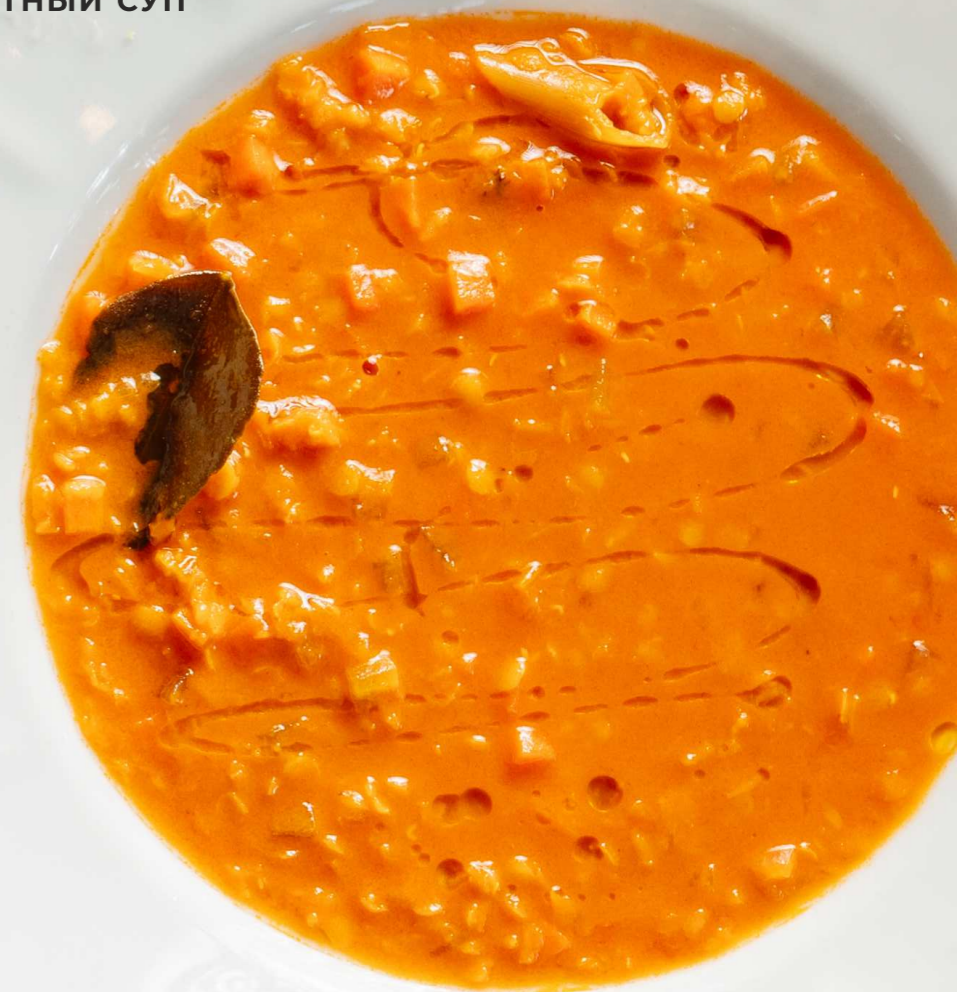
ПРЯНЫЙ ТОМАТНЫЙ СУП С ЧЕЧЕВИЦЕЙ 350 г 390 Р