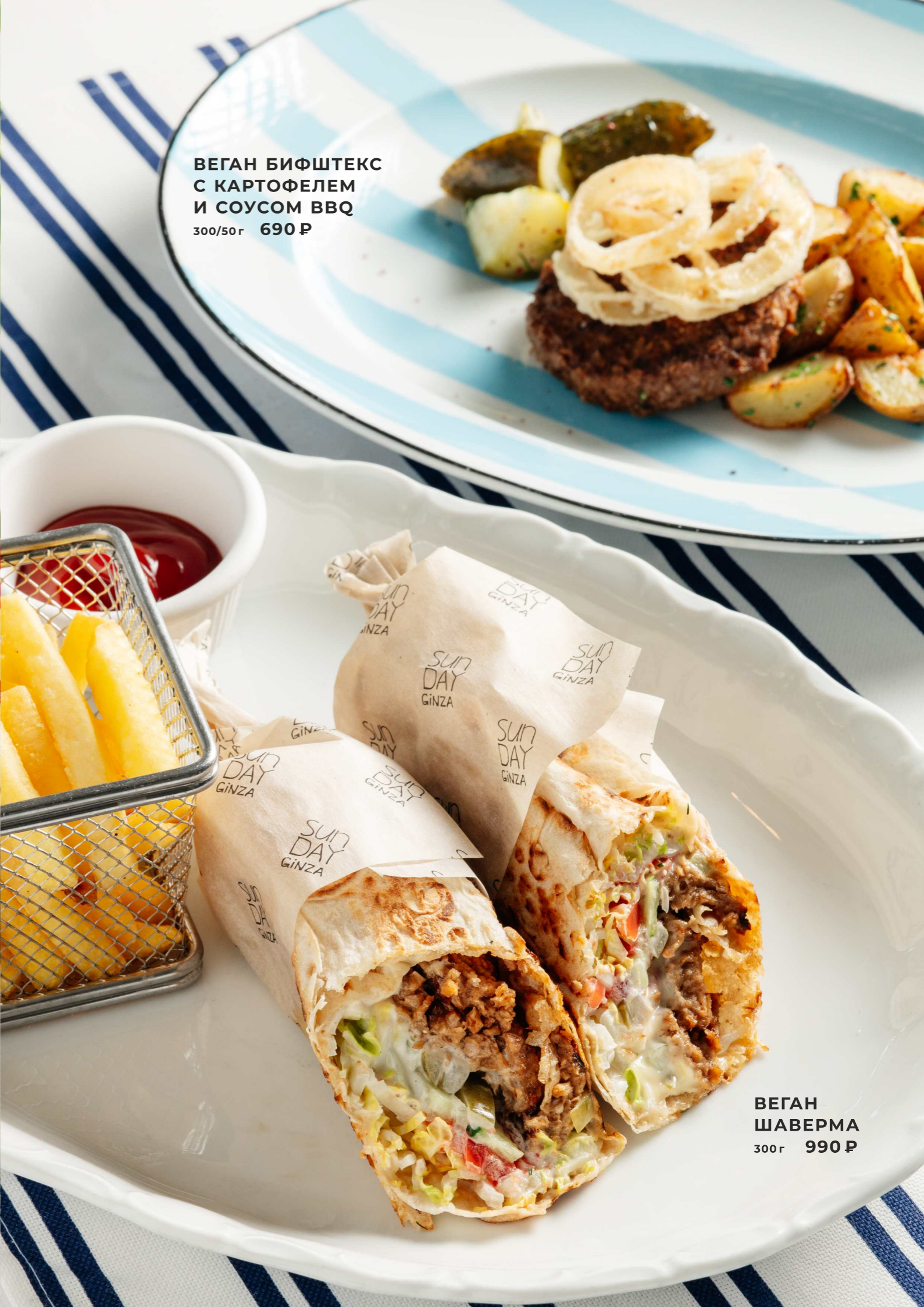
ВЕГАН БИФШТЕКС С КАРТОФЕЛЕМ И СОУСОМ BBQ 300/50г 690 Р