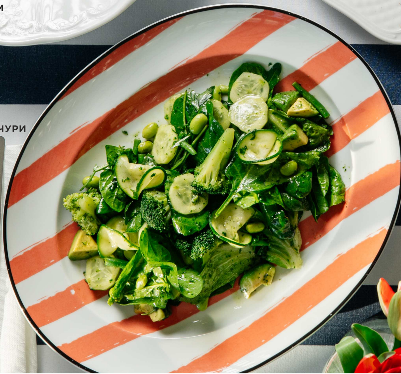
ЗЕЛЕНЬ САЛАТ С СОУСОМ ЧИМИЧУРИ 260г 1090 Р