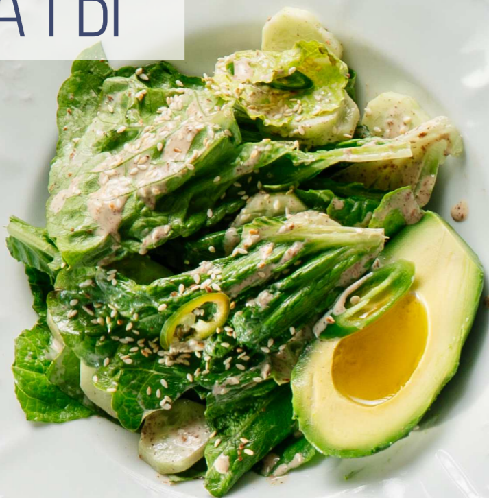
САЛАТ ИЗ АВОКАДО С МОЛОДЫМ РОМЕЙНОМ В ОРЕХОВОЙ ЗАПРАВКЕ 230г 790 Р