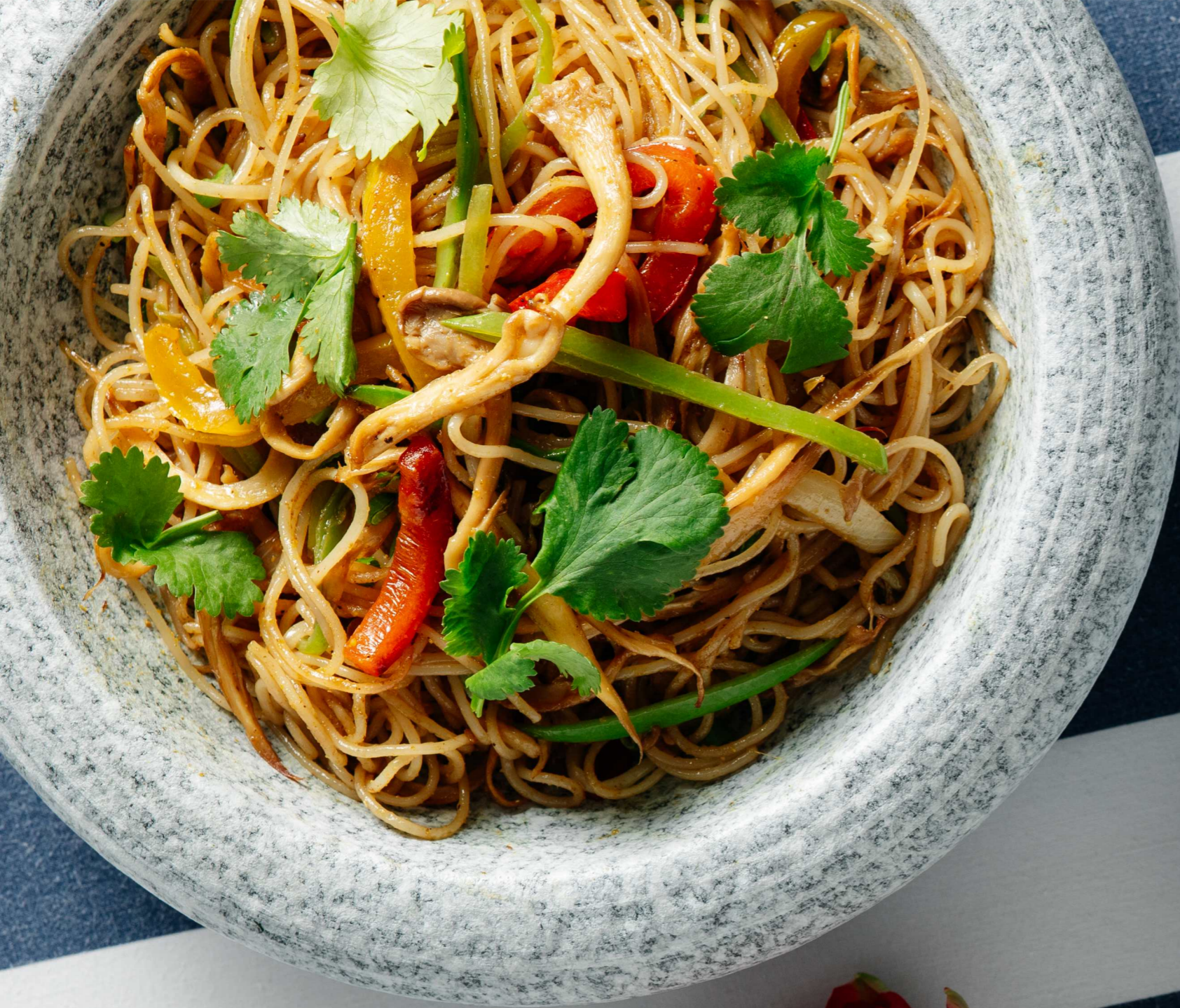
ЛАПША ПО-СИНГАПУРСКИ С ОВОЩАМИ 250г 550 Р