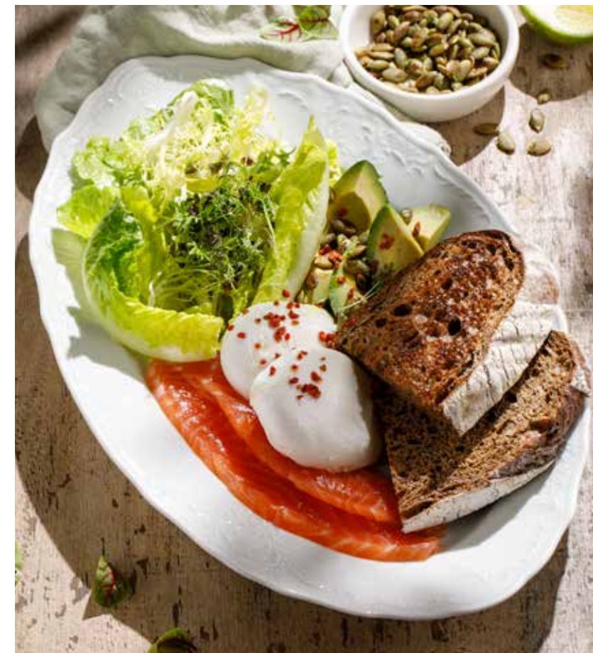
ЗЕЛЕНЬ ЗАВТРАК GREEN BREAKFAST