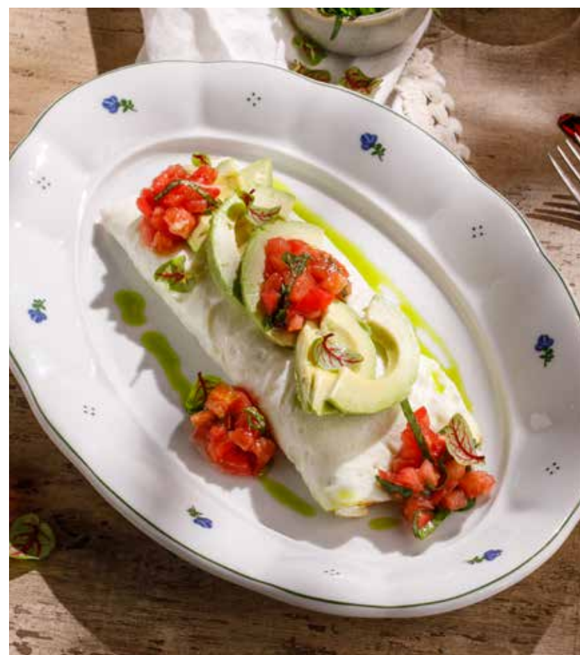
БЕЛКОВЫЙ ОМЛЕТ С АВОКАДО И ТОМАТНОЙ САЛЬСОЙ EGG WHITE OMELETTE WITH AVOCADO AND TOMATO SALSA 850 Р