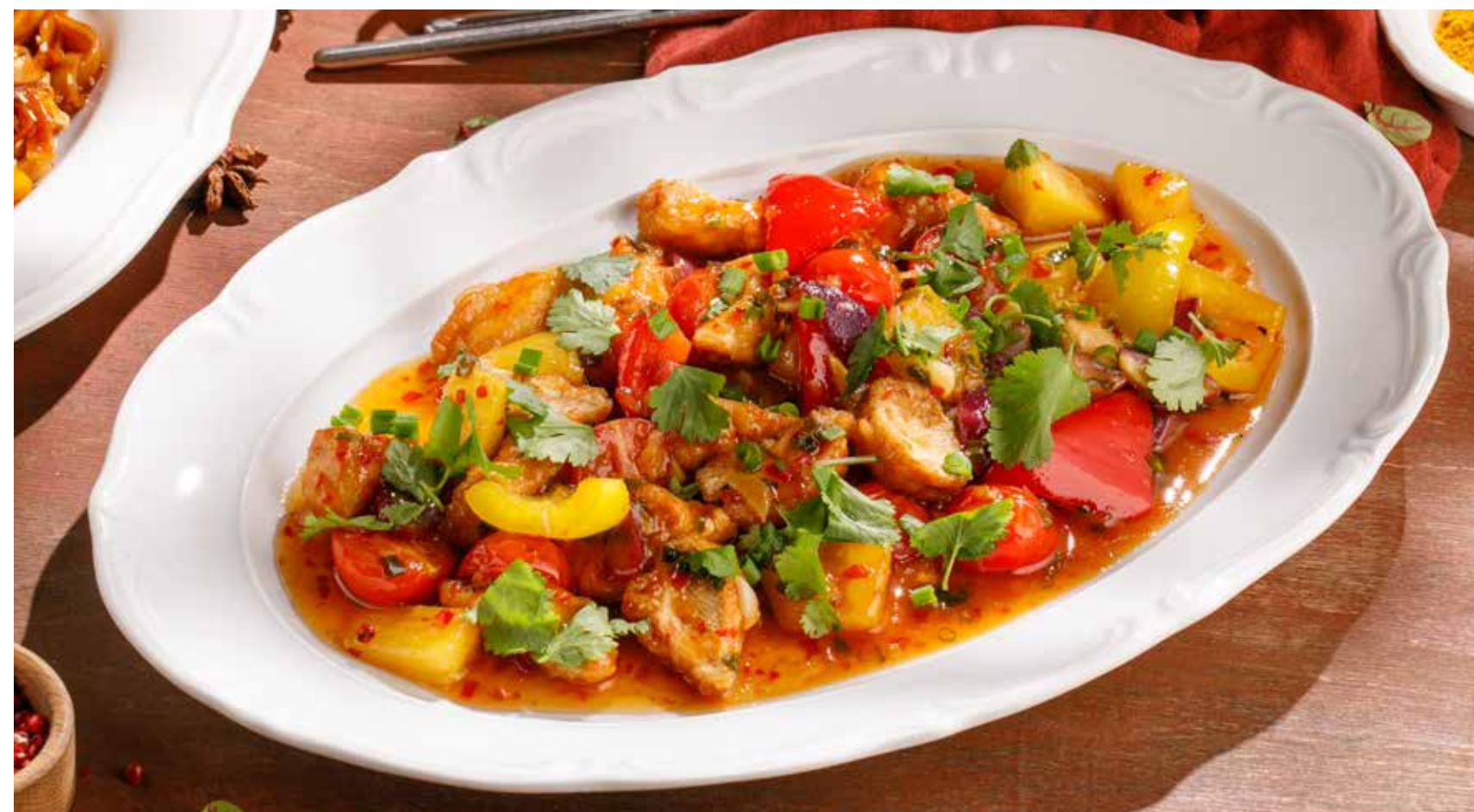
КУРИЦА С АНАНАСАМИ PINEAPPLE CHICKEN