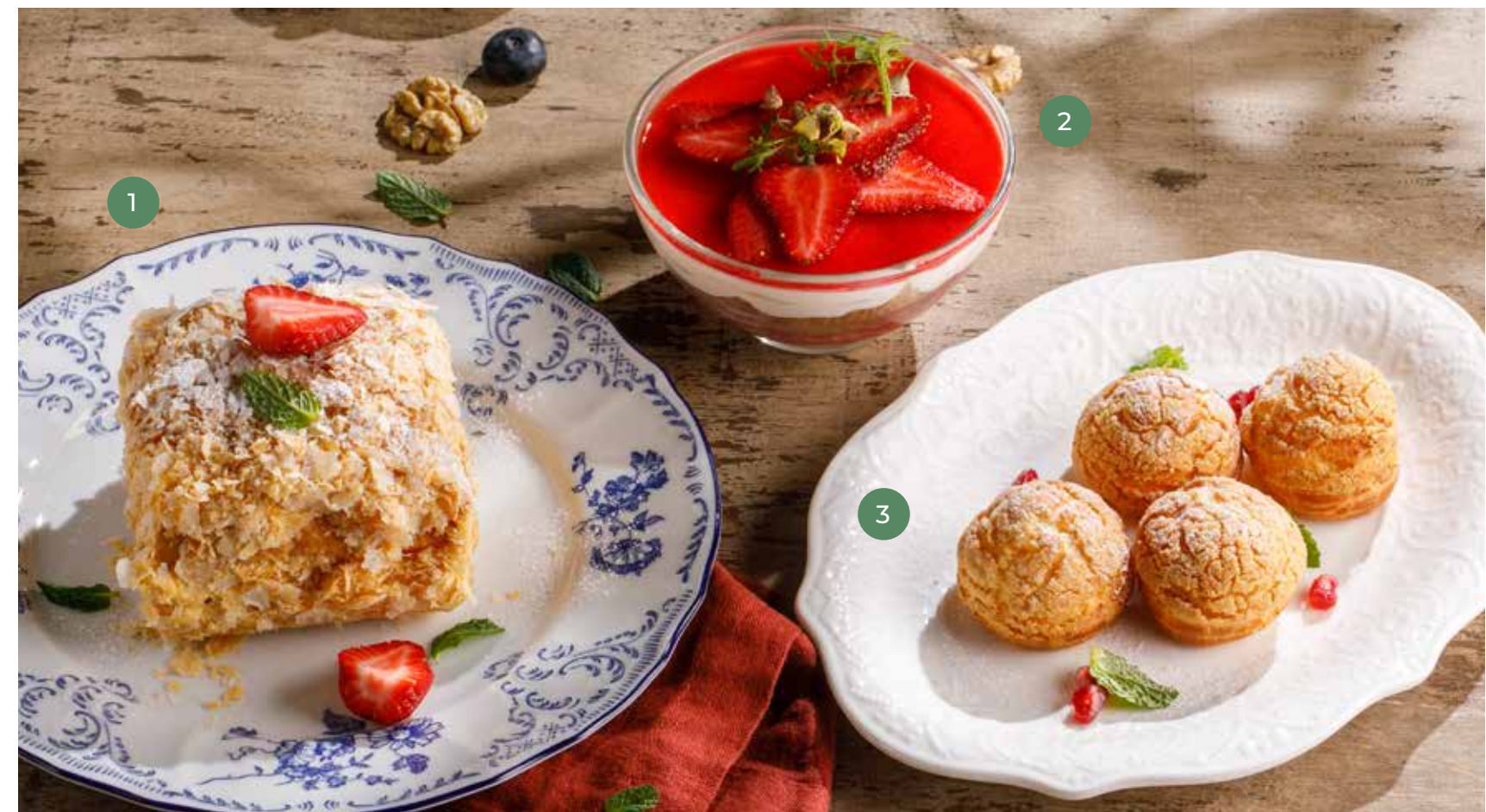
① НАПОЛЕОН С ЗАВАРНЫМ КРЕМОМ NAPOLEON CAKE WITH CUSTARD CREAM