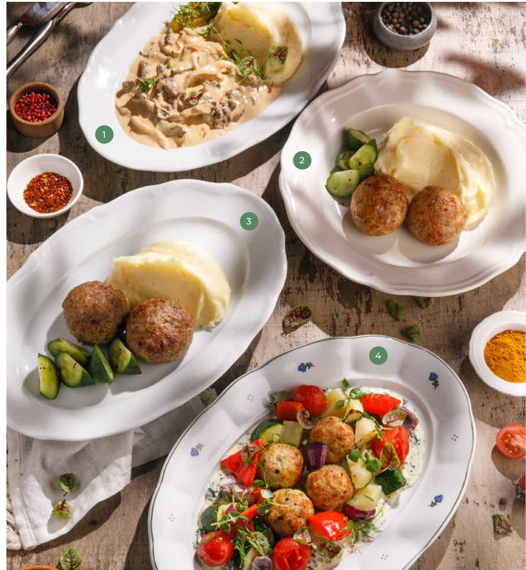
① БЕФСТРОГАНОВ С КАРТОФЕЛЬНЫМ ПЮРЕ BEEF STROGANOFF WITH MASHED POTATOES