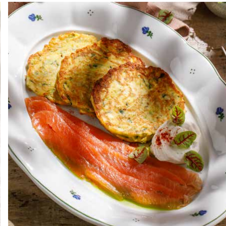
ОЛАДЬИ ИЗ ЦУКИНИ с форелью шеф-посола и соусом крем-чиз ZUCCHINI PANCAKES WITH CHEF'S SALTED TROUT AND CREAM CHEESE SAUCE