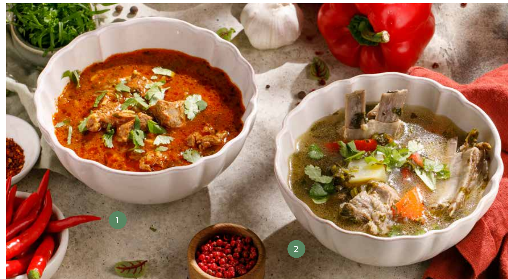
① ХАРЧО С ГОВЯДИНОЙ BEEF KHARCHO