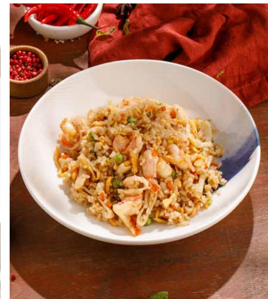
РИС С МОРЕПРОДУКТАМИ SEAFOOD RICE