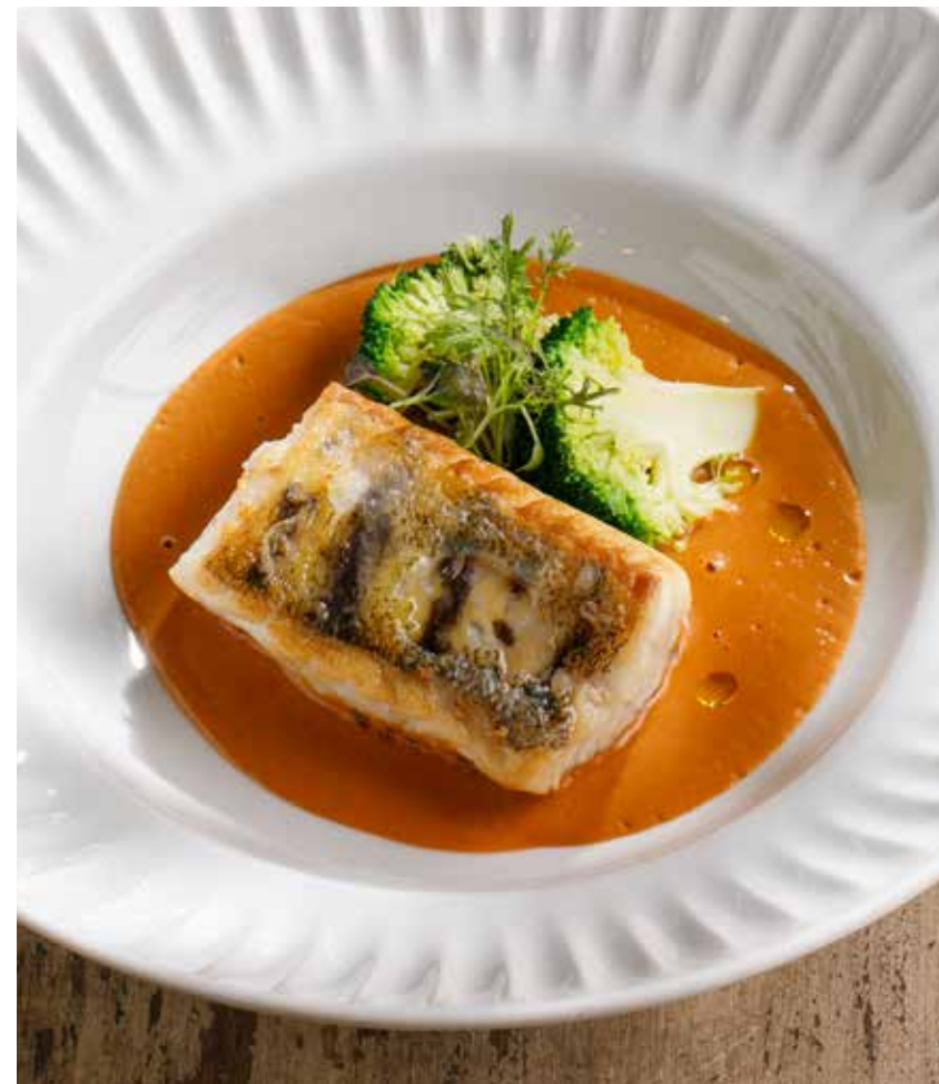
СУДАК В СОУСЕ БИСК PIKE PERCH IN BISQUE SAUCE