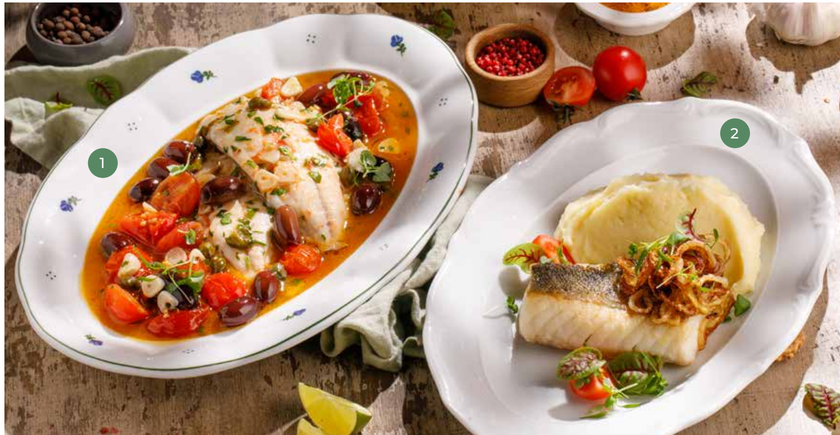
① ФИЛЕ ДОРАДО С ЧЕРРИ ТОМАТАМИ И МАСЛИНАМИ КАЛАМАТА DORADO FILLET WITH CHERRY TOMATOES AND KALAMATA OLIVES