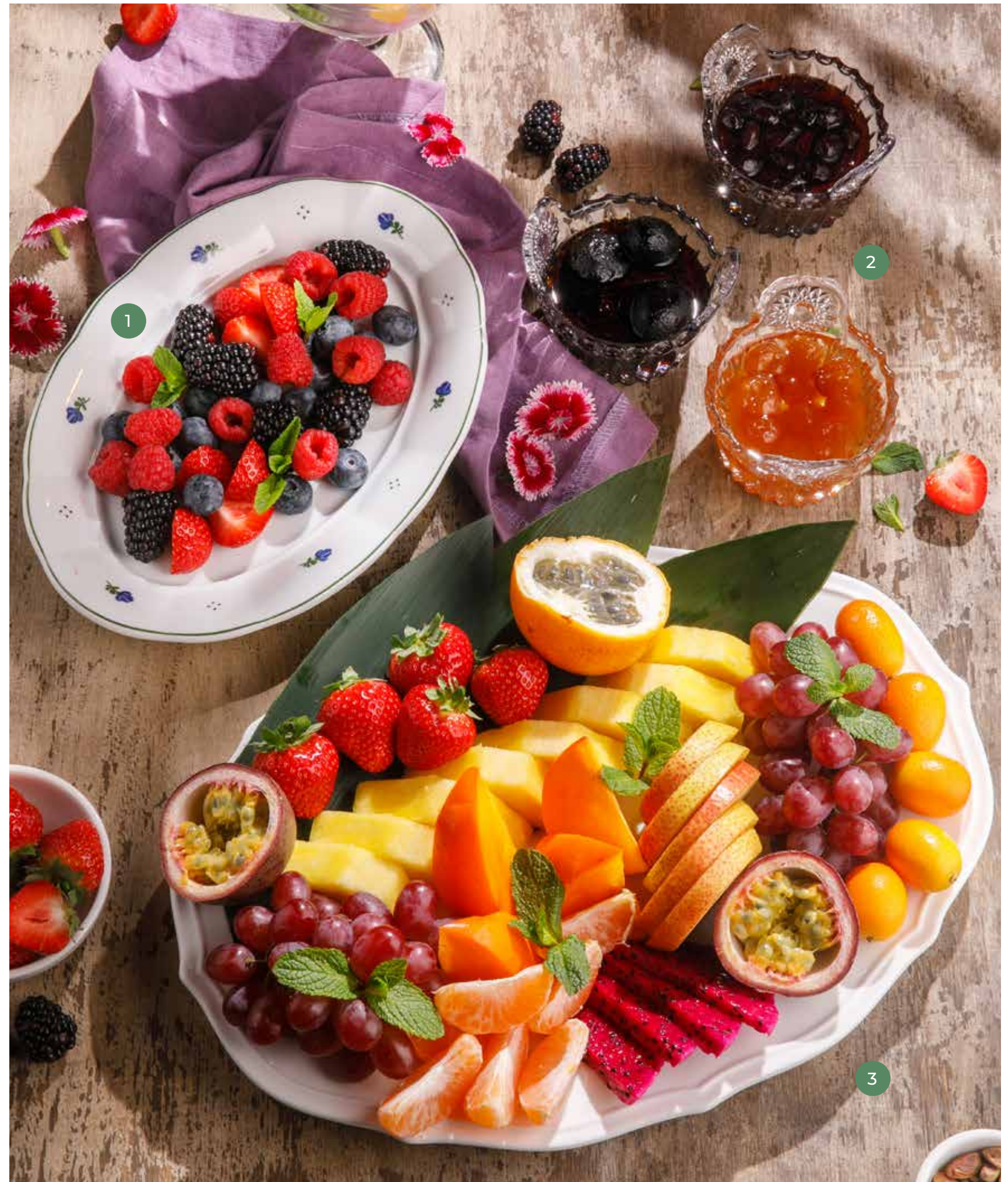
① СЕЗОННЫЕ ЯГОДЫ SEASONAL BERRIES