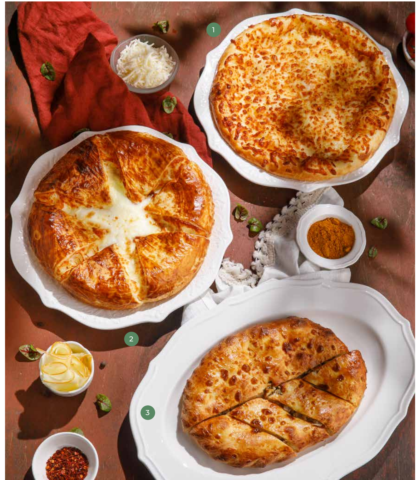
① ХАЧАПУРИ ПО-МЕГРЕЛЬСКИ MEGRELIAN KHACHAPURI