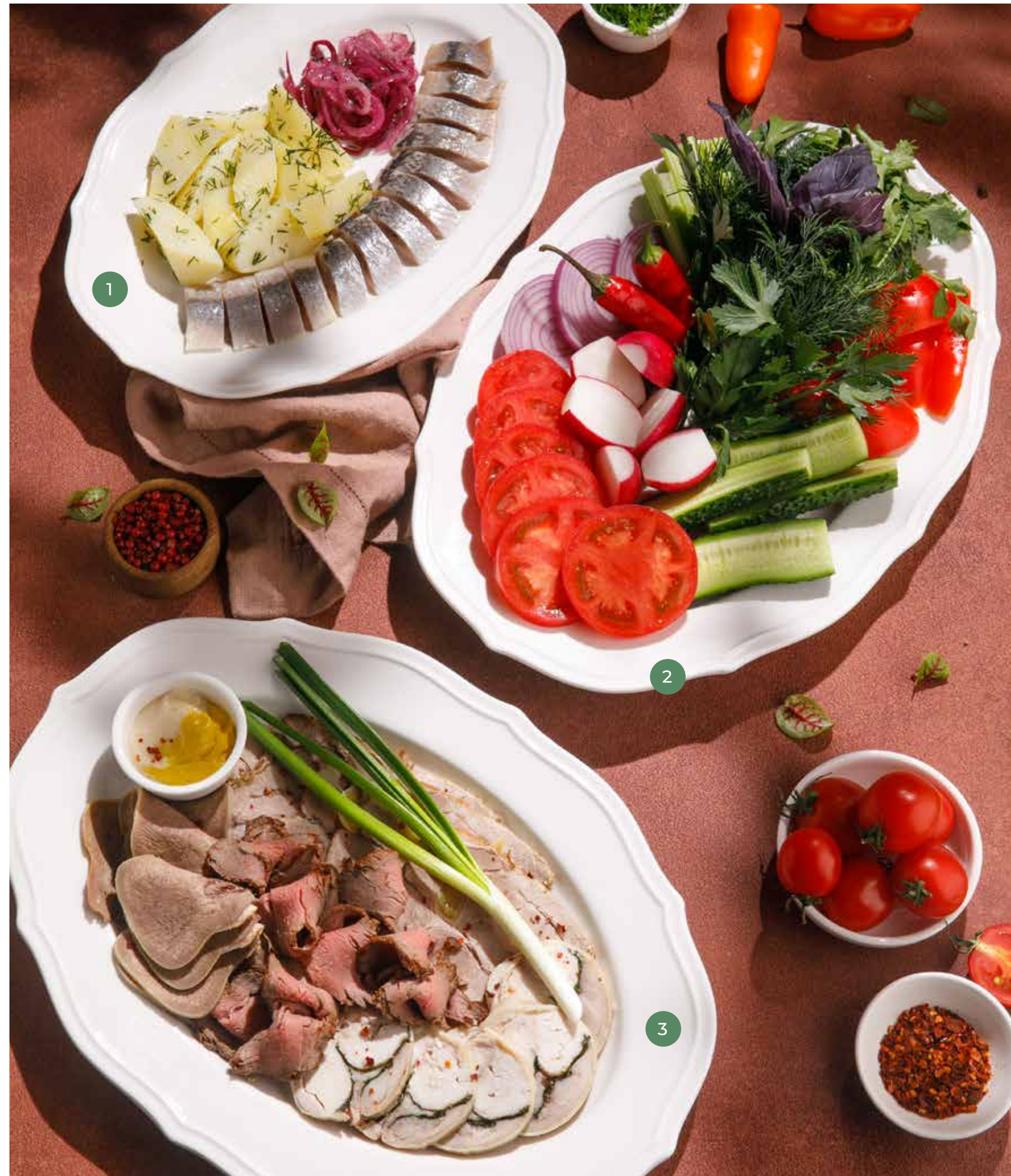
① СЕЛЬДЬ С КАРТОФЕЛЕМ 650 ₺ HERRING WITH POTATOES