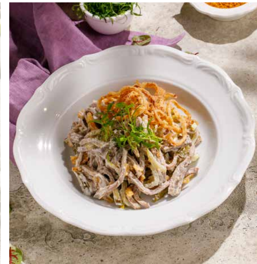
САЛАТ С ГОВЯЖЬИМ ЯЗЫКОМ И ЛУКОМ ФРИ SALAD WITH BOILED BEEF TONGUE AND FRENCH FRIED ONIONS