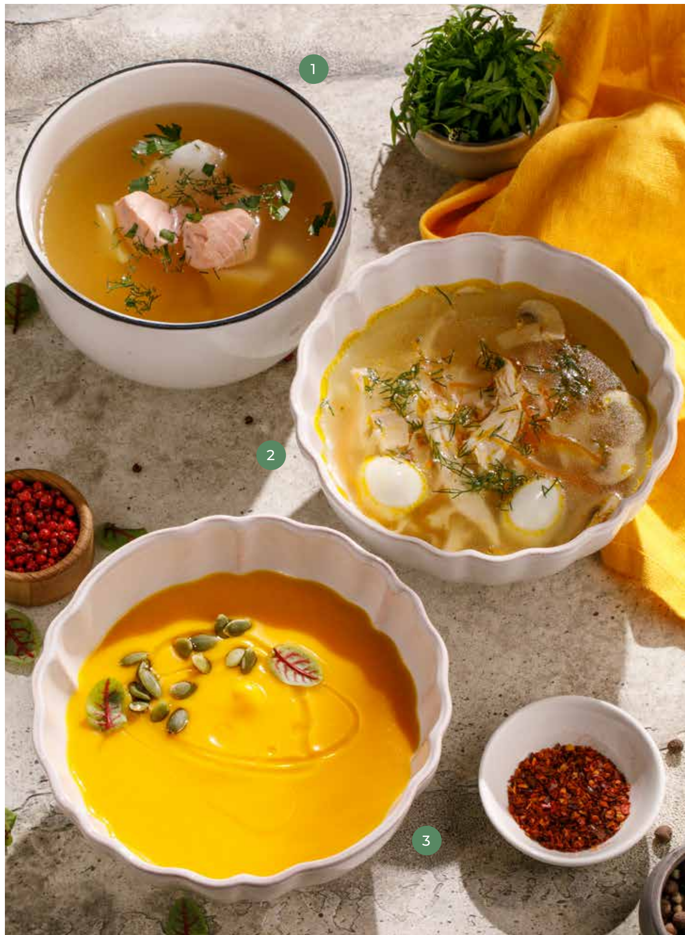
① УХА FISH SOUP