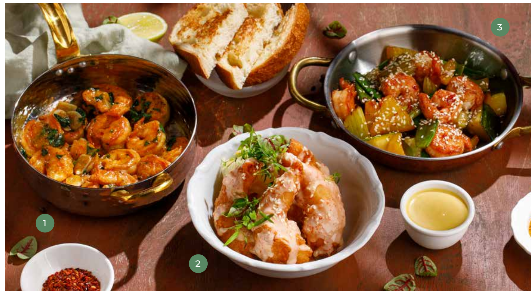
① КРЕВЕТКИ С ЧЕСНОКОМ И ПЕТРУШКОЙ FRIED SHRIMP WITH GARLIC AND PARSLEY