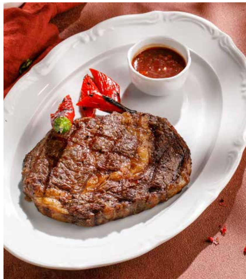
СТЕЙК РИБАЙ RIB EYE STEAK