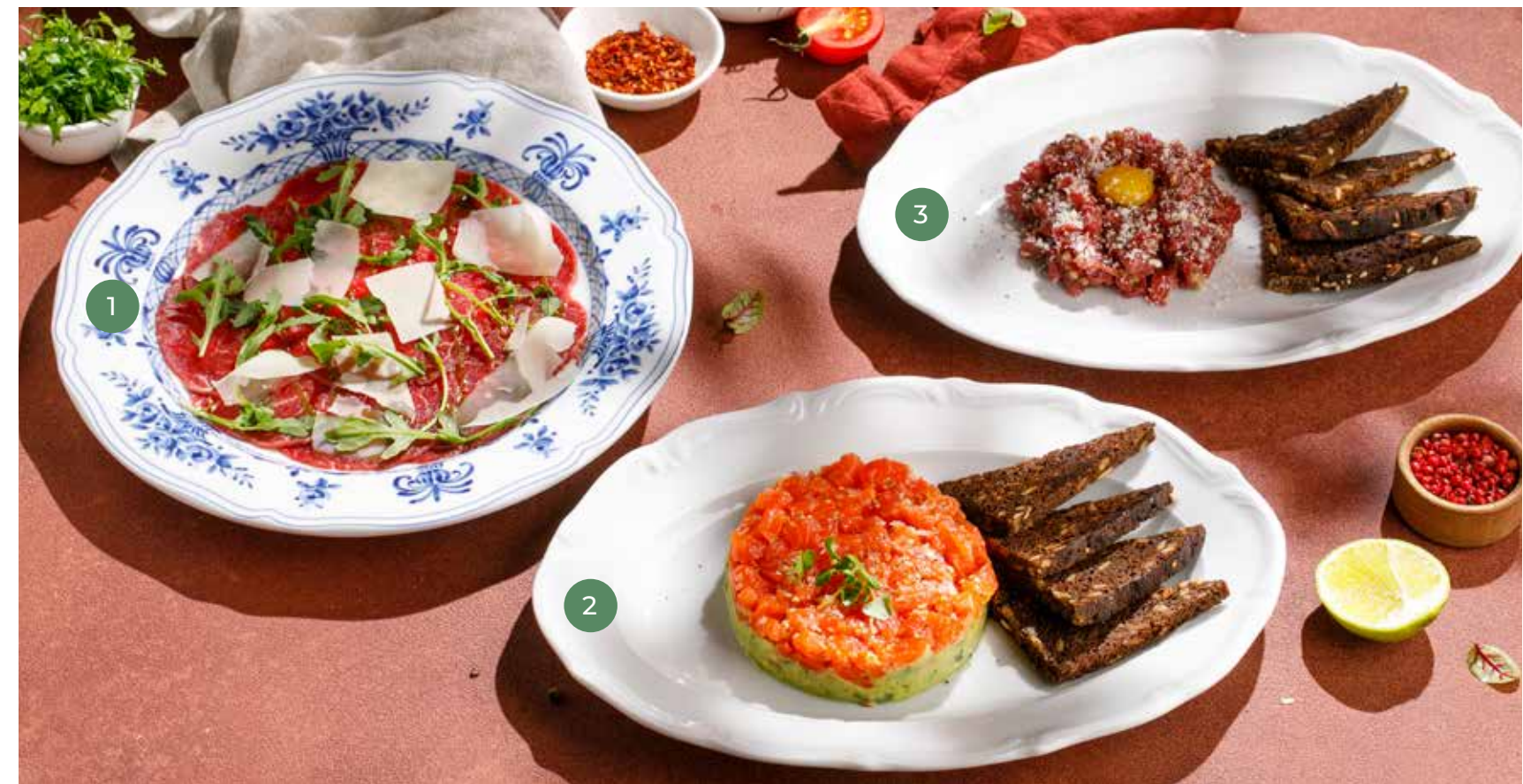
① КАРПАЧО ИЗ ГОВЯДИНЫ BEEF CARPACCIO