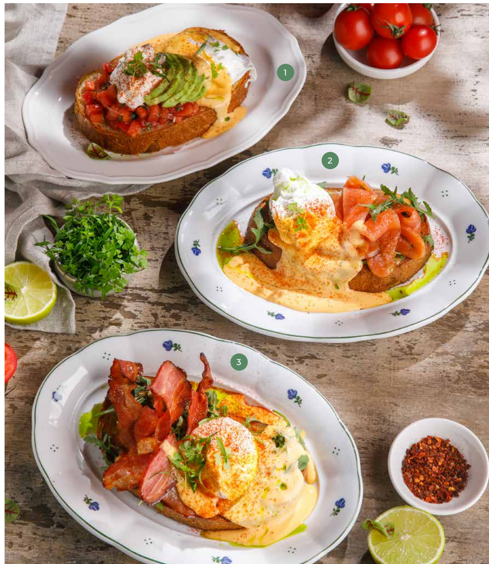
① ЯЙЦО БЕНЕДИКТ с авокадо и страчателлой EGG BENEDICT WITH AVOCADO AND STRACCIATELLA 790 Р