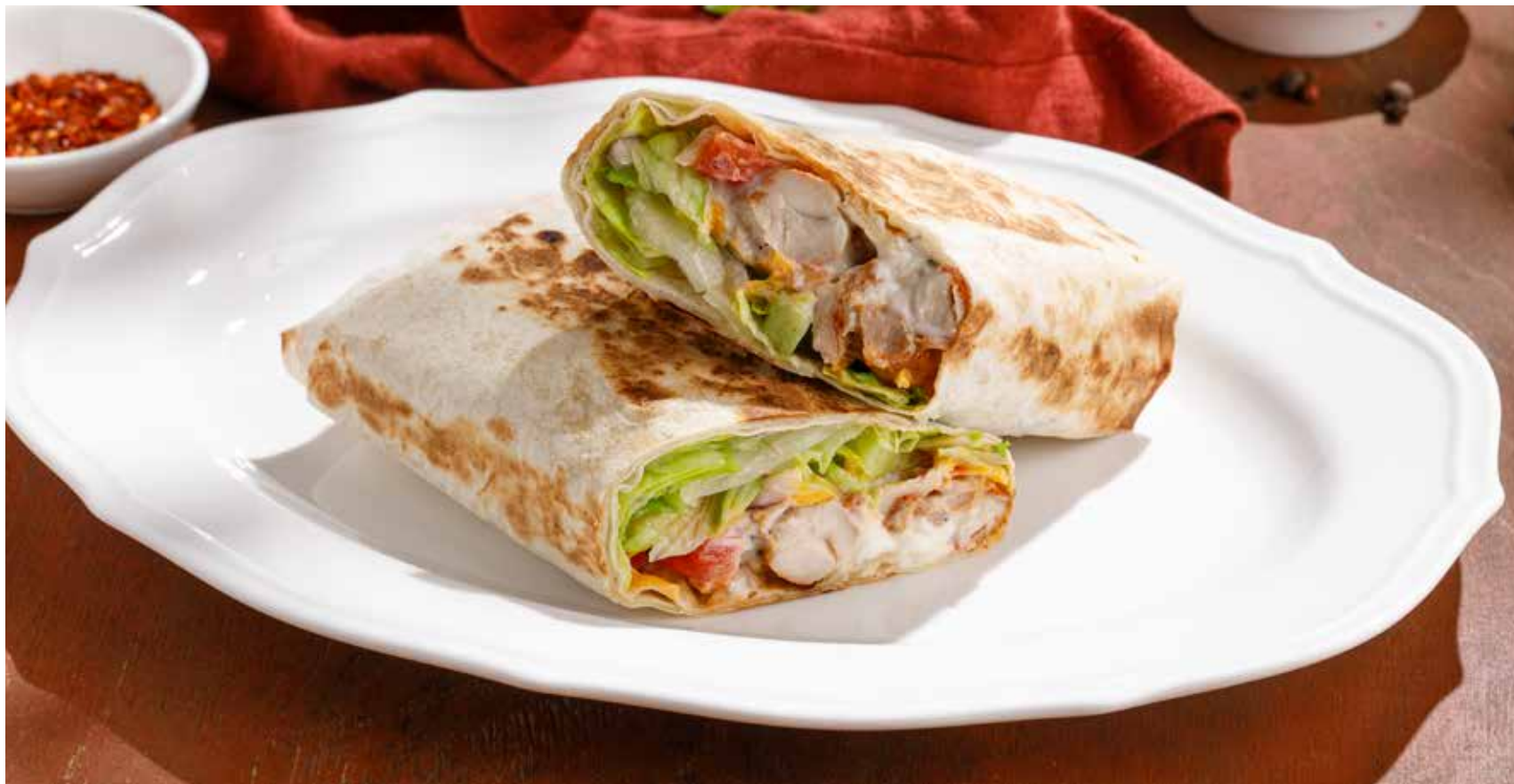
ШАВЕРМА С КУРОЙ CHICKEN SHAWARMA