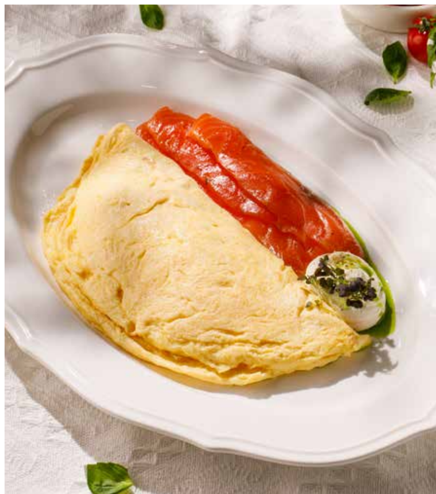
ОМЛЕТ С ФОРЕЛЬЮ И СОУСОМ КРЕМ-ЧИЗ OMELETTE WITH TROUT AND CREAM CHEESE SAUCE 990 Р