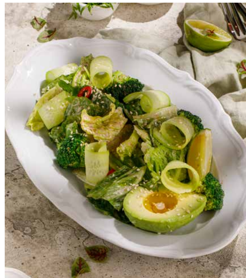
САЛАТ С АВОКАДО, листьями ромейна и ореховым соусом AVOCADO SALAD WITH ROMAINE AND NUT SAUCE