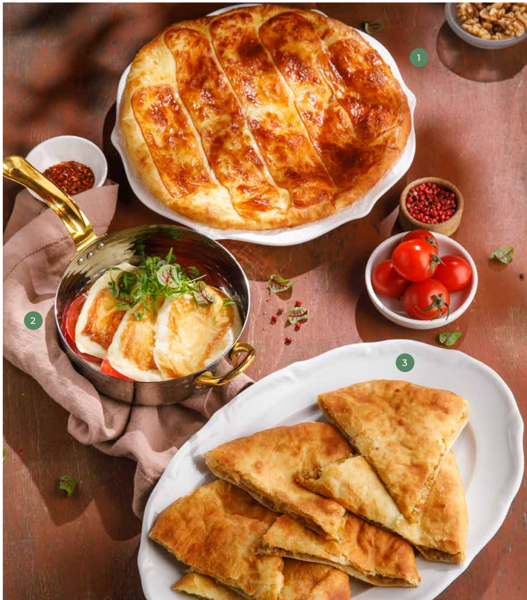
① ХАЧАПУРИ С КОПЧЕНЫМ СЫРОМ СУЛГУНИ KNACHAPURI WITH SMOKED SULGUNİ