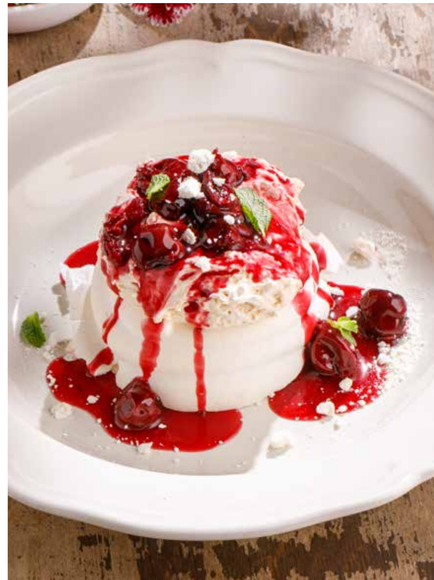
ПАВЛОВА С ВИШНЕВЫМ СОУСОМ PAVLOVA WITH CHERRY SAUCE