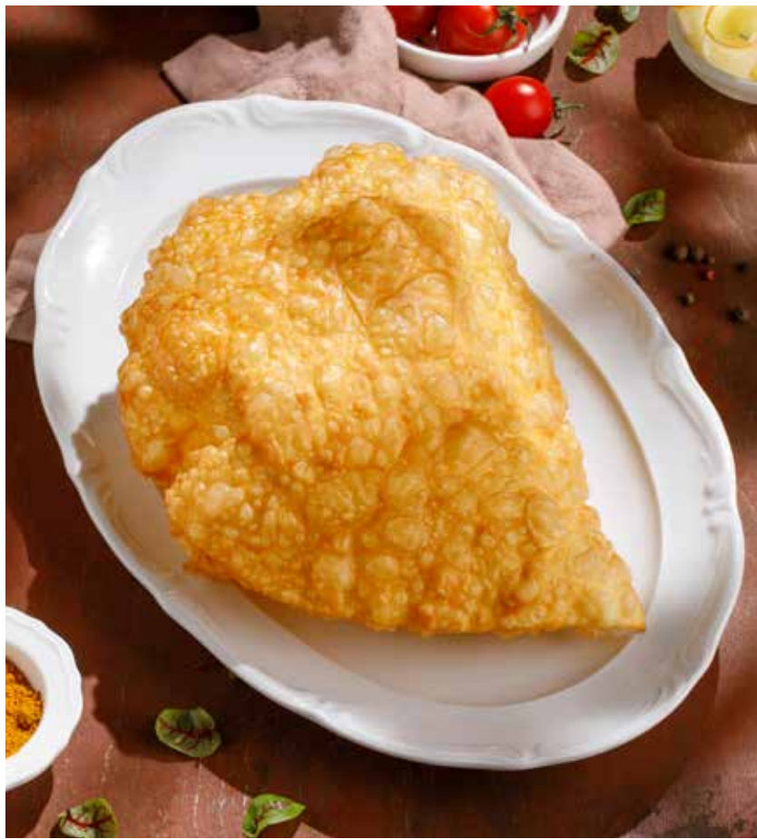
ЧЕБУРЕК | CHEBUREK С СЫРОМ | WITH CHEESE С ТЕЛЯТИНОЙ | WITH VEAL С БАРАНИНОЙ | WITH LAMB