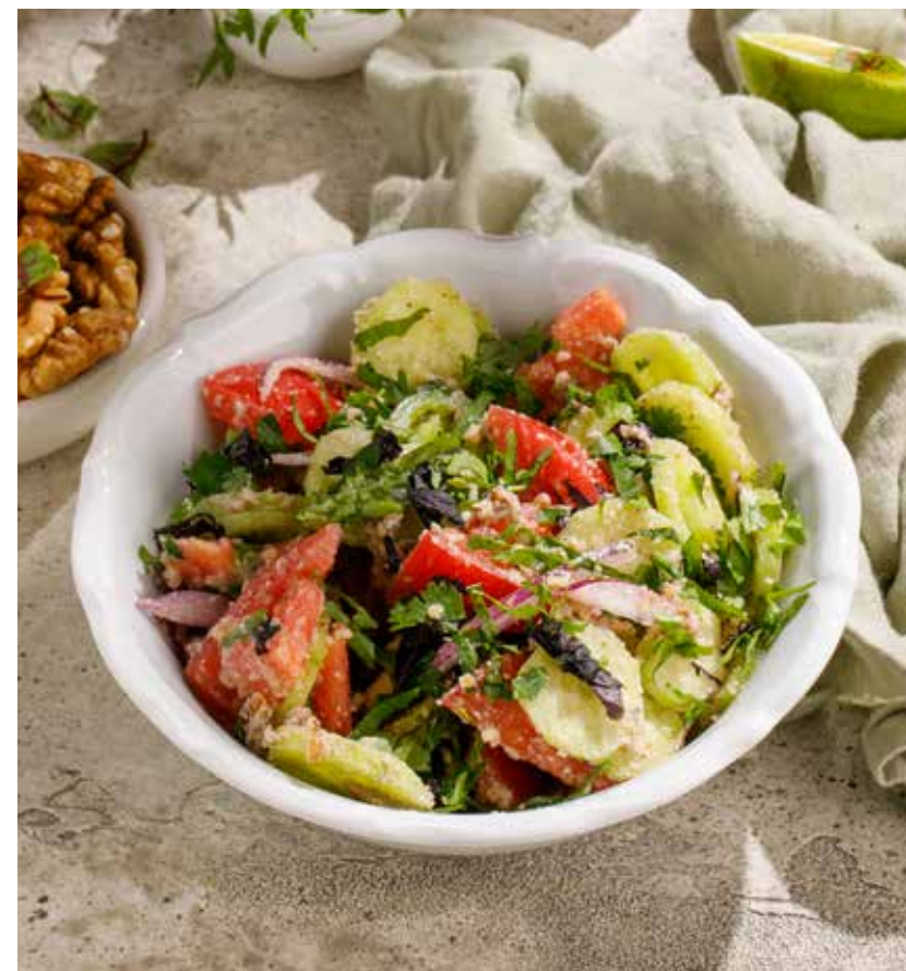
ОВОЩНОЙ САЛАТ ПО-ГРУЗИНСКИ со специями / с орехами GEORGIAN VEGETABLE SALAD WITH SPICES / WITH NUTS