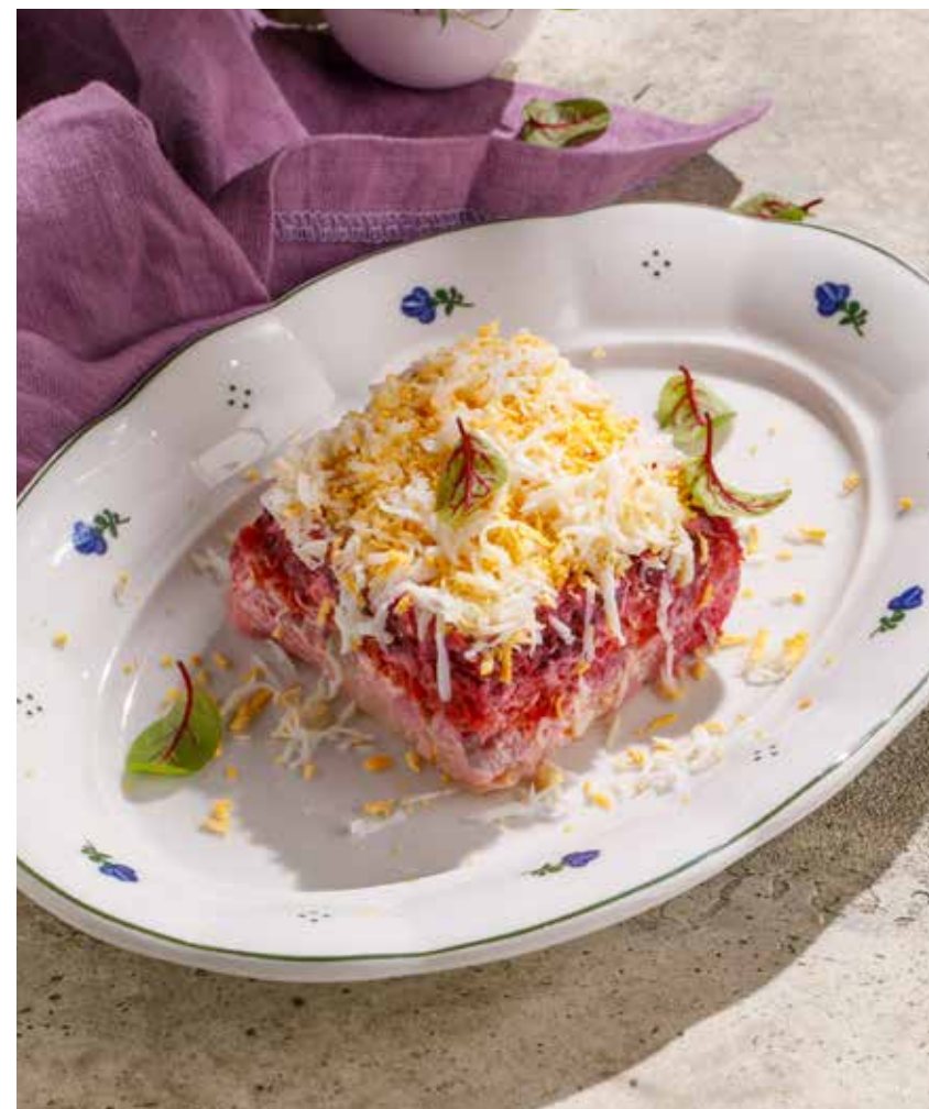
СЕЛЬДЬ ПОД ШУБОЙ DRESSED HERRING