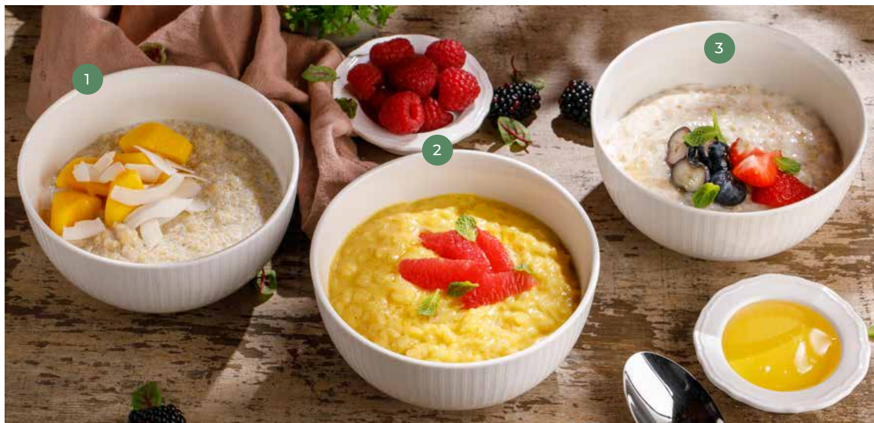
① КИНОА НА КОКОСОВОМ МОЛОКЕ QUINOA PORRIDGE ON COCONUT MILK 590 Р