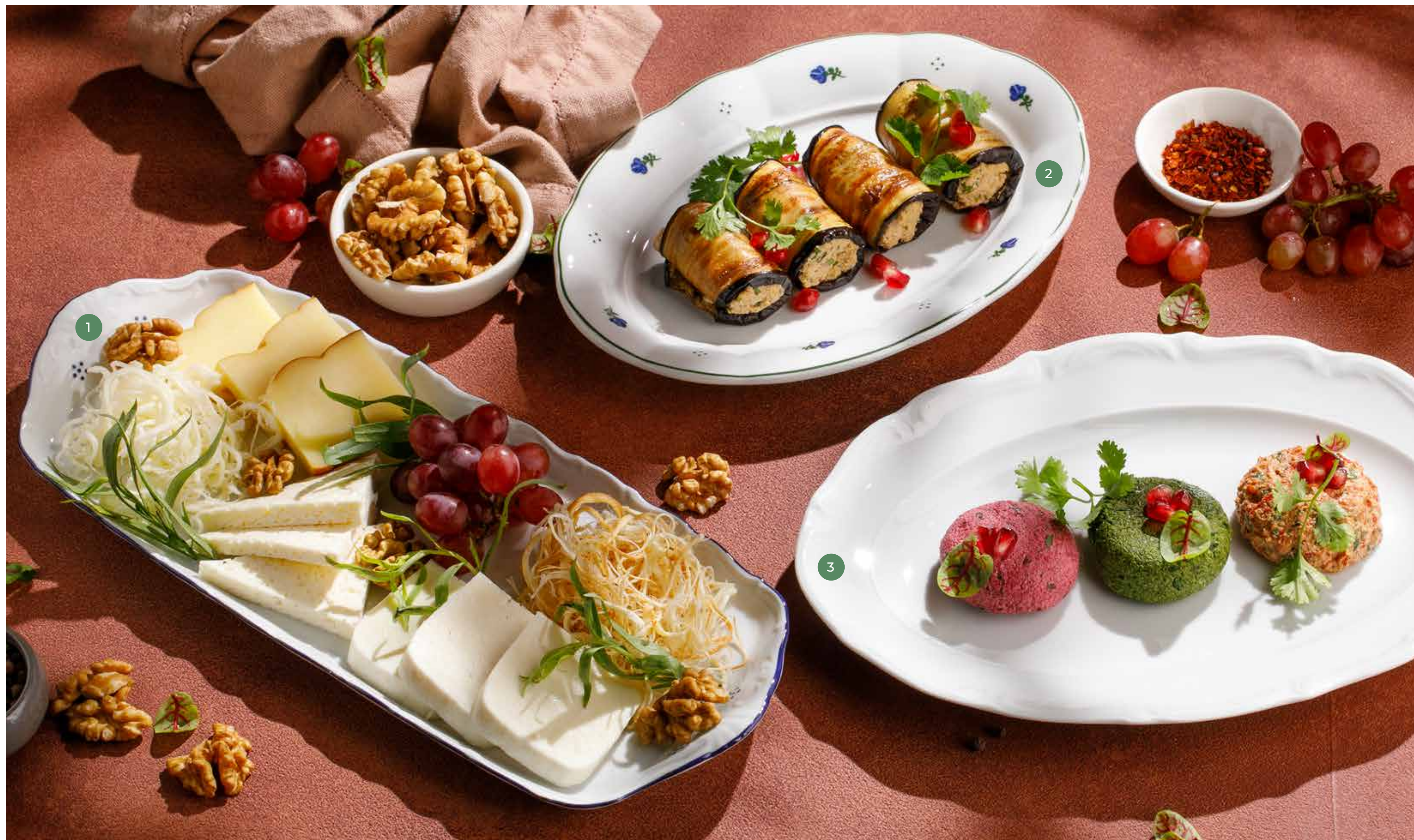
① АССОРТИ ДОМАШНИХ СЫРОВ HOMEMADE CHEESE PLATTER