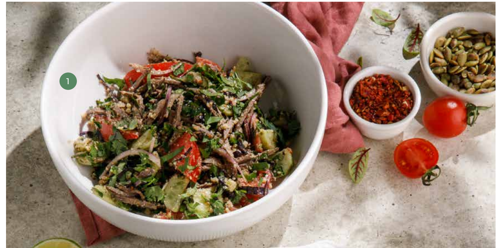
① САЛАТ С ОВОЩАМИ, ГОВЯДИНОЙ И ГРЕЦКИМИ ОРЕХАМИ VEGETABLE SALAD WITH BEEF AND WALNUTS