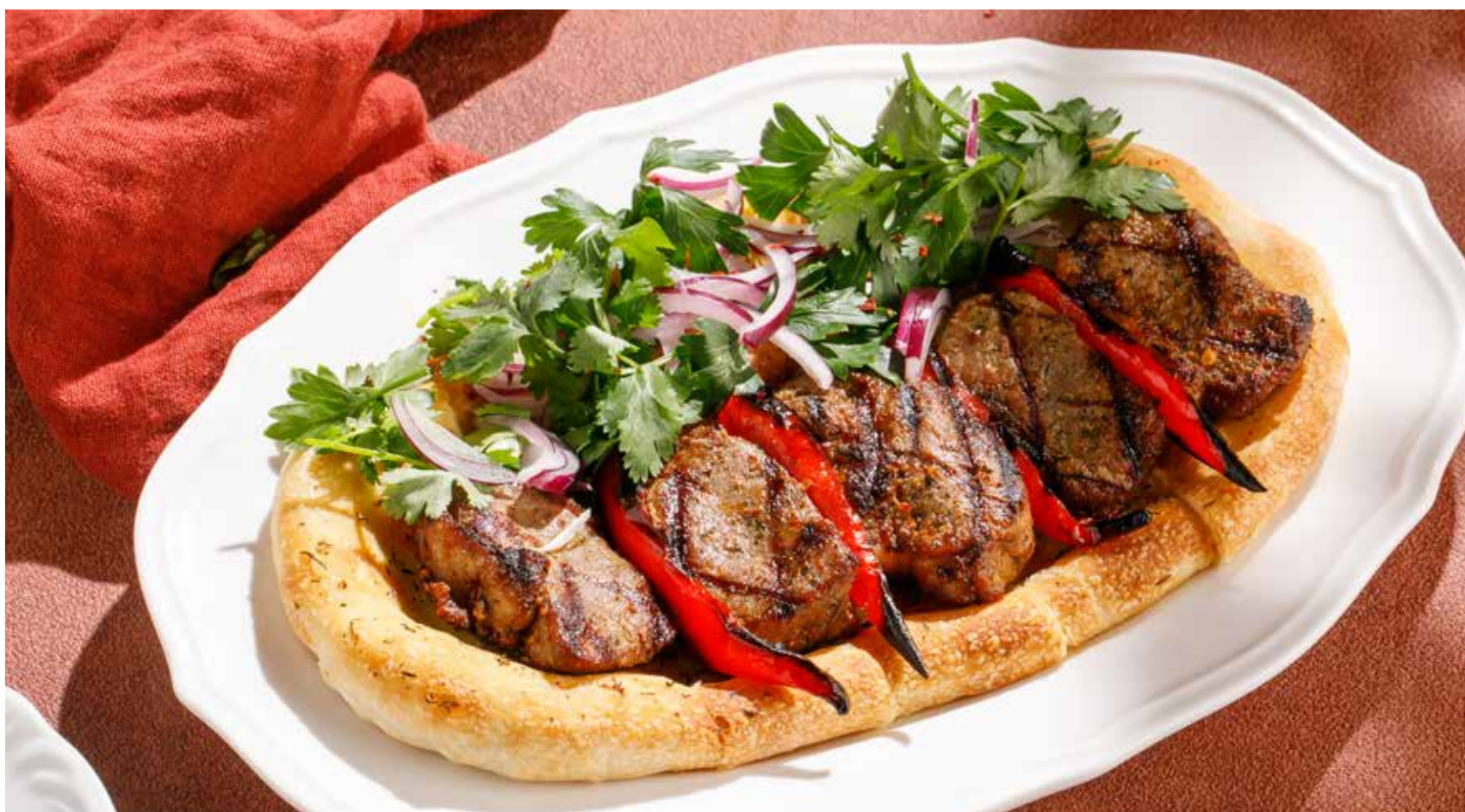
СЕДЛО ЯГНЕНКА SADDLE OF LAMB