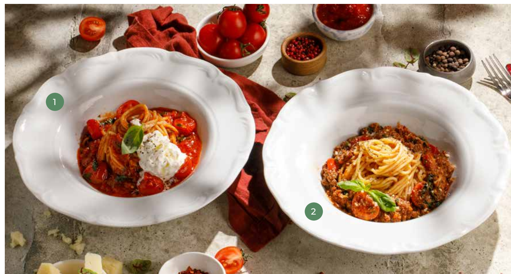
① СПАГЕТТИ «ПОМОДОРНИ» СО СТРАЧАТЕЛЛОЙ SPAGHETTI POMODORINI WITH STRACCIATELLA