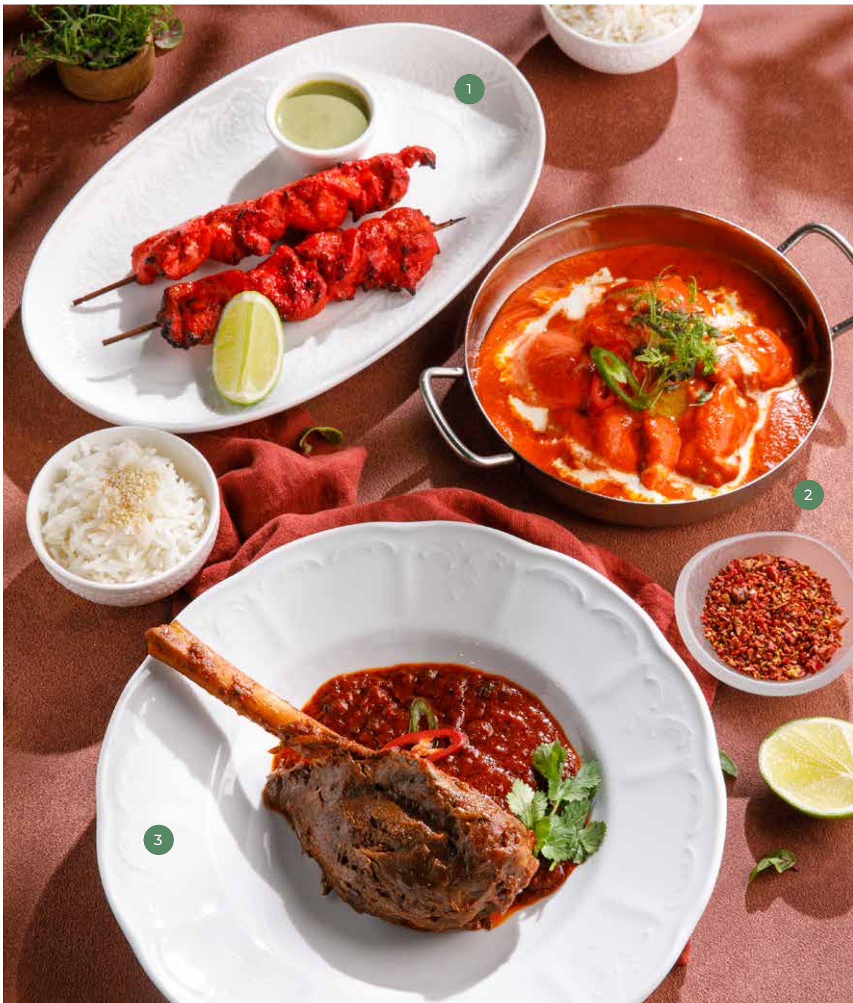
① ЦЫПЛЕНОК ТАНДУРИ TANDOORI CHICKEN