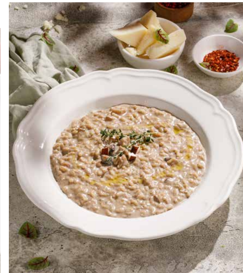
РИЗОТТО С БЕЛЫМИ ГРИБАМИ PORCINI MUSHROOM RISOTTO