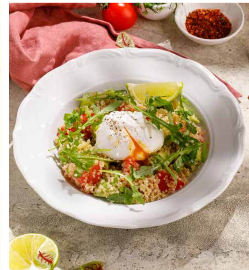
САЛАТ С КИНОА, АВОКАДО И ЯЙЦОМ ПАШОТ QUINOA SALAD WITH AVOCADO AND POACHED EGG