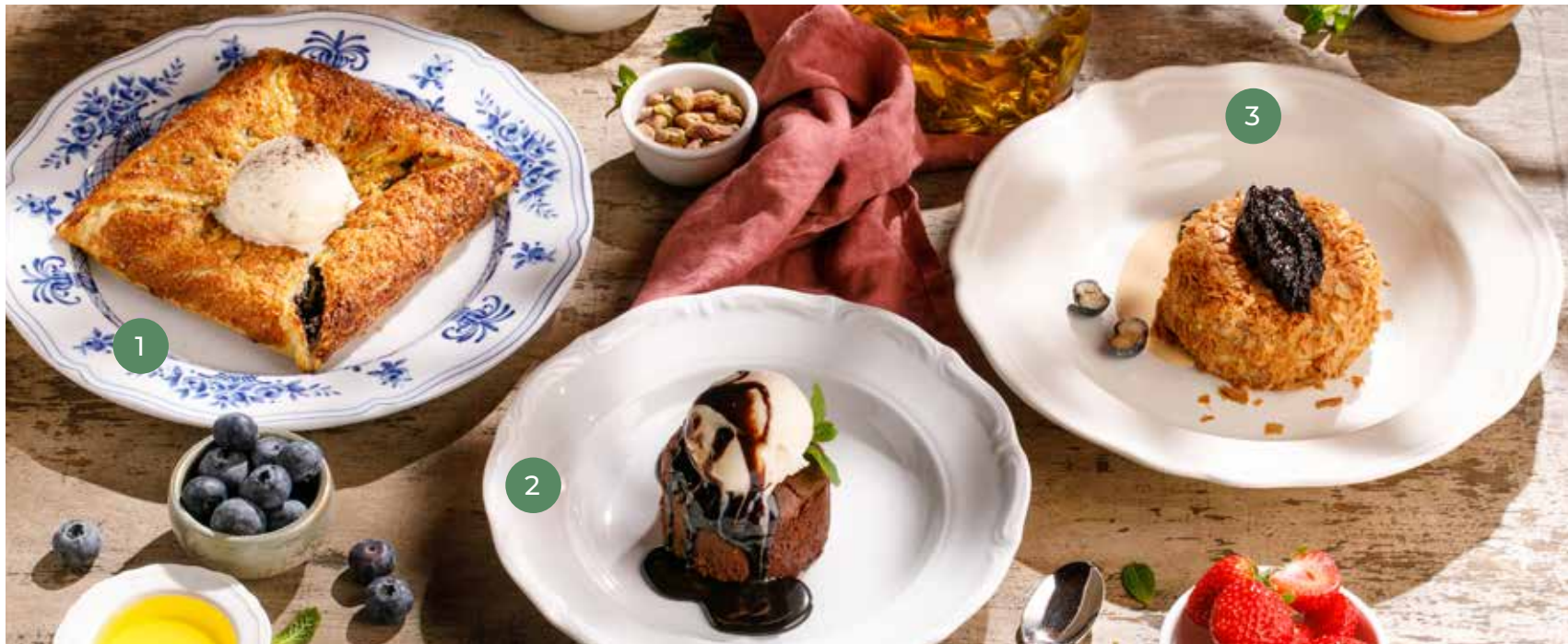
① МАКОВЫЙ ПИРОГ POPPY SEED PIE