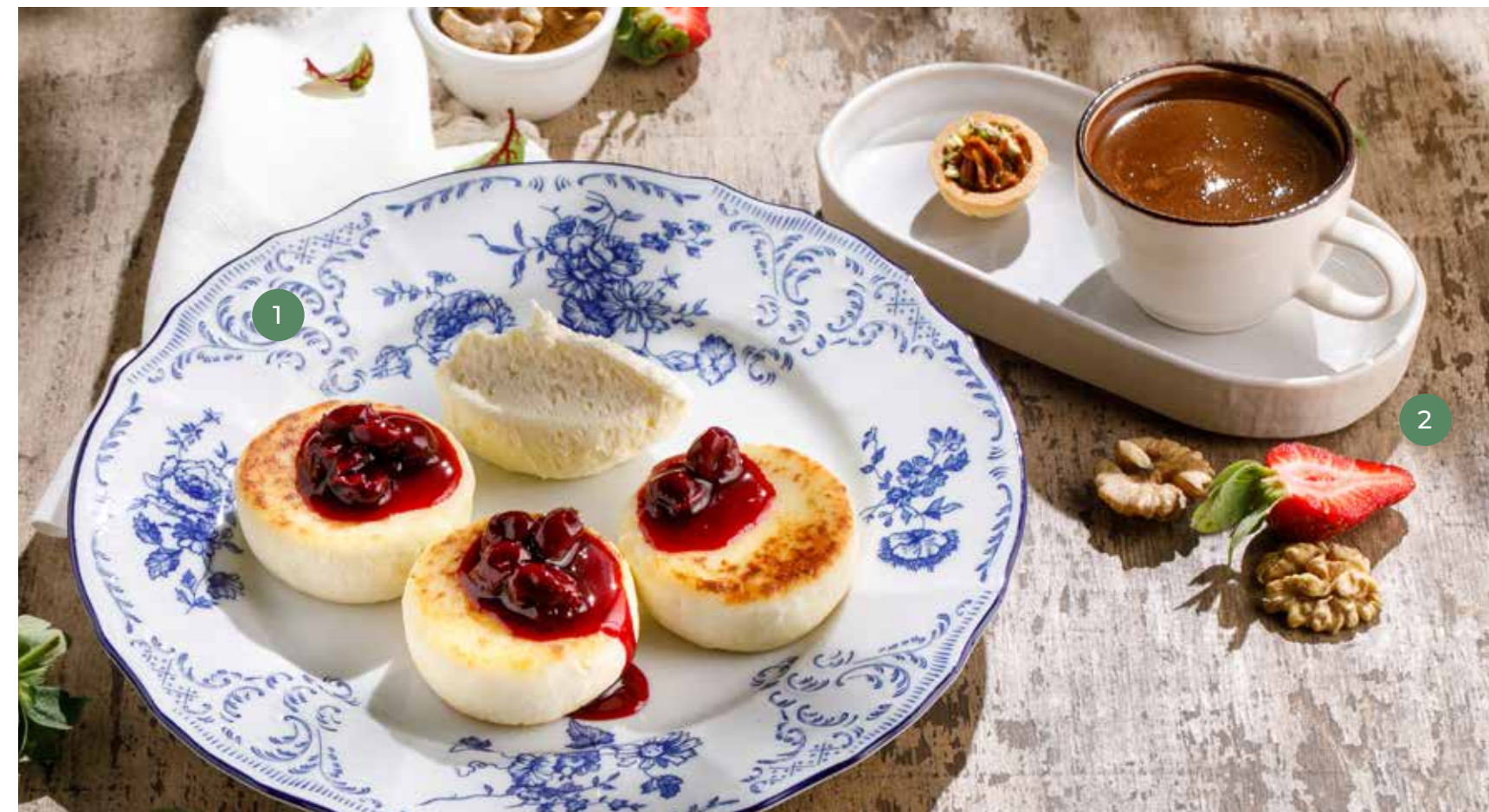
③ СЫРНИКИ С МУССОМ ИЗ БЕЛОГО ШОКОЛАДА COTTAGE CHEESE PANCAKES WITH WHITE CHOCOLATE MOUSSE