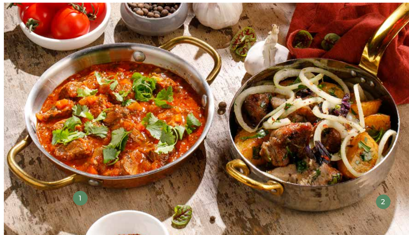
① ЧАШУШУЛИ CHASHUSHULI