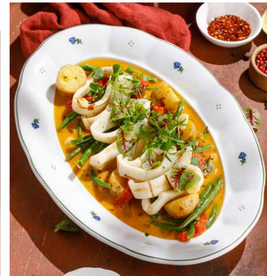
КОМАНДОРСКИЙ КАЛЬМАР НА ГРИЛЕ С ОВОЩАМИ COMMANDER GRILLED SQUID WITH VEGETABLES