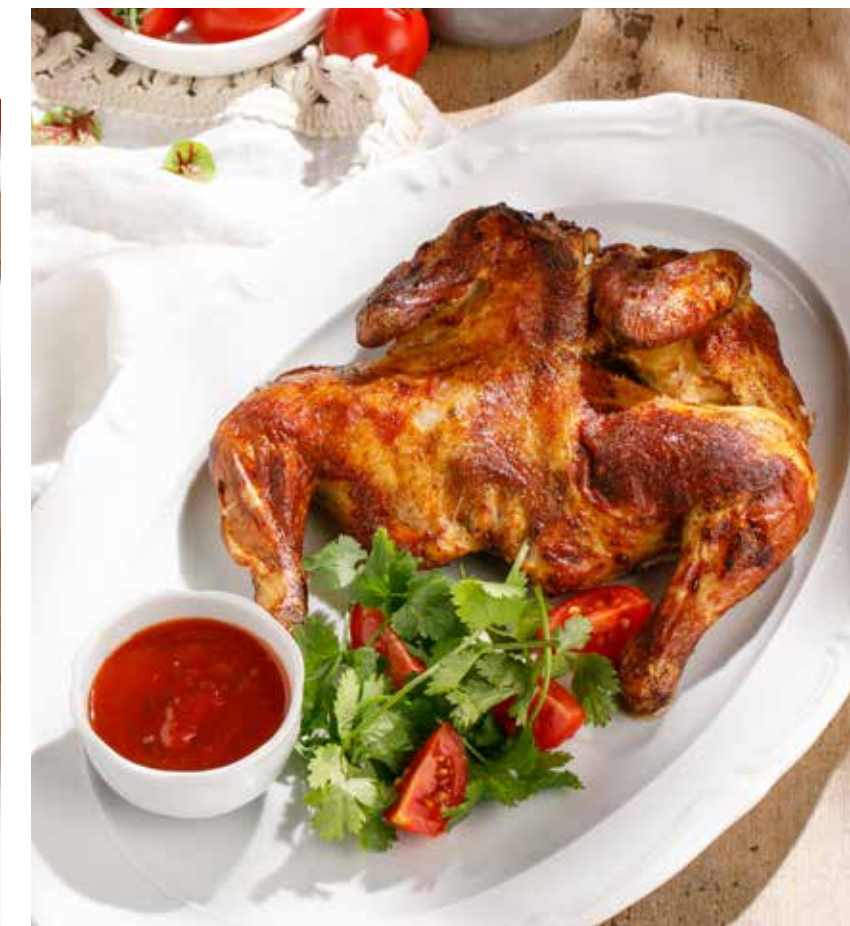
ФЕРМЕРСКИЙ ЦЫПЛЕНОК С АДЖИКОЙ FARM CHICKEN WITH ADJIKA