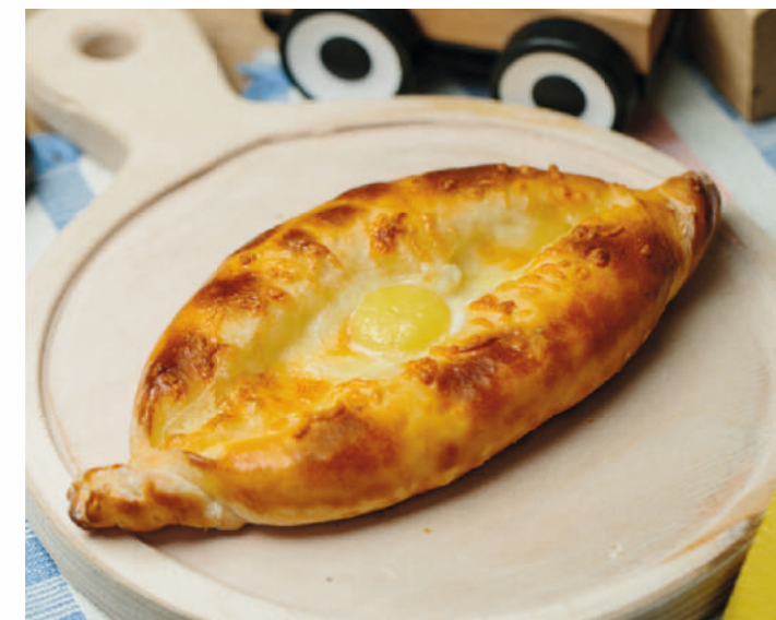
ЛОДОЧКА С СЫРОМ