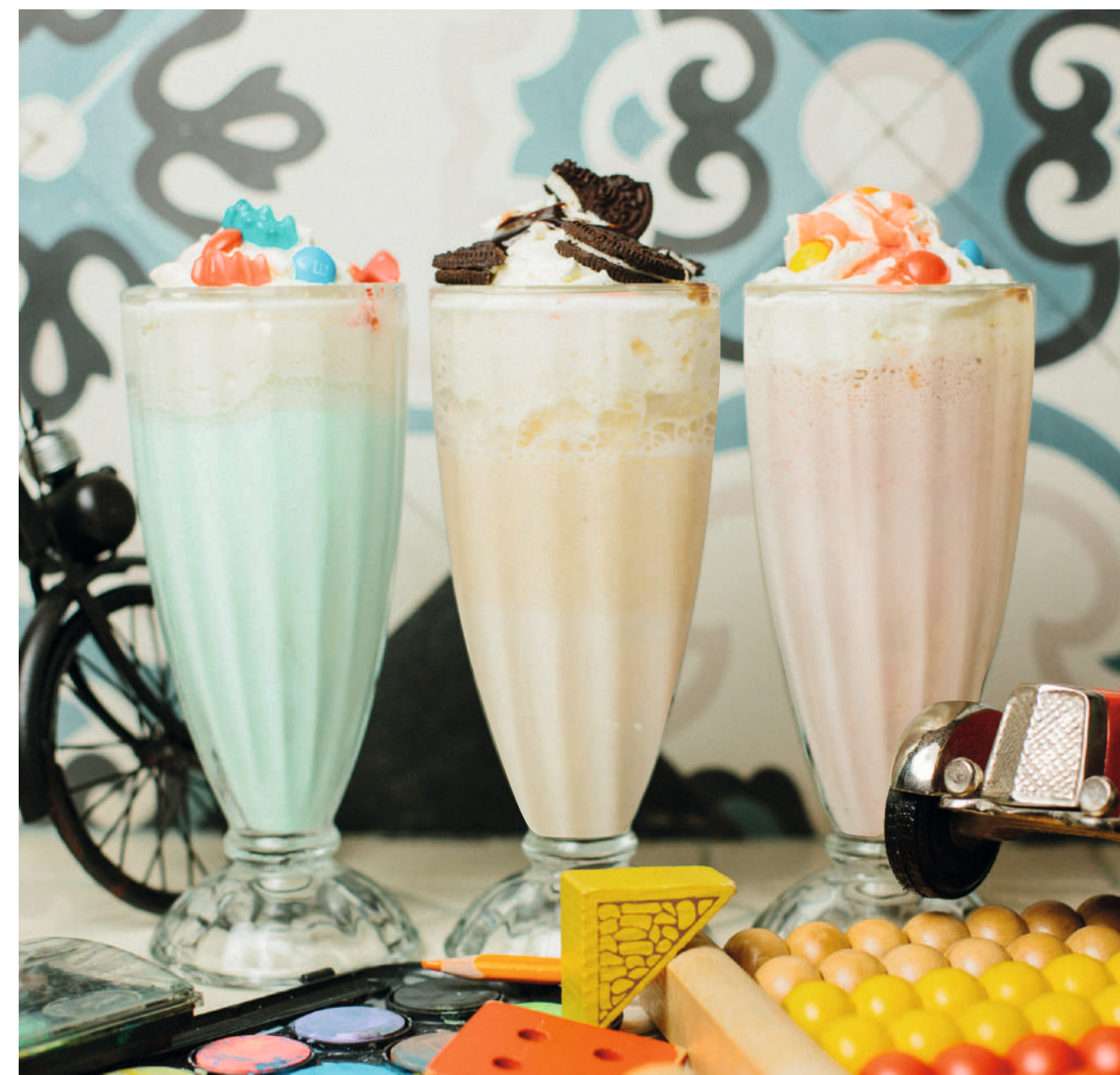
КАКАО С МАРШМЕЛЛОУ