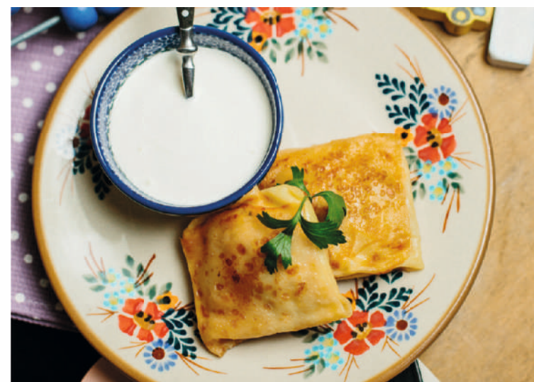
БЛИНЧИКИ С МЯСОМ 18 AZN