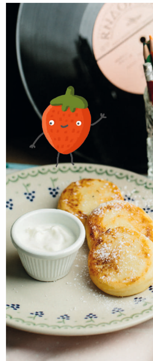
СЫРНИЧКИ СО СМЕТАНОЙ 12 AZN