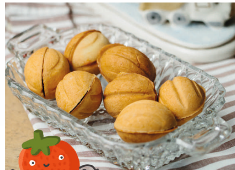
ОРЕШКИ С ВАРЕНОЙ СГУЩЕНКОЙ