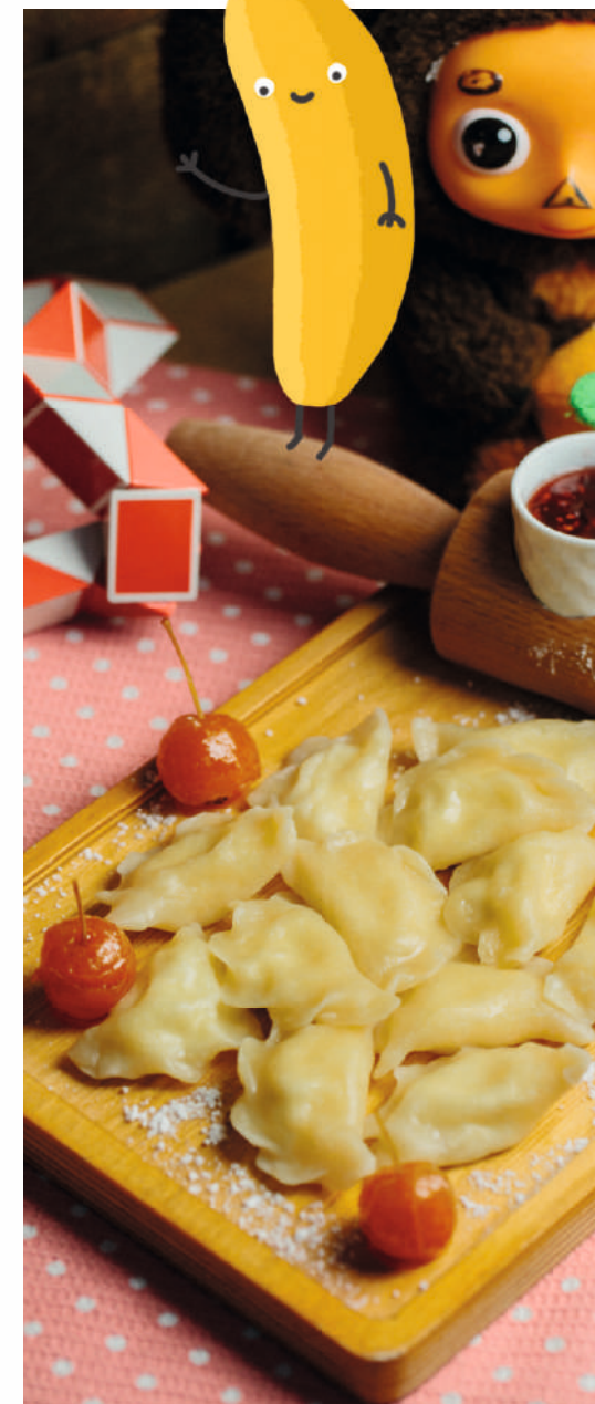
6 AZN ВАРЕНИКИ С ТВОРОГОМ И БАНАНОМ 10 AZN