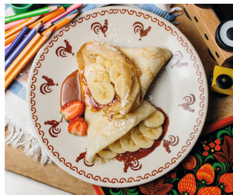
БЛИНЧИКИ С БАНАНОМ И КАРАМЕЛЮ 8 AZN