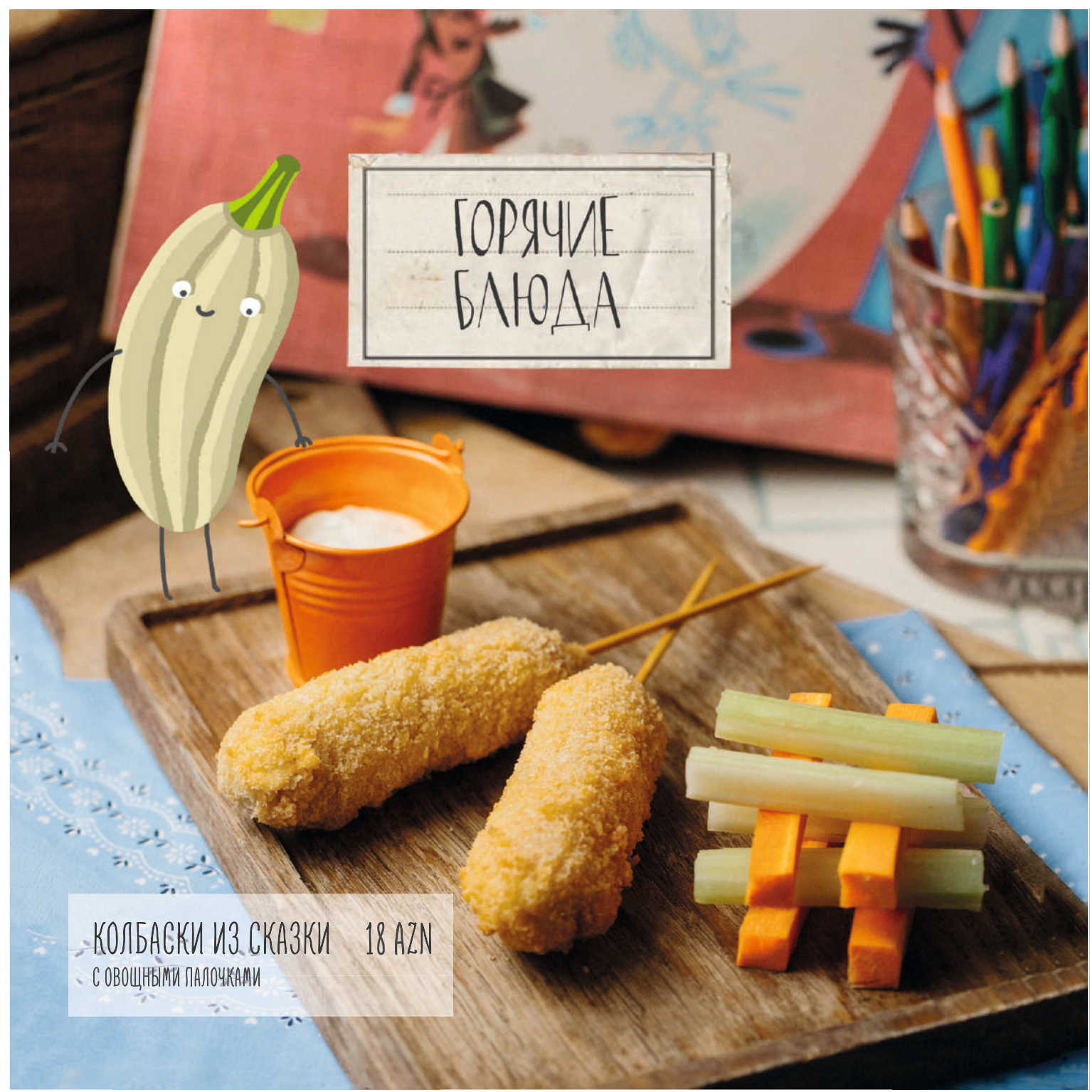
КОЛБАСКИ ИЗ СКАЗКИ 18 AZN С ОВОЩНЫМИ ПАЛОЧКАМИ