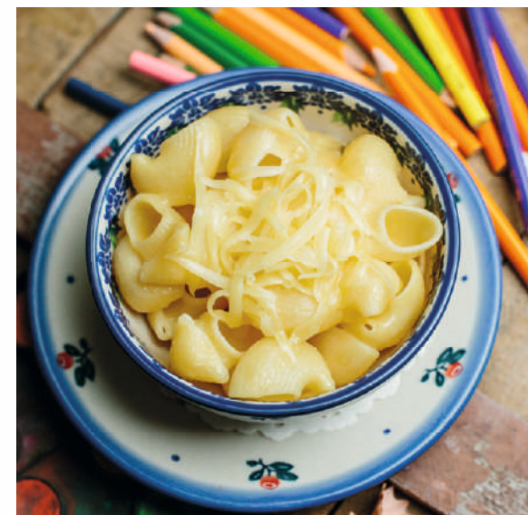
МАКАРОШКИ С СЫРОМ