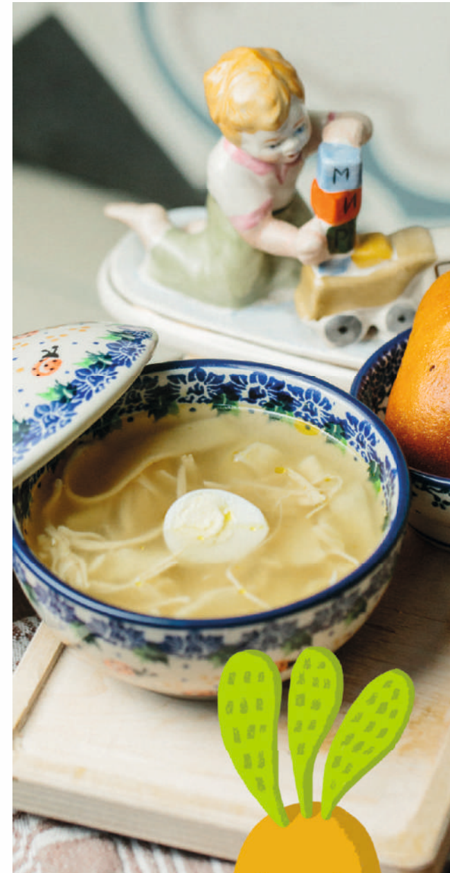
СУПЧИК «КУРОЧКА РЯБА»