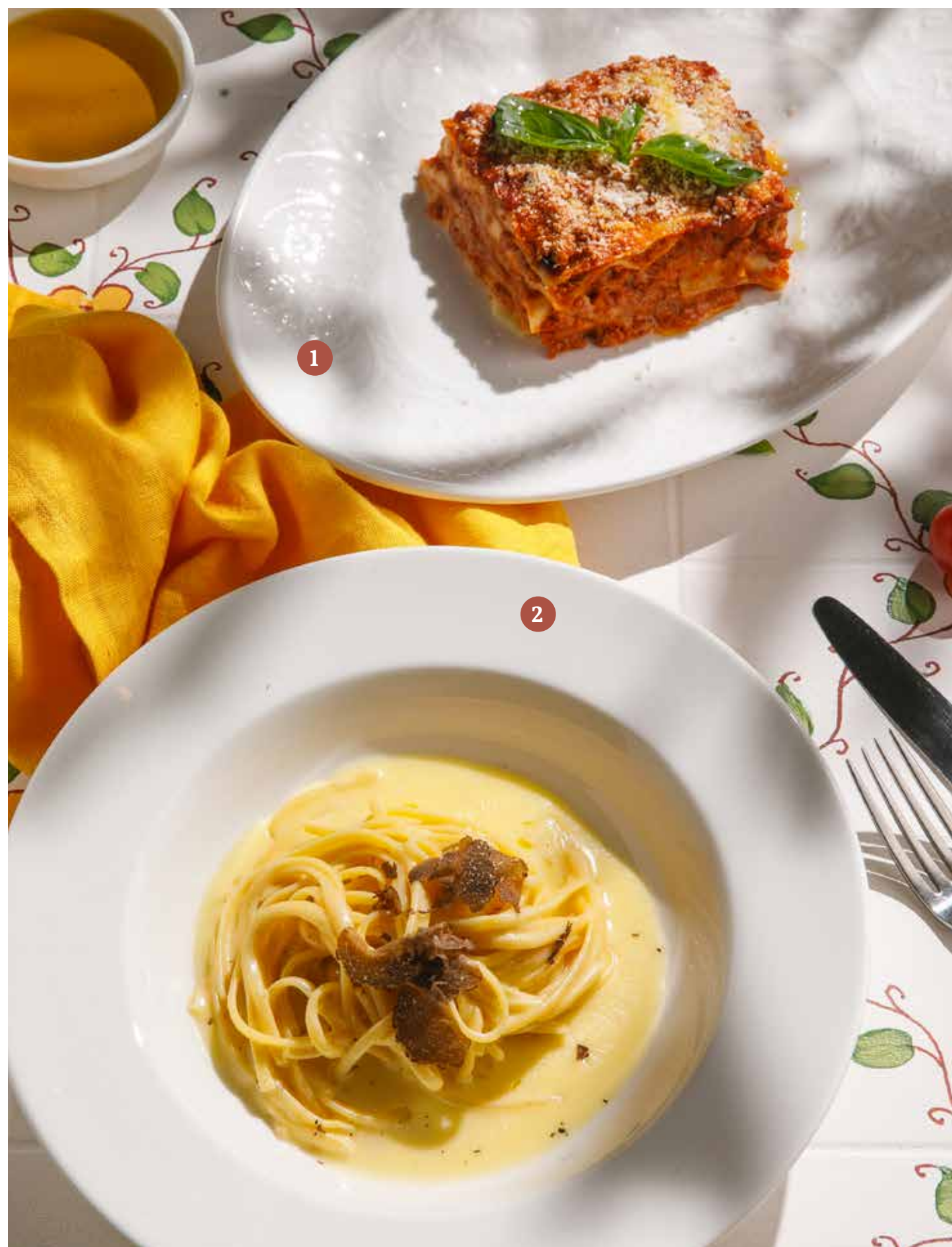
1 ЛАЗАНЬЯ Lasagna

ПРОСЬБА ПРЕДУПРЕЖДАТЬ ВАШЕГО ОФИЦИАНТА ОБ ИМЕЮЩЕЙСЯ У ВАС АЛЛЕРГИИ НА ОПРЕДЕЛЕННЫЕ ПРОДУКТЫ ПИТАНИЯ. Please, tell your waiter if you have any food allergy to certain products.