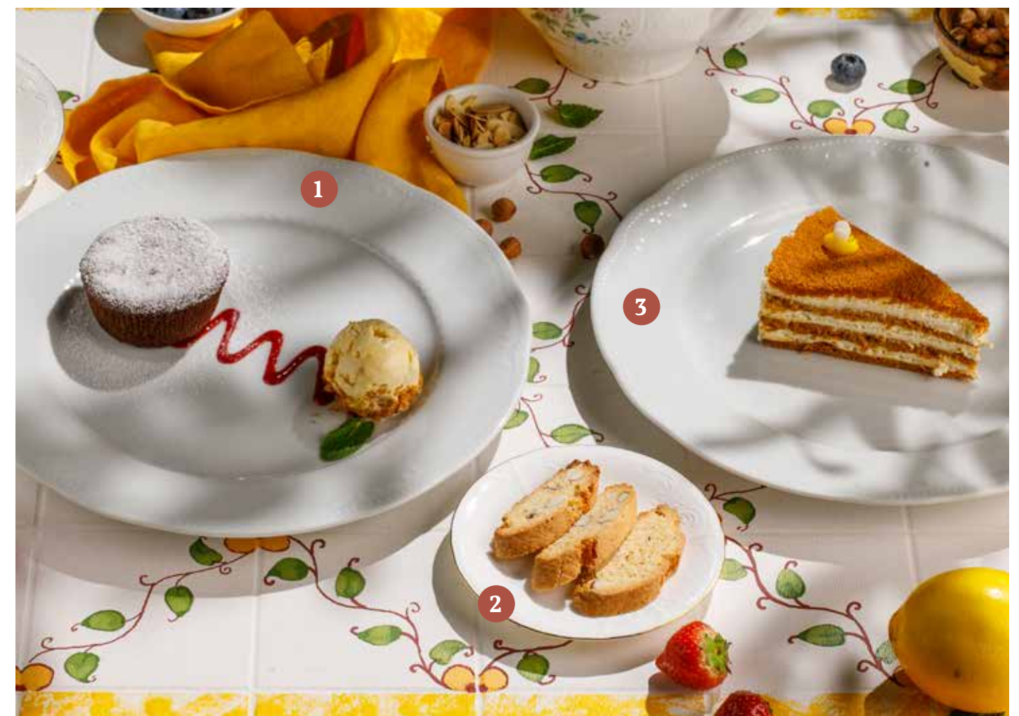
1 ГОРЯЧИЙ ШОКОЛАДНЫЙ КЕКС