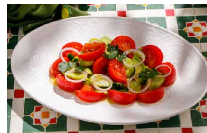
САЛАТ С ПОМИДОРОМ, ОГУРЦОМ И АВОКАДО Tomato, cucumber and avocado salad