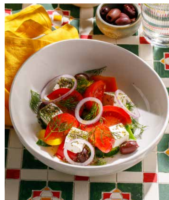
ГРЕЧЕСКИЙ Greek salad