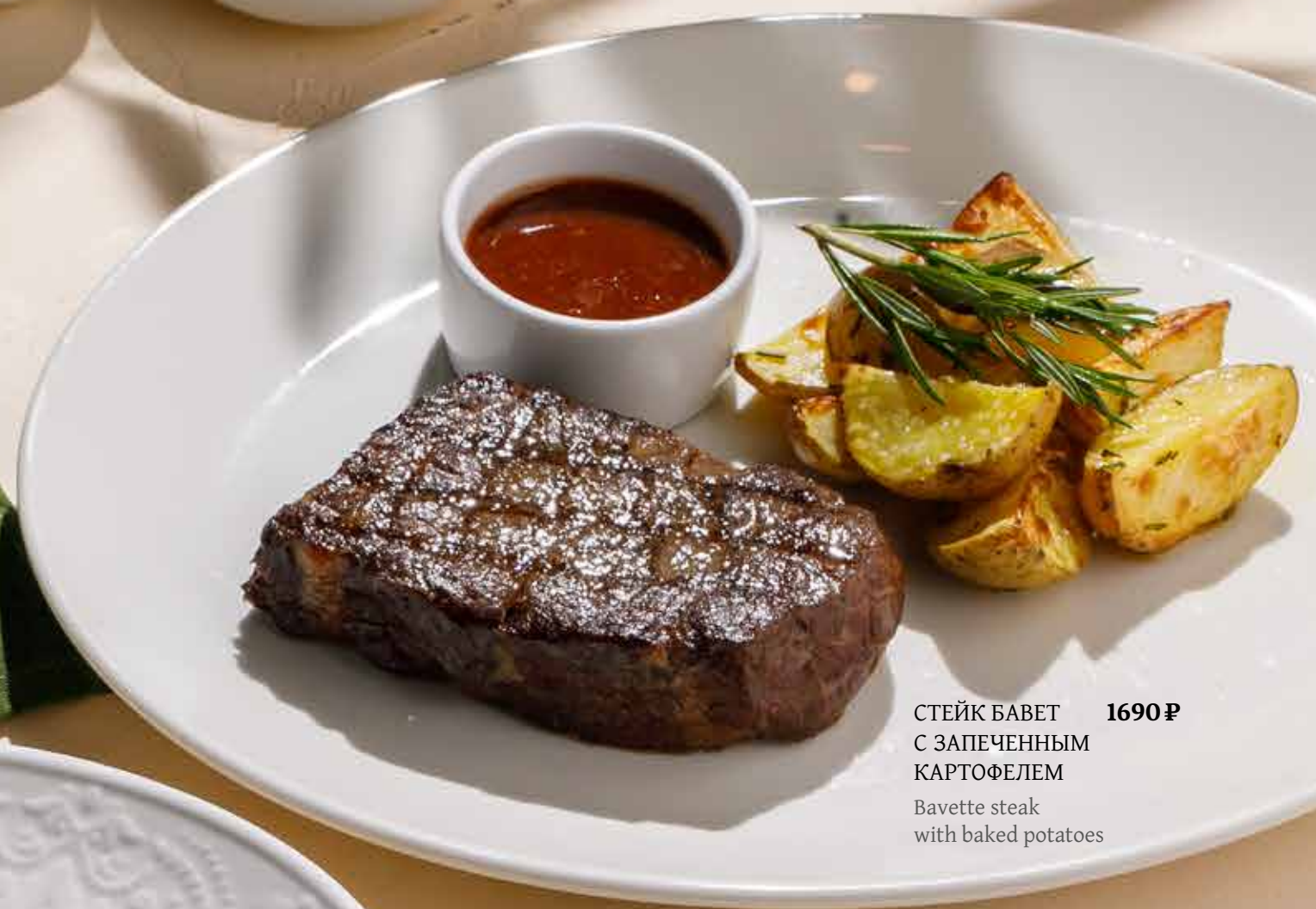
СТЕЙК БАВЕТ 1690 ₽ С ЗАПЕЧЕННЫМ КАРТОФЕЛЕМ Bavette steak with baked potatoes