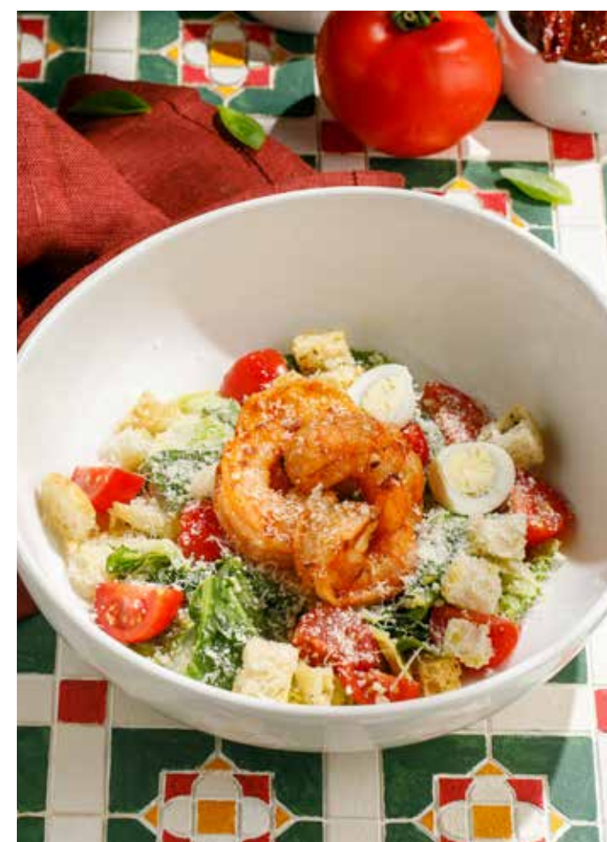
ЦЕЗАРЬ С КРЕВЕТКАМИ / С КУРИЦЕЙ Caesar salad with shrimp / chicken