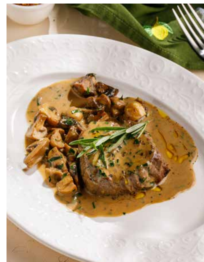
МЕДАЛЬОНЫ ИЗ ГОВЯДИНЫ 1490₽ С ШАМПИньОНАМИ И СОУСОМ ДЕМИГЛЯС Beef medallions with champignons and demiglace sauce