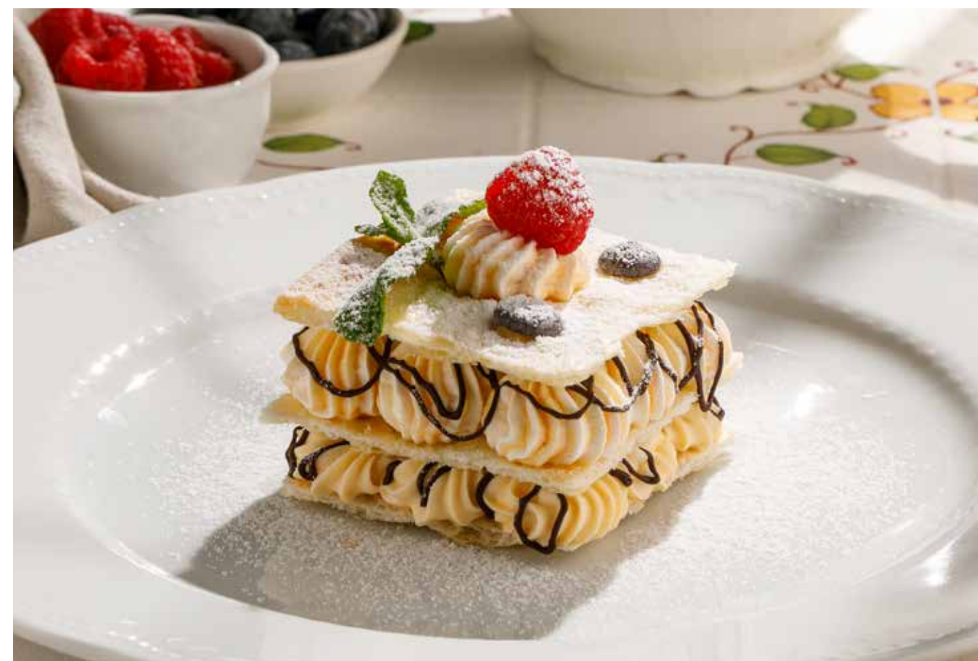
МИЛЛЕФОЛЬЕ Mille foglie