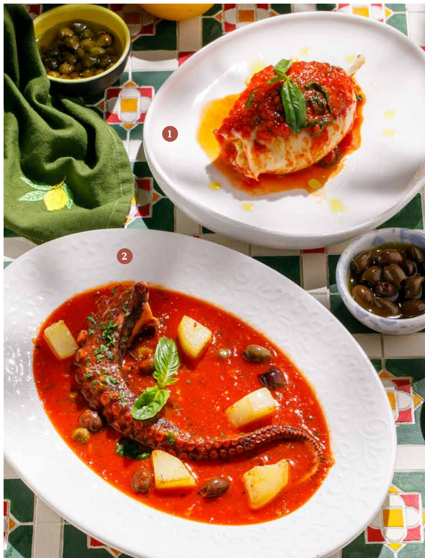
1 ФАРШИРОВАННЫЙ КАЛЬМАР Stuffed squid

ПРОСЬБА ПРЕДУПРЕЖДАТЬ ВАШЕГО ОФИЦИАНТА ОБ ИМЕЮЩЕЙСЯ У ВАС АЛЛЕРГИИ НА ОПРЕДЕЛЕННЫЕ ПРОДУКТЫ ПИТАНИЯ. Please, tell your waiter if you have any food allergy to certain products.