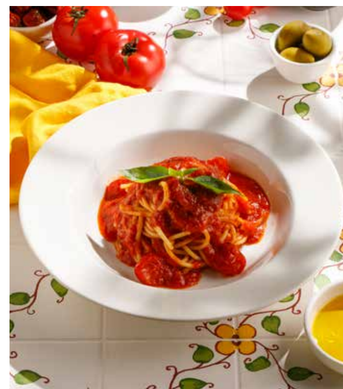
СПАГЕТТИ С ТОМАТАМИ ЧЕРРИ И БАЗИЛИКОМ Spaghetti with cherry tomatoes and basil