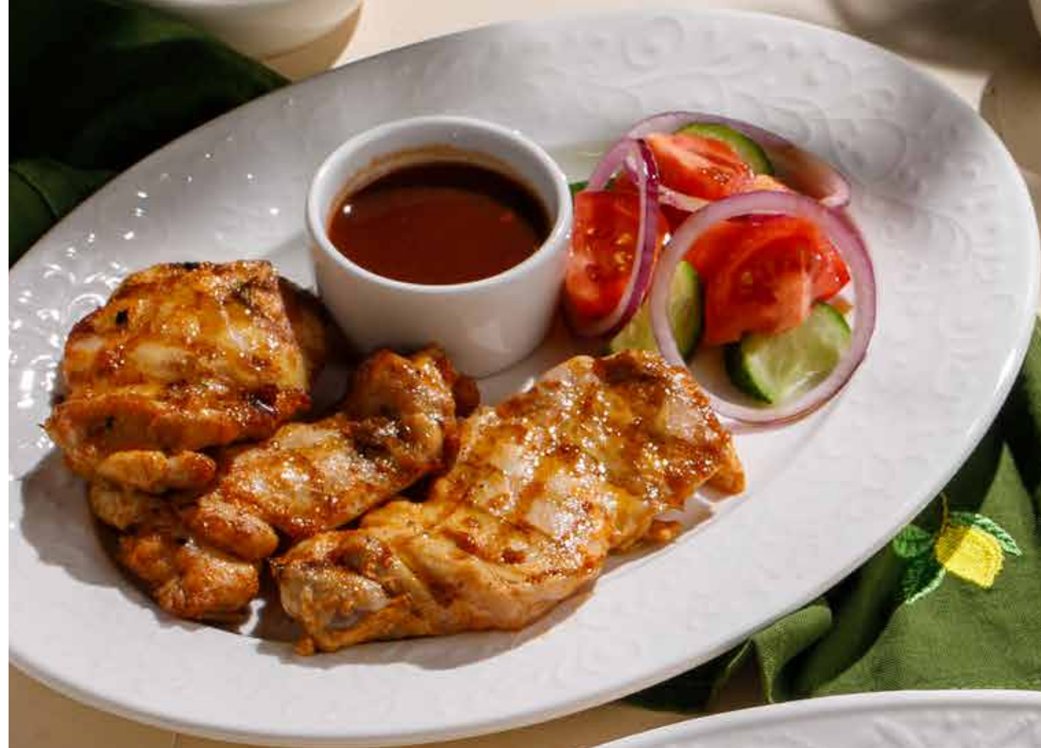
НЕЖНЫЕ КУСОЧКИ КУРИЦЫ 990 ₽ Tender chicken