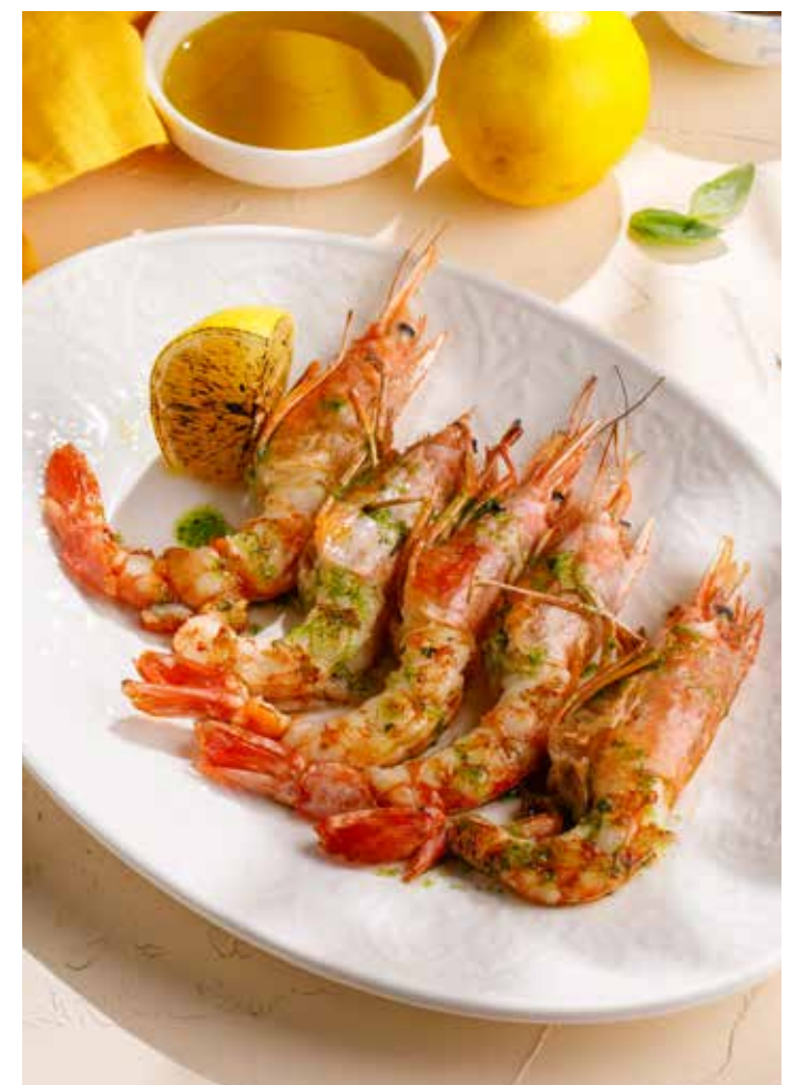
КРЕВЕТКИ АРГЕНТИНСКИЕ Argentine shrimp