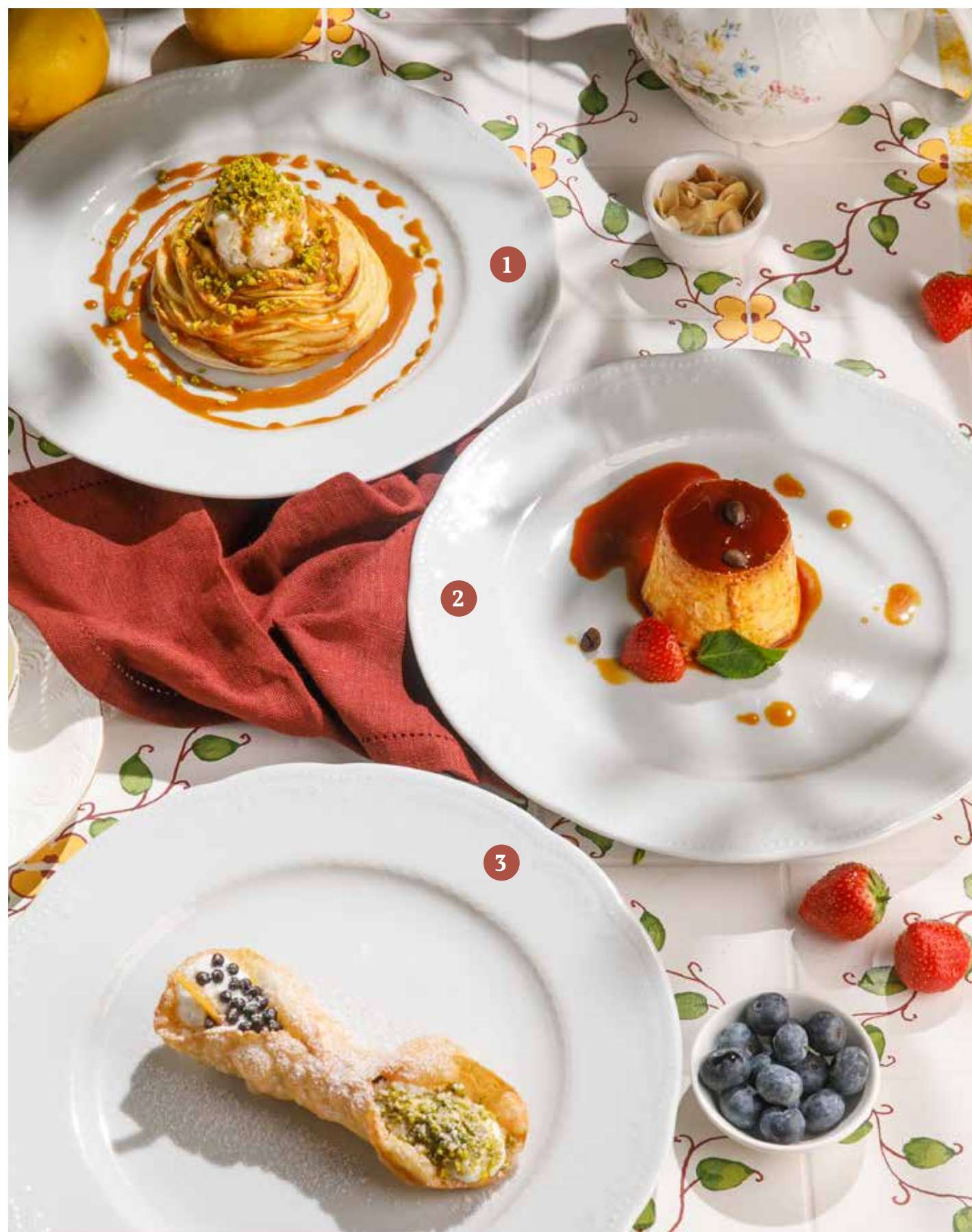
1 ЯБЛОЧНЫЙ ПИРОГ С ОРЕХАМИ, КАРАМЕЛЬНЫМ СОУСОМ И МОРОЖЕНЫМ Apple pie with nuts, caramel sauce and ice cream

ПРОСЬБА ПРЕДУПРЕЖДАТЬ ВАШЕГО ОФИЦИАНТА ОБ ИМЕЮЩЕЙСЯ У ВАС АЛЛЕРГИИ НА ОПРЕДЕЛЕННЫЕ ПРОДУКТЫ ПИТАНИЯ. Please, tell your waiter if you have any food allergy to certain products.