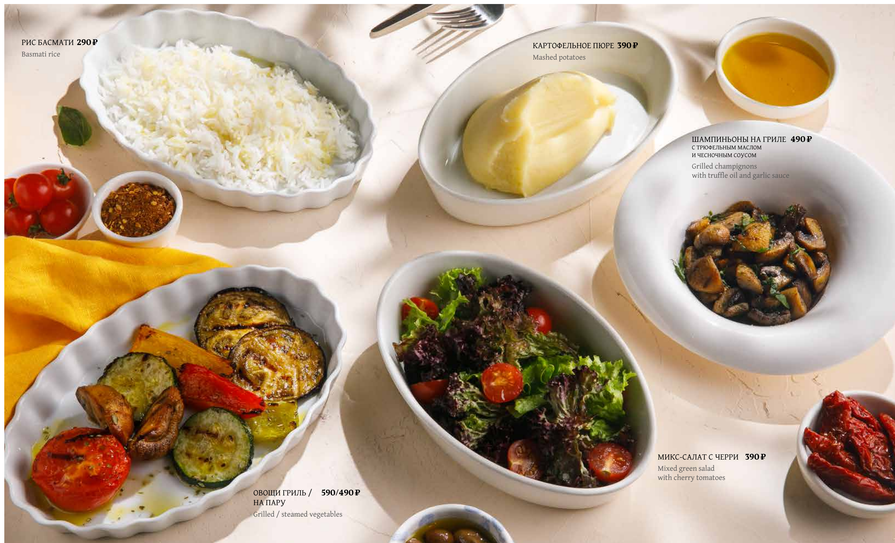
РИС БАСМАТИ 290₽ Basmati rice

ПРОСЬБА ПРЕДУПРЕЖДАТЬ ВАШЕГО ОФИЦИАНТА ОБ ИМЕЮЩЕЙСЯ У ВАС АЛЛЕРГИИ НА ОПРЕДЕЛЕННЫЕ ПРОДУКТЫ ПИТАНИЯ. Please, tell your waiter if you have any food allergy to certain products.