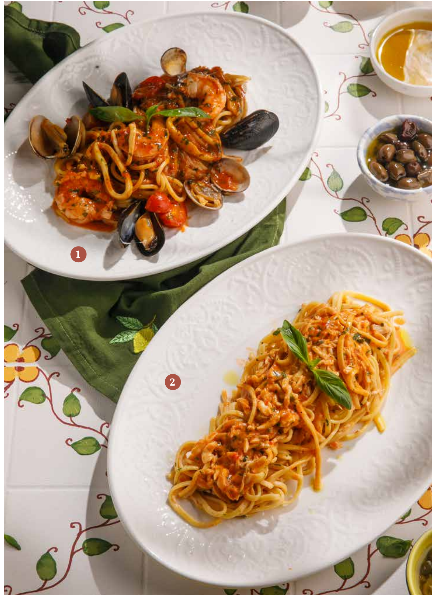
1 СПАГЕТТИ С МОРЕПРОДУКТАМИ МИДИИ, ВОНГОЛЕ, КАЛЬМАРЫ, КРЕВЕТКИ Seafood spaghetti Mussels, vongole, squid, shrimp