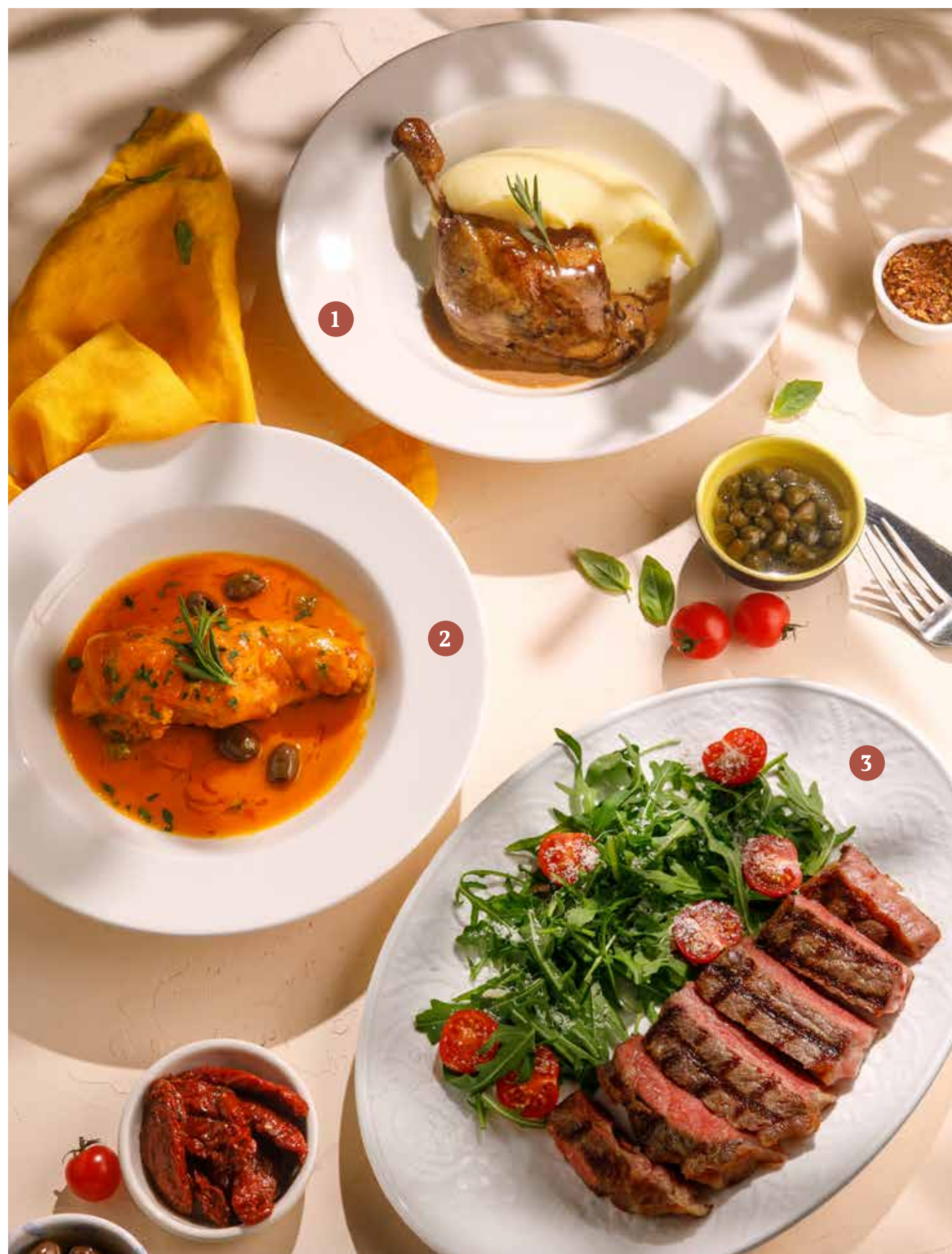
1 УТИНАЯ НОЖКА КОНФИ 1290₽ С КАРТОФЕЛЬНЫМ ПЮРЕ Duck leg confit with mashed potatoes

ПРОСЬБА ПРЕДУПРЕЖДАТЬ ВАШЕГО ОФИЦИАНТА ОБ ИМЕЮЩЕЙСЯ У ВАС АЛЛЕРГИИ НА ОПРЕДЕЛЕННЫЕ ПРОДУКТЫ ПИТАНИЯ. Please, tell your waiter if you have any food allergy to certain products.