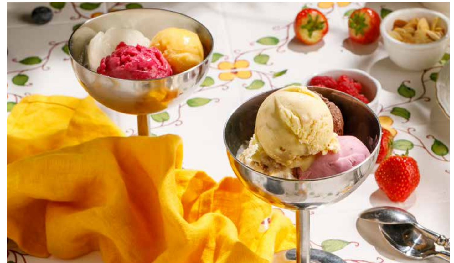
МОРОЖЕНОЕ / СОРБЕТ в ассортименте