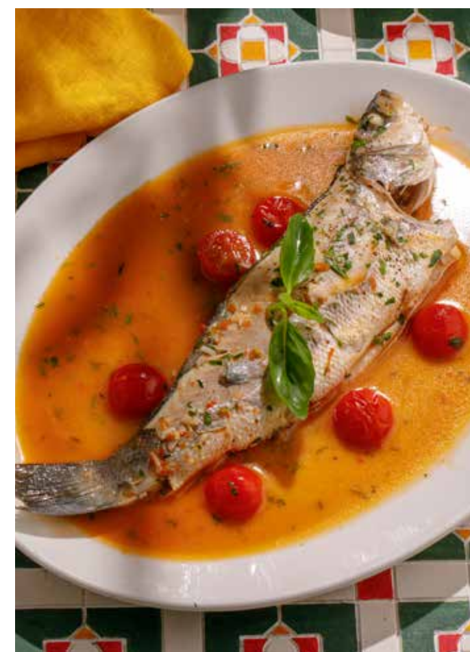
СИБАС / ДОРАДО «АКВА ПАЦЦА» Sea bass / dorado acqua pazza