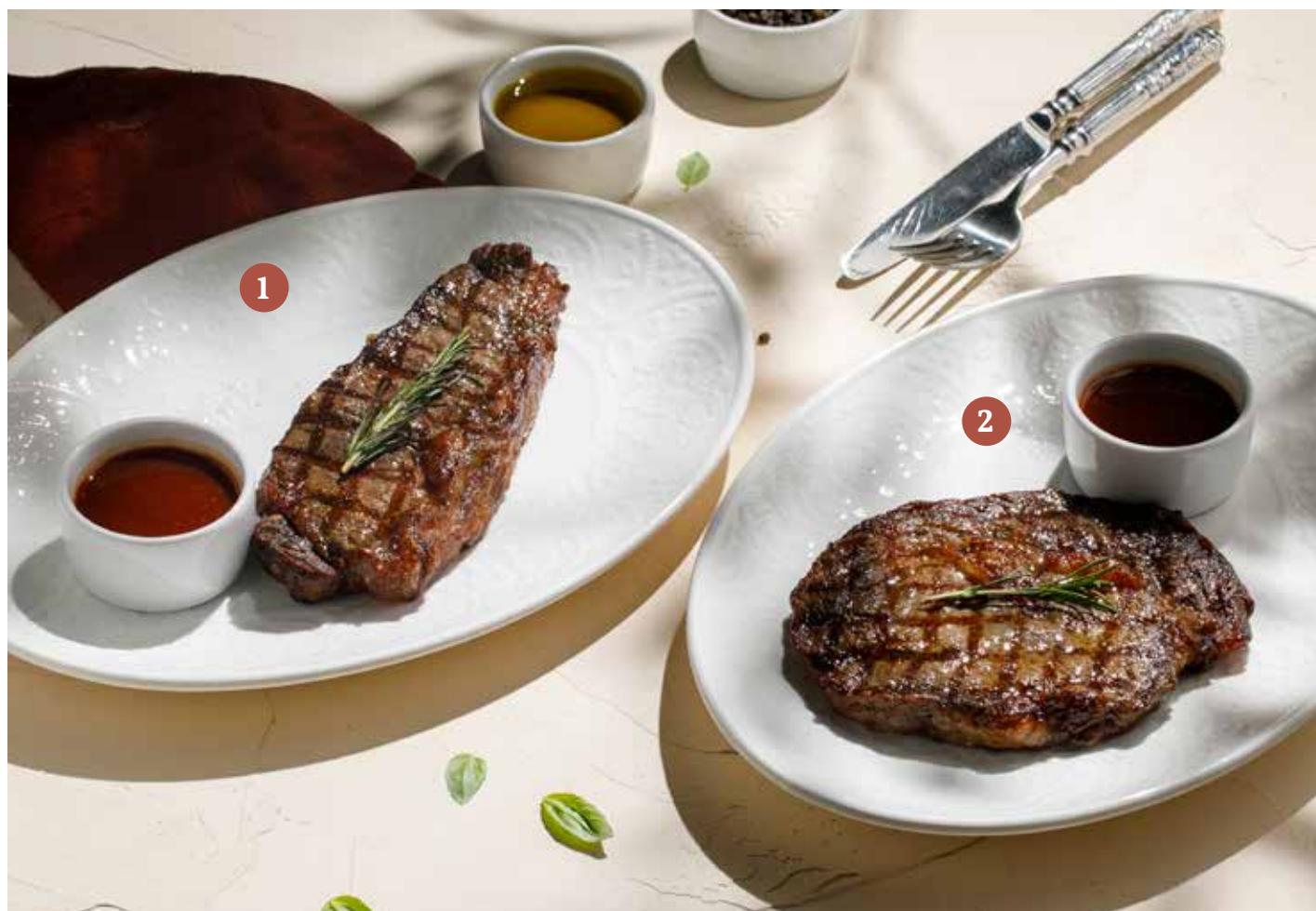
1 СТЕЙК СТРИПЛОЙН Striploin steak