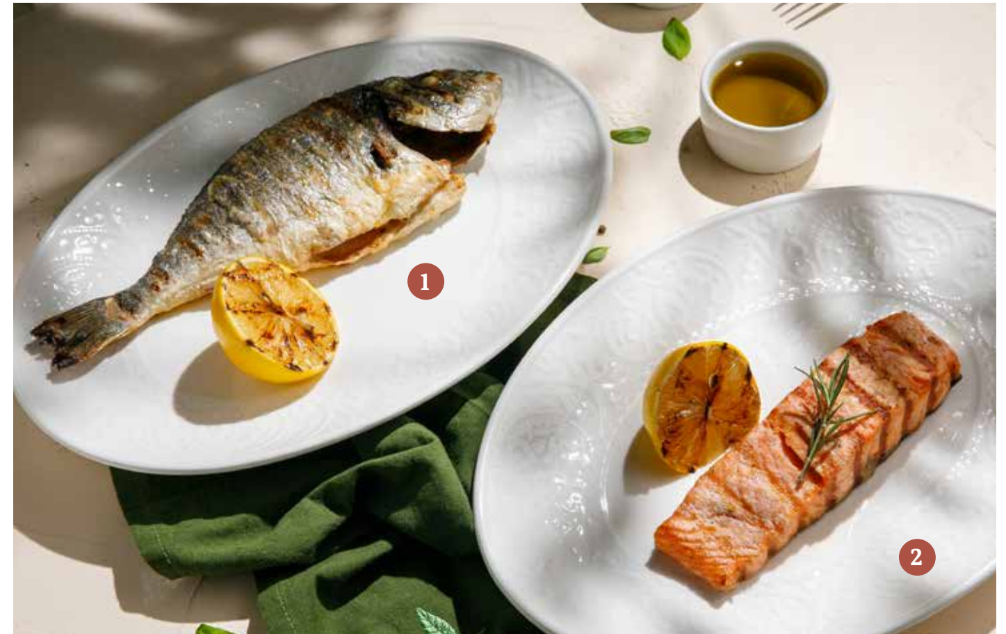
1 СИБАС / ДОРАДО Sea bass / dorado