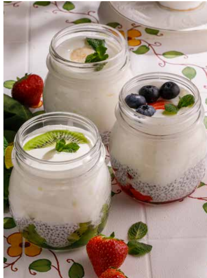
ДОМАШНИЙ ЙОГУРТ 490/490/590 ₺ С КИВИ / С БАНАНОМ / С КЛУБНИКОЙ Homemade yogurt with kiwi / banana / strawberry