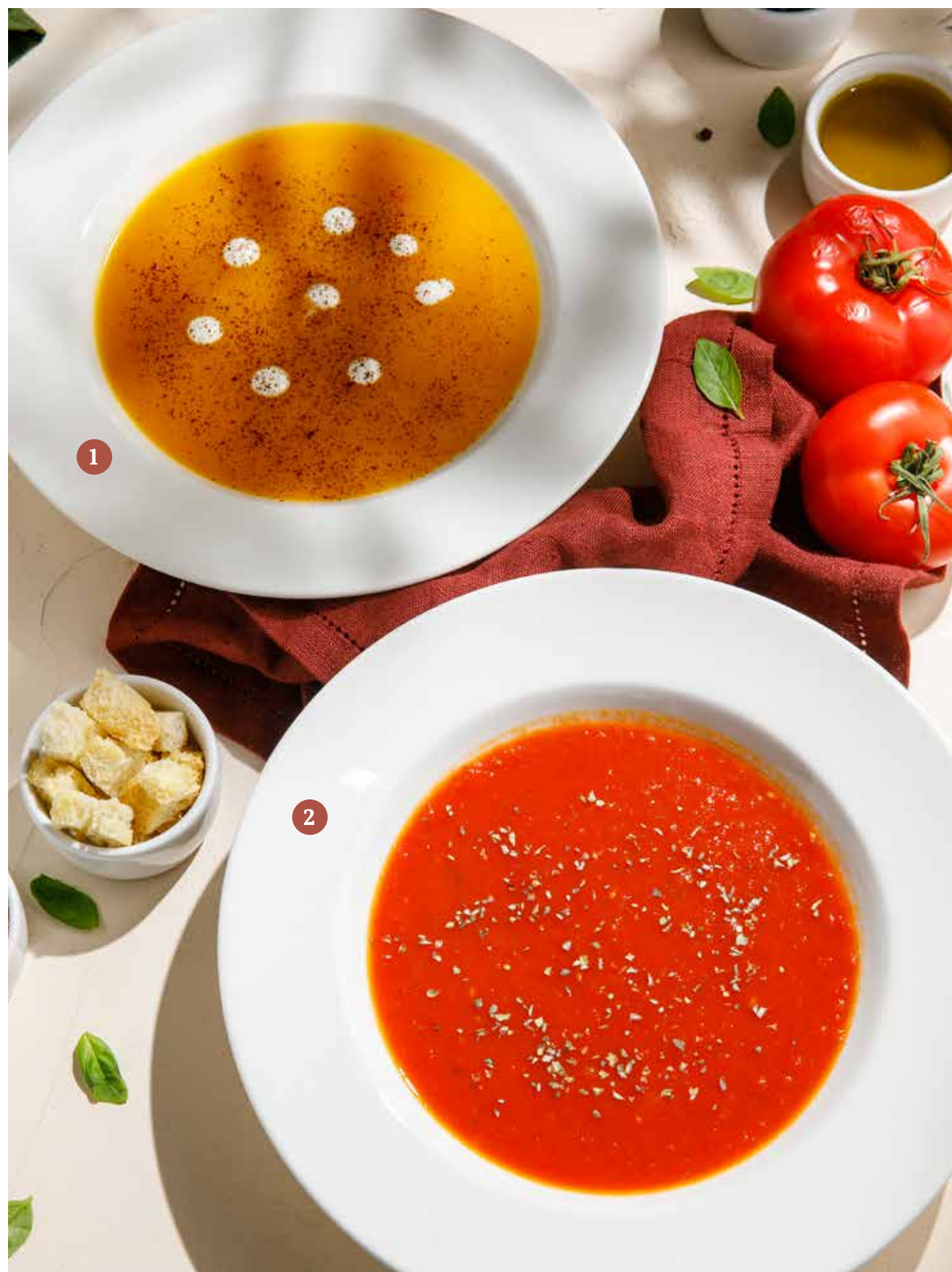
1 ТЫКВЕННЫЙ СУП С РИКОТТОЙ Cream of pumpkin soup with ricotta

ПРОСЬБА ПРЕДУПРЕЖДАТЬ ВАШЕГО ОФИЦИАНТА ОБ ИМЕЮЩЕЙСЯ У ВАС АЛЛЕРГИИ НА ОПРЕДЕЛЕННЫЕ ПРОДУКТЫ ПИТАНИЯ. Please, tell your waiter if you have any food allergy to certain products.