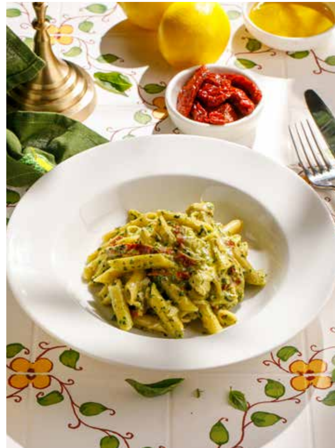
ПЕННЕ С КУРИНОЙ ГРУДКОЙ, ВЯЛЕНЫМИ ТОМАТАМИ И СОУСОМ ПЕСТО Penne with chicken fillet, sun-dried tomatoes and pesto sauce