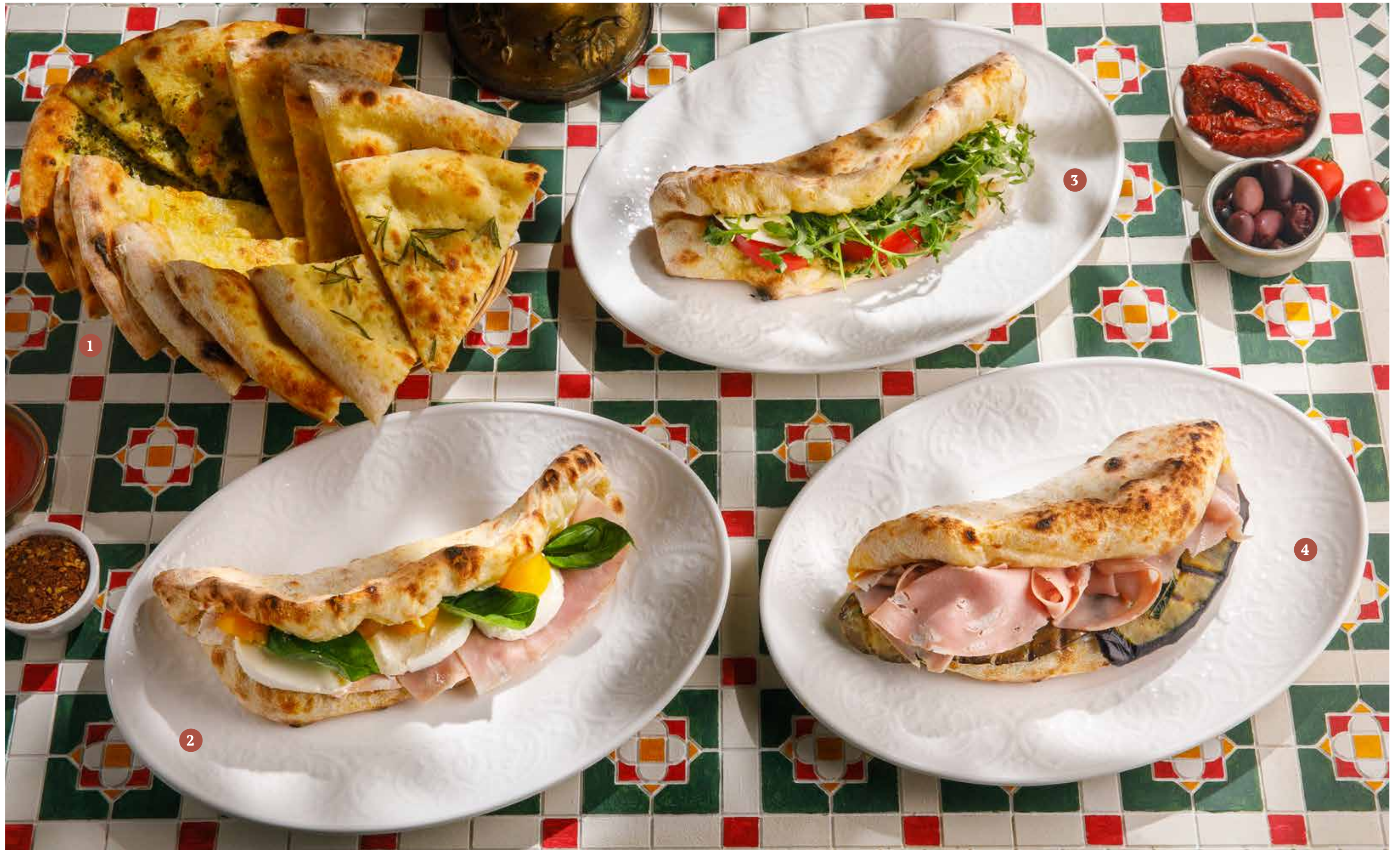
1 ФОКАЧЧА С СОУСОМ ПЕСТО / С ПАРМЕЗАНОМ / С РОЗМАРИНОМ Focaccia with pesto sauce / parmesan / rosemary