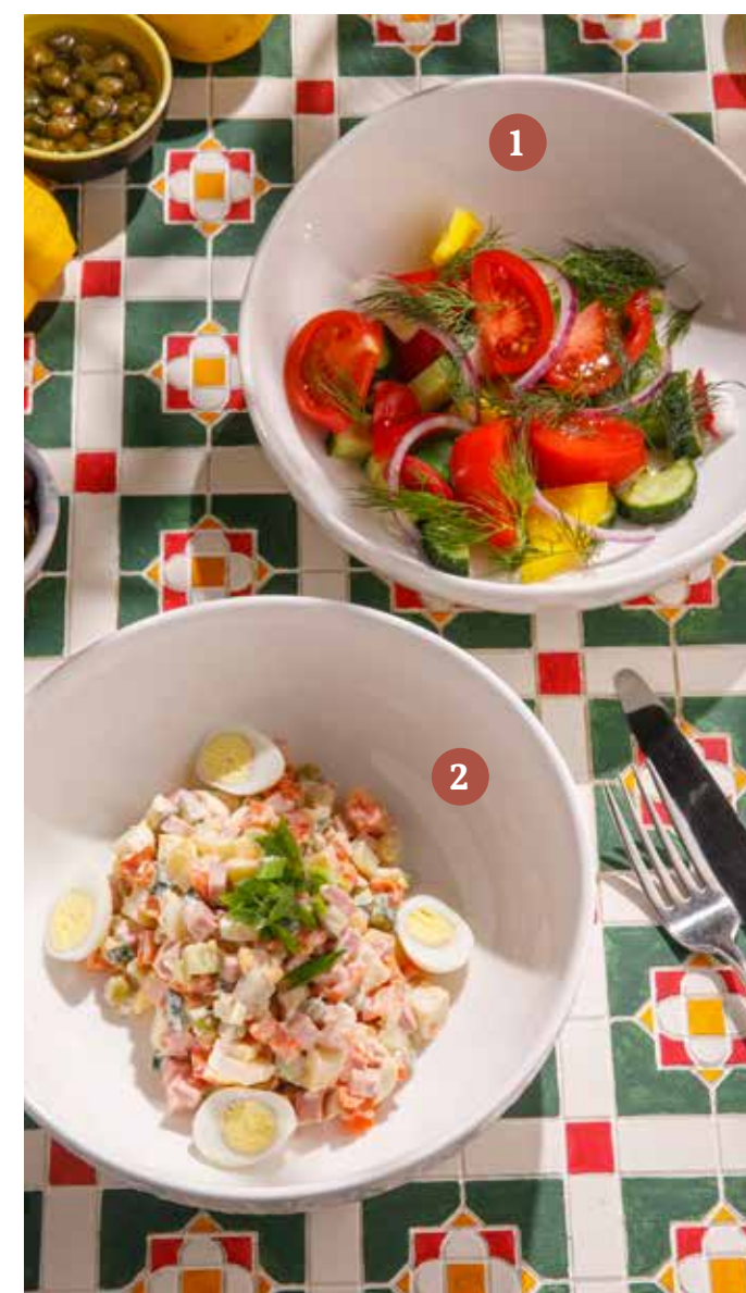
1 ОВОЩНОЙ Vegetable salad