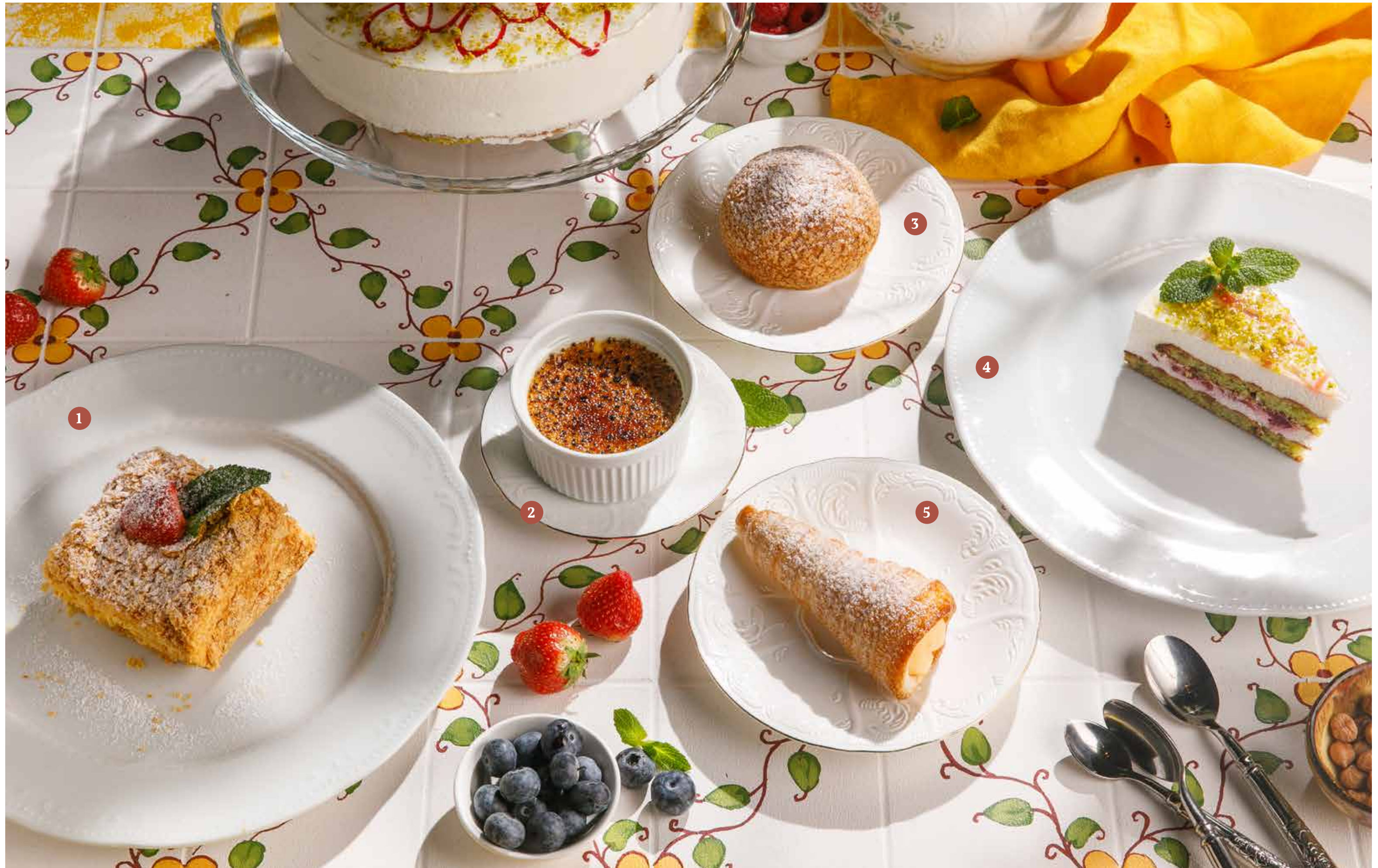
1 НАПОЛЕОН Napoleon cake