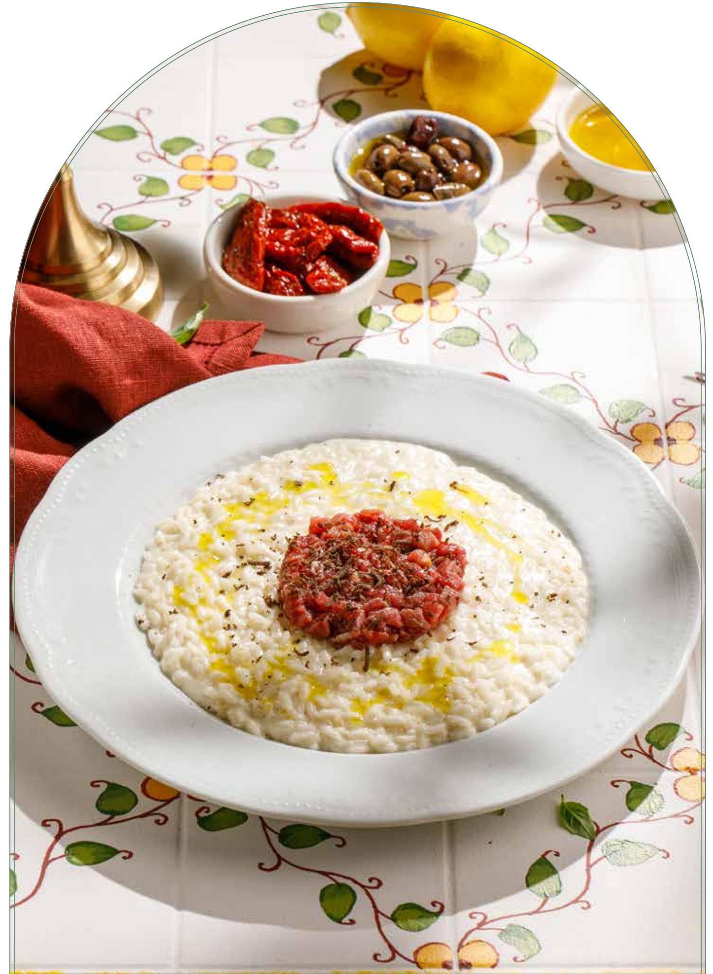
РИЗОТТО С ТАРТАРОМ ИЗ ГОВЯДИНЫ И ЧЕРНЫМ ТРЮФЕЛЕМ Risotto with beef tartare and black truffle