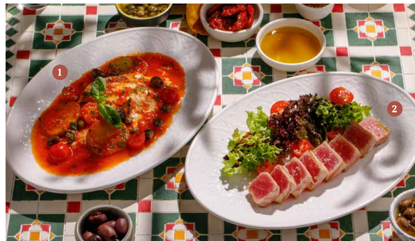
1 ФИЛЕ СИБАСА ПО-СИЦИЛИЙСКИ Sicilian sea bass fillet