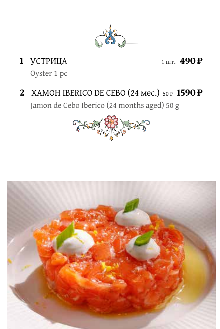
ТАРТАР ИЗ ЛОСОСЯ Salmon tartare