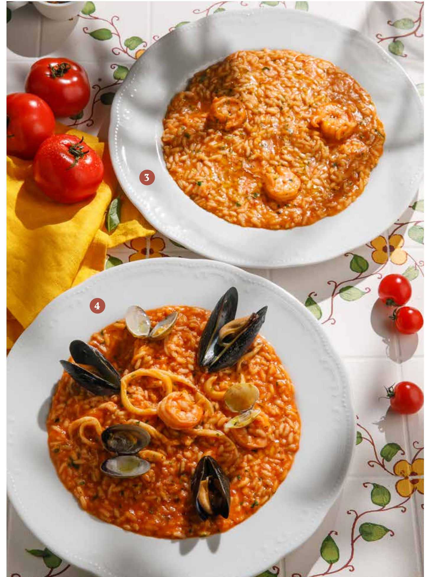
3 РИЗОТТО С КРЕВЕТКАМИ, ТОМАТНЫМ СОУСОМ И ЦЕДРОЙ ЛИМОНА Risotto with shrimp, tomato sauce and lemon zest