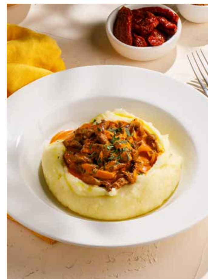
БЕФСТРОГАНОВ С ПЮРЕ / С ГРЕЧЕЙ 990₽ Beef stroganoff with mashed potatoes / buckwheat