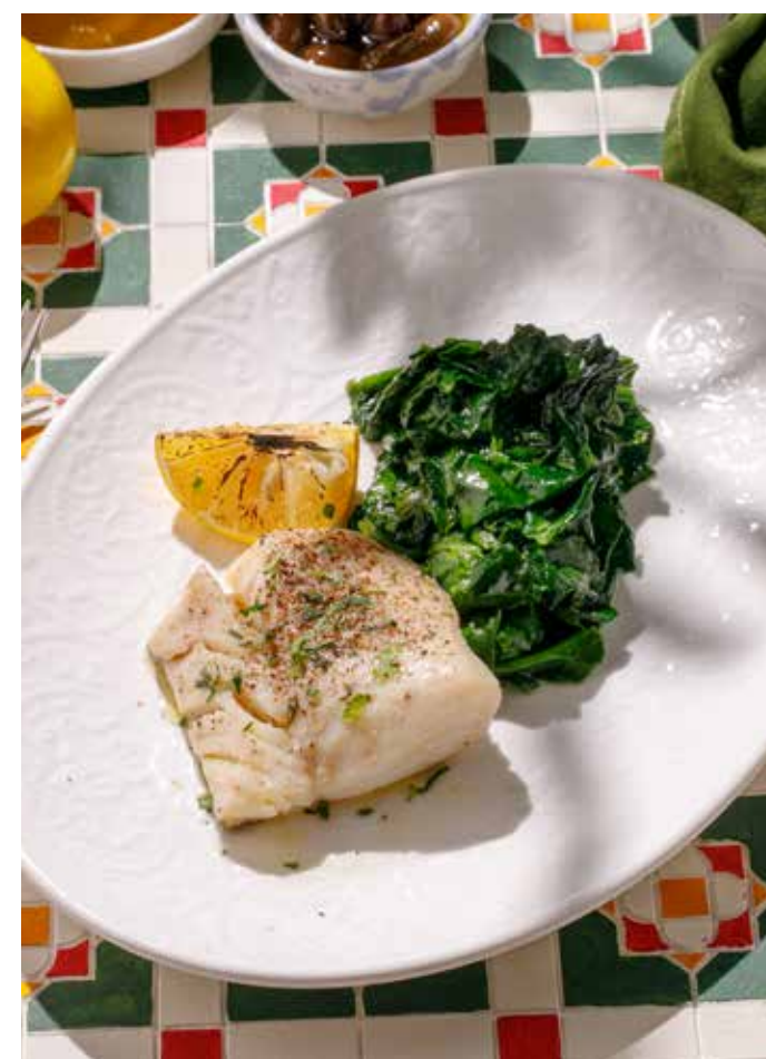
ЗАПЕЧЕННАЯ ТРЕСКА СО ШПИНАТОМ Baked cod with spinach