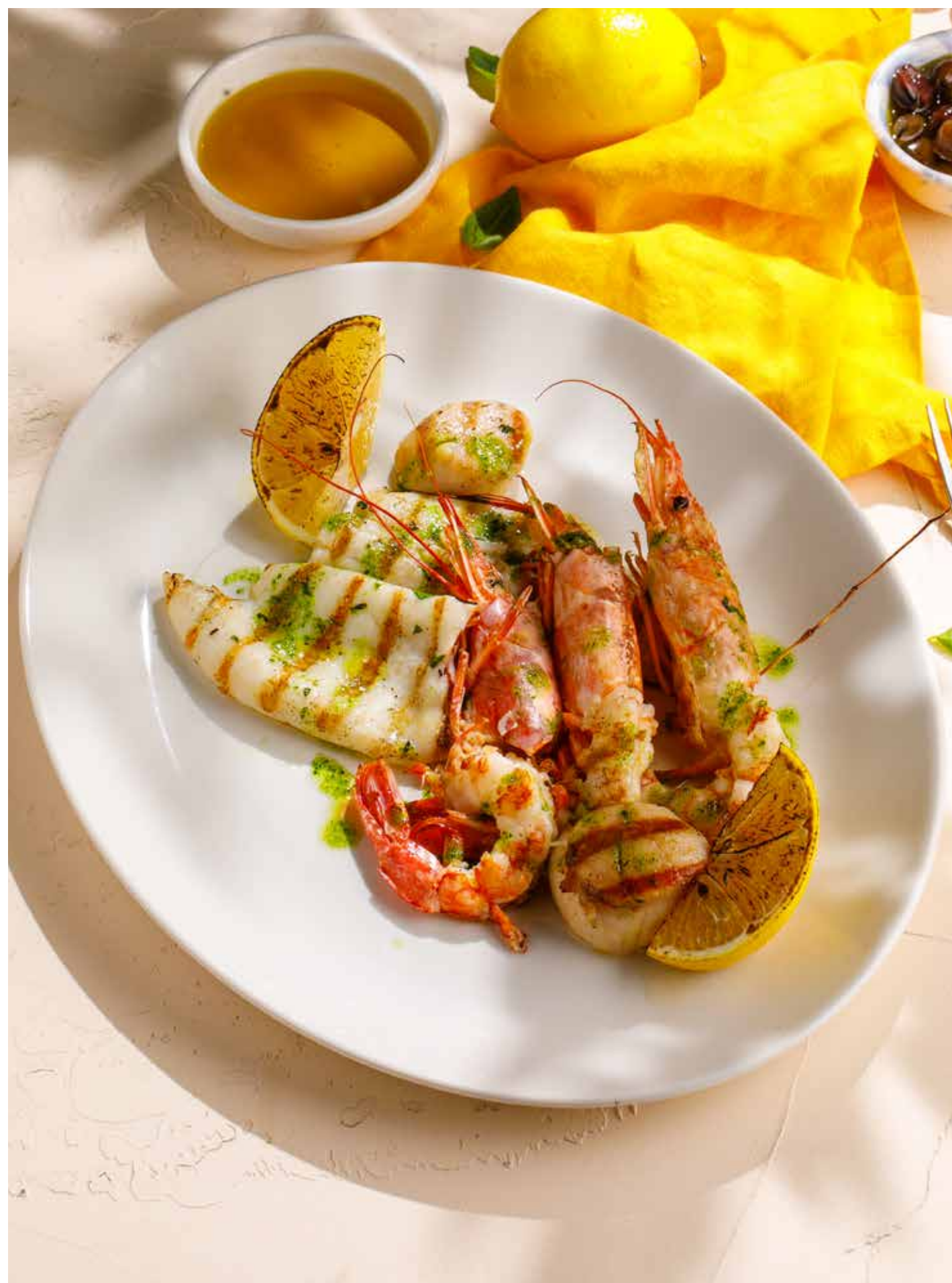
АССОРТИ ИЗ МОРЕПРОДУКТОВ (ФИЛЕ СИБАСА, КАЛЬМАРЫ, ГРЕБЕШКИ, КРЕВЕТКИ) Seafood platter (sea bass fillet, squid, scallops, shrimp)

ПРОСЬБА ПРЕДУПРЕЖДАТЬ ВАШЕГО ОФИЦИАНТА ОБ ИМЕЮЩЕЙСЯ У ВАС АЛЛЕРГИИ НА ОПРЕДЕЛЕННЫЕ ПРОДУКТЫ ПИТАНИЯ. Please, tell your waiter if you have any food allergy to certain products.