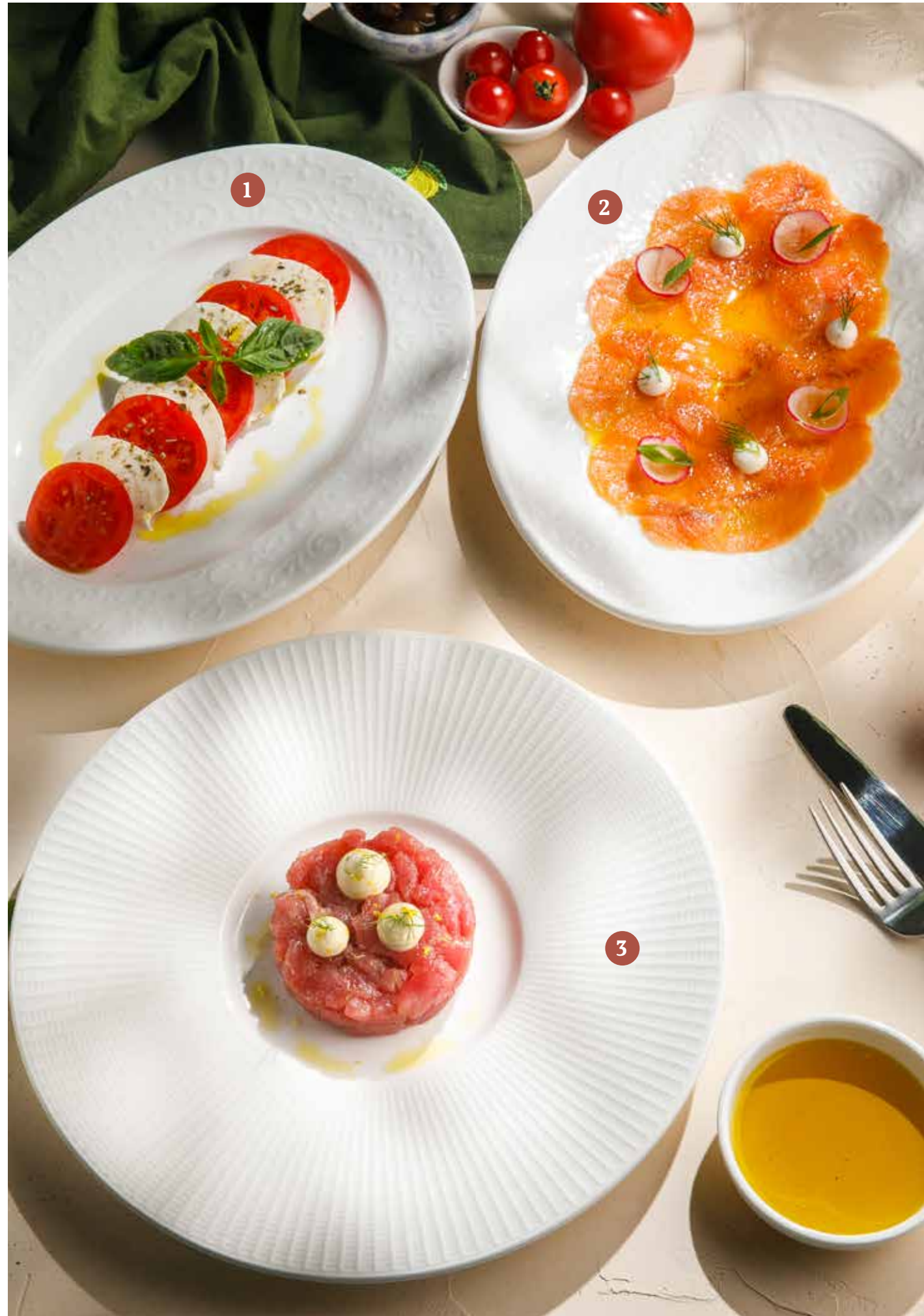
1 КАПРЕЗЕ 990₽ 2 КАРПАЧЧО ИЗ ЛОСОСЯ 1190₽ 3 ТАРТАР ИЗ ТУНЦА 1190₽ Caprese salad Salmon carpaccio Tuna tartare