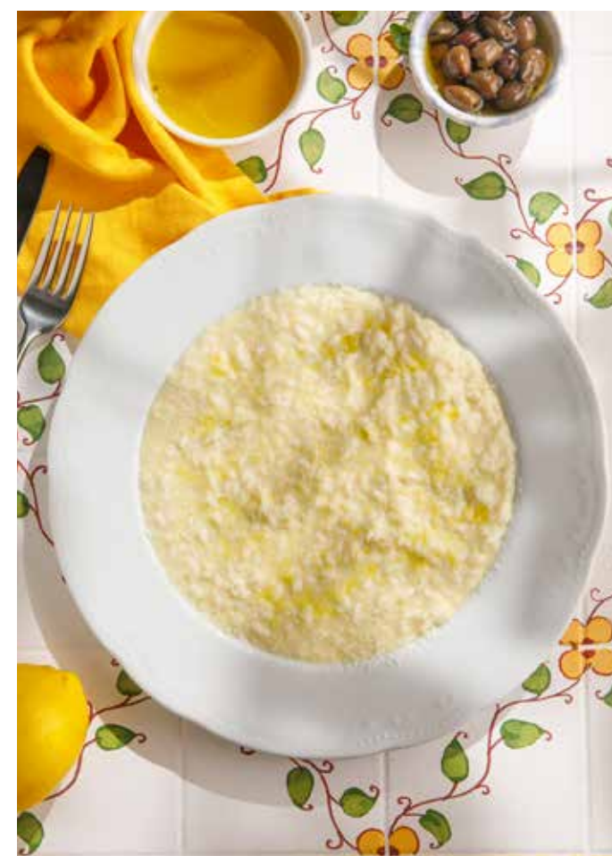
РИЗОТТО «ЧЕТЫРЕ СЫРА» Four cheese risotto