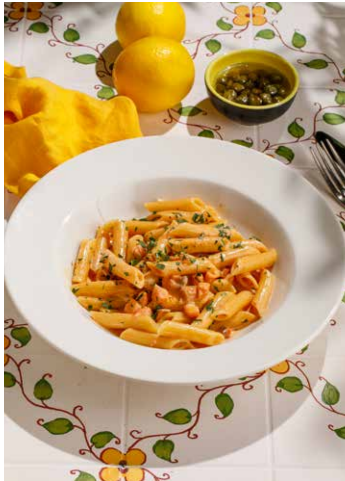
ПЕННЕ С КОПЧЕНЫМ ЛОСОСЕМ Penne with smoked salmon