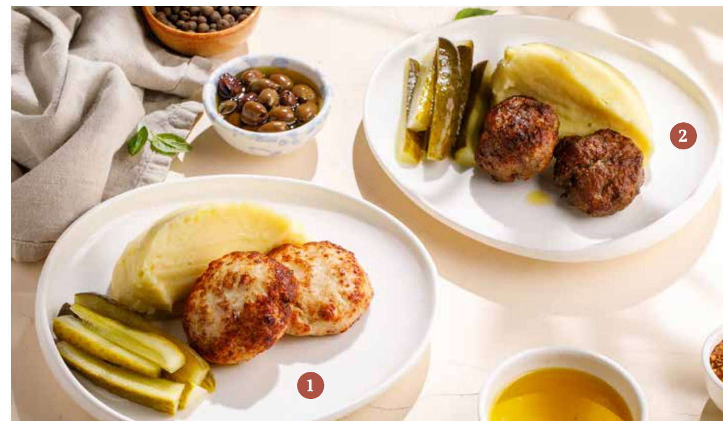
1 КОТЛЕТЫ ИЗ ИНДЕЙКИ 890₽ С КАРТОФЕЛЬНЫМ ПЮРЕ Turkey patties with mashed potatoes