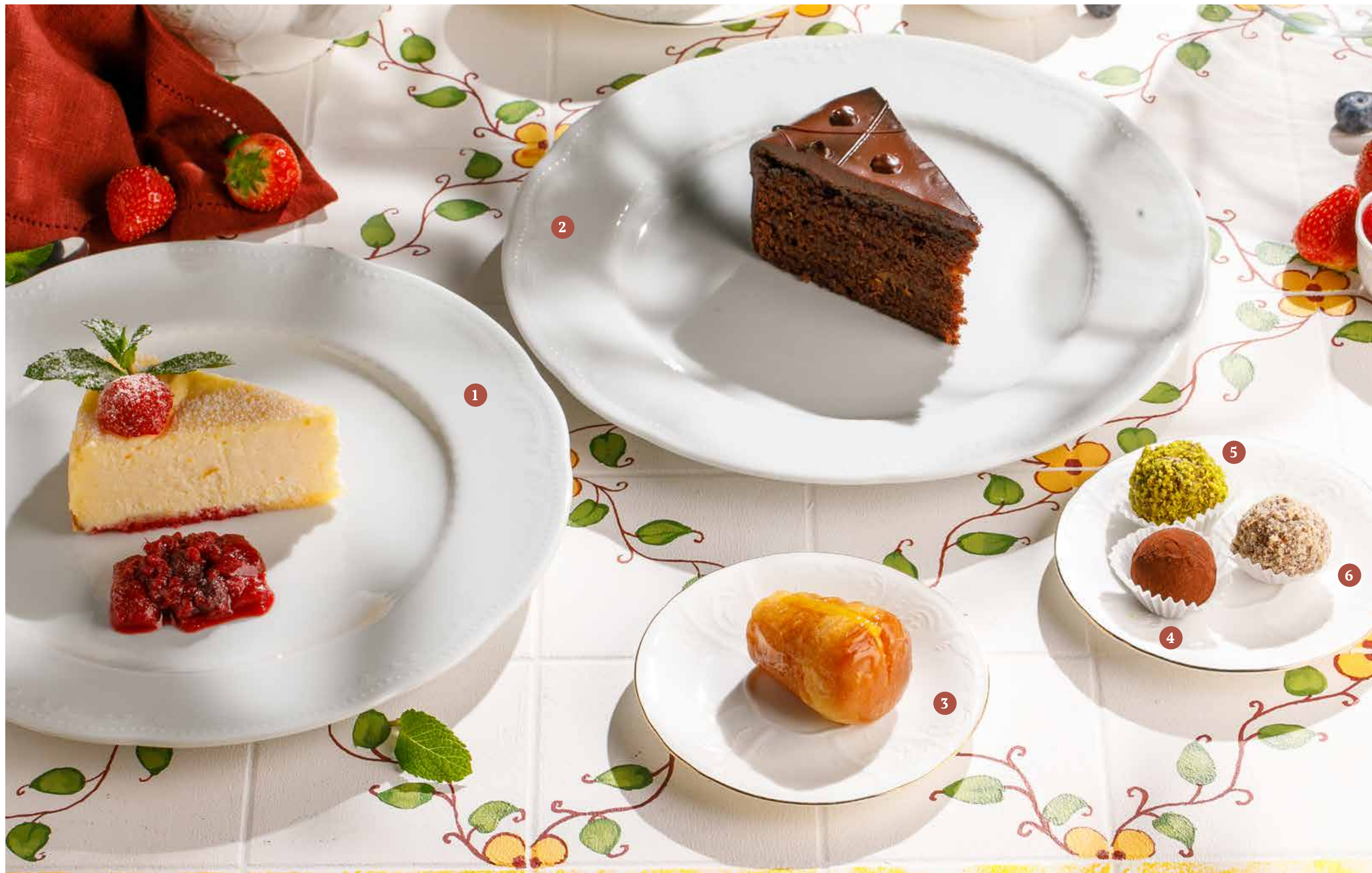
1 ЧИЗКЕЙК КЛАССИЧЕСКИЙ Classic cheesecake