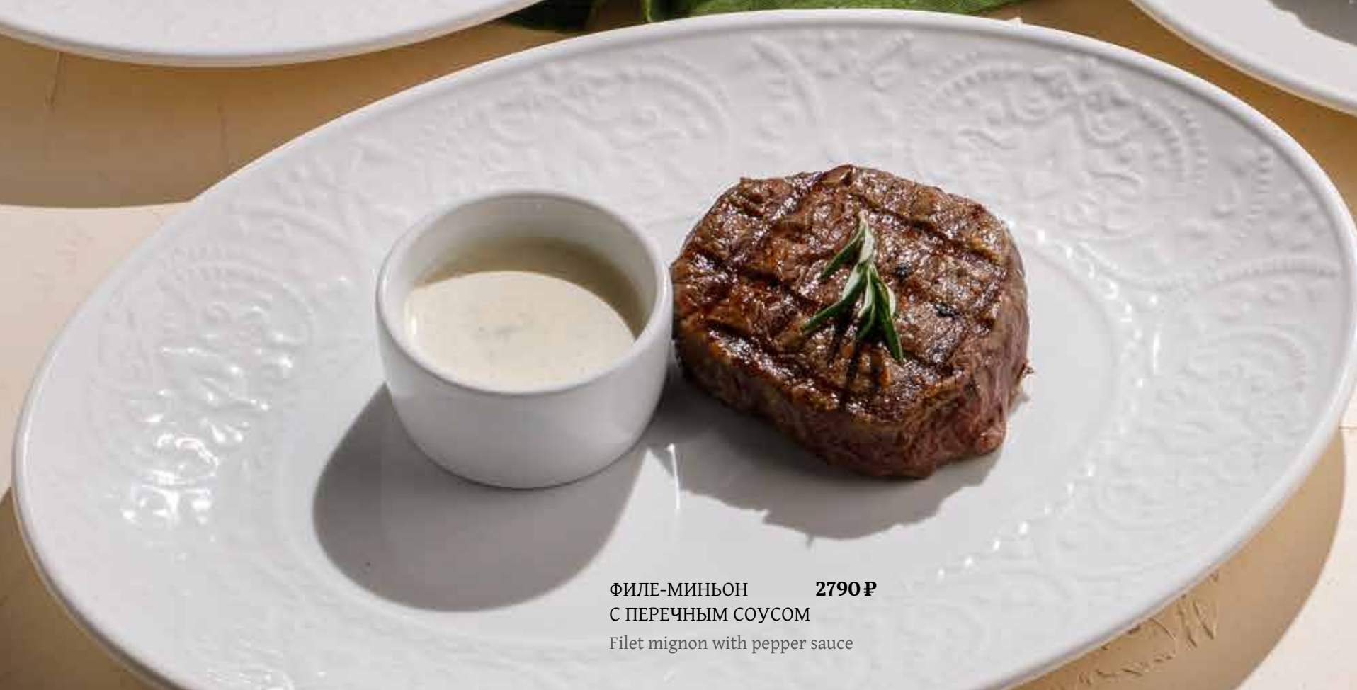
ФИЛЕ-МИНЬОН 2790 ₽ С ПЕРЕЧНЫМ СОУСОМ Filet mignon with pepper sauce