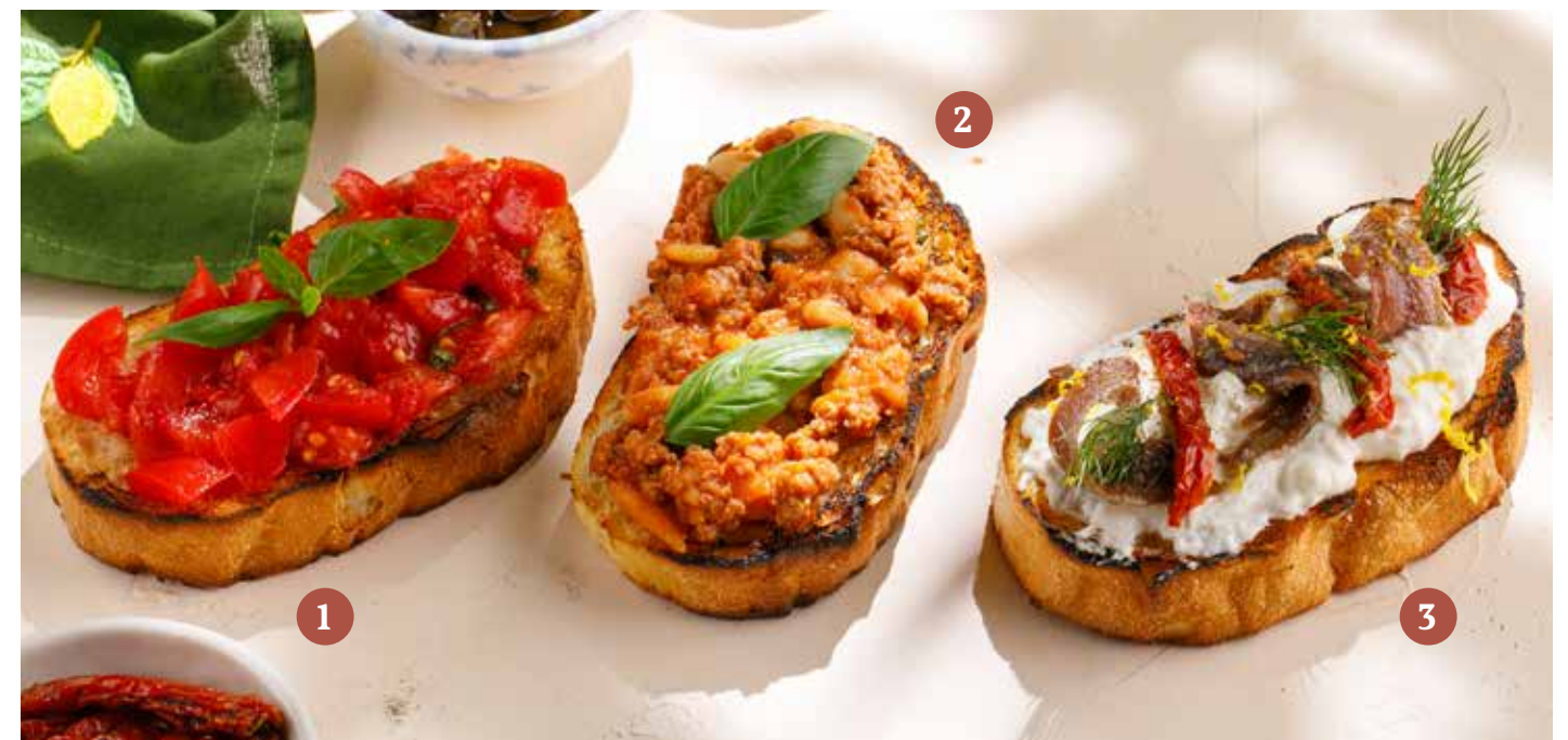
1 БРУСКЕТТА С ТОМАТАМИ И БАЗИЛИКОМ Tomato bruschetta with basil