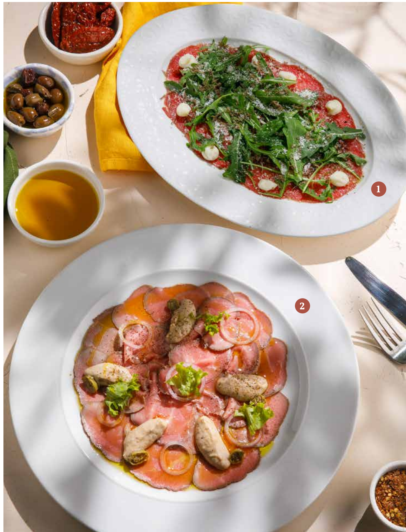
1 КАРПАЧЧО ИЗ ГОВЯДИНЫ С ЧЕРНЫМ ТРЮФЕЛЕМ Beef carpaccio with black truffle

ПРОСЬБА ПРЕДУПРЕЖДАТЬ ВАШЕГО ОФИЦИАНТА ОБ ИМЕЮЩЕЙСЯ У ВАС АЛЛЕРГИИ НА ОПРЕДЕЛЕННЫЕ ПРОДУКТЫ ПИТАНИЯ. Please, tell your waiter if you have any food allergy to certain products.