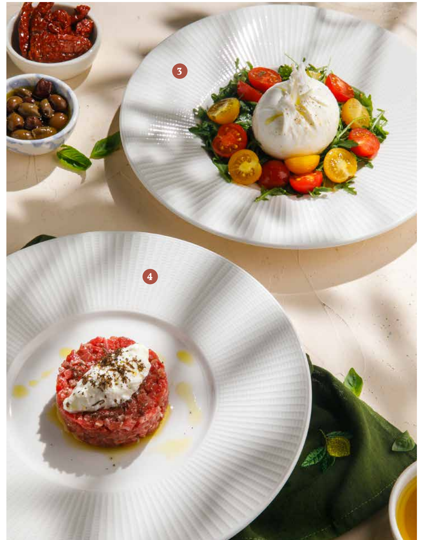
3 БУРРАТА С ТОМАТАМИ И РУКОЛОЙ Burrata with tomatoes and arugula