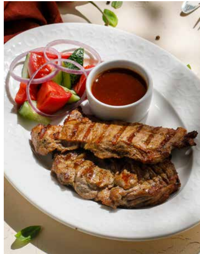
НЕЖНАЯ СВИНИНА, ПРИГОТОВЛЕННАЯ НА УГЛЯХ Charcoal roasted tender pork