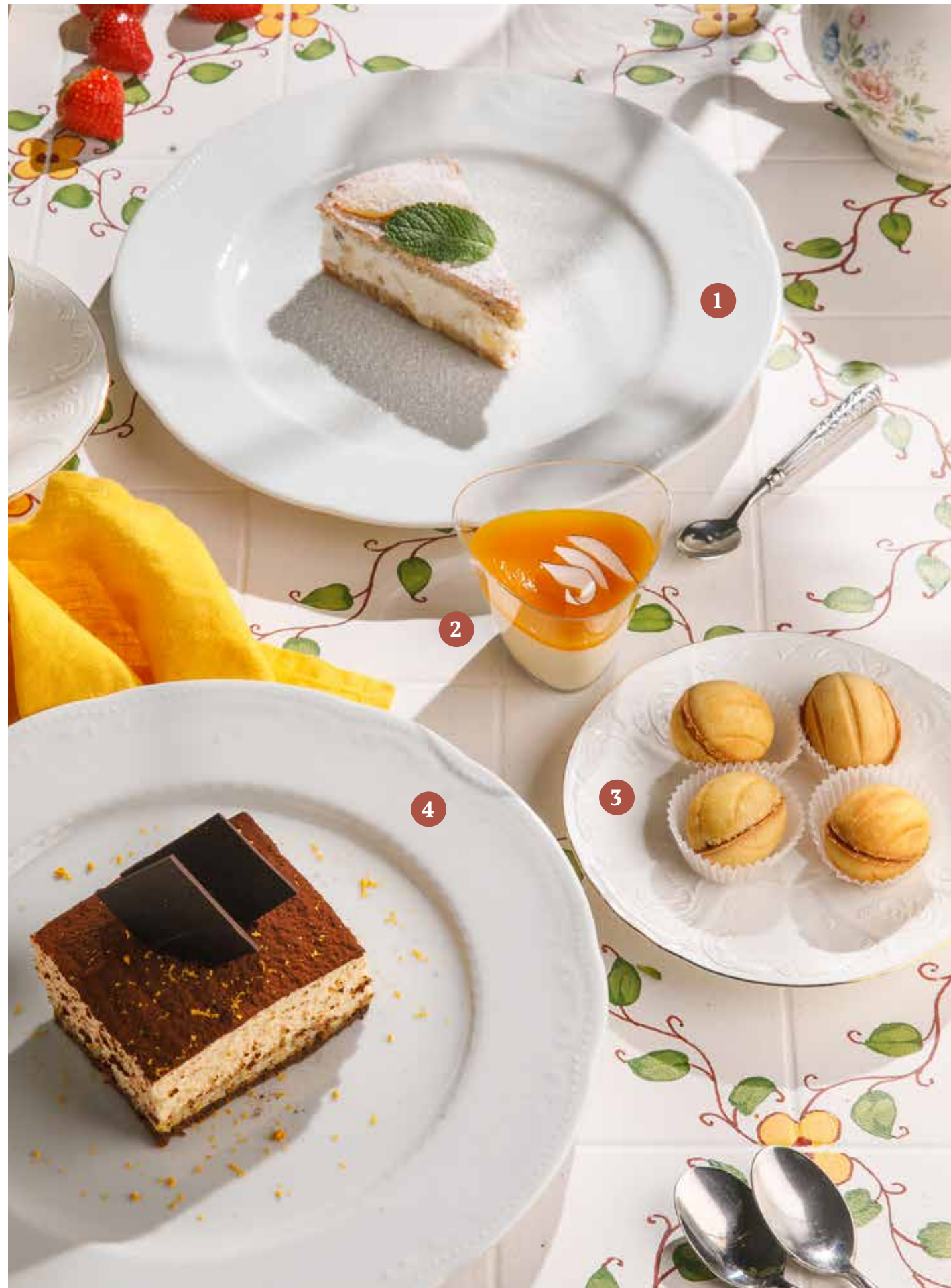
1 ТОРТ С РИКОТТОЙ И ГРУШЕЙ