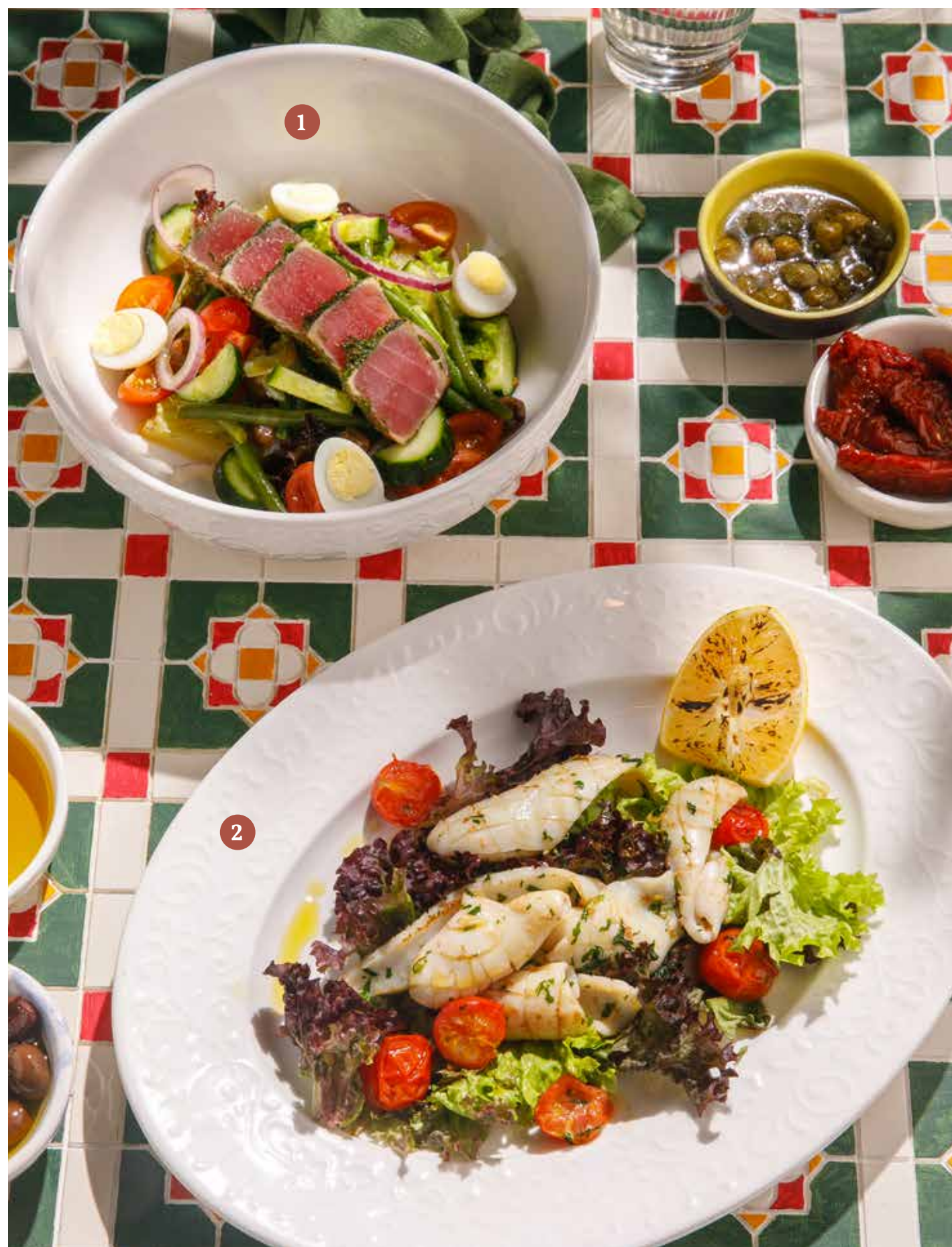
1 НИСУАЗ С ТУНЦОМ Tuna nicoise salad

ПРОСЬБА ПРЕДУПРЕЖДАТЬ ВАШЕГО ОФИЦИАНТА ОБ ИМЕЮЩЕЙСЯ У ВАС АЛЛЕРГИИ НА ОПРЕДЕЛЕННЫЕ ПРОДУКТЫ ПИТАНИЯ. Please, tell your waiter if you have any food allergy to certain products.