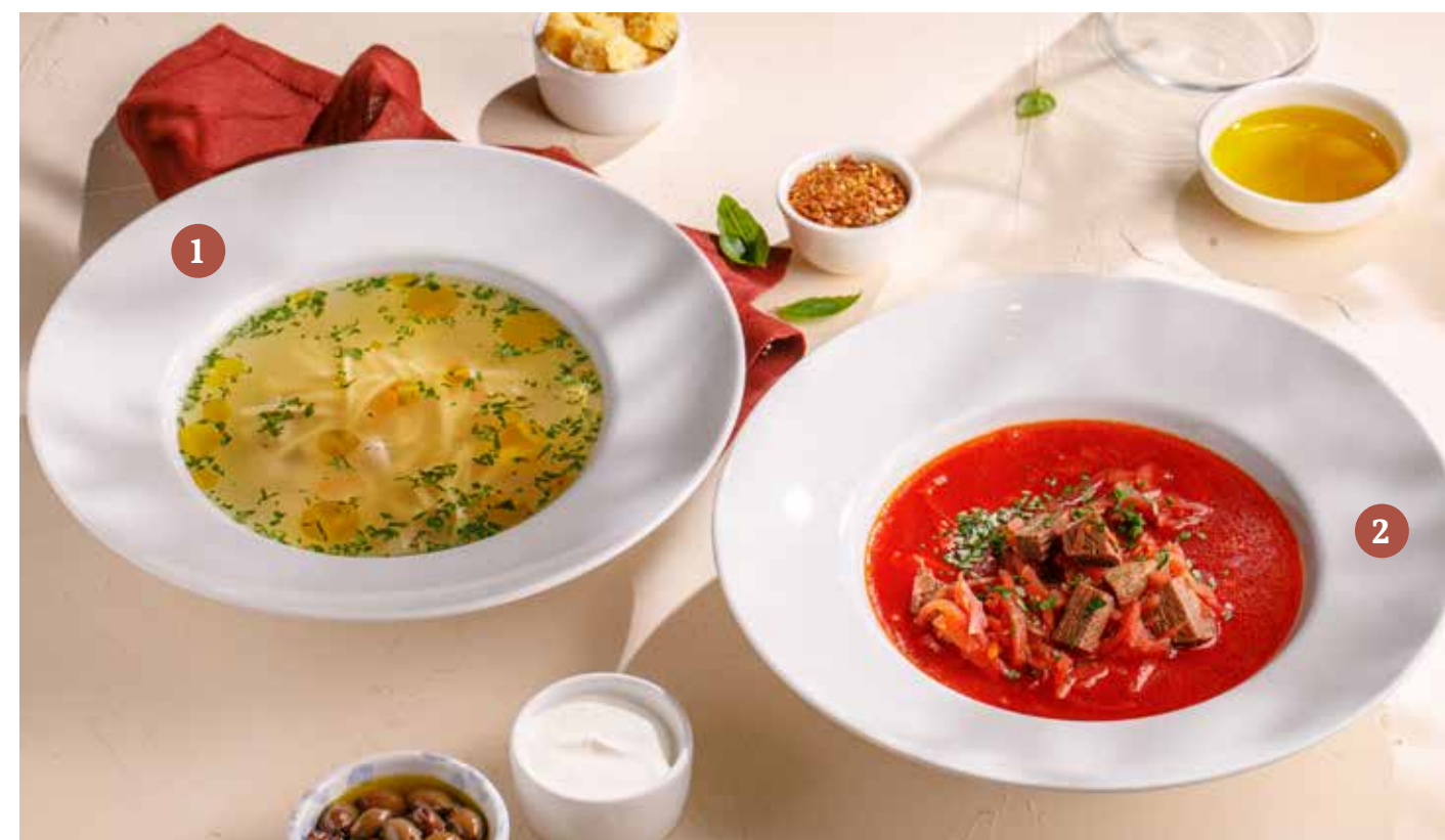
1 ДОМАШНИЙ КУРИНЫЙ СУП Homemade chicken soup