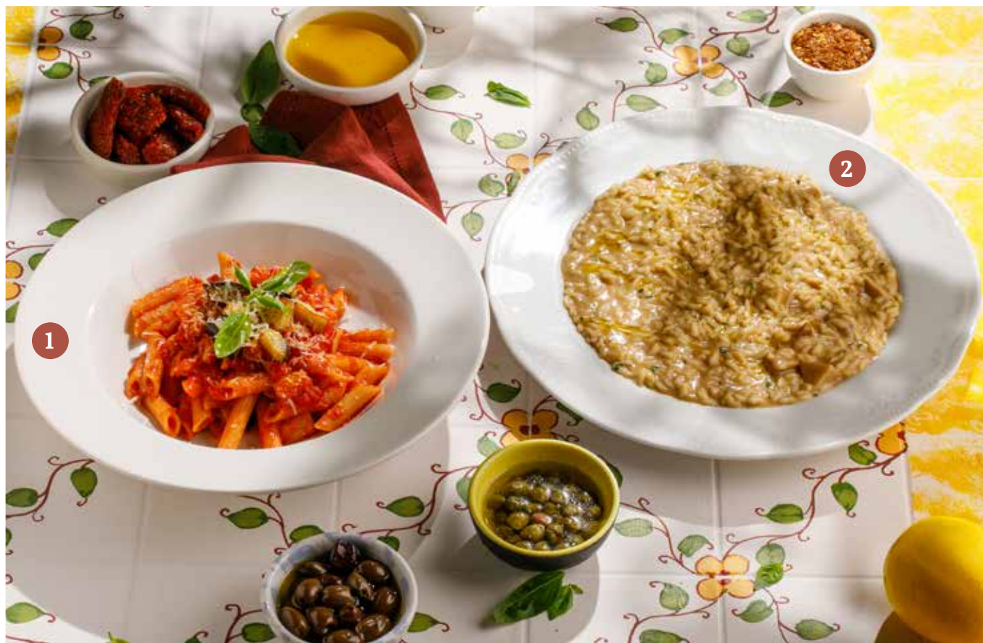
1 ПЕННЕ С БАКЛАЖАНОМ Penne with eggplant