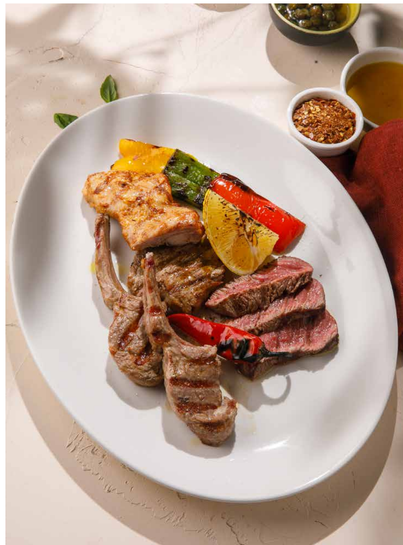
АССОРТИ ИЗ МЯСА НА ГРИЛЕ (КАРЕ ЯГНЕНКА, ФИЛЕ ГОВЯДИНЫ, КУРИЦА, СВИНИНА) Grilled meat platter (rack of lamb, beef loin, chicken, pork)