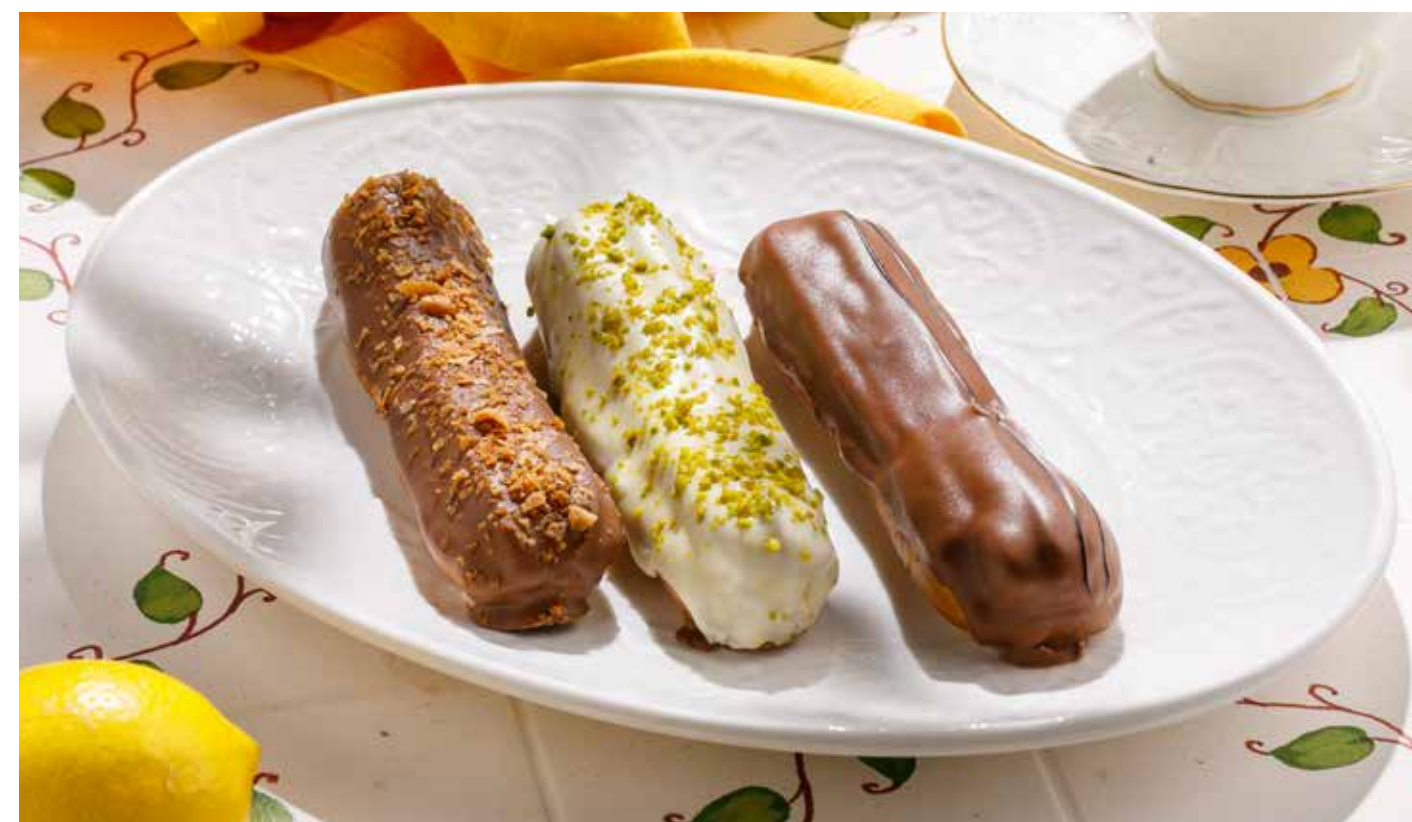
ЭКЛЕР ВАНИЛЬНЫЙ / ФИСТАШКОВЫЙ / ФУНДУЧНЫЙ Vanilla / pistachio / hazelnut eclair