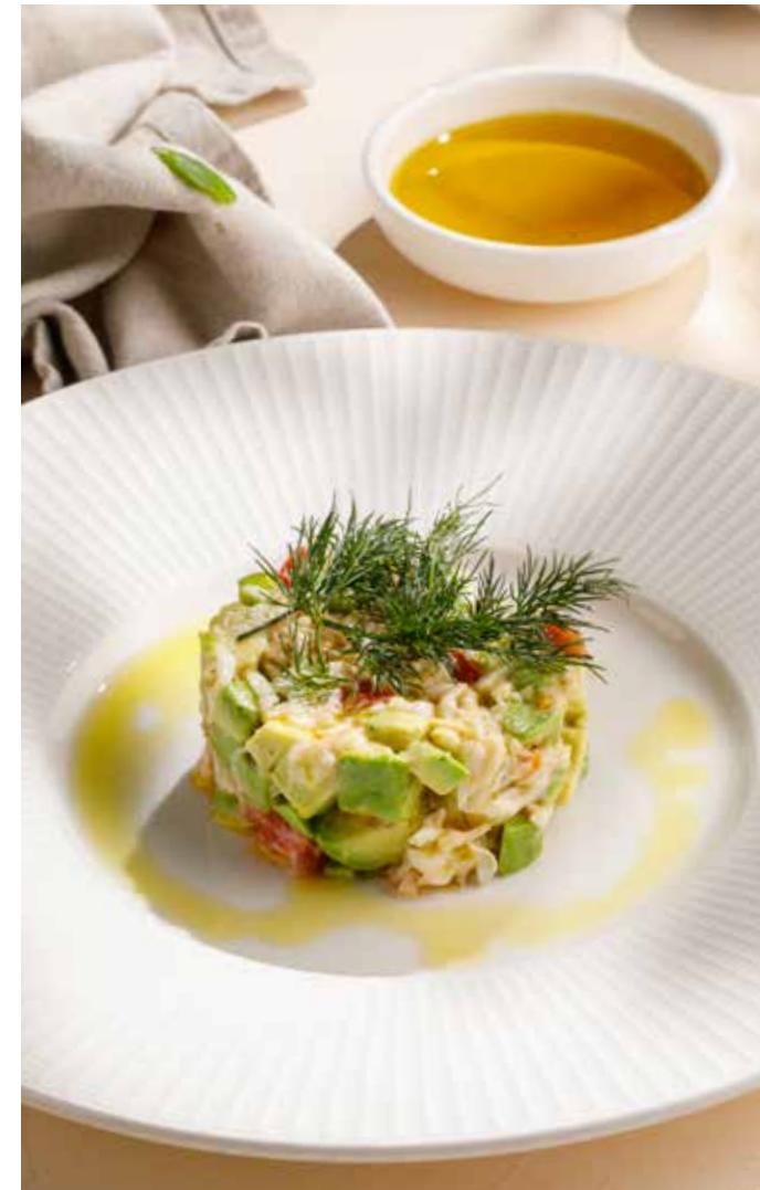
ТАРТАР ИЗ КРАБА И АВОКАДО Crab tartare with avocado