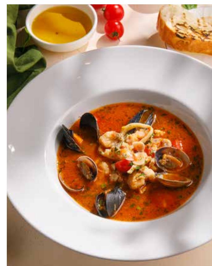
СУП С ДАРАМИ МОРЯ ТИГРОВЫЕ КРЕВЕТКИ / МИДИИ / КАЛЬМАРЫ / ПАЛТУС / ДОРАДО Seafood soup Tiger shrimp / mussels / squid / halibut / dorado