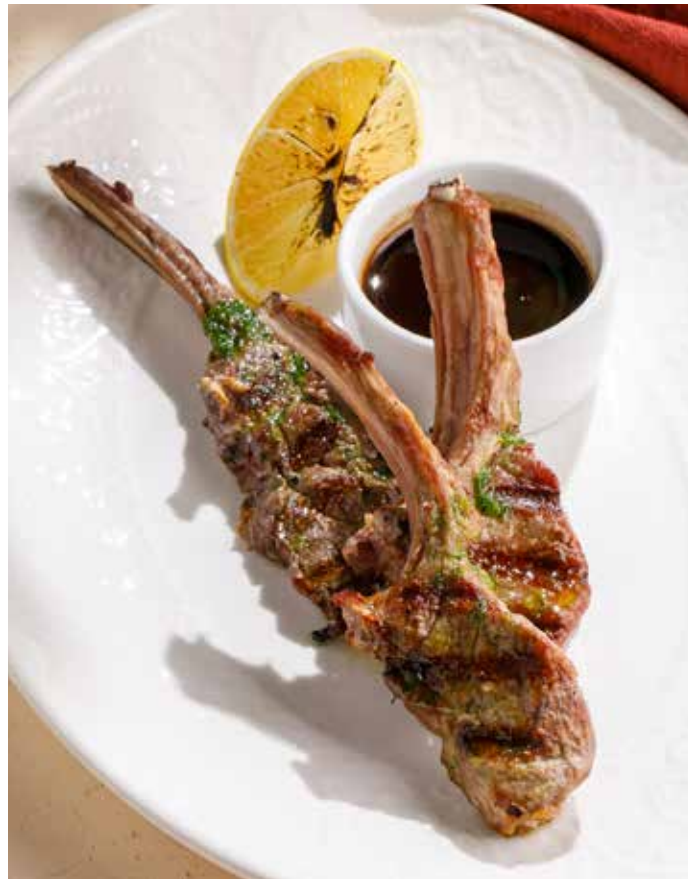
РЕБРЫШКИ ЯГНЕНКА С ГРАНАТОВЫМ СОУСОМ Lamb ribs with pomegranate sauce