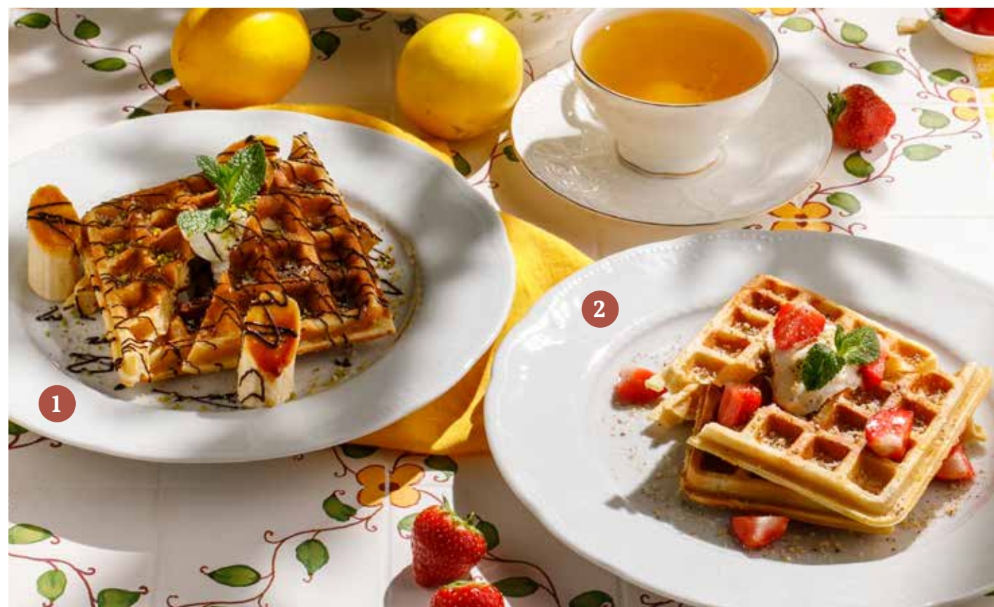
1 БЕЛЬГИЙСКИЕ ВАФЛИ С БАНАНОМ, ШОКОЛАДОМ И ФИСТАШКАМИ 590 ₺ Belgian waffles with banana, chocolate and pistachio 2 БЕЛЬГИЙСКИЕ ВАФЛИ С СЕЗОННЫМИ ЯГОДАМИ И АПЕЛЬСИНОВЫМ СОУСОМ 590 ₺ Belgian waffles with seasonal berries and orange sauce