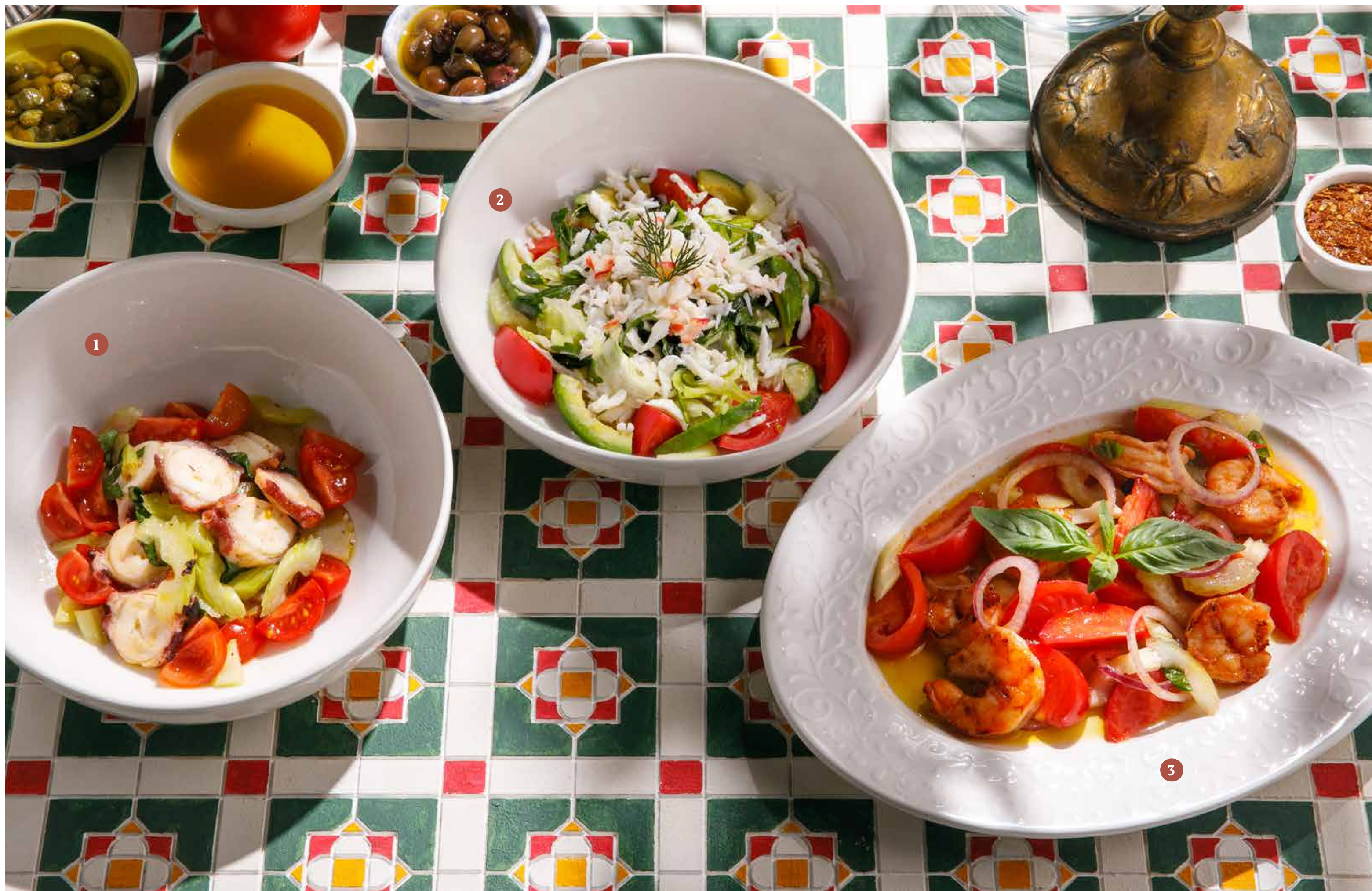
1 САЛАТ С ОСЬМИНОГОМ Octopus salad