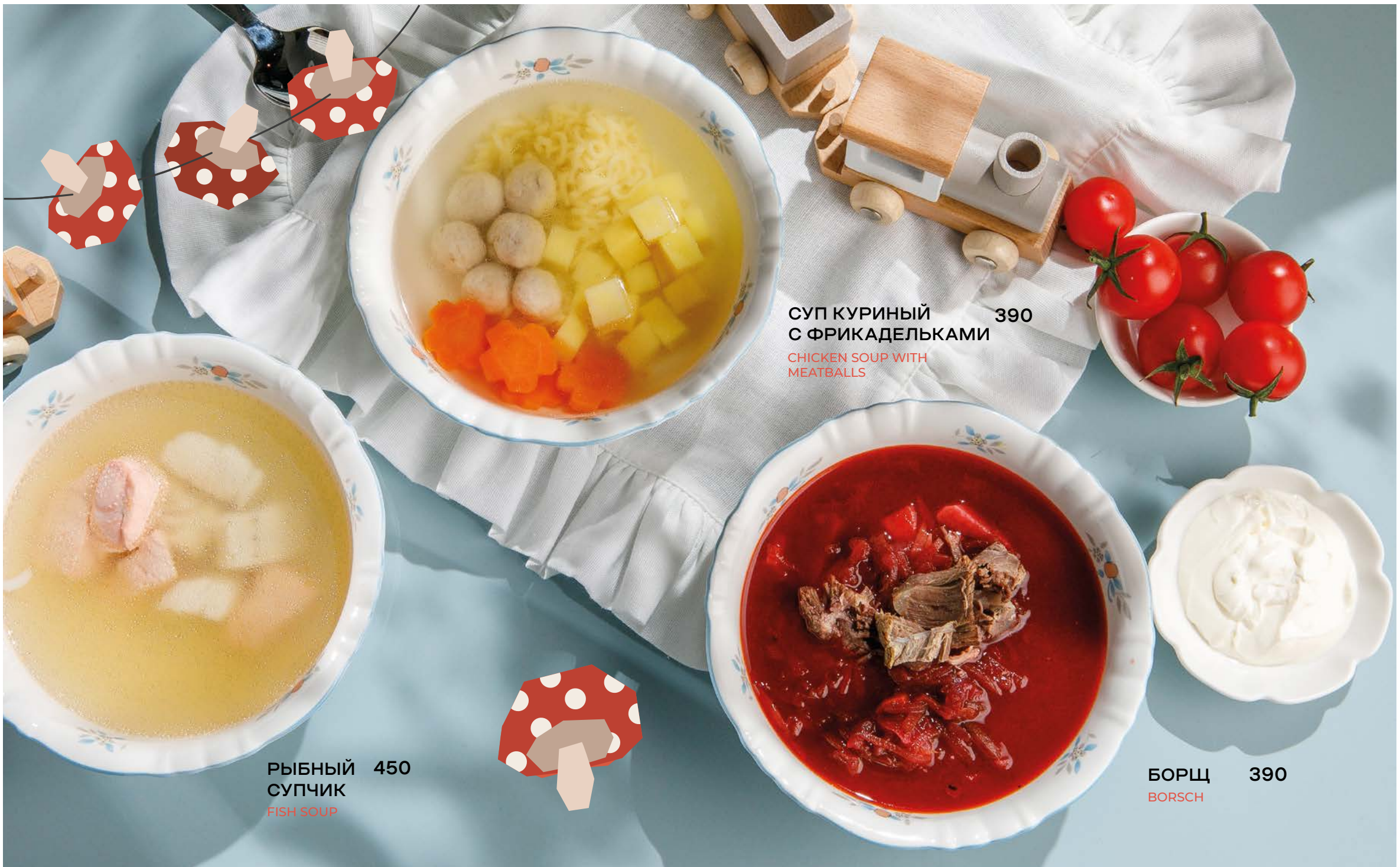
СУП КУРИНЫЙ С ФРИКАДЕЛЬКАМИ 390 CHICKEN SOUP WITH MEATBALLS