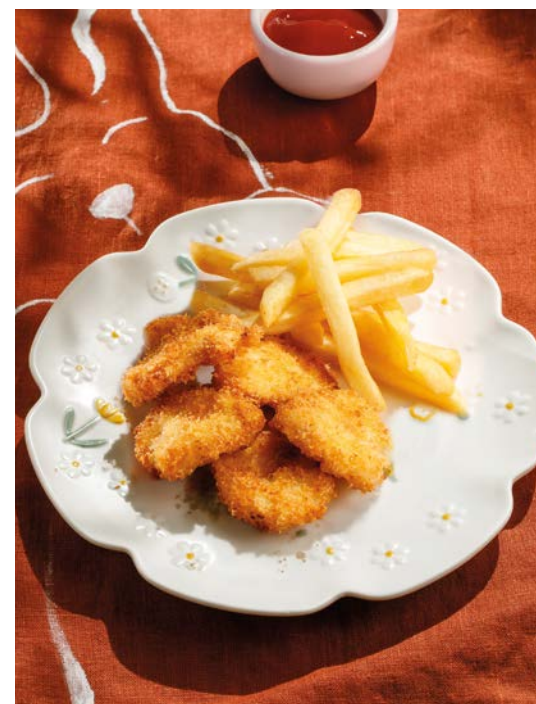
НАГГЕТСЫ КУРИНЫЕ С КАРТОФЕЛЕМ ФРИ CHICKEN NUGGETS WITH FRENCH FRIES