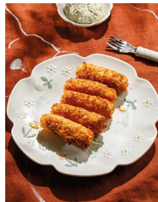
РЫБНЫЕ ПАЛОЧКИ FISH STICKS