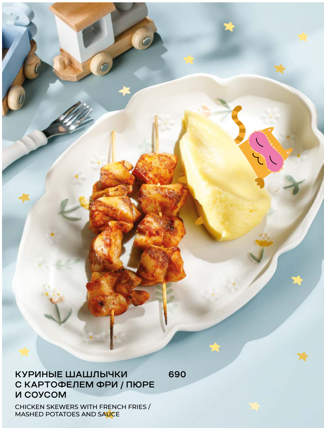
КУРИНЫЕ ШАШЛЫЧКИ С КАРТОФЕЛЕМ ФРИ / ПЮРЕ И СОУСОМ 690

CHICKEN SKEWERS WITH FRENCH FRIES / MASHED POTATOES AND SAUCE