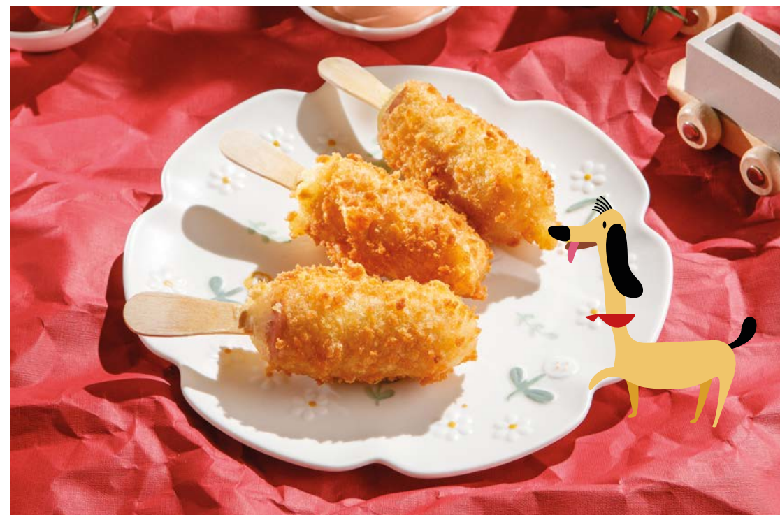
СОСИСКИ В ТЕСТЕ SAUSAGE ROLLS