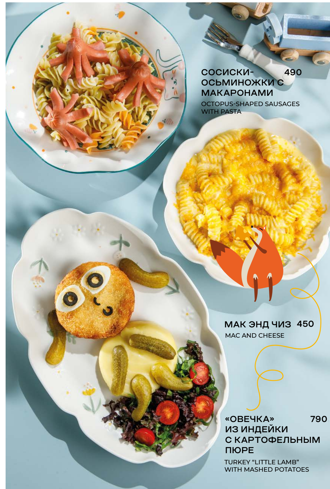
СОСИСКИ- ОСЬМИНОЖКИ С МАКАРОНАМИ 490