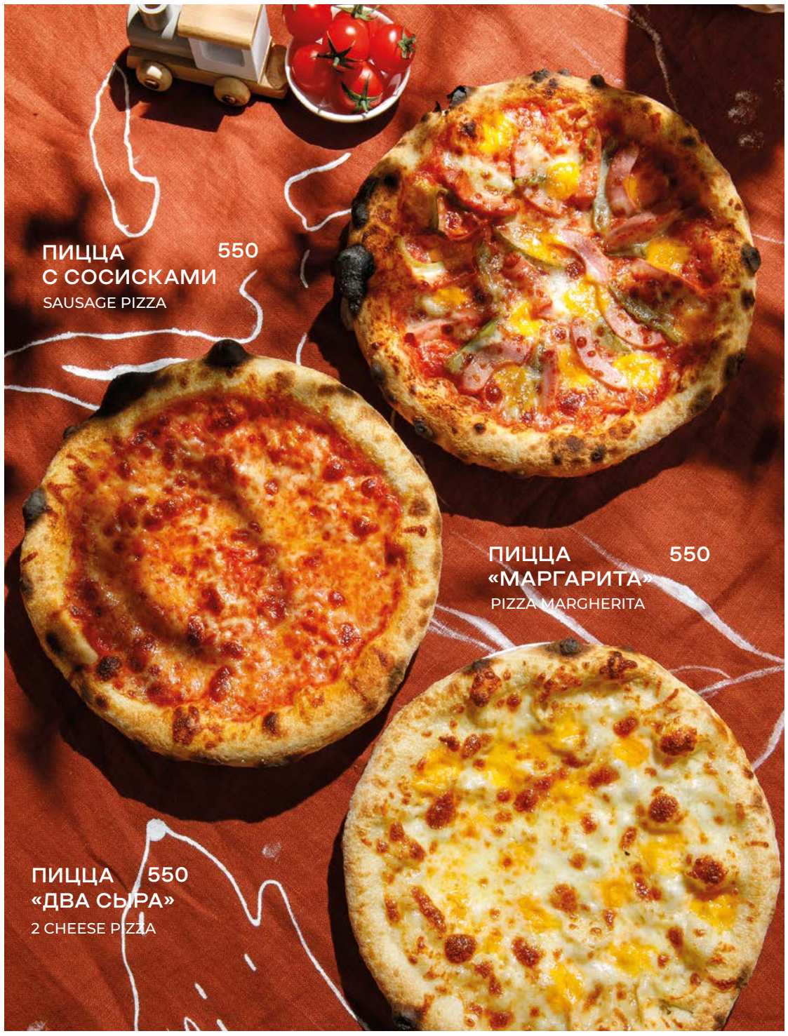
ПИЦЦА 550 С СОСИСКАМИ SAUSAGE PIZZA