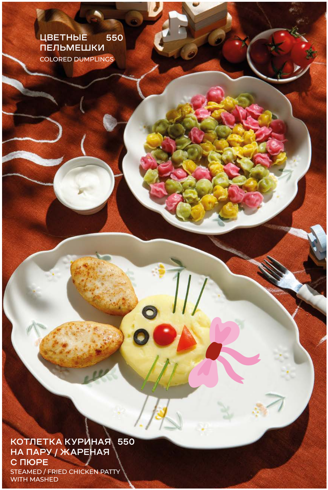
ЦВЕТНЫЕ ПЕЛЬМЕШКИ 550 COLORED DUMPLINGS