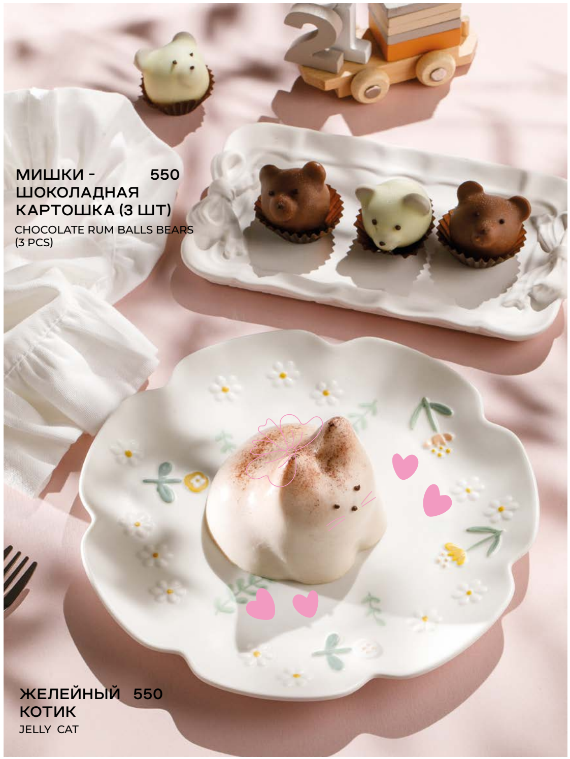
МИШКИ - 550 ШОКОЛАДНАЯ КАРТОШКА (3 ШТ) CHOCOLATE RUM BALLS BEARS (3 PCS)