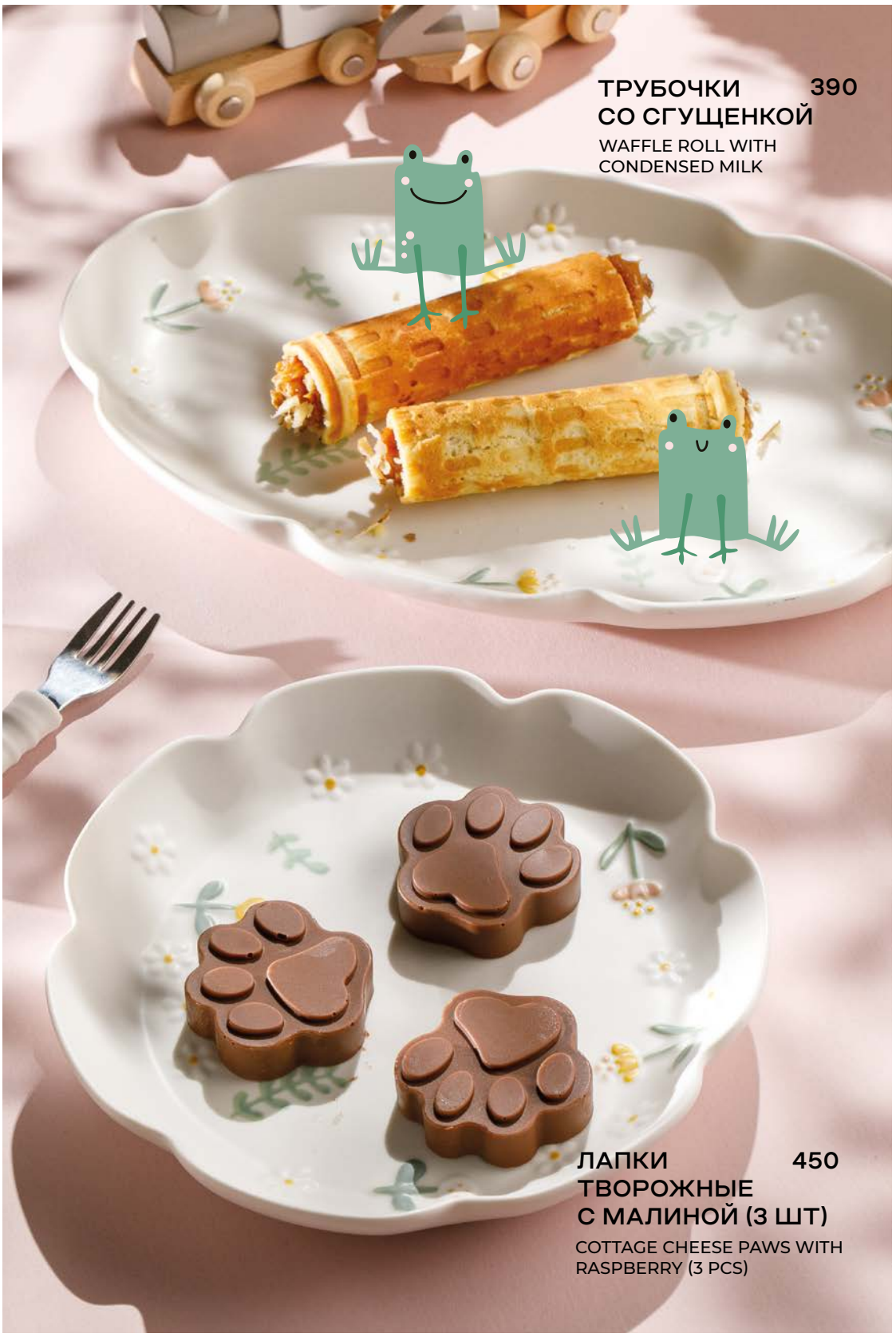
ТРУБОЧКИ 390 СО СГУЩЕННОЙ WAFFLE ROLL WITH CONDENSED MILK