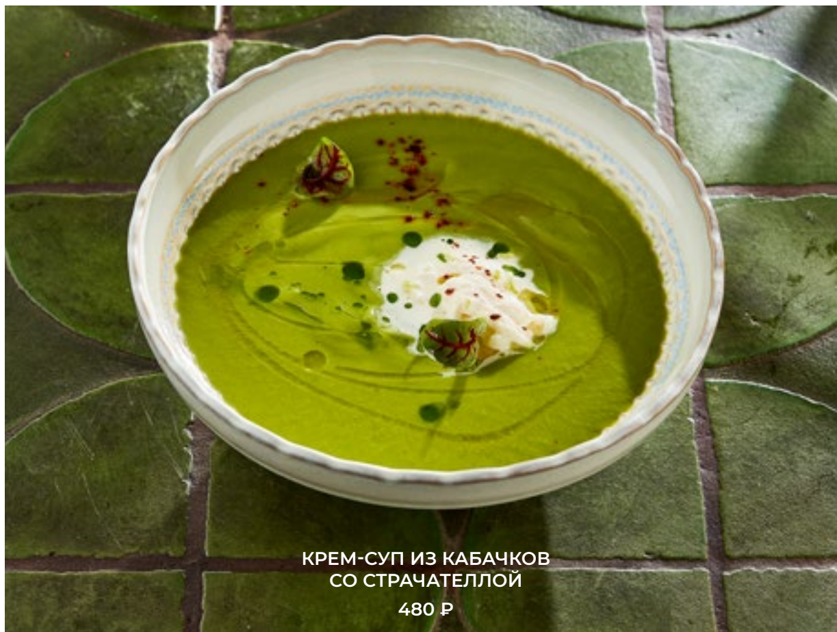
КРЕМ-СУП ИЗ КАБАЧКОВ СО СТРАЧАТЕЛЛОЙ