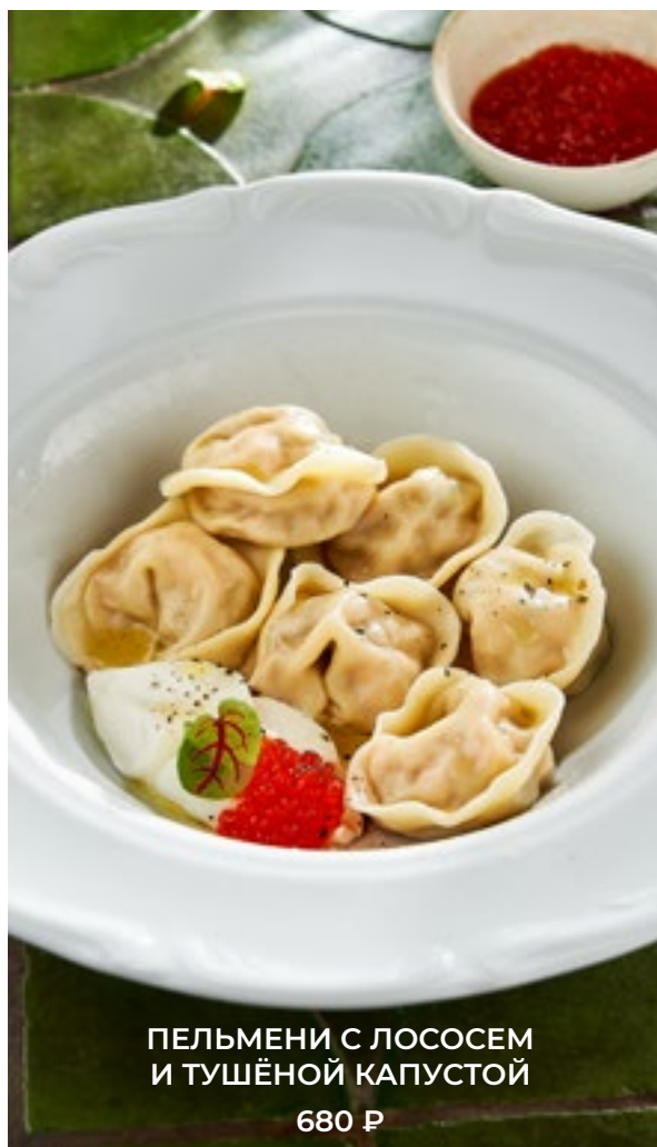
ПЕЛЬМЕНИ С ЛОСОСЕМ И ТУШЁНОЙ КАПУСТОЙ 680 Р