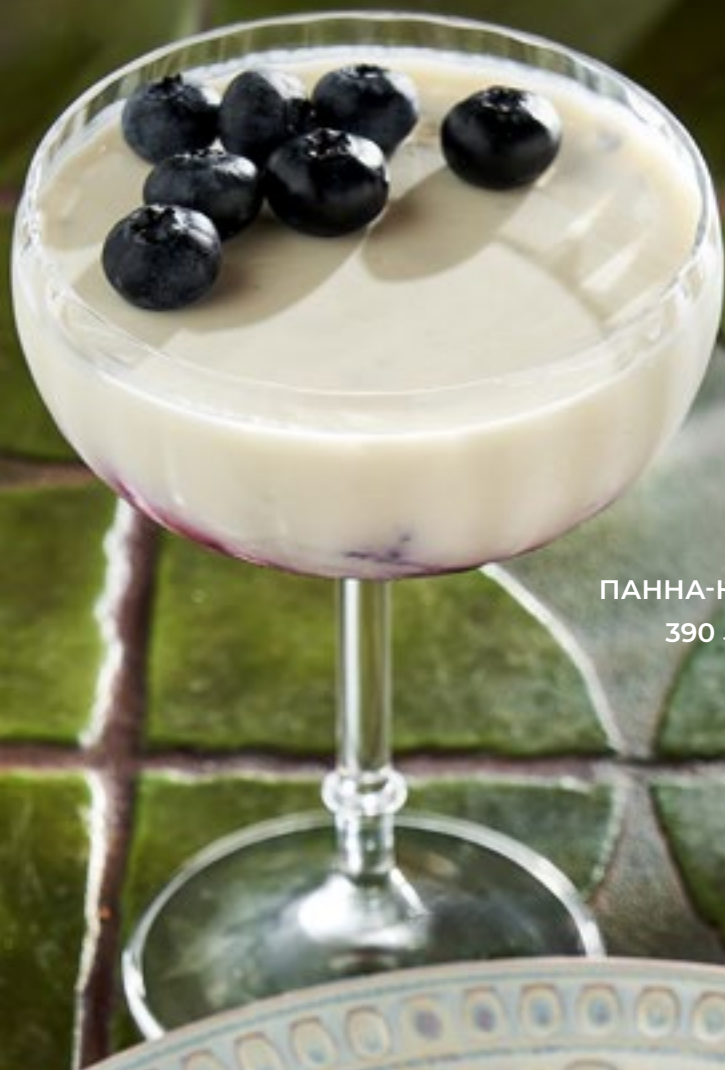
ПАННА-КОТТА 390 Р