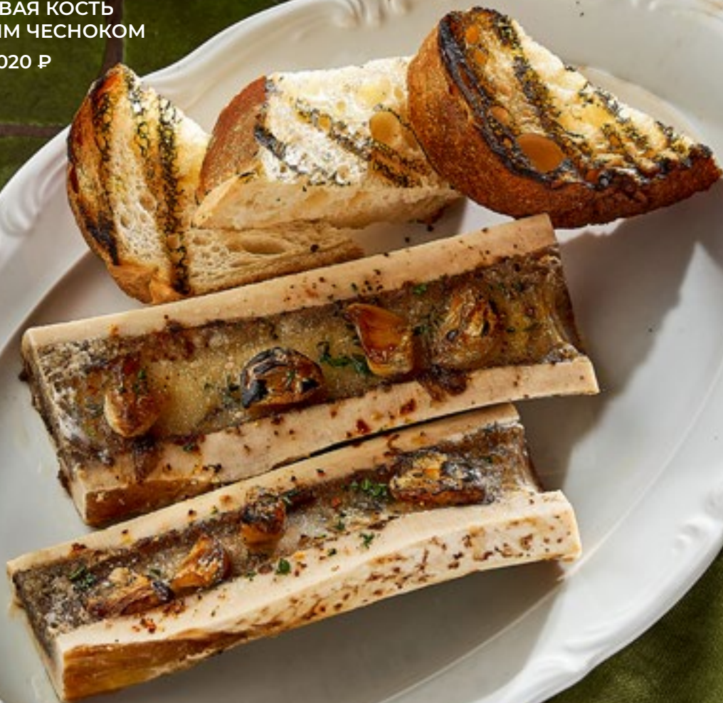
МОЗГОВАЯ КОСТЬ С ПЕЧЁНЫМ ЧЕСНОКОМ 1020 Р