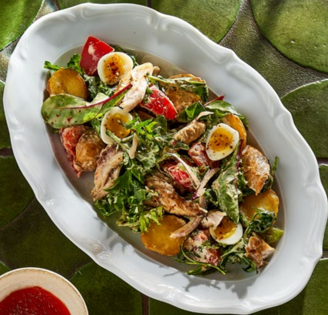
САЛАТ С ПОДКОПЧЁННОЙ СКУМБРИЕЙ