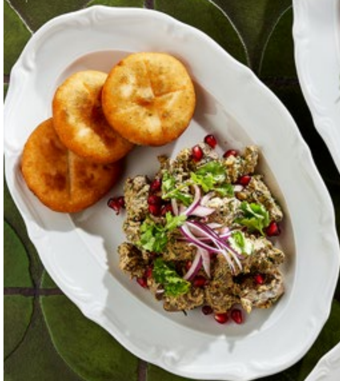
КУЧМАЧИ ИЗ ПЕЧЕНИ С ЗОЛОТИСТЫМИ МЧАДИ 520 Р