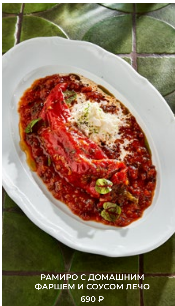
РАМИРО С ДОМАШНИМ ФАРШЕМ И СОУСОМ ЛЕЧО 690 Р