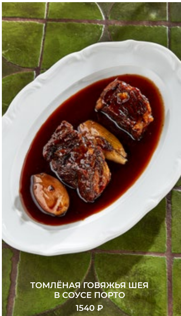
ТОМЛЁНАЯ ГОВЯЖЬЯ ШЕЯ В СОУСЕ ПОРТО 1540 Р