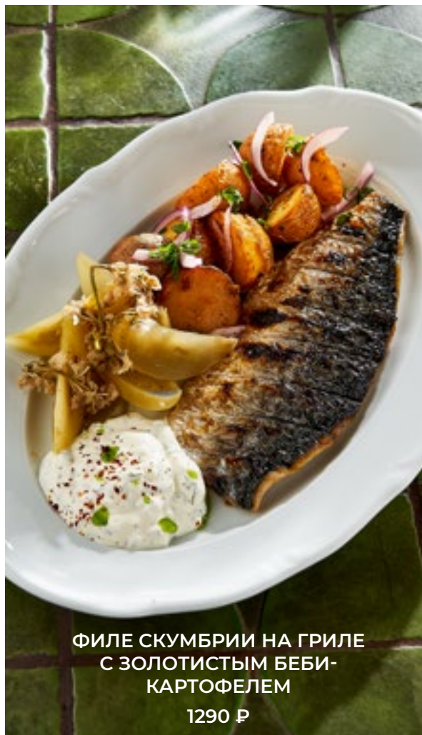
ФИЛЕ СКУМБРИИ НА ГРИЛЕ С ЗОЛОТИСТЫМ БЕБИ- КАРТОФЕЛЕМ 1290 Р