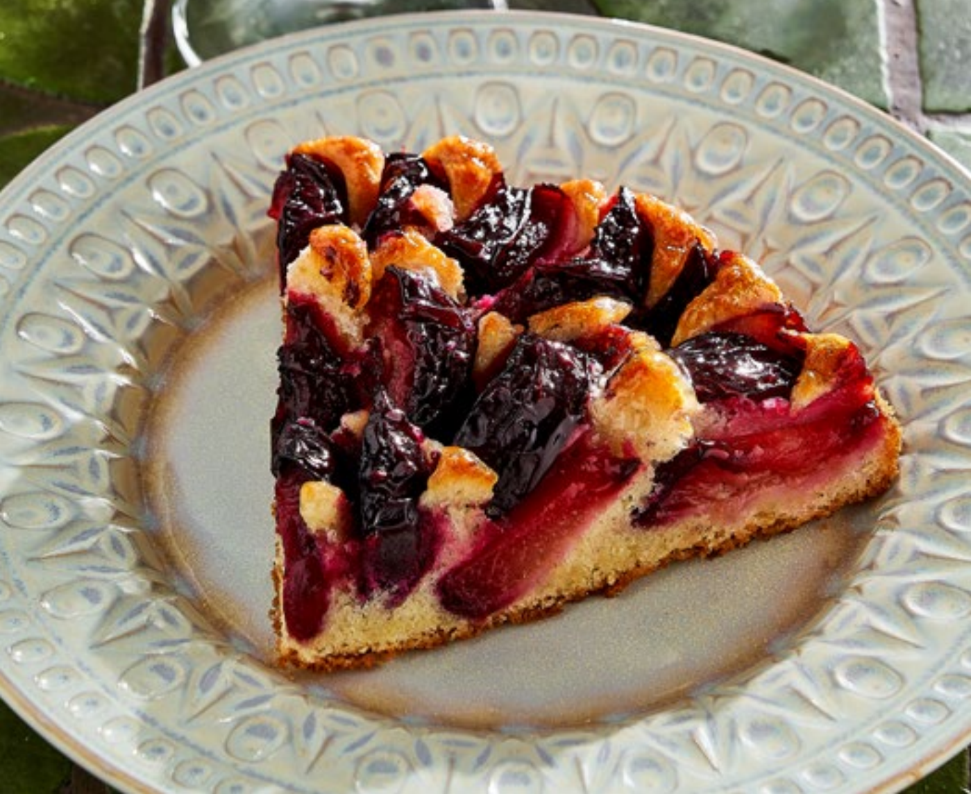
СЛИВОВЫЙ ПИРОГ 390 Р