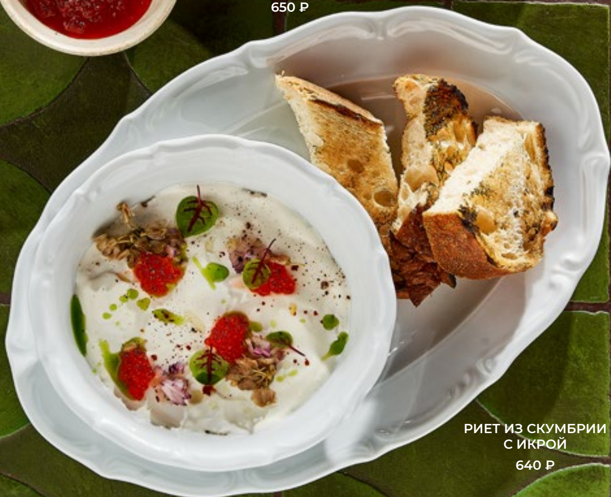
РИЕТ ИЗ СКУМБРИИ С ИКРОЙ