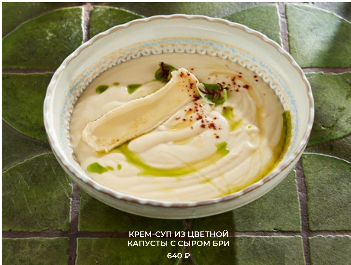
КРЕМ-СУП ИЗ ЦВЕТНОЙ КАПУСТЫ С СЫРОМ БРИ