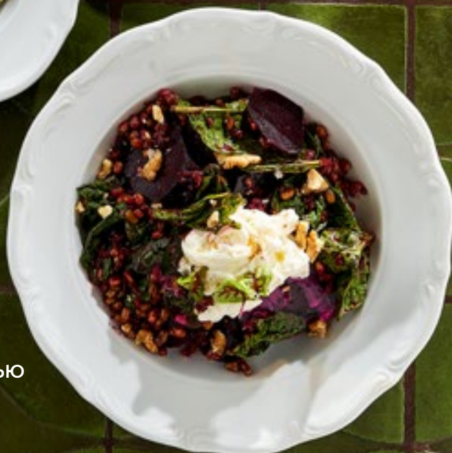
САЛАТ СО СВЁКЛОЙ, ФАСОЛЬЮ МАШ И СТРАЧАТЕЛЛОЙ 620 Р