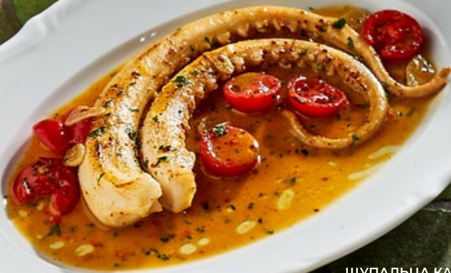
ЩУПАЛЬЦА КАЛЬМАРА 1290 Р