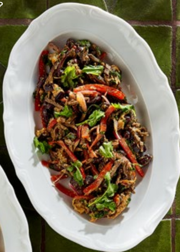
САЛАТ ТБИЛИСО 690 Р