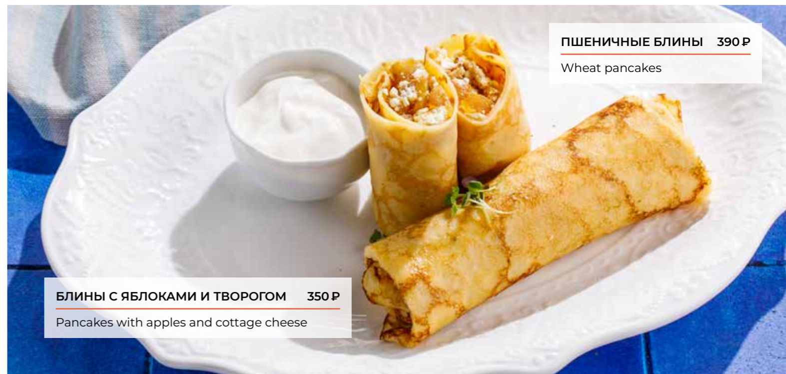
ПШЕНИЧНЫЕ БЛИНЫ 390 Р Wheat pancakes БЛИНЫ С ЯБЛОКАМИ И ТВОРОГОМ 350 Р Pancakes with apples and cottage cheese