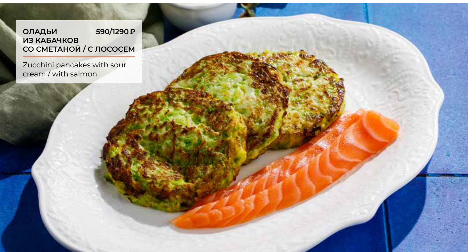
ОЛАДЫ 590/1290 Р ИЗ КАБАЧКОВ СО СМЕТАНОЙ / С ЛОСОСЕМ Zucchini pancakes with sour cream / with salmon