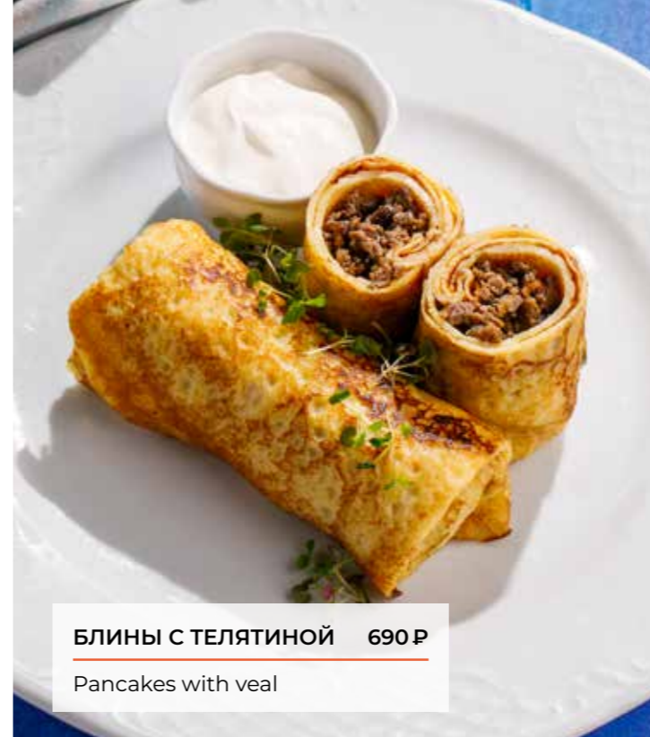
БЛИНЫ С ТЕЛЯТИНОЙ 690 Р Pancakes with veal