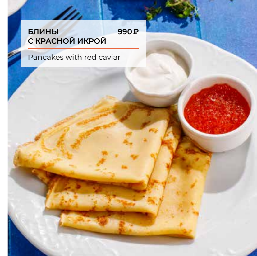
БЛИНЫ 990 Р С КРАСНОЙ ИКРОЙ Pancakes with red caviar