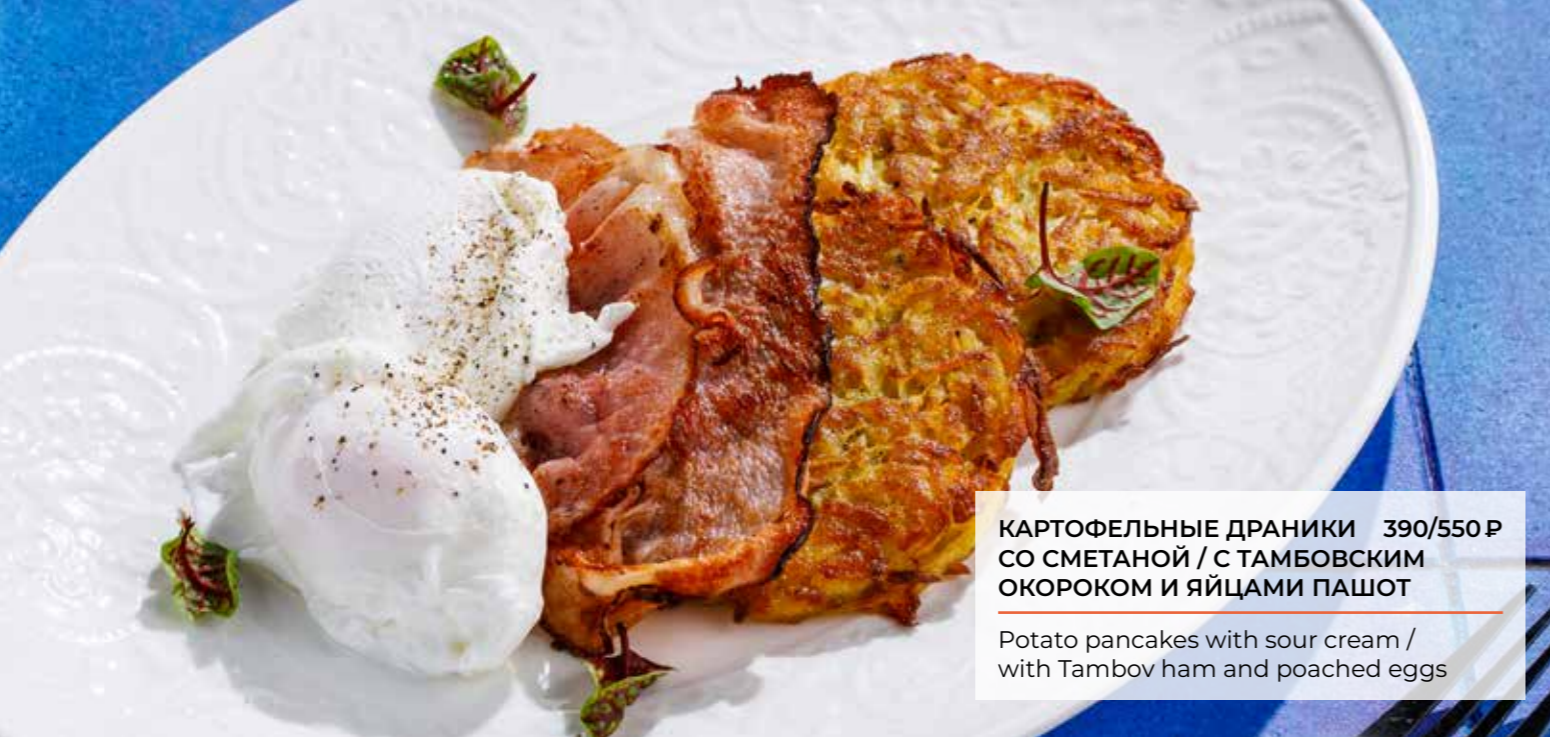
КАРТОФЕЛЬНЫЕ ДРАНИКИ 390/550 Р СО СМЕТАНОЙ / С ТАМБОВСКИМ ОКОРОКОМ И ЯЙЦАМИ ПАШОТ Potato pancakes with sour cream / with Tambov ham and poached eggs