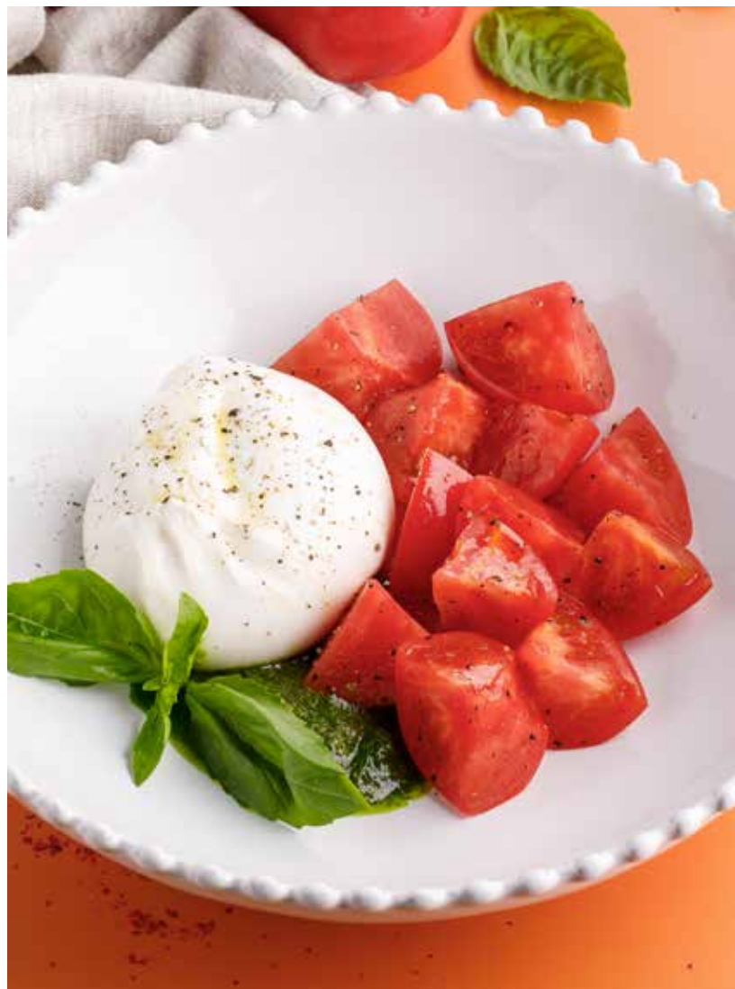
БУРРАТА С ТОМАТАМИ И СОУСОМ ПЕСТО 990₽ Burrata with tomatoes and pesto sauce