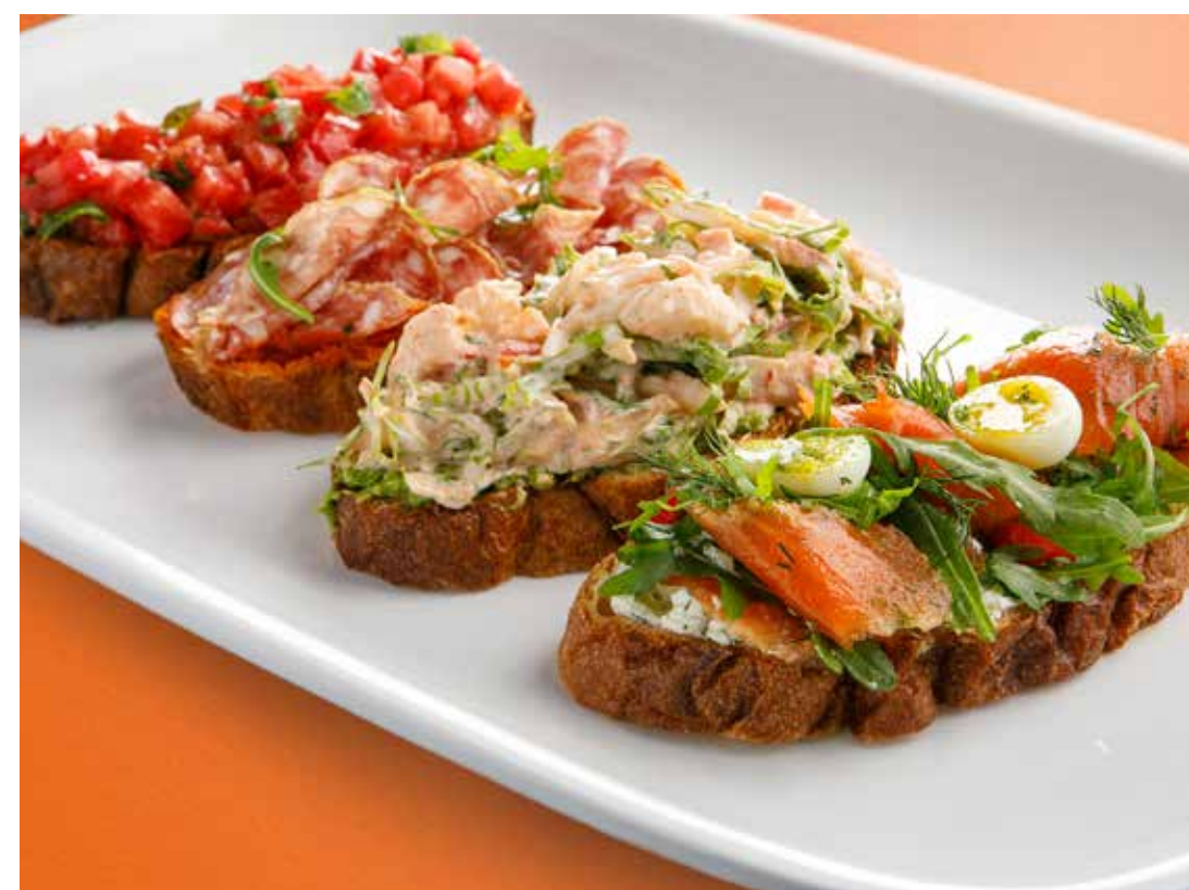
АССОРТИ ИЗ БРУСКЕТТ 2590₽ Bruschetta platter