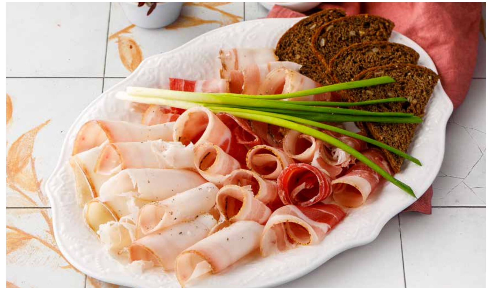
АССОРТИ ИЗ САЛА С ЧЕСНОКОМ