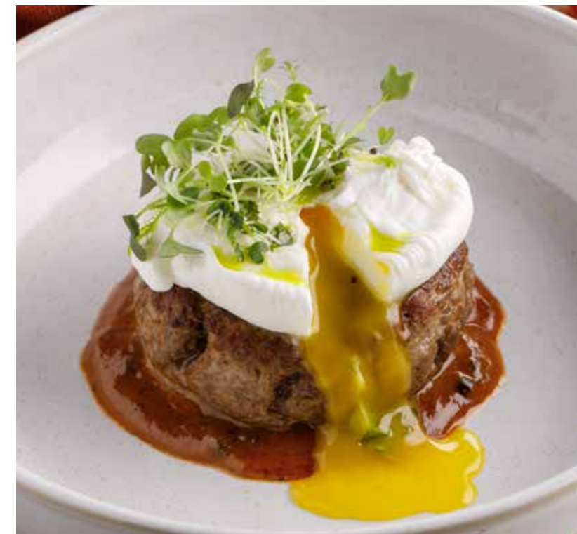
БИФСТЕКС 1190 Р