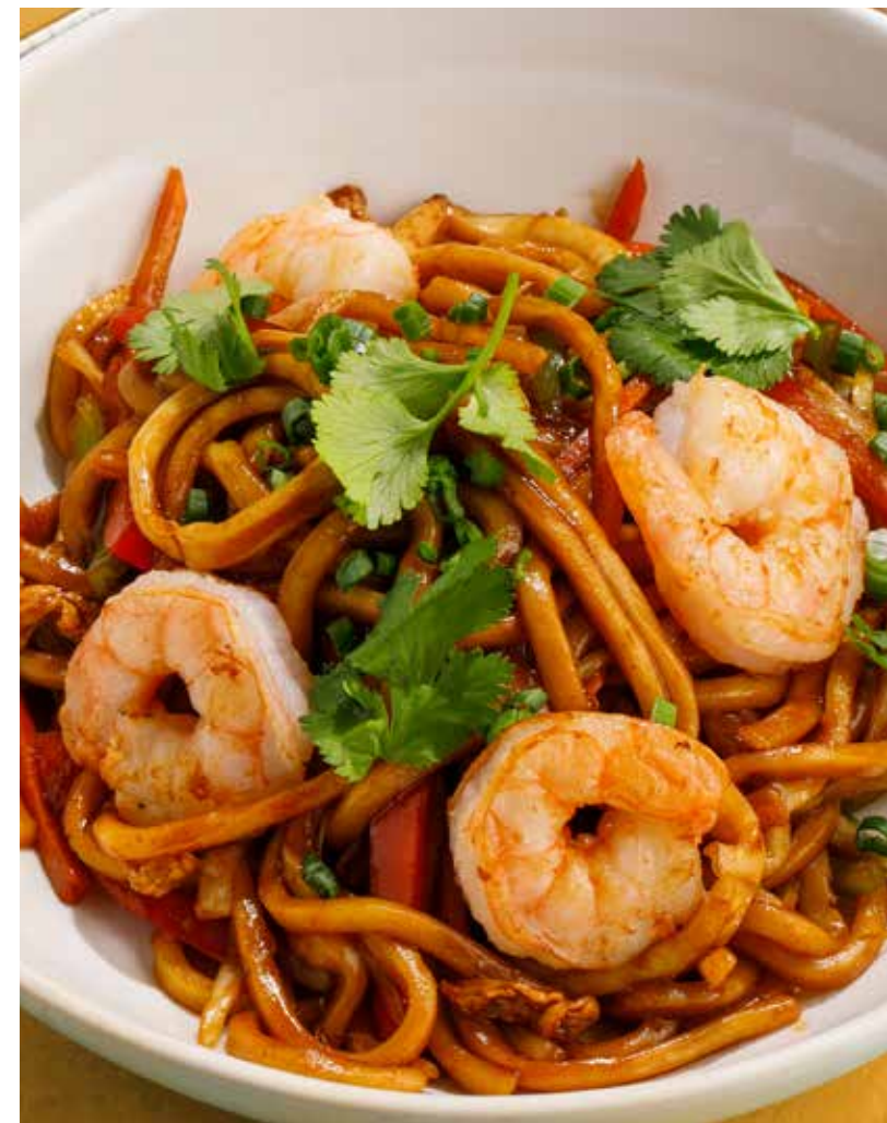
УДОН С МОРЕПРОДУКТАМИ

Chicken skewers with unagi teriyaki sauce