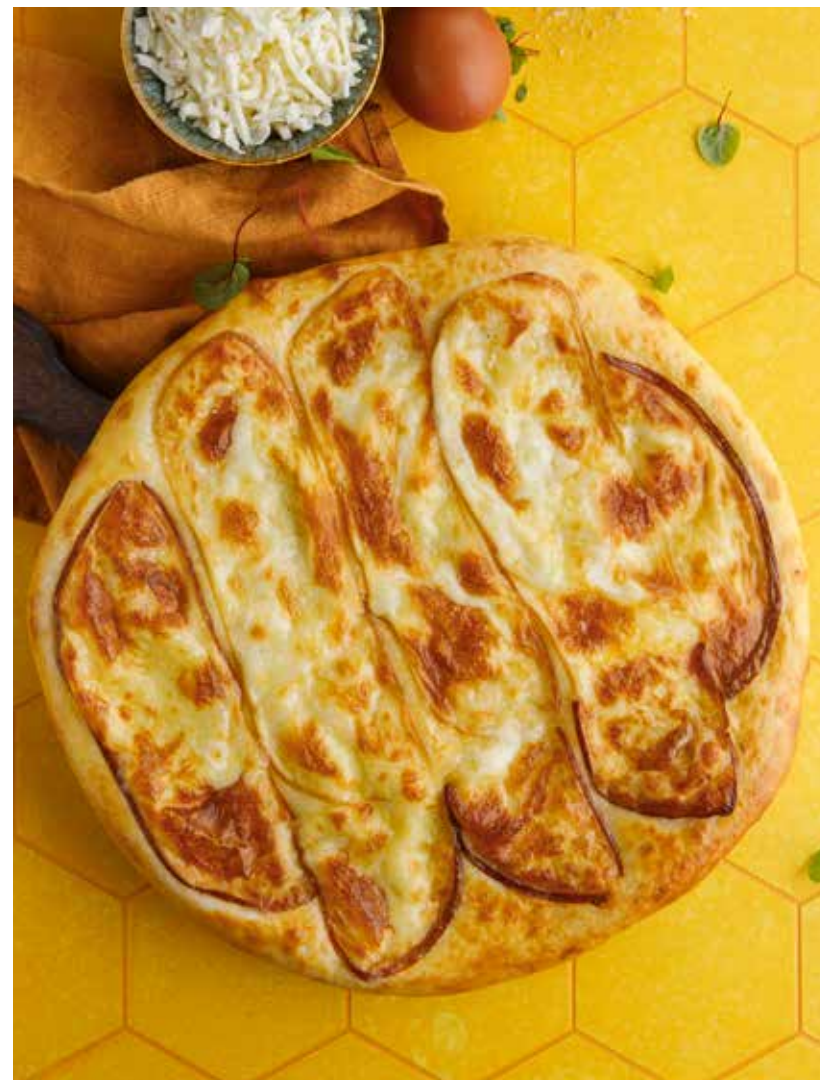
ХАЧАПУРИ С КОПЧЕНЫМ СЫРОМ СУЛУГУНИ 690 Р