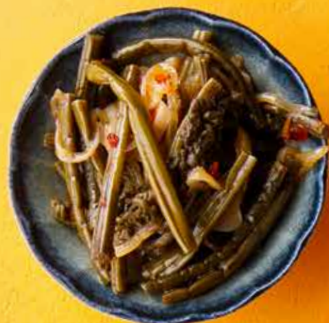
ПАПОРОТНИК 290 ₽ Fern