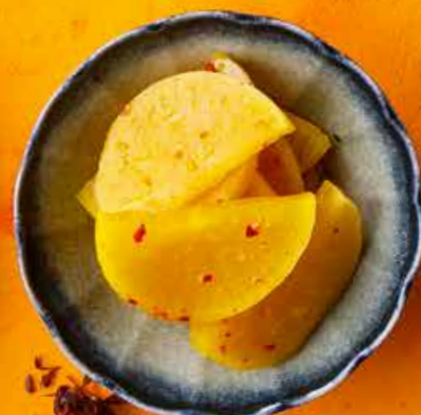
АНАНАС 490 ₽ Pineapple