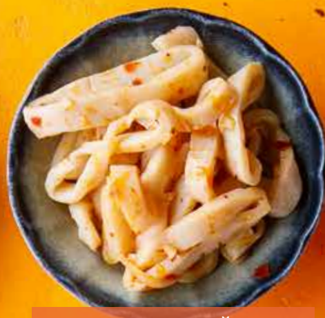
МАРИНОВАННЫЙ КАЛЬМАР 790 ₽ Pickled squid