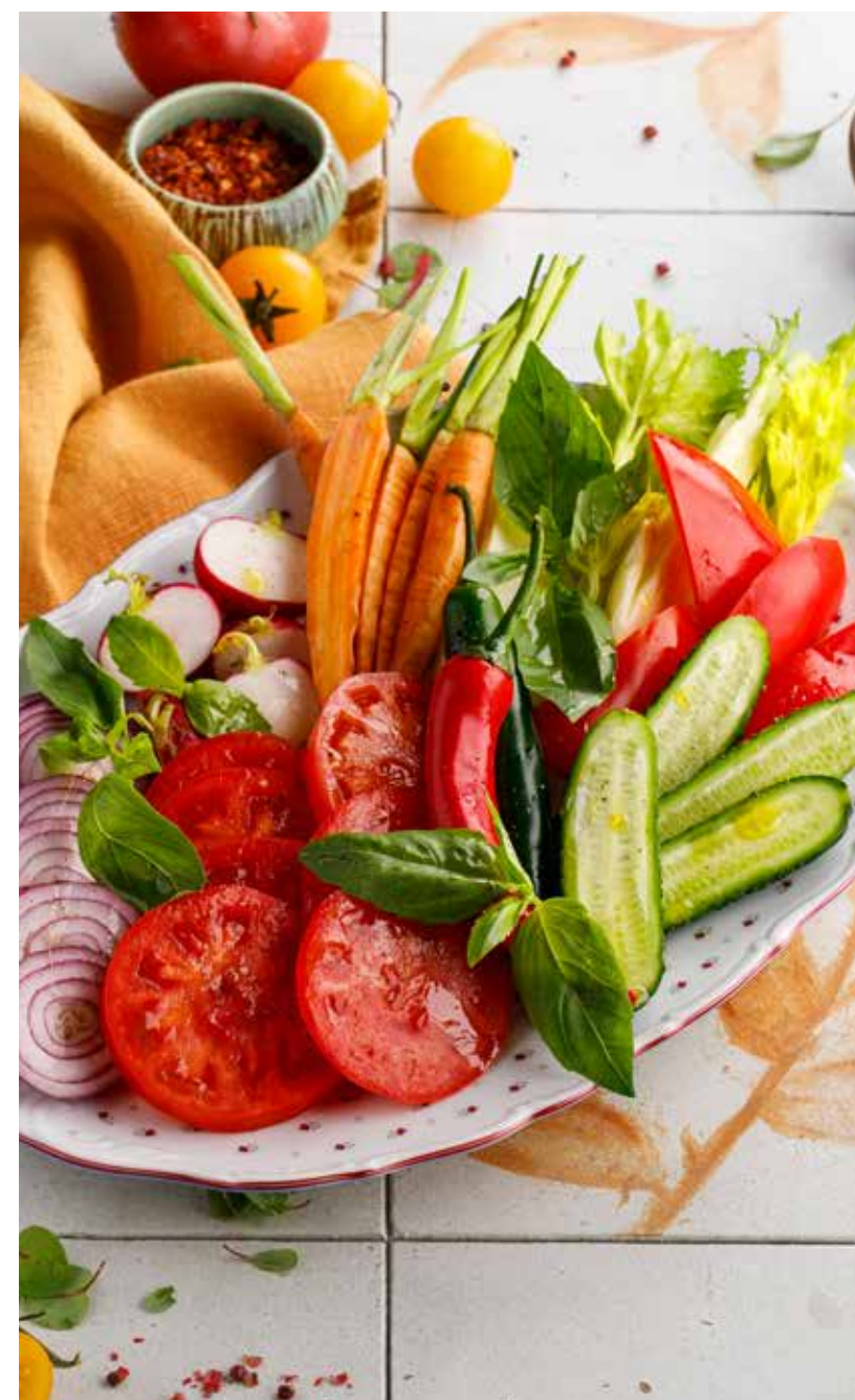
СЕЗОННЫЕ ОВОЩИ И ЗЕЛЕНЬ 1290 Р