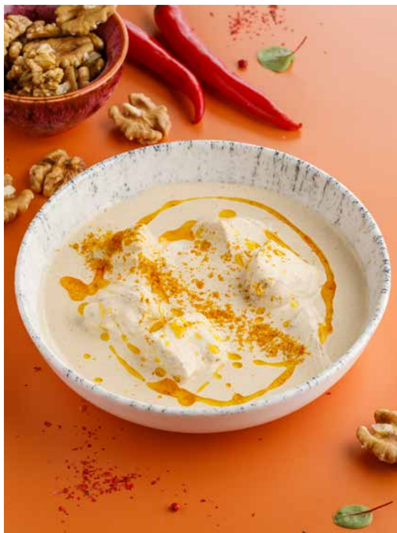
САЦИВИ 550₽ Satsivi