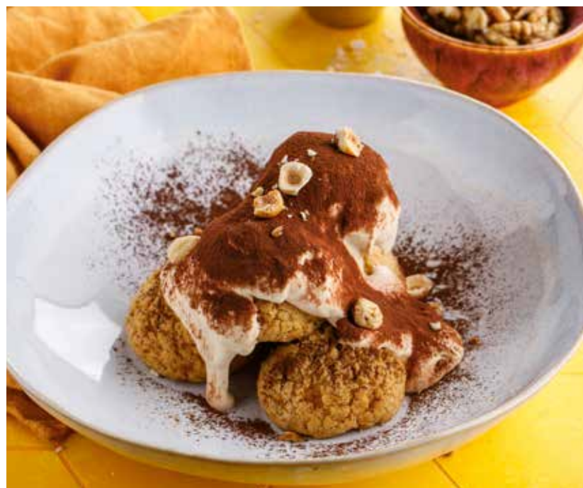
БУЛОЧКИ С КРЕМОМ ИЗ МАСКАРПОНЕ