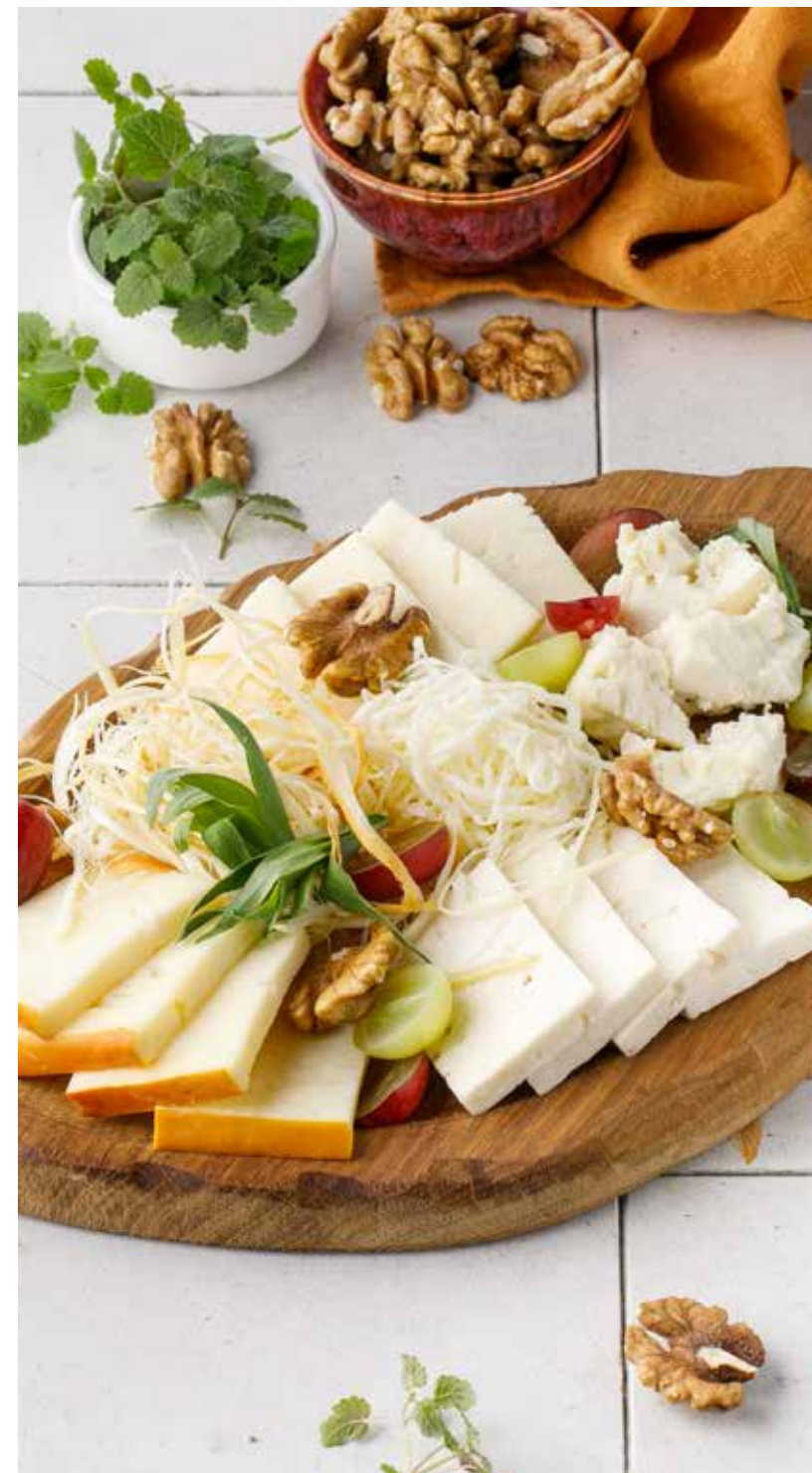
АССОРТИ ИЗ ДОМАШНИХ СЫРОВ 950₽ Assorted homemade cheese