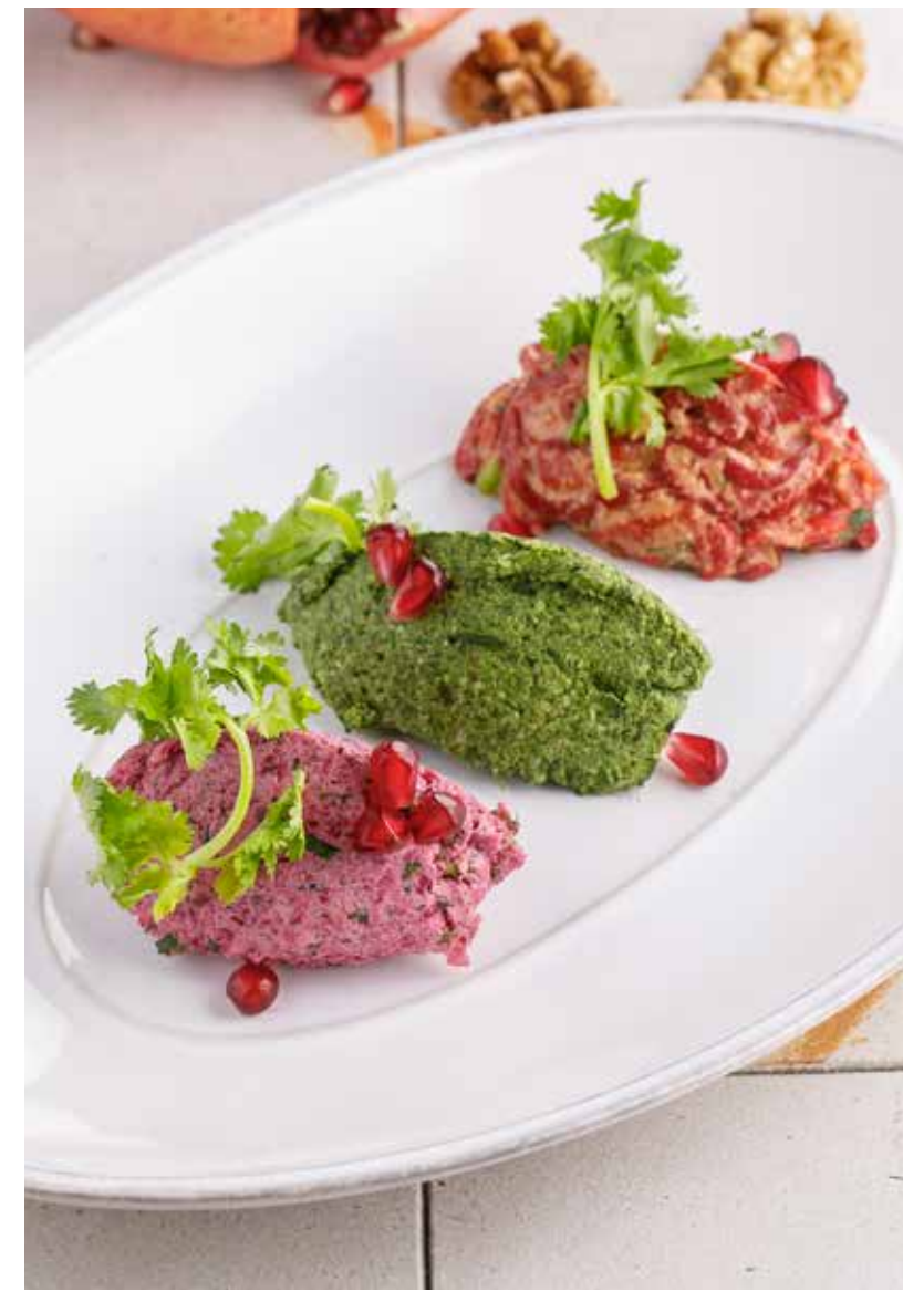
АССОРТИ ПХАЛИ ИЗ ШПИНАТА / ИЗ ЗАПЕЧЕННОГО ПЕРЦА / ИЗ СВЕКЛЫ