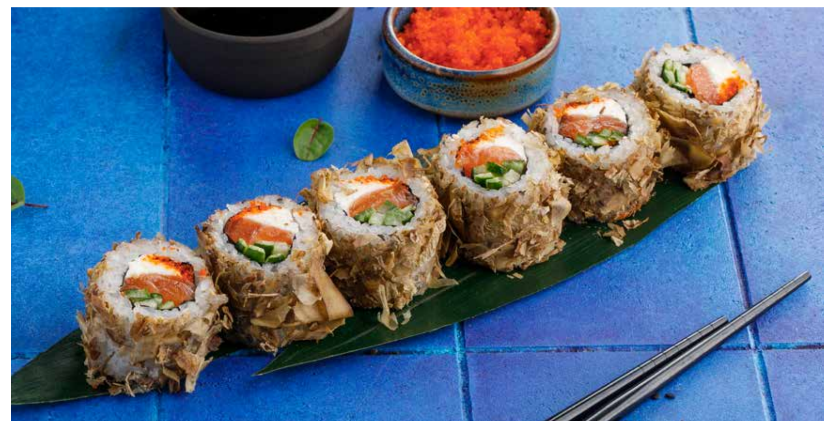
РОЛЛЫ БОНИТО С ТУНЦОМ / ЛОСОСЕМ / УГРЕМ