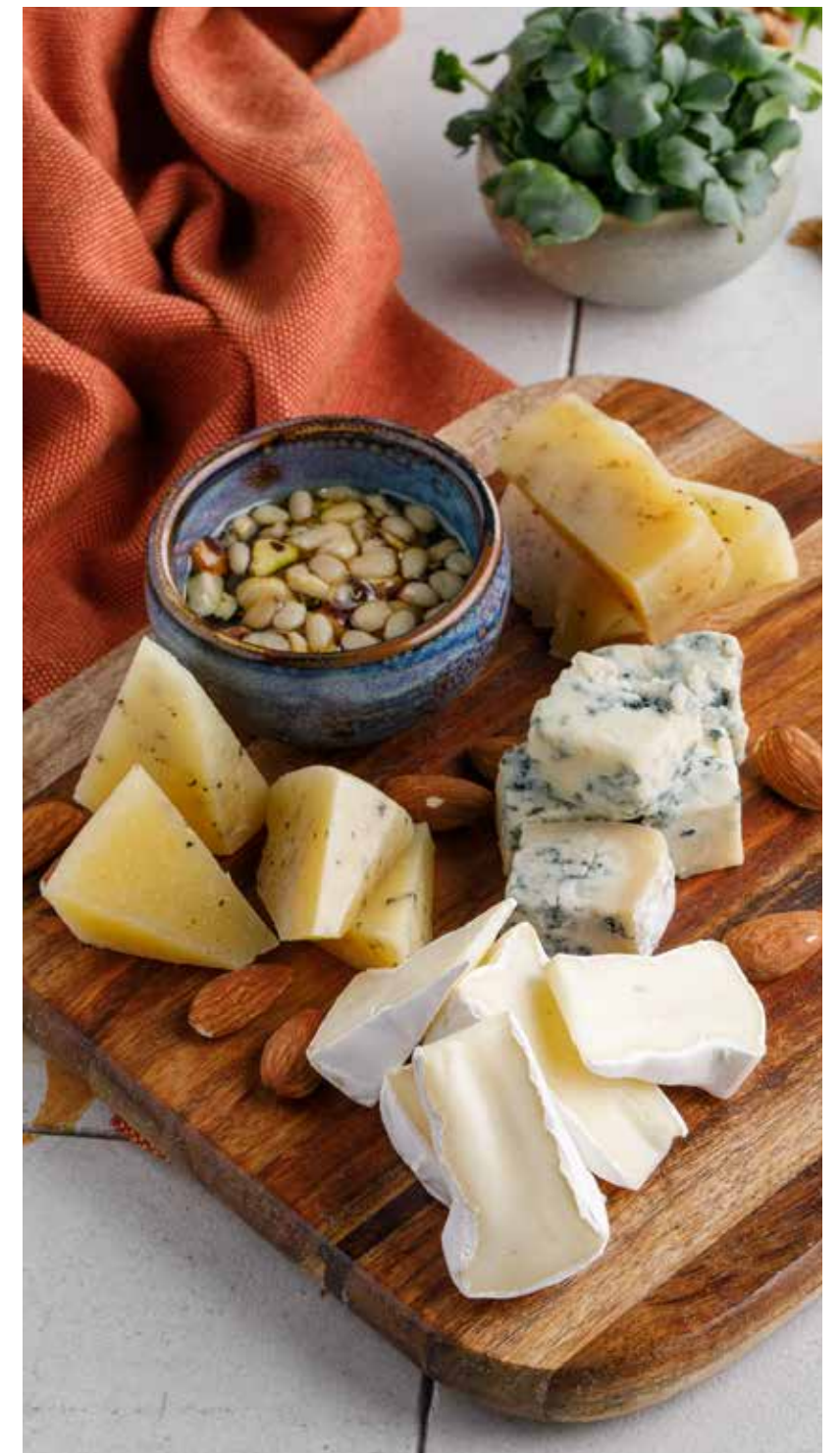
АССОРТИ ИЗ ЕВРОПЕЙСКИХ СЫРОВ 1590₽ Assorted European cheese