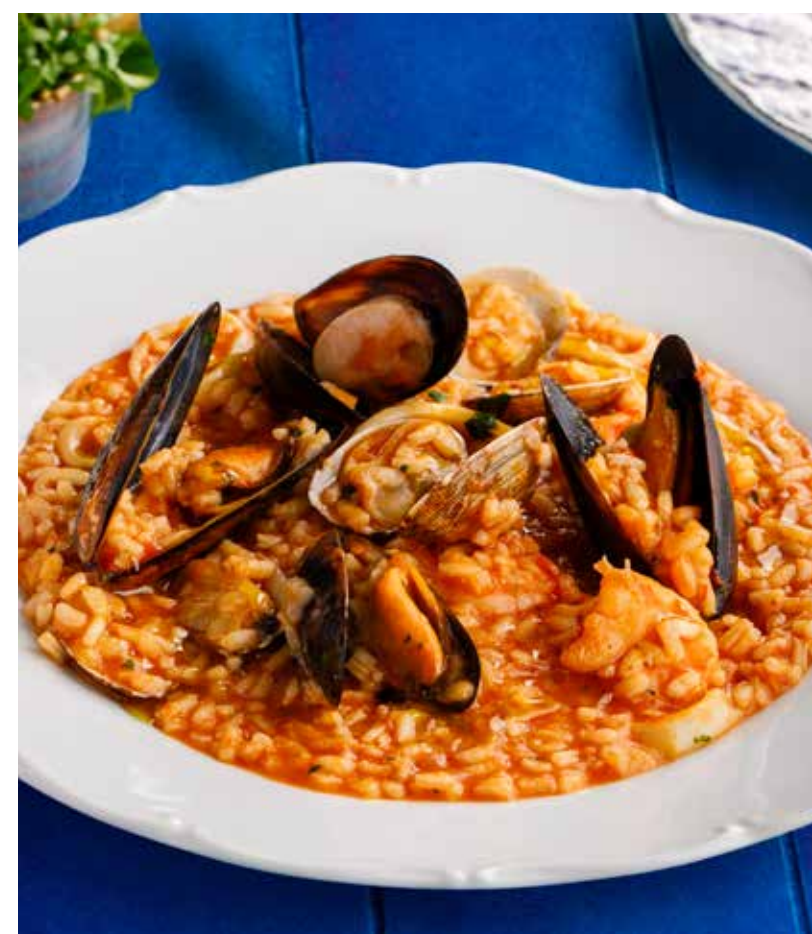
РИЗОТТО С МОРЕПРОДУКТАМИ