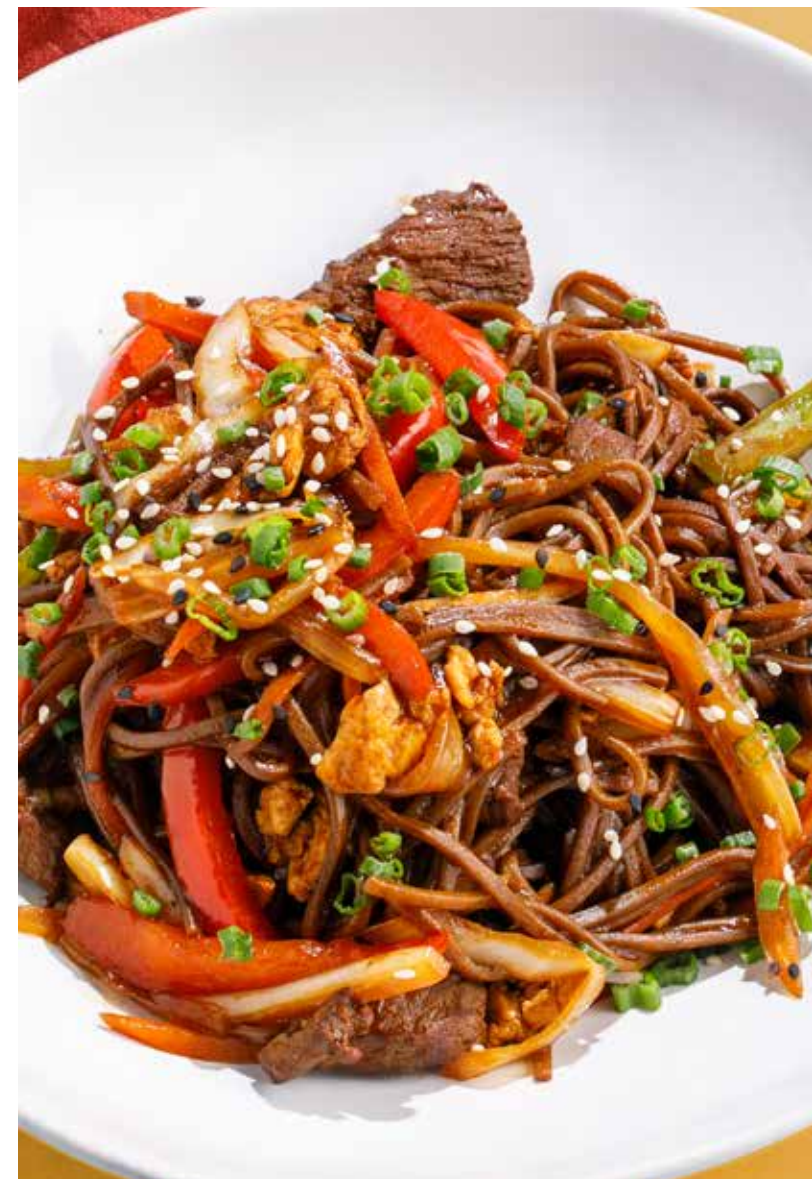
ГРЕЧНЕВАЯ ЛАПША С ГОВЯДИНОЙ