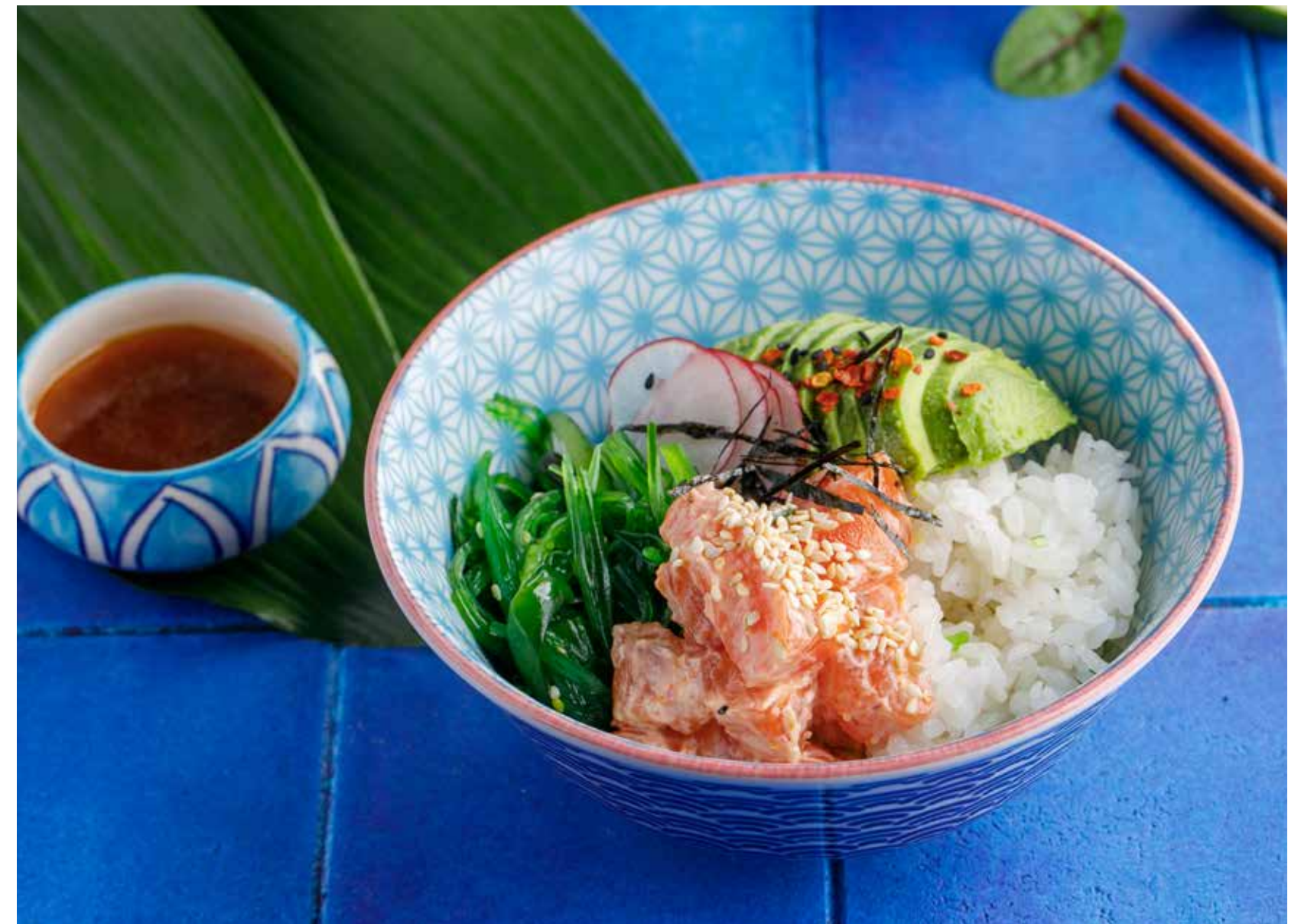
ПОКЕ С ТУНЦОМ / С ЛОСОСЕМ 750/790 ₺ Poke with tuna / with salmon