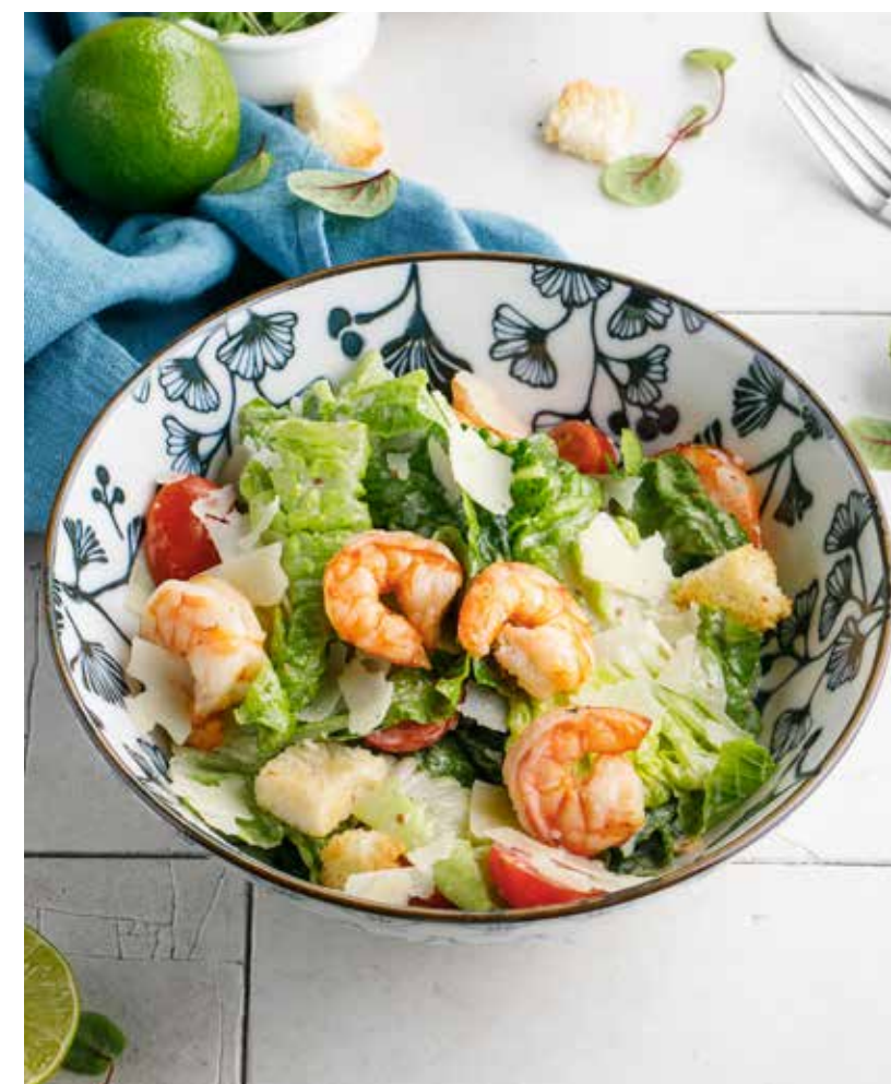
САЛАТ «ЦЕЗАРЬ» С КУРИЦЕЙ / С КРЕВЕТКАМИ 690/790 Р

Warm salad with chicken and smoked suluguni cheese