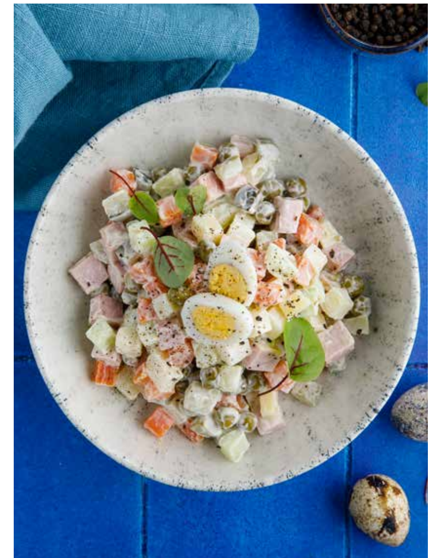
ОЛИВЬЕ С КОЛБАСОЙ / С КОПЧЕНЫМ ЛОСОСЕМ И ЩУЧЬЕЙ ИКРОЙ 550/750 Р

Olivier Russian salad with sausage / with smoked salmon and pike caviar