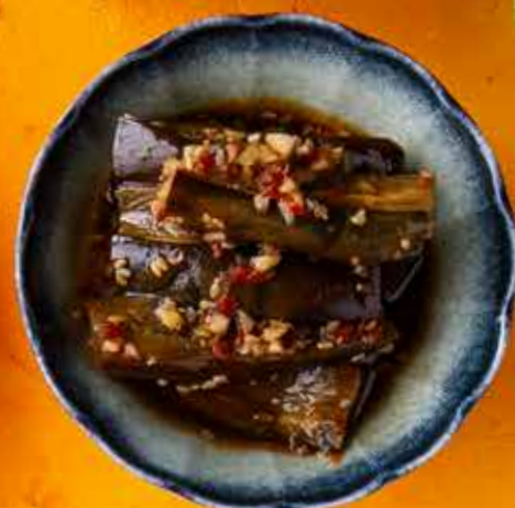
ЖАРЕНЫЙ БАКЛАЖАН 390 ₽ Fried eggplant