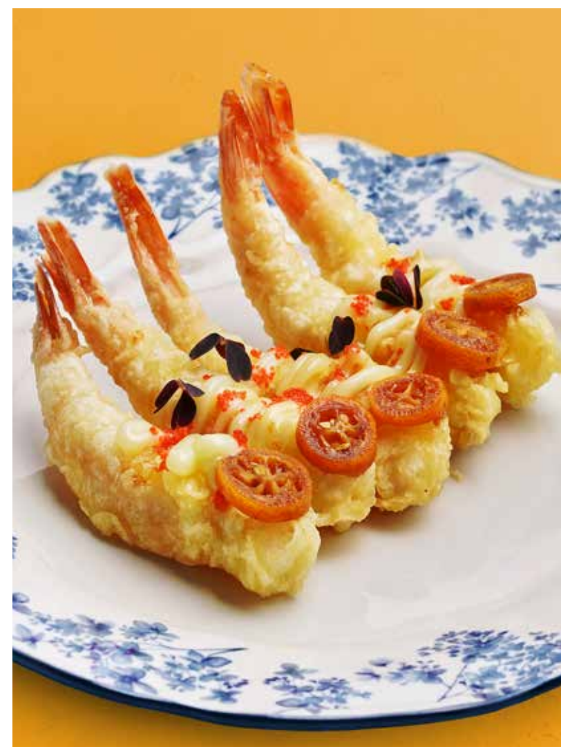
КРЕВЕТКИ ТЕМПУРА С КУМКВАТОМ 790 ₺