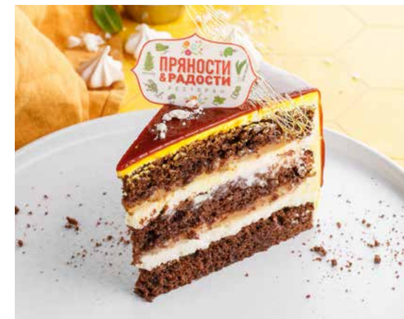
ТОРТ «ПРЯНОСТИ И РАДОСТИ»