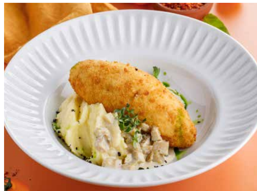
ХРУСТЯЩАЯ КУРИНАЯ КОТЛЕТКА С ГРИБНЫМ СОУСОМ 790 Р

Petrovna's homemade patties with mashed potatoes