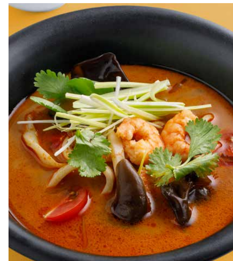
ТОМ ЯМ ПОТАК 750 ₽ Tom Yum Po Taek

ПРОСЬБА ПРЕДУПРЕЖДАТЬ ВАШЕГО ОФИЦИАНТА ОБ ИМЕЮЩЕЙСЯ У ВАС АЛЛЕРГИИ НА ОПРЕДЕЛЕННЫЕ ПРОДУКТЫ ПИТАНИЯ. ВСЕ ЦЕНЫ УКАЗАНЫ В РУБЛЯХ. НА ФОТО ИСПОЛЬЗОВАНЫ ЭЛЕМЕНТЫ ДЕКОРА. PLEASE, TELL YOUR WAITER IF YOU HAVE ANY FOOD ALLERGY TO CERTAIN PRODUCTS. ALL PRICES ARE IN RUBLES. THE PICTURES HAVE DECORATIVE ELEMENTS.