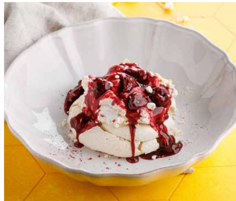
ДЕСЕРТ «АННА ПАВЛОВА»