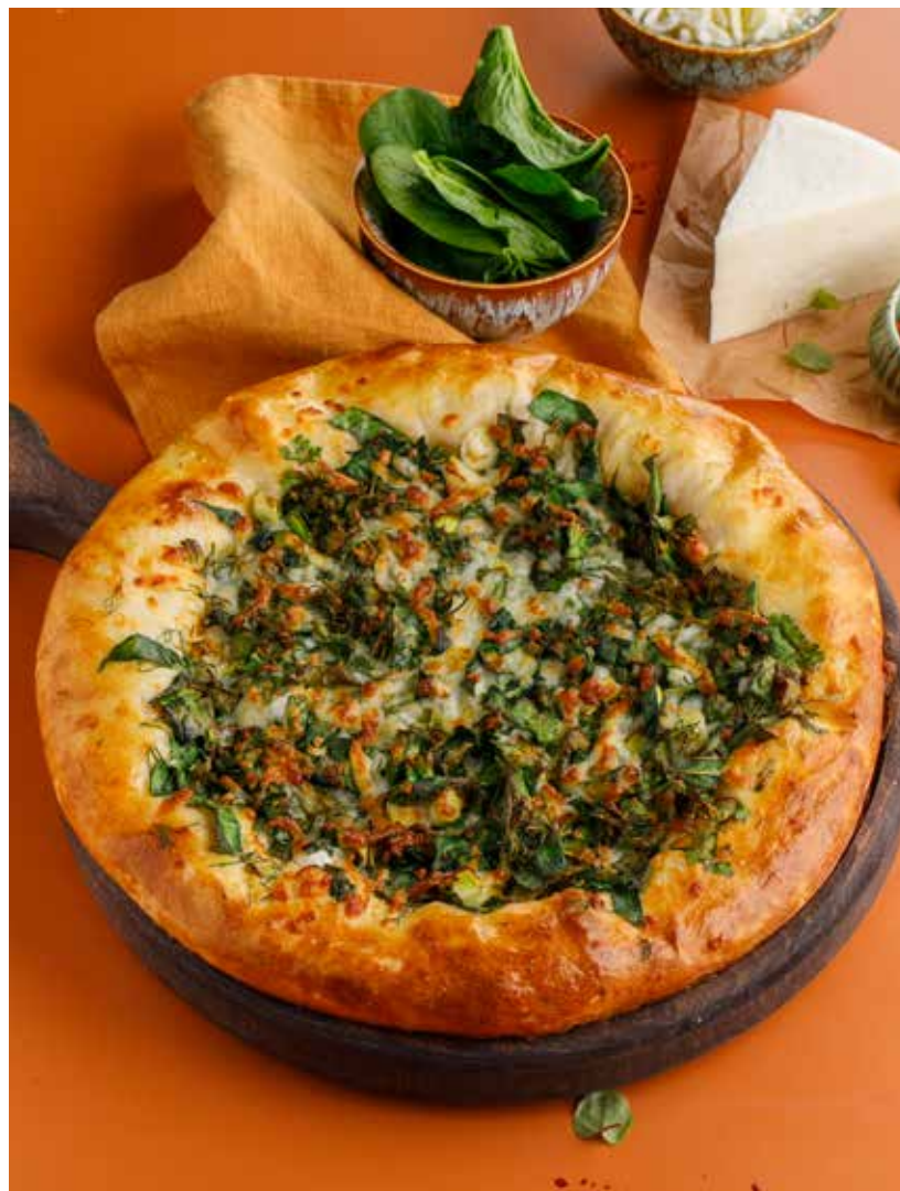
ЛАЗУРАТ 750 Р