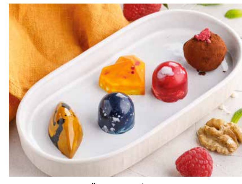
КОНФЕТЫ РУЧНОЙ РАБОТЫ (1 шт.) в ассортименте