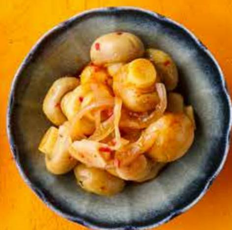
ШАМПИНЬОНЫ 290 ₽ Champignons