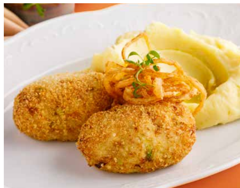
КОТЛЕТЫ ИЗ БАЛТИЙСКОЙ РЫБЫ 1090 Р

Pike perch with quinoa and cucumber tartare