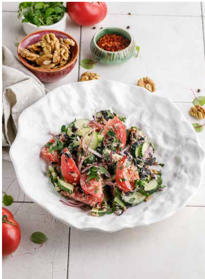
ОВОЩНОЙ САЛАТ ПО-ГРУЗИНСКИ СО СПЕЦИЯМИ / С ОРЕХАМИ 550/590 Р

Olivier Russian salad with sausage / with smoked salmon and pike caviar