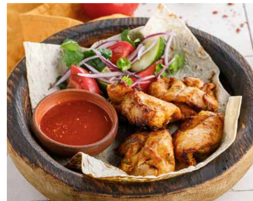
ШАШЛЫК ИЗ КУРИНОГО БЕДРА