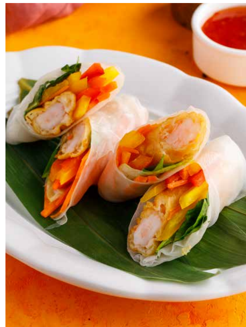
ФРЕШ-РОЛЛ С КРЕВЕТКОЙ / С ОВОЩАМИ И АРАХИСОВЫМ СОУСОМ 690/490 ₺

Fresh roll with shrimp / with vegetables and peanut sauce