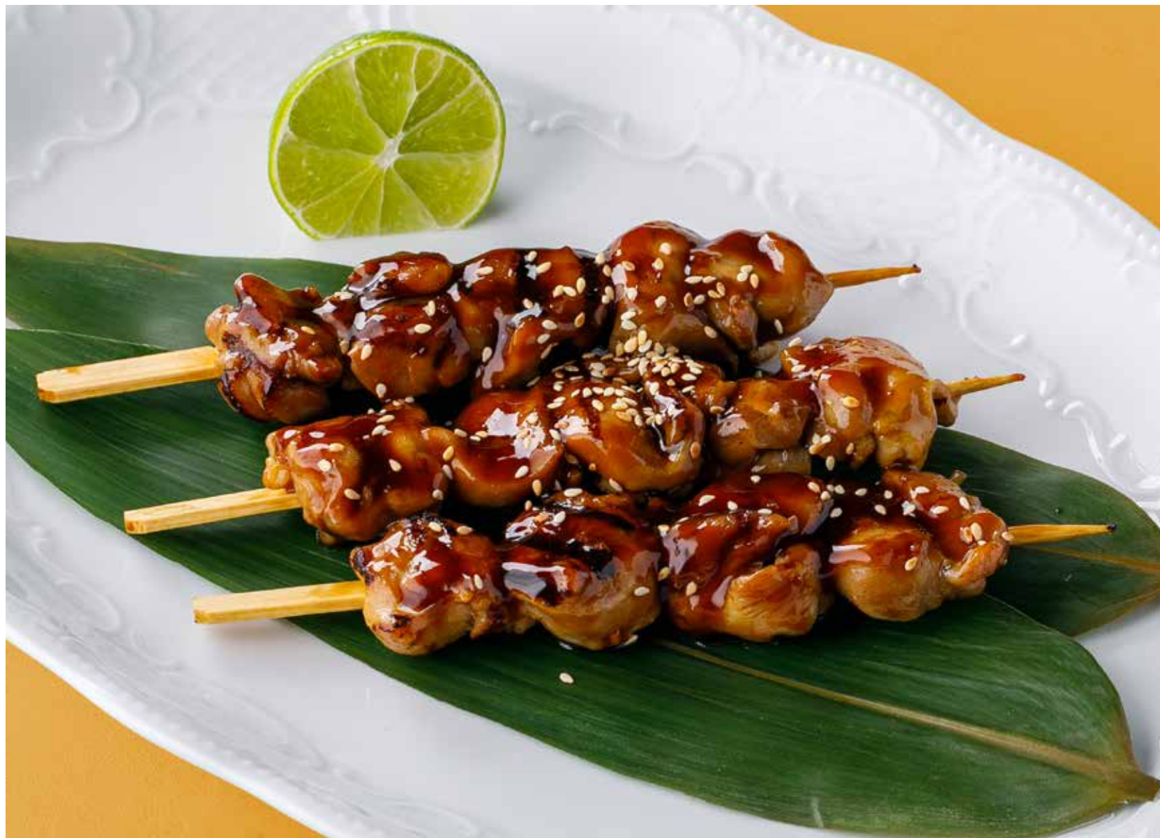
КУРИНЫЕ ШАШЛЫЧКИ В СОУСЕ УНАГИ-ТЕРИЯКИ