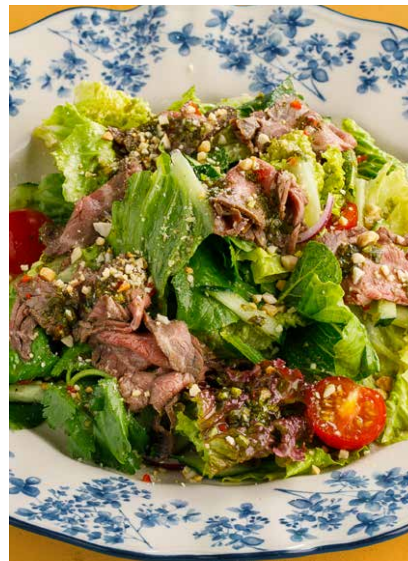
ТАЙСКИЙ САЛАТ С ГОВЯДИНОЙ 750 ₽ Beef Thai salad