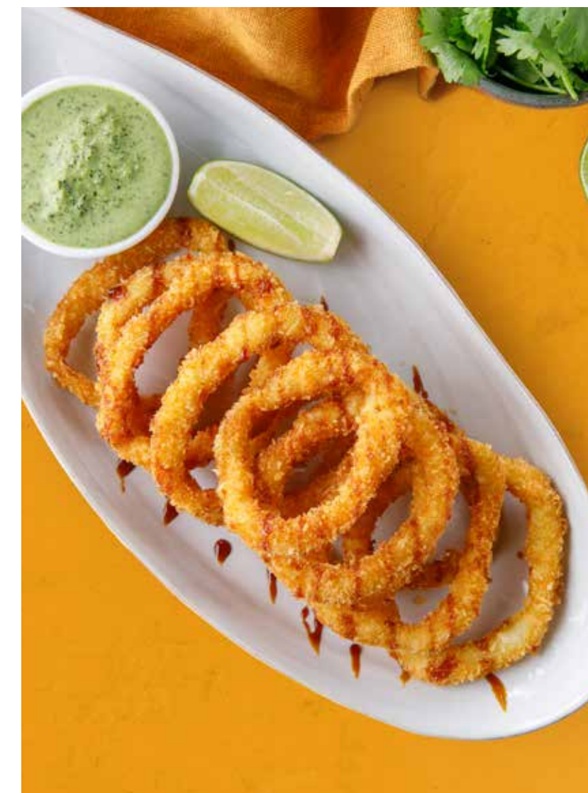
КОЛЬЦА КАЛЬМАРА В ПАНКО

Fresh roll with shrimp / with vegetables and peanut sauce