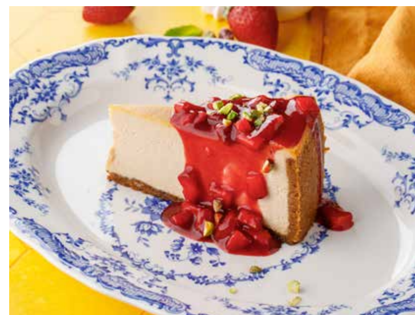
ЧИЗКЕЙК ИЗ ТОПЛЕННЫХ СЛИВОК