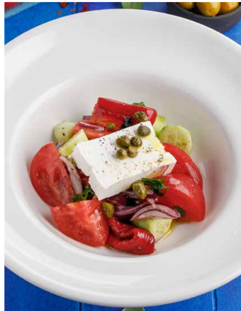
ГРЕЧЕСКИЙ САЛАТ 650 Р

Green salad with avocado and lemongrass sauce