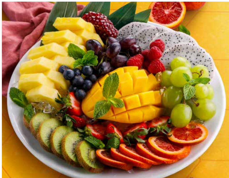
АССОРТИ ИЗ СЕЗОННЫХ ФРУКТОВ