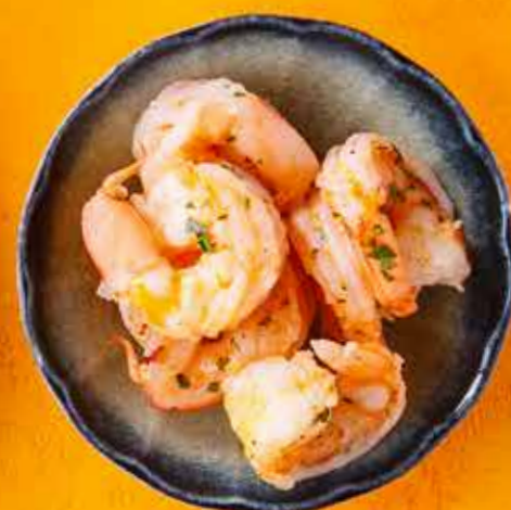
КРЕВЕТКИ 990 ₽ Shrimp