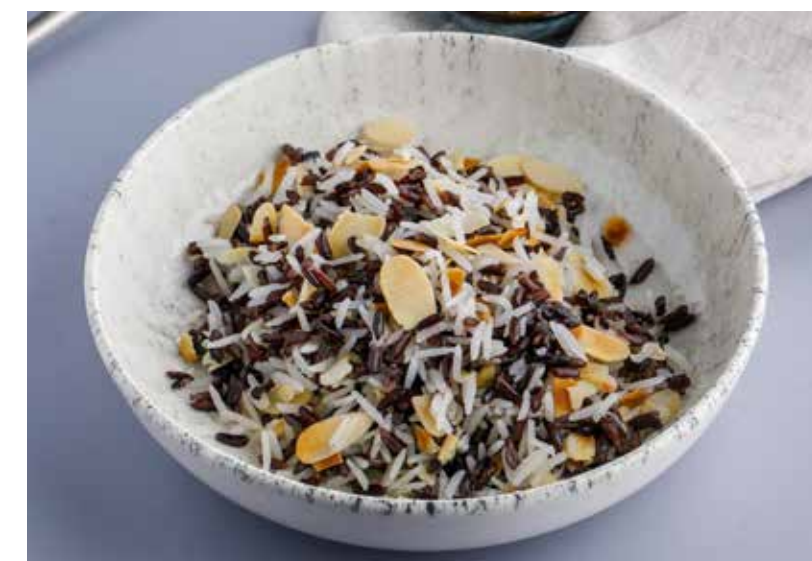
РИС С МИНДАЛЕМ

French fries with truffle oil and Parmesan cheese