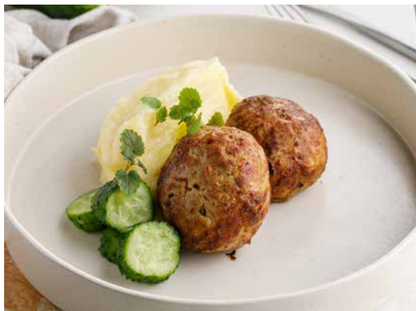
КОТЛЕТЫ ПО-ДОМАШНЕМУ ОТ ПЕТРОВНЫ С КАРТОФЕЛЬНЫМ ПЮРЕ 750 Р

Petrovna's homemade patties with mashed potatoes