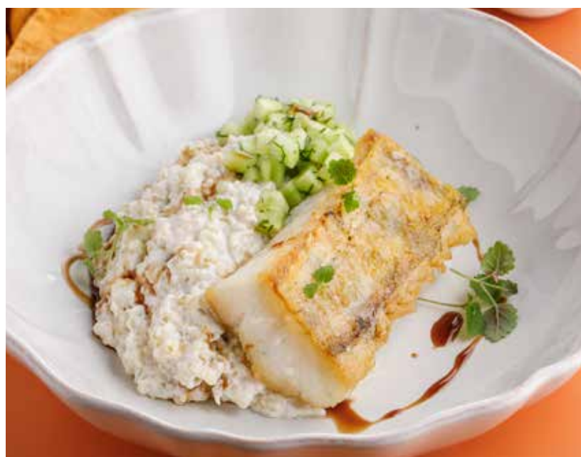
СУДАК С КИНОА И ТАРТАРОМ ИЗ ОГУРЦОВ 1190 Р

Pike perch with quinoa and cucumber tartare