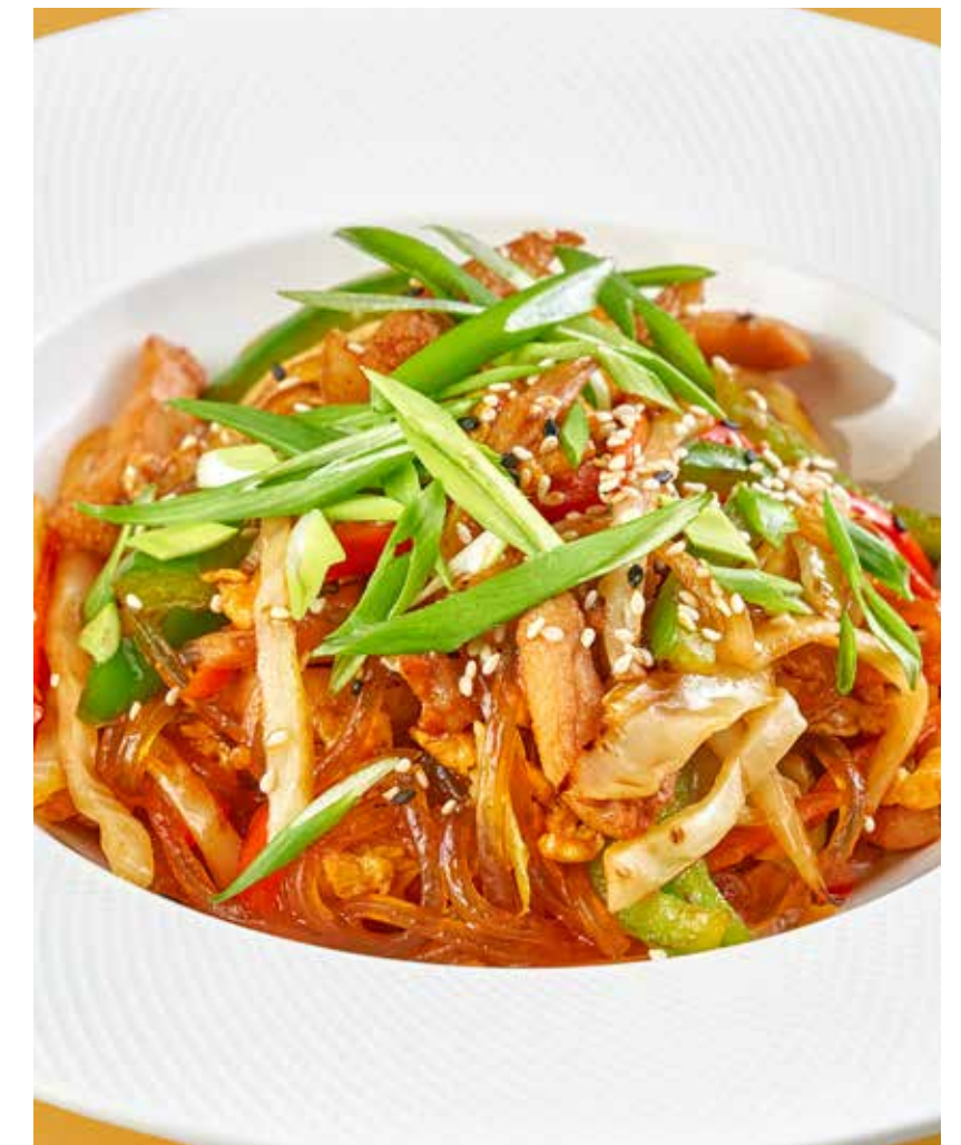
СТЕКЛЯННАЯ ЛАПША С ЦЫПЛЕНКОМ