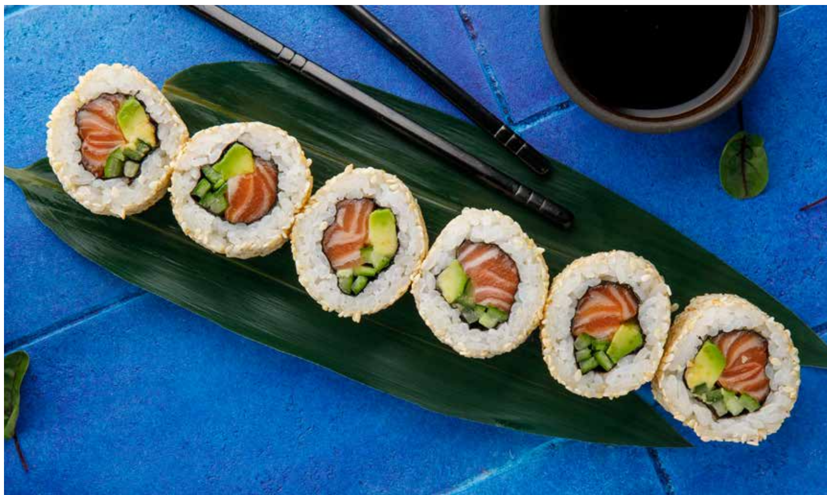
«АЛЯСКА» 590 ₺ Alaska