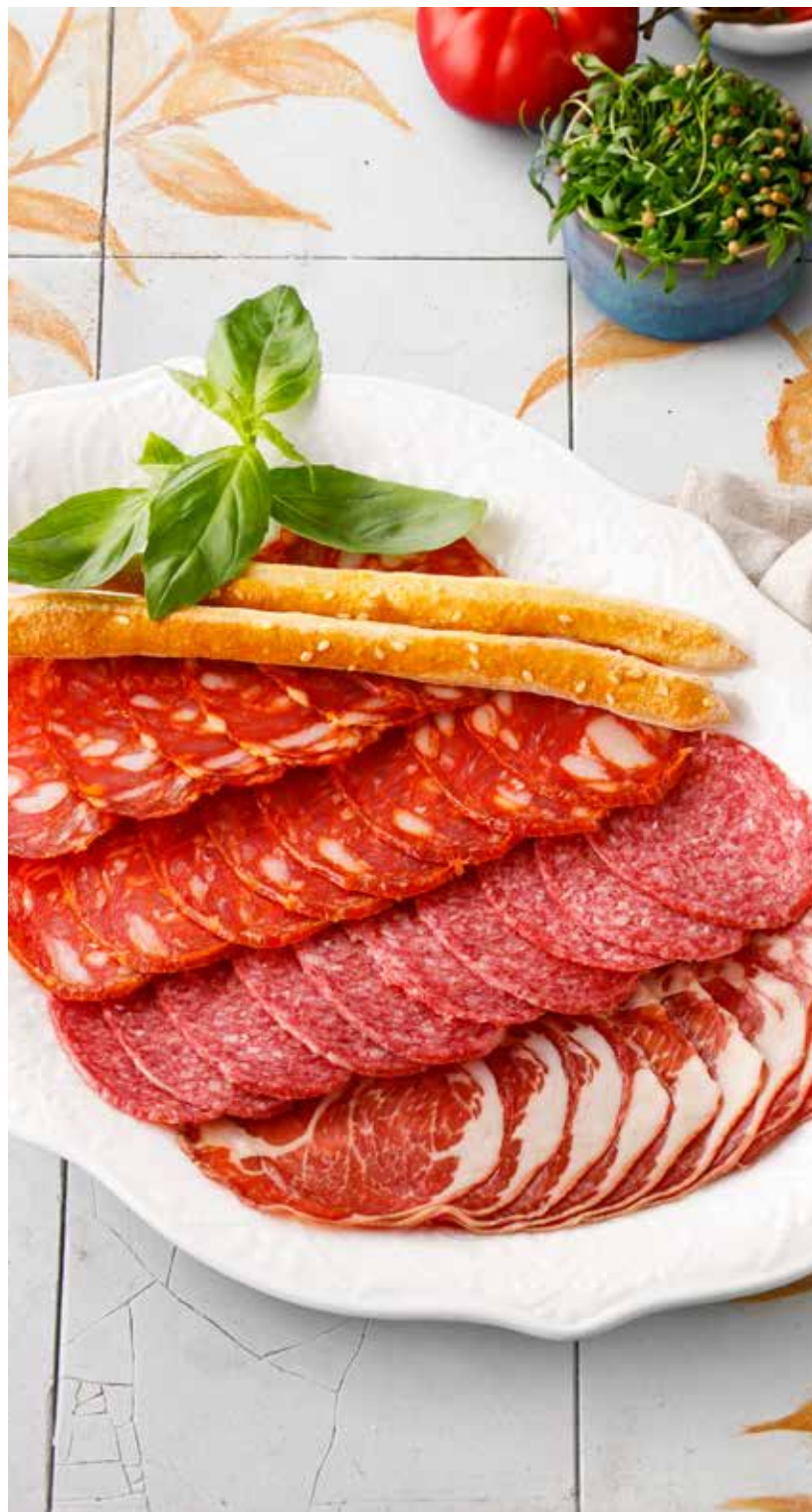
ИТАЛЬЯНСКОЕ МЯСНОЕ АССОРТИ 1550 Р салями наполи, салями чоризо, шейка коппа

Assorted Italian deli meats (salame Napoli, salami chorizo, dried pork neck)