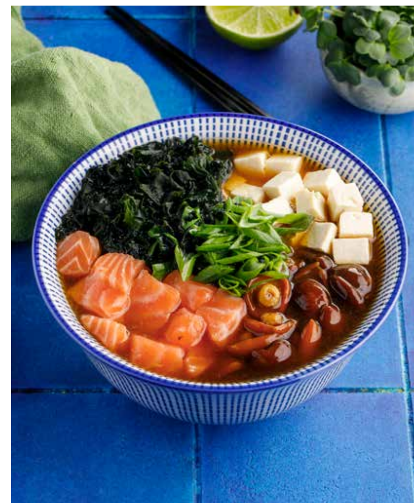
МИСО-СУП / МИСО-СУП С ЛОСОСЕМ 350/590 ₺ Miso soup / miso soup with salmon