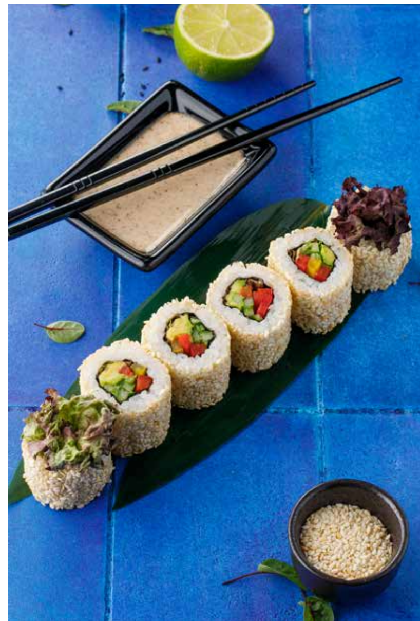
ВЕГЕТАРИАНСКИЙ РОЛЛ 450 ₺ Veggie roll