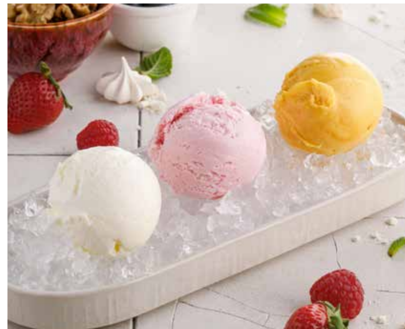
МОРОЖЕНОЕ / СОРБЕТ в ассортименте (1 шарик)