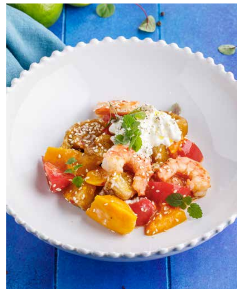
САЛАТ С ХРУСТЯЩИМИ БАКЛАЖАНАМИ, КРЕВЕТКАМИ И СТРАЧАТЕЛЛОЙ 950 ₺

Salad with crispy eggplant, shrimp and stracciatella