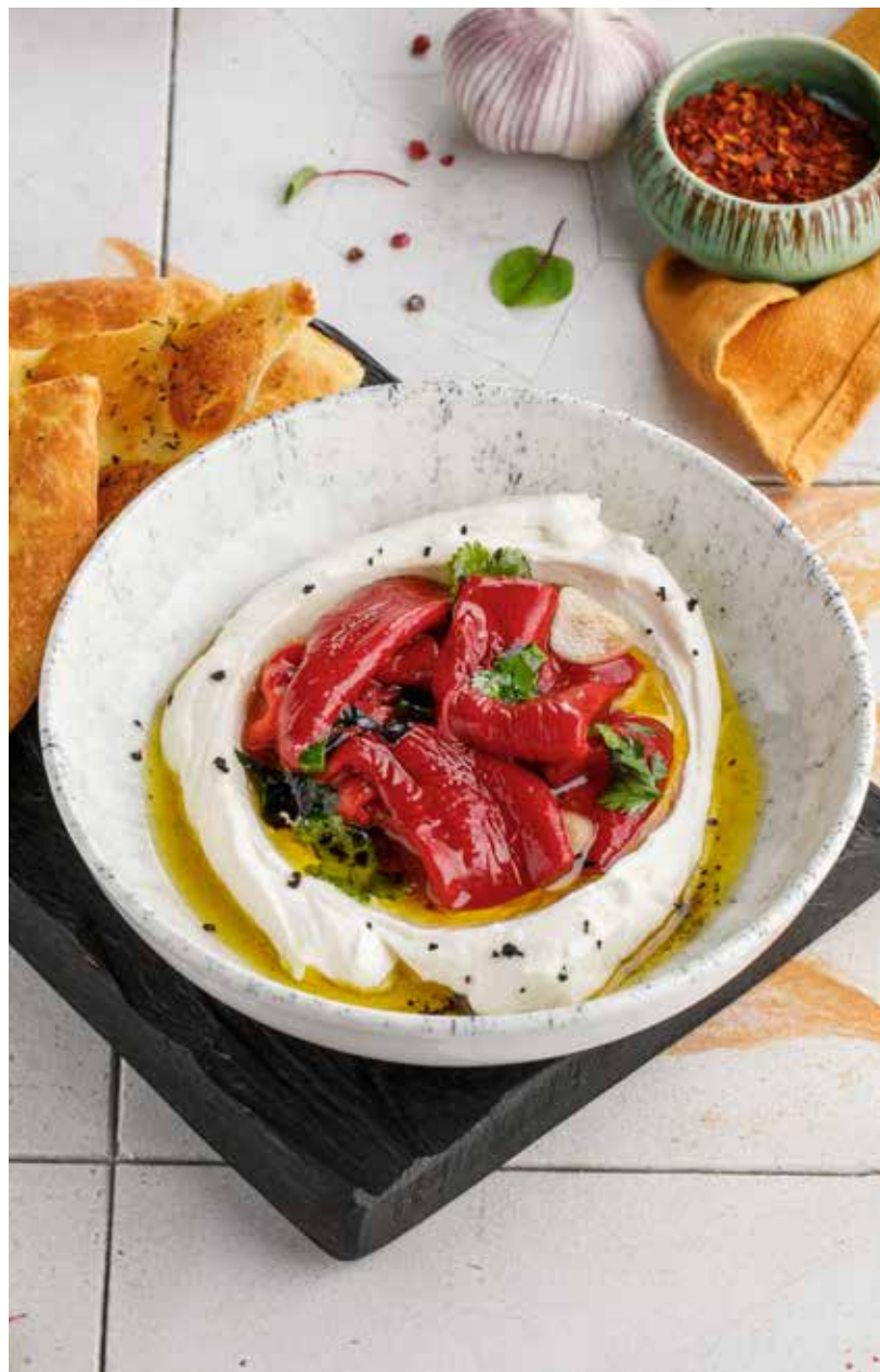
ПЕЧЕННЫЕ ПЕРЦЫ РАМИРО С КРЕМОМ ИЗ СЫРА ГУДА

Smorrebrod with Baltic sprat / with salmon