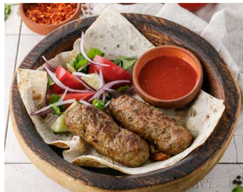
ЛЮЛЯ-КЕБАБ ИЗ КУРИЦЫ / ИЗ БАРАНИНЫ