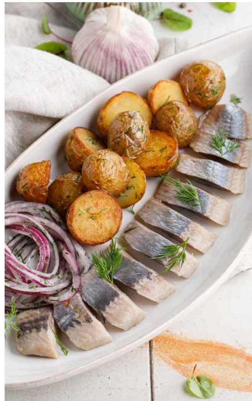
СЕЛЬДЬ С КАРТОФЕЛЕМ

Roasted ramiro peppers with cream of guda cheese