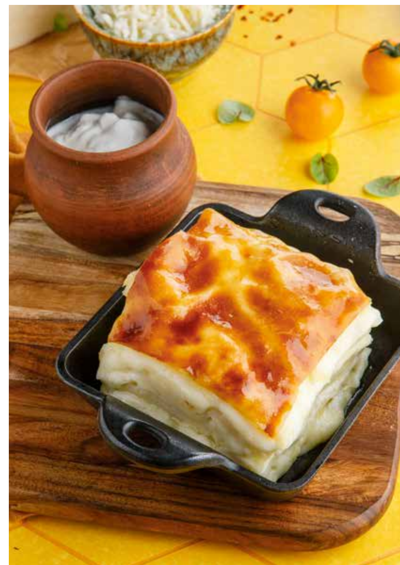
АЧМА С МАЦОНИ 590 Р