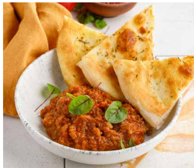
ИКРА ИЗ БАКЛАЖАНОВ 550 Р