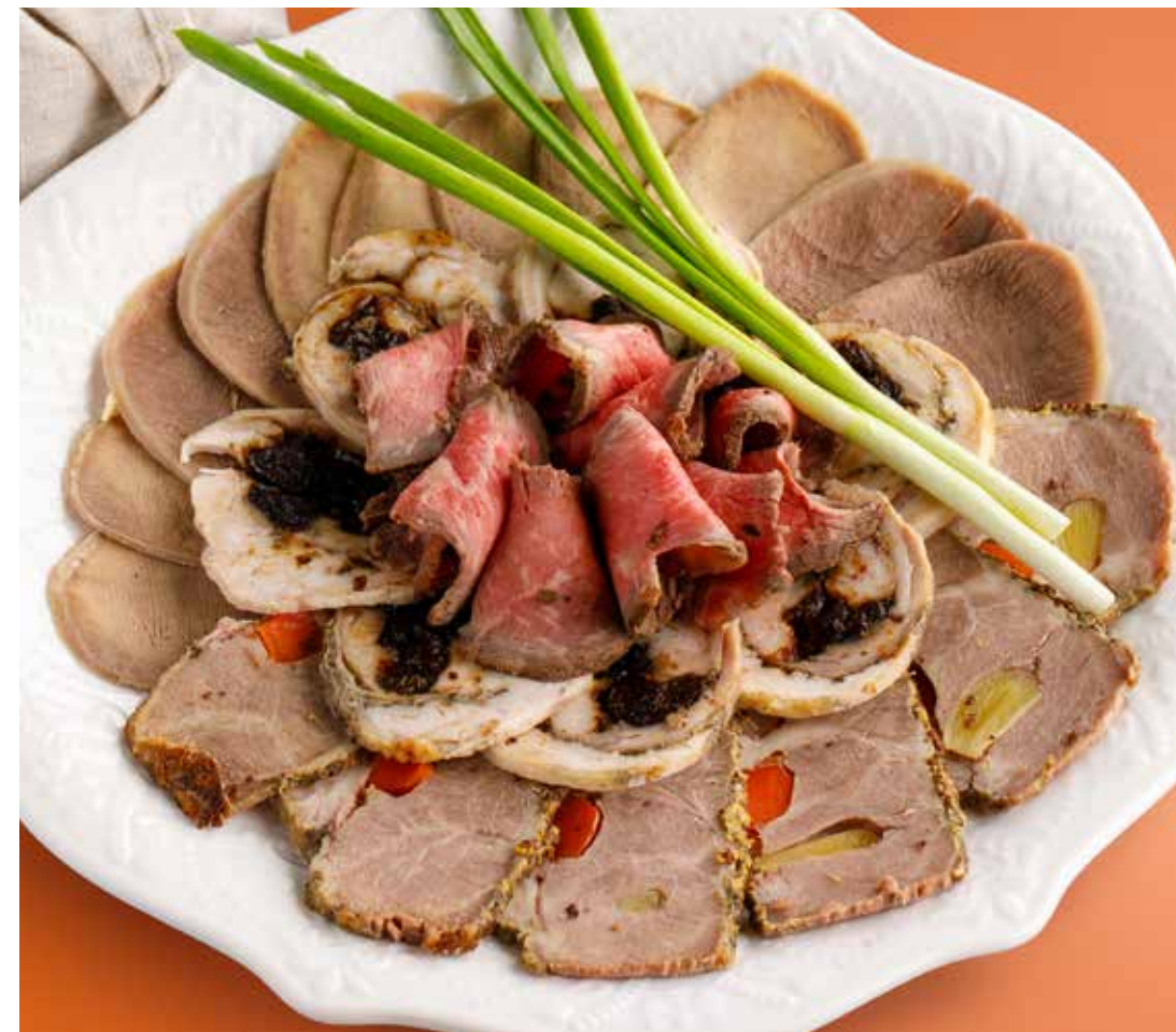
МЯСНОЕ АССОРТИ 2190 Р