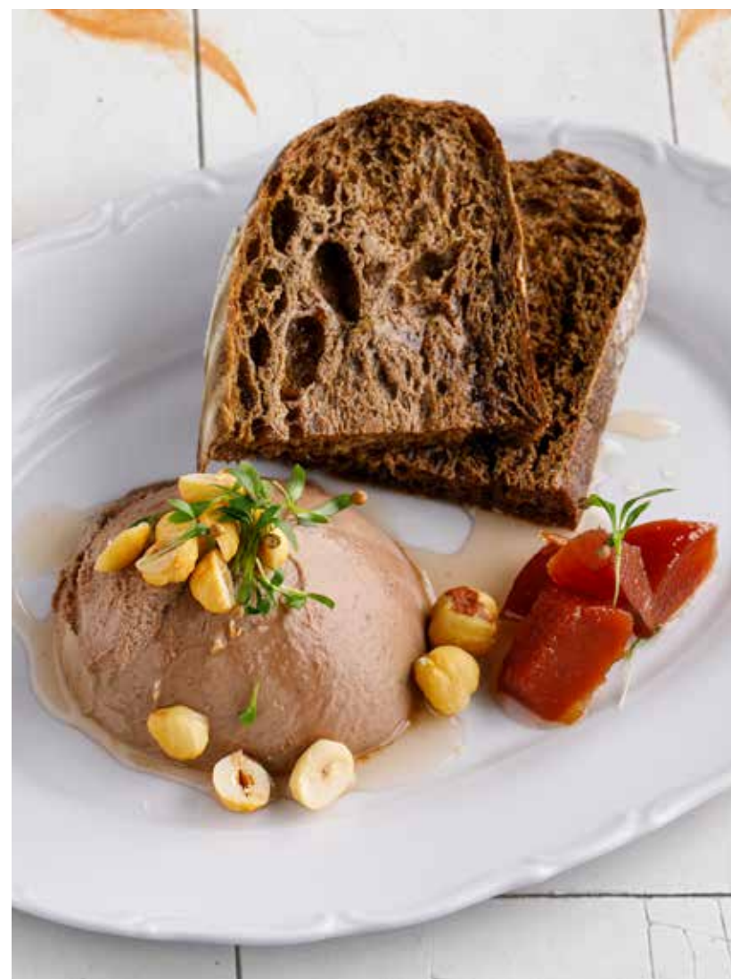
ПАШТЕТ ИЗ КУРИНОЙ ПЕЧЕНИ 650₽ Chicken liver pate