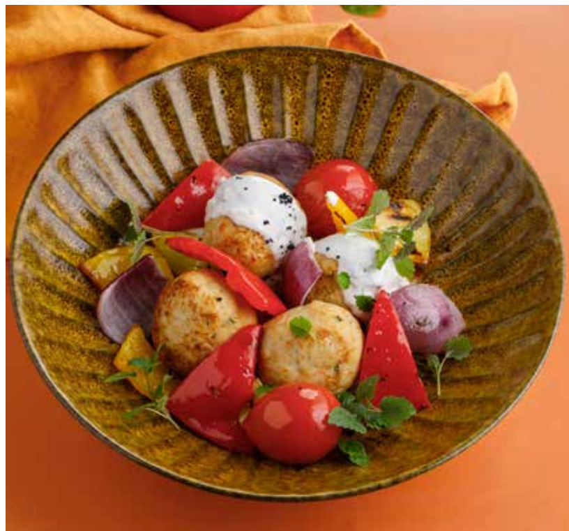
КОТЛЕТЫ ИЗ ИНДЕЙКИ С ОВОЩАМИ ГРИЛЬ 750 Р