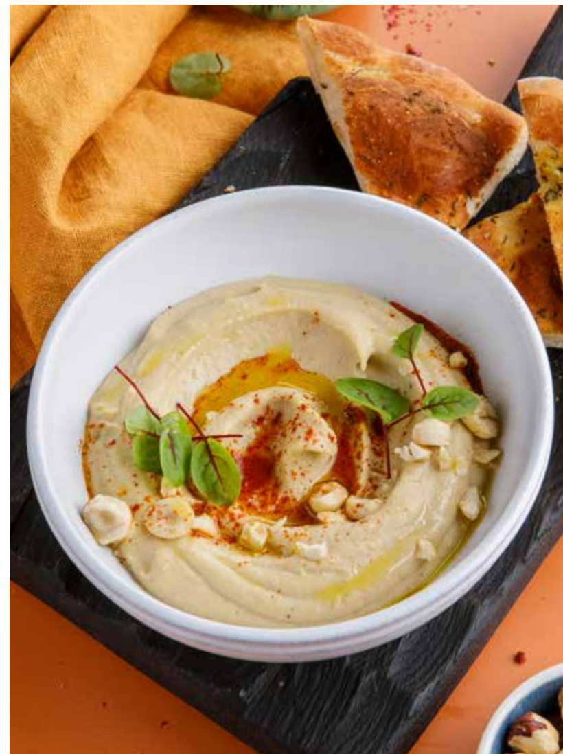
ХУМУС С ПРЯНОЙ ЛЕПЕШКОЙ 490₽ Hummus with spicy flatbread