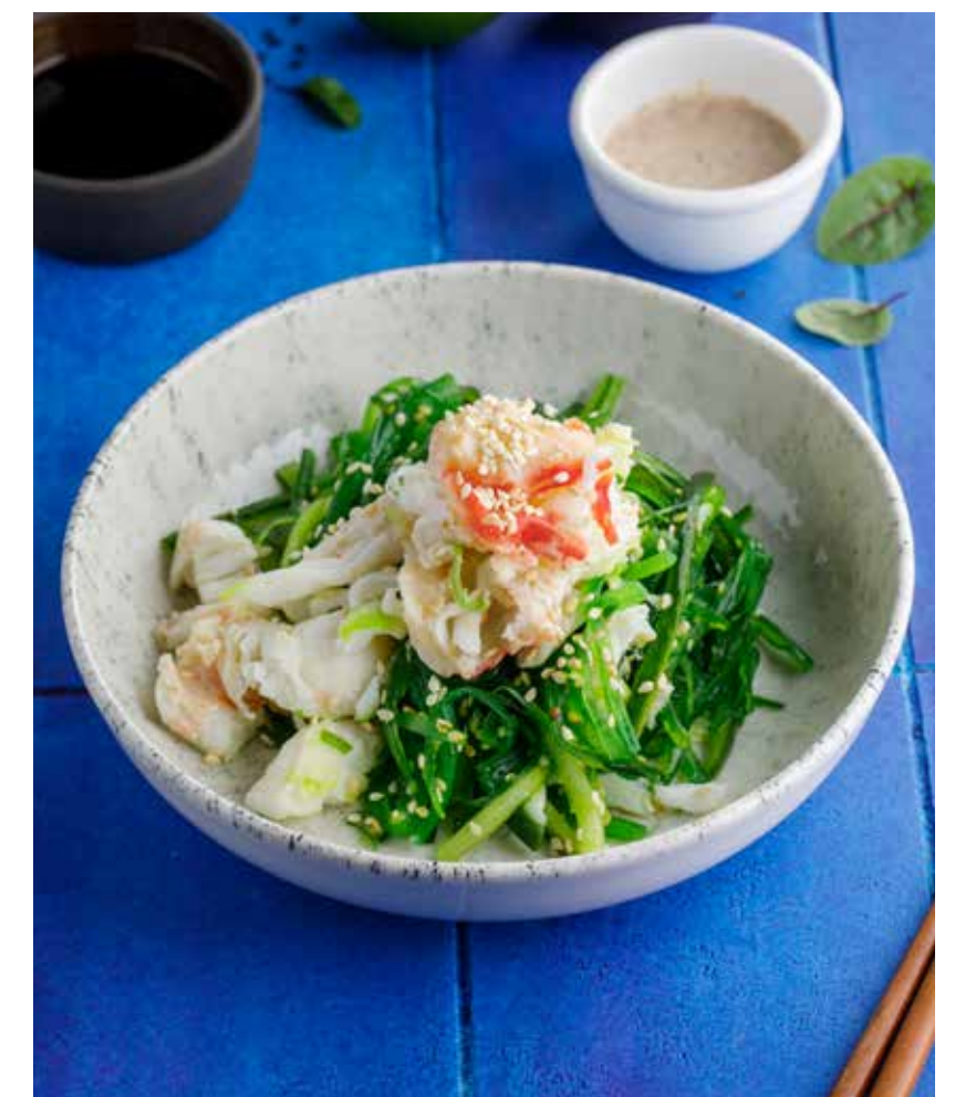
КАЙСО / КАЙСО С КРАБОМ 390/690 ₺ Kaiso salad / kaiso salad with crab