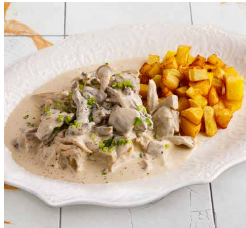
БЕФСТРОГАНОВ 1190 Р