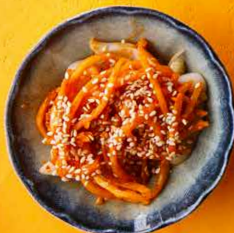
ВЯЛЕНый КАЛЬМАР 690 ₽ Cured squid