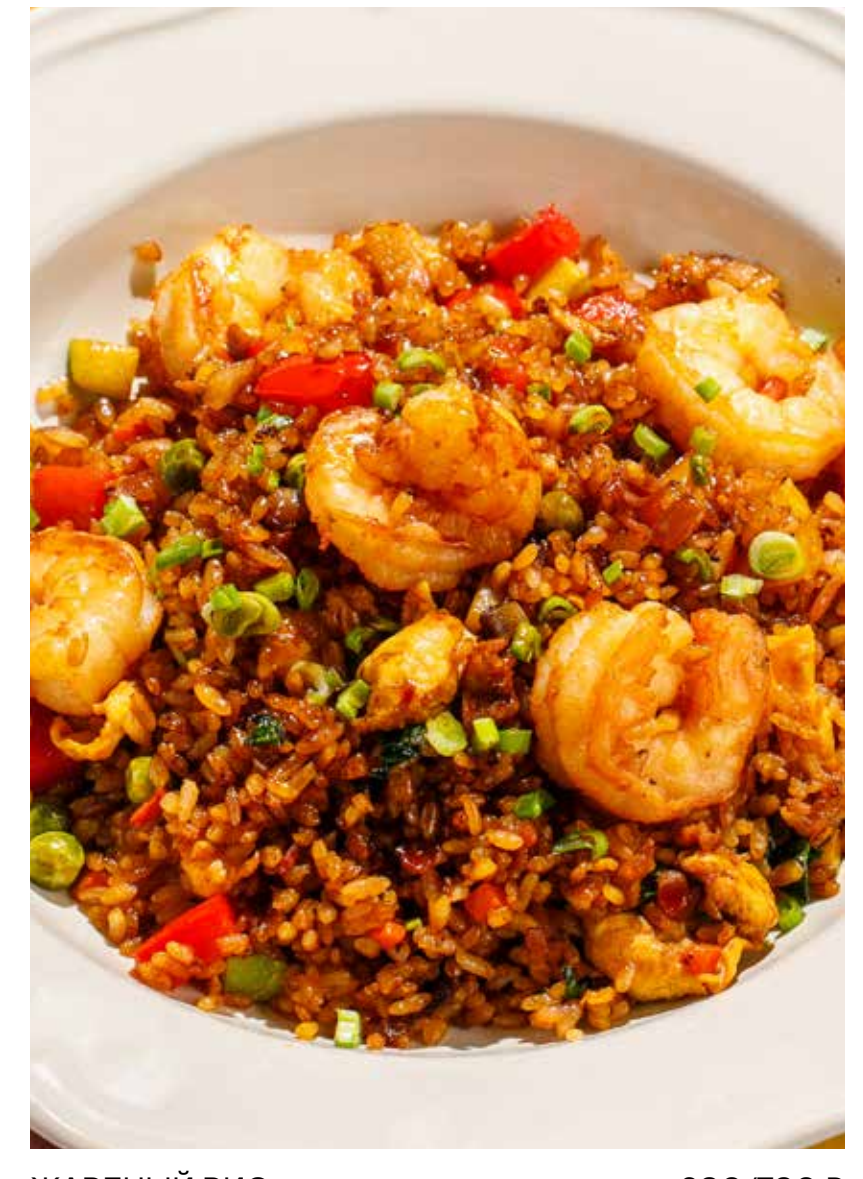
ЖАРЕННЫЙ РИС С КРЕВЕТКАМИ / С КУРИЦЕЙ