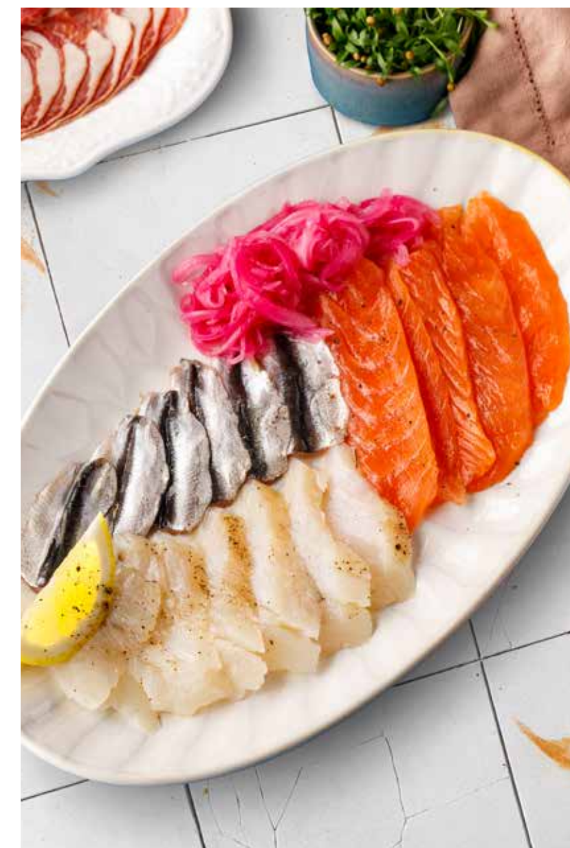
РЫБНОЕ АССОРТИ 2190 Р лосось слабой соли, маринованный сиг, балтийская килька

Cold fish platter (lightly salted salmon, pickled whitefish, Baltic sprat)