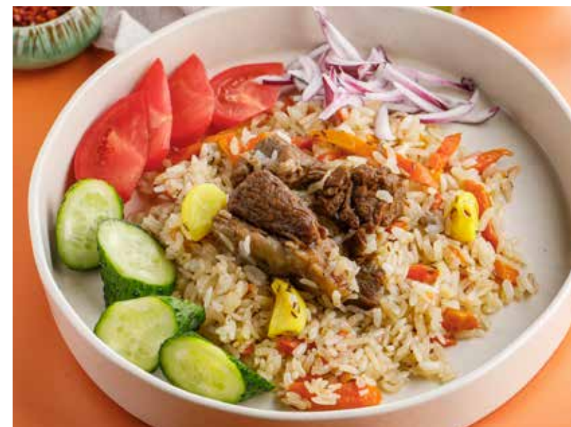
ПЛОВ 890 Р (подается со свежими овощами или соленьями на выбор)

Crispy chicken patty with mushroom sauce