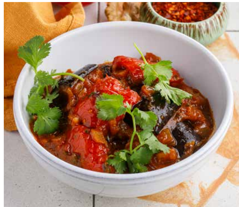
АДЖАПСАНДАЛ 590 Р

Assorted Italian deli meats (salame Napoli, salami chorizo, dried pork neck)