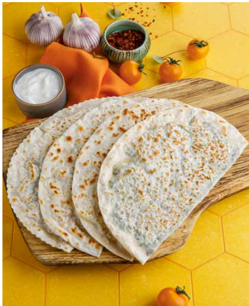
КУТАБЫ 390/390/390/450 Р С СЫРОМ / С ЗЕЛЕНЬЮ / С КАРТОФЕЛЕМ / С БАРАНИНОЙ

Qutabs with cheese / with fresh herbs / with potatoes / with lamb