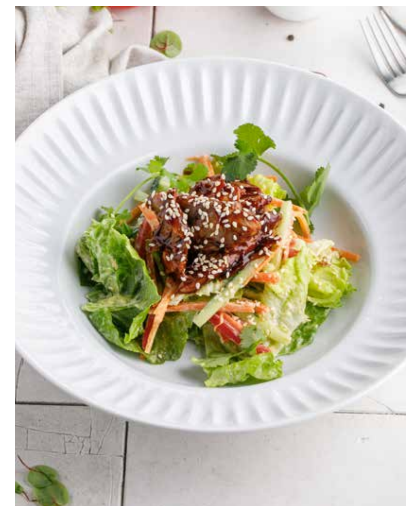
САЛАТ С УТКОЙ КОНФИ 790 ₺

Salad with crispy eggplant, shrimp and stracciatella