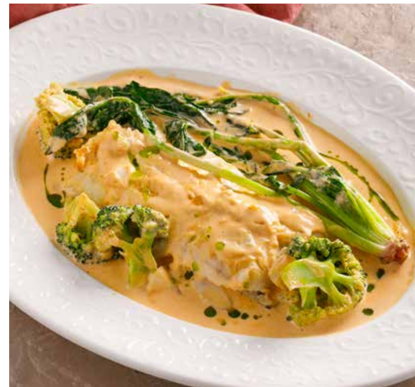
СУДАК С ОВОЩАМИ БИСК 1190 Р