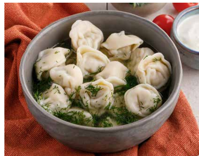
СИБИРСКИЕ ПЕЛЬМЕНИ 550 Р