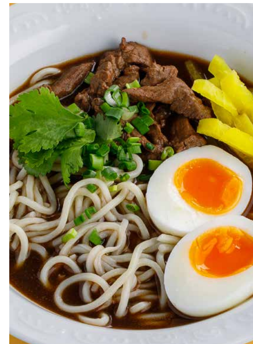
СУП С ГОВЯДИНОЙ И ЛАПШОЙ 690 ₽ Beef noodle soup