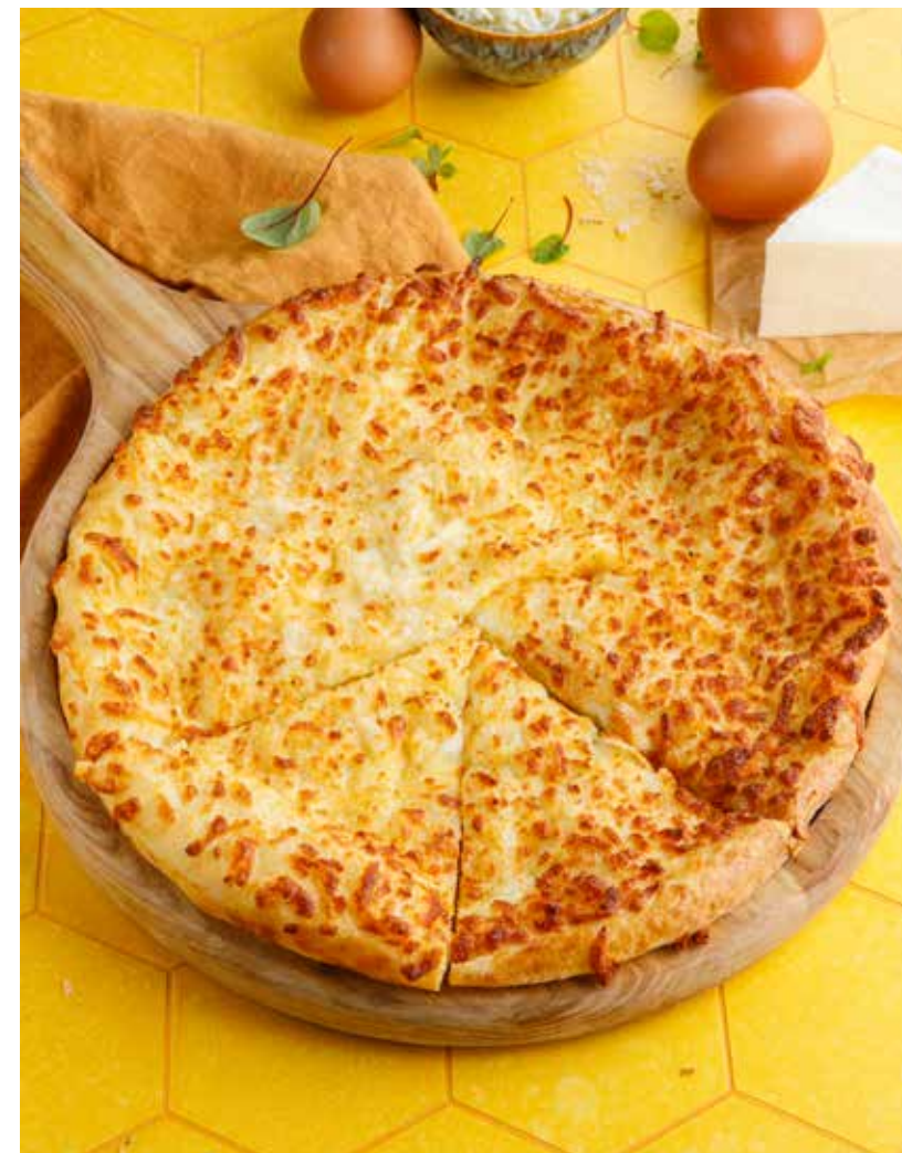
ХАЧАПУРИ ПО-МЕГРЕЛЬСКИ 750 Р Megrelian khachapuri

Shawarma with chicken / with shrimp / lamb lula kebab