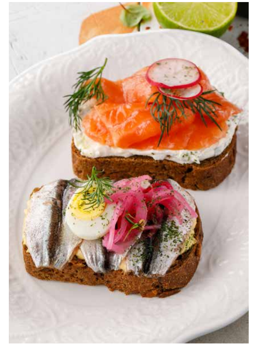
СМОРРЕБРОД С БАЛТИЙСКОЙ КИЛЬКОЙ / С ЛОСОСЕМ

Assorted phali with spinach / roasted pepper / beetroot