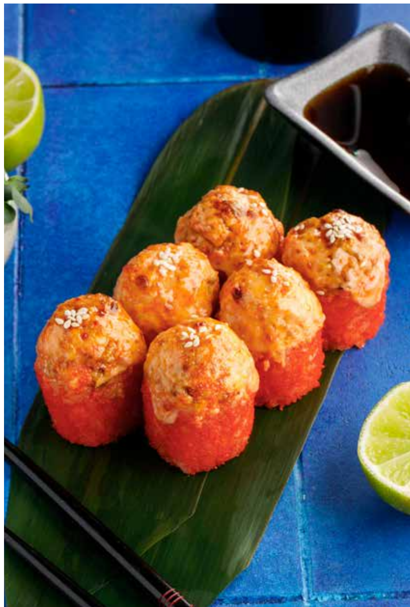
«ФЬЮЖН» 690 ₺ Fusion