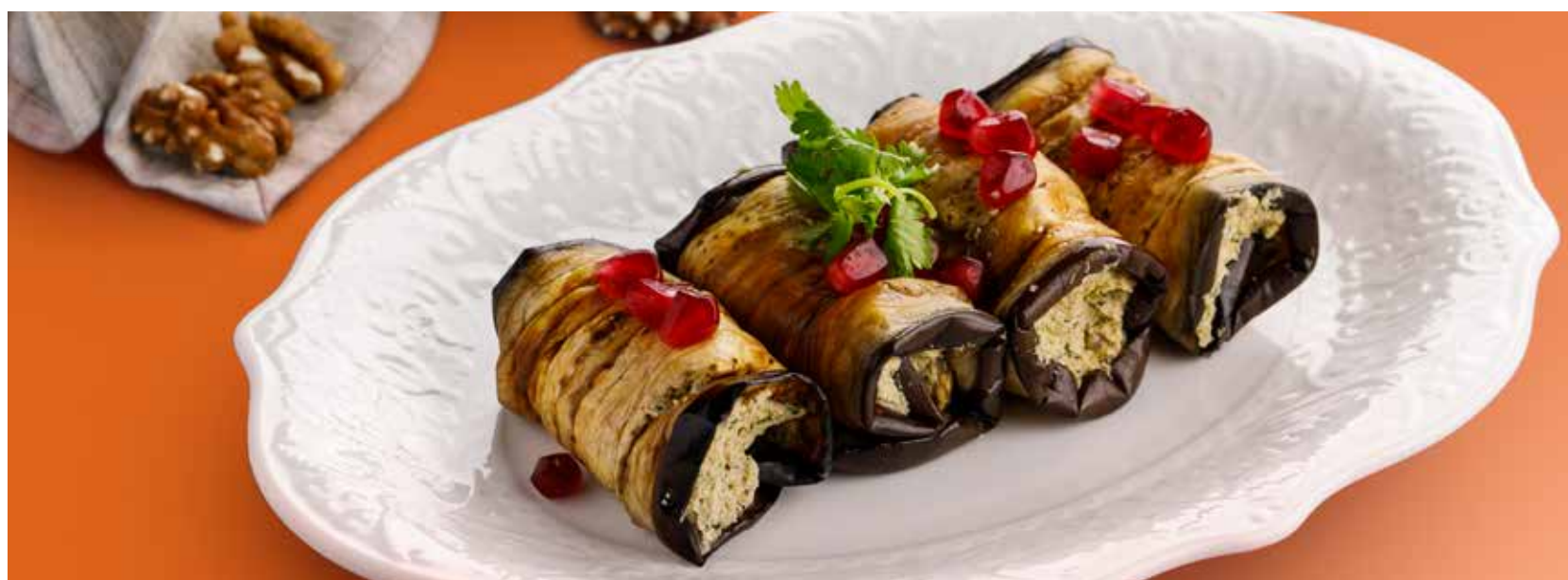
РУЛЕТКИ ИЗ БАКЛАЖАНОВ С ГРЕЦКИМИ ОРЕХАМИ 690 Р