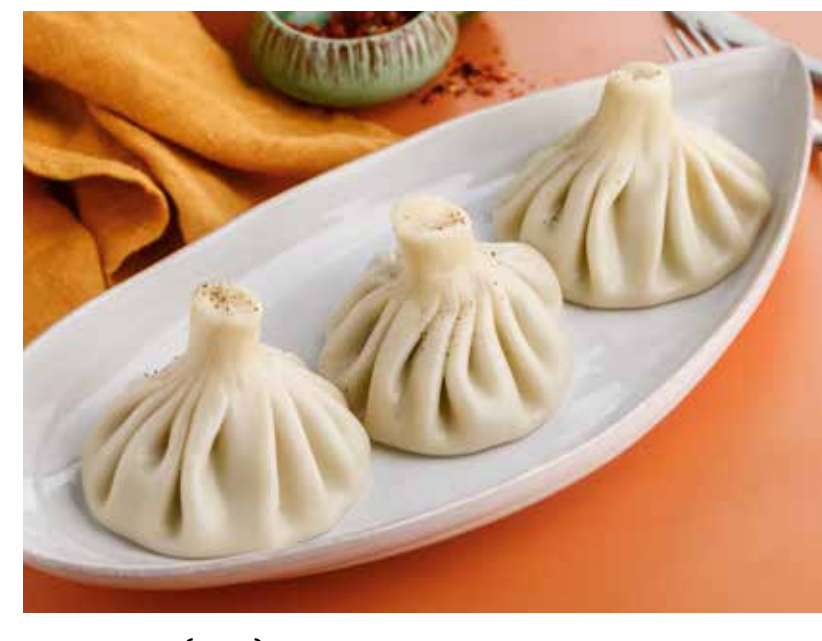
ХИНКАЛИ (1 шт.) 190 Р с бараниной / телятиной / говядиной и свиной

Khinkali (1 pc) with lamb / veal / beef and pork