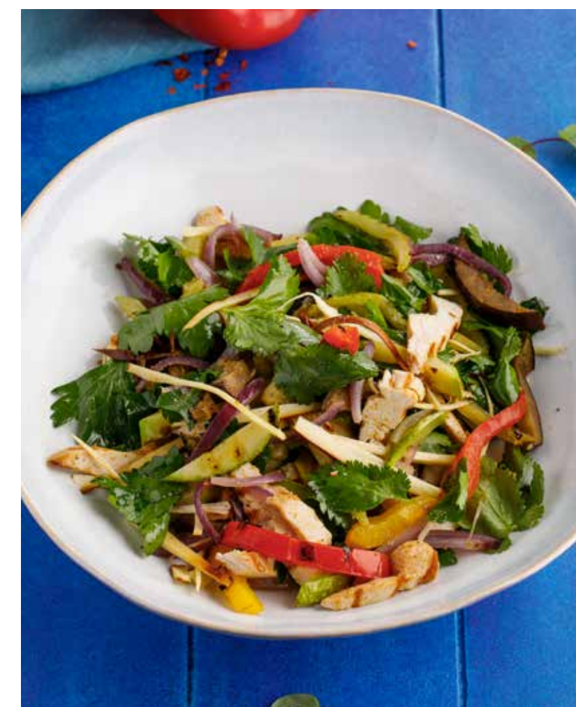
ГРИЛЬ-САЛАТ С ИНДЕЙКОЙ / С ЯГНЕНКОМ 590/790 ₺