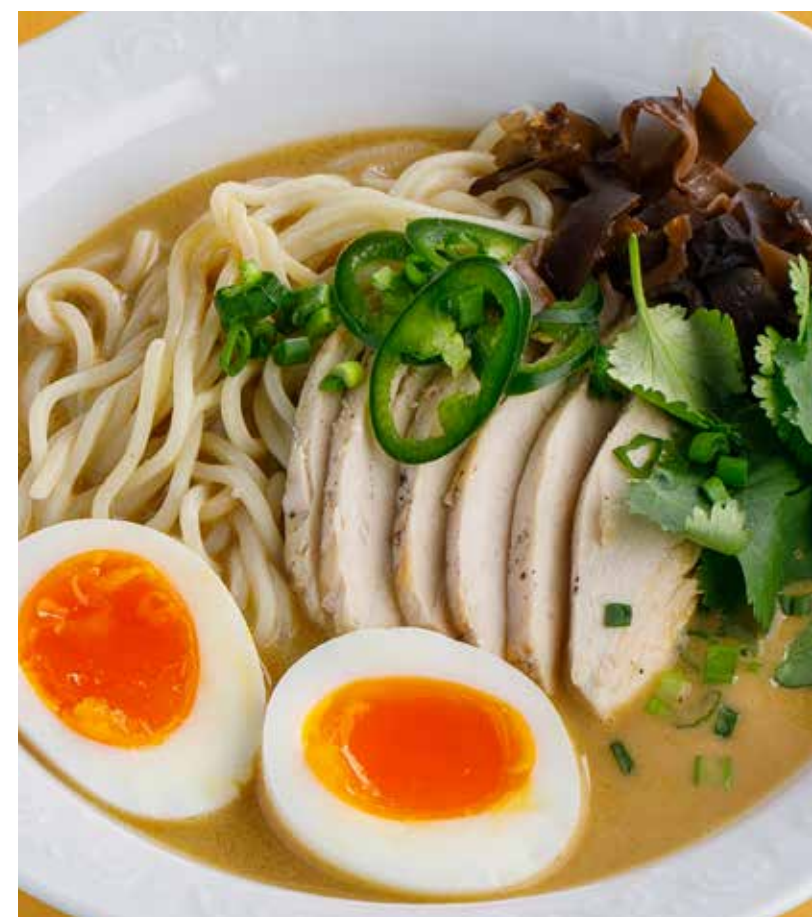
РАМЕН С КУРИЦЕЙ 650 ₽ Chicken ramen