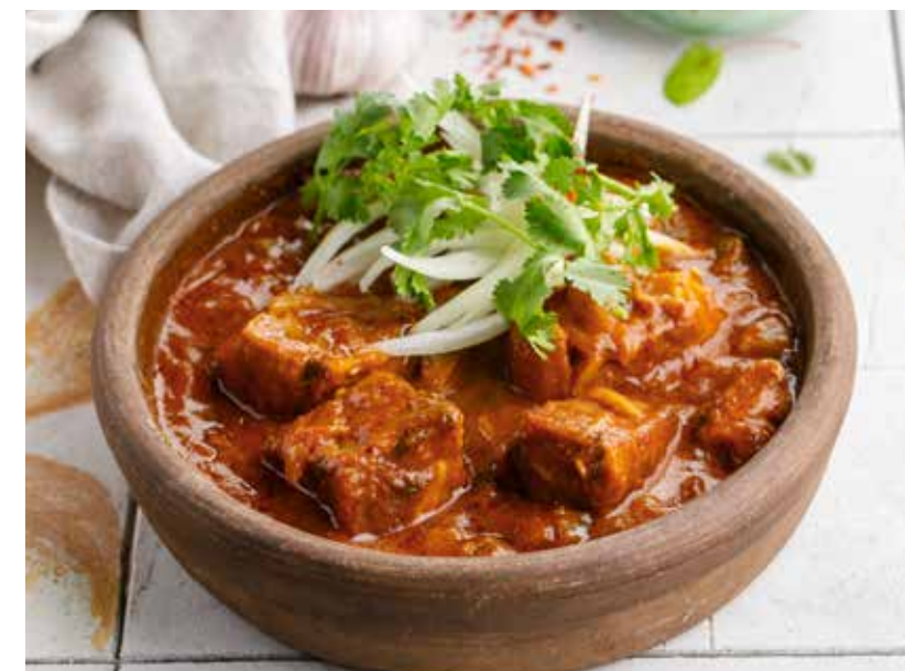
СОЛЯНКА ПО-ГРУЗИНСКИ 690 Р

Pilaf (served with fresh vegetables or pickles on your choice)