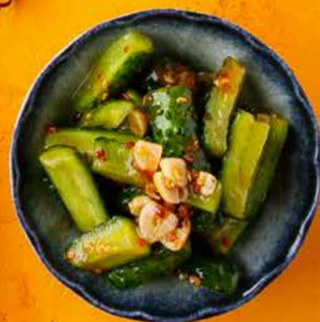
БИТЫЕ ОГУРЦЫ 290 ₽ Smashed cucumbers