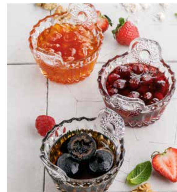
ДОМАШНЕЕ ВАРЕНЬЕ в ассортименте