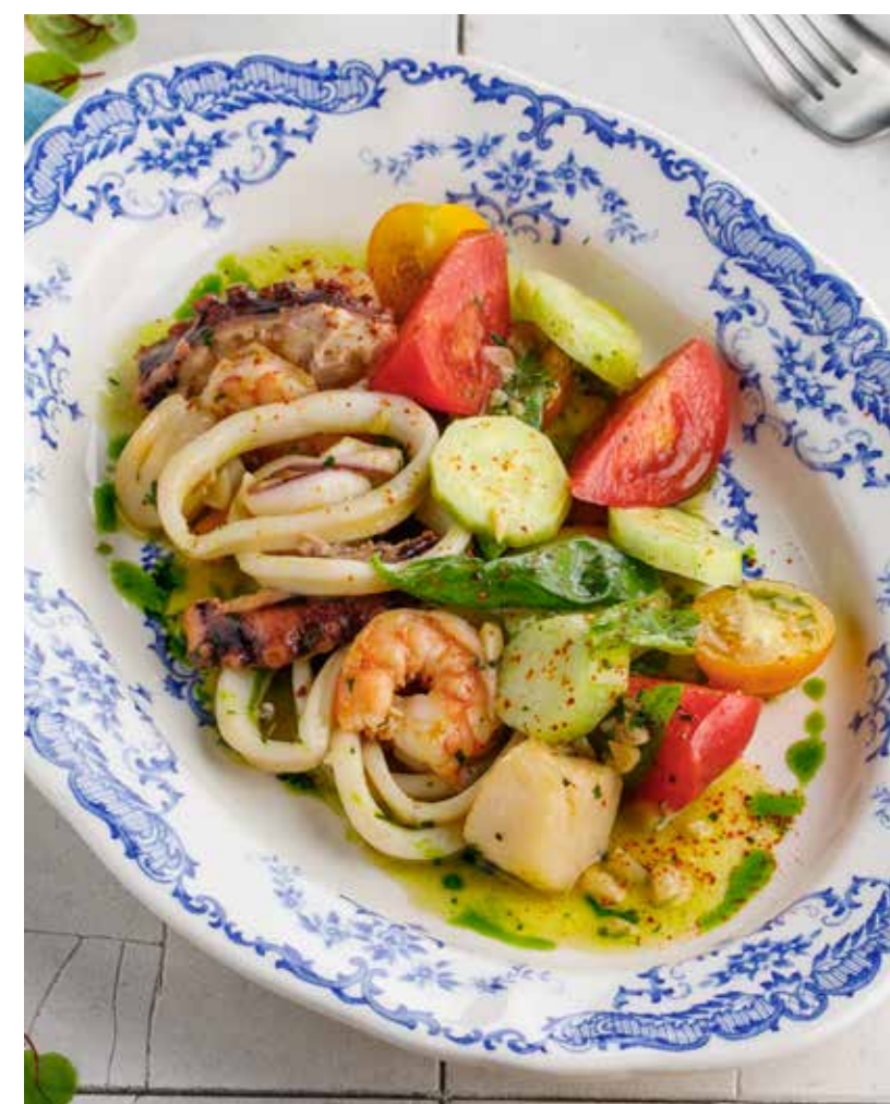
САЛАТ С МОРЕПРОДУКТАМИ 1590 ₺