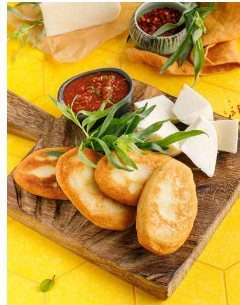
МЧАДИ С СЫРОМ СУЛУГУНИ 650 Р Mchadi with suluguni cheese