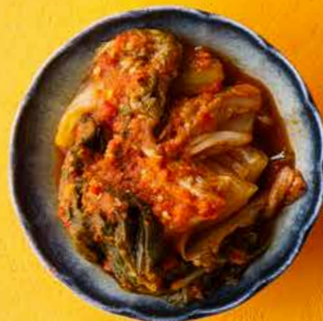
КАПУСТА КИМЧИ 290 ₽ Kimchi cabbage