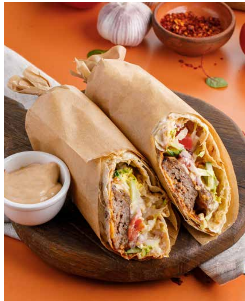
ШАВЕРМА 690/750/750 Р С КУРИЦЕЙ / С КРЕВЕТКАМИ / ЛЮЛЯ-КЕБАБ ИЗ ЯГНЕНКА

Qutabs with cheese / with fresh herbs / with potatoes / with lamb