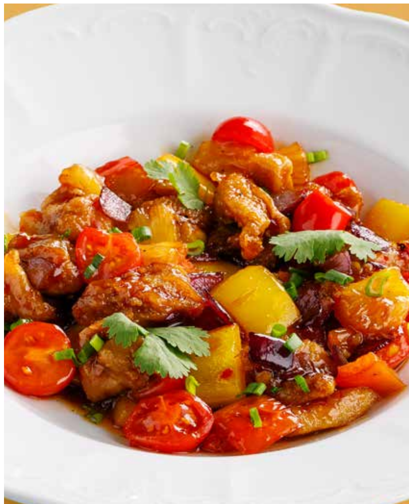
КУРИЦА С АНАНАСАМИ