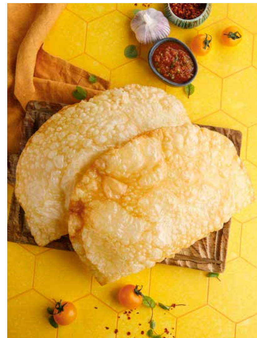
ЧЕБУРЕК 390/390/450 Р С СЫРОМ / С ТЕЛЯТИНОЙ / С БАРАНИНОЙ

Cheburek with cheese / with veal / with lamb