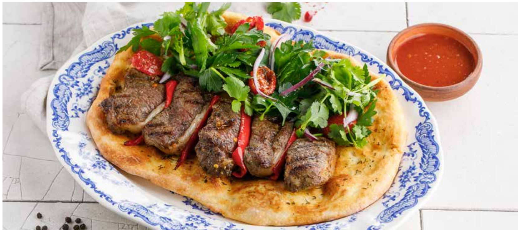
СЕДЛО ЯГНЕНКА НА ПРЯНОЙ ЛЕПЕШКЕ