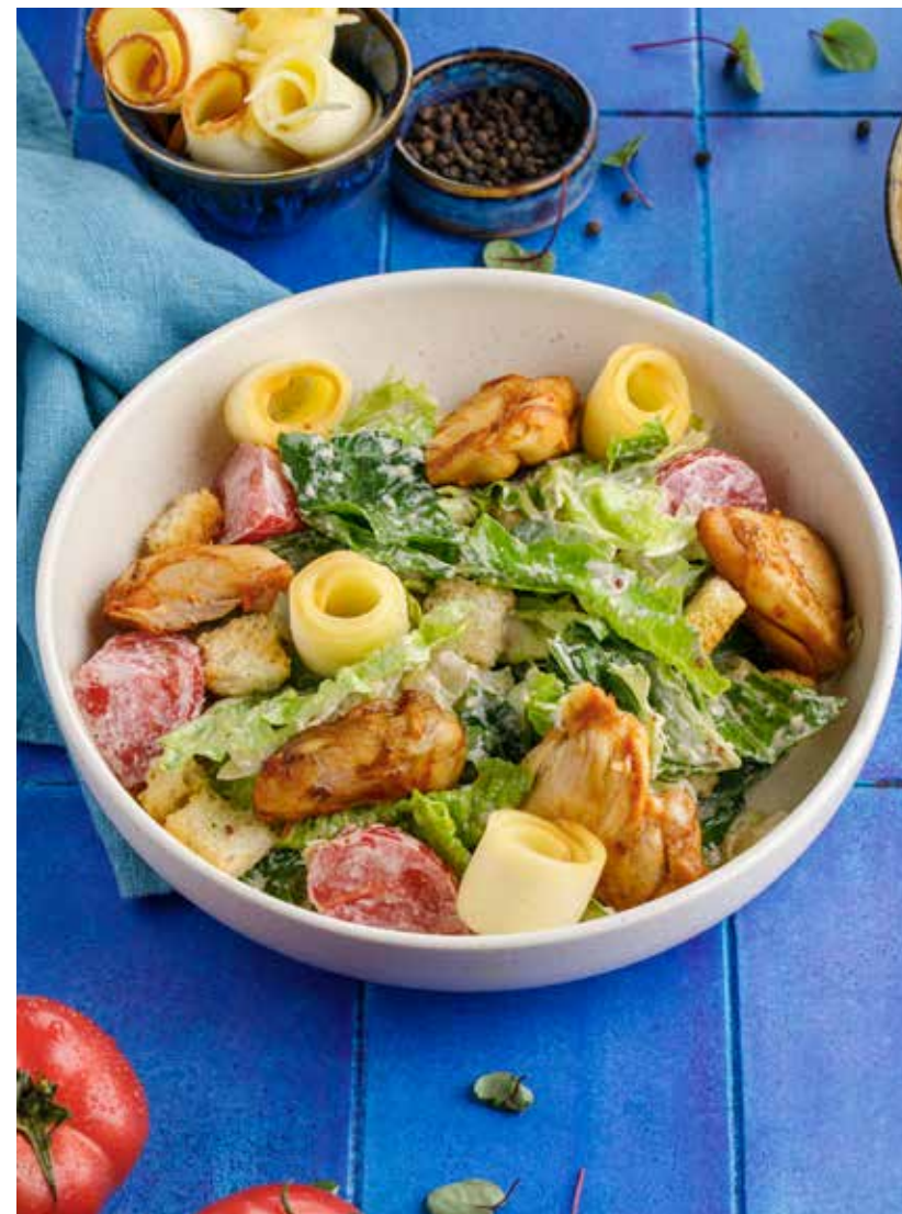
ТЕПЛЫЙ САЛАТ С КУРИЦЕЙ И КОПЧЕНЫМ СУЛУГУНИ 750 Р

Georgian vegetable salad with spices / with nuts