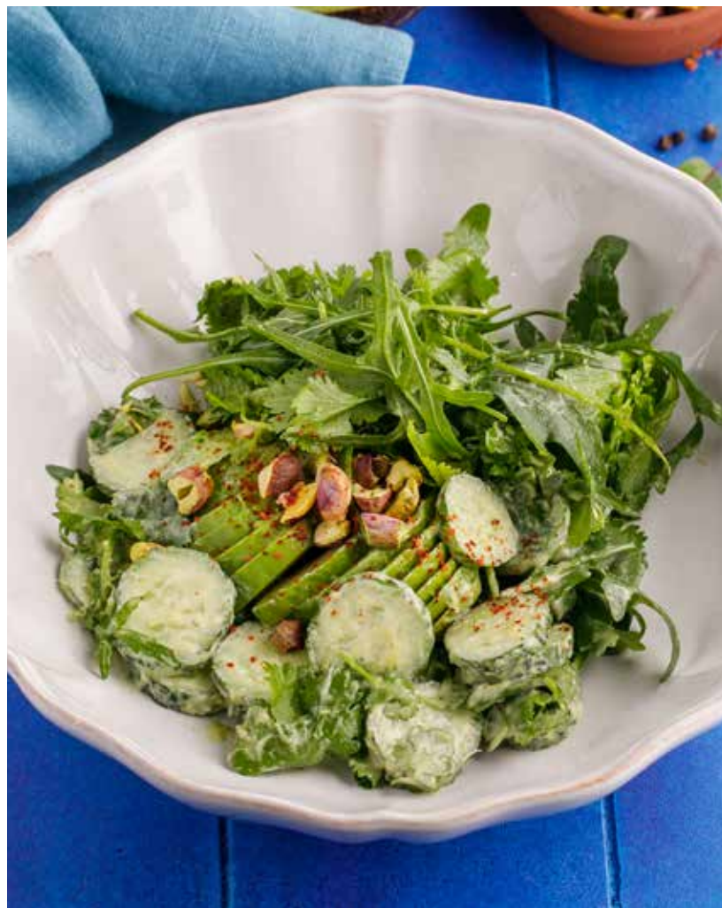
ЗЕЛЕНЫЙ САЛАТ С АВОКАДО И СОУСОМ ИЗ ЛЕМОНГРАССА 750 Р

Green salad with avocado and lemongrass sauce