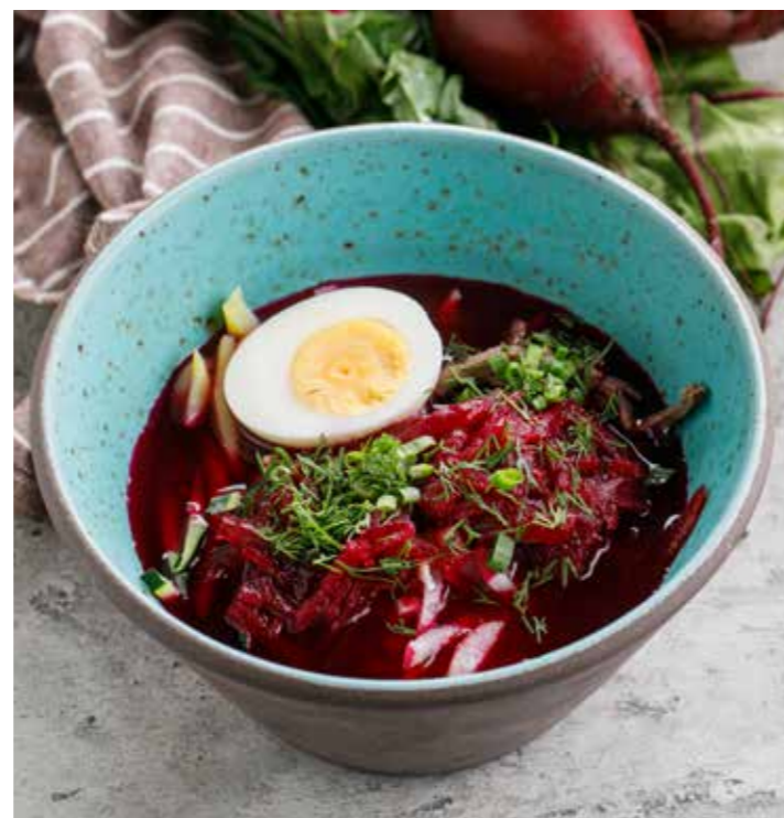
СВЕКОЛЬНИК С ГОВЯДИНОЙ 350/40/40 г 690 Р Beetroot soup with beef