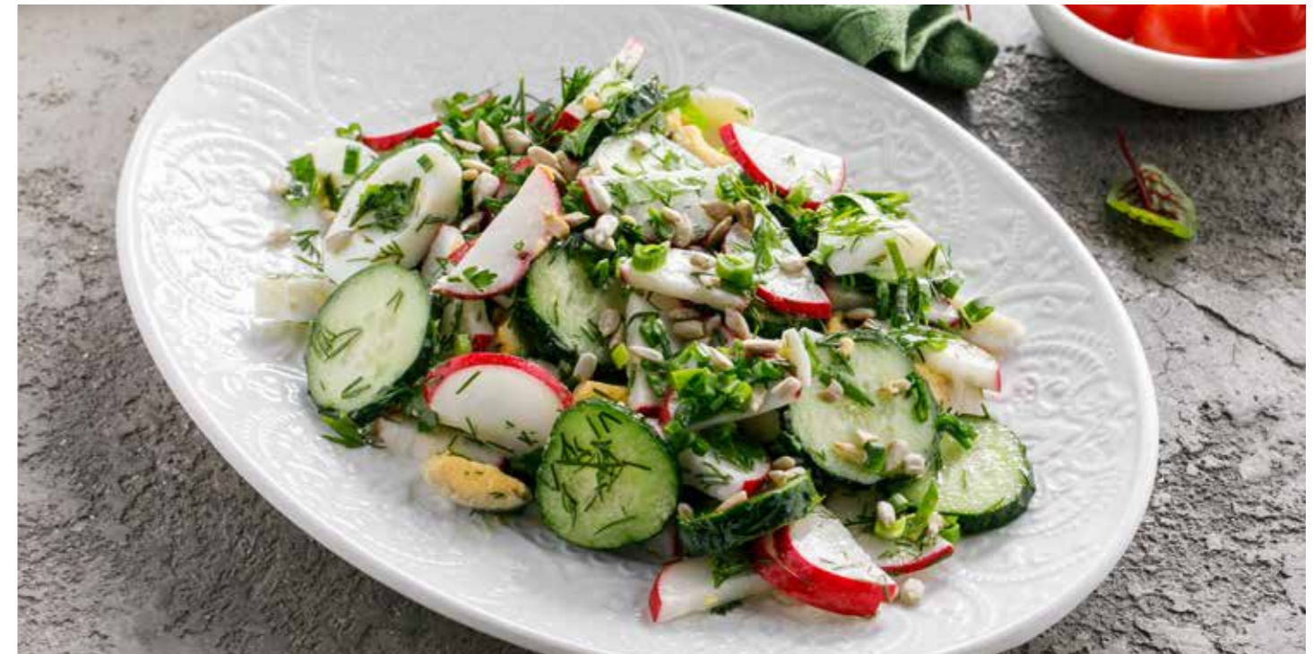
ОВОЩНОЙ САЛАТ С ГРЯДКИ