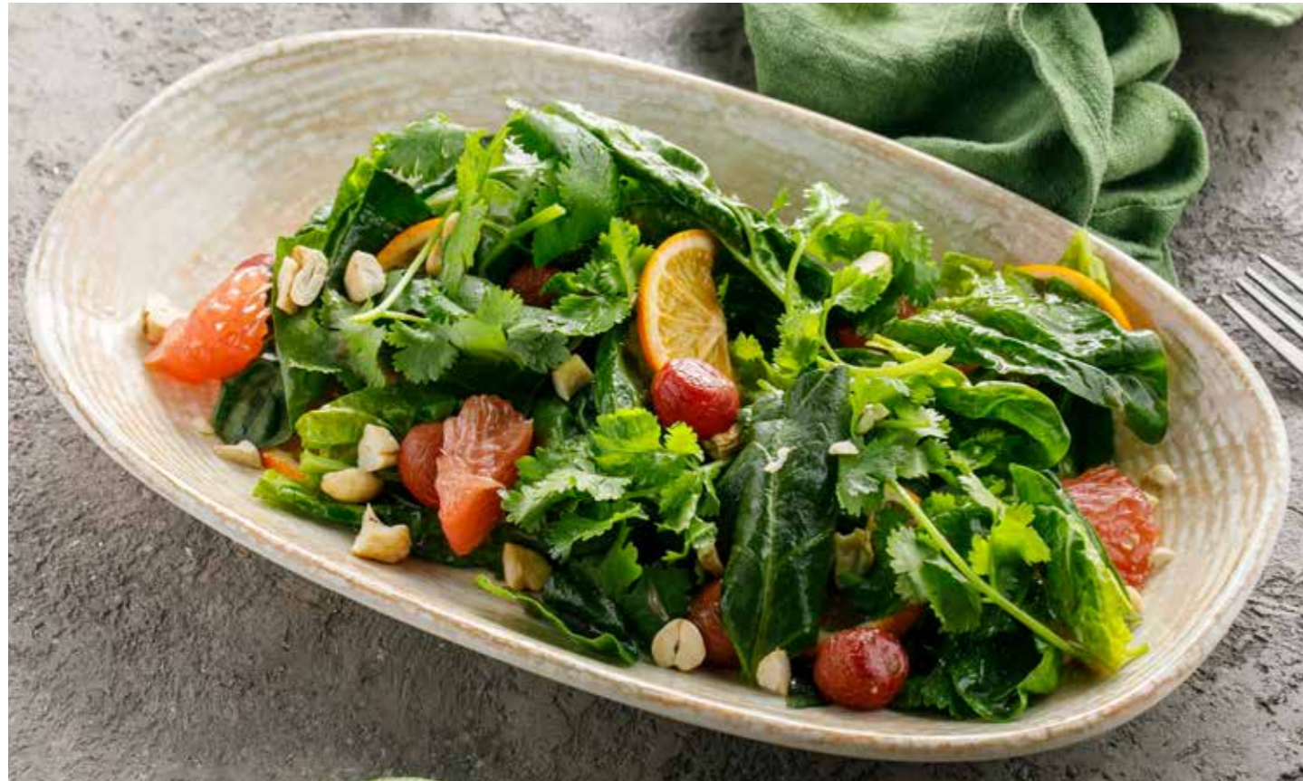
САЛАТ С ЦИТРУСАМИ И КЕШЬЮ