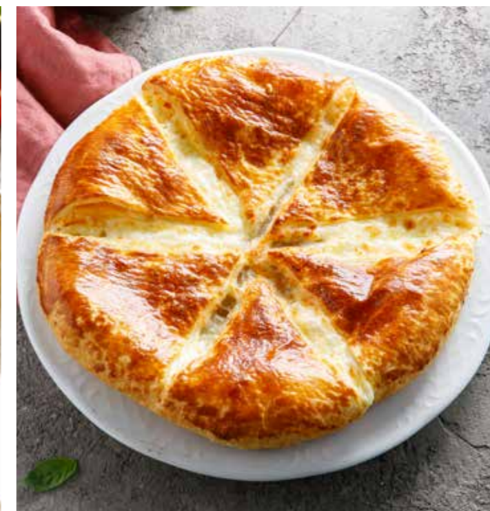
ПЕНОВАНИ 560 г 890 Р Penovani