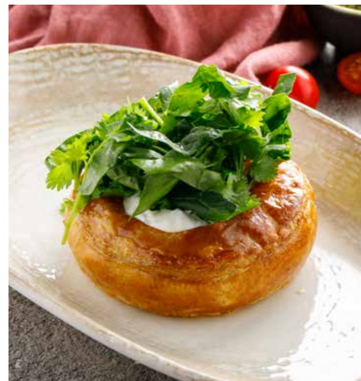
ПИРОГ С КРОЛИКОМ, ТОМЛЕННЫМ В СМЕТАНЕ 180/30/15 г 790 Р Pie with rabbit slow-cooked in sour cream