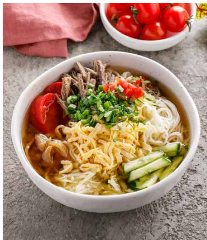
КУКСИ С ГОВЯДИНОЙ 400 г 690 Р Guksu with beef