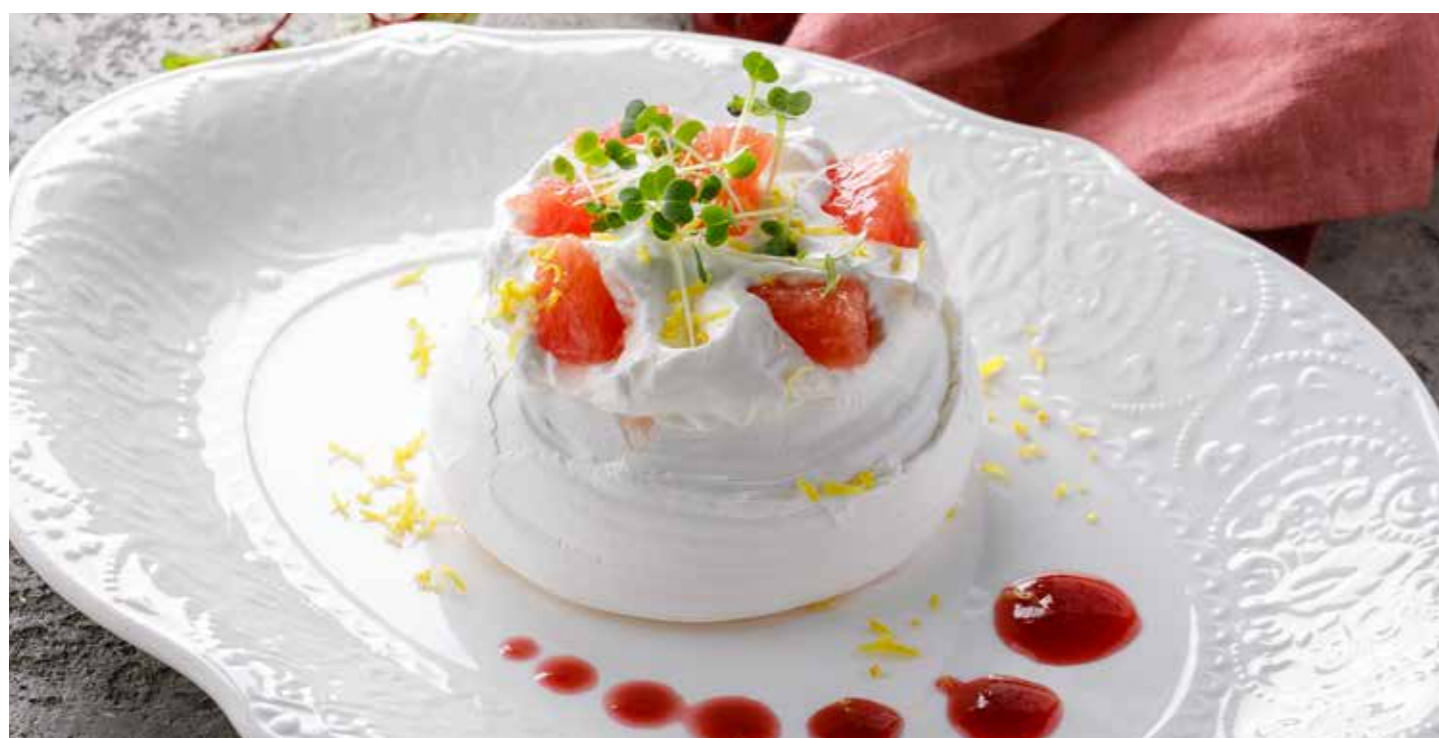
МЕРЕНГА С ГРЕЙПФРУТОМ