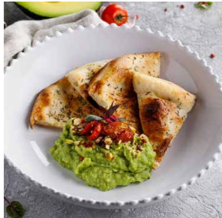
ГУАКАМОЛЕ С ТОМАТАМИ И ЛЕПЕШКОЙ 150/80 г 1190 Р