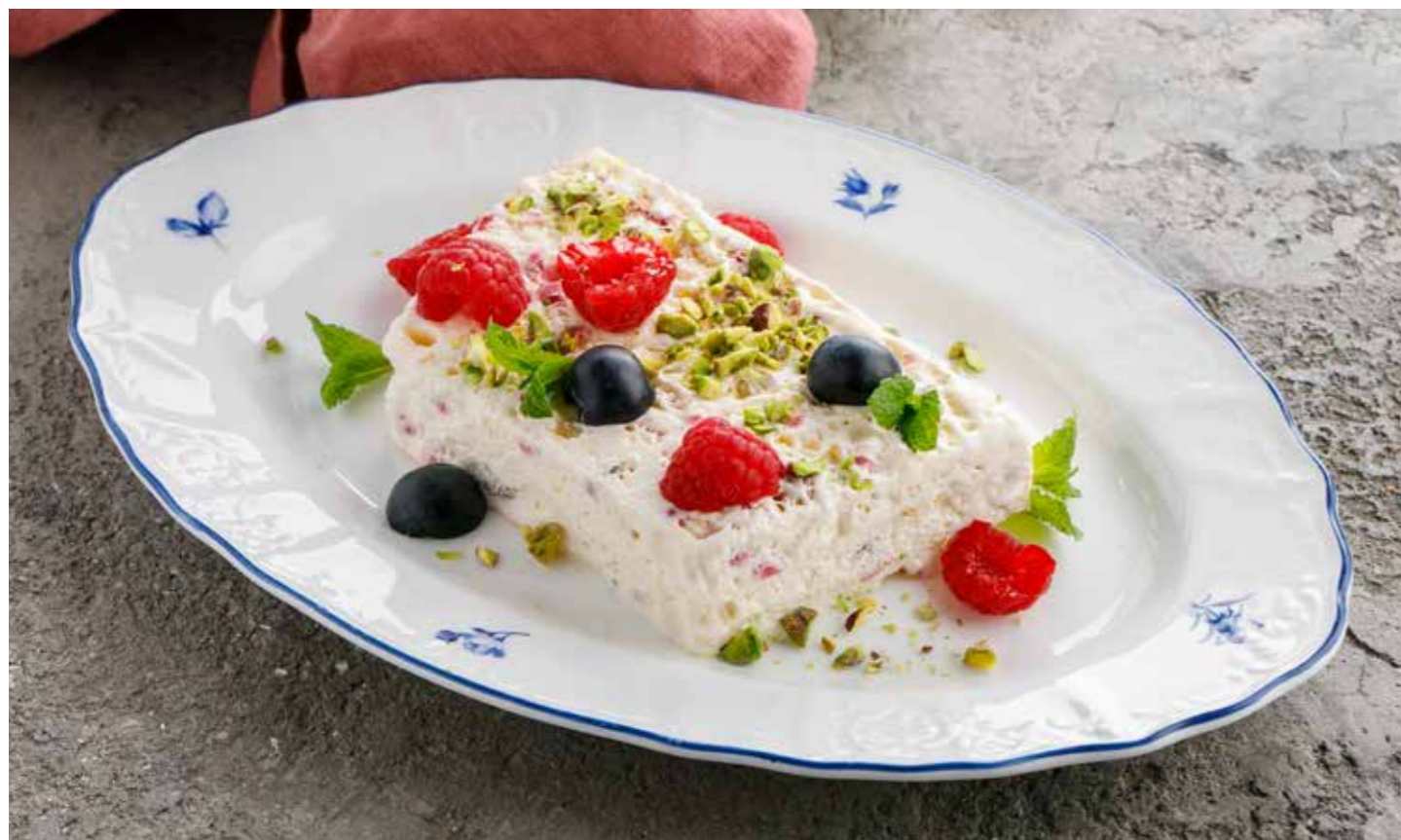
СЕМИФРЕДДО С ЯГОДАМИ