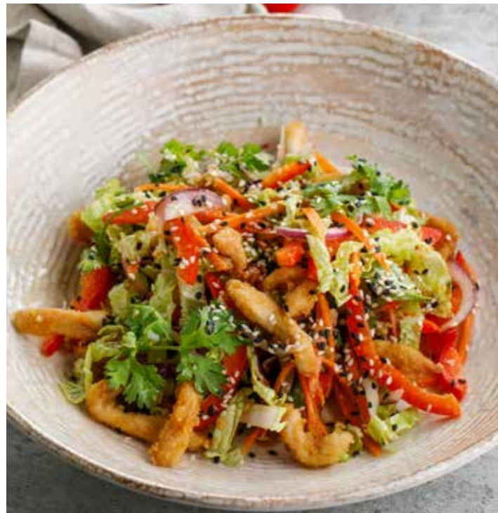
АЗИАТСКИЙ САЛАТ С КУРОЙ 250 г 790 Р