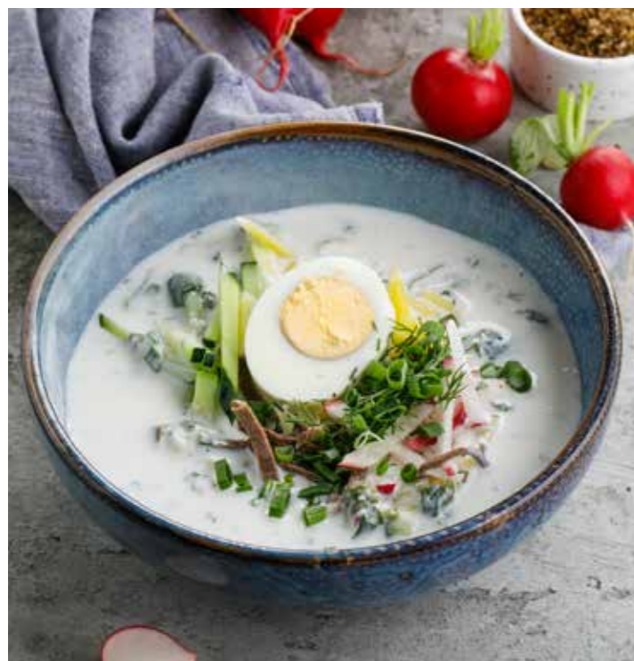
ОКРОШКА НА КВАСЕ / МАЦОНИ 350/40/40 г 690 Р Okroshka with kvas / matzoon