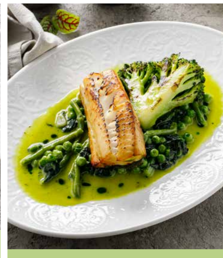
ЧЕРНАЯ ТРЕСКА С ОВОЩАМИ 110/121 г 1690 Р Black cod with vegetables

Если у вас имеется аллергия на какие-либо продукты, пожалуйста, сообщите об этом официанту.