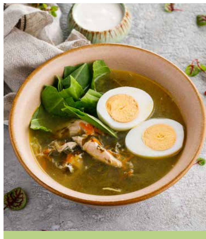
ЩАВЕЛЕВЫЙ СУП С КУРИНОЙ ГРУДКОЙ 350/40 г 590 Р Sorrel soup with chicken breast