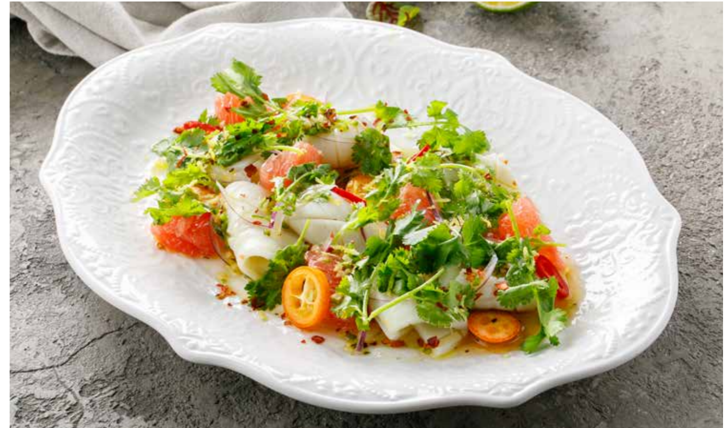
ЗАКУСКА ИЗ КАЛЬМАРА И СВЕЖЕЙ ЗЕЛЕНИ