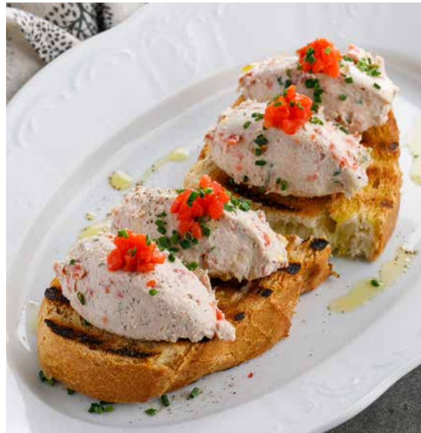
ПАТЕ ИЗ ТУНЦА И КОПЧЕНОЙ НЕРКИ