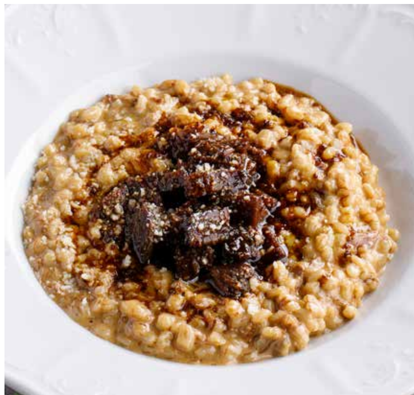
ПЕРЛОВАЯ КАША НА ТОПЛЕННЫХ СЛИВКАХ С ЩЕЧКАМИ ИЗ КОПТИЛЬНИ 990 ₽ Pearl barley porridge on melted cream with smokehouse cheeks