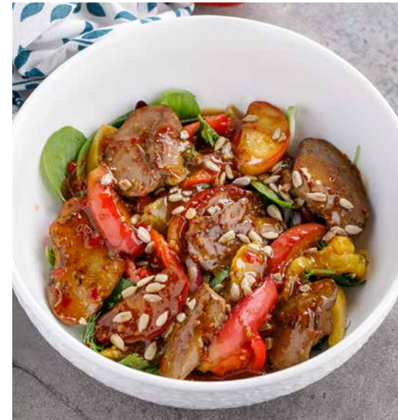
ТЕПЛЫЙ САЛАТ С ПЕЧЕНЬЮ КРОЛИКА