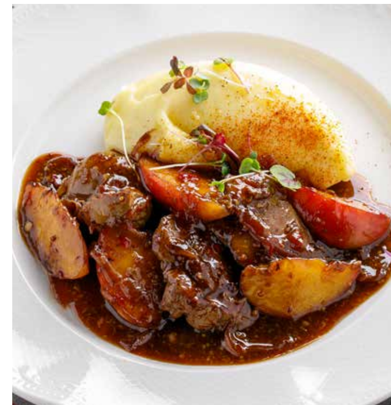
ПЕЧЕНЬ КРОЛИКА С ЯБЛОКАМИ И ЖАРЕНЫМ ЛУКОМ 1190 Р Rabbit liver with apples and fried onions