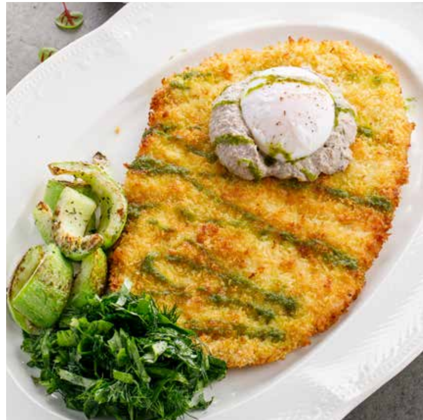
ШНИЦЕЛЬ ИЗ КРОЛИКА С ТРЮФЕЛЬНОЙ ПАСТОЙ И ЯЙЦОМ ПАШОТ 1190 ₽ Rabbit schnitzel with truffle paste and poached egg