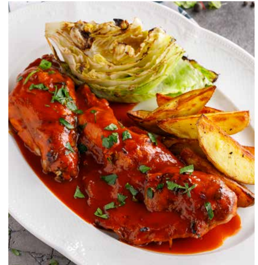
ПОЛОВИНКА КРОЛИКА ИЗ ПЕЧИ 1990 Р Half a rabbit from the oven