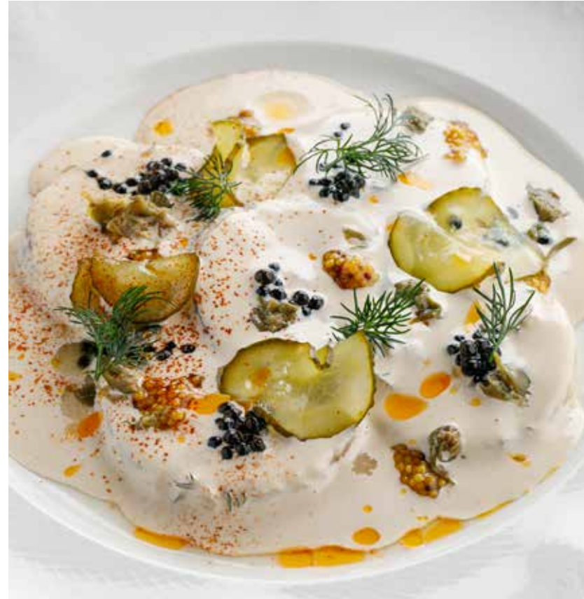
БУЖЕНИНА ИЗ СУДАКА