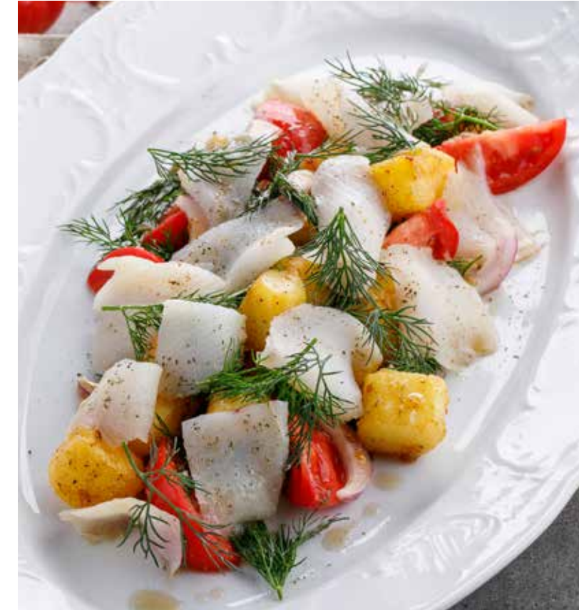
САЛАТ С КОПЧЕНЫМ ПАЛТУСОМ