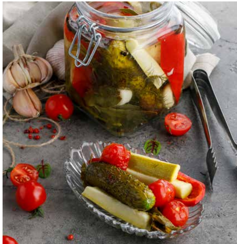
ДОМАШНИЕ СОЛЕНЬЯ В БАНКЕ