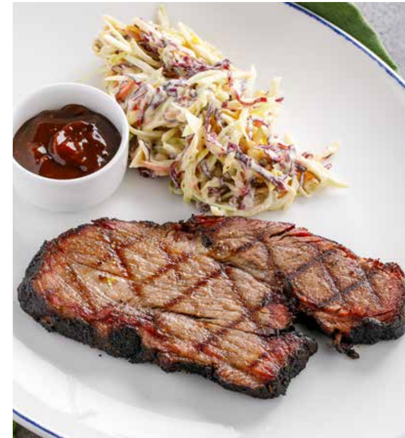
БРИСКЕТ С СОУСОМ БАРБЕКЮ 2590 Р Brisket with BBQ sauce