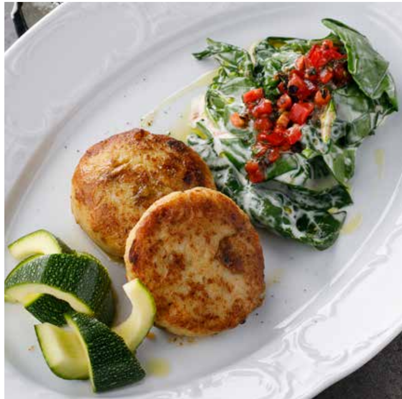
ЗРАЗЫ ИЗ ШУКИ С БЕЛЫМИ ГРИБАМИ И МАРИНОВАННЫМ КАБАЧКОМ 1190 ₽ Pike zrazy with porcini mushrooms and pickled zucchini