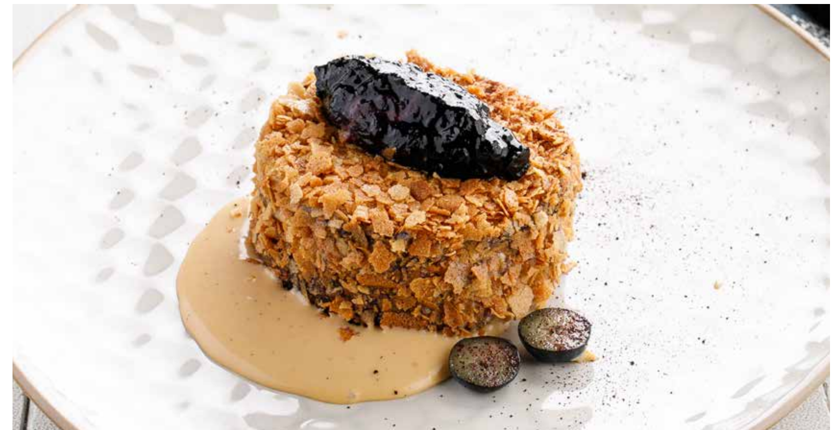
ЧЕРНИЧНЫЙ ТОРТ Blueberry cake