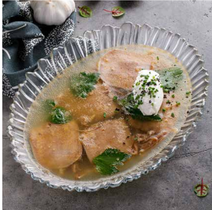
ХОЛОДЕЦ НА БЫЧЬИХ ХВОСТАХ С ГОВЯЖЬИМ ЯЗЫКОМ