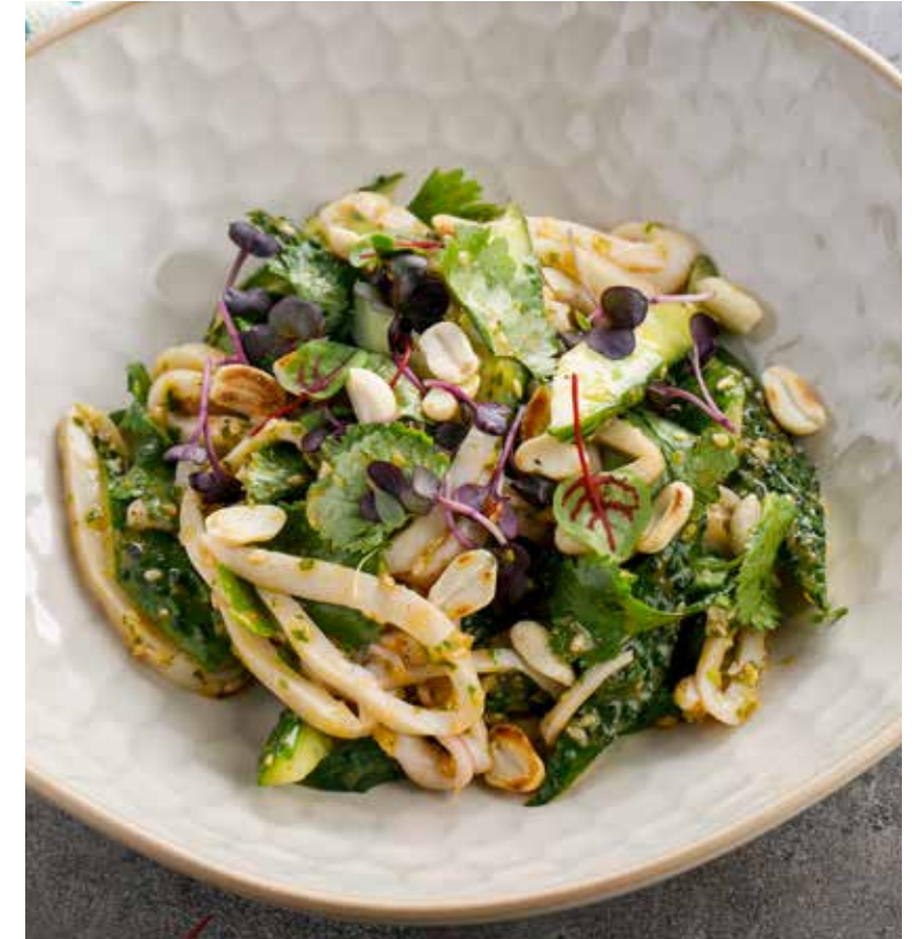
САЛАТ С КАЛЬМАРОМ