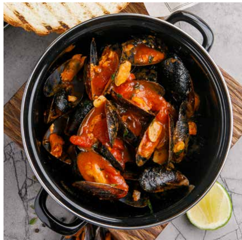
МИДИИ В ТОМАТНОМ / СЛИВОЧНОМ СОУСЕ 1490 ₽ Mussels with red or white sauce