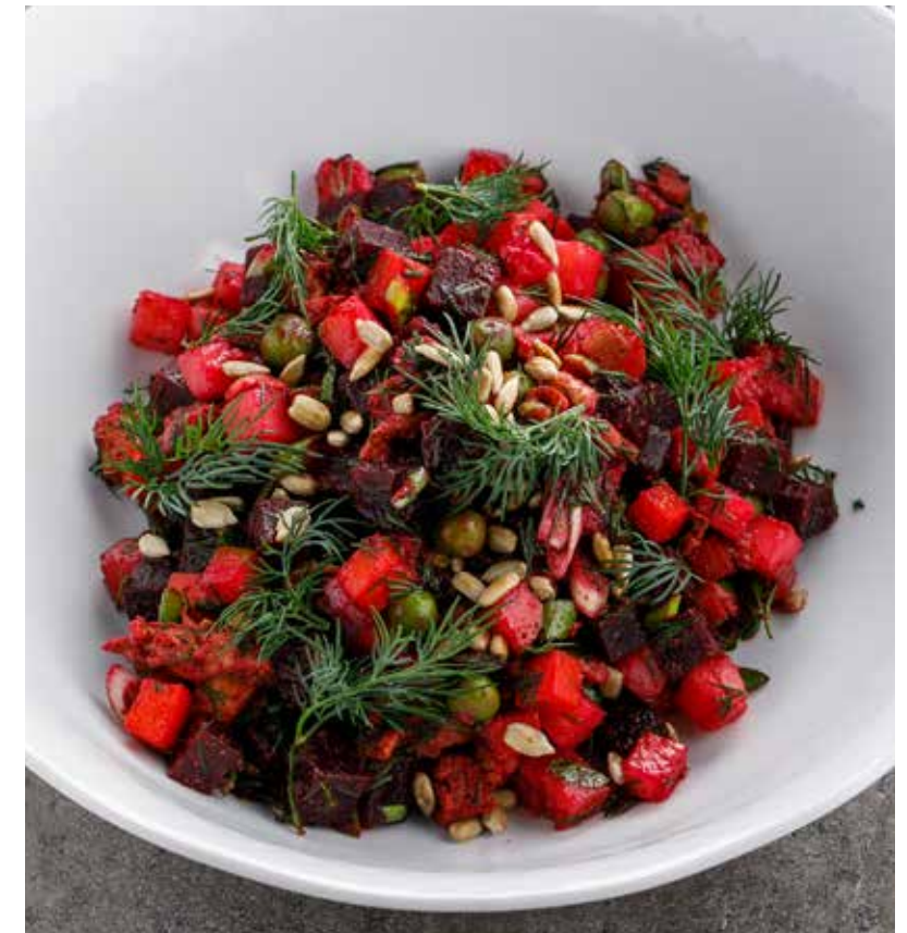
ВИНЕГРЕТ / ВИНЕГРЕТ С СЕЛЕДКОЙ