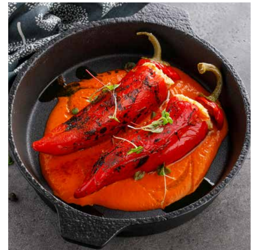
ПЕРЦЫ, ФАРШИРОВАННЫЕ ЩУКОЙ С СОУСОМ ЛЕЧО 990 Р Peppers stuffed with pike with lecho sauce

ПРОСЬБА ПРЕДУПРЕЖДАТЬ ВАШЕГО ОФИЦИАНТА ОБ ИМЕЮЩЕЙСЯ У ВАС АЛЛЕРГИИ НА ОПРЕДЕЛЕННЫЕ ПРОДУКТЫ ПИТАНИЯ. | PLEASE, TELL YOUR WAITER IF YOU HAVE ANY FOOD ALLERGY TO CERTAIN PRODUCTS.