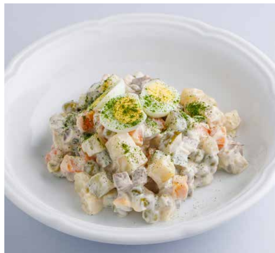
«ОЛИВЬЕ» С ИНДЕЙКОЙ / С ГОВЯДИНОЙ / С КОПЧЕНЫМ ЛОСОСЕМ Turkey / beef / smoked salmon Olivier (Russian salad)