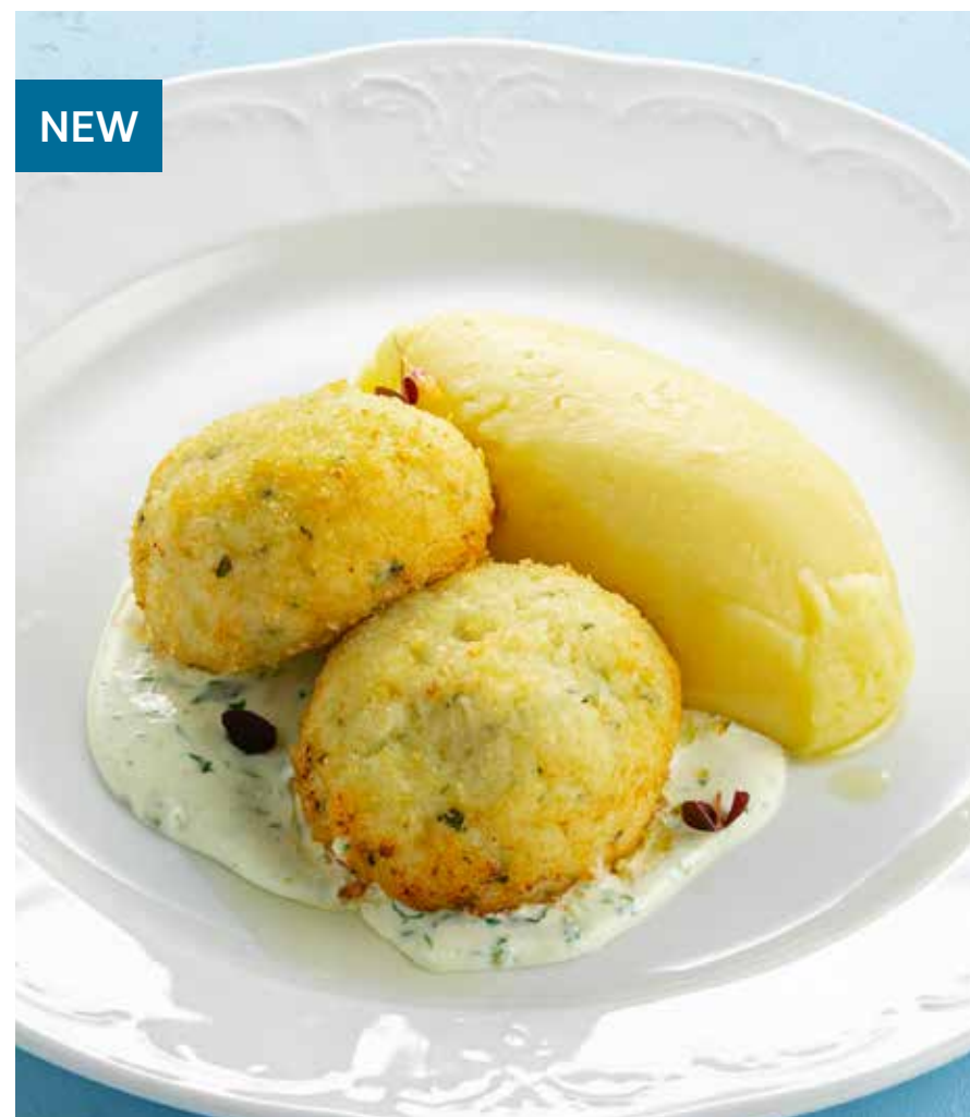
КОТЛЕТЫ ИЗ ТРЕСКИ С СОУСОМ ИЗ ШПИНАТА Cod patties with spinach sauce