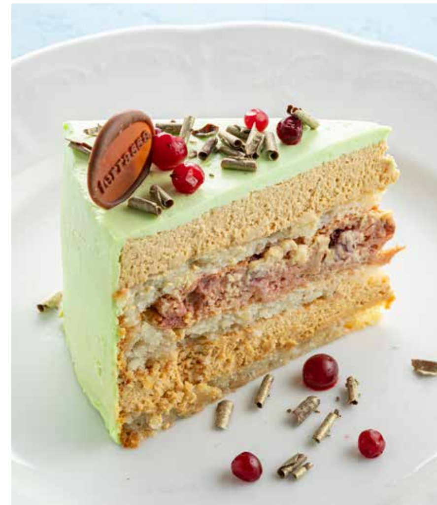
БЕЗГЛЮТЕНОВЫЙ ЯБЛОЧНО-КАРАМЕЛЬНЫЙ ТОРТ Gluten free apple-caramel cake