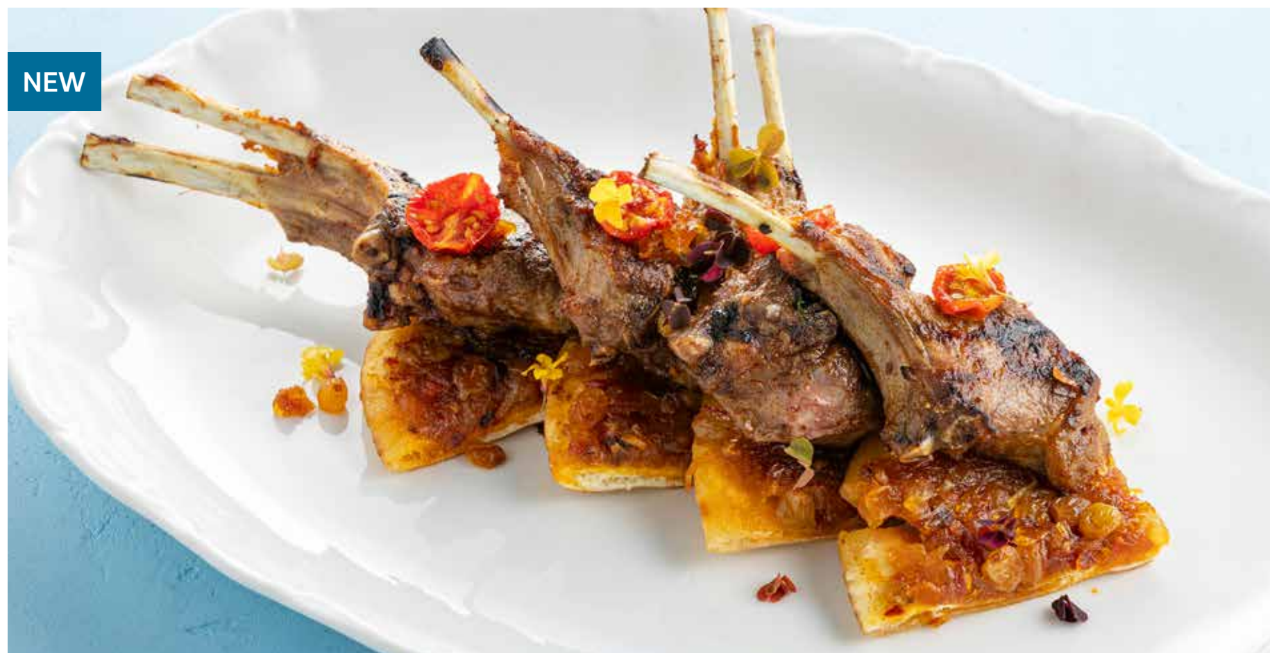
КАРЕ ЯГНЕНКА С ПИТОЙ И ИЗЮМОМ Rack of lamb with pita and raisins