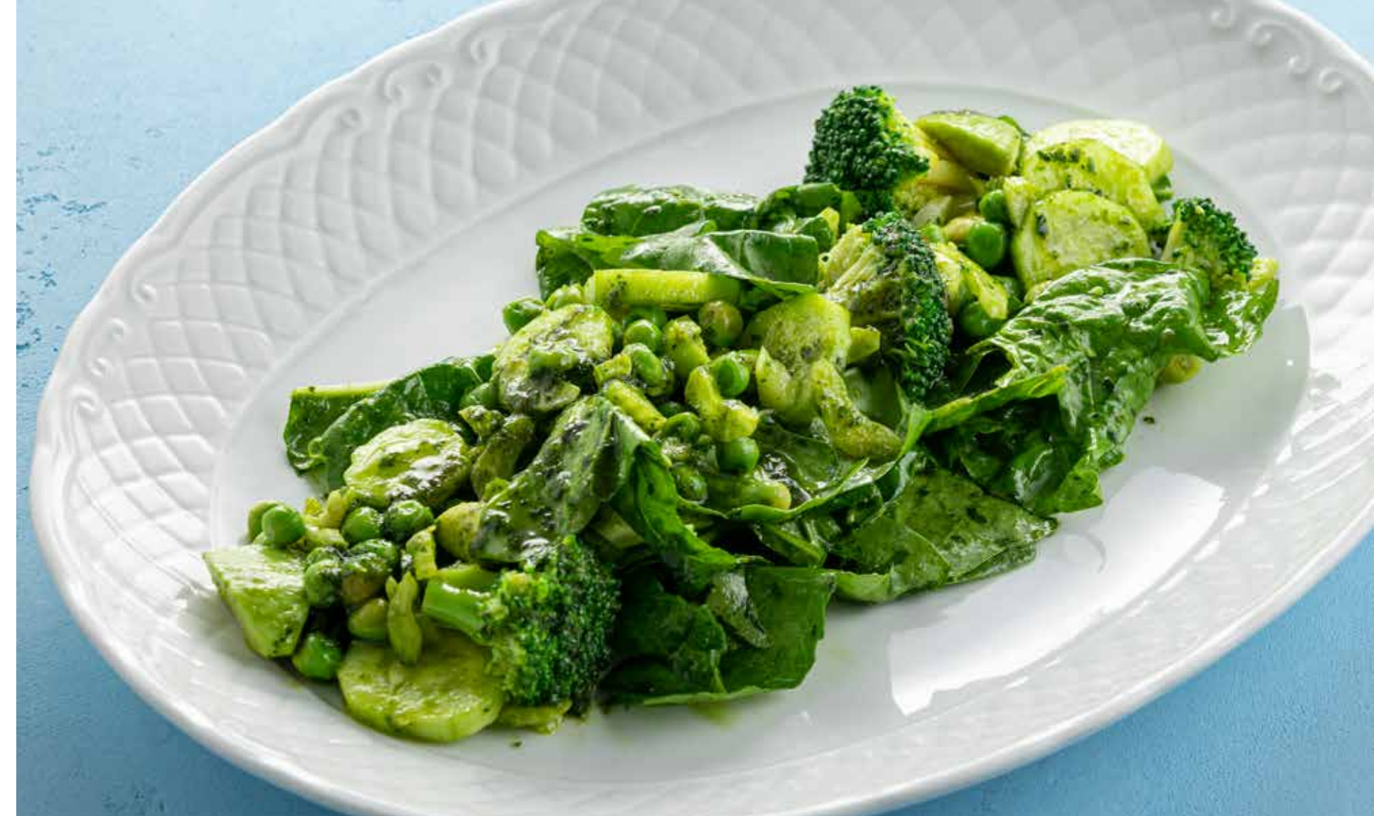
ЗЕЛЕНЫЙ САЛАТ Green salad