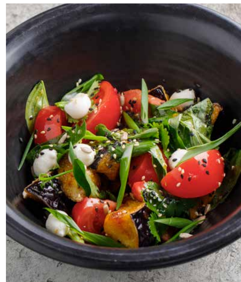
САЛАТ С БАКЛАЖАНАМИ И ФЕТОЙ Eggplant and feta salad