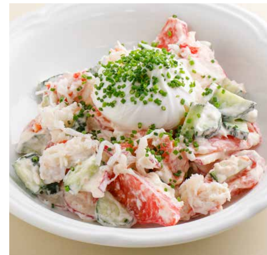
ОВОЩНОЙ САЛАТ С ЯЙЦОМ ПАШОТ, СМЕТАНОЙ И КРАБОМ Vegetable salad with poached egg, sour cream and crab