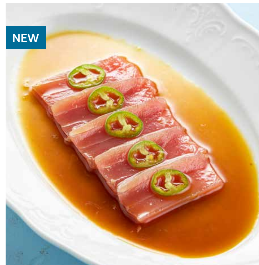
САШИМИ ИЗ ТУНЦА С СОУСОМ ЮДЗУ Tuna sashimi with yuzu dressing