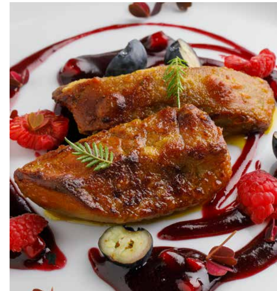
ФУА-ГРА С ЯГОДАМИ Foie gras with berries