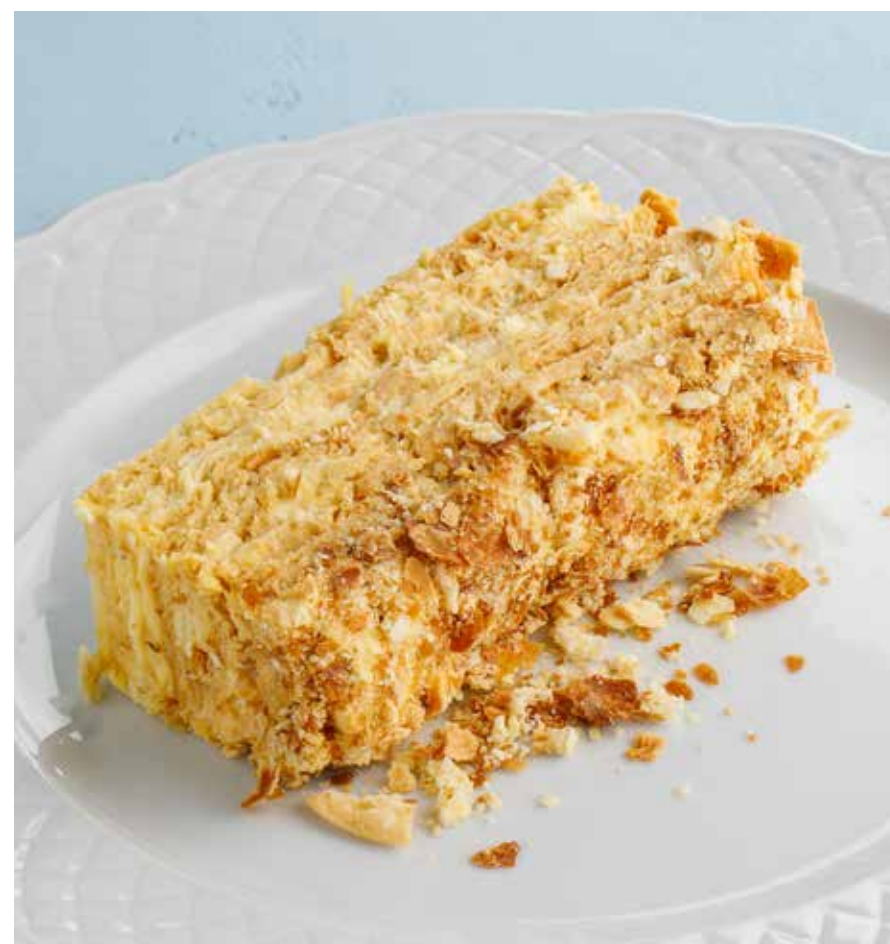
«НАПОЛЕОН» Napoleon cake