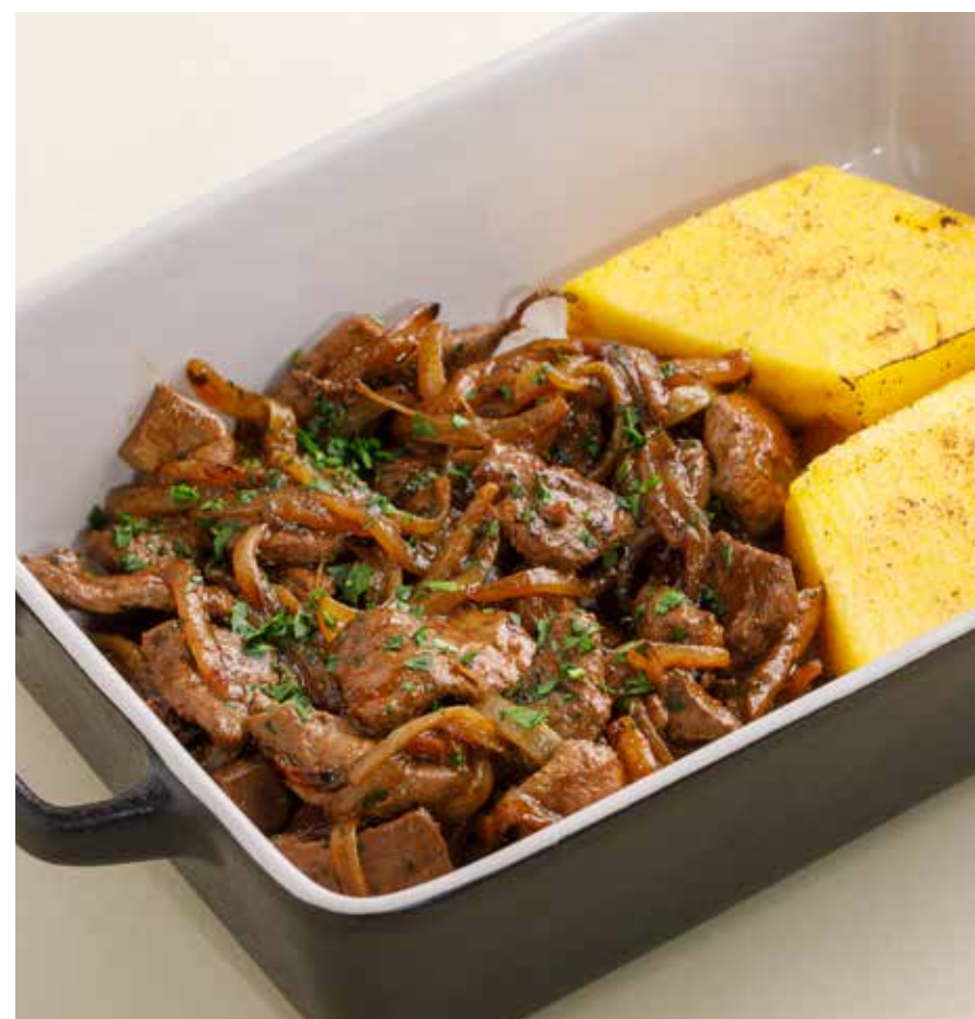
ПЕЧЕНЬ ПО-ВЕНЕЦИАНСКИ Venetian-style liver