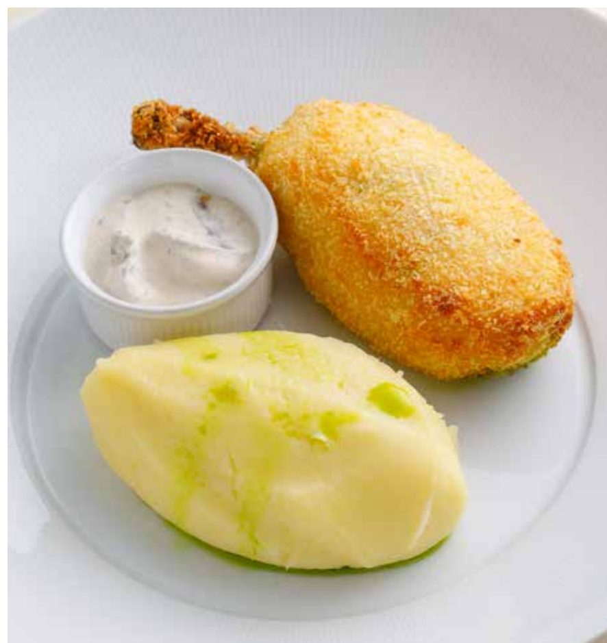
КОТЛЕТА ПО-КИЕВСКИ Chicken Kiev