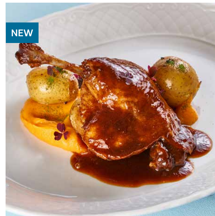
УТИНАЯ НОЖКА С КРЕМОМ ИЗ БАТАТА Duck leg with cream of sweet potato