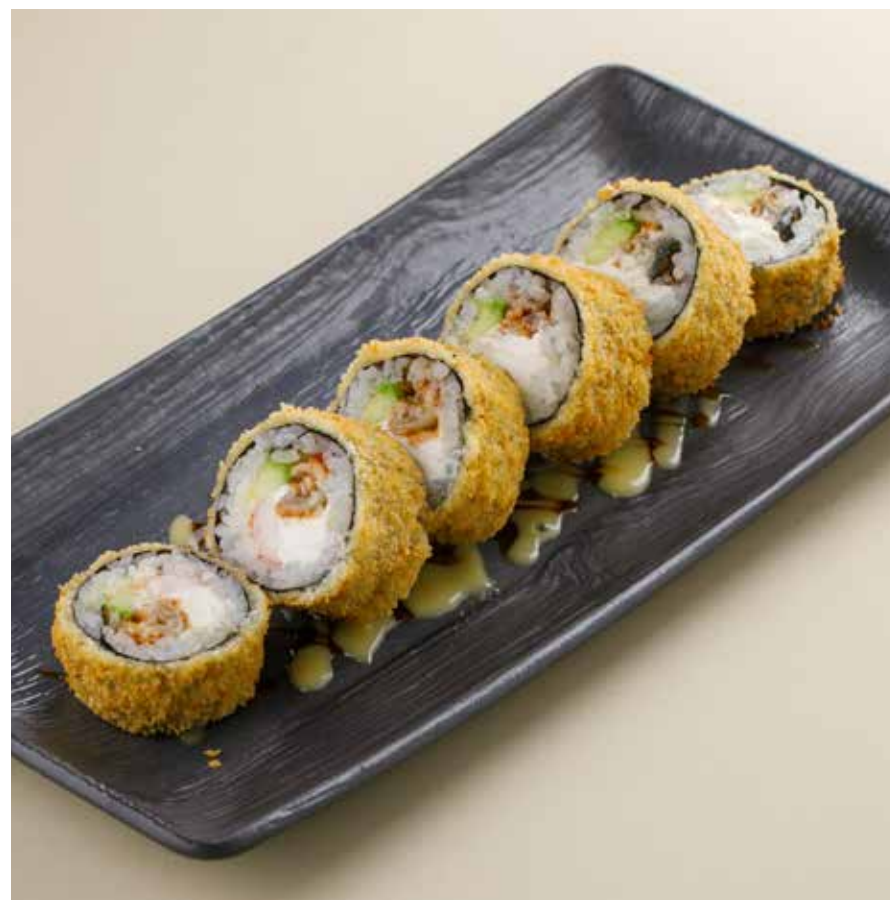
ТЕМПУРА С УГРЕМ / ГРЕБЕШКОМ Eel / scallop tempura