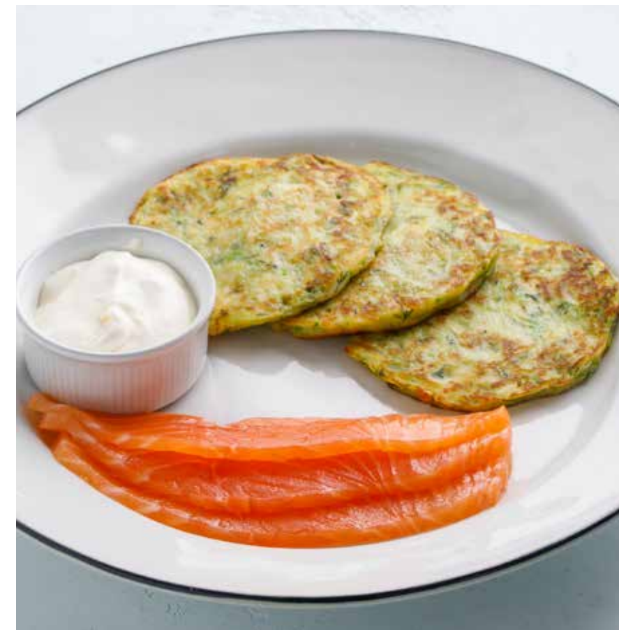
ОЛАДЬИ ИЗ ЦУКИНИ С ЛОСОСЕМ ШЕФ-ПОСОЛА Zucchini patties with chef-cured salmon