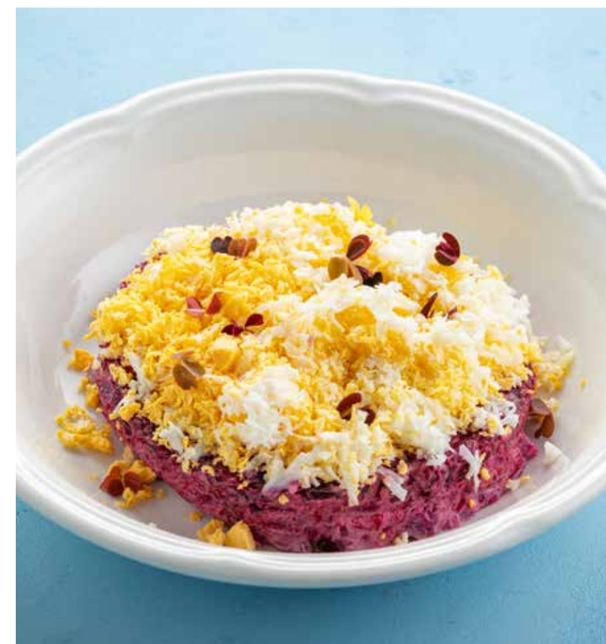
СЕЛЕДКА ПОД ШУБОЙ Russian dressed herring