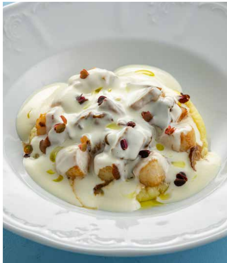
ГРЕБЕШКИ С БЕЛЫМИ ГРИБАМИ И ПАРМЕЗАНОМ Scallops with porcini mushrooms and Parmesan