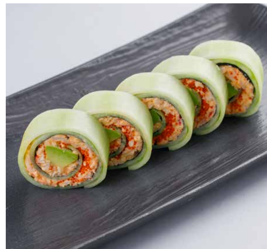
«ФИРМЕННЫЙ» С КРАБОМ / С ЛОСОСЕМ / С ТУНЦОМ / С УГРЕМ Signature roll with crab / salmon / tuna / eel