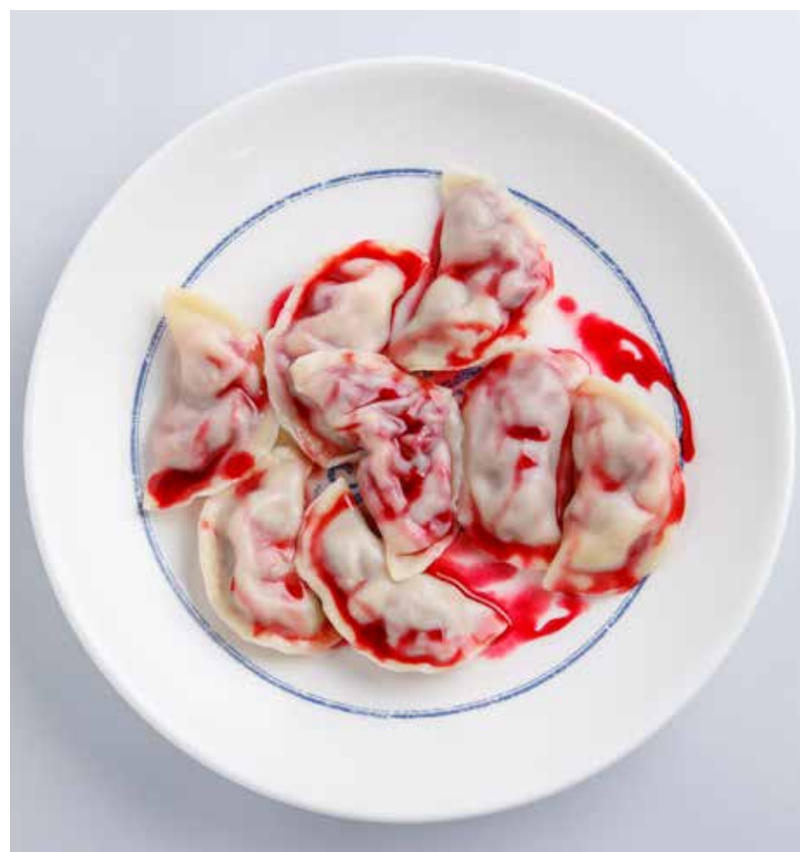
ВАРЕНИКИ С ВИШНЕЙ Vareniki stuffed with cherries