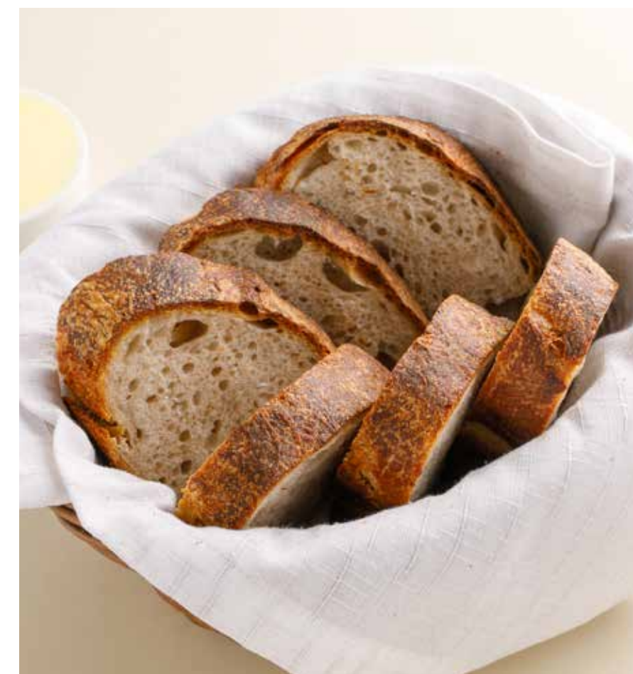
ХЛЕБНАЯ КОРЗИНА | 390 ₽ Bread basket