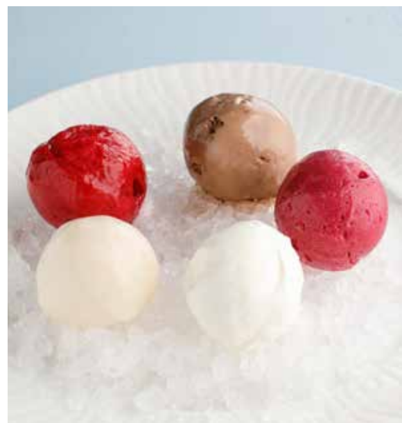
МОРОЖЕНОЕ ..... 190 ₺ ВАНИЛЬНОЕ / ШОКОЛАДНОЕ Ice cream (vanilla / chocolate)