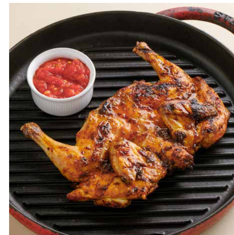
ЦЫПЛЕНОК КОРНИШОН С АДЖИКОЙ Cornichon chicken with adjika sauce