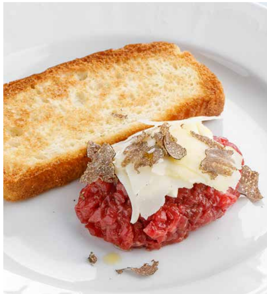
ТАРТАР ИЗ ГОВЯДИНЫ С ЧЕРНЫМ ТРЮФЕЛЕМ Beef tartare with black truffle