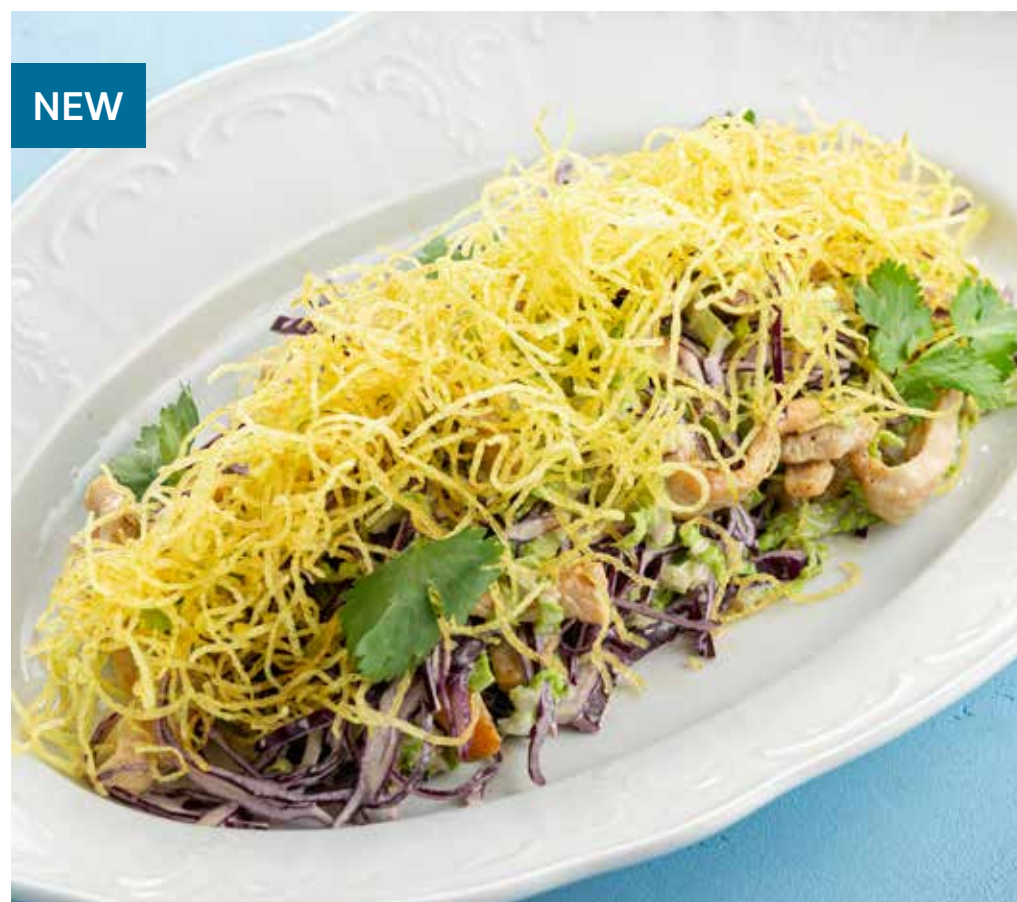
САЛАТ С КУРИНОЙ ГРУДКОЙ И КАРТОФЕЛЕМ ПАЙ Salad with chicken breast and pai potatoes