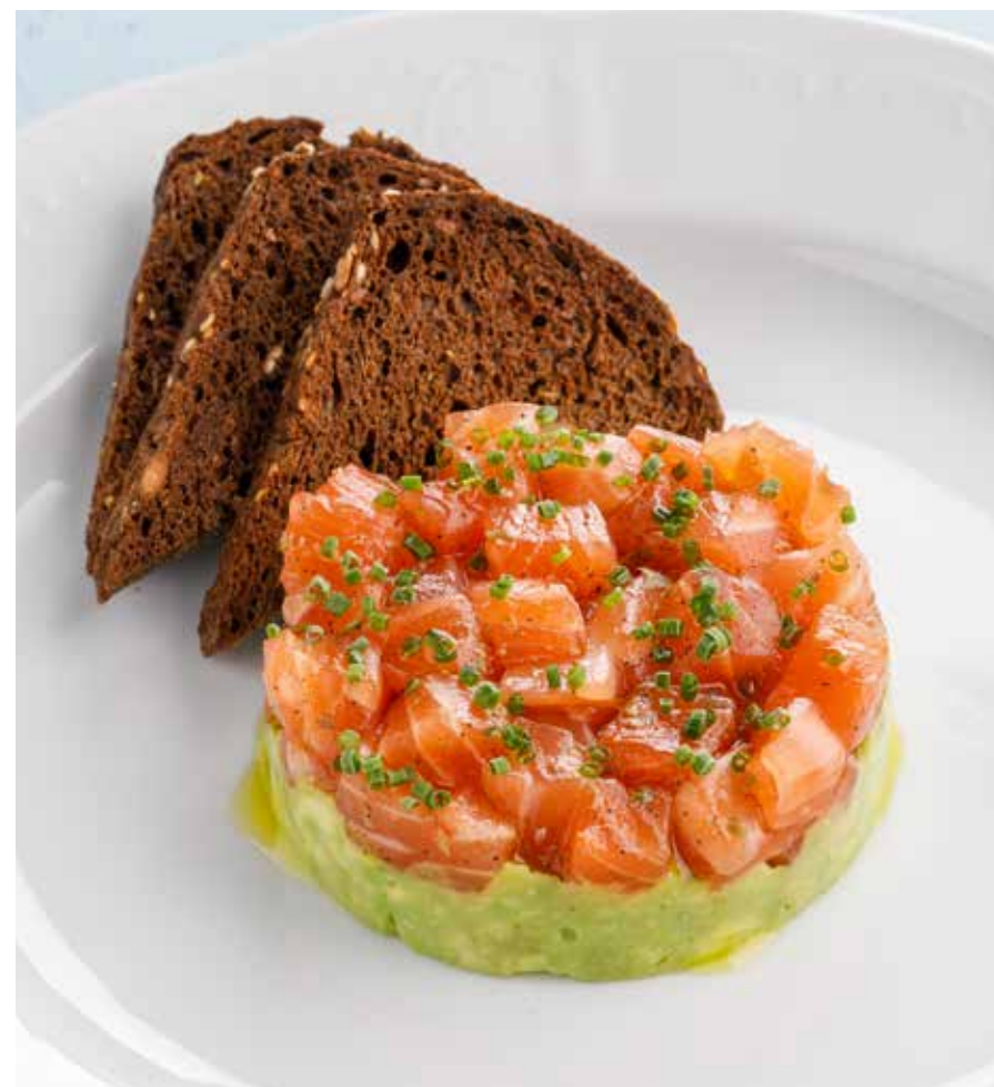
ТАРТАР ИЗ ЛОСОСЯ Salmon tartare