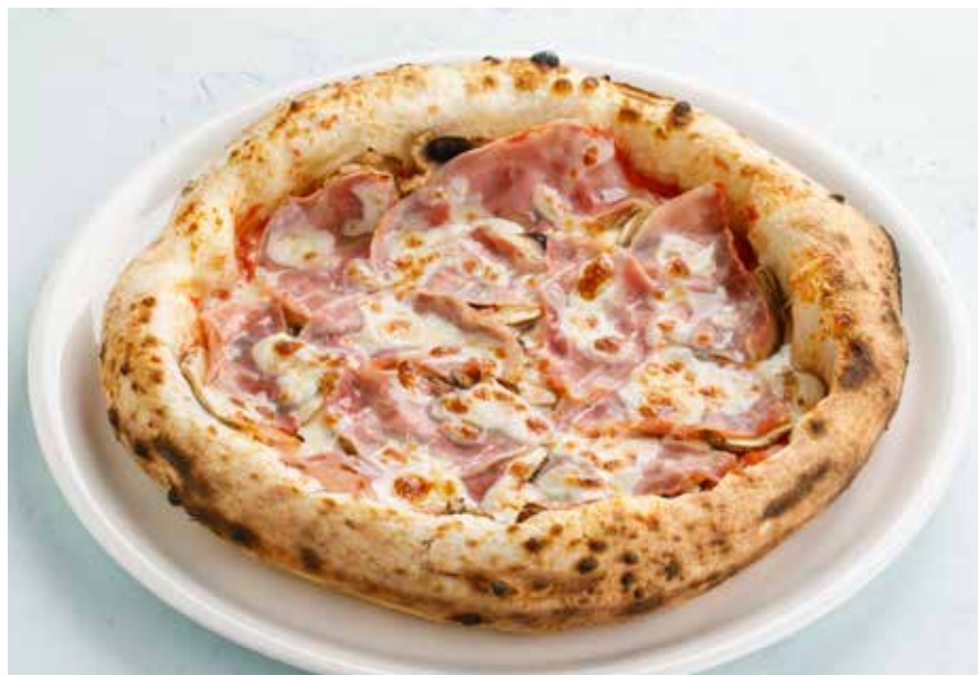
ПИЦЦА С ВЕТЧИНОЙ И ГРИБАМИ | 890 ₽ Ham and mushroom pizza