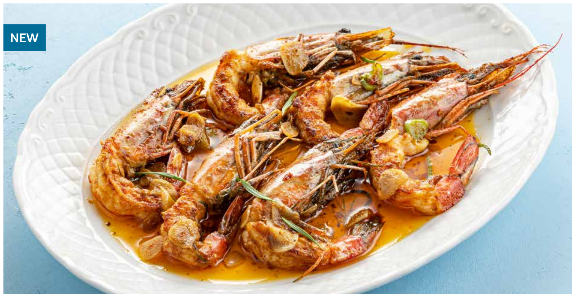
АРГЕНТИНСКИЕ КРЕВЕТКИ С ХАРИССОЙ Argentinian shrimps with harissa garlic