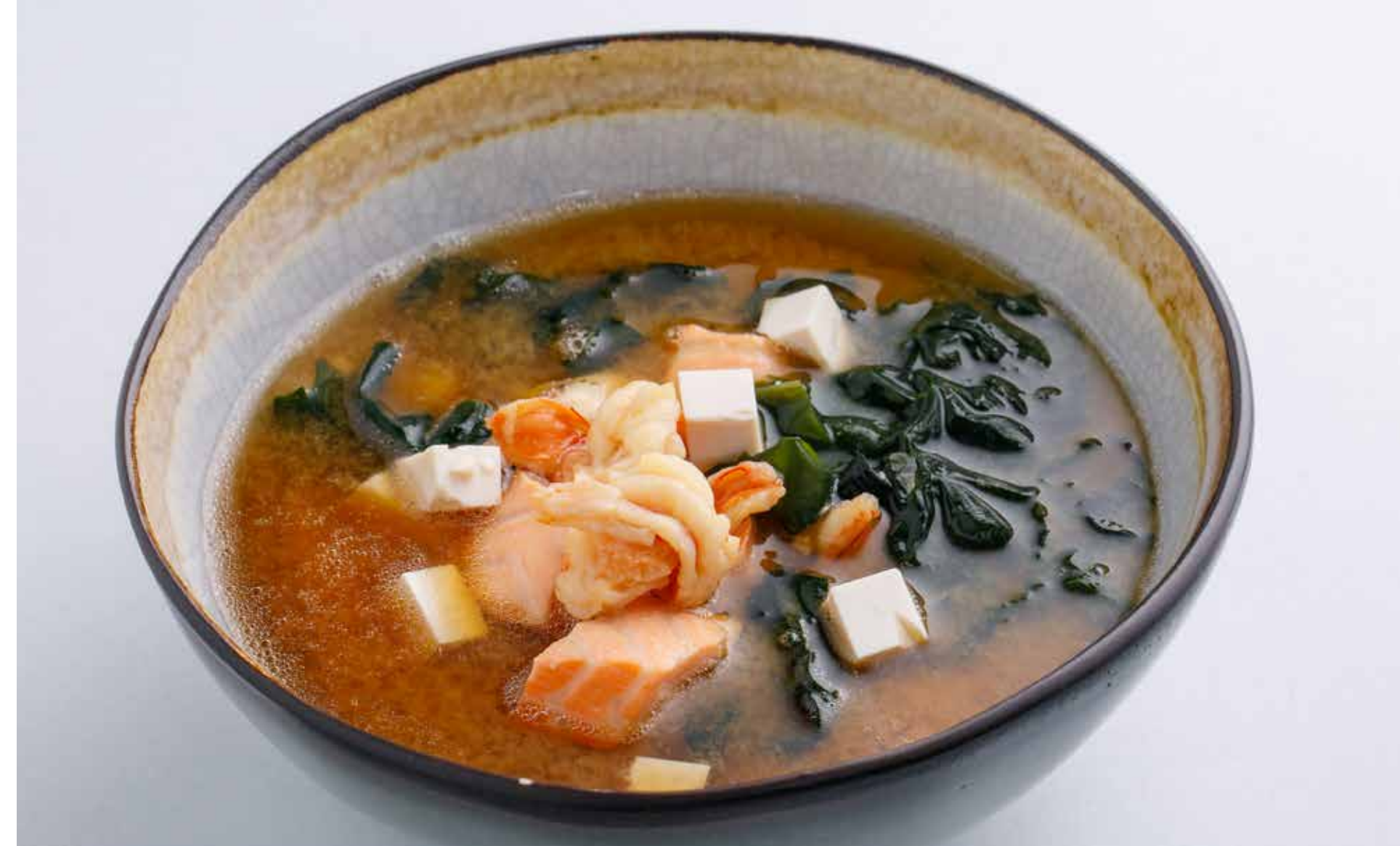
МИСО-СУП / С ШИИТАКЕ И СЫРОМ ТОФУ / С ЛОСОСЕМ И КРЕВЕТКАМИ Miso soup / miso soup with shiitake and tofu / miso soup with salmon and shrimp