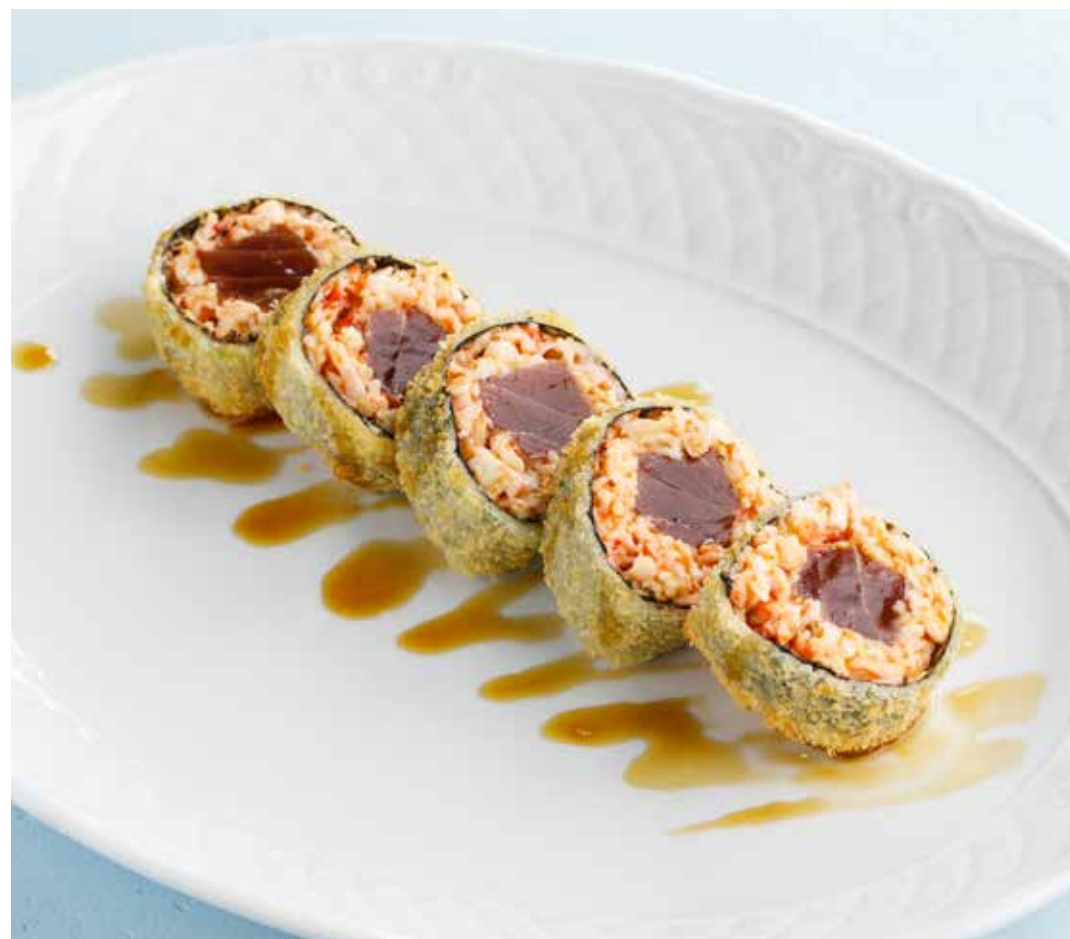
ТЕПЛЫЙ РОЛЛ С КРАБОМ И ТУНЦОМ Warm crab and tuna roll