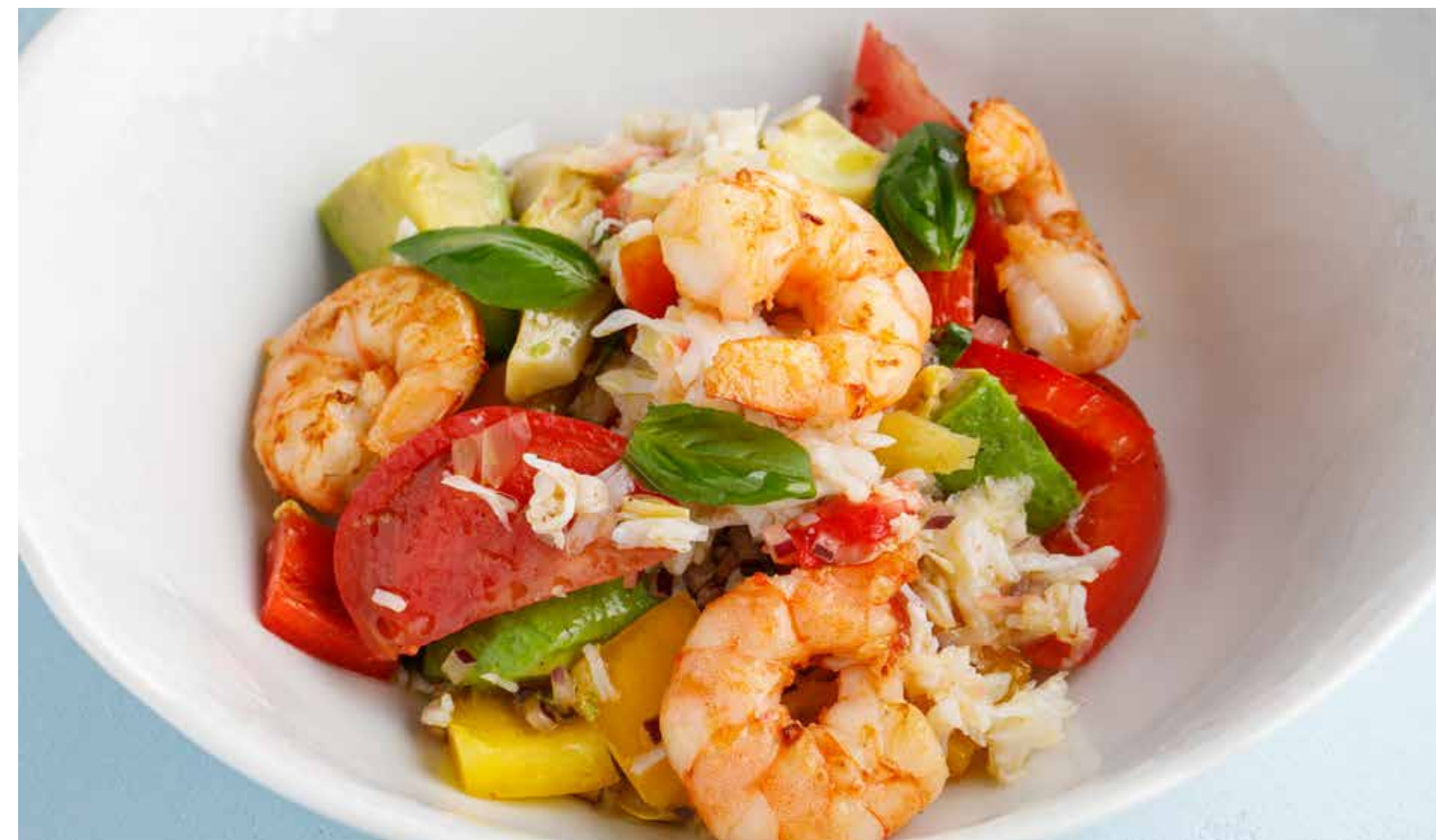
ОВОЩНОЙ САЛАТ С КРАБОМ И КРЕВЕТКАМИ Vegetable salad with crab and shrimp