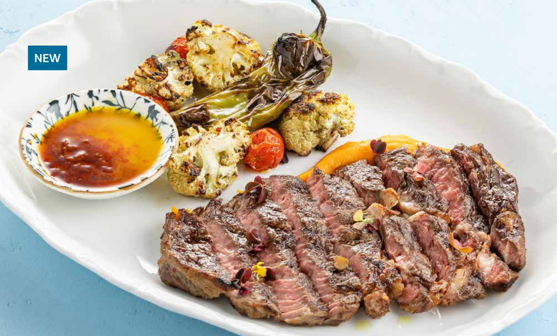
РИБАЙ В ПЕРУАНСКОМ СТИЛЕ Peruvian style ribeye