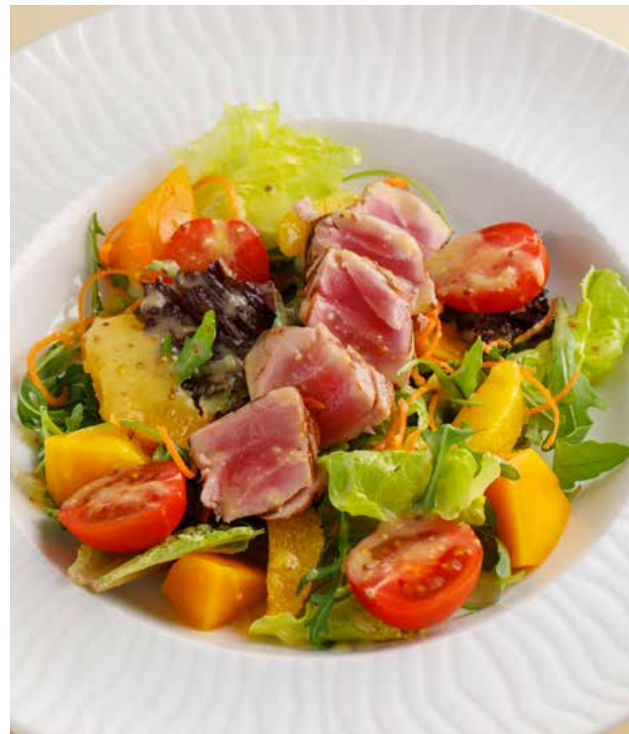
САЛАТ С МАНГО И ТУНЦОМ НА ГРИЛЕ Mango and grilled tuna salad