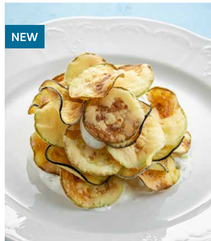
ФРИТТО МИСТО ИЗ ЦУКИНИ И БАКЛАЖАНА С СОУСОМ ДЗАДЗИКИ Zucchini and eggplant fritto misto with tzatziki sauce