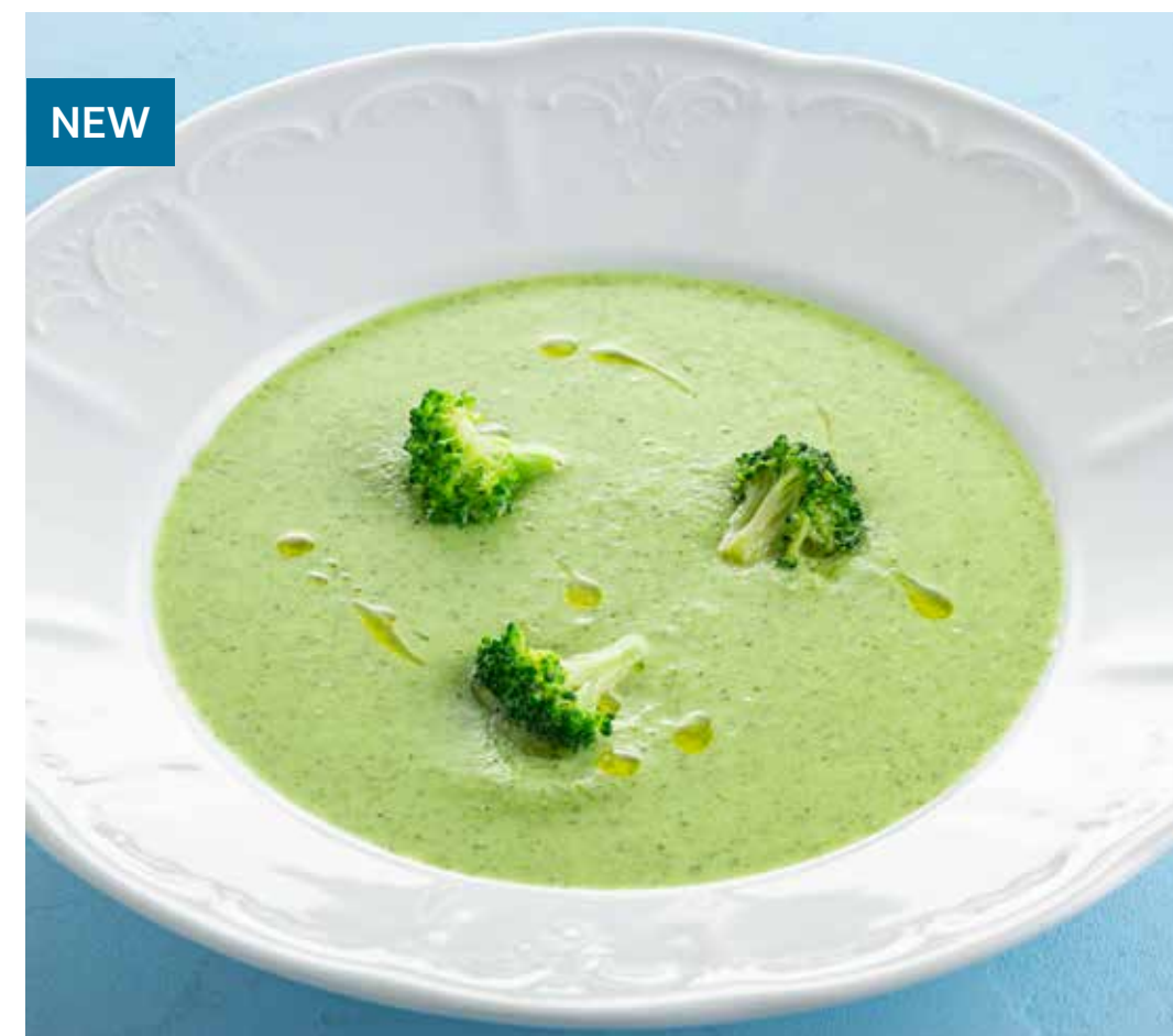
КРЕМ-СУП ИЗ БРОККОЛИ Broccoli cream soup