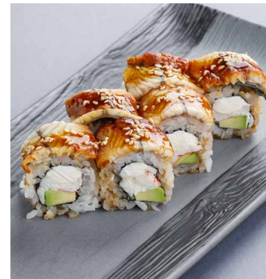
РОЛЛ С УГРЕМ И КРАБОМ Roll with eel and crab