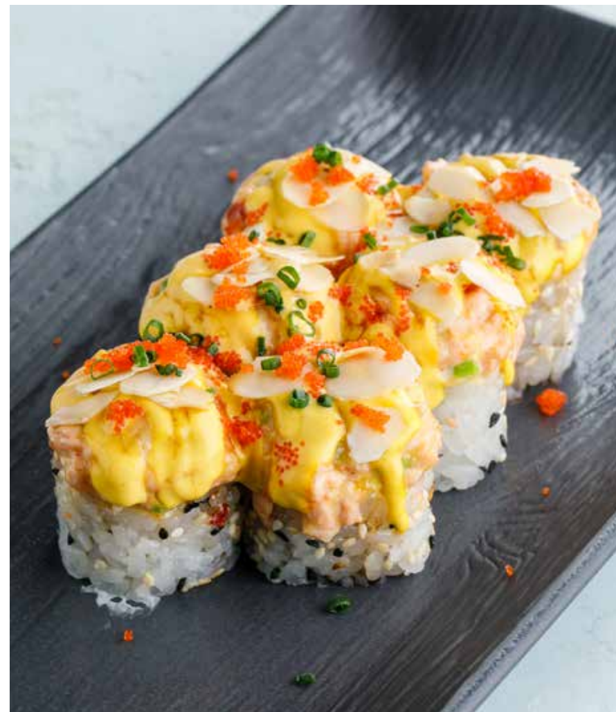
ЗАПЕЧЕННЫЙ РОЛЛ С ЛОСОСЕМ И МИНДАЛЕМ Baked roll with salmon and almonds