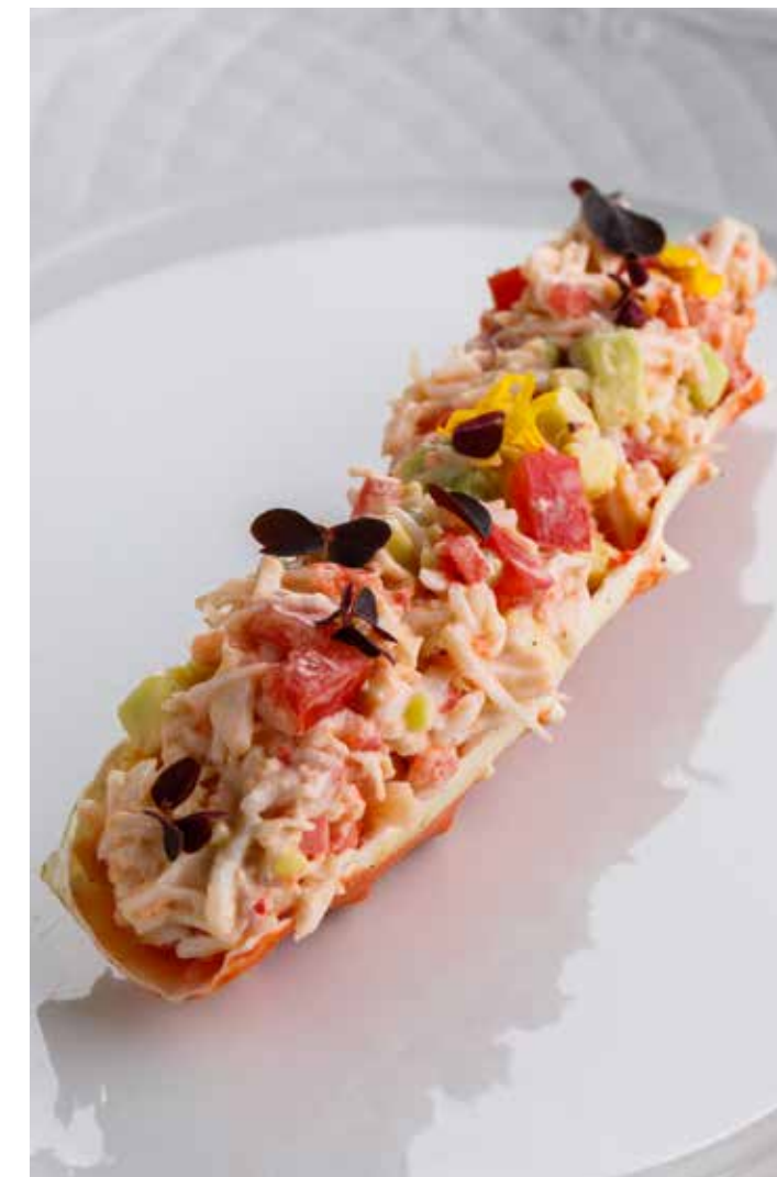
ТАРТАР ИЗ КРАБА Crab tartare