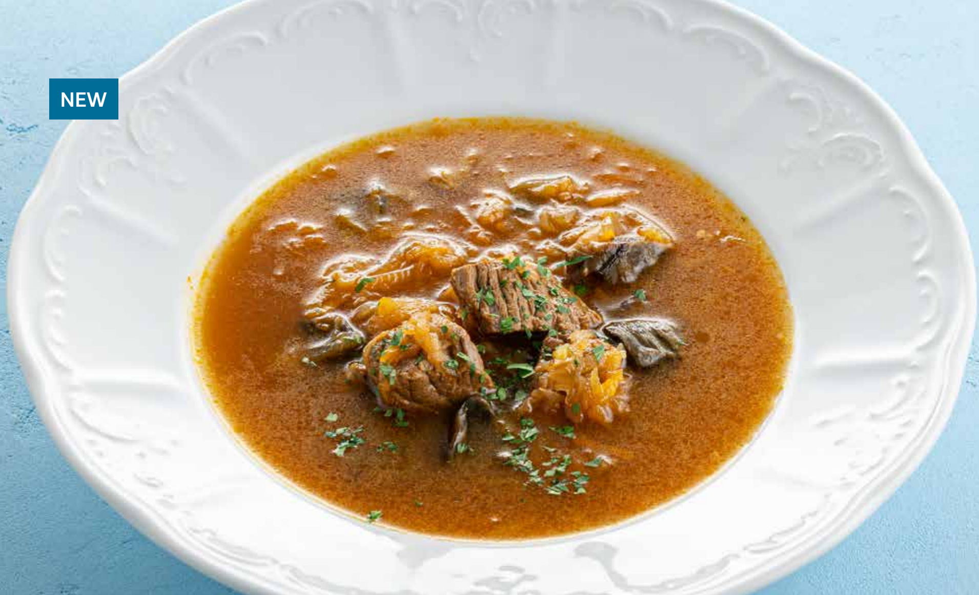
ЩИ ИЗ КВАШЕНОЙ КАПУСТЫ С ГРИБАМИ Sauerkraut soup with mushrooms