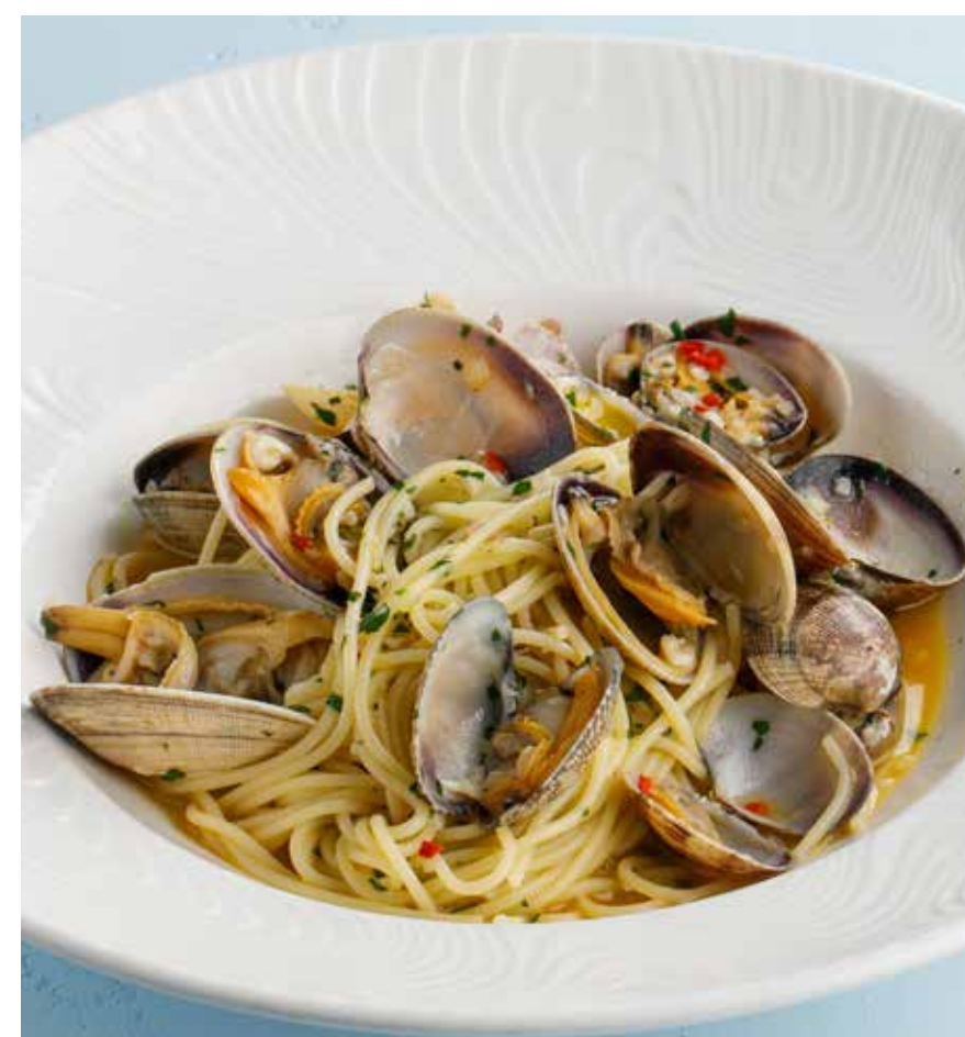
ПАСТА С ВОНГОЛЕ Pasta alle vongole