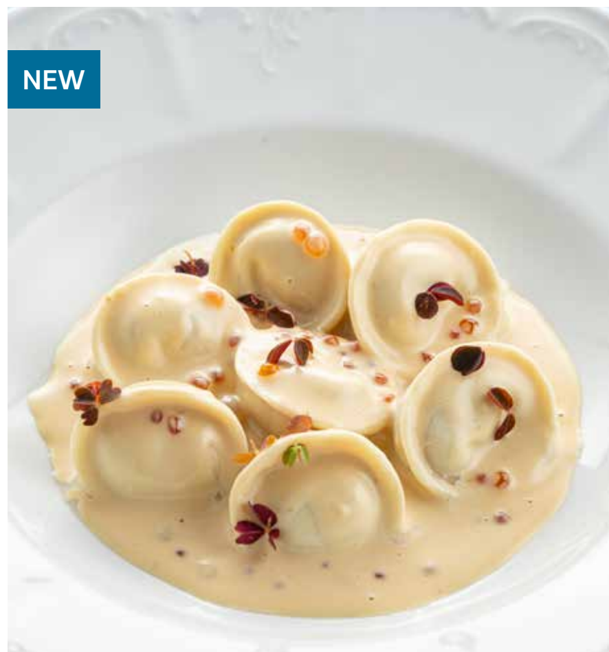
ПЕЛЬМЕНИ ИЗ ЛОСОСЯ И ТРЕСКИ С СОУСОМ ИЗ ТОПЛЕНОГО МОЛОКА Salmon and cod dumplings with baked milk sauce