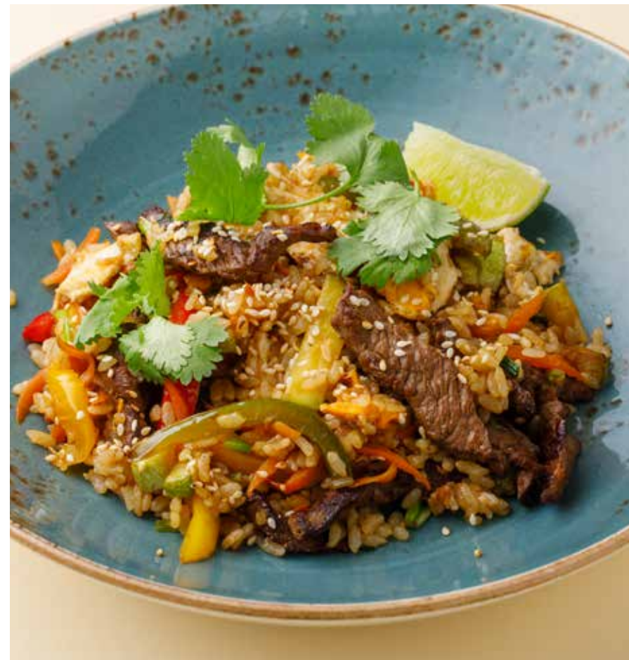
РИС С ГОВЯДИНОЙ И ЯЙЦОМ Rice with beef and egg