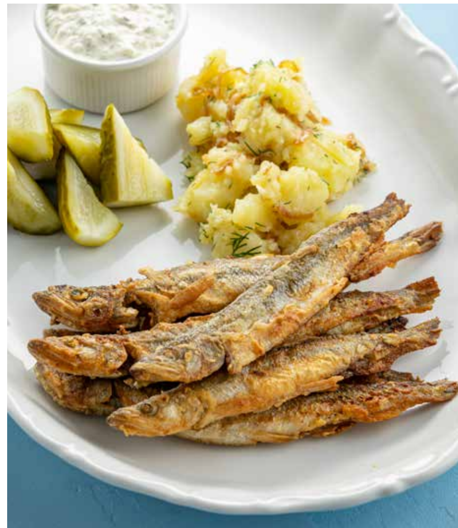
КОРЮШКА, ЖАРЕННАЯ ПО-ДОМАШНЕМУ Homemade fried smelt