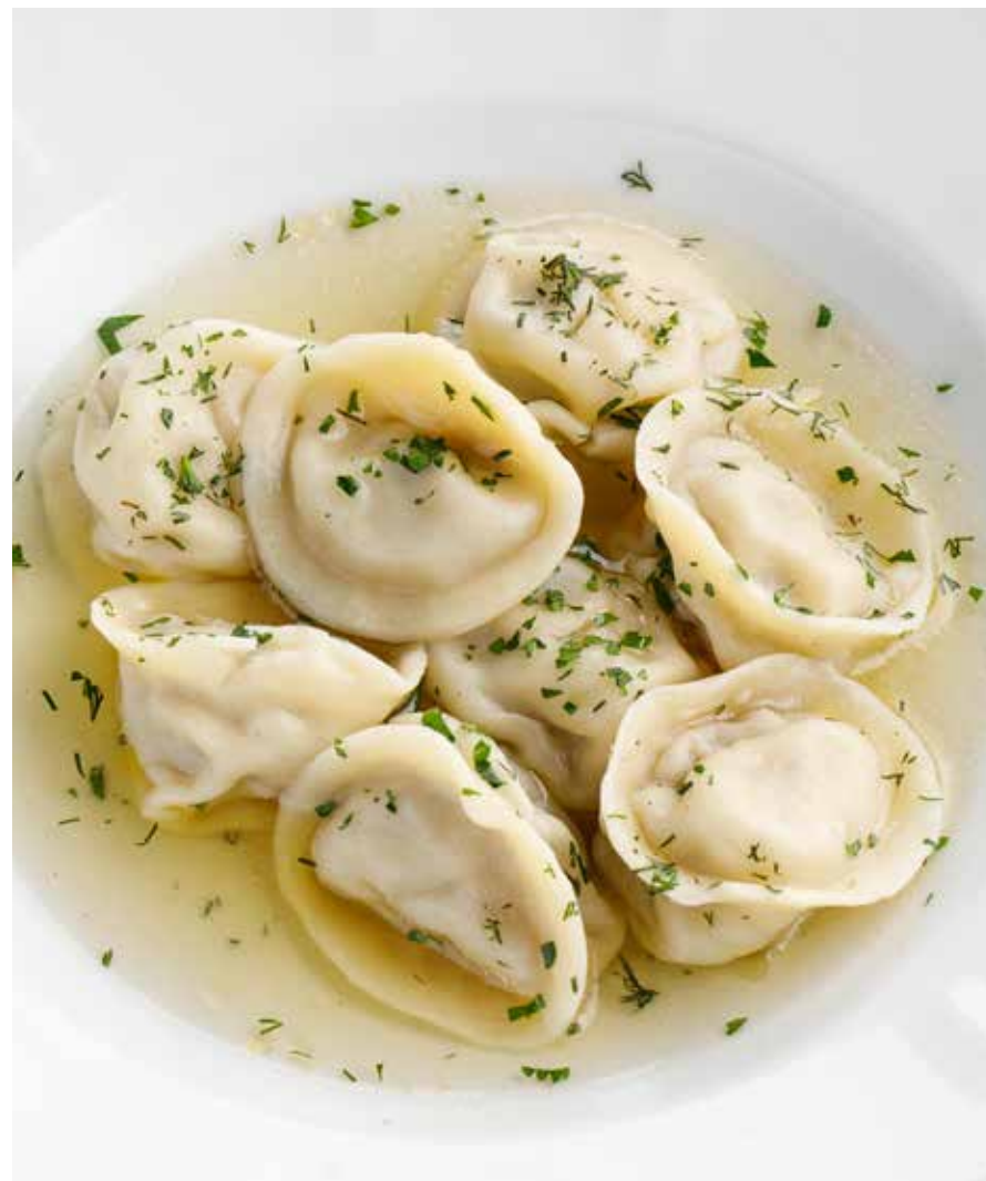
ПЕЛЬМЕНИ СИБИРСКИЕ Siberian pelmeni