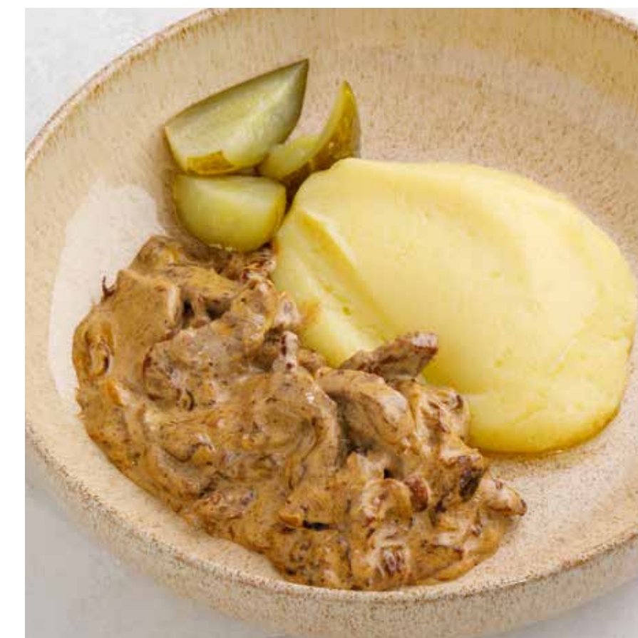
БЕФСТРОГАНОВ С БЕЛЫМИ ГРИБАМИ Beef stroganoff with porcini mushrooms