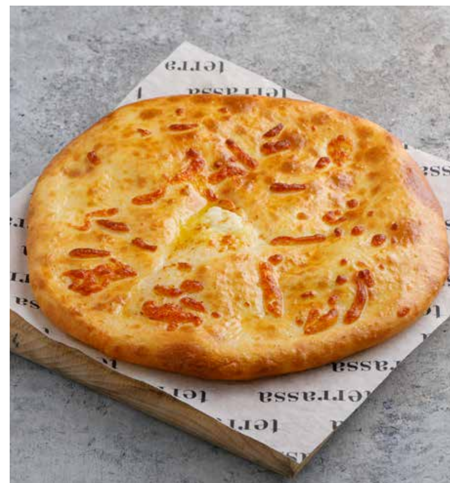
ХАЧАПУРИ ПО-ИМЕРЕТИНСКИ | 690 ₽ Imeretian-style khachapuri