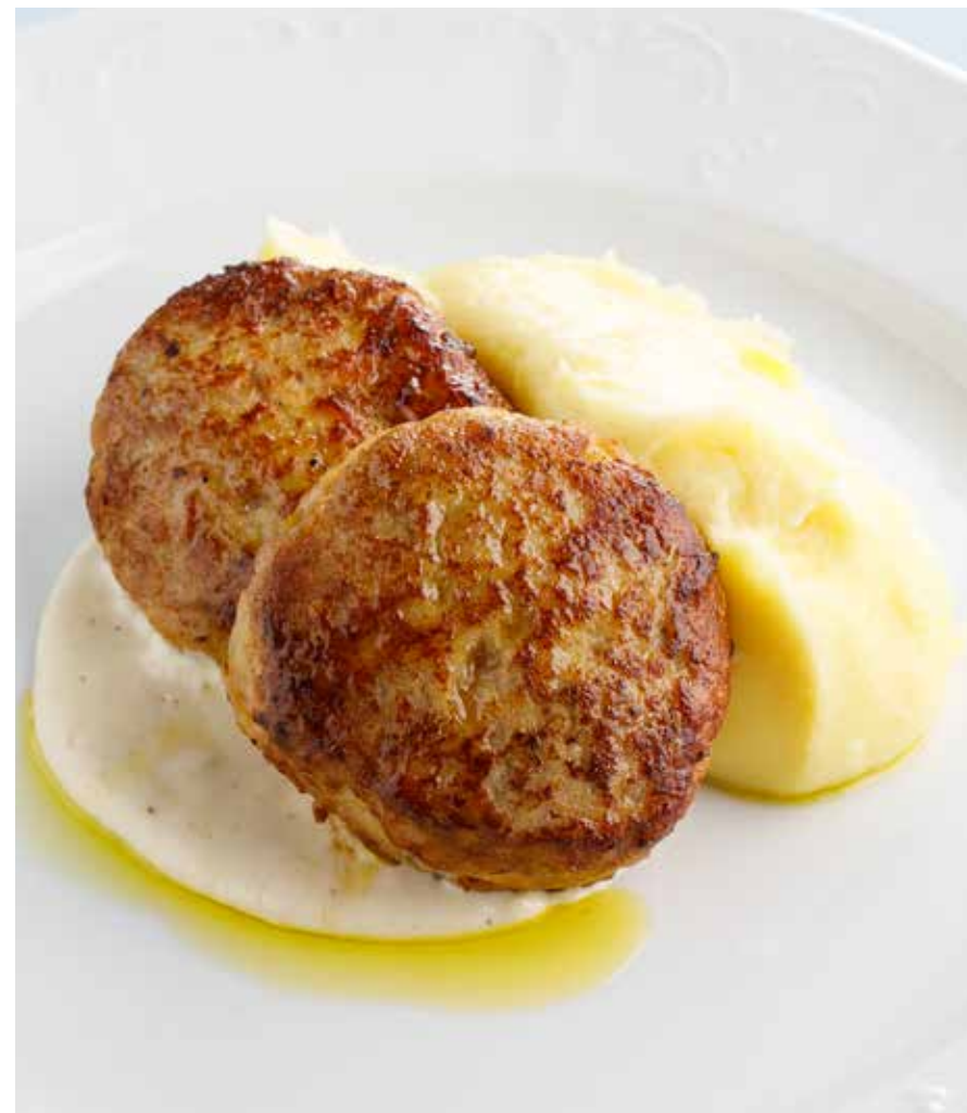
КУРИНЫЕ КОТЛЕТЫ СО СЛИВОЧНЫМ СОУСОМ Chicken cutlets with creamy sauce