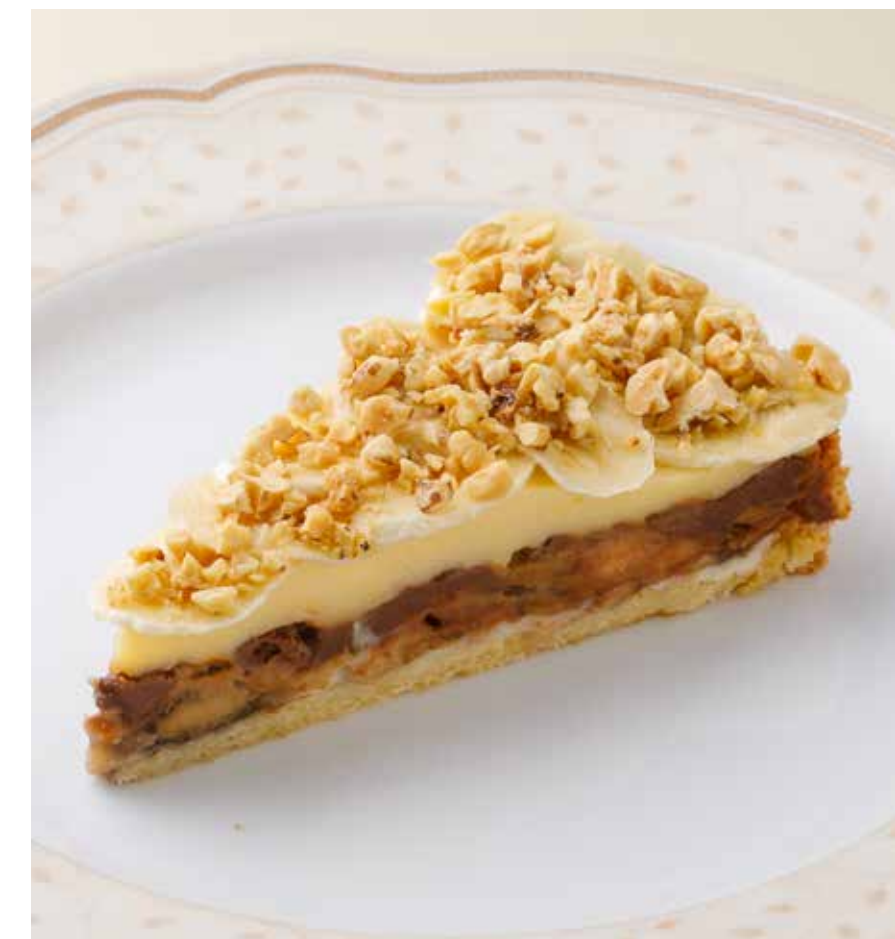
БАНАНОВЫЙ ТОРТ Banana cake