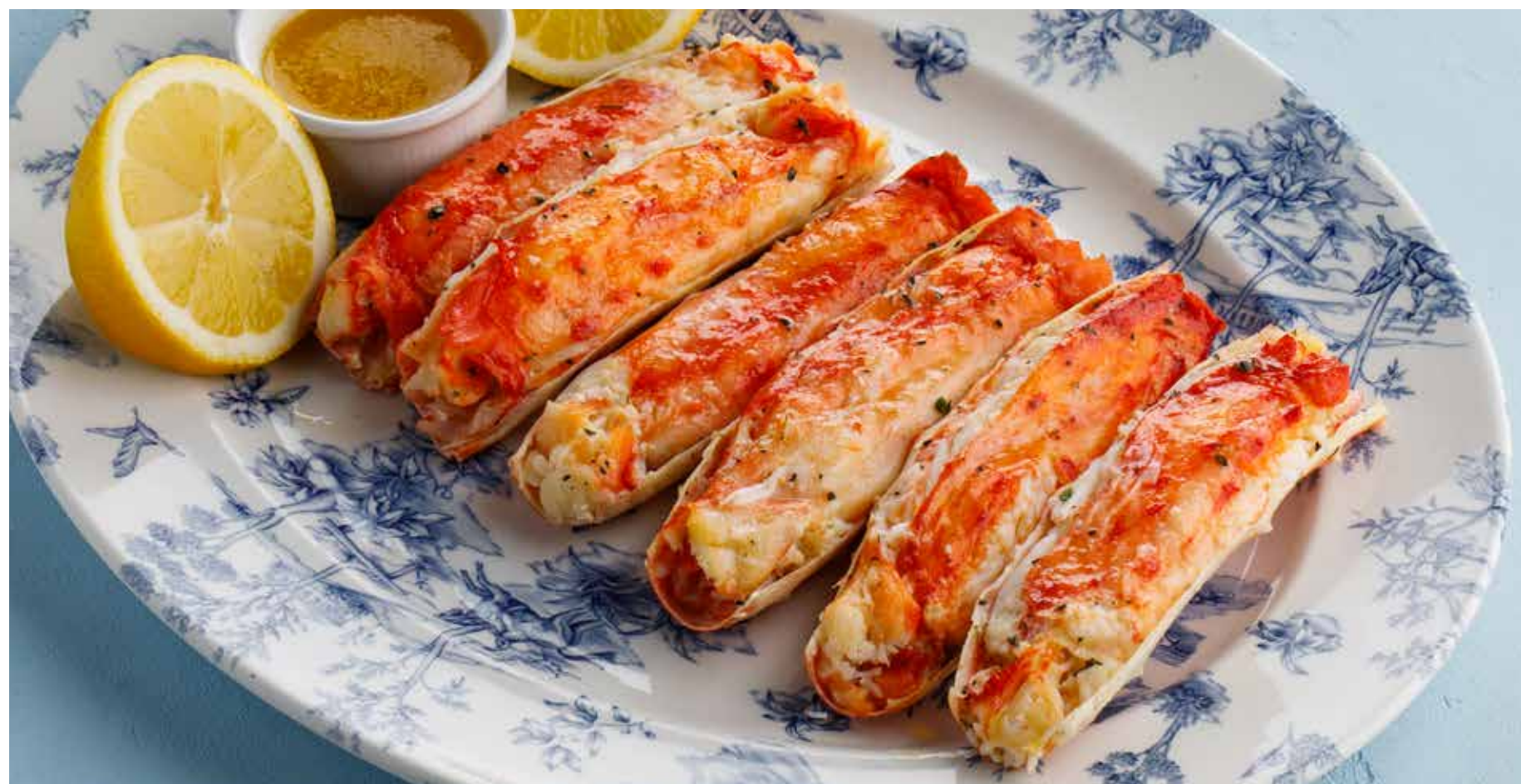
ЗАПЕЧЕННЫЕ ФАЛАНГИ КАМЧАТСКОГО КРАБА 2 шт. / 6 шт. Baked Kamchatka crab phalanx (2 pcs / 6 pcs)