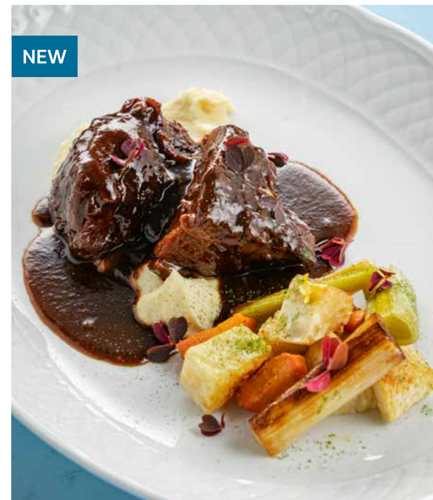
ТЕЛЯЧЬИ ЩЕКИ С ПЕЧеныМИ ОВОЩАМИ Veal cheeks with baked vegetables