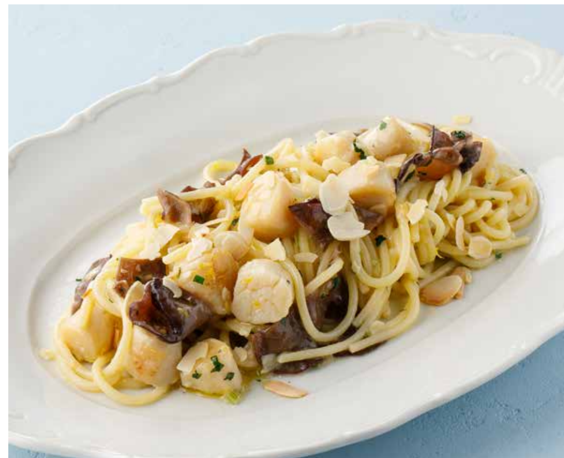
ПАСТА С ГРЕБЕШКАМИ И МИНДАЛЕМ Scallop pasta with almonds