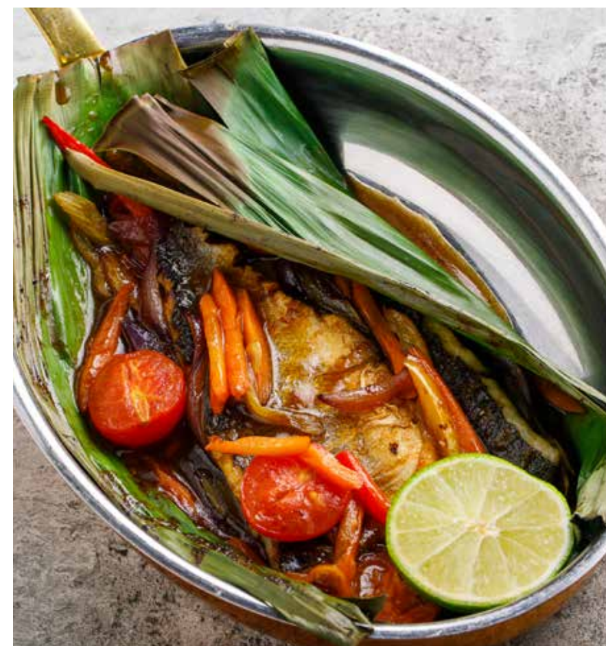
СИБАС В БАНАНОВОМ ЛИСТЕ Banana leaf wrapped sea bass