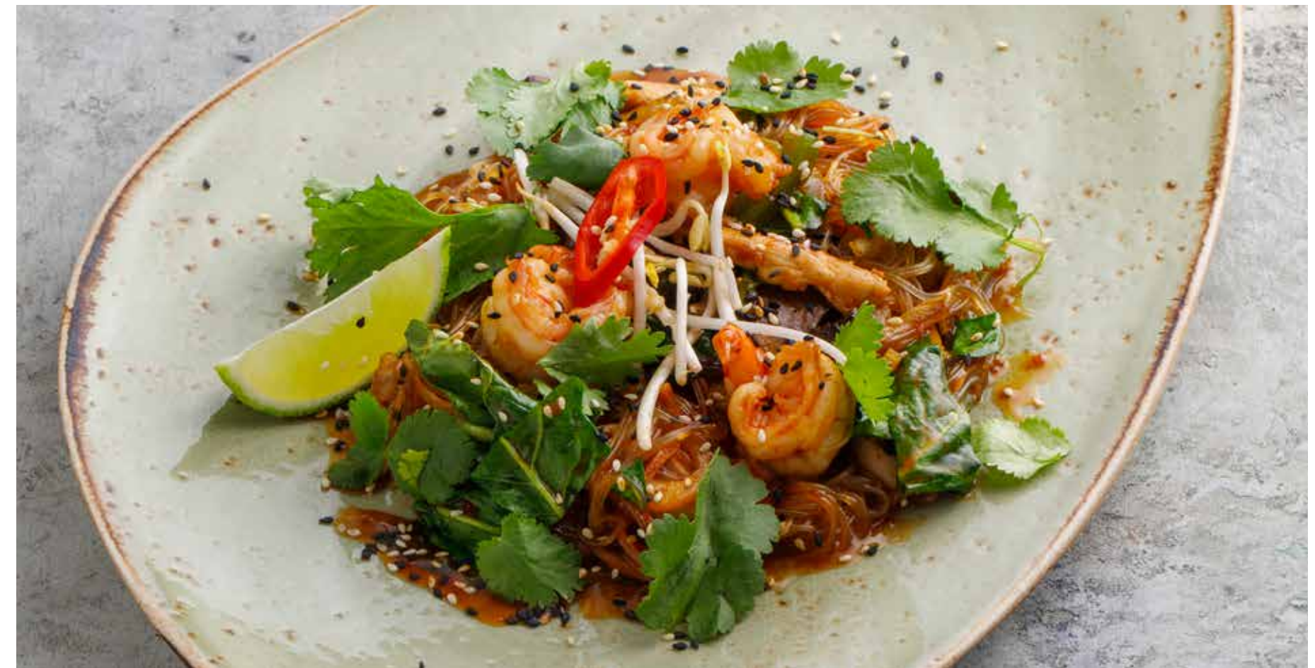
ПАД-ТАЙ С КУРИЦЕЙ И КРЕВЕТКАМИ Chicken and shrimp pad thai