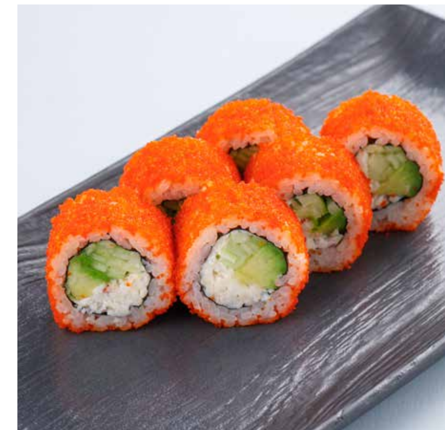
«КАЛИФОРНИЯ» С КРАБОМ / С ЛОСОСЕМ / С УГРЕМ California roll with crab / salmon / eel