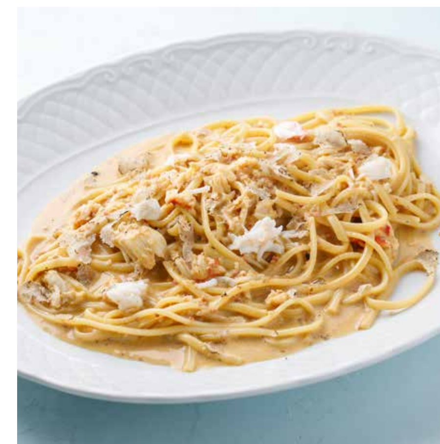
«КРАБОНАРА» С ЧЕРНЫМ ТРЮФЕЛЕМ Crabonara with black truffle