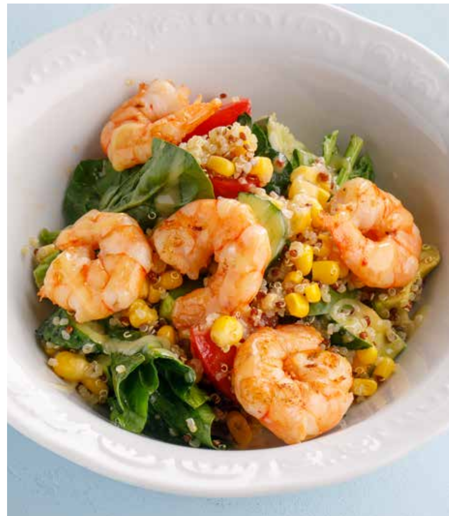
САЛАТ С КИНОА, КРЕВЕТКАМИ И КУКУРУЗОЙ Salad with quinoa, shrimps and corn