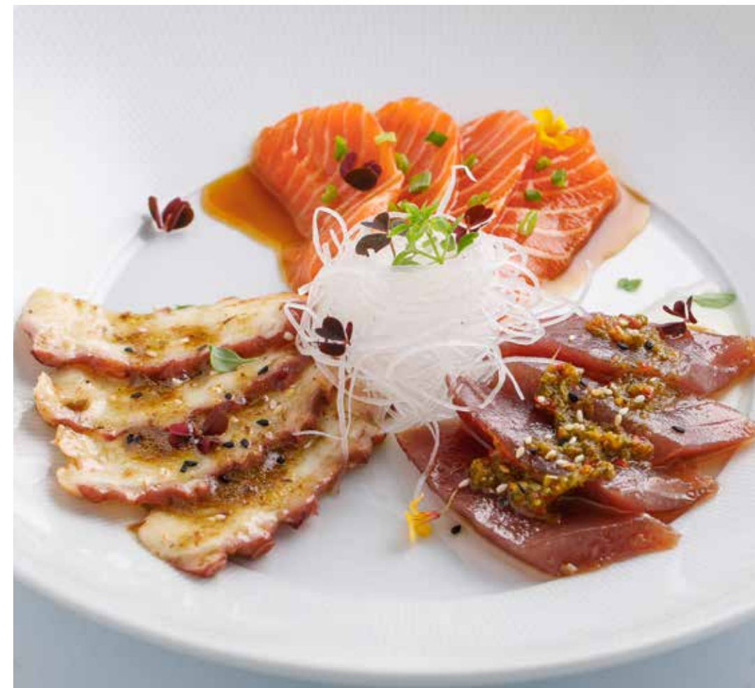
САШИМИ ИЗ ЛОСОСЯ / ЖЕЛТОХВОСТОГО ТУНЦА / ОСЬМИНОГА Salmon / yellowfin tuna / octopus sashimi