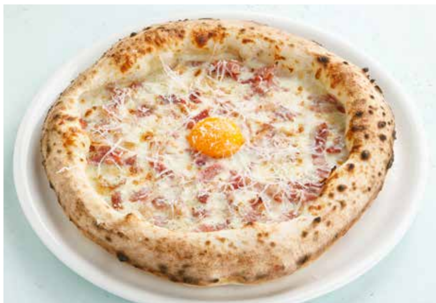
ПИЦЦА «КАРБОНАРА» | 790 ₽ Carbonara pizza