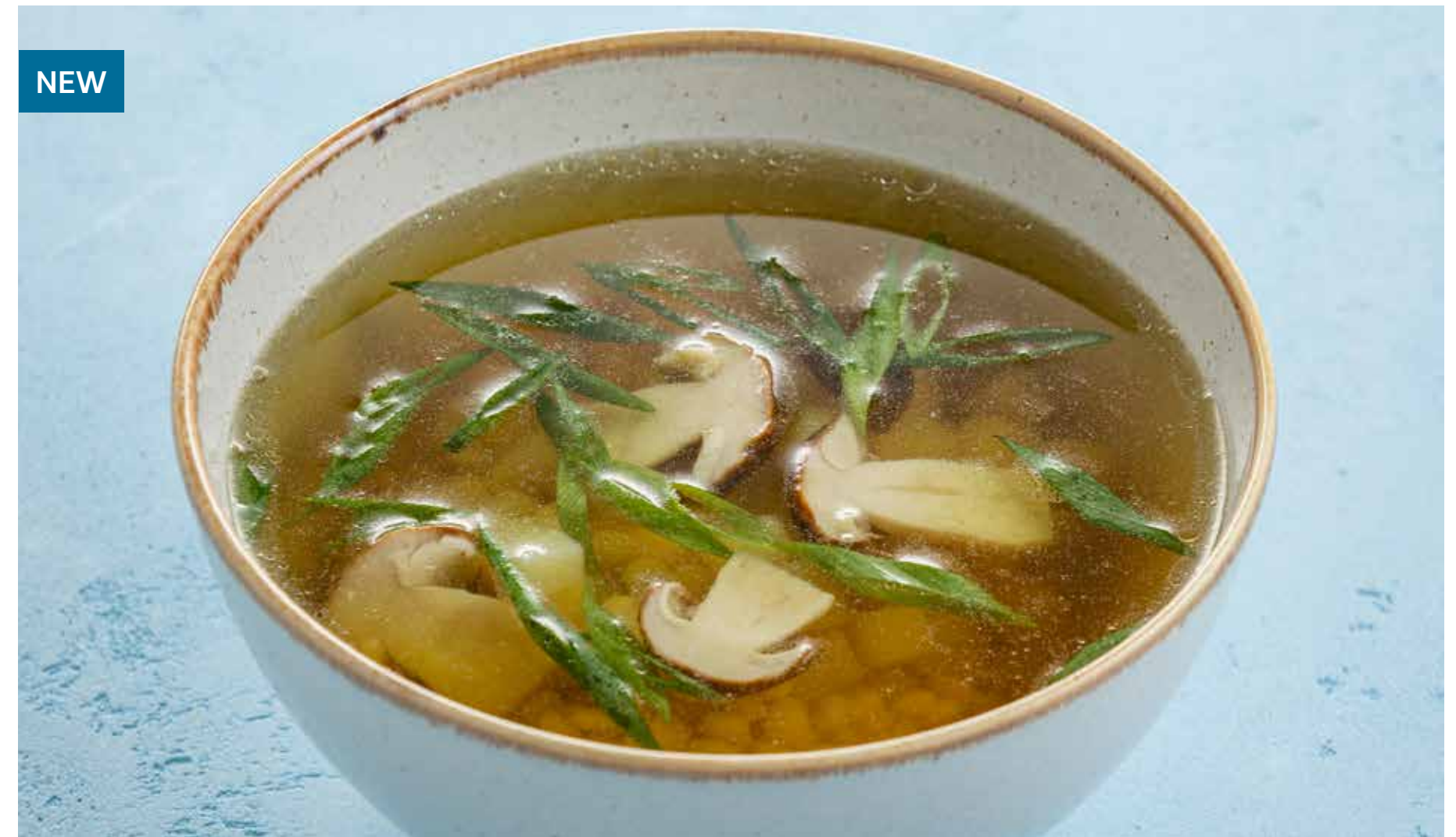
СУП ИЗ БЕЛЫХ ГРИБОВ Porcini mushroom soup