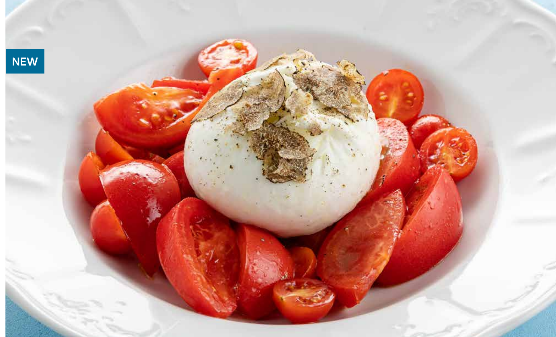
БУРРАТА С ТОМАТАМИ И ЧЕРНЫМ ТРЮФЕЛЕМ Burrata with tomatoes and black truffle (150 g)