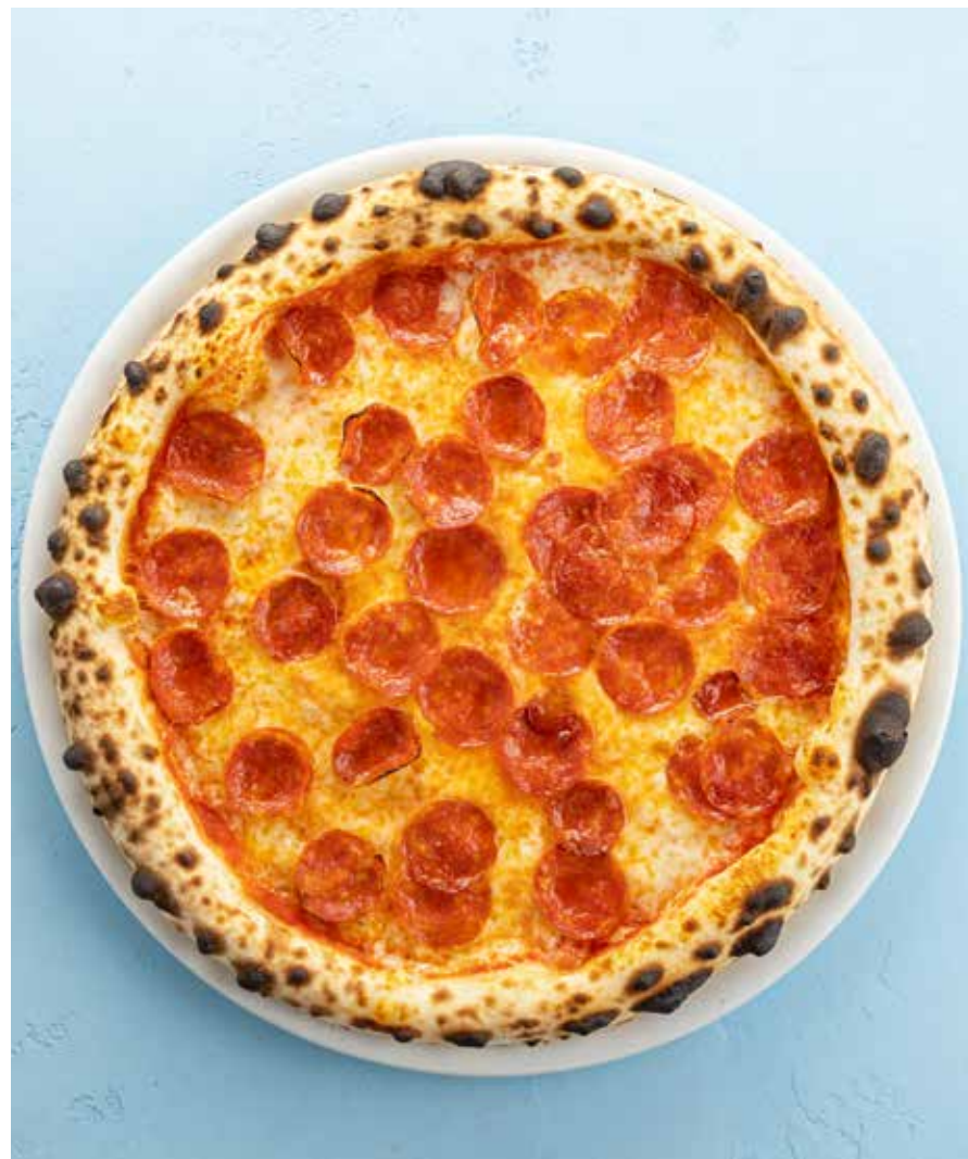
ПИЦЦА С САЛЯМИ ПЕПЕРОНИ | 890 ₽ Pepperoni salami pizza