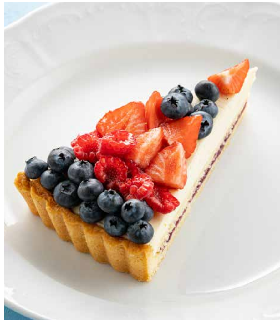
ЯГОДНЫЙ ТОРТ С ЗАВАРНЫМ КРЕМОМ Berry cake with custard