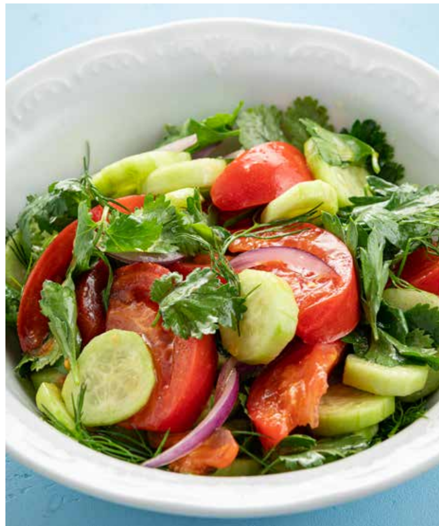
САЛАТ ИЗ СВЕЖИХ ОВОЩЕЙ Salad with fresh vegetables