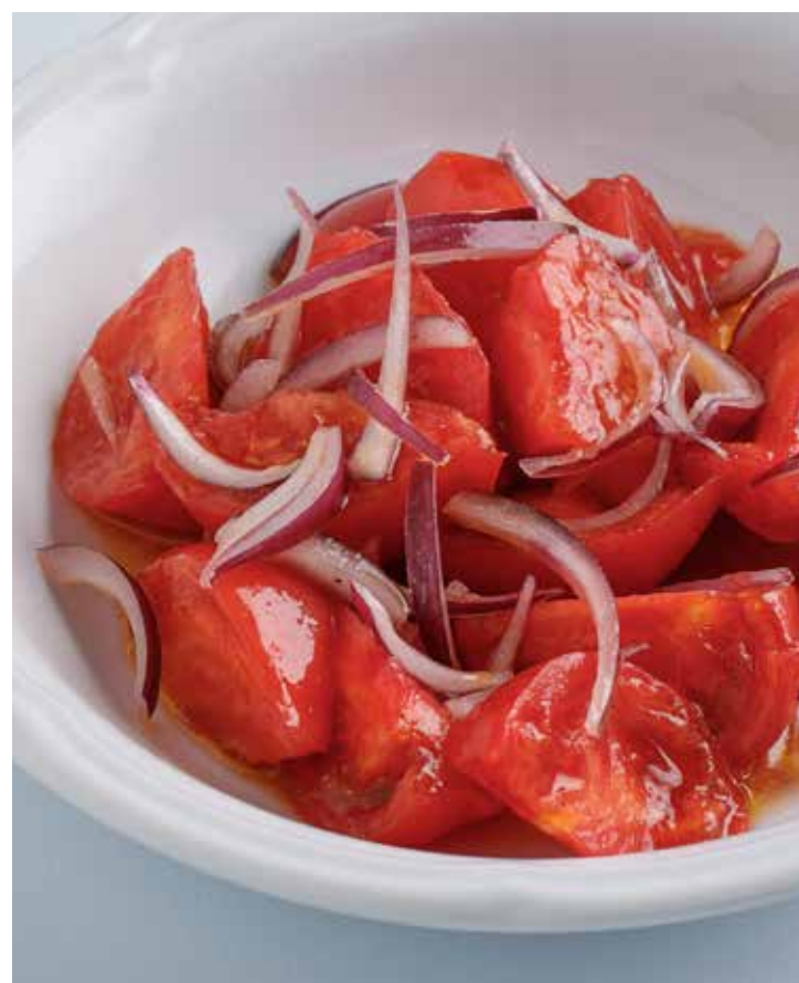
САЛАТ ИЗ ТОМАТОВ С ЯЛТИНСКИМ ЛУКОМ Tomato salad with Yalta onion