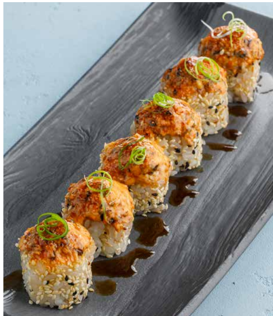
ЗАПЕЧЕННЫЙ РОЛЛ С МИДИЯМИ Baked mussel roll