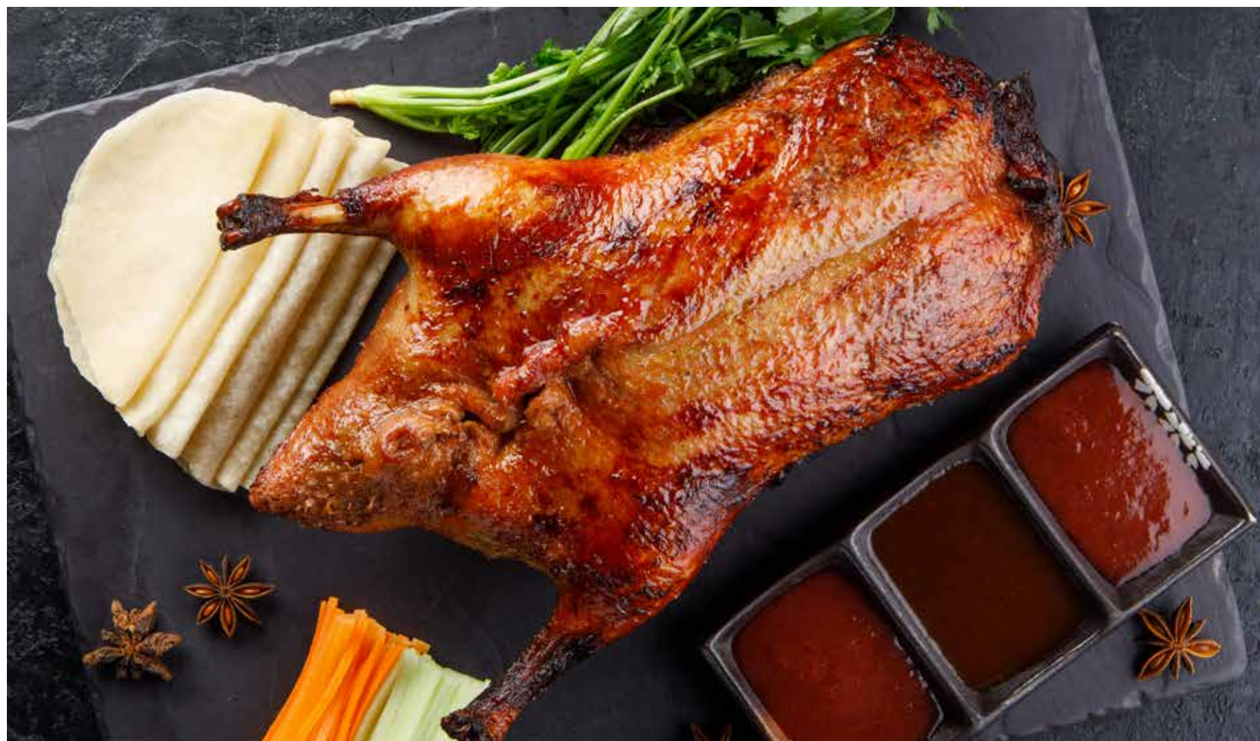
УТКА ПО-КИТАЙСКИ половина / целая Chinese roast duck (one half / full)