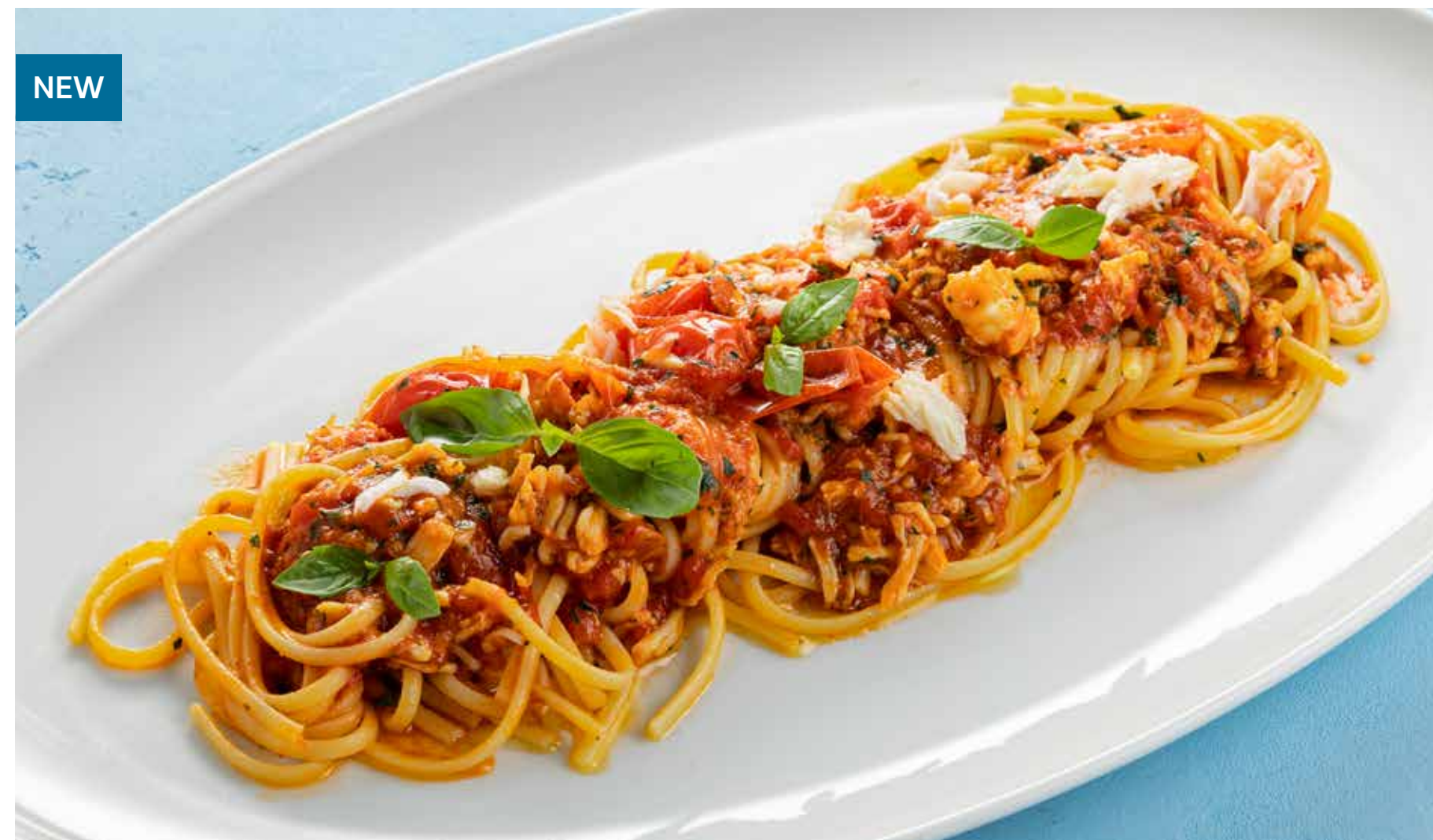
ЛИНГВИНИ С КРАБОМ Crab linguine