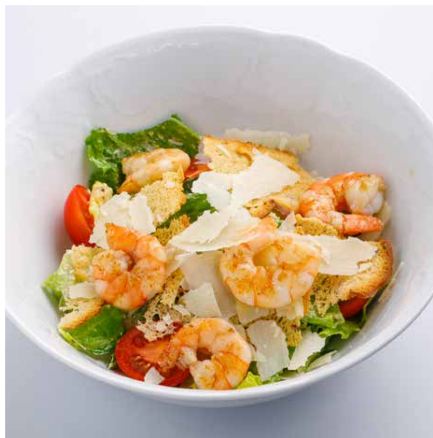
«ЦЕЗАРЬ» С КРЕВЕТКАМИ / С ЦЫПЛЕНКОМ Shrimps / chicken Caesar salad