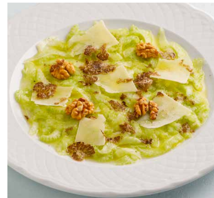
КАРПАЧЧО ИЗ СЕЛЬДЕРЕЯ С ПАРМЕЗАНОМ И ЧЕРНЫМ ТРЮФЕЛЕМ Celery carpaccio with Parmesan and black truffle