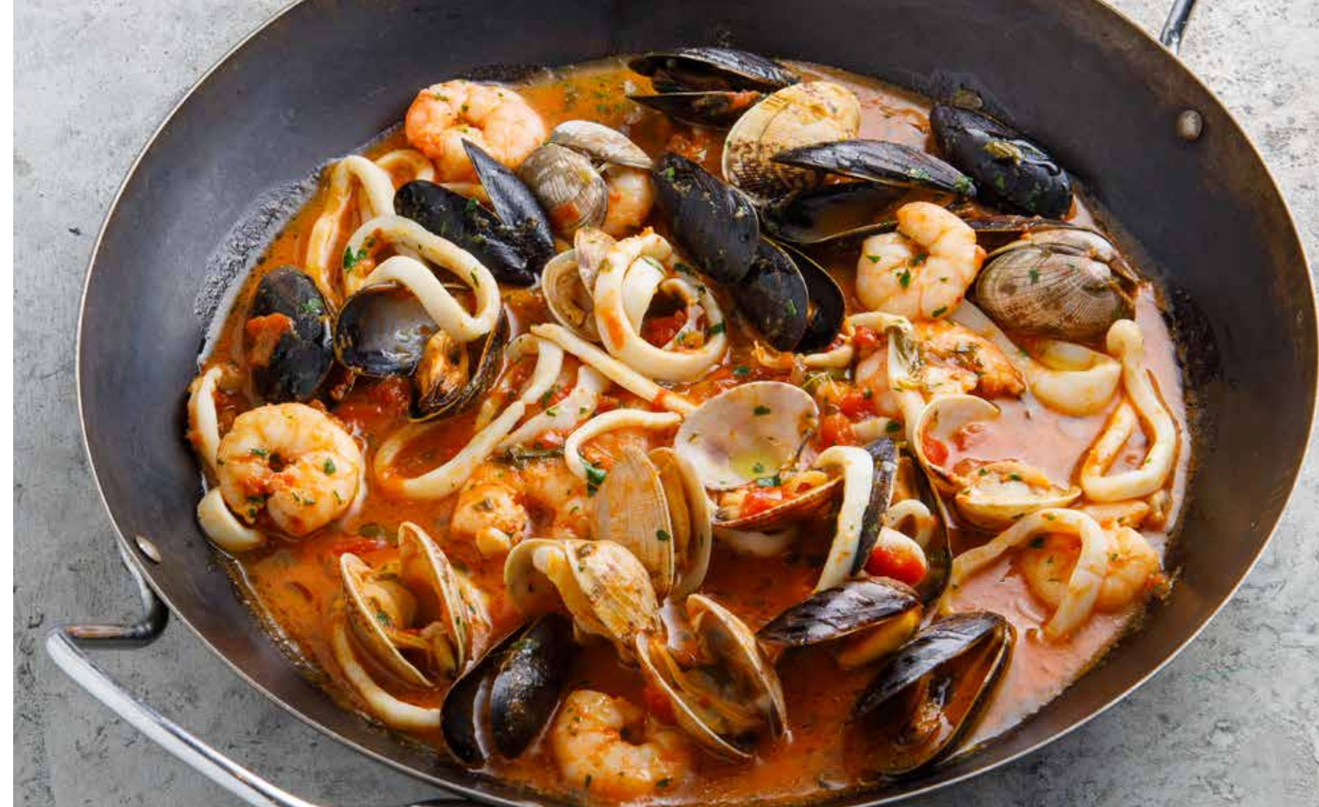
СОТЕ ИЗ МОРЕПРОДУКТОВ 1 персоне / 2 персоны Seafood saute for 1 or 2 persons