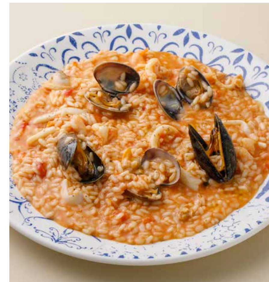
РИЗОТТО С МОРЕПРОДУКТАМИ Risotto with seafood