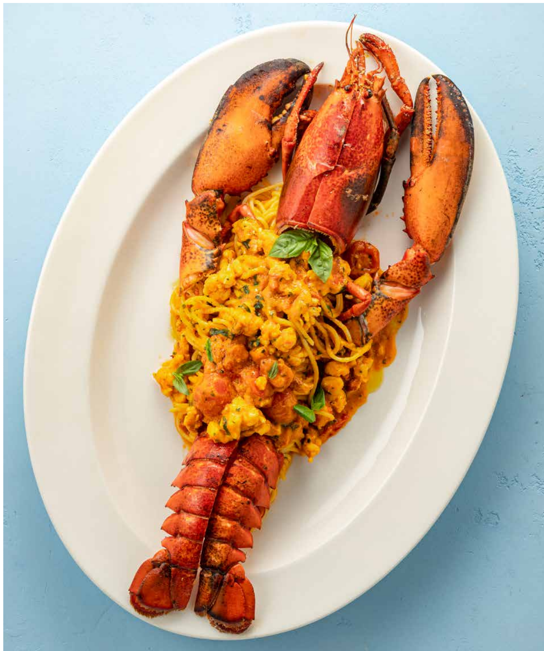
ПАСТА С ЛОБСТЕРОМ Lobster pasta