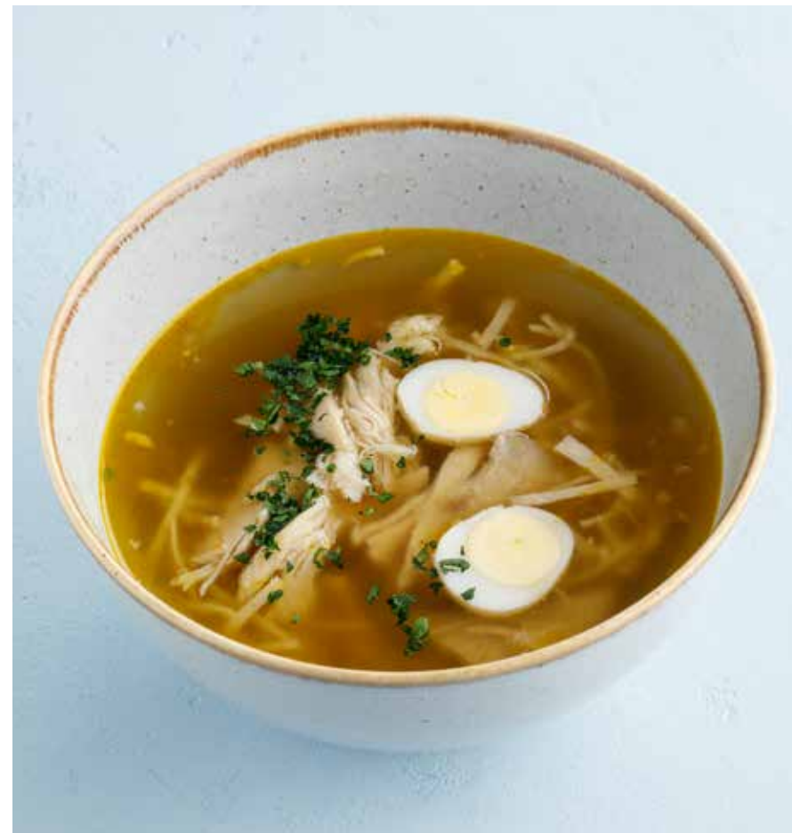
ДОМАШНИЙ КУРИНЫЙ СУП Home-style chicken soup