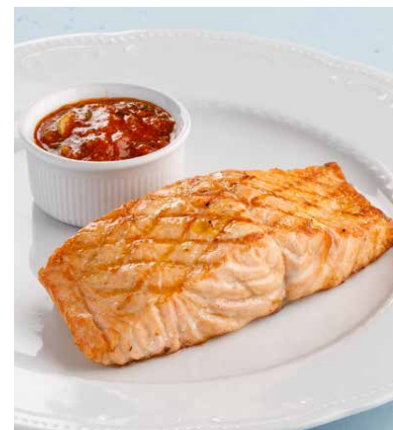
СТЕЙК ИЗ ЛОСОСЯ Salmon steak