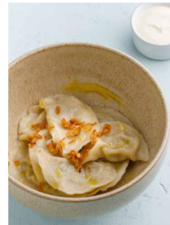
ВАРЕНИКИ С КАРТОФЕЛЕМ И ГРИБАМИ Vareniki stuffed with potatoes and mushrooms