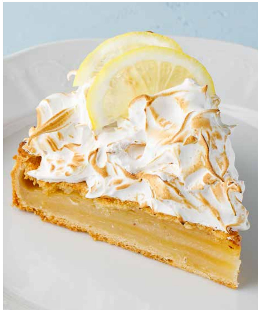
ЛИМОННЫЙ ПИРОГ Lemon pie