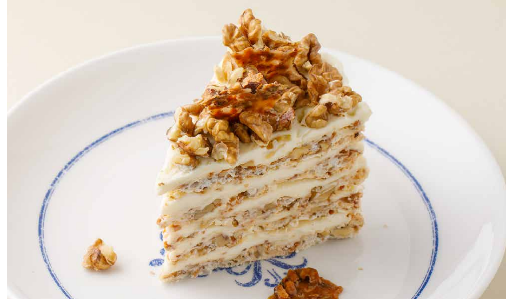
ТОРТ «ГРЕЦКИЙ ОРЕХ» Walnut cake