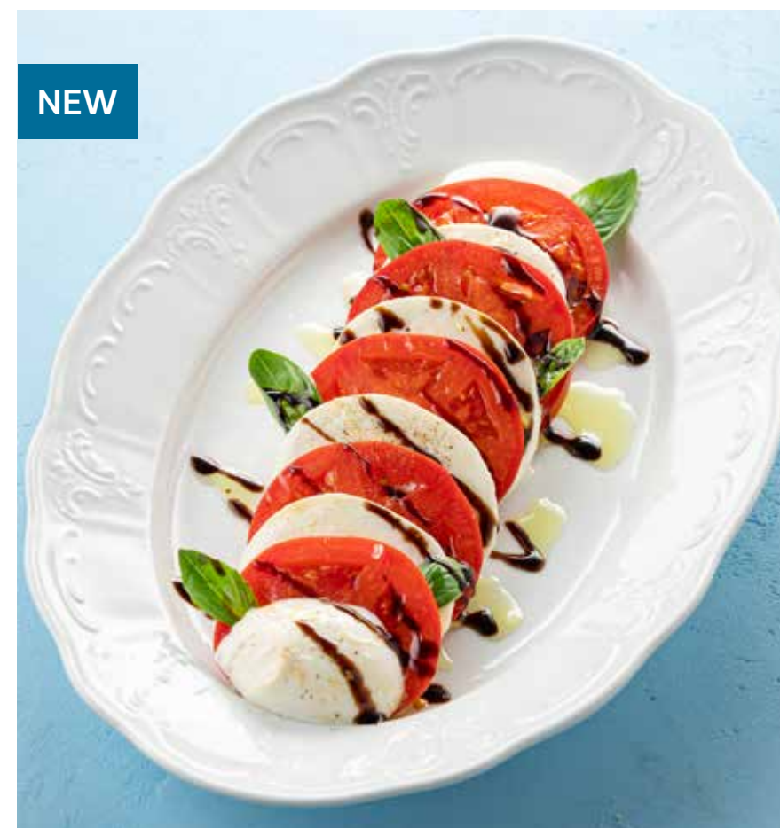
КАПРЕЗЕ FIOR DI LATTE Fior di Latte caprese