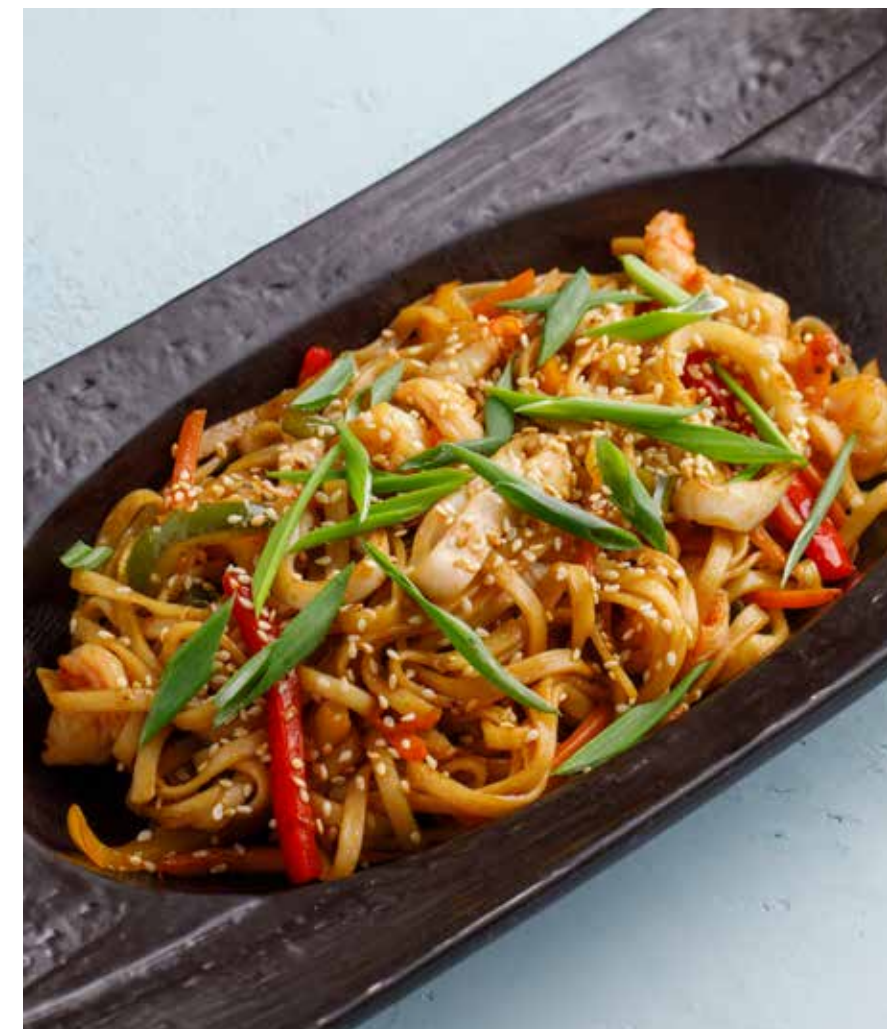
УДОН С МОРЕПРОДУКТАМИ Seafood udon