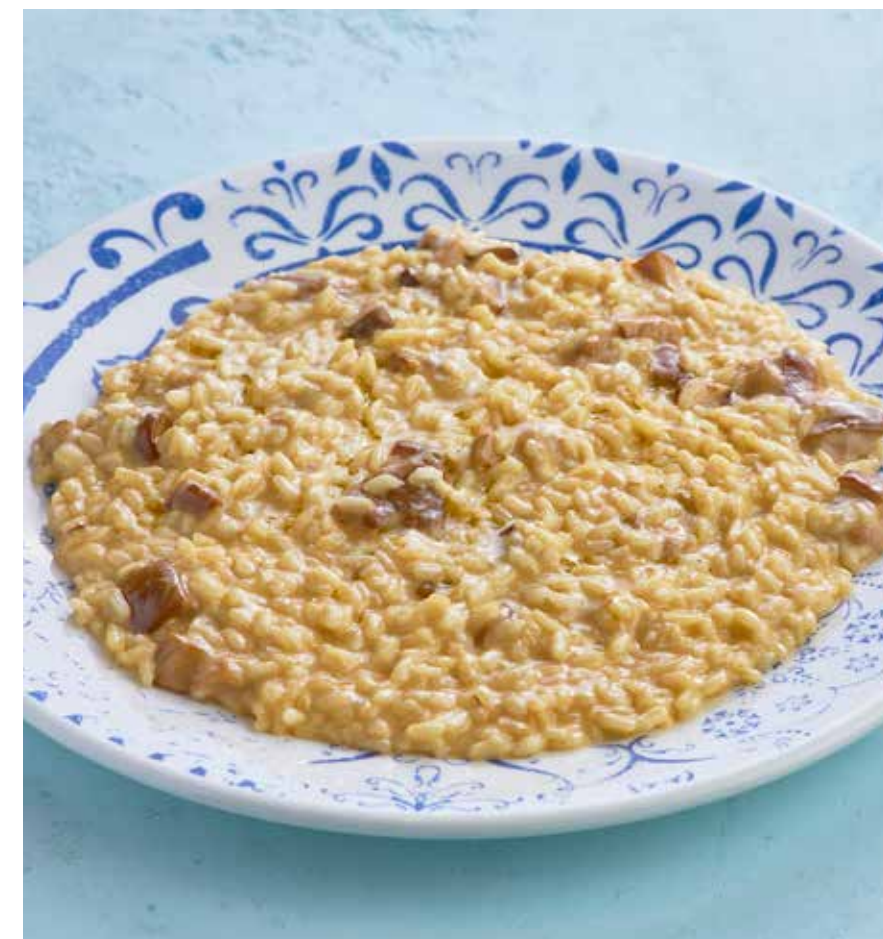
РИЗОТТО С БЕЛЫМИ ГРИБАМИ Porcini mushroom risotto