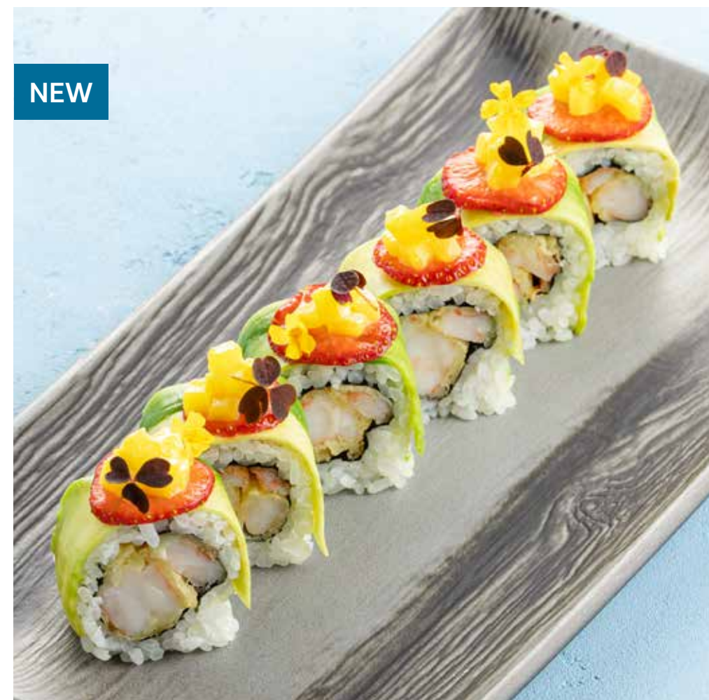
РОЛЛ С КРЕВЕТКОЙ ТЕМПУРА, АВОКАДО И КЛУБНИКОЙ Roll with tempura shrimp, avocado and strawberry