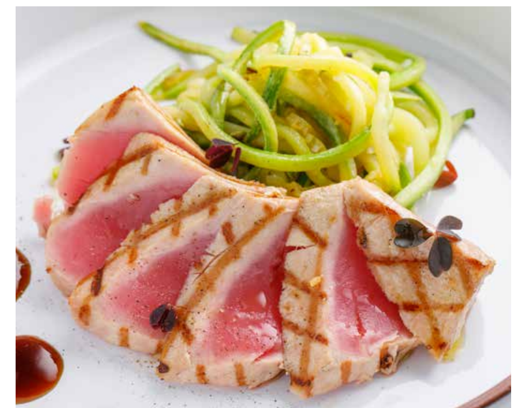
ТАЛЬЯТА ИЗ ТУНЦА С ЦУКИНИ Tuna tagliata with zucchini