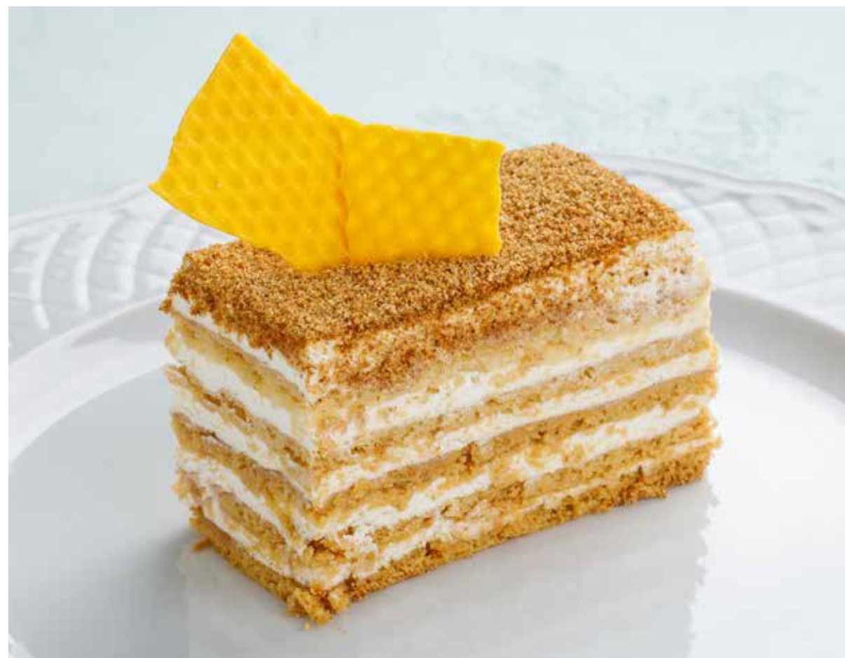
«МЕДОВИК» Honey cake