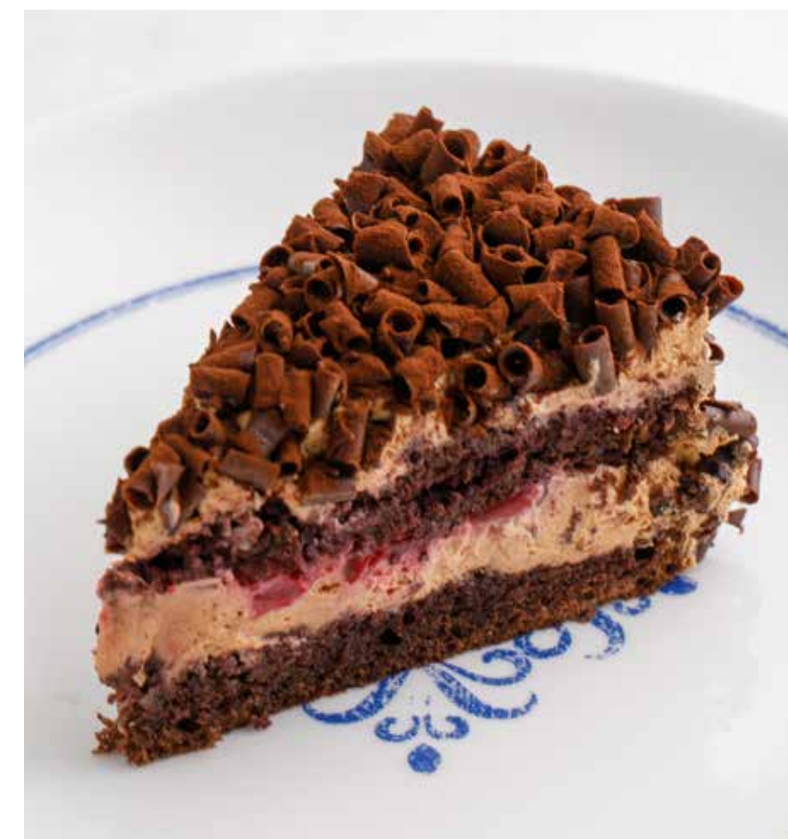
ШОКОЛАДНО-ВИШНЕВЫЙ ТОРТ Chocolate cherry cake