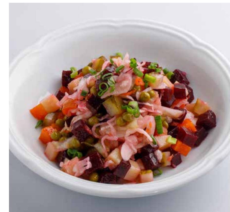
ВИНЕГРЕТ / ВИНЕГРЕТ С ГРУЗДЯМИ Russian vinegret salad / Russian vinegret salad with milk mushrooms