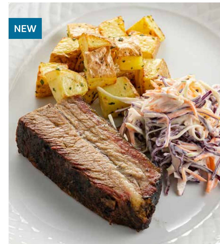
БРИСКЕТ С ПЕЧеныМ КАРТОФЕЛЕМ И «КОУЛ СЛОУ» Brisket with baked potatoes and coleslaw salad