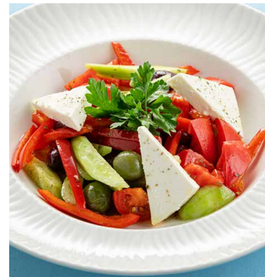
ГРЕЧЕСКИЙ САЛАТ Greek salad