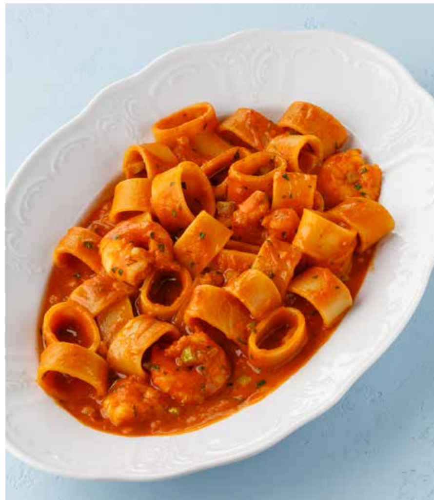
ПАСТА «КАЛАМАРАТА» С КРЕВЕТКАМИ Calamarata pasta with shrimps