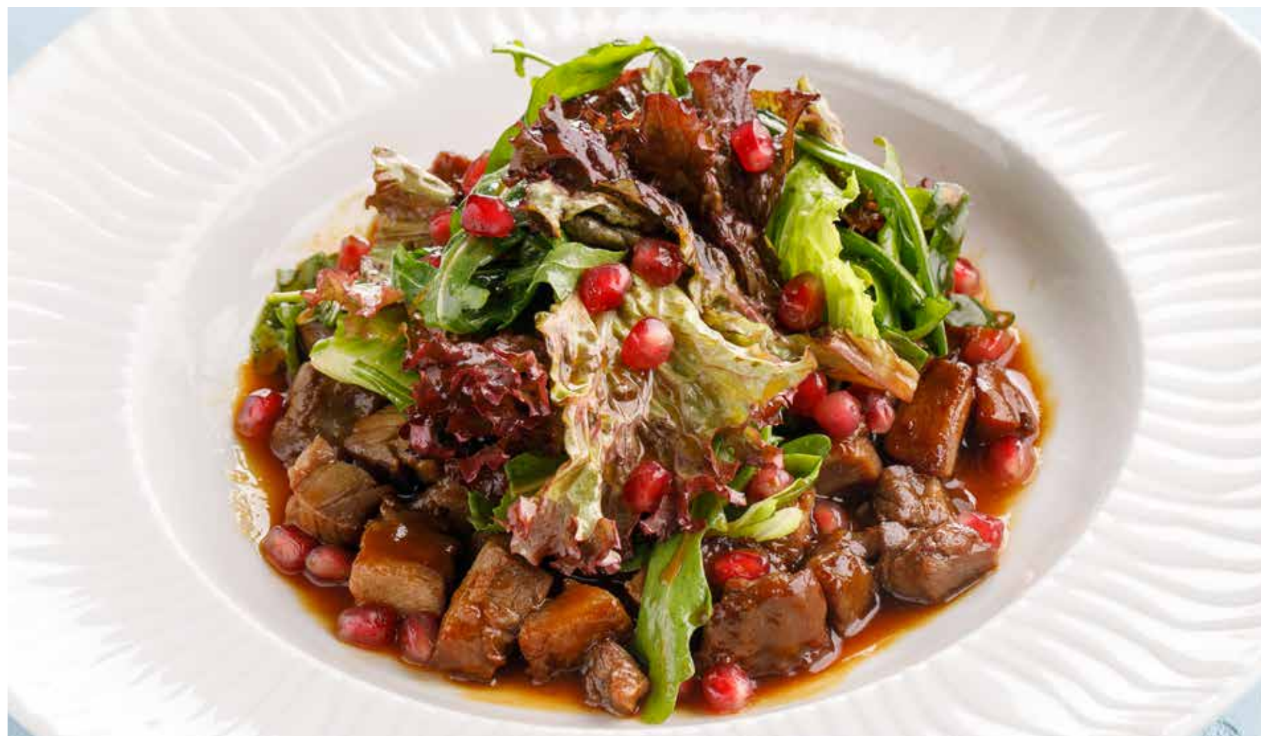
САЛАТ С УТКОЙ Duck salad