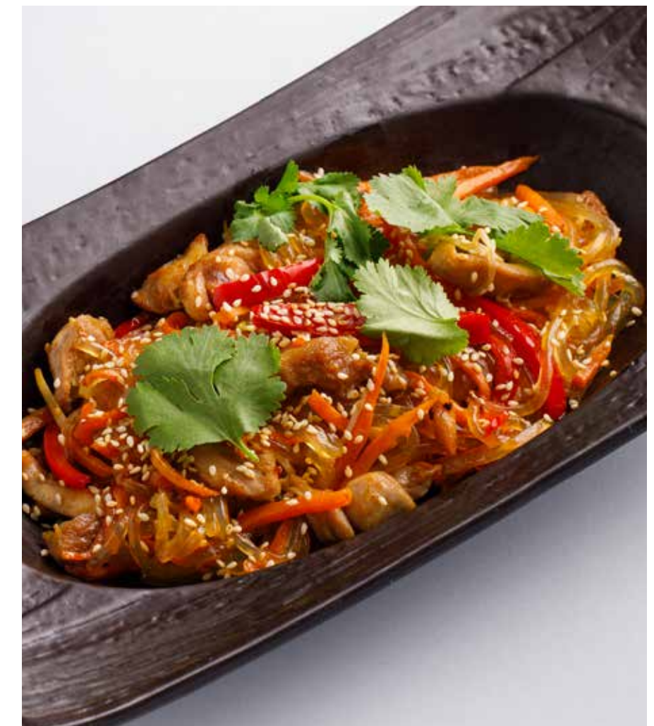
СТЕКЛЯННАЯ ЛАПША С ЦЫПЛЕНКОМ И ОВОЩАМИ Glass noodles with chicken and vegetables