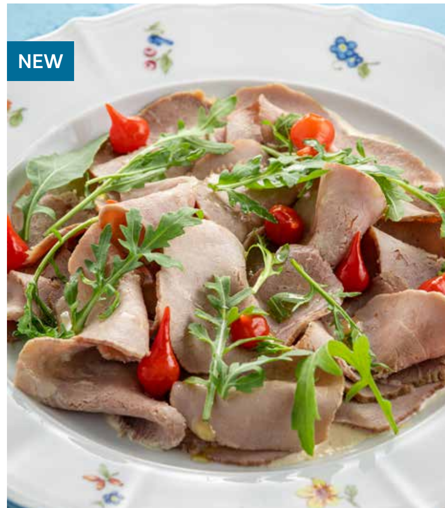
ВИТЕЛЛО ТОННАТО Vitello Tonnato