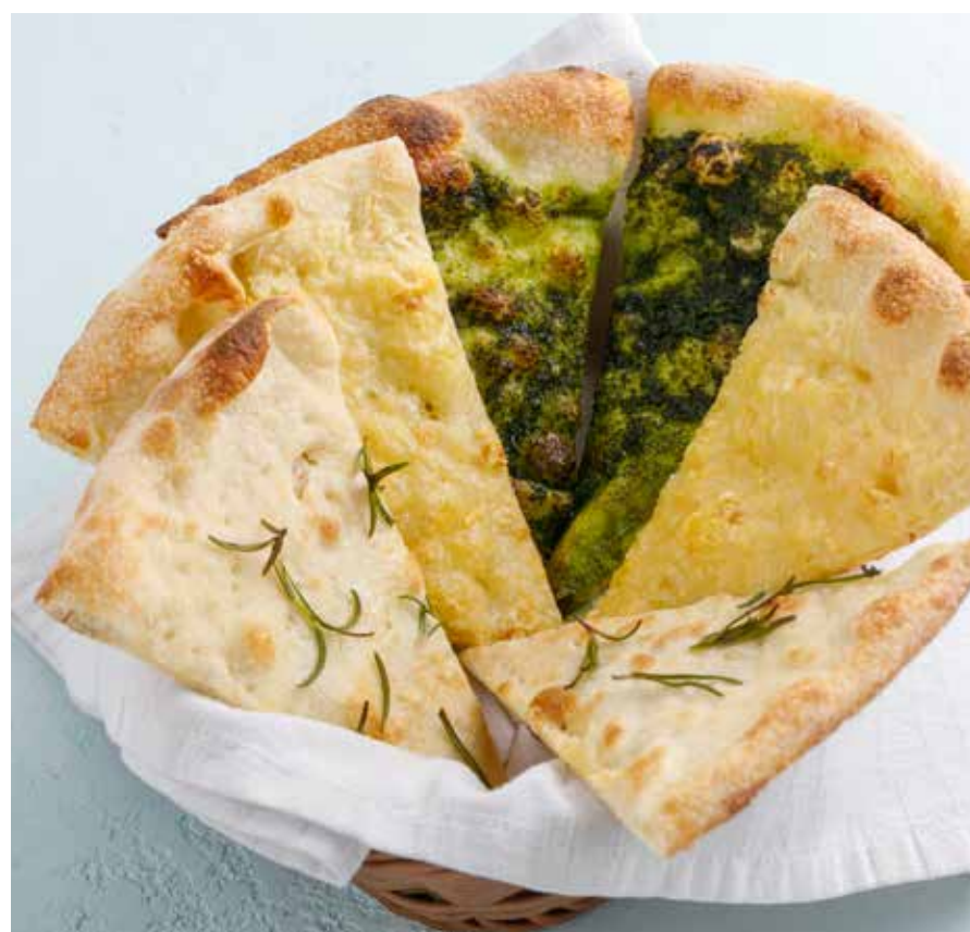
ФОКАЧЧА С ПАРМЕЗАНОМ / С ПЕСТО / С РОЗМАРИНОМ | 490/ Parmesan / pesto / rosemary focaccia | 390/ 290 ₽

АССОРТИ ИЗ КУТАБОВ ..... 690 ₽ Assorted qutabs