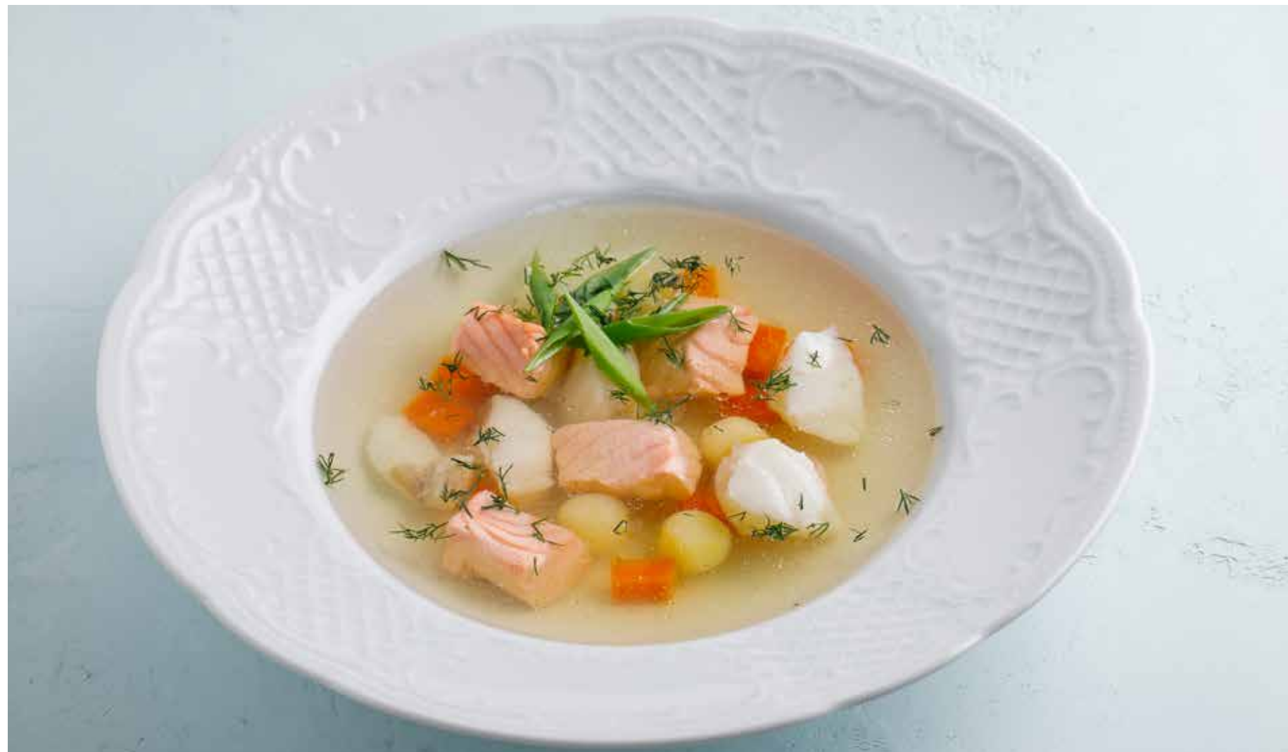
УХА С ЛОСОСЕМ И ТРЕСКОЙ / ПО-ФИНСКИ Salmon and cod fish soup / in Finnish style