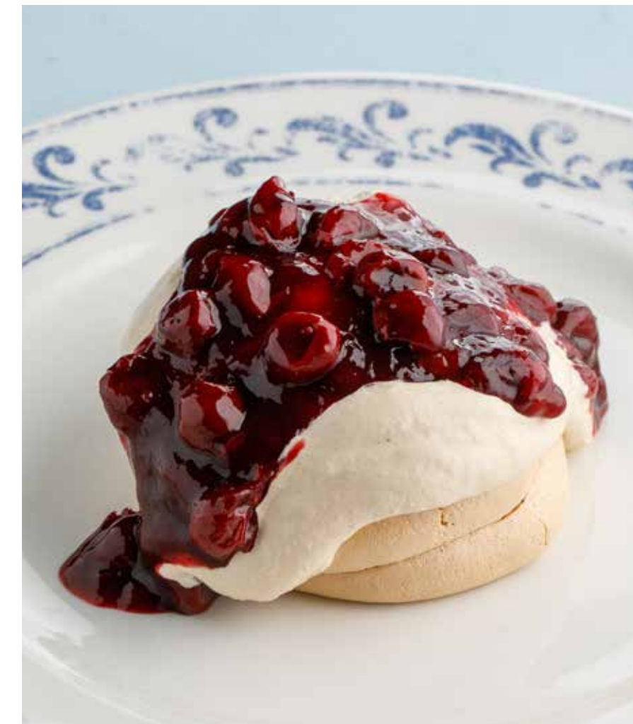
БЕЗЕ «ВАРЕНАЯ СГУЩЕНКА» С ВИШНЕЙ Dulce de leche meringues with cherry