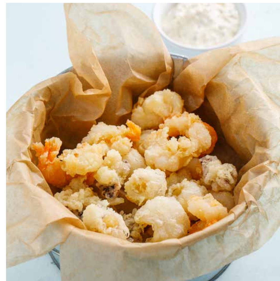
ФРИТТО МИСТО Fritto misto