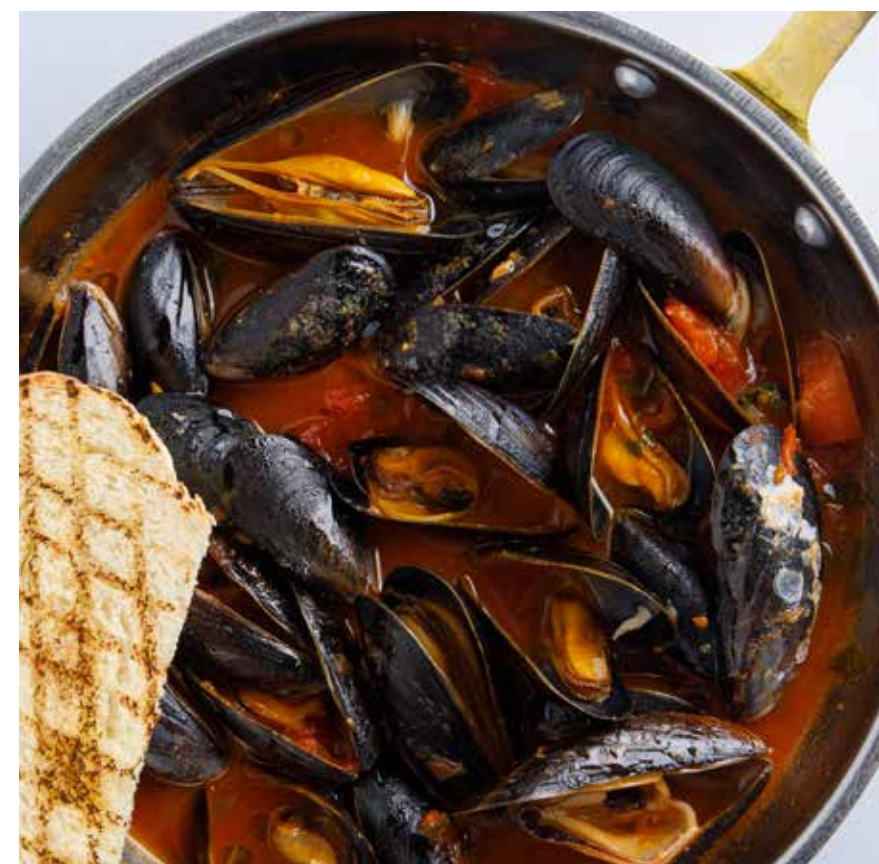
МИДИИ В КРАСНОМ / БЕЛОМ СОУСЕ Mussels with red or white sauce