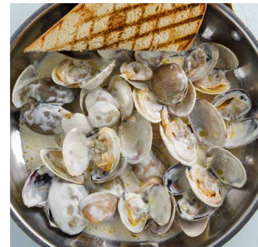
ВОНГОЛЕ В КРАСНОМ / БЕЛОМ СОУСЕ Vongole with red or white sauce