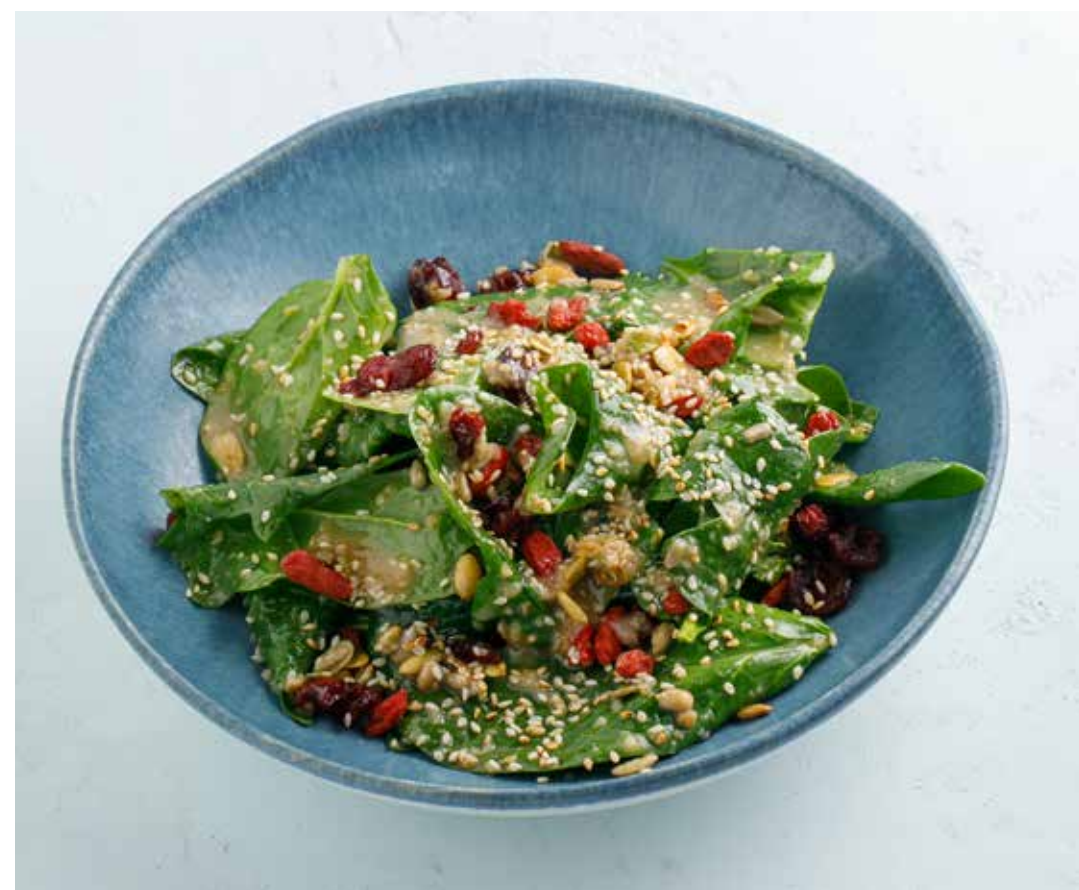
САЛАТ СО ШПИНАТОМ, ОРЕХОВЫМ СОУСОМ И КЛЮКВОЙ Spinach, nut sauce and cranberry salad