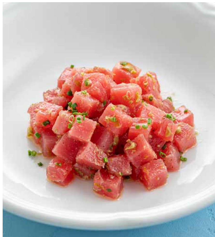
ТАРТАР ИЗ ТУНЦА Tuna tartare