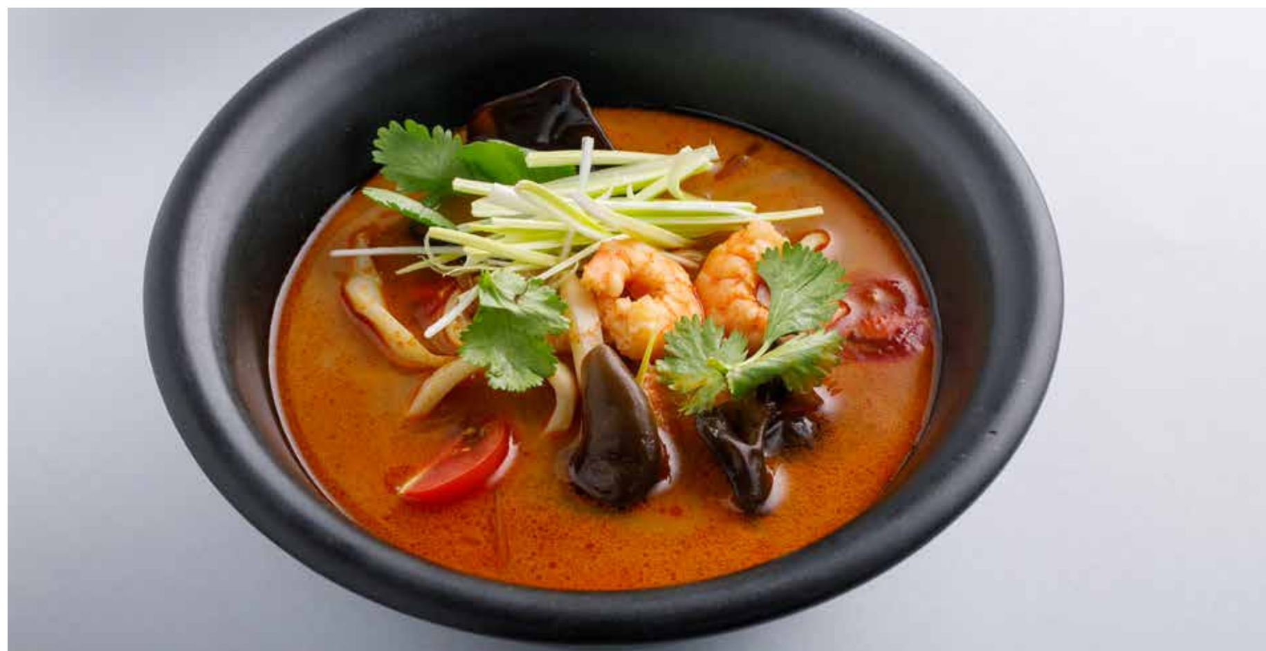
ТОМ ЯМ С МОРЕПРОДУКТАМИ Tom Yum with seafood