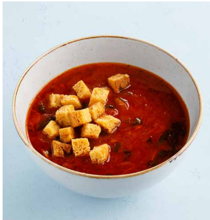
ТОМАТНЫЙ СУП Tomato soup