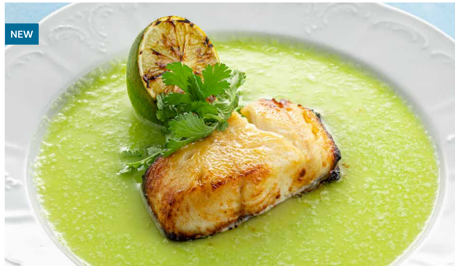
ЧЕРНАЯ ТРЕСКА В МИСО-ПАСТЕ С СОУСОМ ХАЛАПЕНЬО Black cod in miso paste with jalapeno sauce