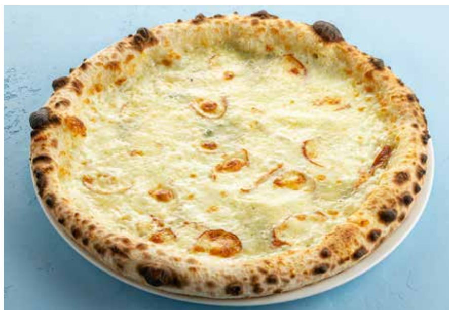
ПИЦЦА «4 СЫРА» | 790 ₽ Four cheeses pizza