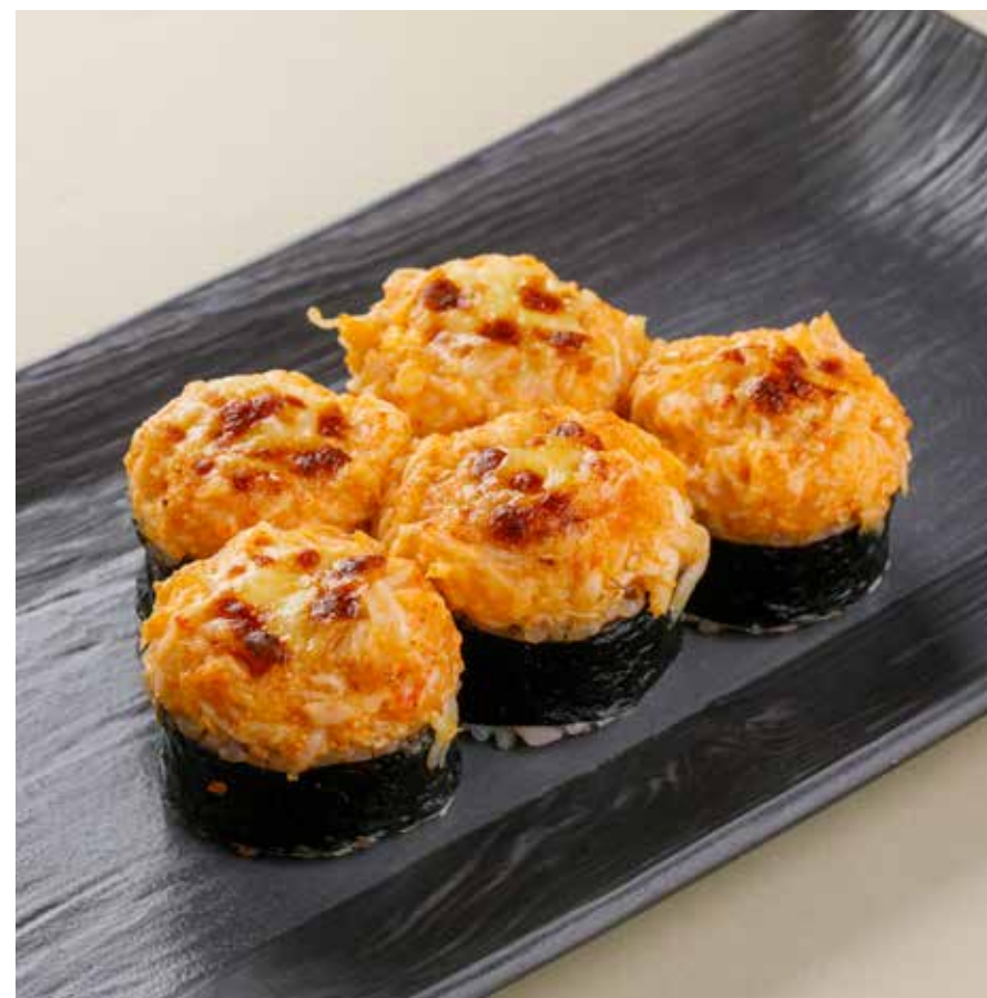
ЗАПЕЧЕННЫЙ РОЛЛ С ГРЕБЕШКОМ / С КРАБОМ Baked roll with scallop / crab