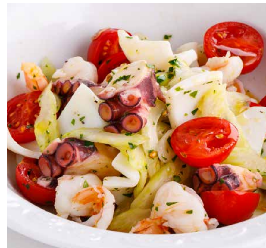
ТЕПЛЫЙ САЛАТ С МОРЕПРОДУКТАМИ, СЕЛЬДЕРЕЕМ И ЧЕРРИ Warm salad with seafood, celery and cherry tomato