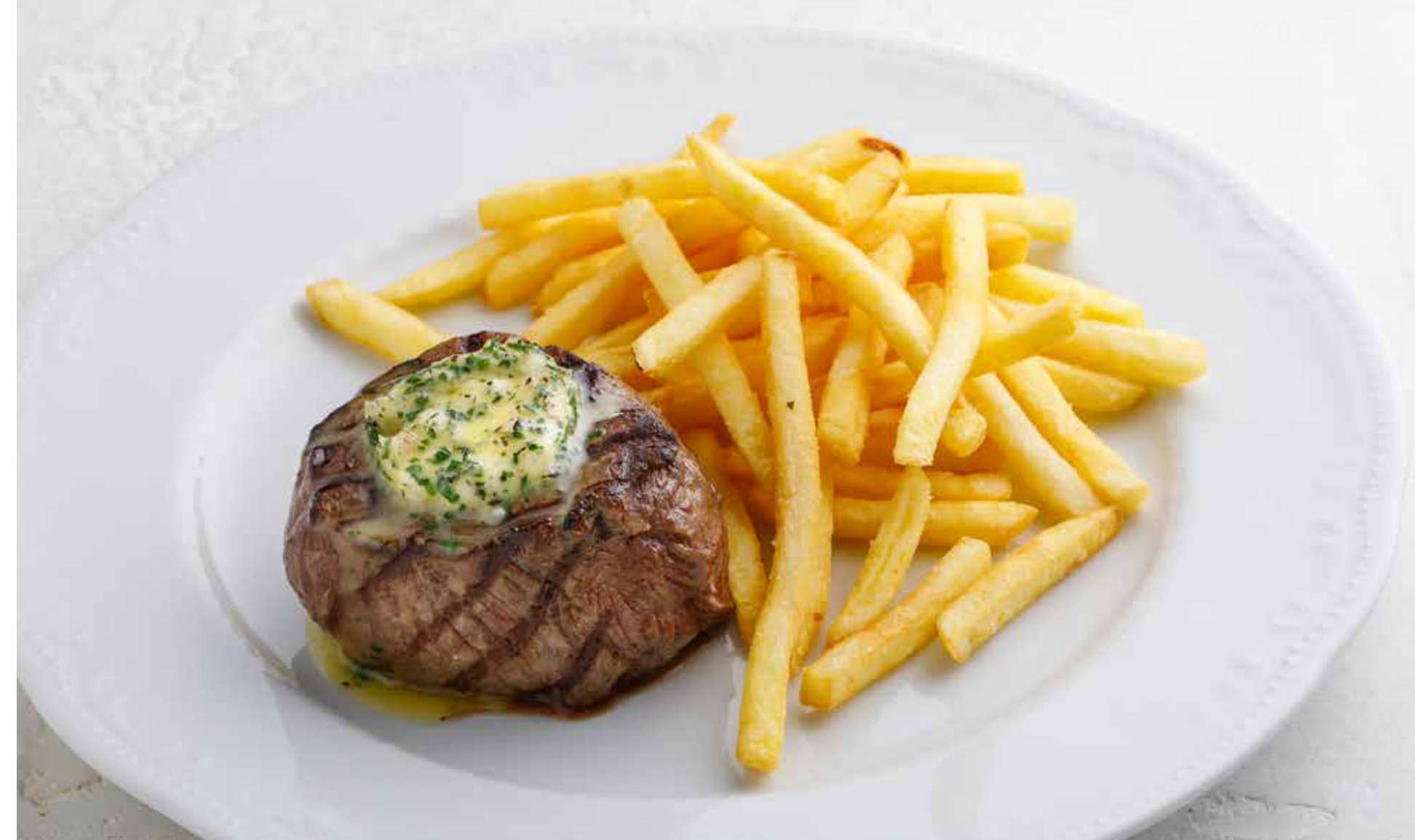
СТЕЙК ИЗ ГОВЯДИНЫ С КАРТОФЕЛЕМ ФРИ Beef steak with French fries