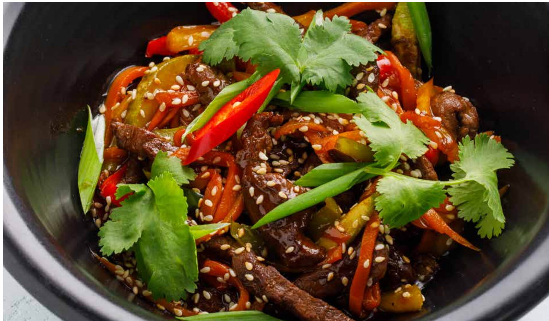
ГОВЯДИНА С ОВОЩАМИ Beef with vegetables