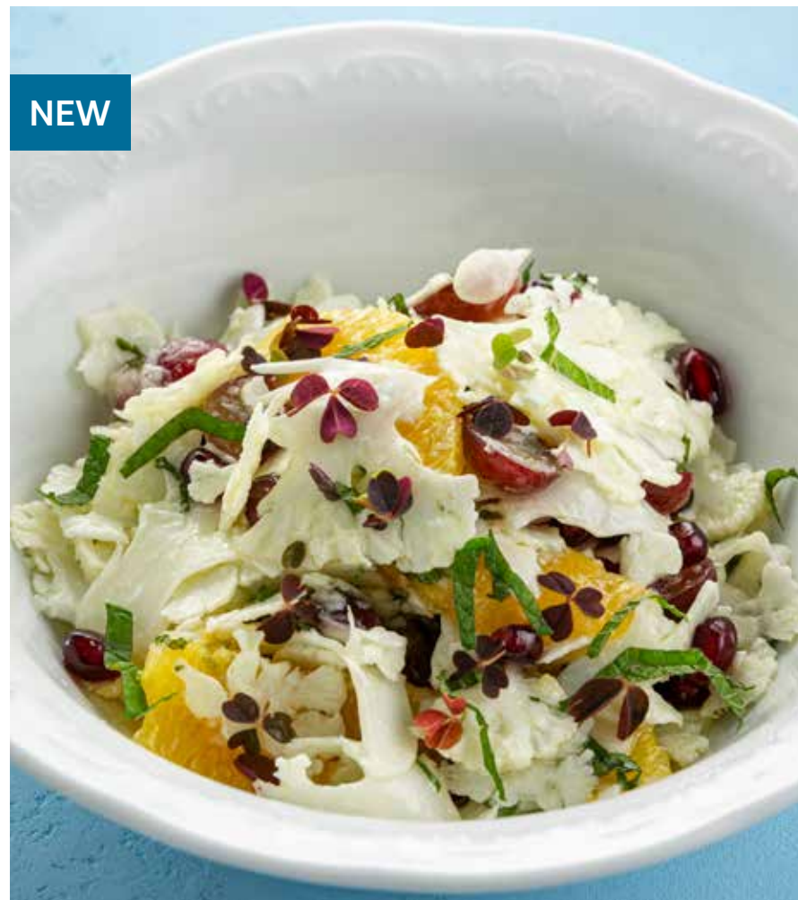
САЛАТ ИЗ ЦВЕТНОЙ КАПУСТЫ С АПЕЛЬСИНОМ И ГРАНАТОМ Salad with cauliflower, orange and pomegranate