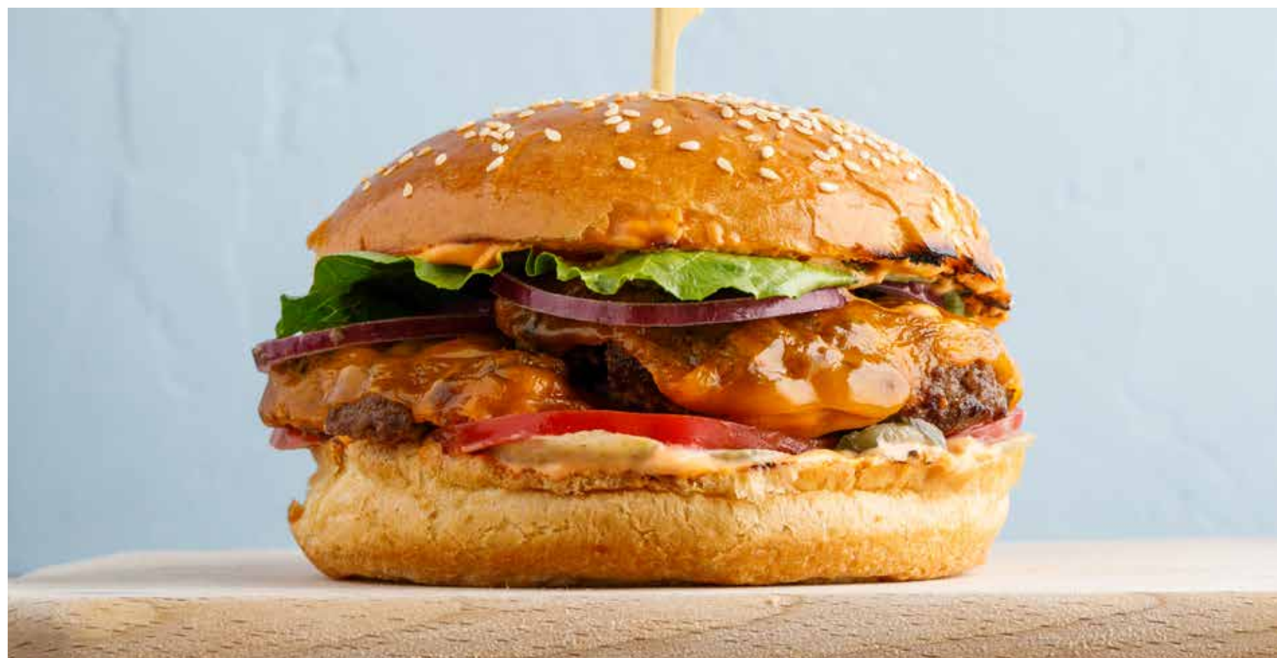
БУРГЕР С МРАМОРНОЙ ГОВЯДИНОЙ / РАСТИТЕЛЬНОМ МЯСОМ Marble beef / vegan meat burger