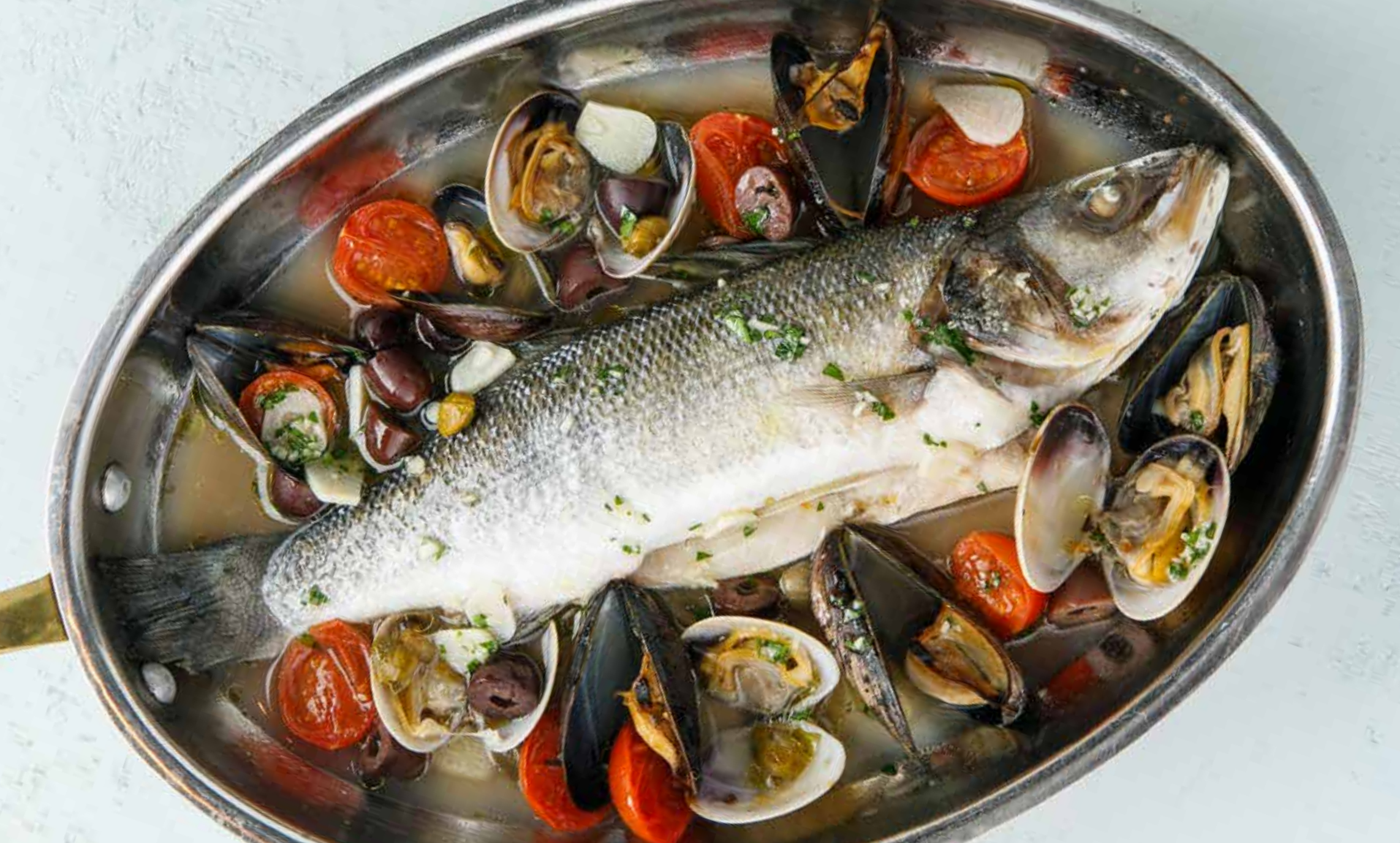
СИБАС «АКВА ПАЦЦА» Sea bass Acqua Pazza