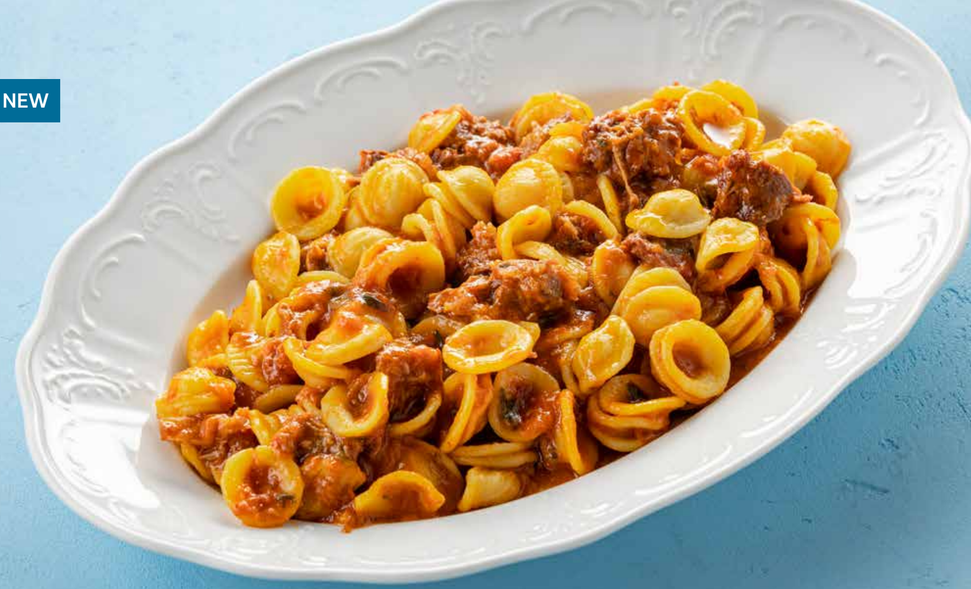
ОРЕКЬЕТТЕ С ГОВЯДИНОЙ И РИКОТТОЙ Orecchiette with beef and ricotta