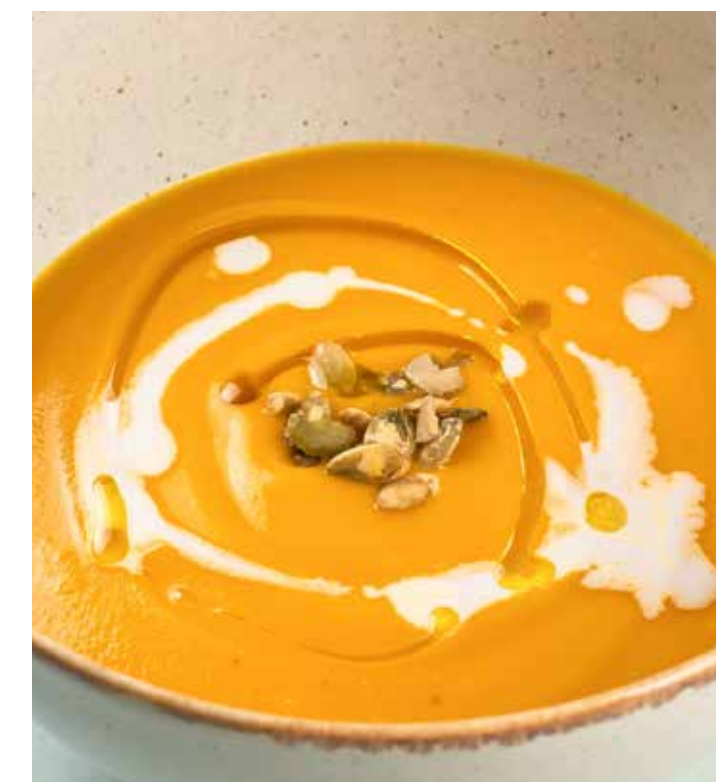
ТЫКВЕННЫЙ СУП С КУМИНОМ И КОКОСОВЫМ МОЛОКОМ Cream of pumpkin soup with cumin and coconut milk