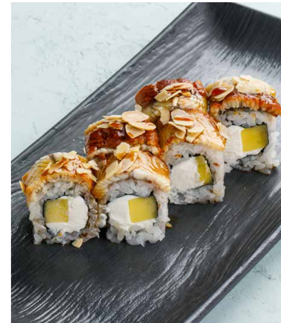
СЛИВОЧНЫЙ РОЛЛ С УГРЕМ И МАНГО Cream roll with eel and mango