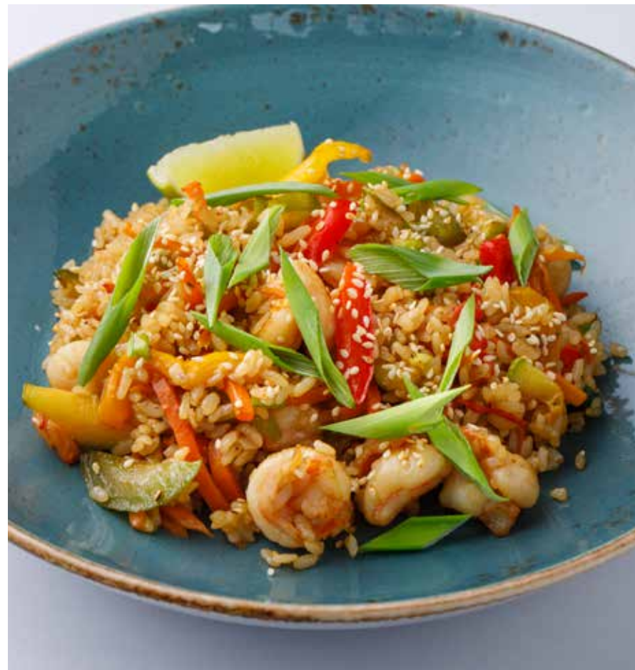
РИС С КРЕВЕТКАМИ И ОВОЩАМИ Rice with shrimp and vegetables