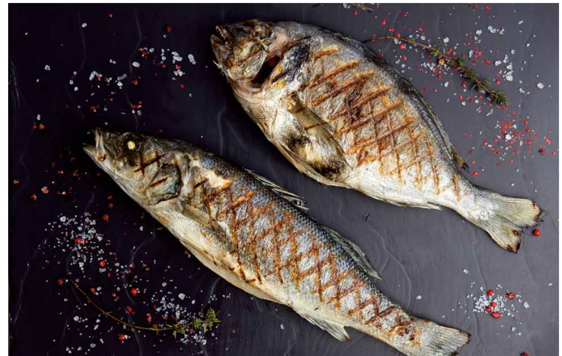
ДОРАДО / СИБАС Dorado / sea bass