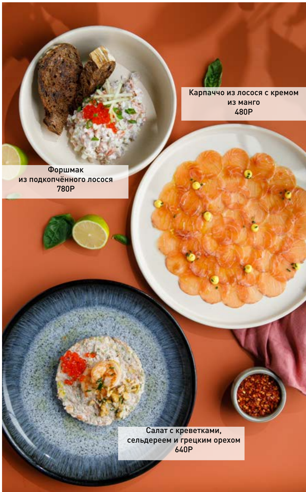
Карпаччо из лосося с кремом из манго 480Р