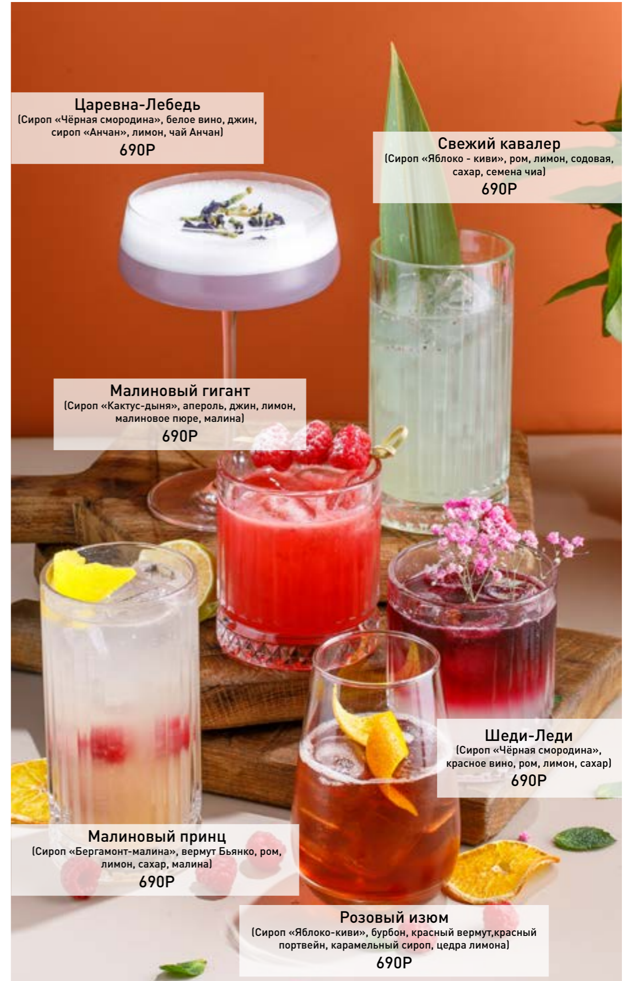
Царевна-Лебедь (Сироп «Чёрная смородина», белое вино, джин, сироп «Анчан», лимон, чай Анчан) 690Р