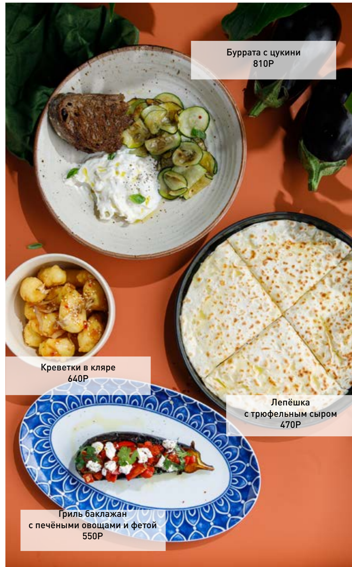
Буррата с цукини 810Р