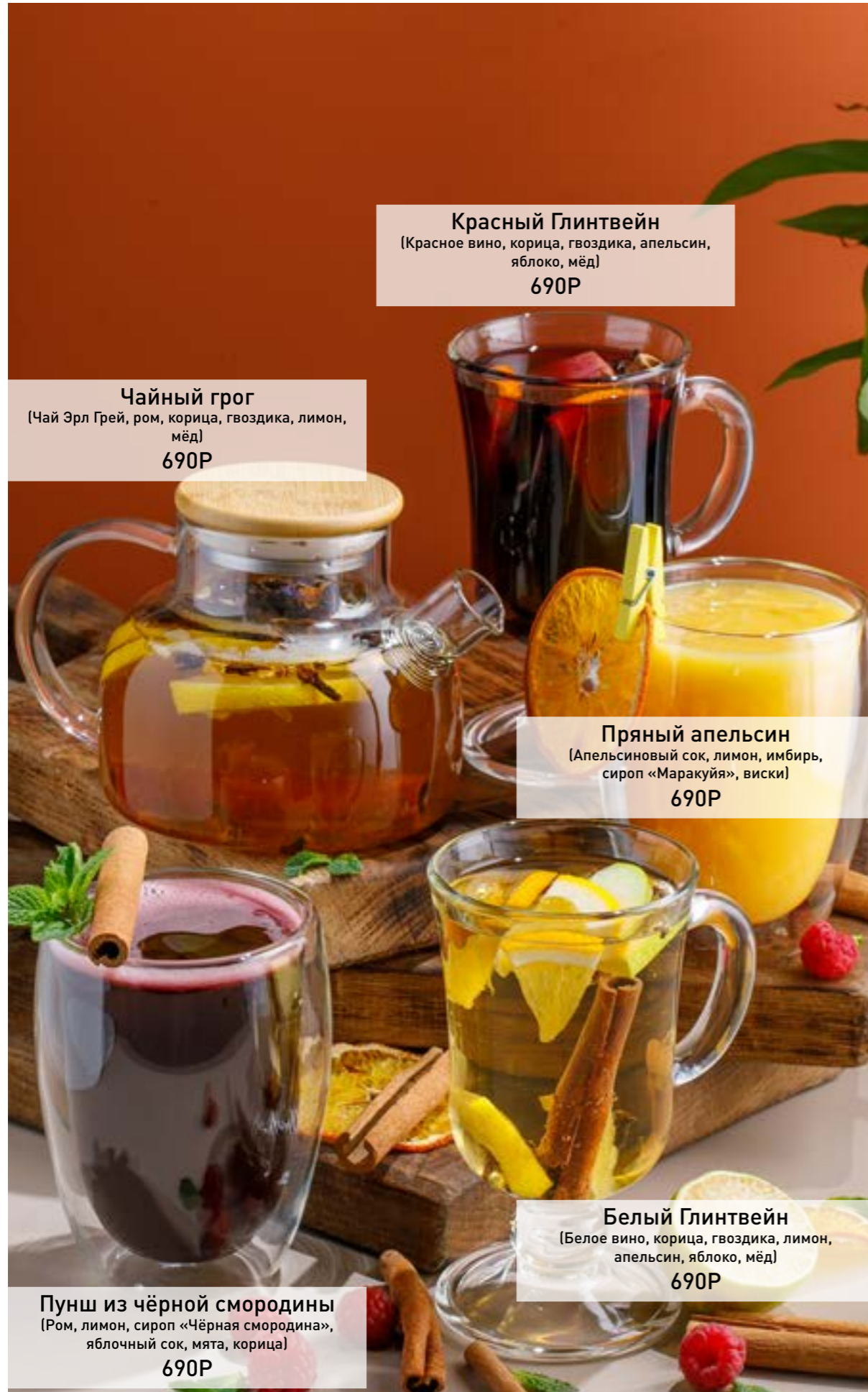
Красный Глинтвейн (Красное вино, корица, гвоздика, апельсин, яблоко, мёд) 690Р