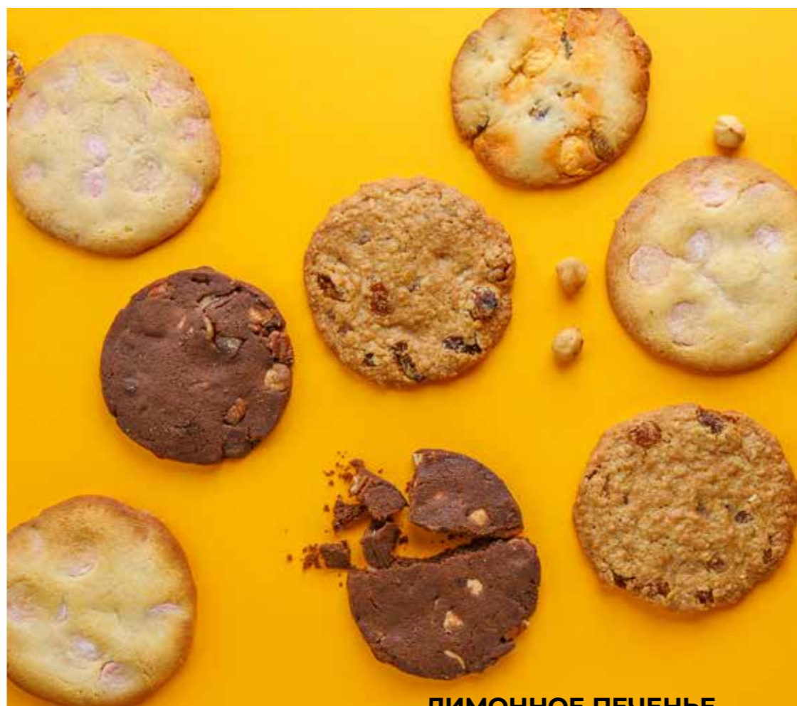
ОВСЯНОЕ ПЕЧЕНЬЕ ... 190 Oatmeal biscuits