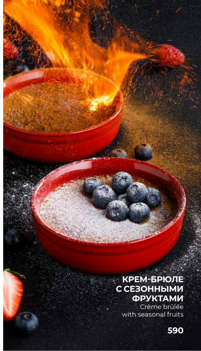
КРЕМ-БРЮЛЕ С СЕЗОННЫМИ ФРУКТАМИ Crème brûlée with seasonal fruits