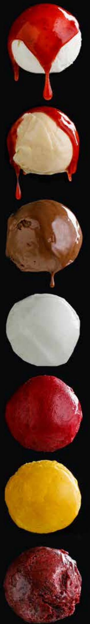
МОРОЖЕНОЕ пломбир / ванильное / шоколадное ... 190 Plombières / vanilla / chocolate ice-cream