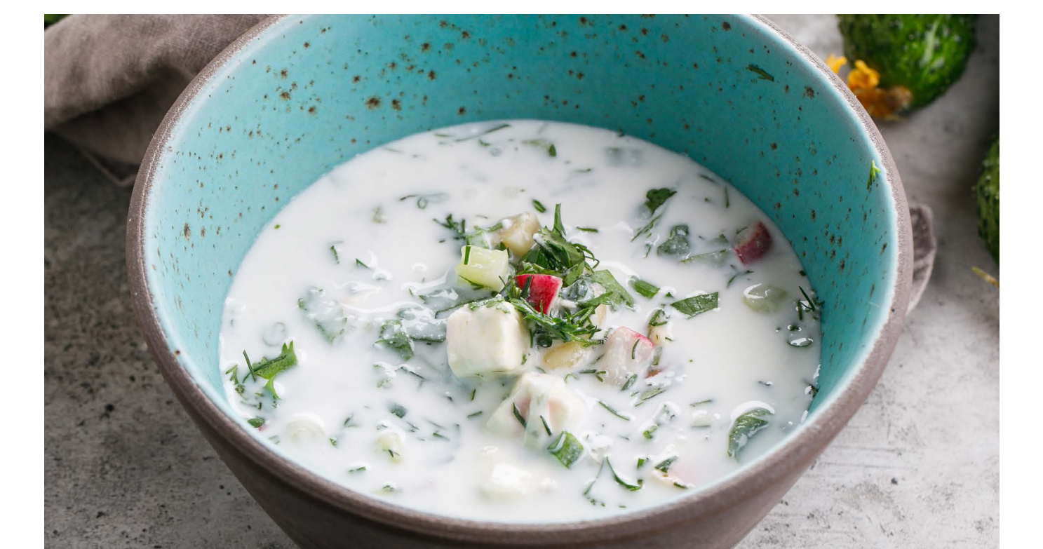
СУП ОТ БАБУШКИ НАДЭ SOUP FROM GRANDMA NADE