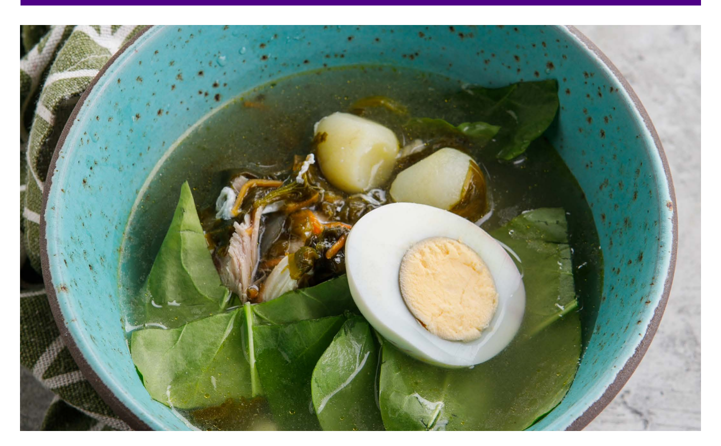
ЩАВЕЛЕВЫЙ СУП SORREL SOUP