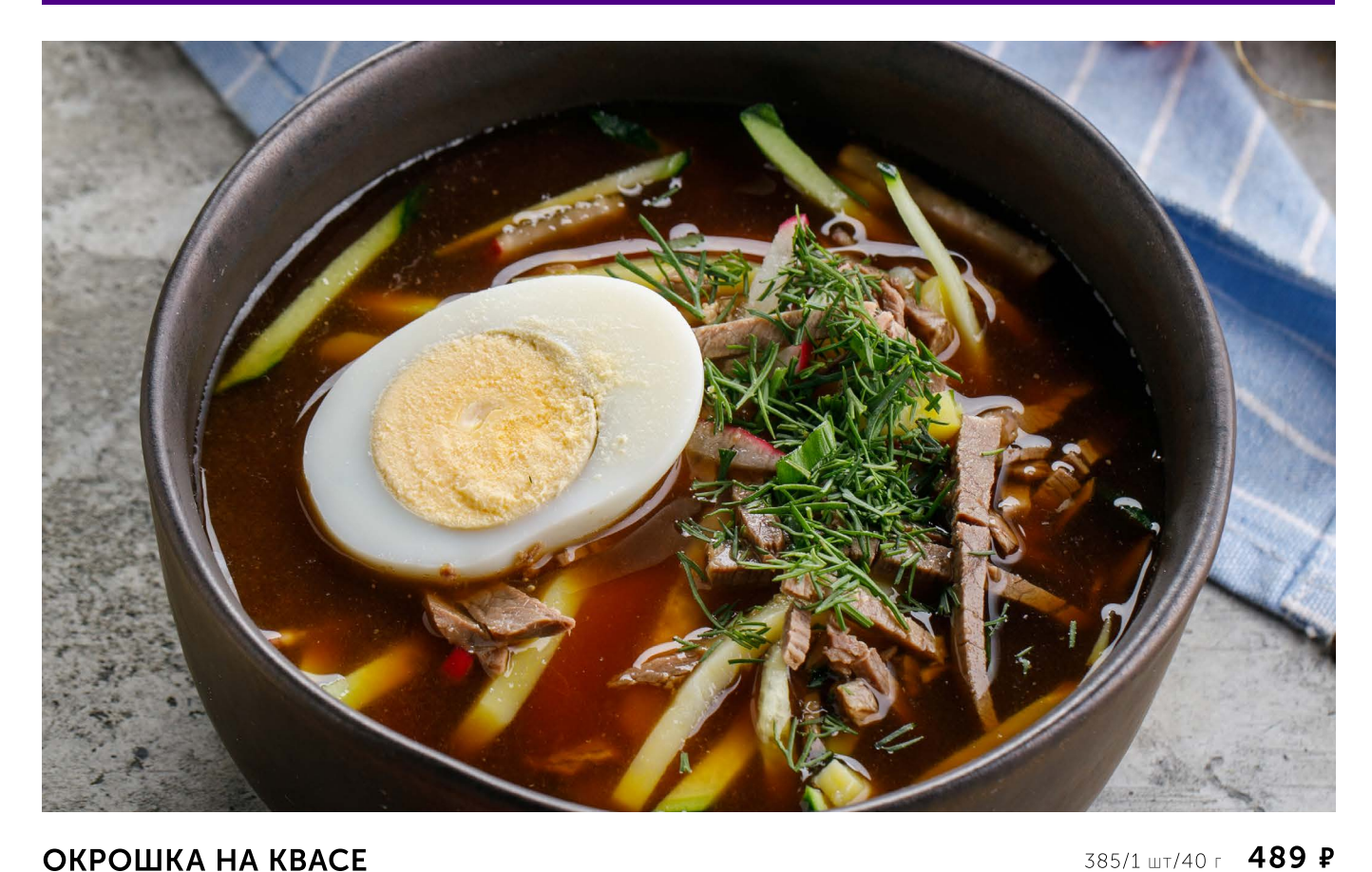
ОКРОШКА НА КВАСЕ COLD KVASS OKROSHKA SOUP