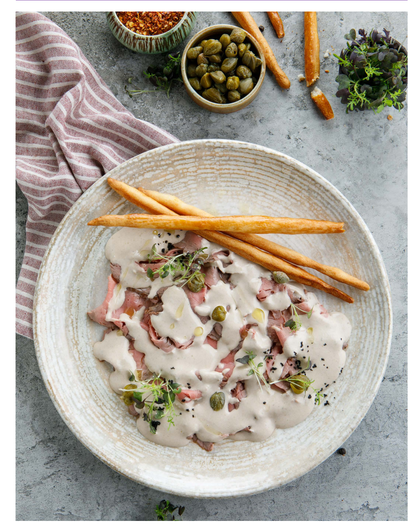
ВИТЕЛЛО ТОННАТО VITELLO TONNATO