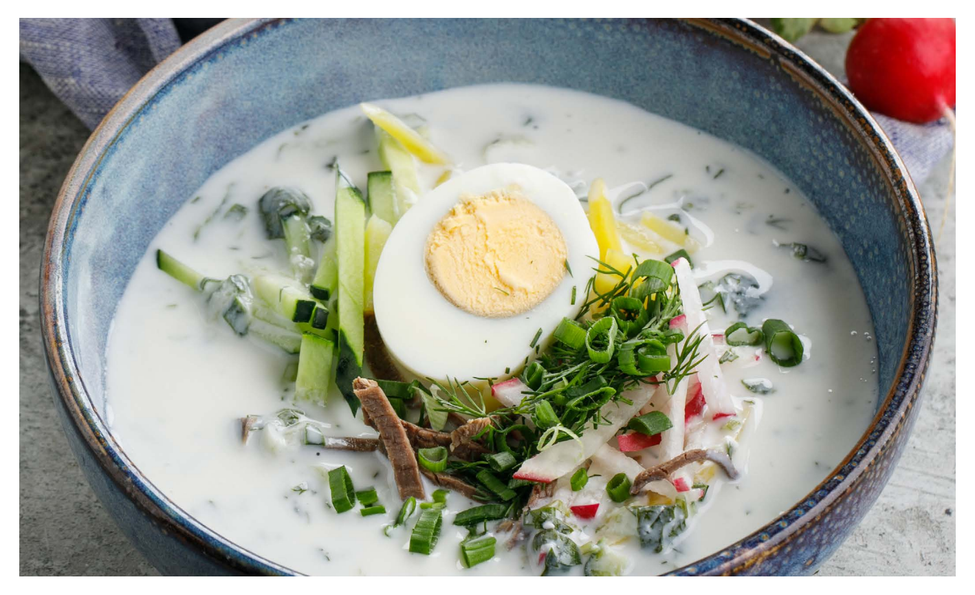
ОКРОШКА НА АЙРАНЕ COLD OKROSHKA SOUP