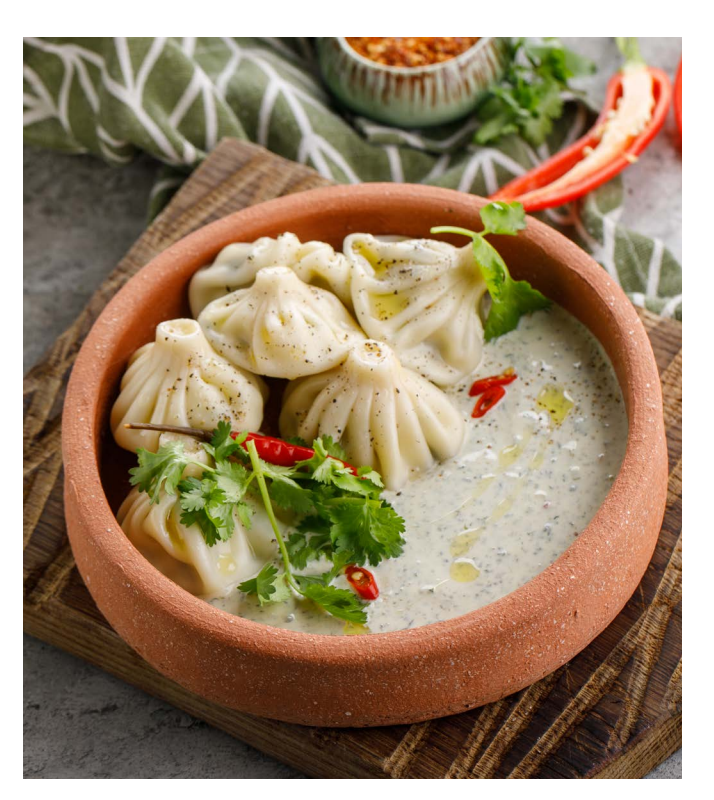
МИНИ-ХИНКАЛИ C MAЦОНИ MINI KHINKALI WITH MATSONI