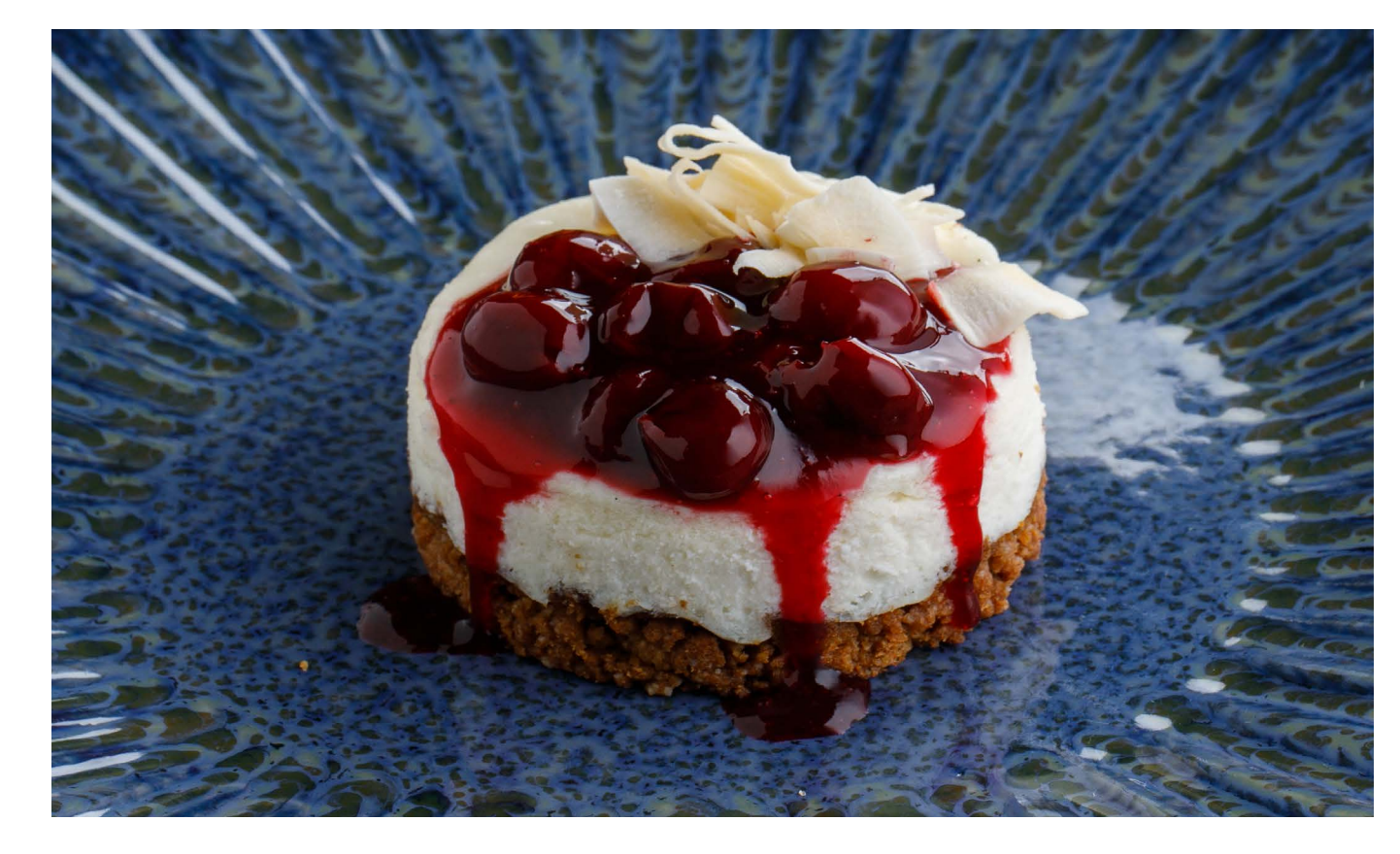
ЧИЗКЕЙК CHEESE CAKE