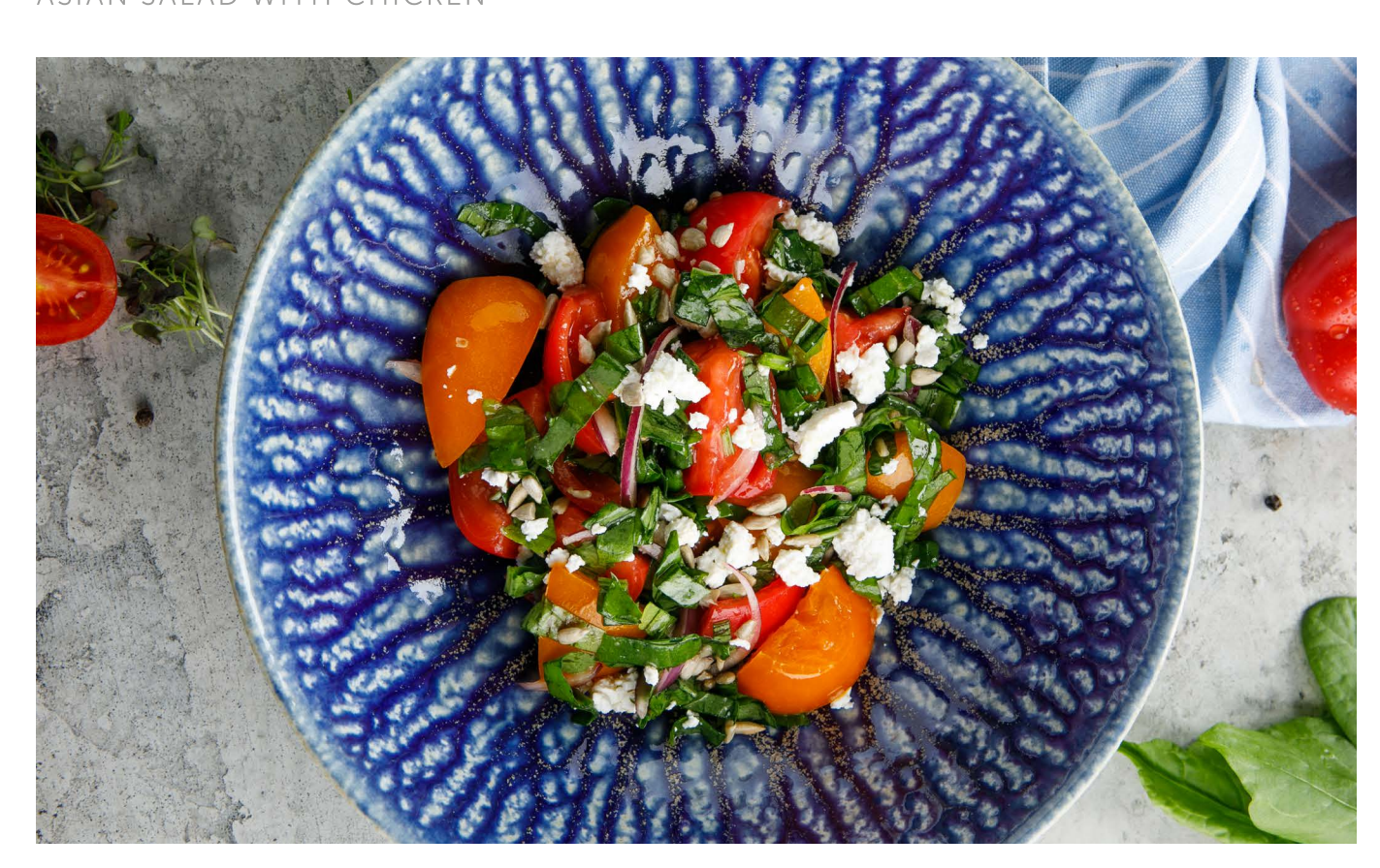
САЛАТ ИЗ ЩАВЕЛЯ, ЖЕЛТЫХ ТОМАТОВ И НАДУГИ SALAD WITH SORREL, TOMATOES AND NADUGI