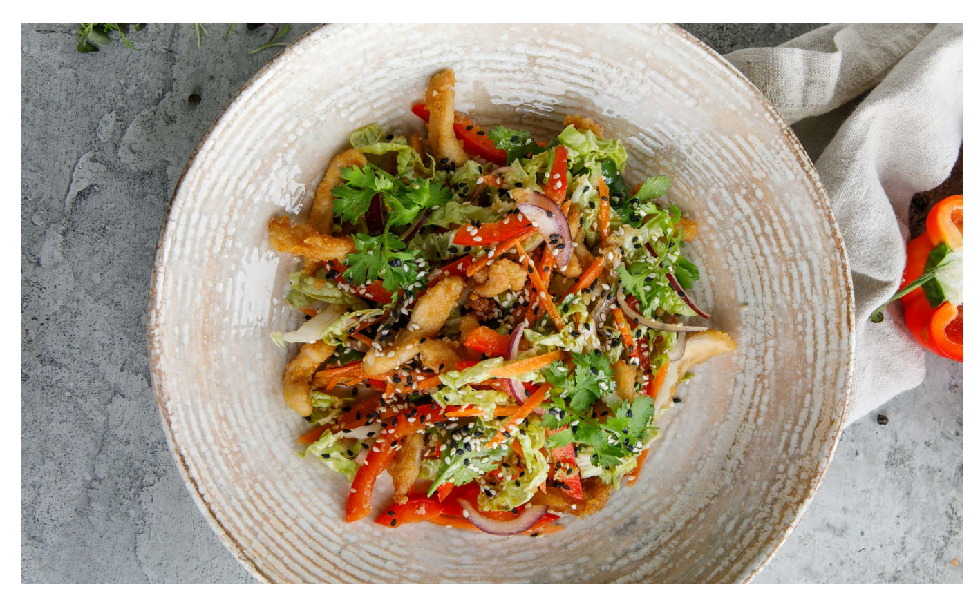
АЗИАТСКИЙ САЛАТ С КУРОЙ ASIAN SALAD WITH CHICKEN