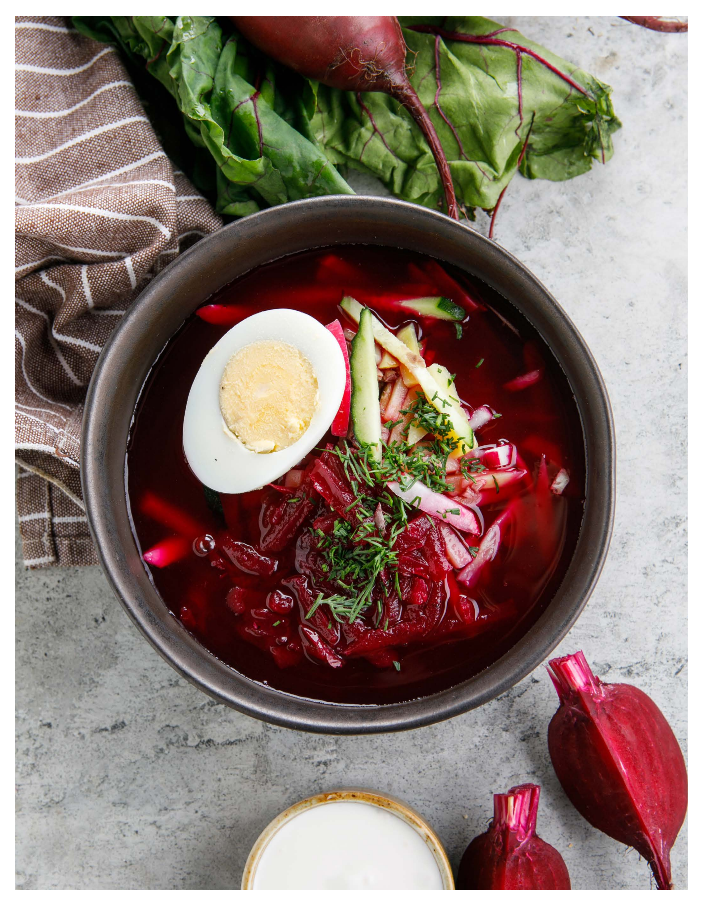
СВЕКОЛЬНИК BEETROOT SOUP