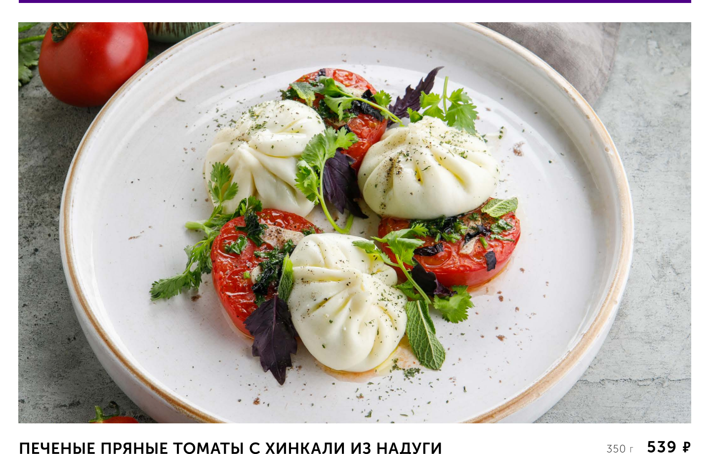
ПЕЧЕНЫЕ ПРЯНЫЕ TOMATЫ С ХИНКАЛИ ИЗ НАДУГИ BAKED SPICY TOMATOES WITH NADUGI KHINKALI