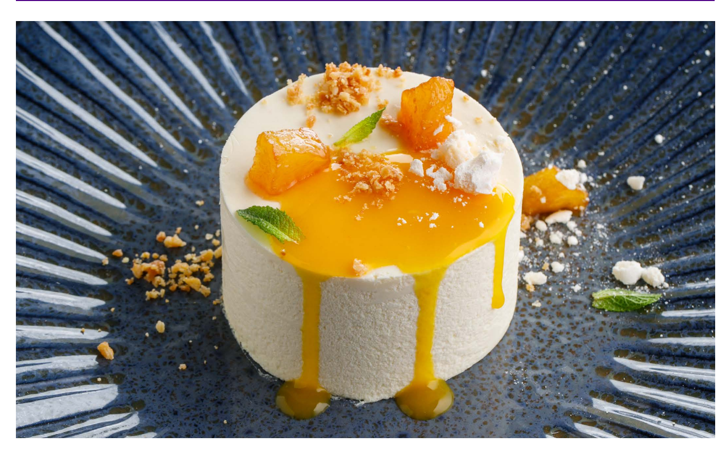
TAHHAKOTTA PANNA COTTA