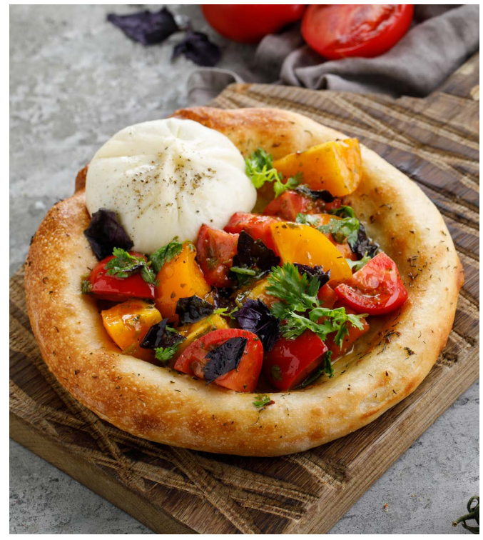
6 шт/70/10 г 489 Р СВАНСКАЯ ЛЕПЕШКА С НАДУГИ SVAN FLATBREAD WITH A NADUGI