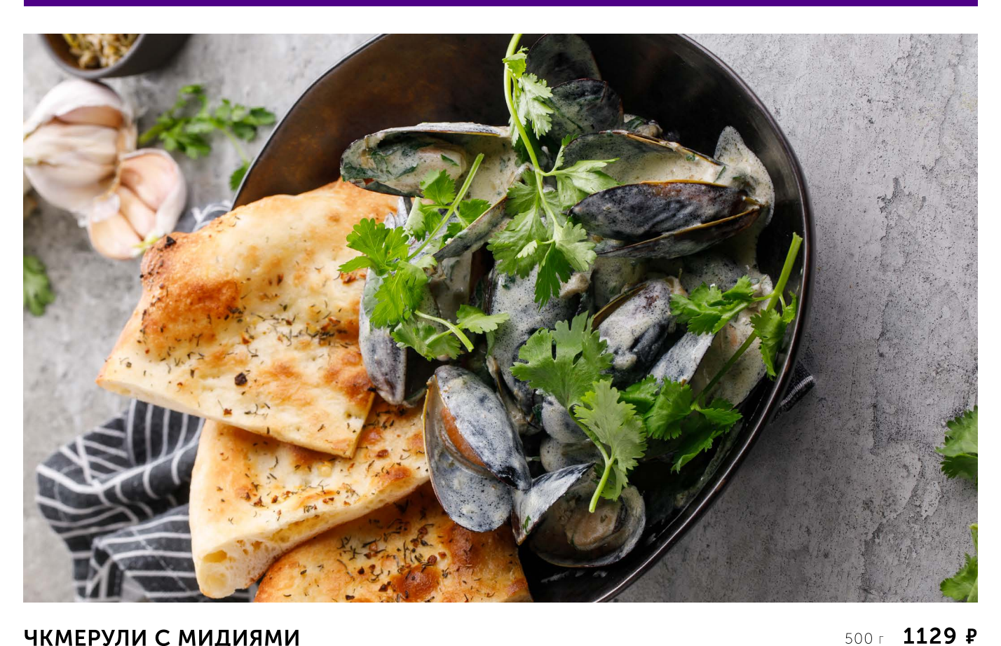
ЧКМЕРУЛИ С МИДИЯМИ CHKMERULI WITH MUSSELS