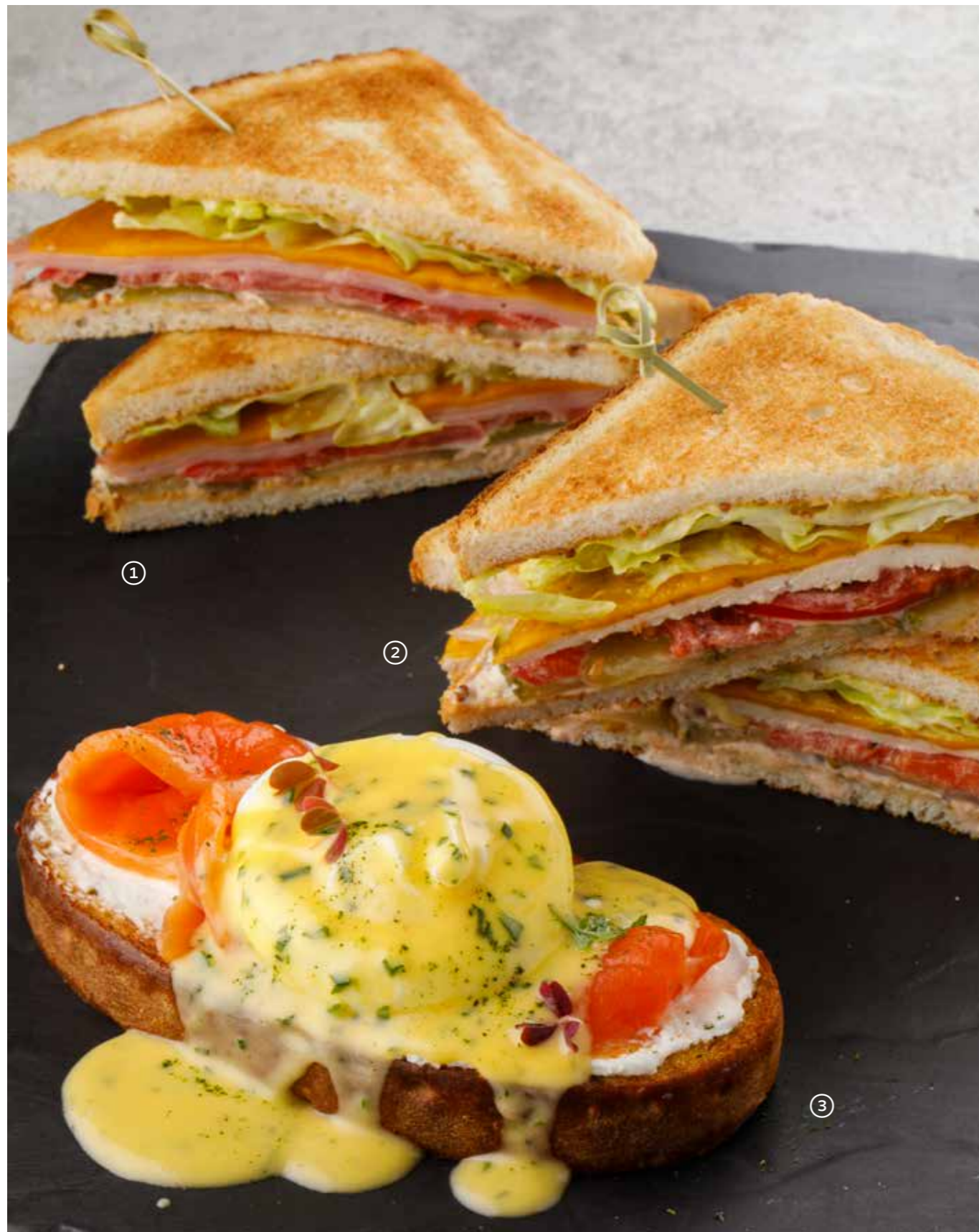
① Сэндвич с цыпленком