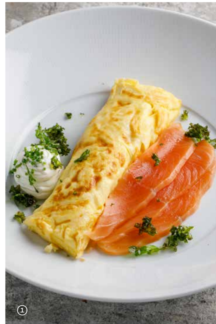
Яичница с беконом (бекон, томаты, грибы, лук)

Fried eggs with bacon (bacon, tomatoes, mushrooms, onion) 拼合煎蛋