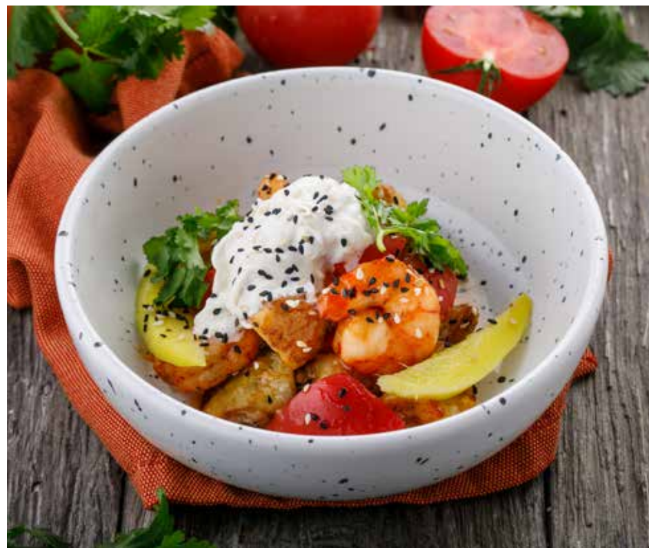
САЛАТ С БАКЛАЖАНАМИ И КРЕВЕТКАМИ