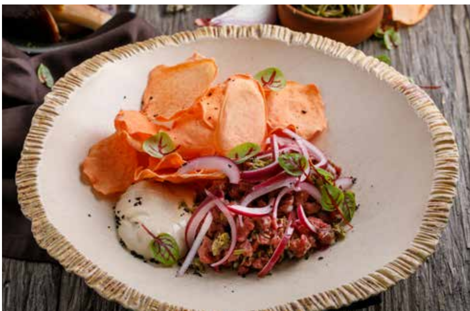
ТАРТАР ИЗ ГОВЯДИНЫ С ГРИБНЫМ СОУСОМ И ОВОЩНЫМИ ЧИПСАМИ