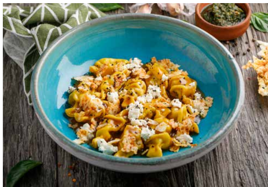
МОРКОВНЫЕ КВАРИ С ГОВЯДИНОЙ И НАДУГИ