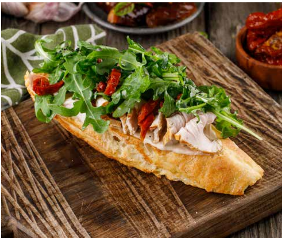
БРУСКЕТТА С ИНДЕЙКОЙ, ГРИБНЫМ СОУСОМ И ВЯЛЕНЫМИ ТОМАТАМИ