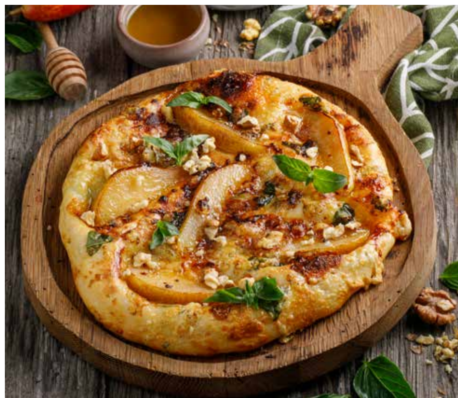
ХАЧАПУРИ С ГОРГОНЗОЛЫ И ГРУШЕЙ