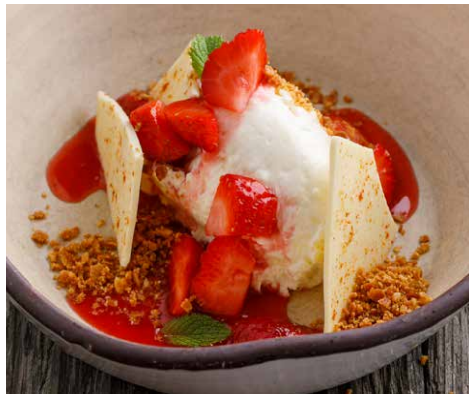
ШОКОЛАДНЫЙ ГАНАШ С СУЛУГУНИ И КЛУБНИКОЙ