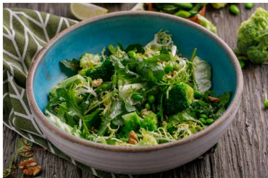
ЗЕЛЕНЫЙ САЛАТ С БРОККОЛИ И АВОКАДО