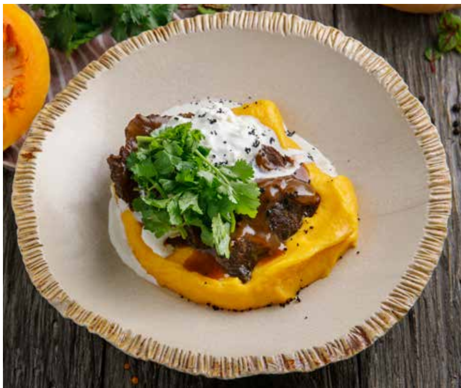
ГОВЯЖЬИ ЩЕЧКИ С ТЫКВЕННЫМ ЭЛАРДЖИ И СТРАЧАТЕЛЛОЙ