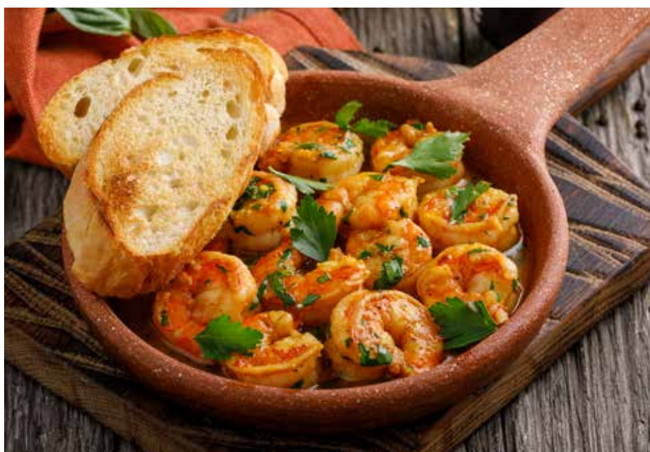
ЖАРЕННЫЕ КРЕВЕТКИ ПО-ГРУЗИНСКИ