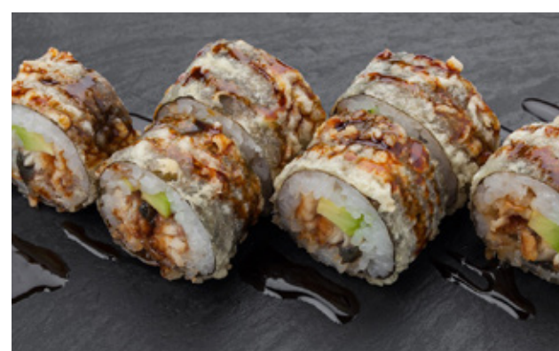
Все цены указаны в рублях с учетом НДС