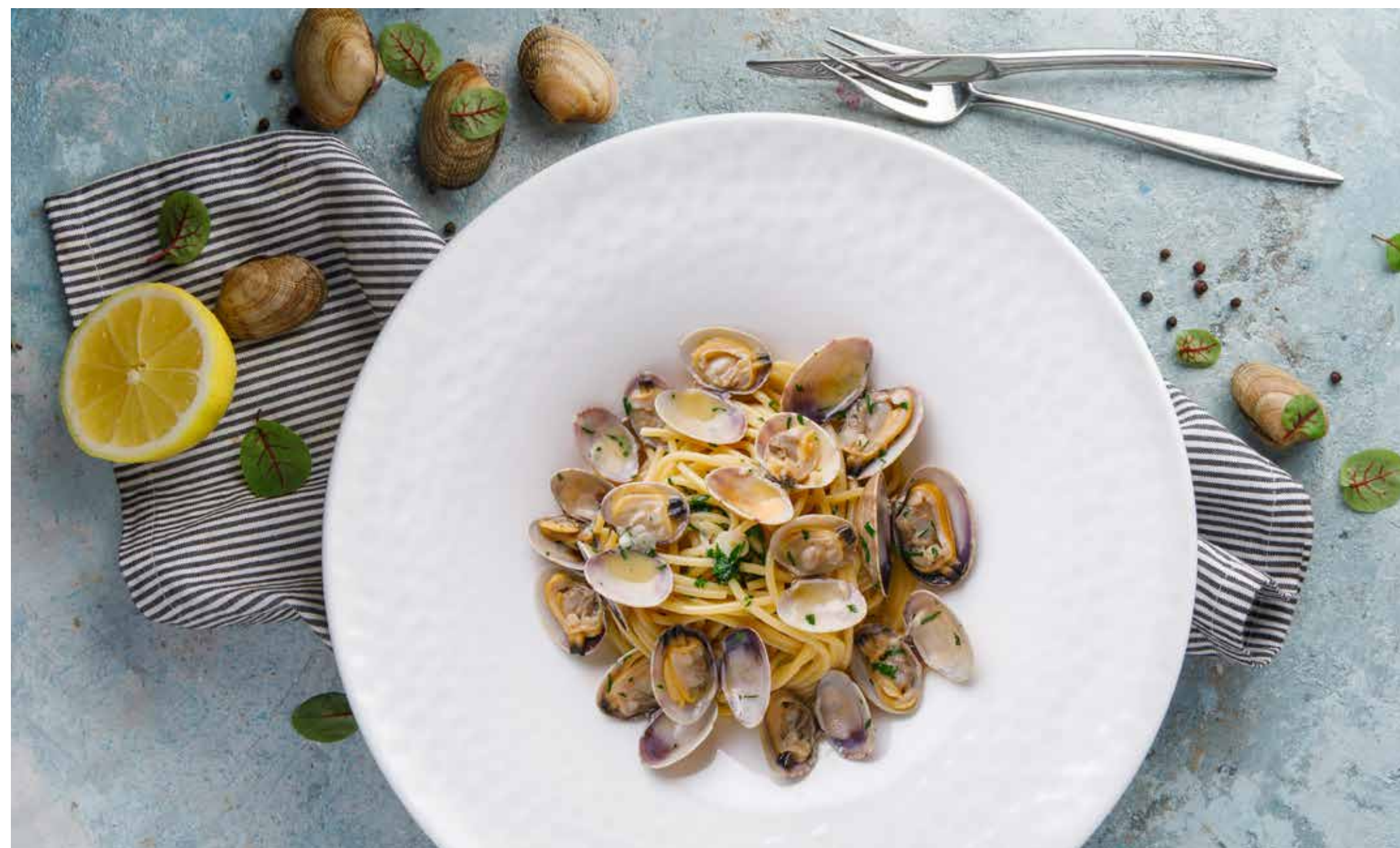
Спагетти с вонголе