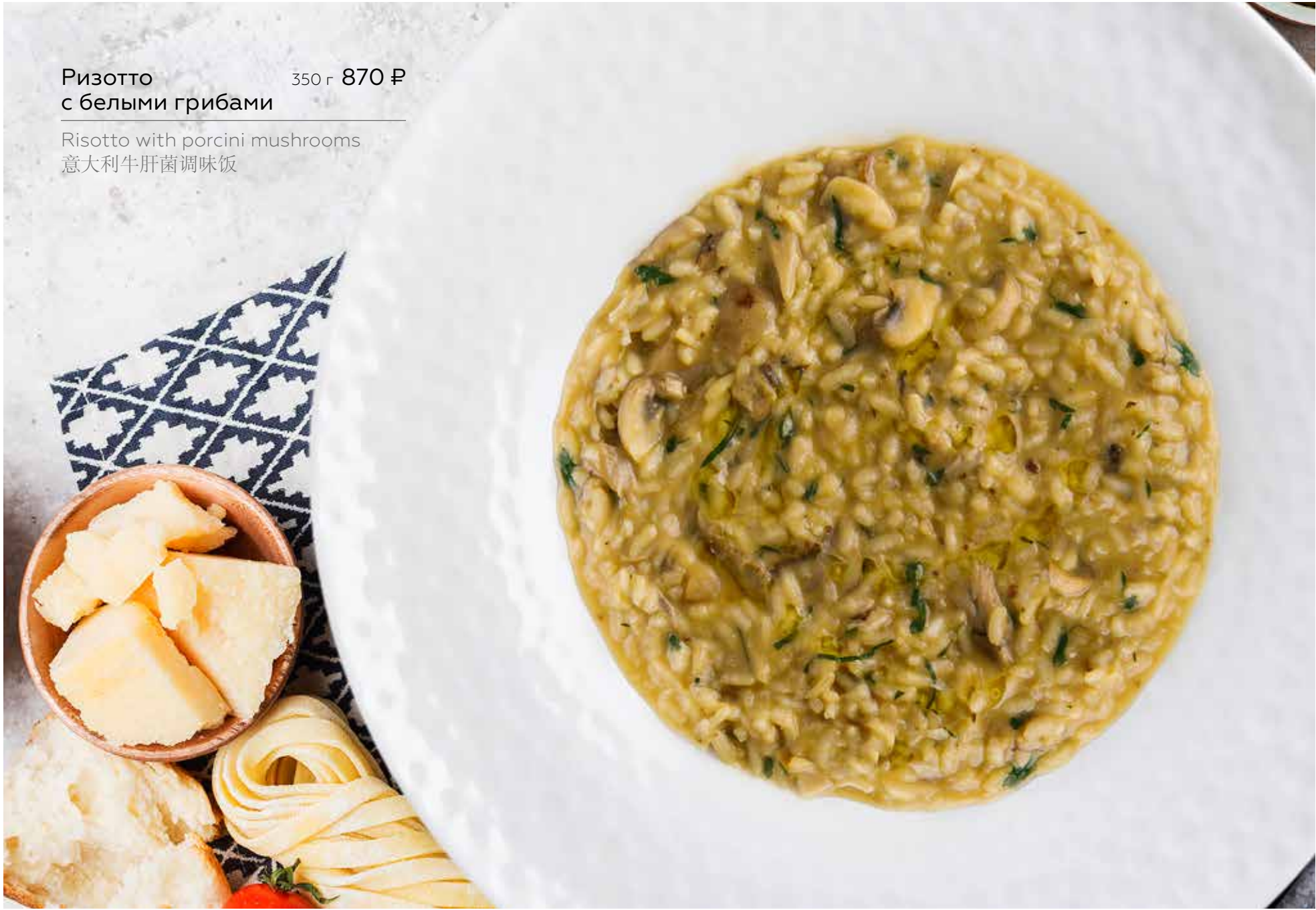
Ризотто с белыми грибами 350 г 870 Р Risotto with porcini mushrooms 意大利牛肝菌调味饭