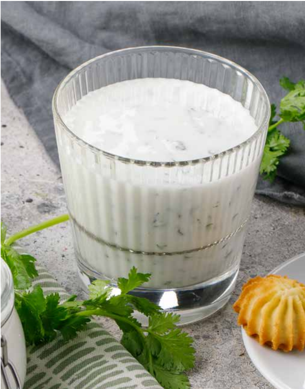
Айран 200 г 150 ₽ Ayran | 爱兰