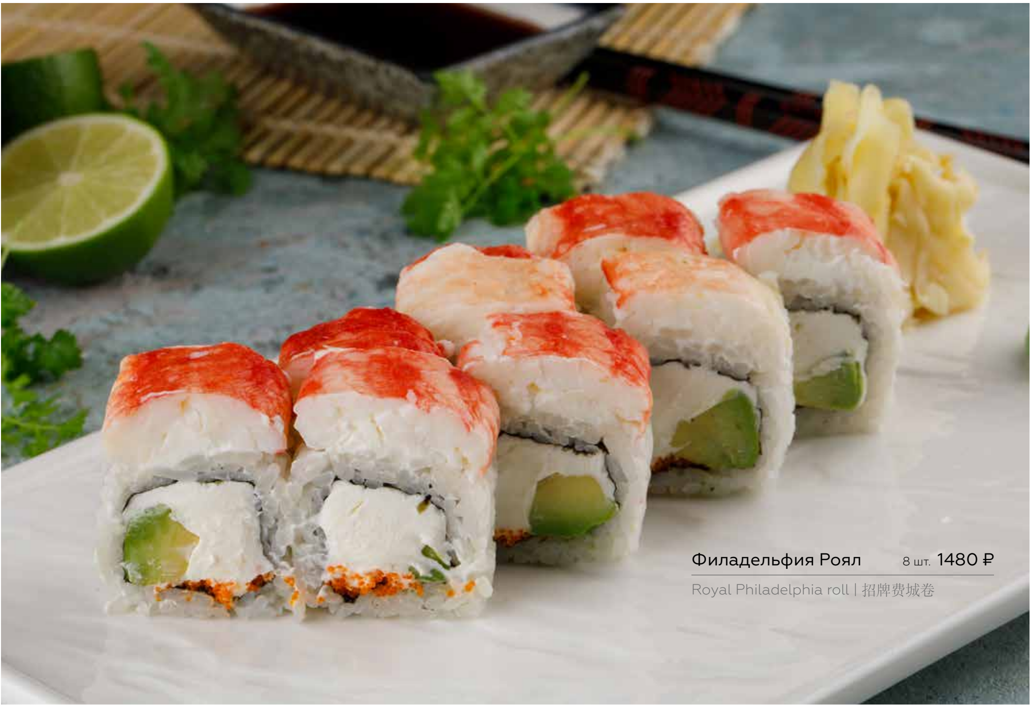
Филадельфия Роял 8 шт. 1480 ₺ Royal Philadelphia roll | 招牌费城卷