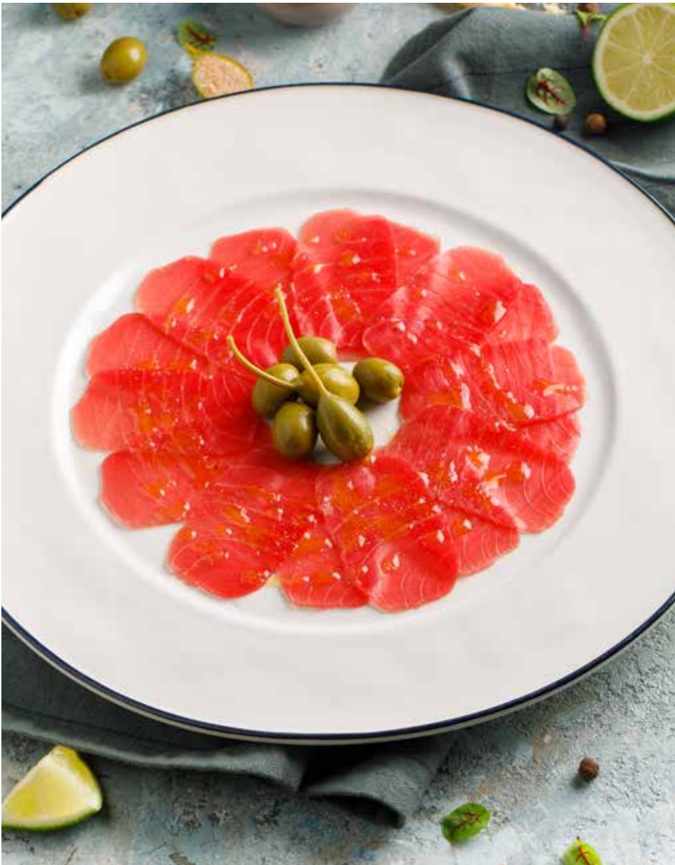
Карпаччо из тунца 110 г 950 ₽ Tuna carpaccio | 意式薄切吞拿鱼