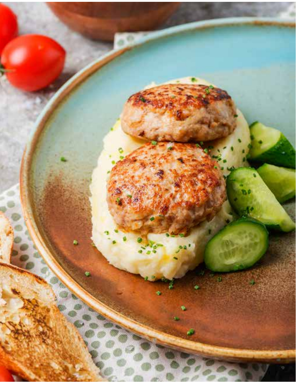
Куриные котлеты с картофельным пюре 140/150/40 г 490 ₽ Chicken cutlets with mashed potatoes | 鸡肉饼配土豆泥