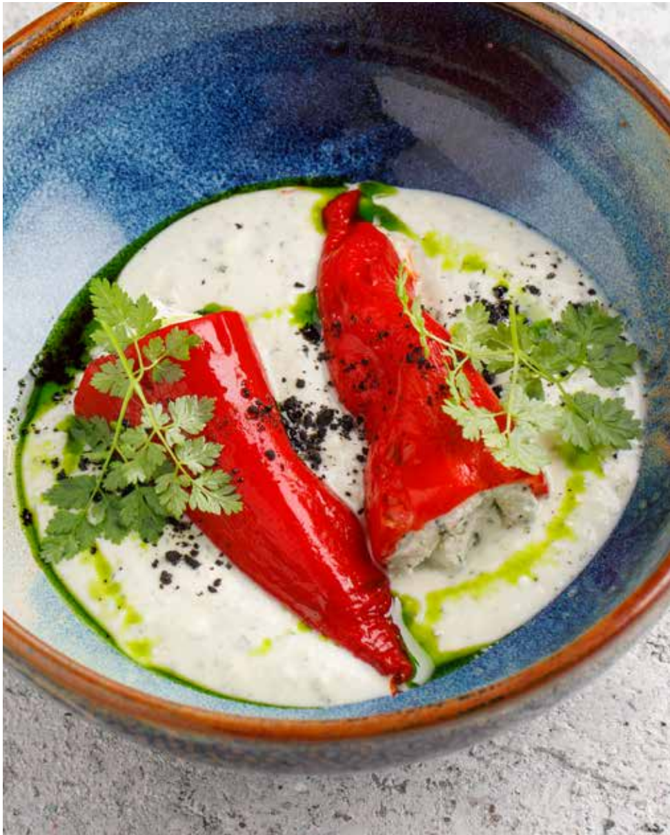
Печеные перцы с надуги и соусом гебжалия 170 г 320 ₽ Baked peppers with nadugi cheese and gebjalia sauce 烤辣椒配奶油乳渣奶酪和薄荷苏尔古尼酱