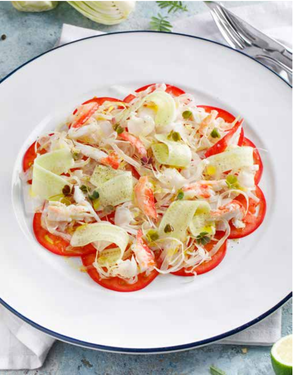
Карпаччо из сельдерея, фенхеля и краба 165 г 730 Р Celery, fennel and crab carpaccio | 芹菜茴香蟹薄切薄片