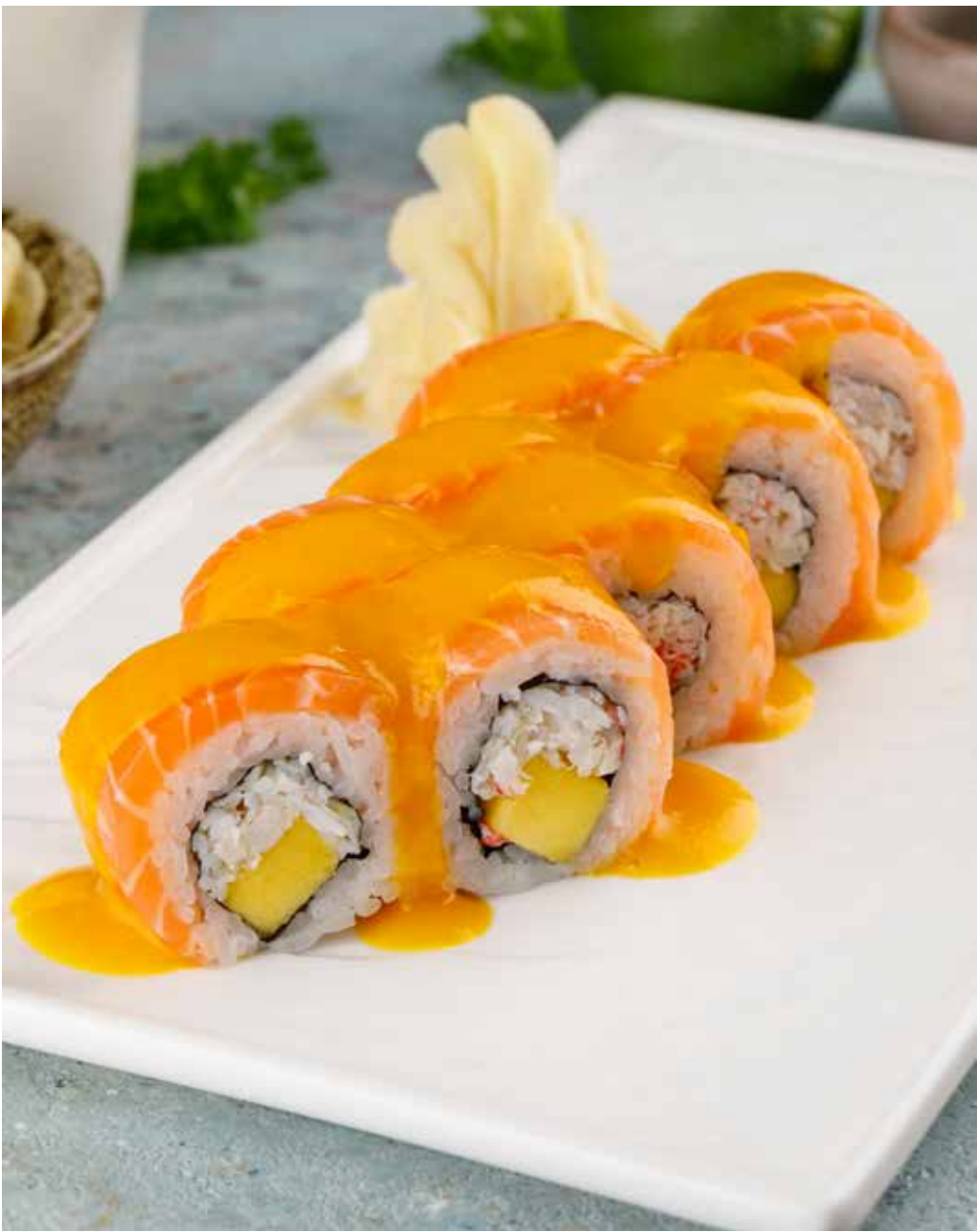
Ролл с острым крабом, манго и лососем 8 шт. 1260 Р Roll with spicy crab, mango and salmon | 辣螃蟹芒果三文鱼卷