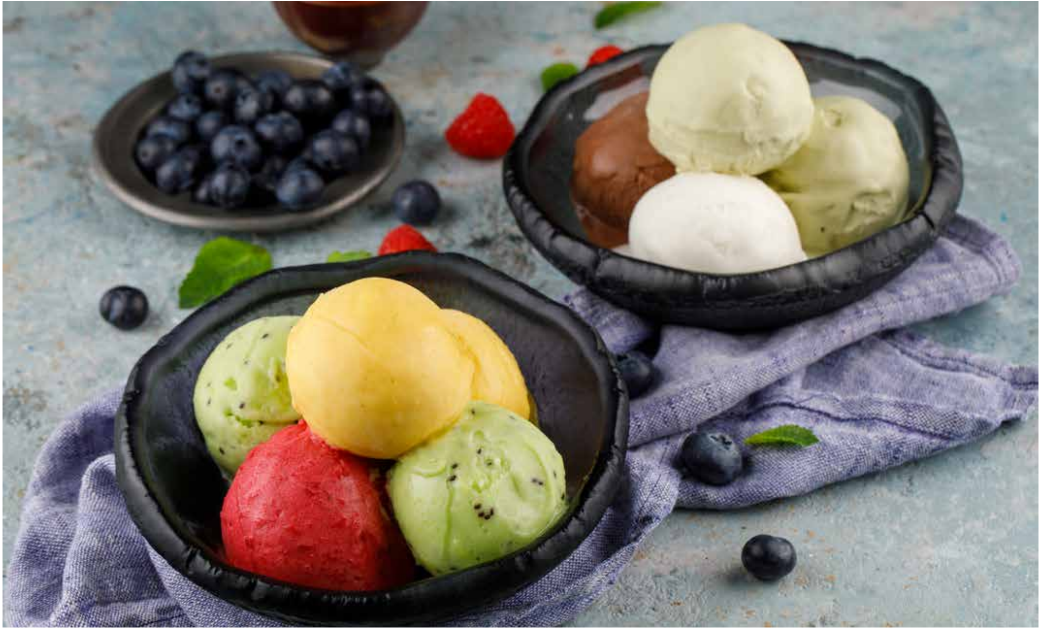
Мороженое в ассортименте Assorted ice cream | 香草冰淇淋 / 巧克力冰淇淋 1 шарик 110 ₺