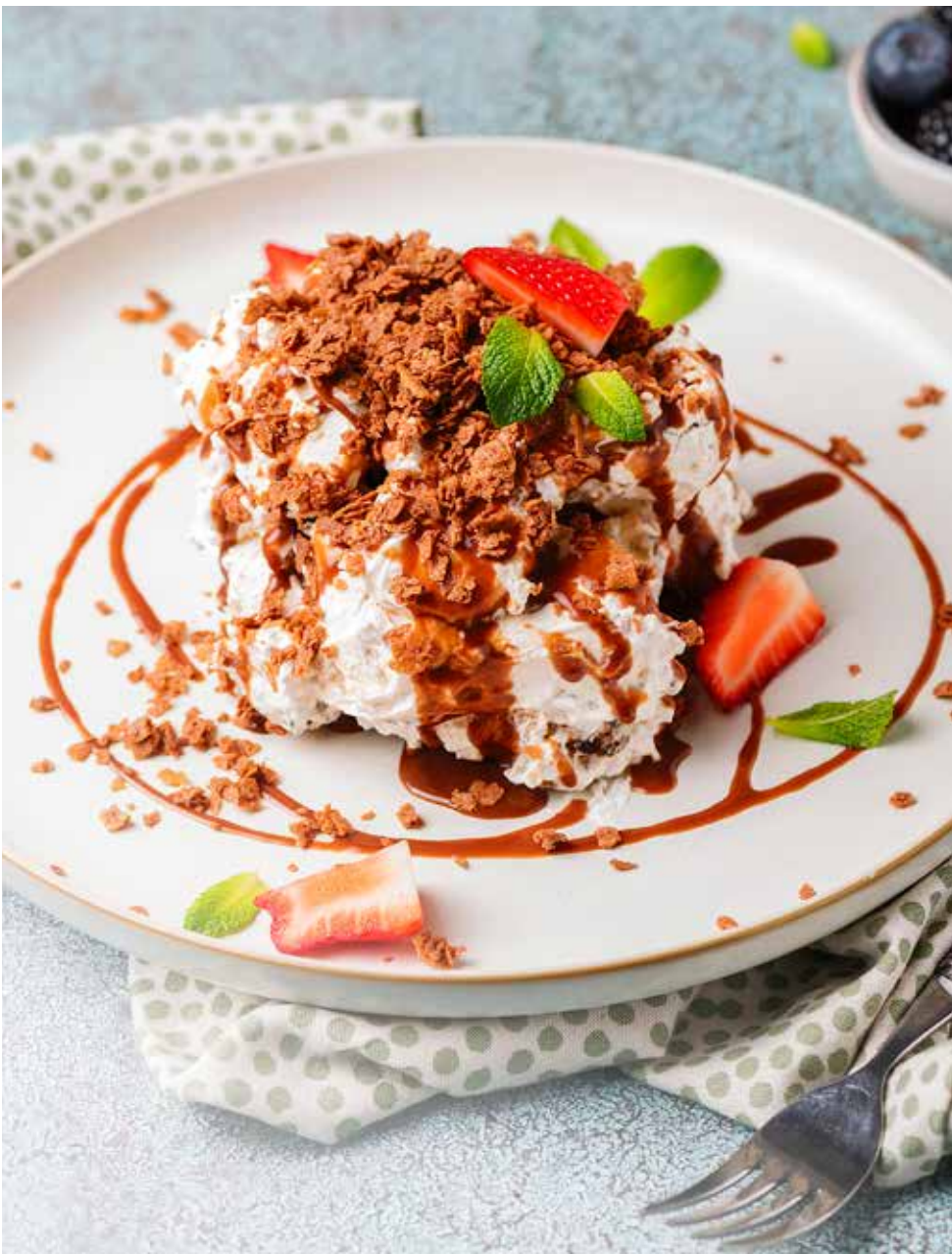
Графские развалины 170/30/15/10 г 420 ₽ Ruins of Count's castle | “伯爵的宫殿遗址” 传统酸奶油蛋糕