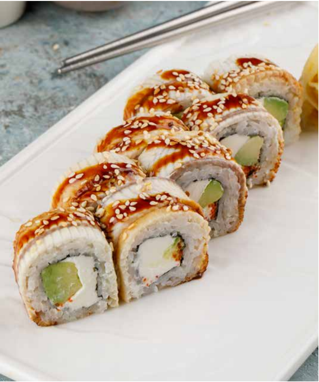
Филадельфия с угрем 8 шт. 1250 ₺ Philadelphia eel roll | 鳗鱼费城卷