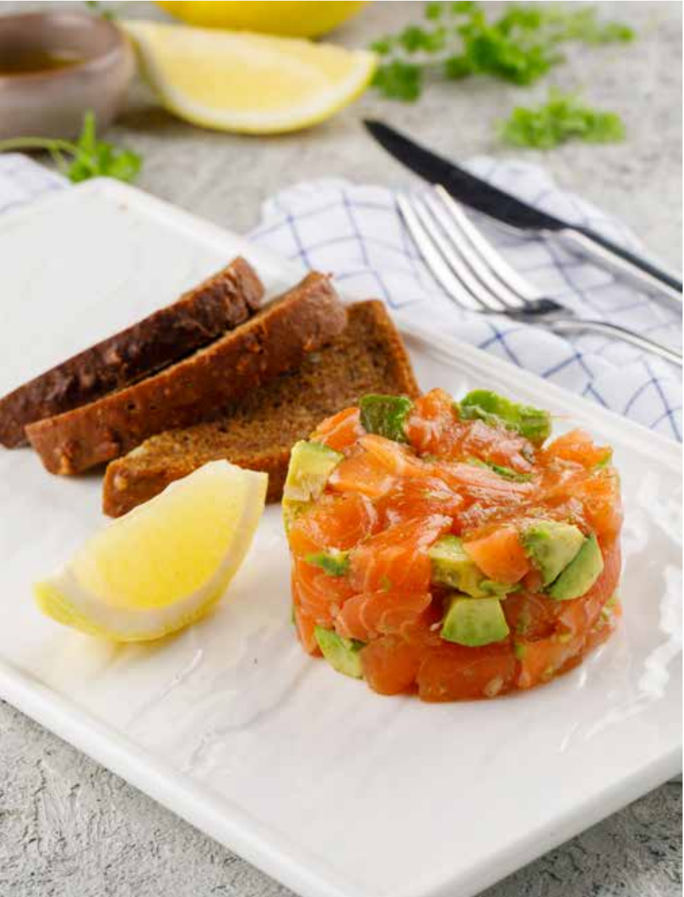
Тартар из лосося с авокадо 140/30 г 890 Р Salmon tartare with avocado | 三文鱼牛油果塔塔