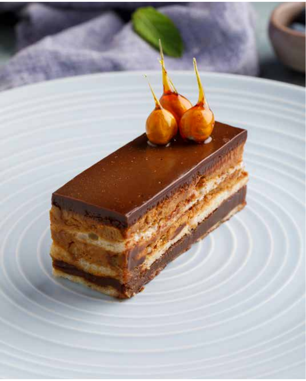
Ореховое пралине 130/15 г 450 ₽ Nut Praline | 果仁糖