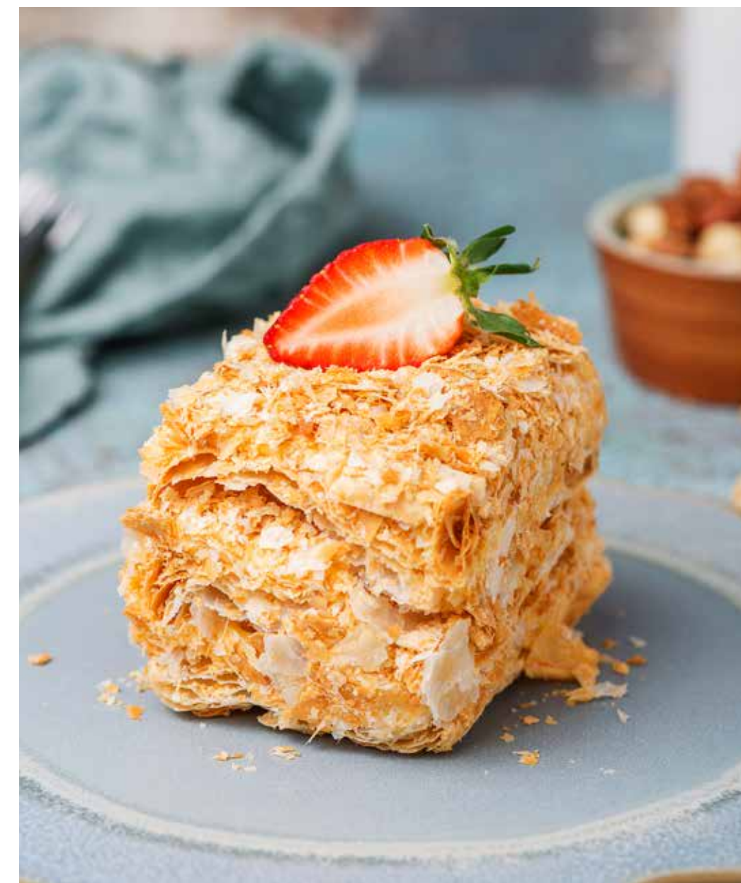
Наполеон 190 г 390 ₽ Napoleon cake (layered dough filled with a custard cream) 拿破仑蛋糕

ПРОСЬБА ПРЕДУПРЕЖДАТЬ ВАШЕГО ОФИЦИАНТА ОБ ИМЮЩЕЙСЯ У ВАС АЛЛЕРГИИ НА ОПРЕДЕЛЕННЫЕ ПРОДУКТЫ ПИТАНИЯ. ВСЕ ЦЕНЫ УКАЗАНЫ В РУБЛЯХ. НА ФОТО ИСПОЛЬЗОВАНЫ ЭЛЕМЕНТЫ ДЕКОРА. ДАННОЕ ИЗДАНИЕ ЯВЛЯЕТСЯ РЕКЛАМНЫМ МАТЕРИАЛОМ. С ГРЕЙСКОРАНТОМ, ВЫХОДОМ, ПИЩЕВОЙ И ЭНЕРГЕТИЧЕСКОЙ ЦЕННОСТЬЮ БЛЮД И ДРУГОЙ ИНФОРМАЦИЕЙ МОЖНО ОЗНАКОМИТЬСЯ В УГОЛКЕ ПОТРЕБИТЕЛЯ. PLEASE, TELL YOUR WAITER IF YOU HAVE ANY FOOD ALLERGY TO CERTAIN PRODUCTS. ALL PRICES ARE IN RUBLES. THE PICTURES HAVE DECORATIVE ELEMENTS. 如果您对某些饮食会有过敏反应, 请通知您的服务员。所有价格为卢布价。