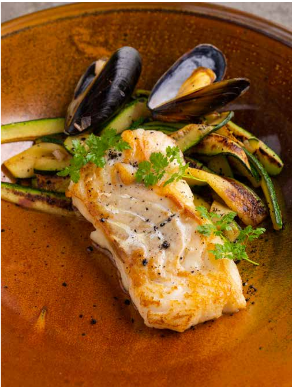
Треска на подушке из цукини 320 г 850 ₽ Cod on the bed of zucchini | 西葫芦鳕鱼