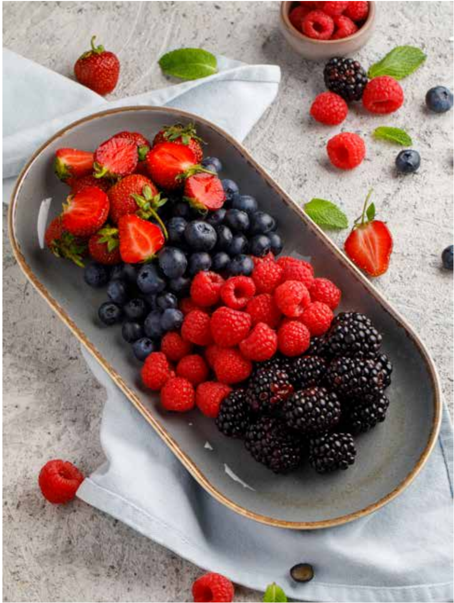
Ягодная тарелка Berry plate | 浆果大盘 400 г 2900 ₺