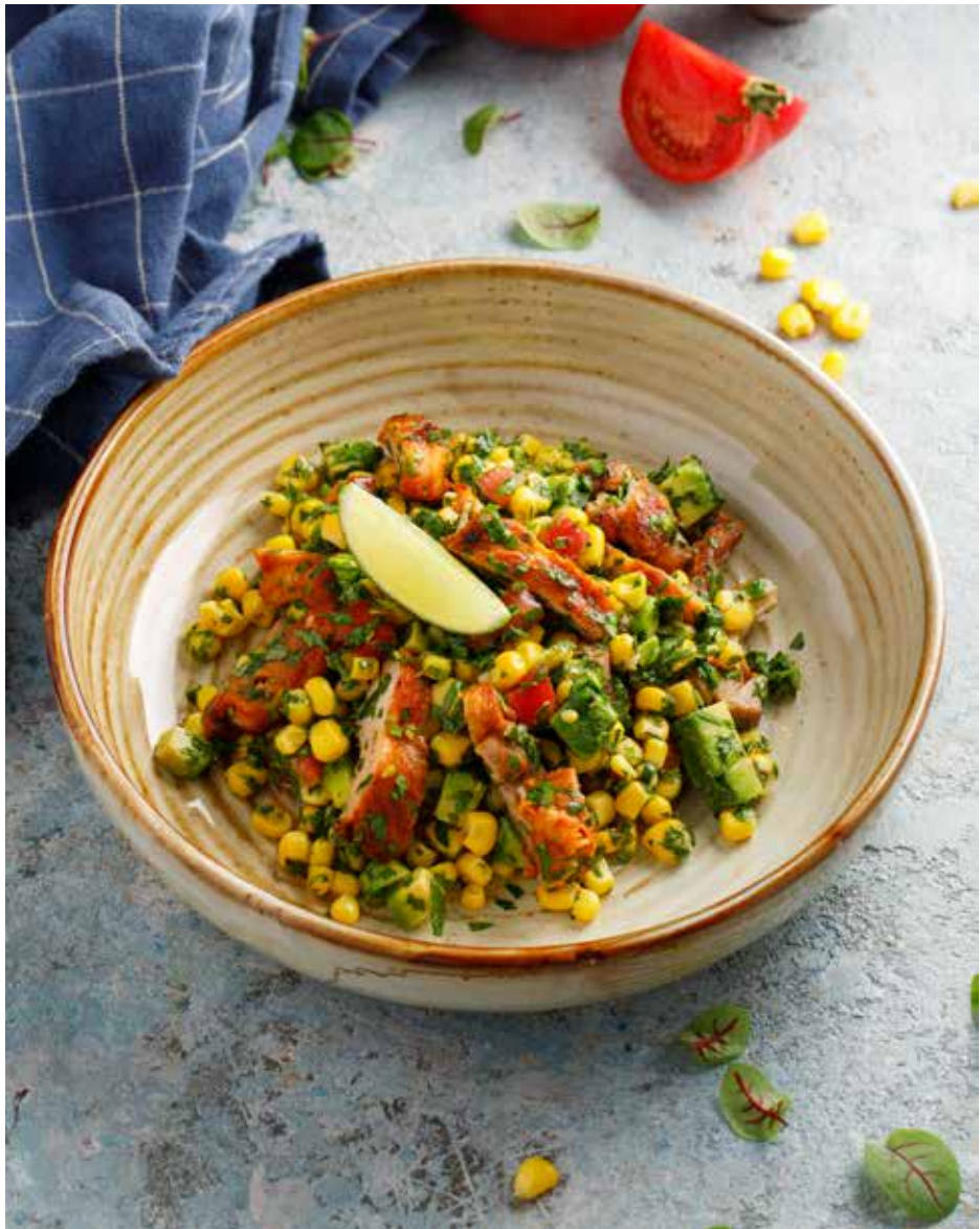
Салат с кукурузой и цыпленком