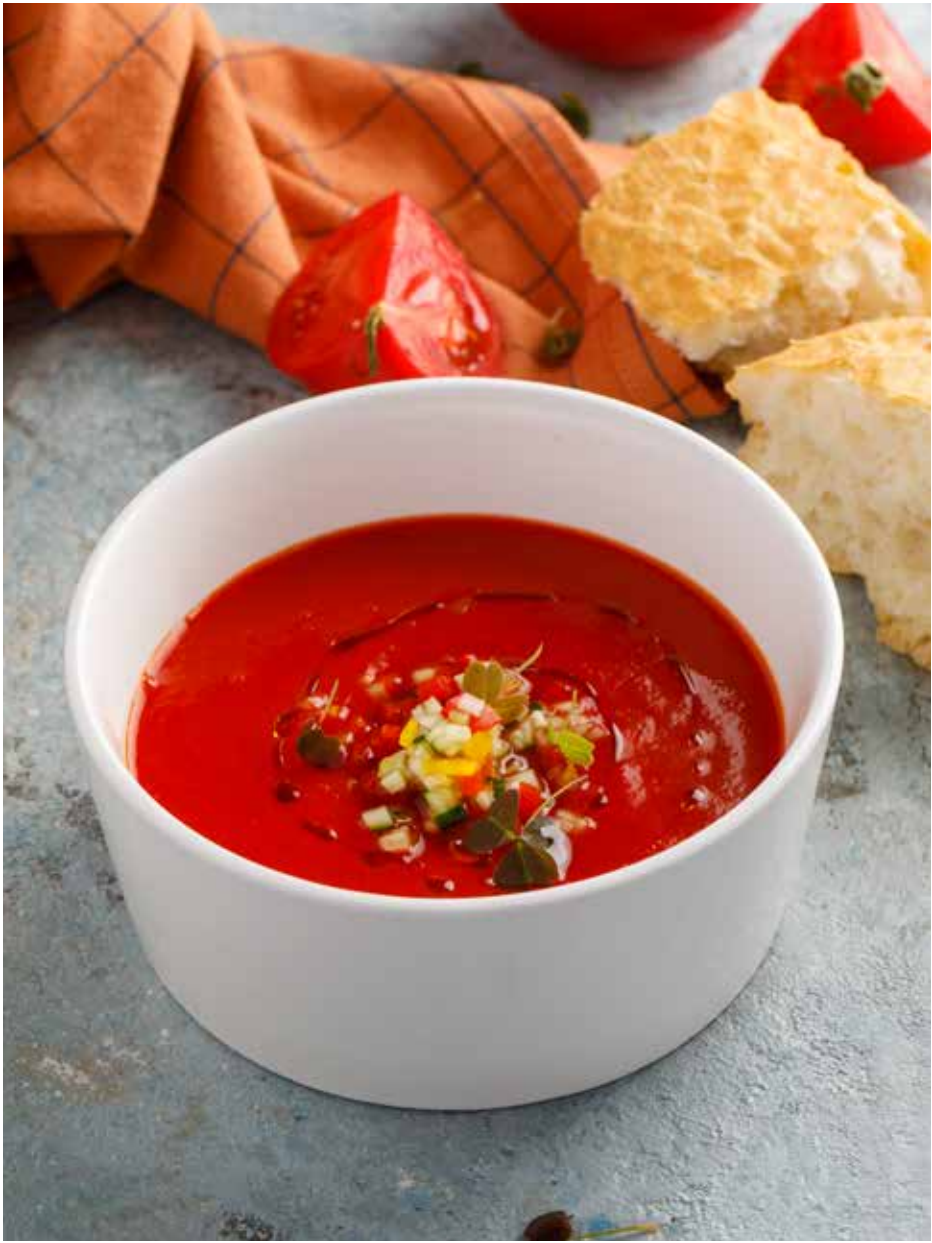
Гаспачо 270/10 г 410 ₽ Gazpacho | 西班牙凉菜汤