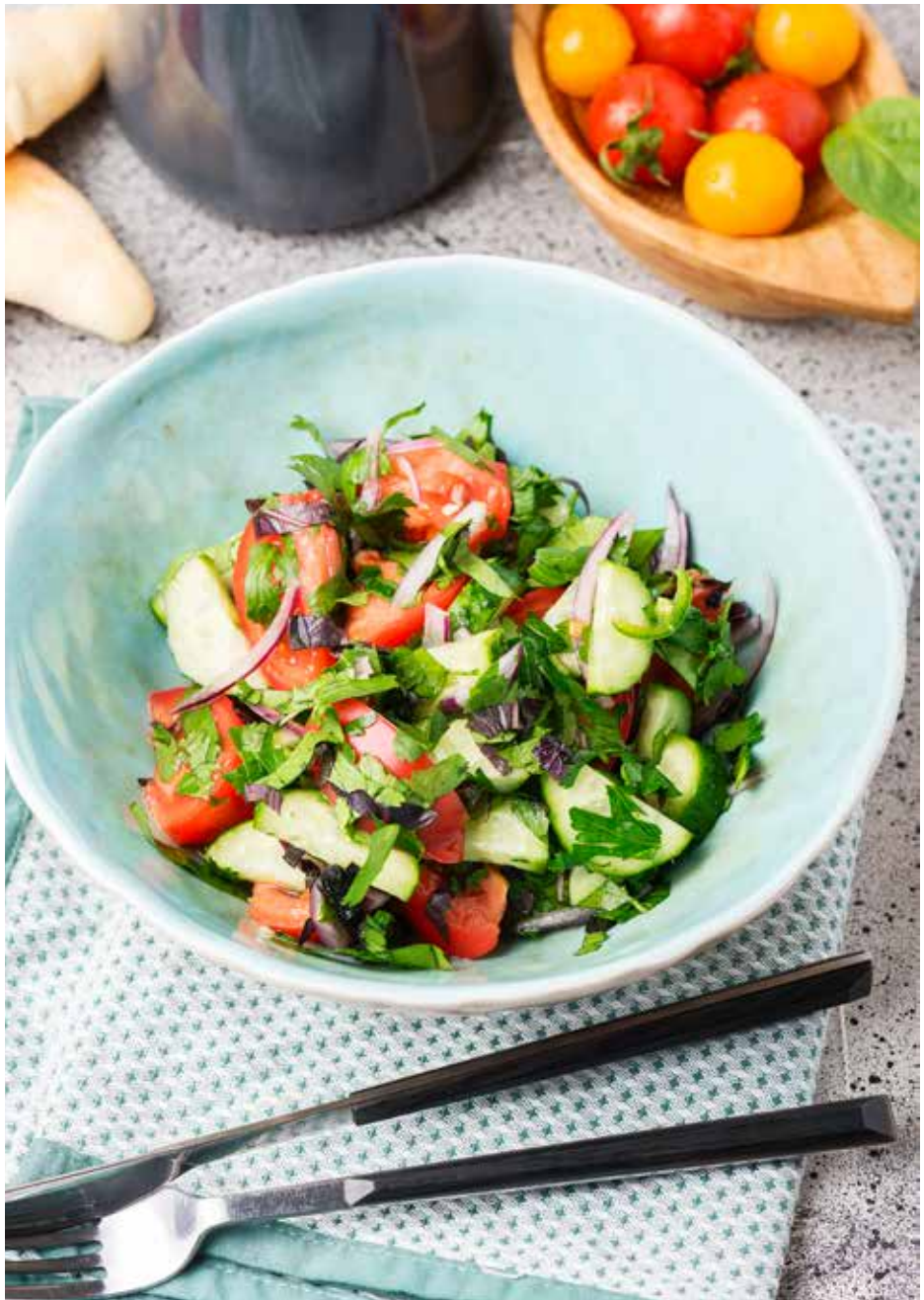
Овощной салат по-грузински со специями