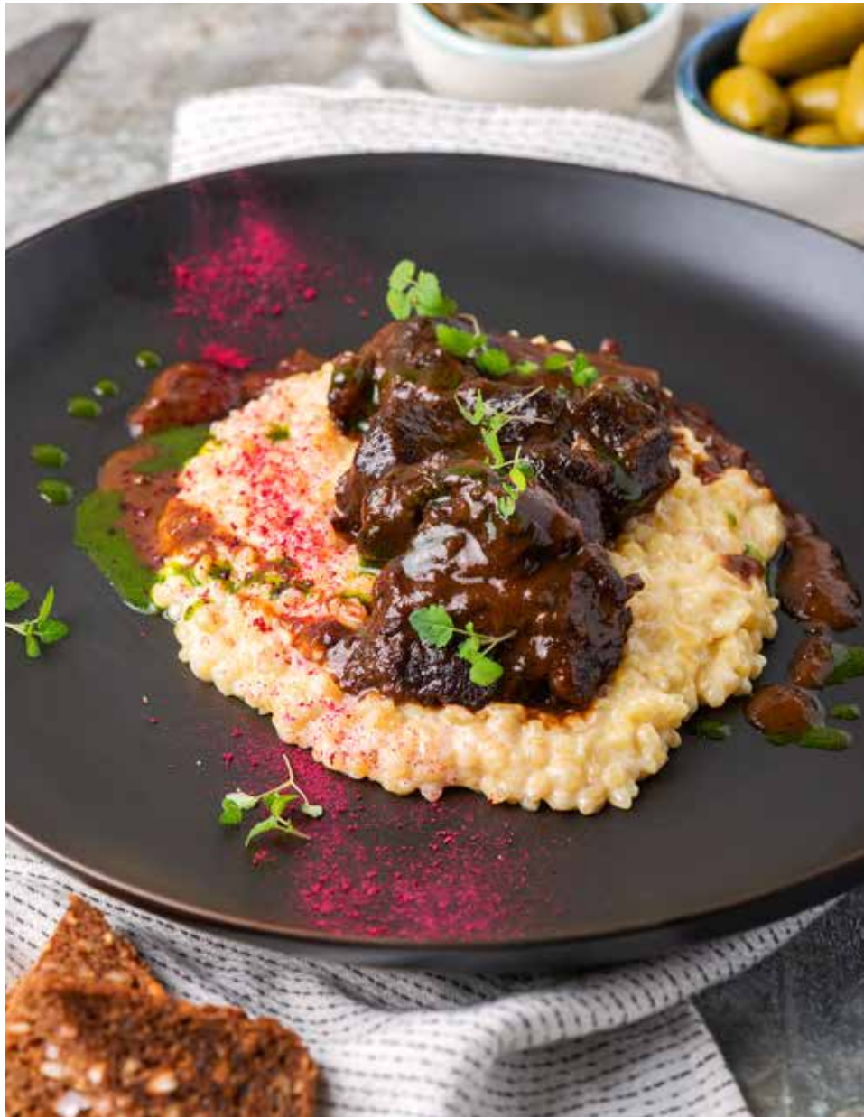
Телячьи щечки, тушенные с булгуром 150/200/50 г 890 ₽ Veal cheeks braised with bulgur | 焖牛肉腮配布格麦