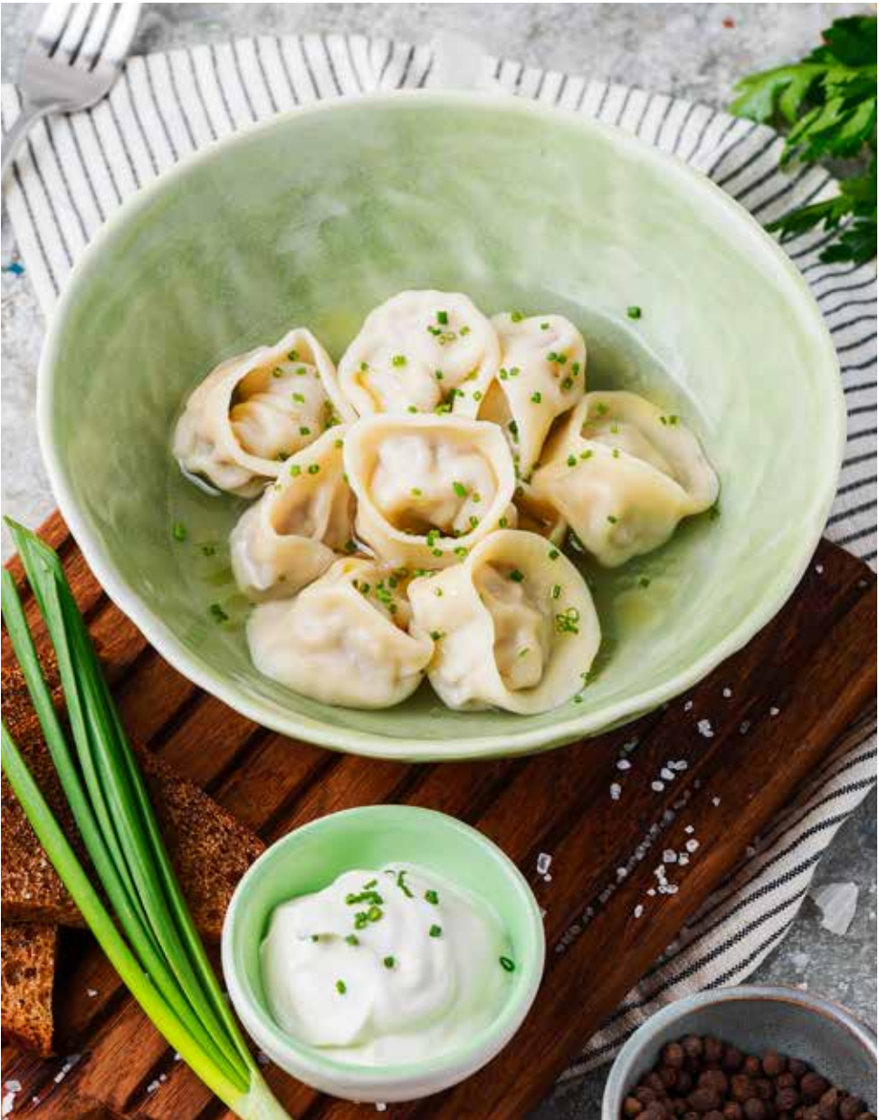
Сибирские пельмени 230/50 г 420 ₽ Siberian dumplings | 西伯利亚饺子