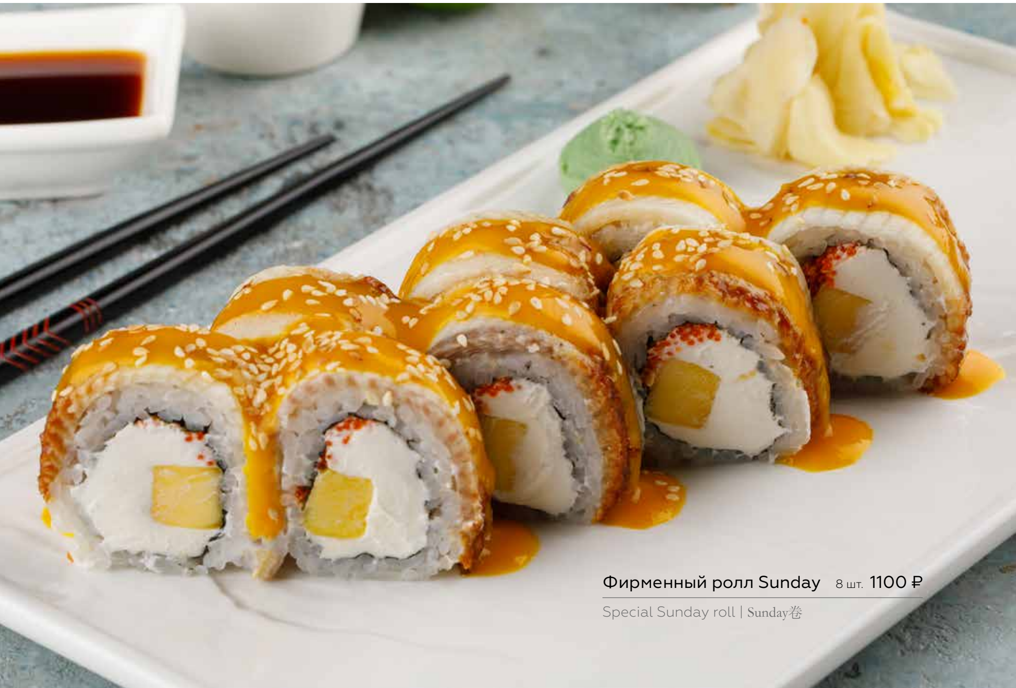
Фирменный ролл Sunday 8 шт. 1100 ₹

Hot roll with smoked salmon and red caviar 熏三文鱼红鱼子酱热卷