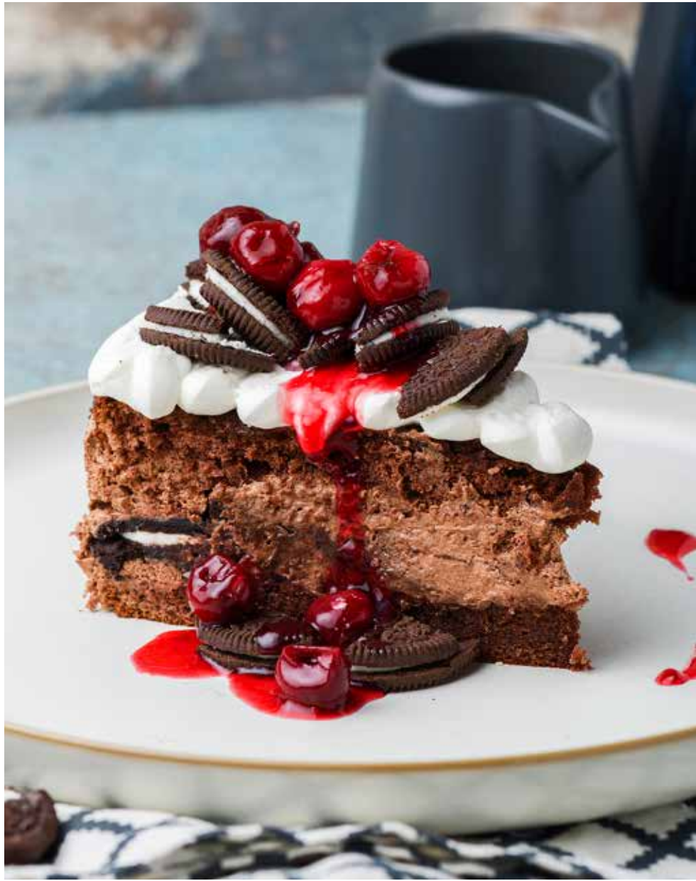
Шоколадно-вишневый торт 240 г 340 ₽ Chocolate and cherry cake | 巧克力樱桃蛋糕