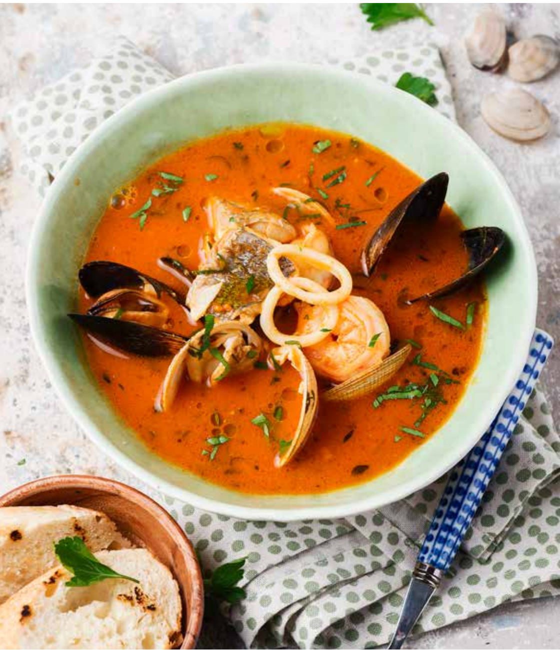
Суп средиземноморский 420 г 1150 ₽ Mediterranean soup | 地中海蔬菜汤