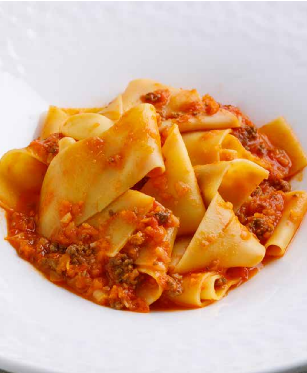
Паппарделле Болоньезе 300 г 550 Р Pappardelle Bolognese | 肉酱意大利宽面