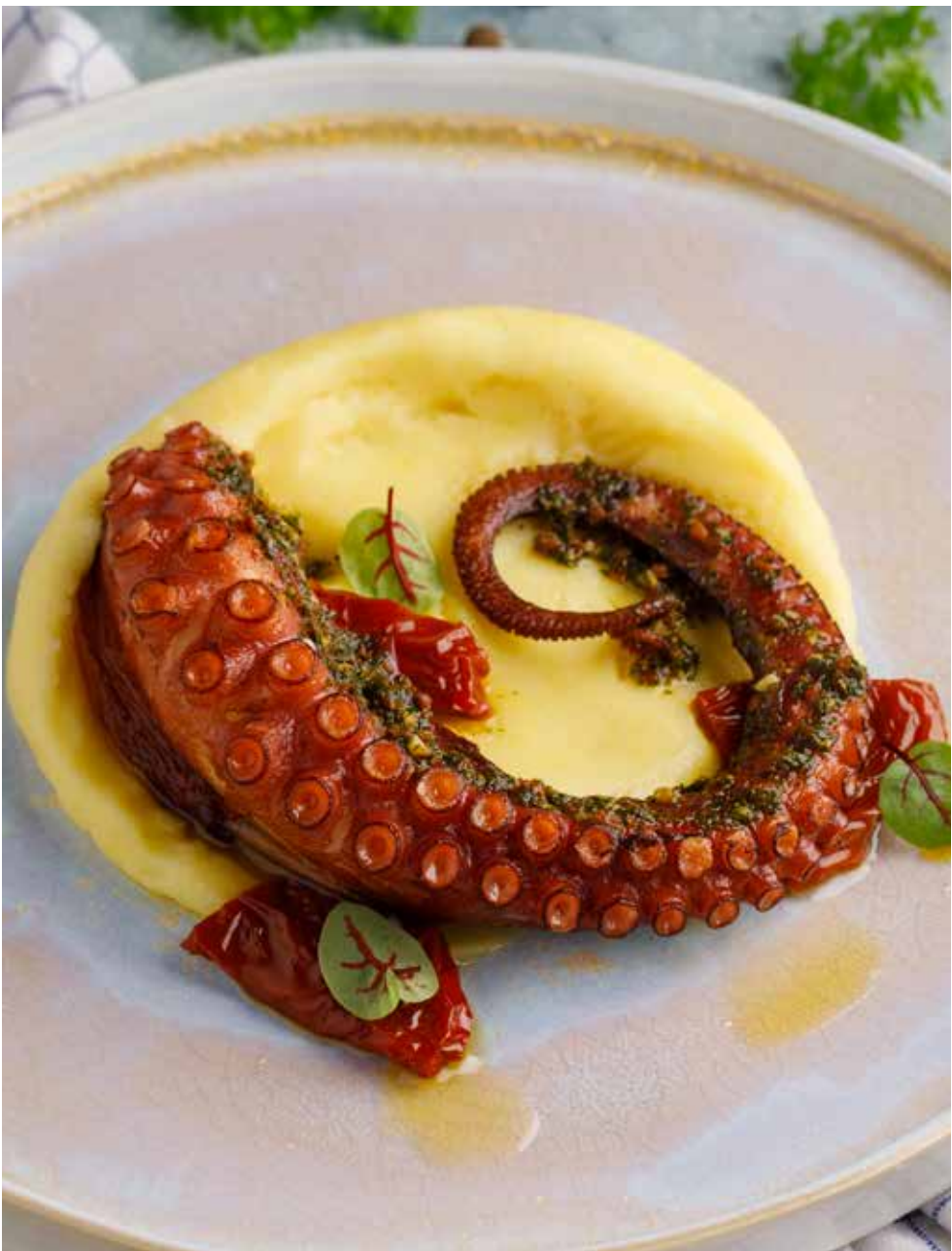
Осьминог по-галисийски 320 г 2450 ₽ Galician octopus | 焖八爪鱼