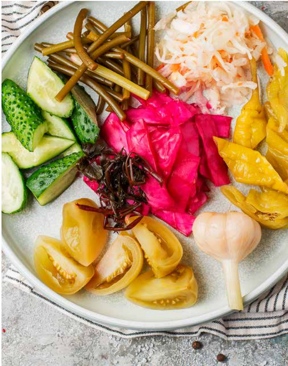
Соленья из бочки 350 г 450 ₽ Pickles from the barrel | 大桶泡菜