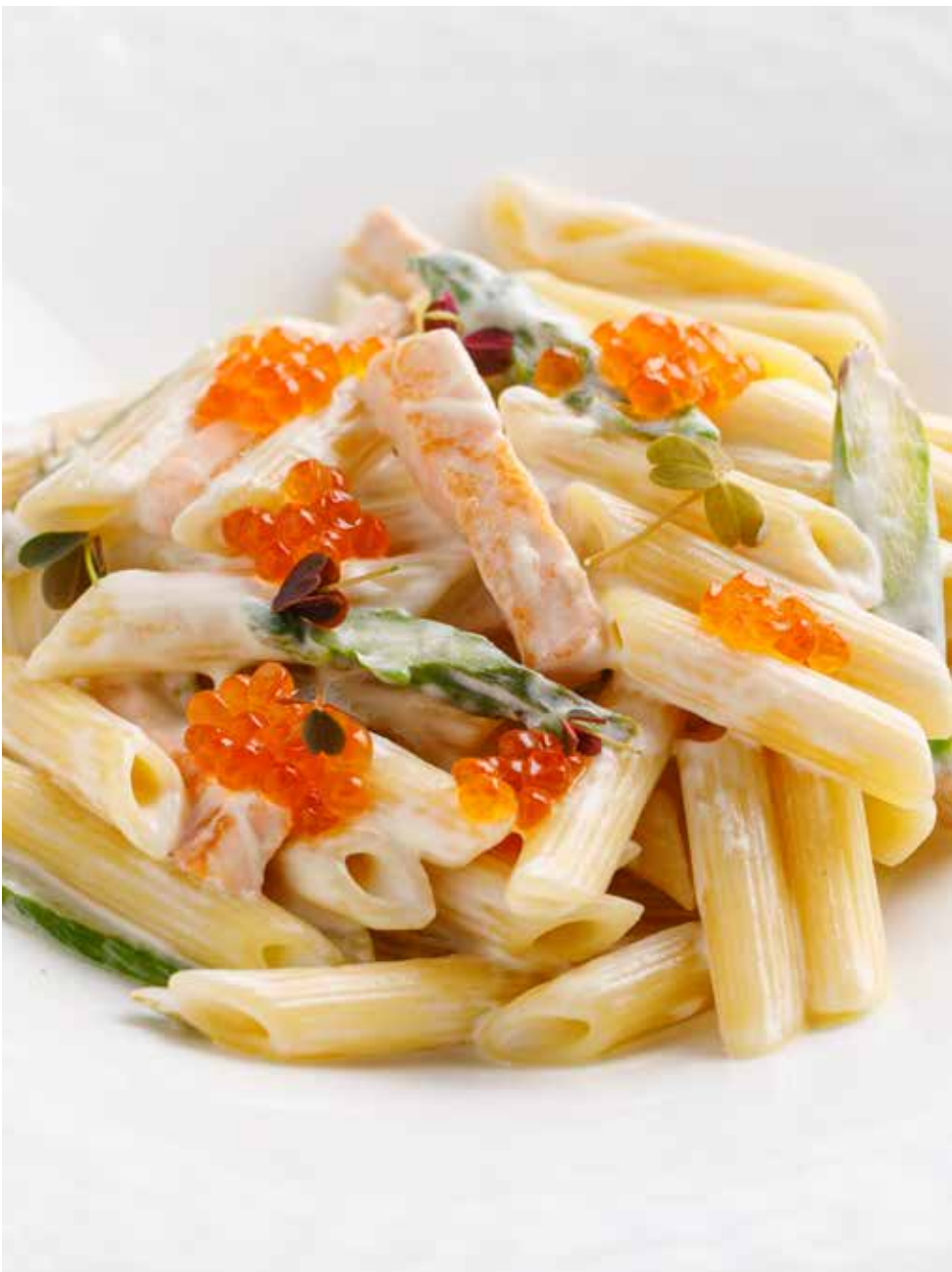
Пенне с лососем и спаржей 300 г 790 Р Penne with salmon and asparagus | 芦笋三文鱼鹅毛笔通心粉