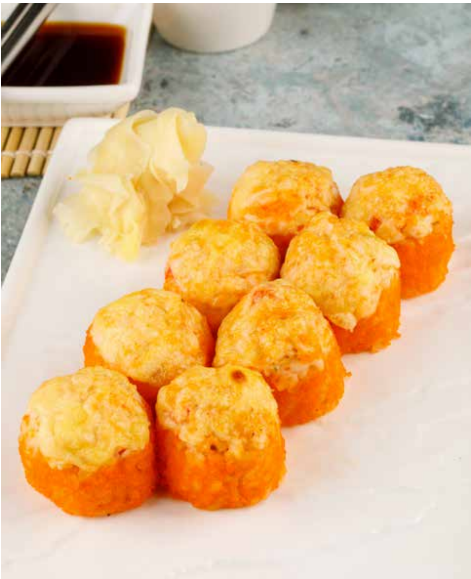
① Запеченный ролл с лососем и угрем 6 шт. 950 ₹

Baked roll with salmon and eel | 三文鱼鳗鱼烤卷