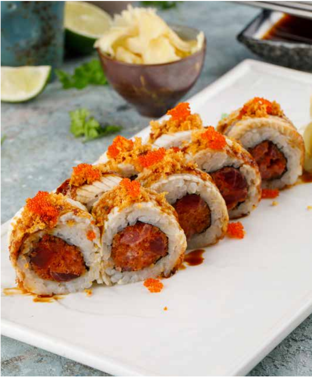
Ролл с угрем и острым тунцом 8 шт. 1360 Р Eel and spicy tuna roll | 鳗鱼辣枪鱼卷