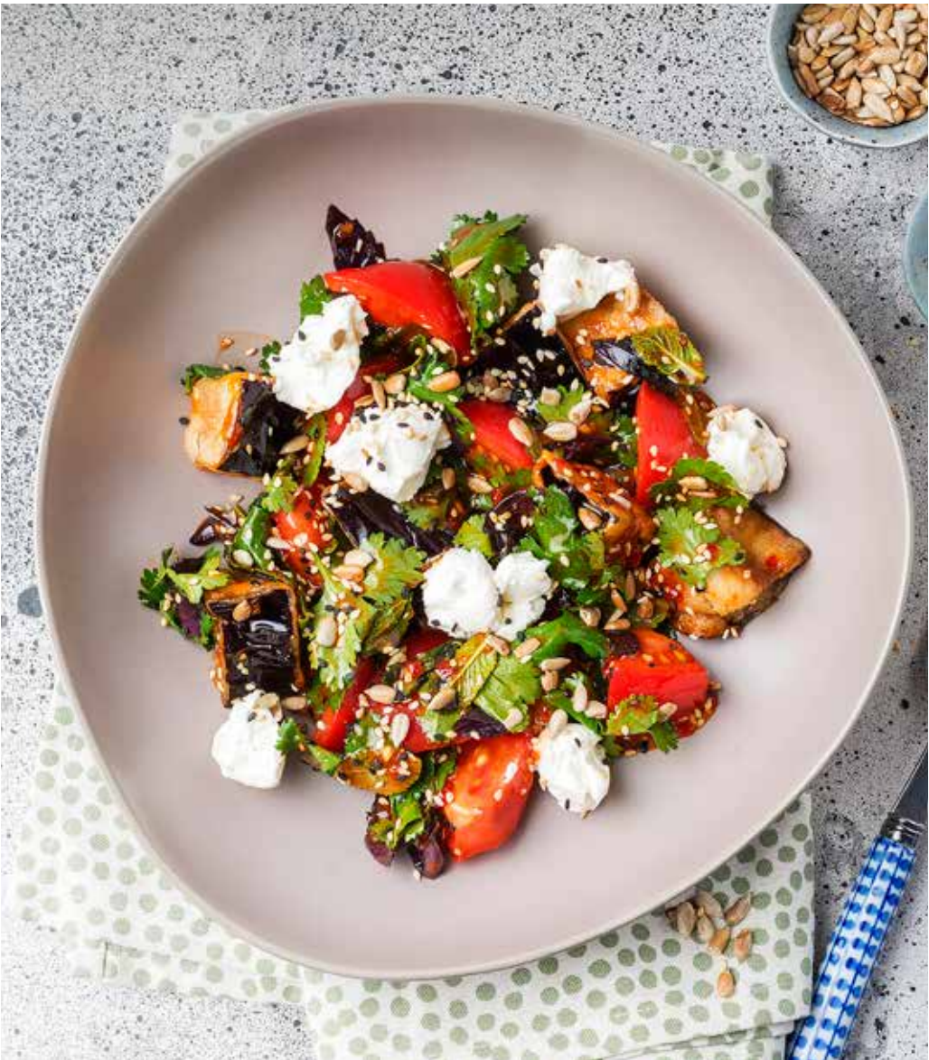
Салат с хрустящими баклажанами