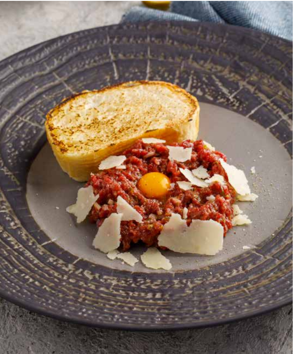
Тартар из фермерской говядины 140 г 650 Р Farm beef tartare | 农家牛肉塔塔