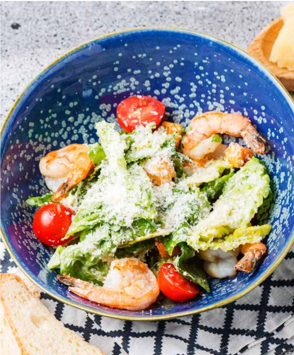
Салат «Цезарь» с куриным бедром / с креветками Caesar salad with chicken thigh / shrimps 鸡大腿凯撒沙拉 / 海虾凯撒沙拉