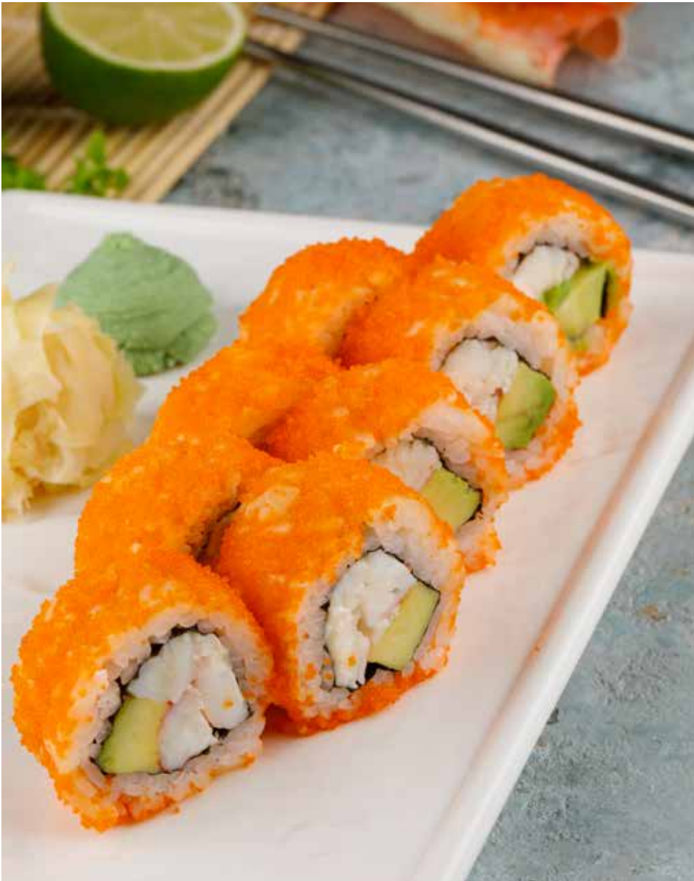
Калифорния с крабом 8 шт. 1480 Р California roll with crab | 螃蟹加州卷