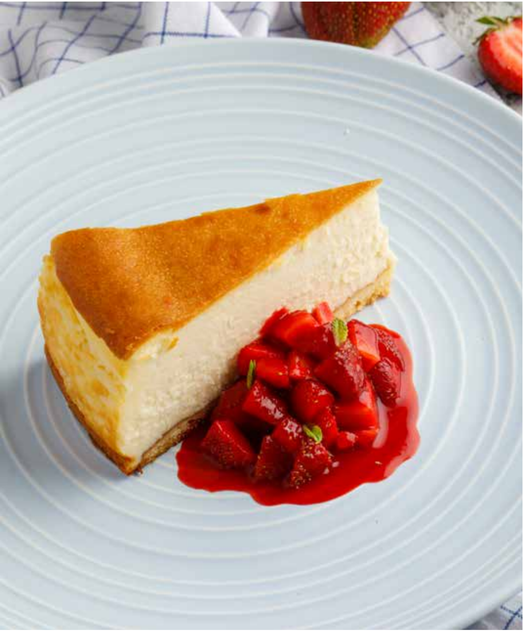
Чизкейк с клубничным соусом 225 г 420 ₽ Cheesecake with strawberry sauce | 草莓果酱芝士蛋糕