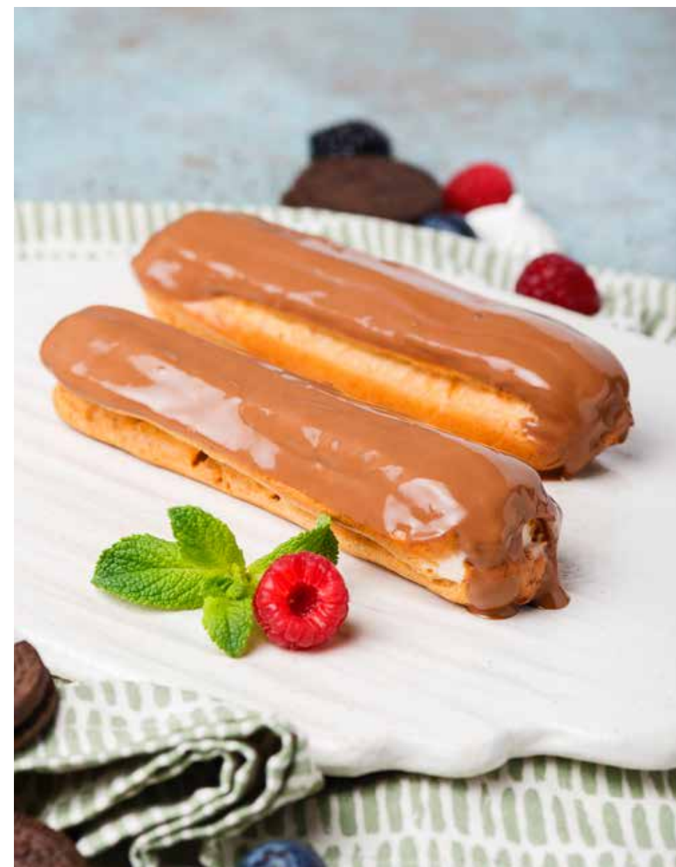
Эклеры 180/7/2 г 320 ₽ Eclairs | 艾克雷亚