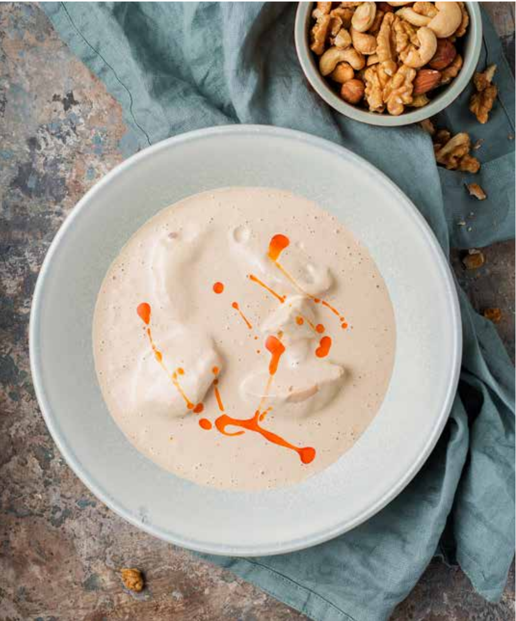
Сациви 230 г 470 ₽ Chicken satsivi | 格鲁吉亚式“萨茨维”鸡肉