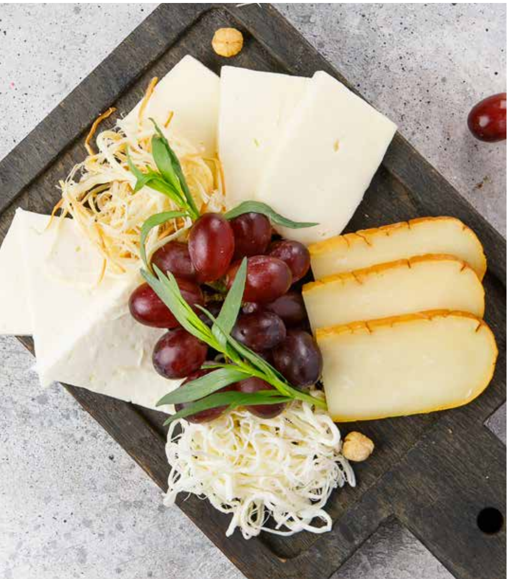
③ Ассорти грузинских сыров 320/5/5 г 680 ₽ Домашний сыр, сулугуни, копченый сыр, чечил Assorted Georgian cheese Homemade cheese, suluguni, smoked cheese, Chechil 什锦格鲁吉亚奶酪：家制奶酪、苏尔古尼、熏奶酪、Chechil