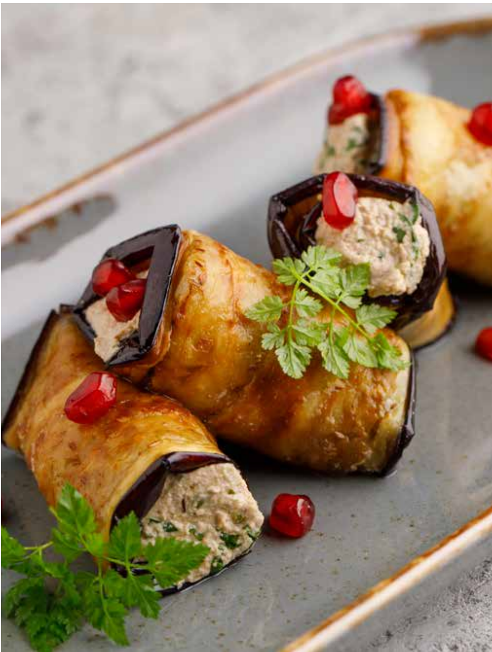
Рулетики из баклажанов по-грузински 180/5 г 590 ₽ Georgian eggplant rolls | 格鲁吉亚式炒茄子卷