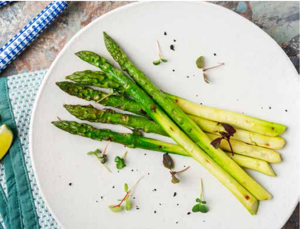
Спаржа 150 г 590 ₺ Asparagus | 炭烧或清蒸芦笋