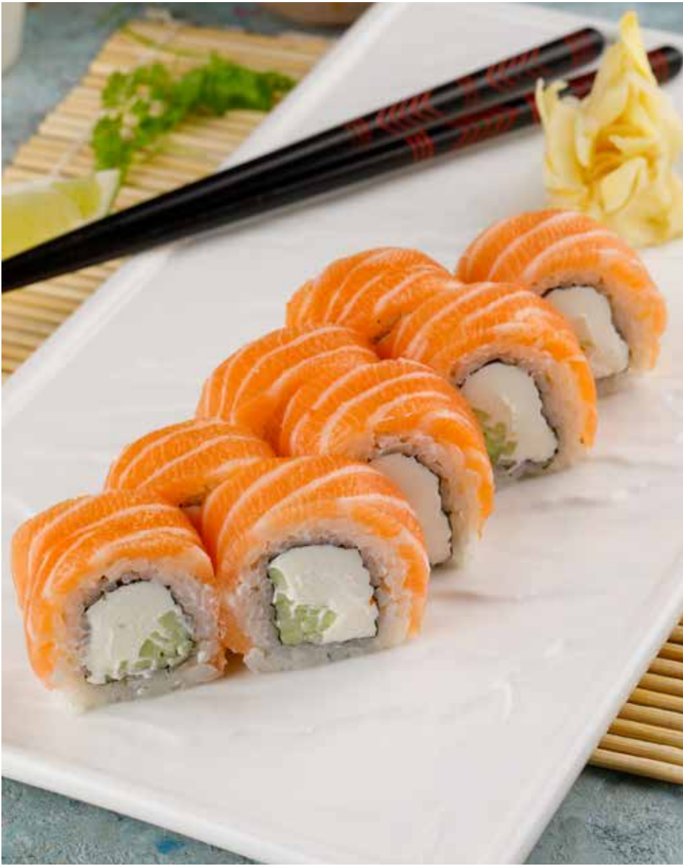
Филадельфия 8 шт. 790 ₺ Philadelphia roll | 费城卷