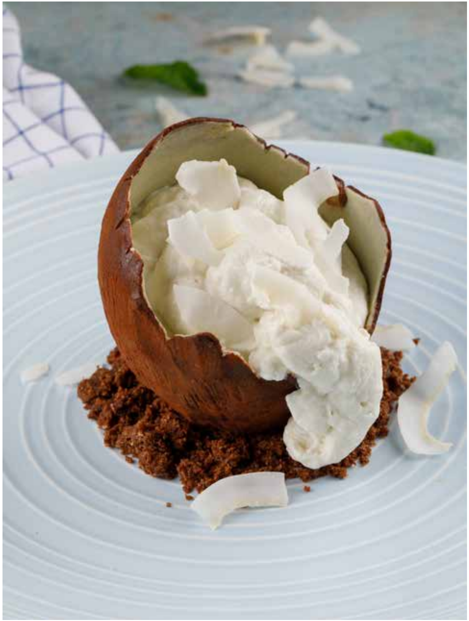
Кокосовый десерт 180 г 420 ₽ Coconut dessert | 椰子糕点