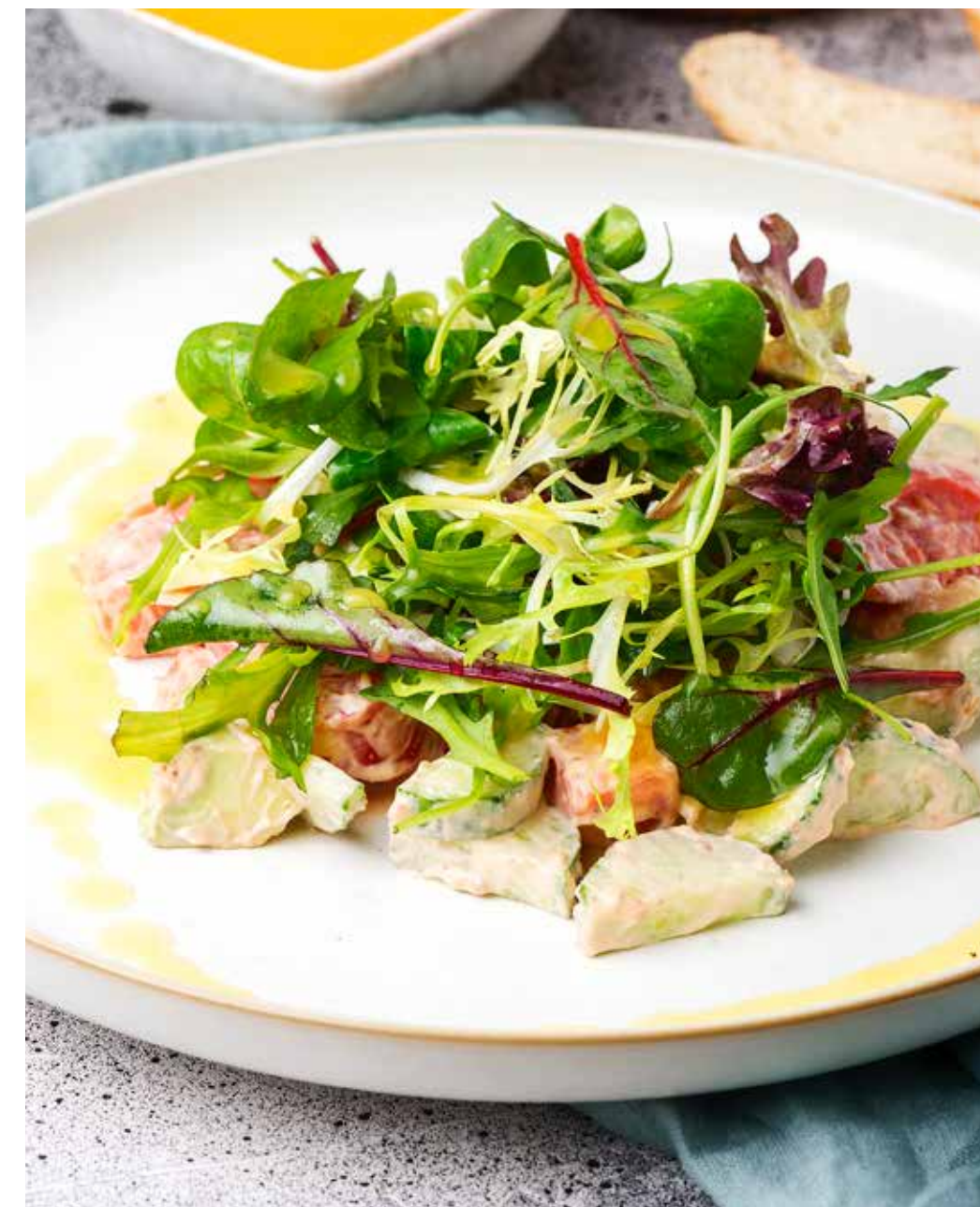
Салат с копченым лососем 210 г 790 ₽ Smoked salmon salad | 熏三文鱼沙拉