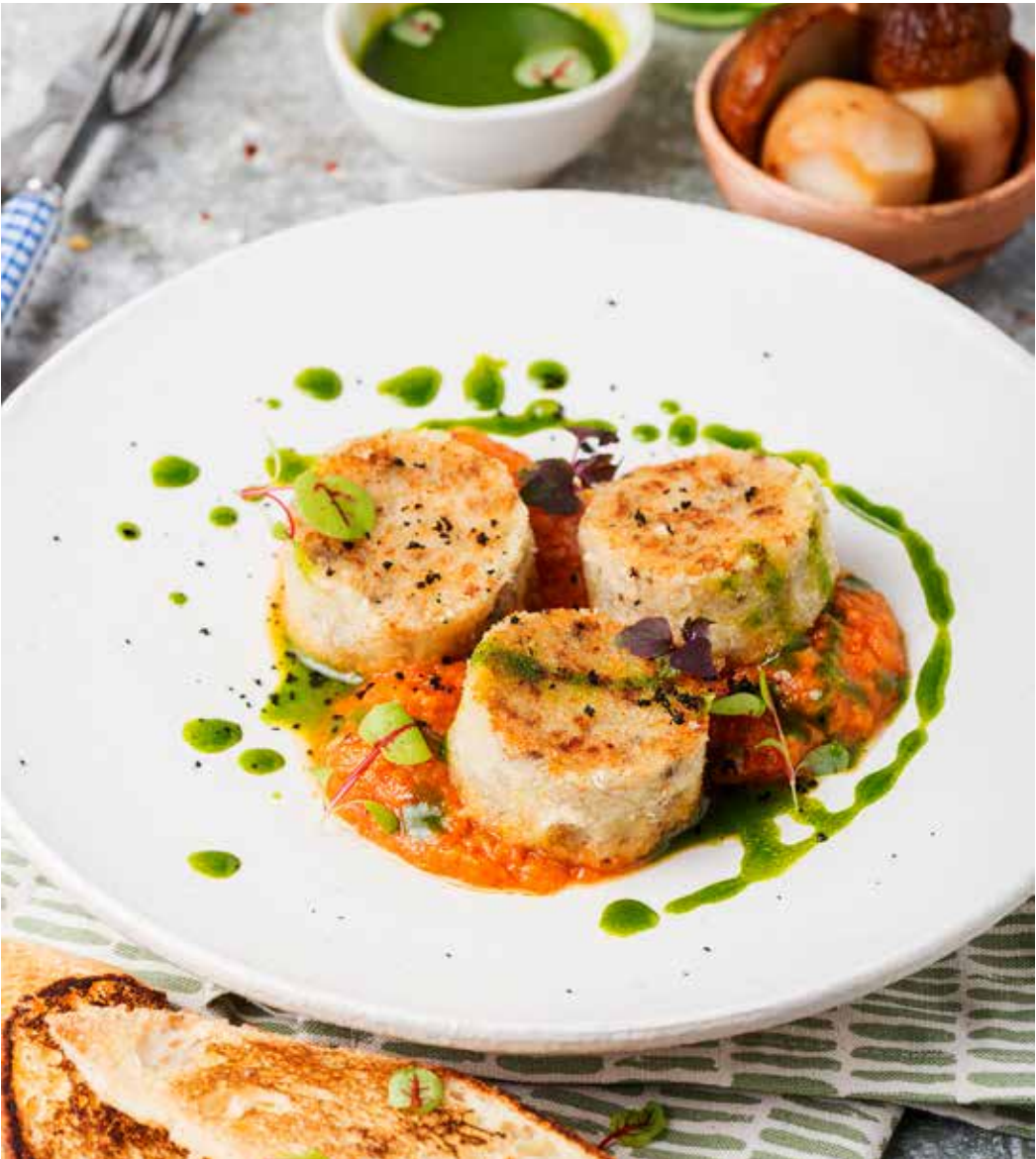
Капустные котлеты с грибами и кабачковой икрой 120/60 г 470 ₽ Cabbage patties with mushrooms and squash spread 蘑菇白菜饼配西葫芦酱