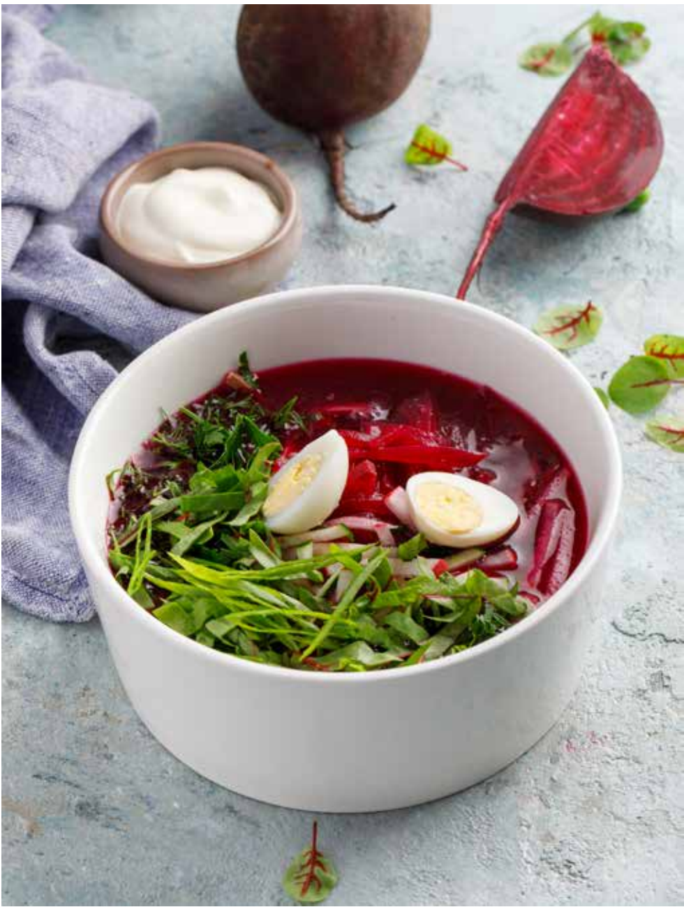
Свекольник 350/50 г 350 ₽ Beetroot Soup | 甜菜汤