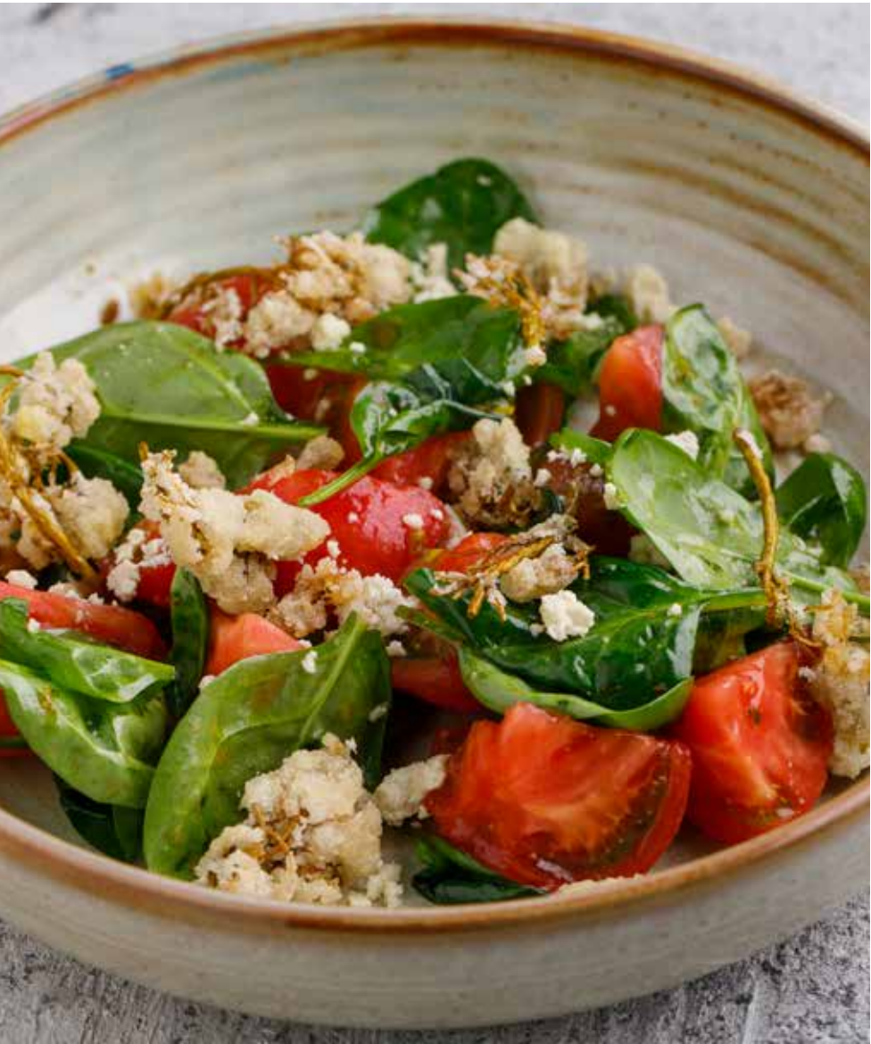
Салат с овечьим сыром гуда и жареными джонджоли Salad with Guda sheep cheese and fried JohnJolie 格鲁吉亚羊奶酪省沾油科花序沙拉