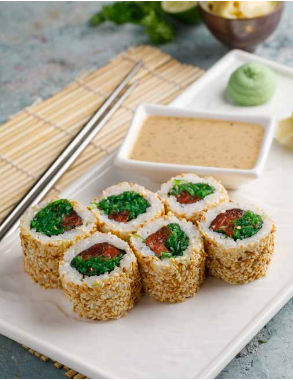
Ролл с чукой 8 шт. 360 ₹

Spicy roll with minced tatakai tuna | 生吞拿片辣卷