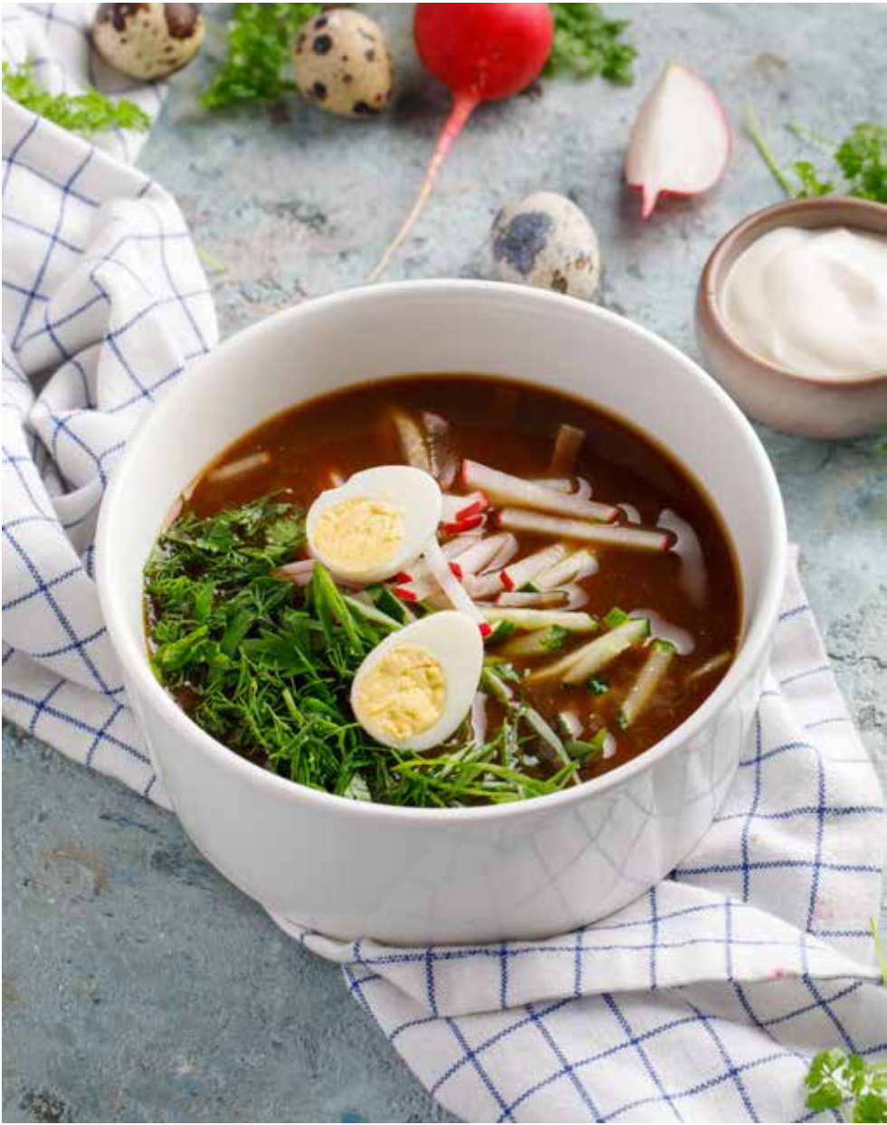
Окрошка на квасе / кефире 350/50 г 320 ₽ Kvass / kefir okroshka | 克瓦斯 / 酸牛奶凉拌汤