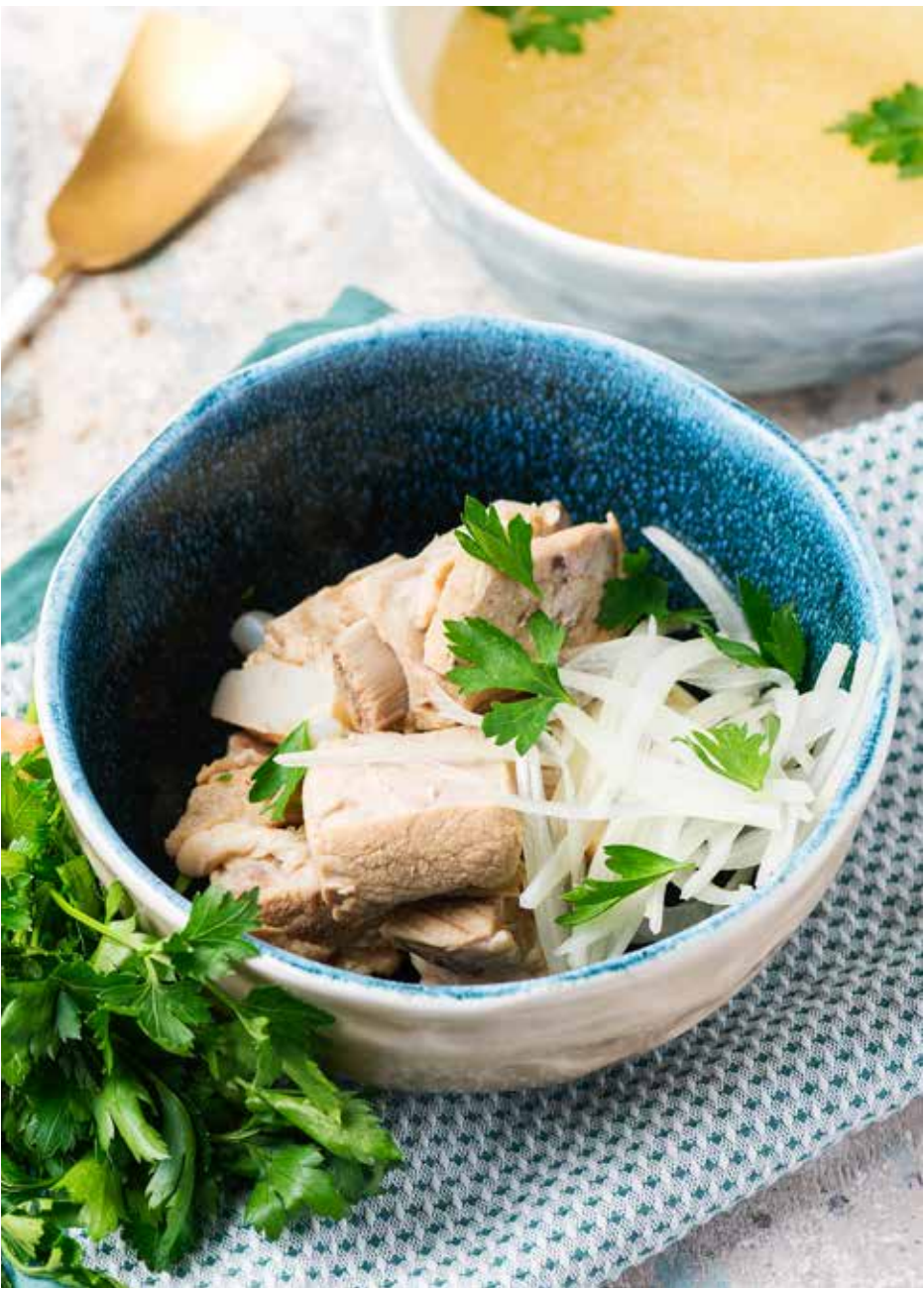
Хашлама с телятиной 180/200 г 670 ₽ Beef khashlama | 格鲁吉亚传统牛肉蔬菜汤