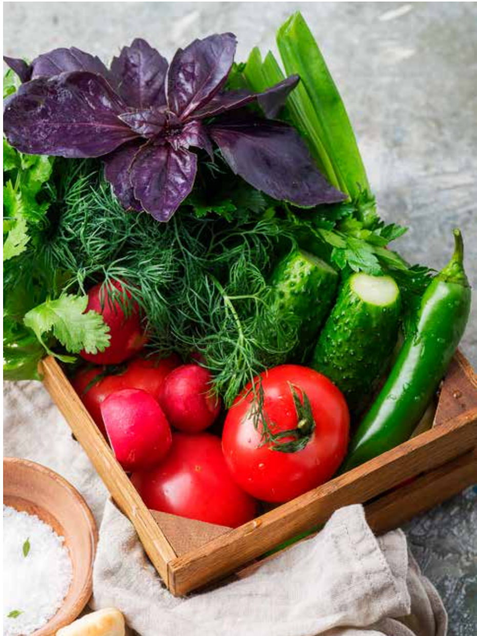
Сезонные овощи и зелень 330 г 520 ₽ Vegetables and herbs in season | 时蔬和鲜菜