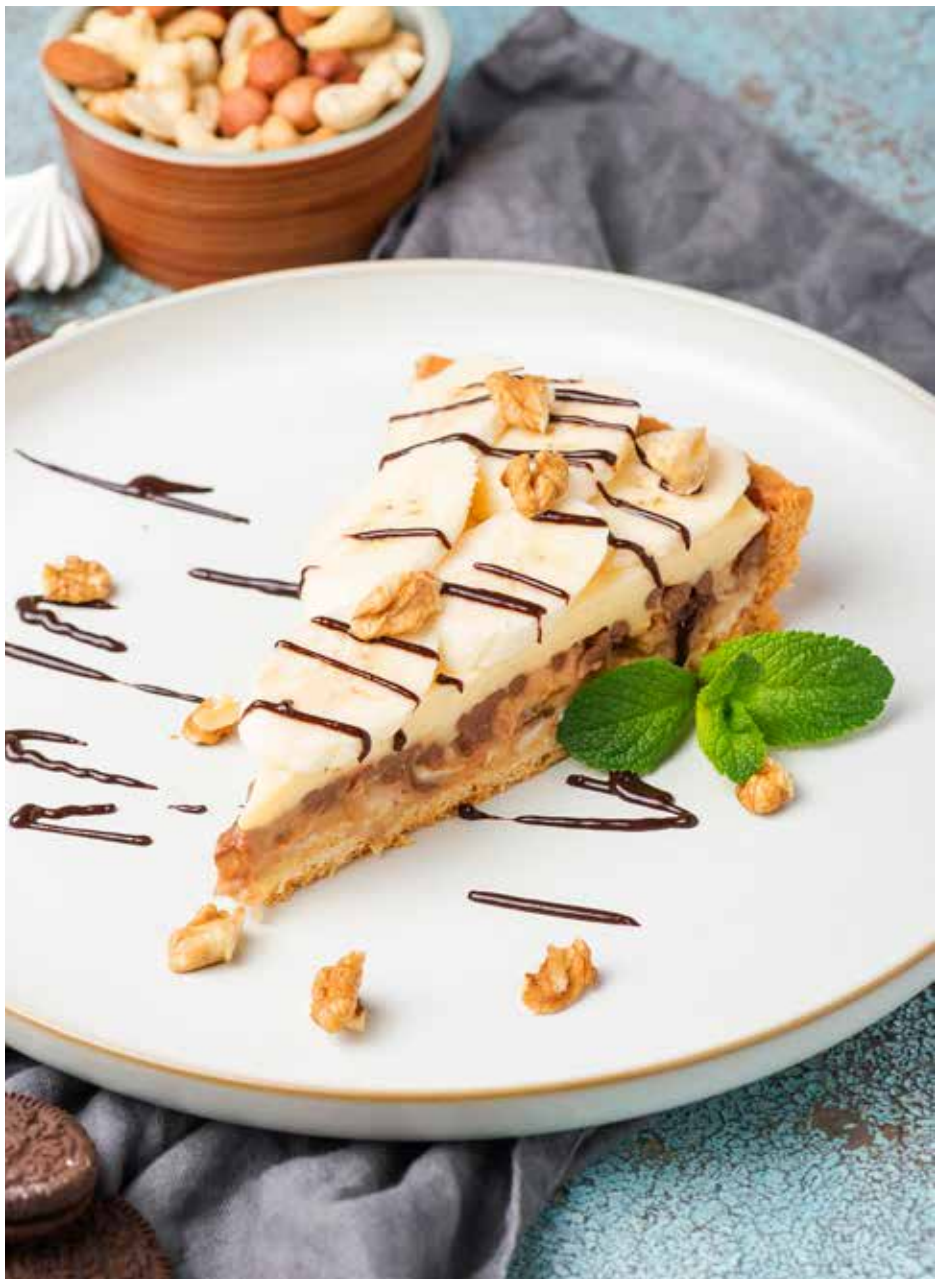
Шоколадно-банановый торт 215 г 340 ₽ Chocolate and banana cake | 巧克力香蕉蛋糕