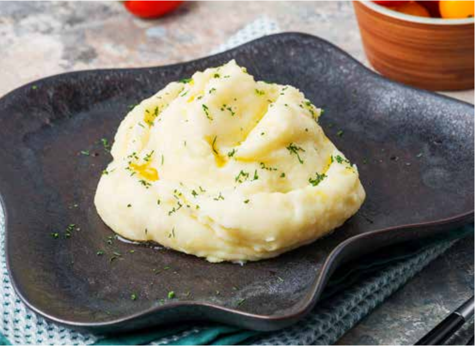
Картофельное пюре 220 г 180 ₺ Mashed potatoes | 土豆泥