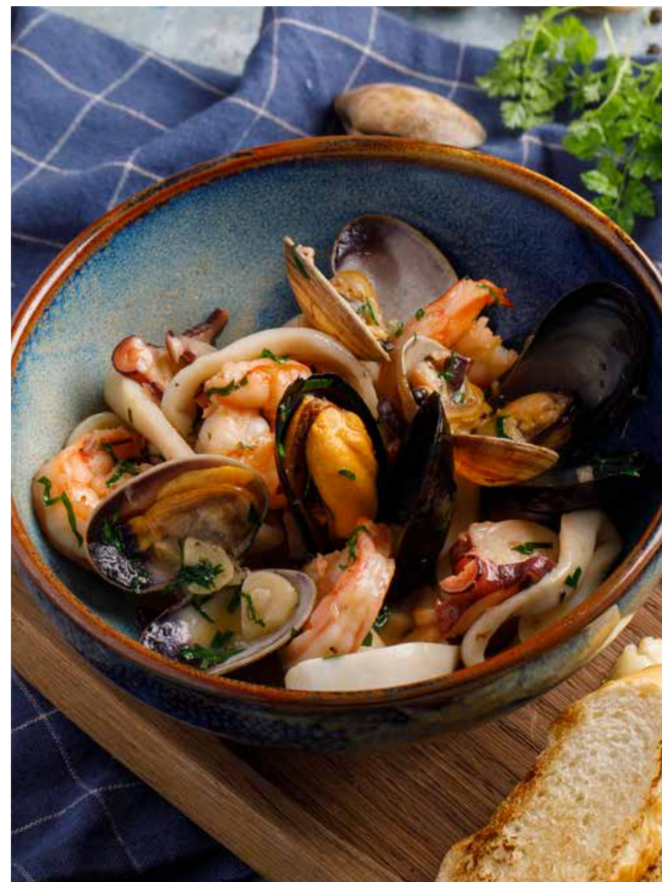
Теплый салат с морепродуктами 210 г 1490 ₽ Warm seafood salad | 海鲜暖沙拉