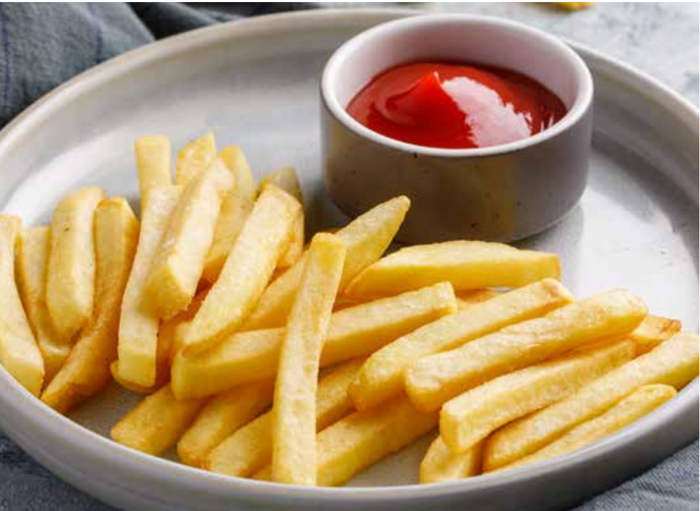
Картофель фри 180 г 180 ₺ French fries | 薯条