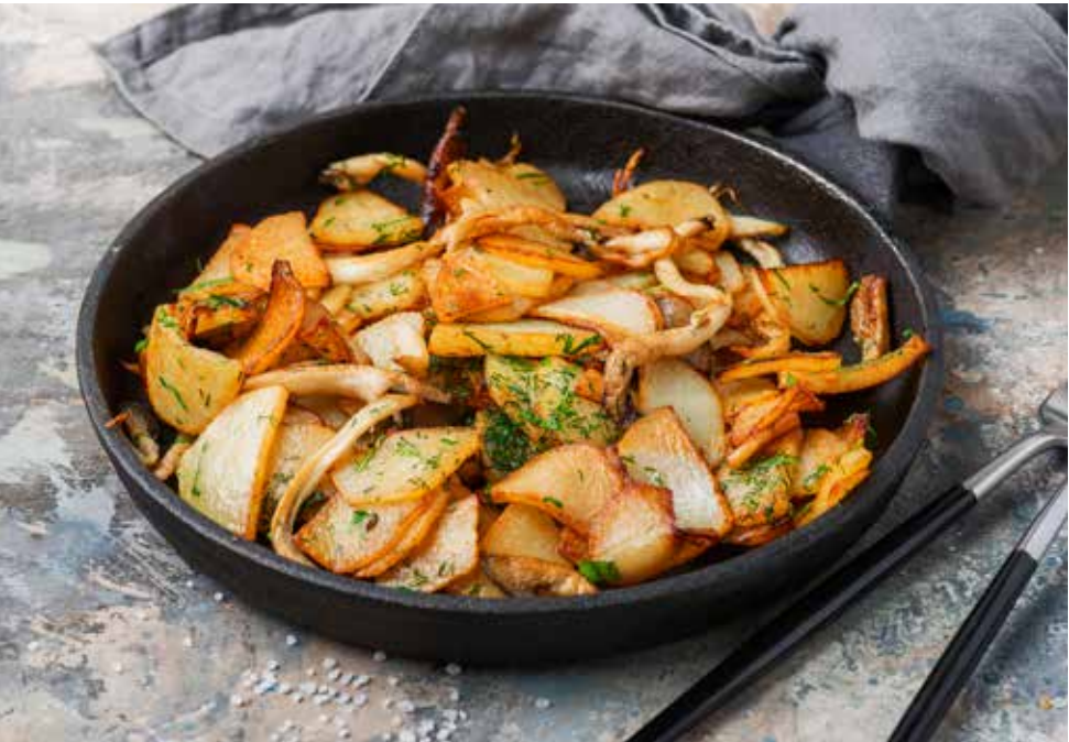
Жареный картофель с сезонными грибами 280 г 300 ₺ Fried potatoes with mushrooms in season | 时蘑菇煎土豆