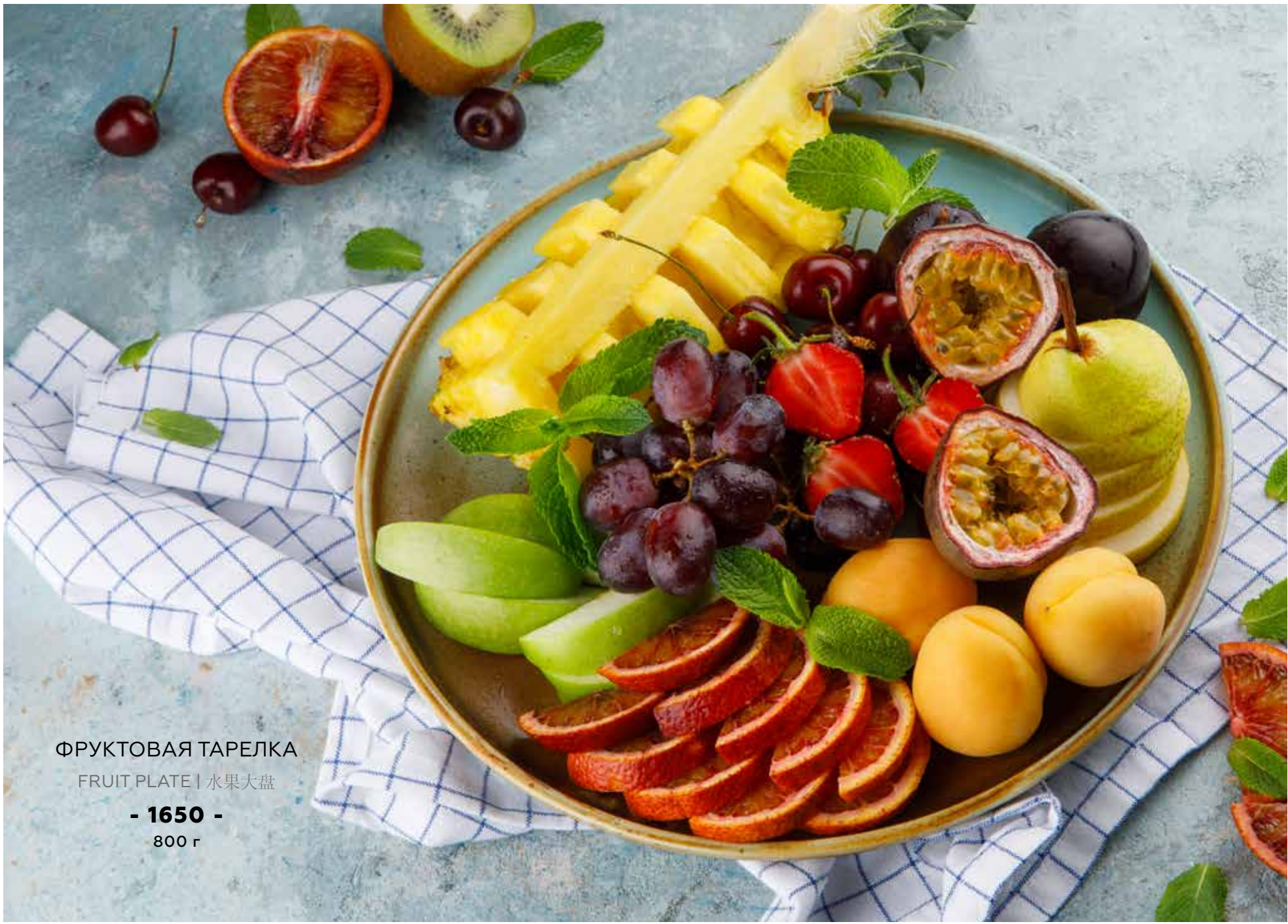
ФРУКТОВАЯ ТАРЕЛКА FRUIT PLATE | 水果大盘 - 1650 - 800 г