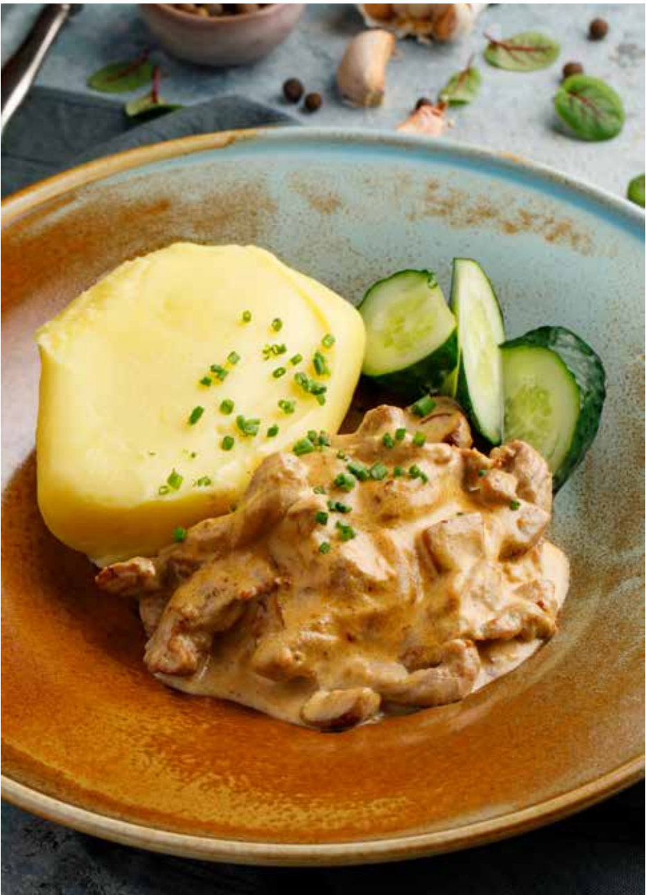
Строганов с картофельным пюре 160/200 г 780 ₽ Stroganoff with mashed potatoes | 俄式炒牛肉配土豆泥