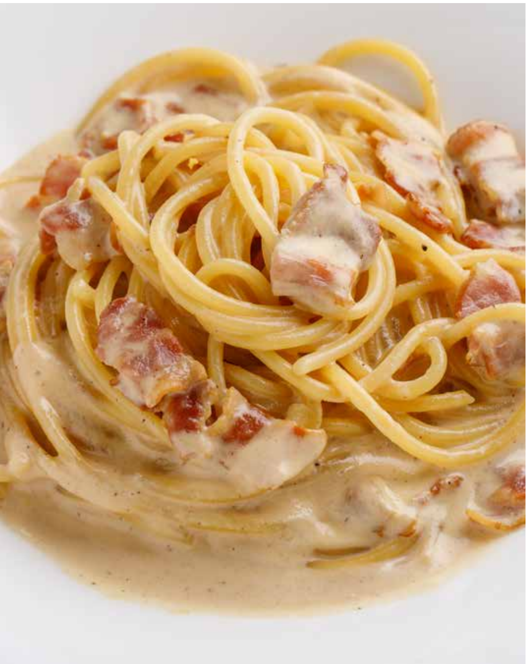
Спагетти Карбонара 300 г 640 Р Spaghetti Carbonara | 芝士培根长面