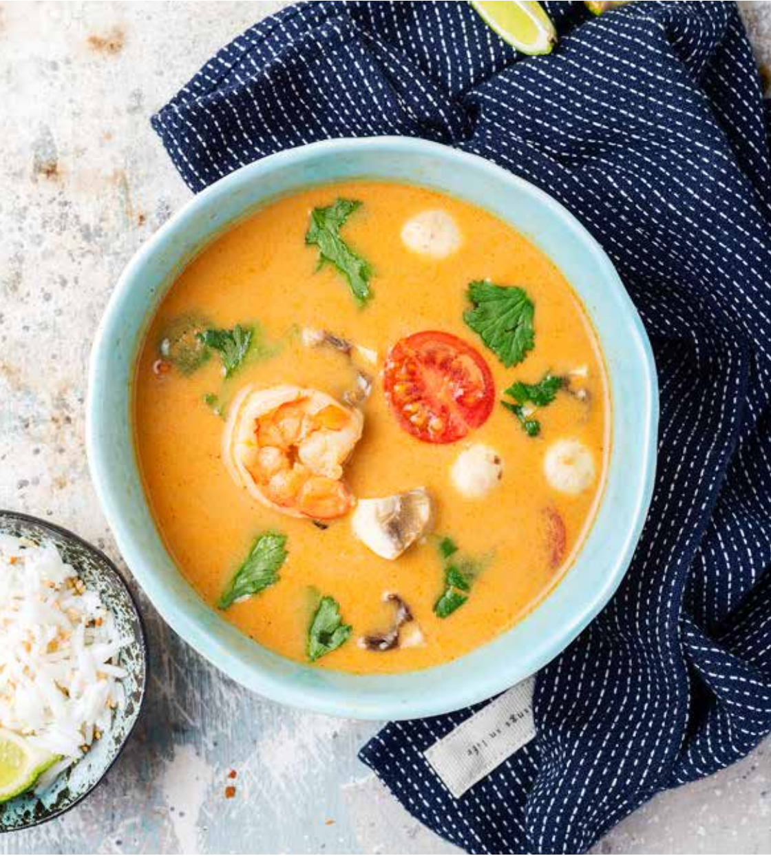
Том Ям с креветками / курицей 350 г 690/470 ₽ Tom Yum with shrimps / chicken | 鲜虾冬阴功汤 / 鸡肉冬阴功汤