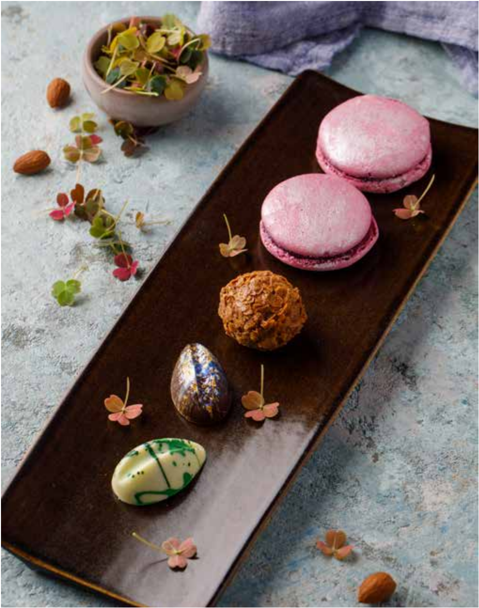
Конфеты Assorted candies | 什锦糖果 15 г 140 ₺