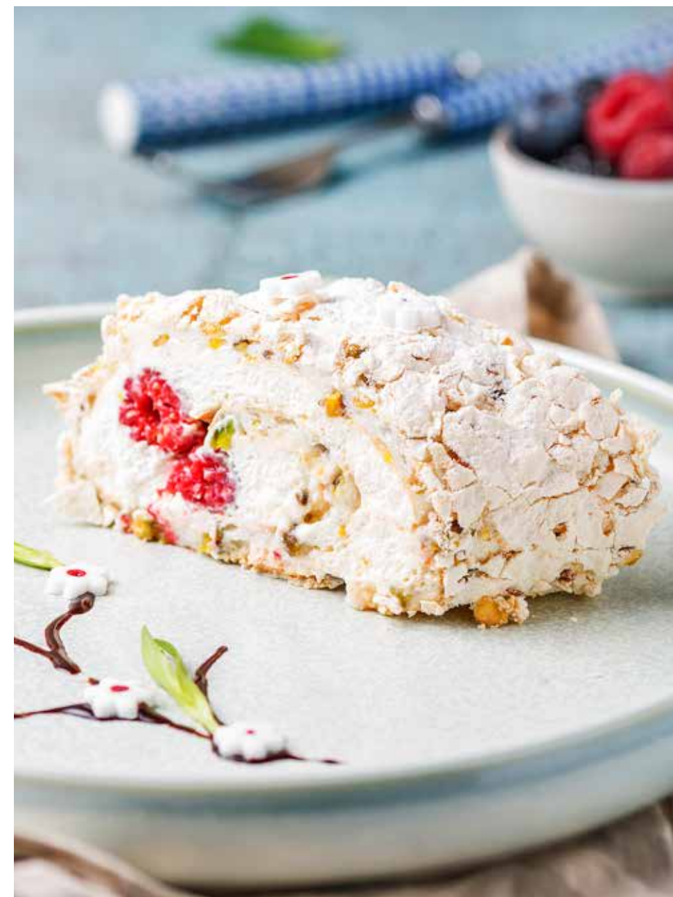
Фисташковый рулет 115/5/3 г 420 ₽ Pistachio roll | 开心果卷

ДЕСЕРТ ПАВЛОВА PAVLOVA'S DESSERT 巴甫洛娃蛋糕 - 450 - 180 г