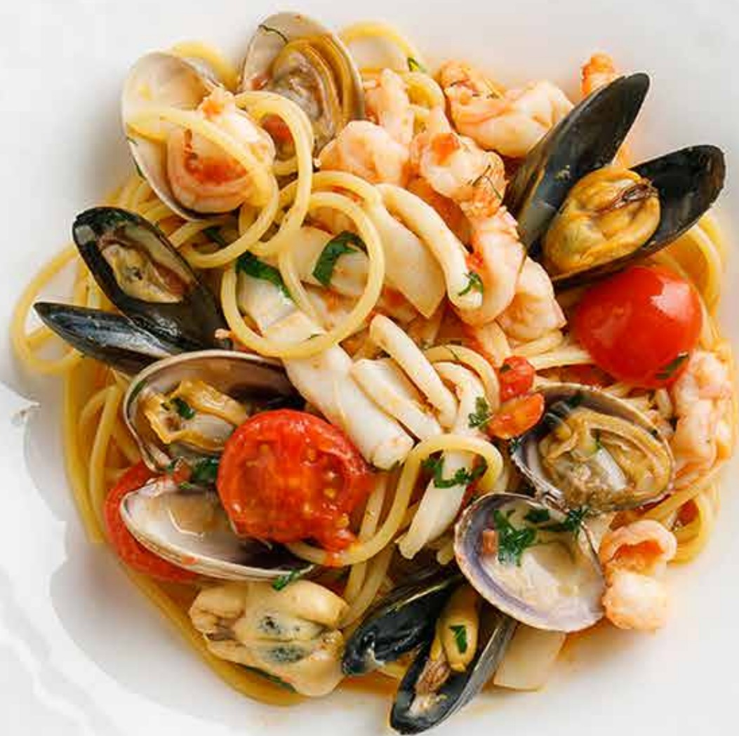
СПАГЕТТИ С МОРЕПРОДУКТАМИ SPAGHETTI WITH SEAFOOD | 海鲜长面 - 1350 - 400 г