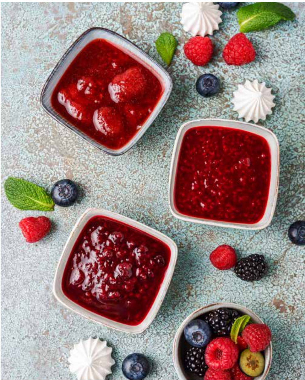
Варенье клубничное / малиновое / лесные ягоды 50 г 150 ₺ Strawberry / raspberry / forest berries jam 草莓果酱 / 覆盆子果酱 / 野果果酱