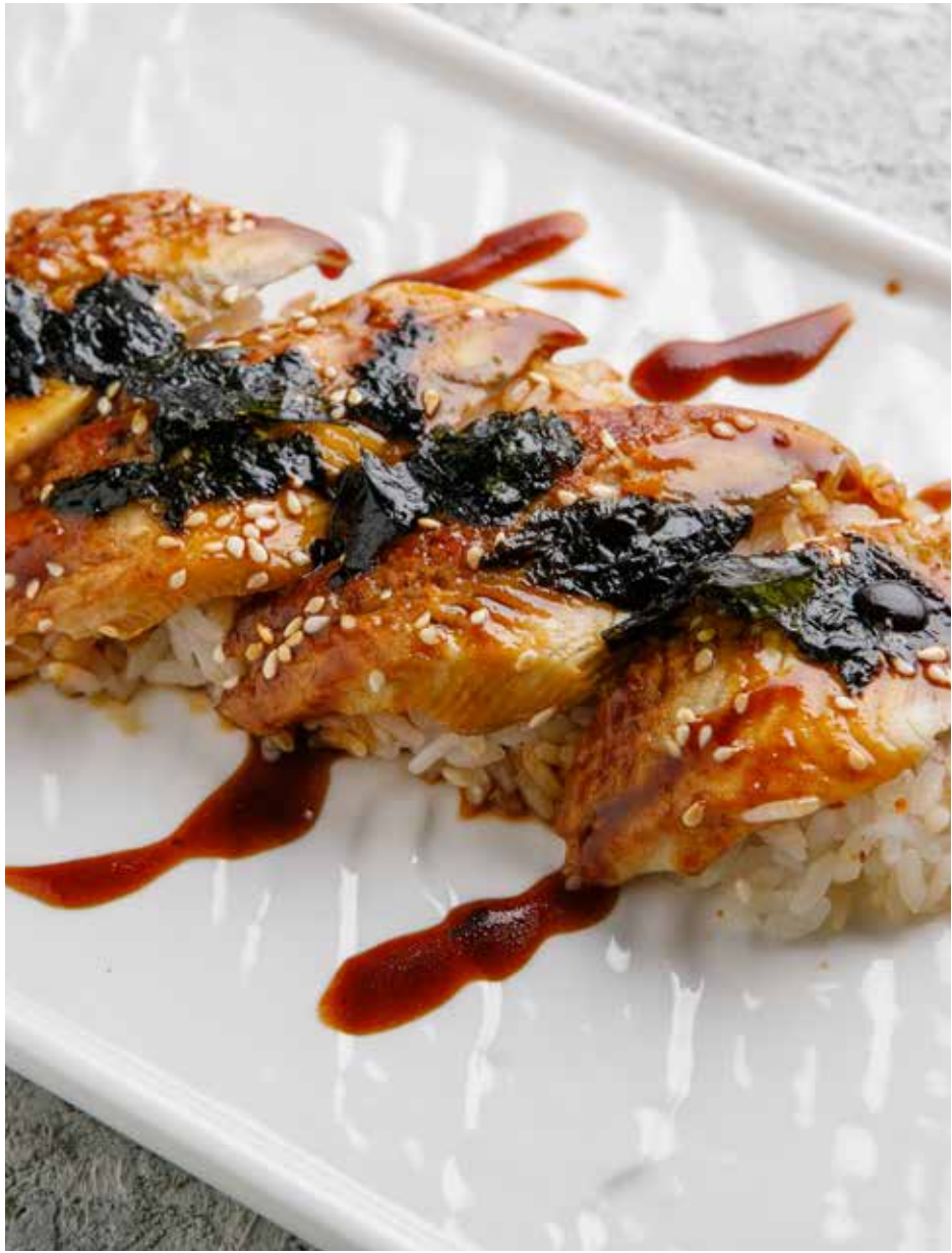
Угорь с рисом 175 г 1050 ₽ Eel with rice | 鳗鱼配米饭