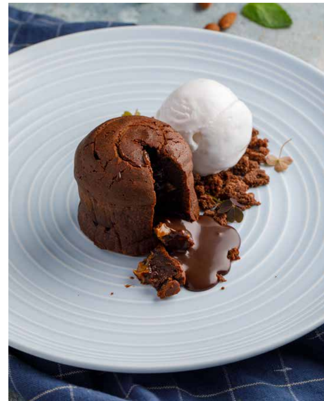
Шоколадный фондан 160/50/20 г 410 ₽ Chocolate fondant | 巧克力熔岩蛋糕