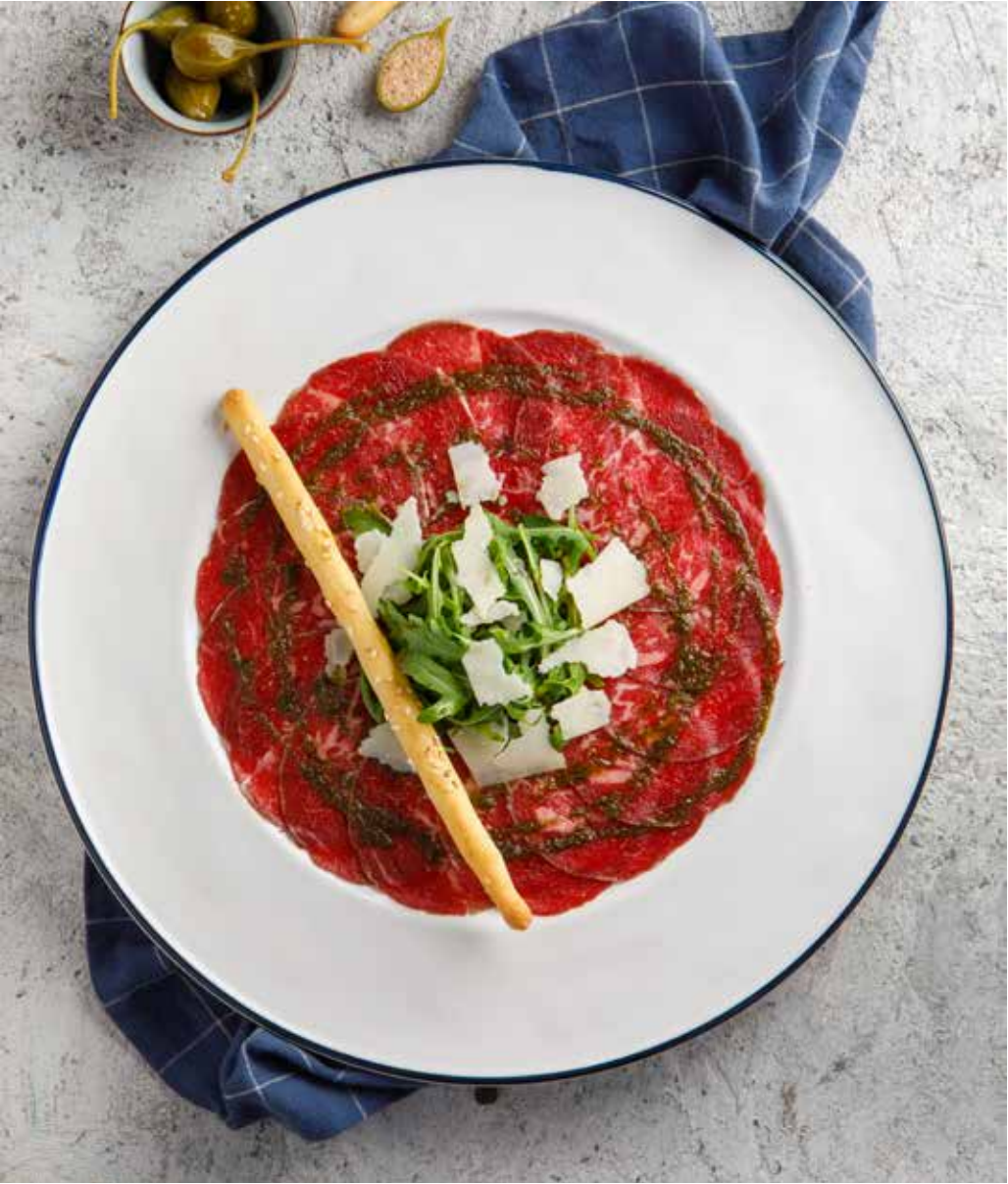
Карпаччо из фермерской говядины 100/20/35 г 790 Р с рукколой и пармезаном Farm beef carpaccio with arugula and parmesan 意式生农家牛肉片配芝麻菜帕玛桑奶酪