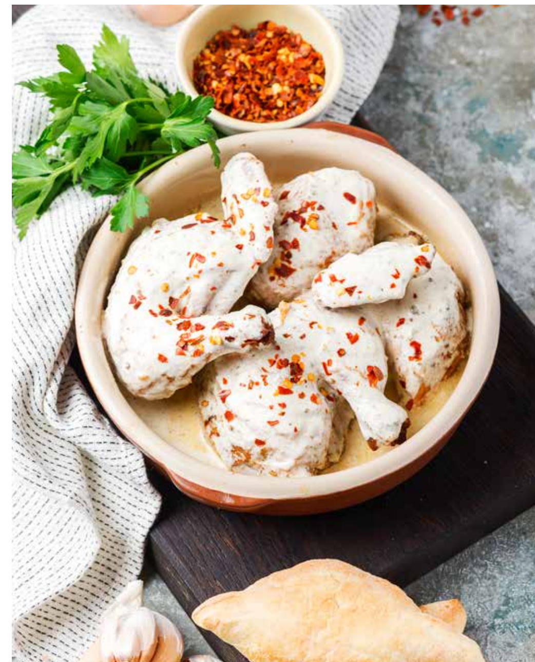
Чкмерули 1 шт./190 г 620 ₽ Chkmeruli | 大蒜奶油汁焗鸡肉