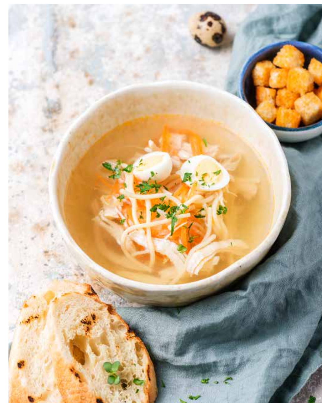
Куриный суп с вермишелью