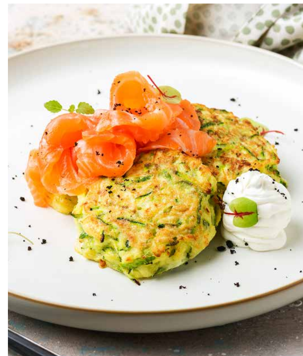
Домашние оладьи из цуккини с лососем шеф-посола 150/50/40 г 640 ₽ Homemade zucchini pancakes with chef-salted salmon 轻腌三文鱼大饼