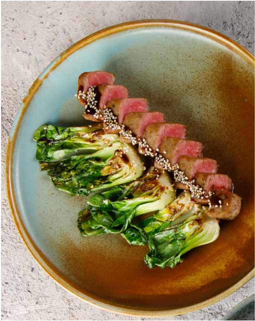
Тальята из тунца 180 г 1650 ₽ Tuna tagliata | 金枪鱼配芝麻菜和巴马臣奶酪薄片