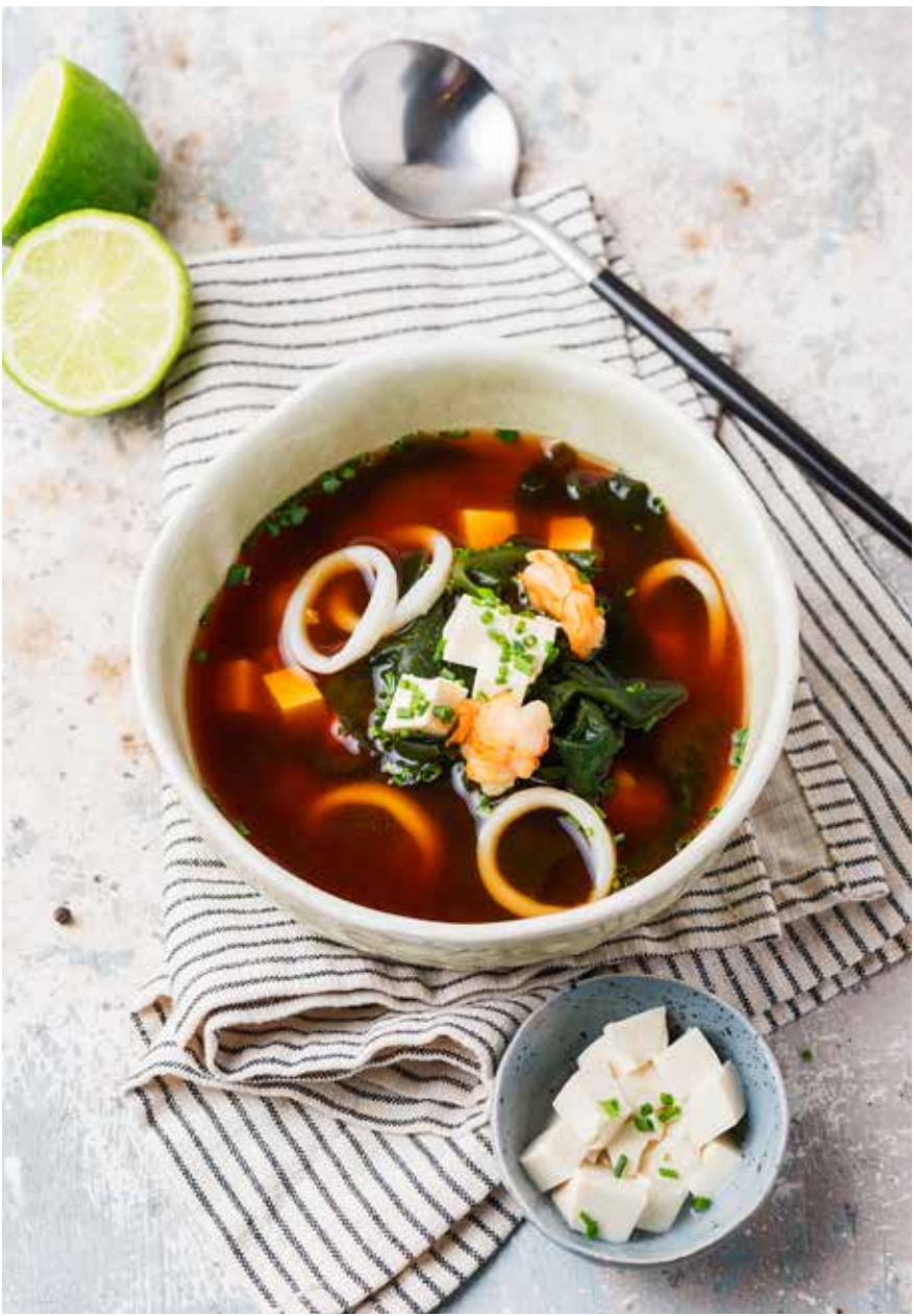
Мисо-суп / 320 г 230/590 ₽ мисо-суп с морепродуктами Miso soup / Miso soup with seafood | 味噌汤 / 海鲜味噌汤