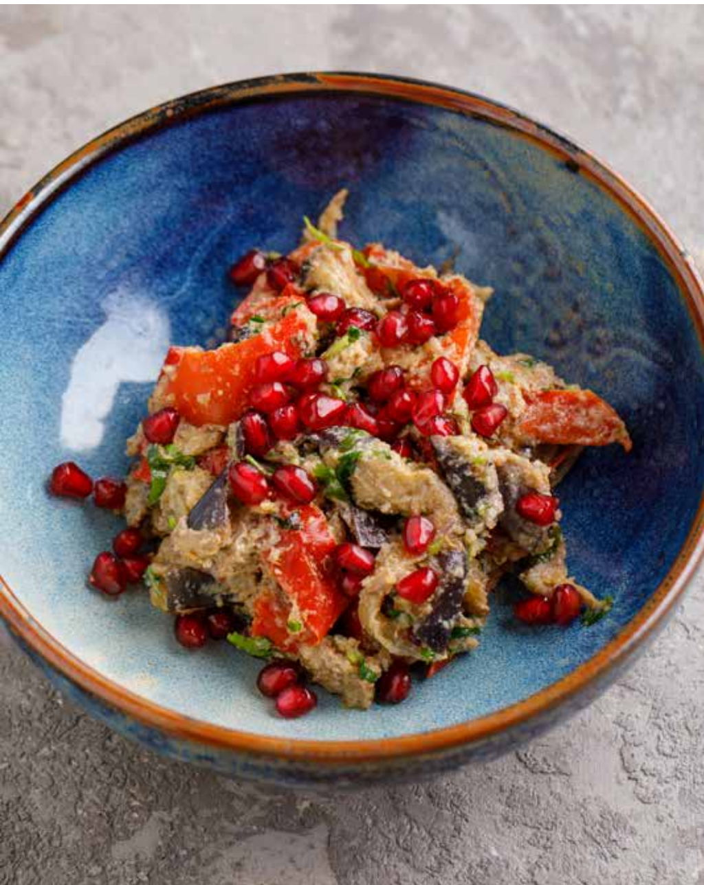
Ацецили из баклажанов 200 г 530 ₽ Eggplant acecili | 格鲁吉亚茄子沙拉