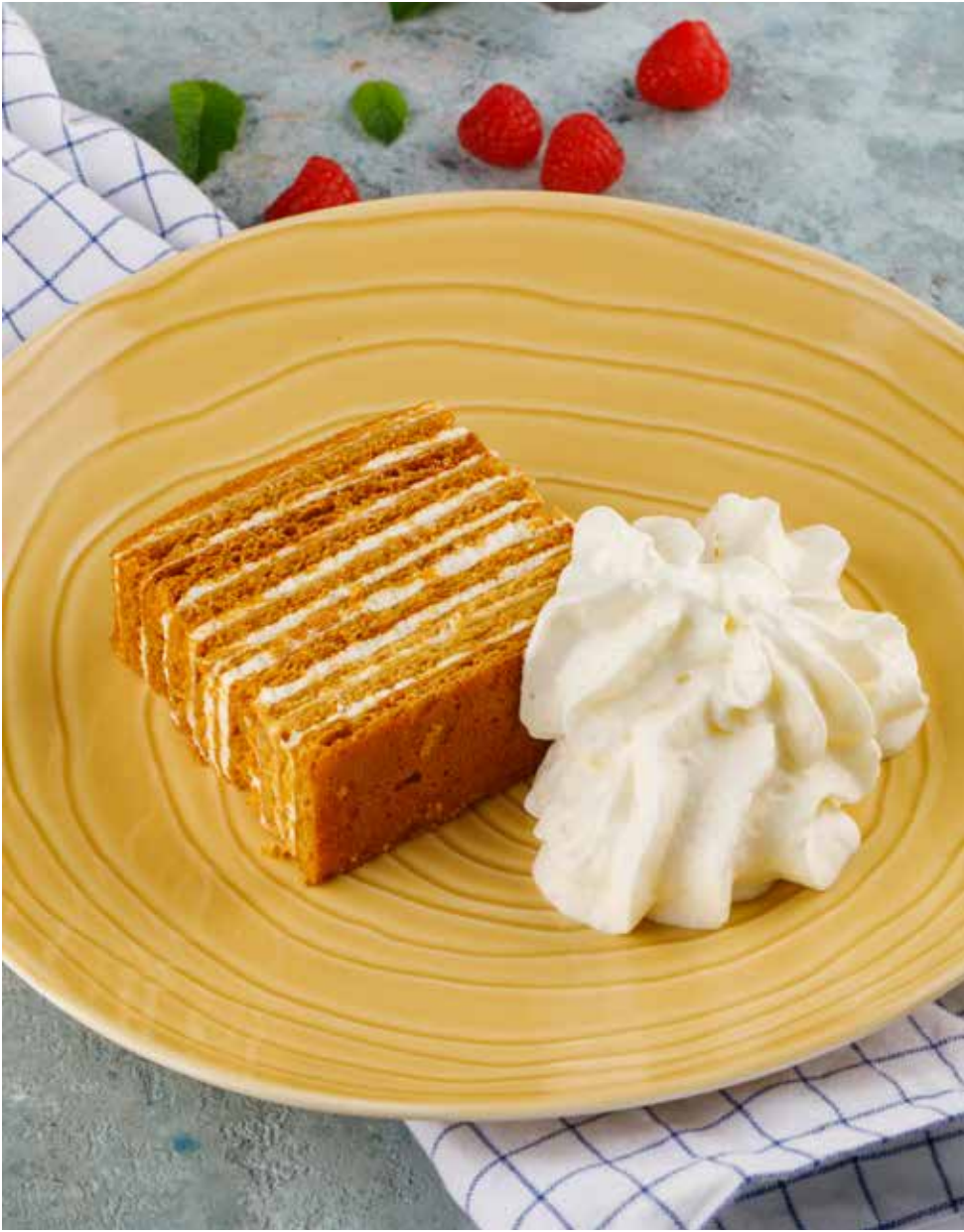
Медовик с грецким орехом 155 г 350 ₽ Honey cake with walnuts | 蜂蜜蛋糕