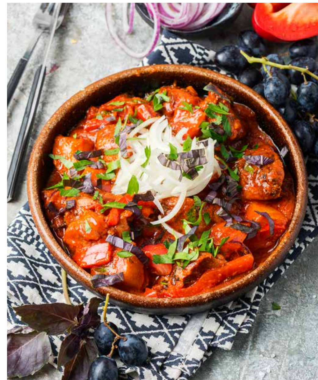
Оджахури со свиной 370 г 670 ₽ Pork odjakhuri | 格鲁吉亚煎猪肉