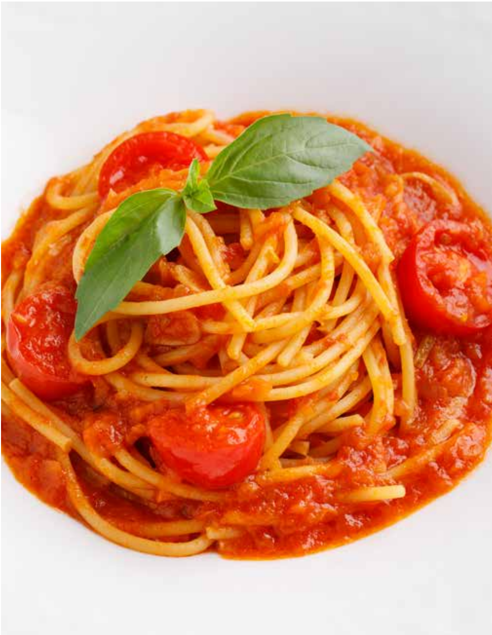
Спагетти с томатами черри и базиликом 300 г 480 Р Spaghetti with cherry tomatoes and basil | 罗勒圣女果意面