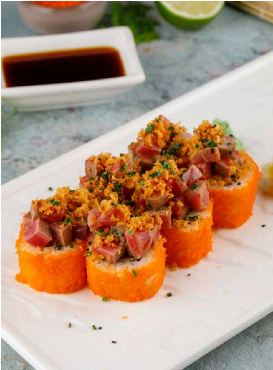
Острый ролл с рубленным тунцом татаки 6 шт. 970 ₹

Spicy roll with minced tatakai tuna | 生吞拿片辣卷