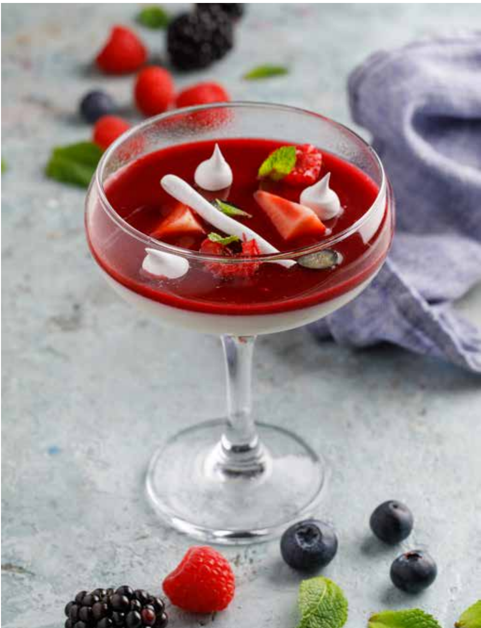
Панна котта с малиновым соусом 135/30 г 450 ₽ Panna cotta with raspberry sauce | 意式奶油布丁配覆盆子果酱