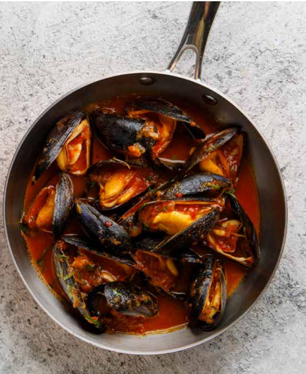
④ Соте из мидий в красном или белом соусе 410 г 920 ₽ Mussels sautéed in red or white sauce | 蛤贝沙嗲配红或白酱