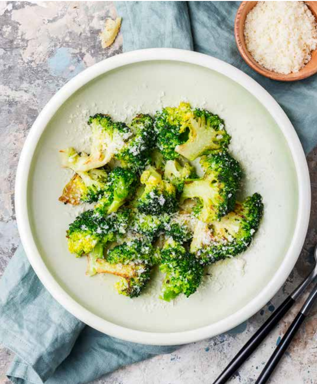
Брокколи с пармезаном 160 г 450 ₺ Broccoli with Parmesan cheese | 西兰花帕玛桑奶酪