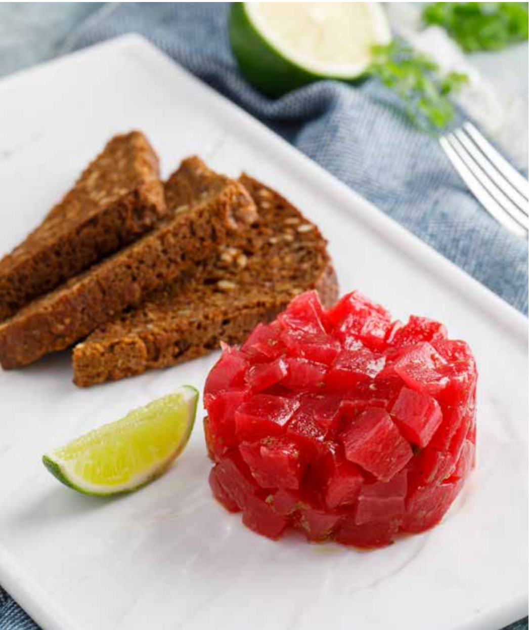
Тартар из тунца 110 г 1190 ₽ Tuna tartare | 吞拿鱼塔塔