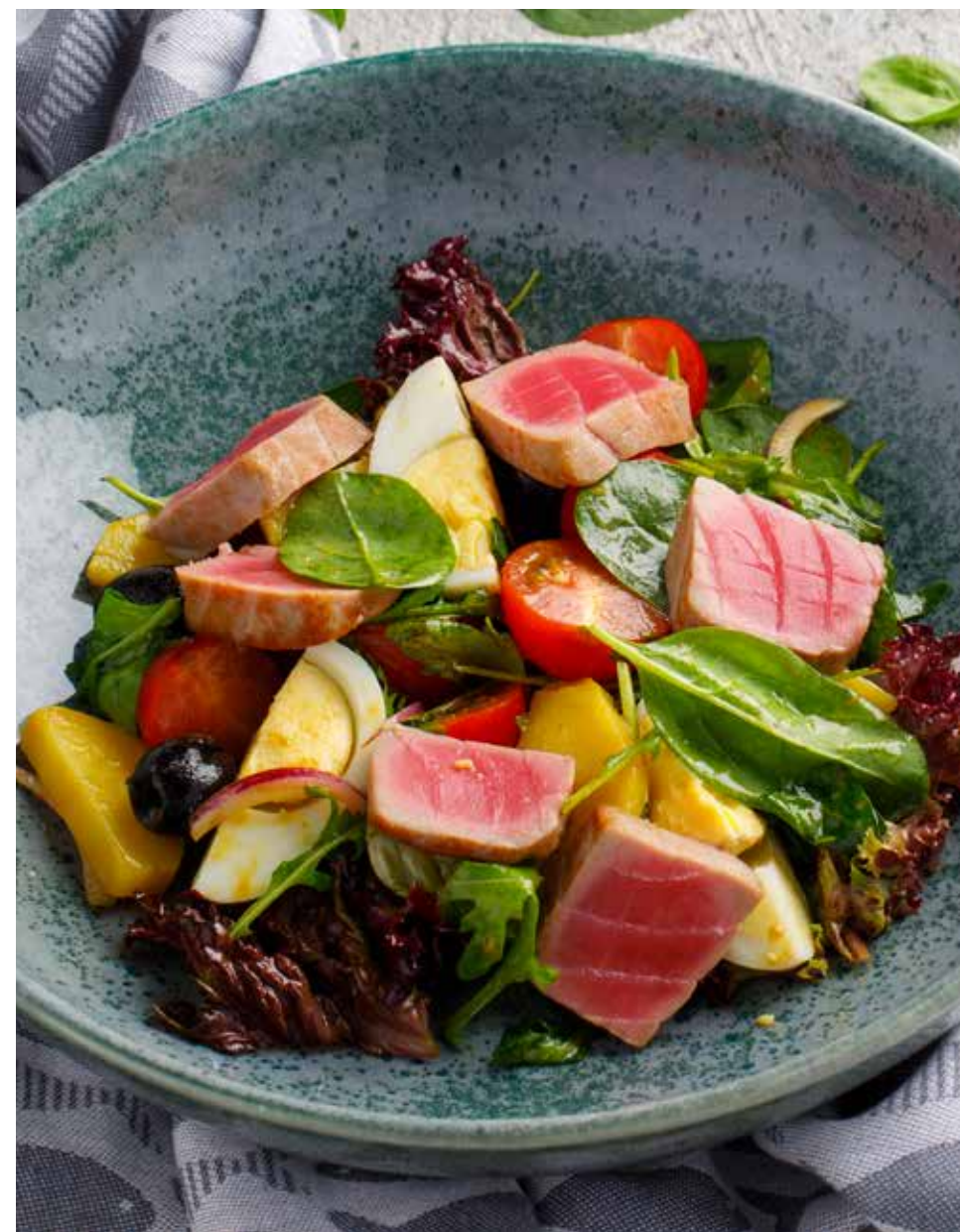
Салат с тунцом 230 г 890 ₽ Tuna salad | 金枪鱼沙拉