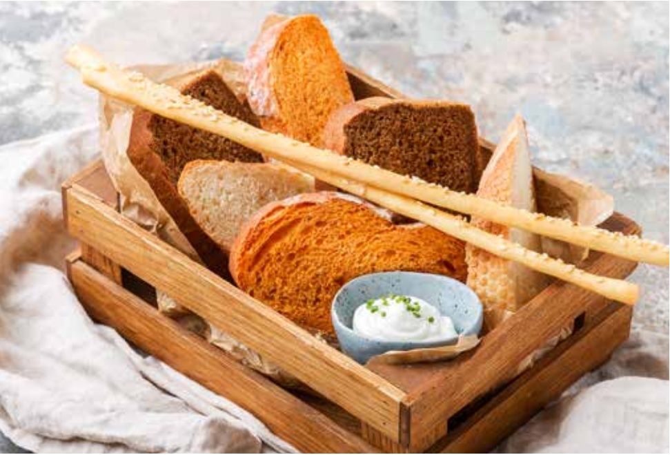
Хлебная корзина 120 г 190 ₺ Кукурузный хлеб, деревенский багет, гриссини, пражский хлеб, крем-чиз Bread basket | 面包篮 Corn bread, village-style baguette, grissini, Prague bread, cream cheese