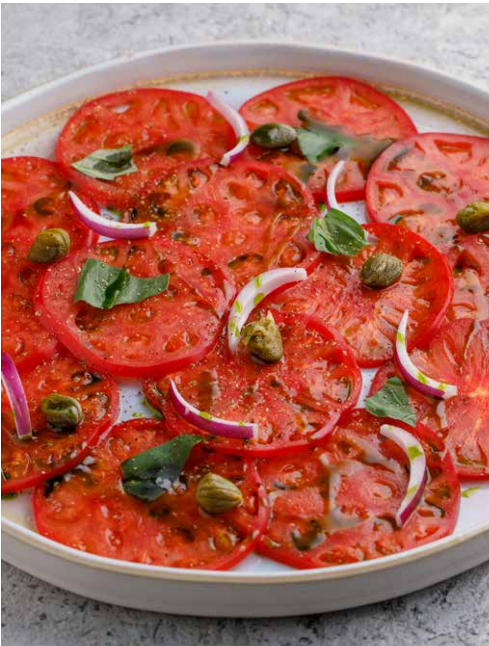
Карпаччо из томатов 175 г 450 ₽ Tomato Carpaccio | 番茄切薄片