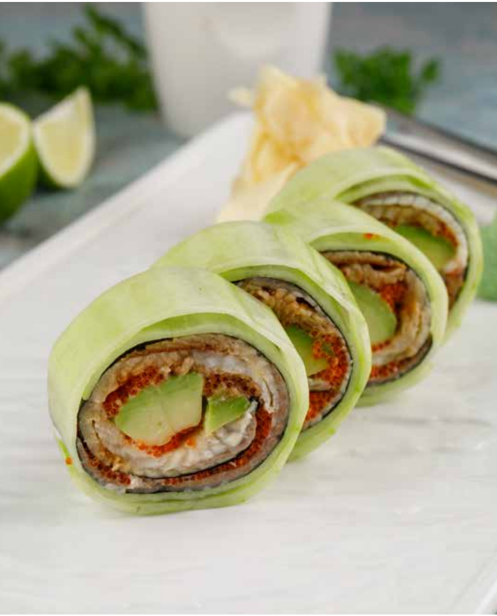
Фреш-ролл с угрем 4 шт. 1250 ₹