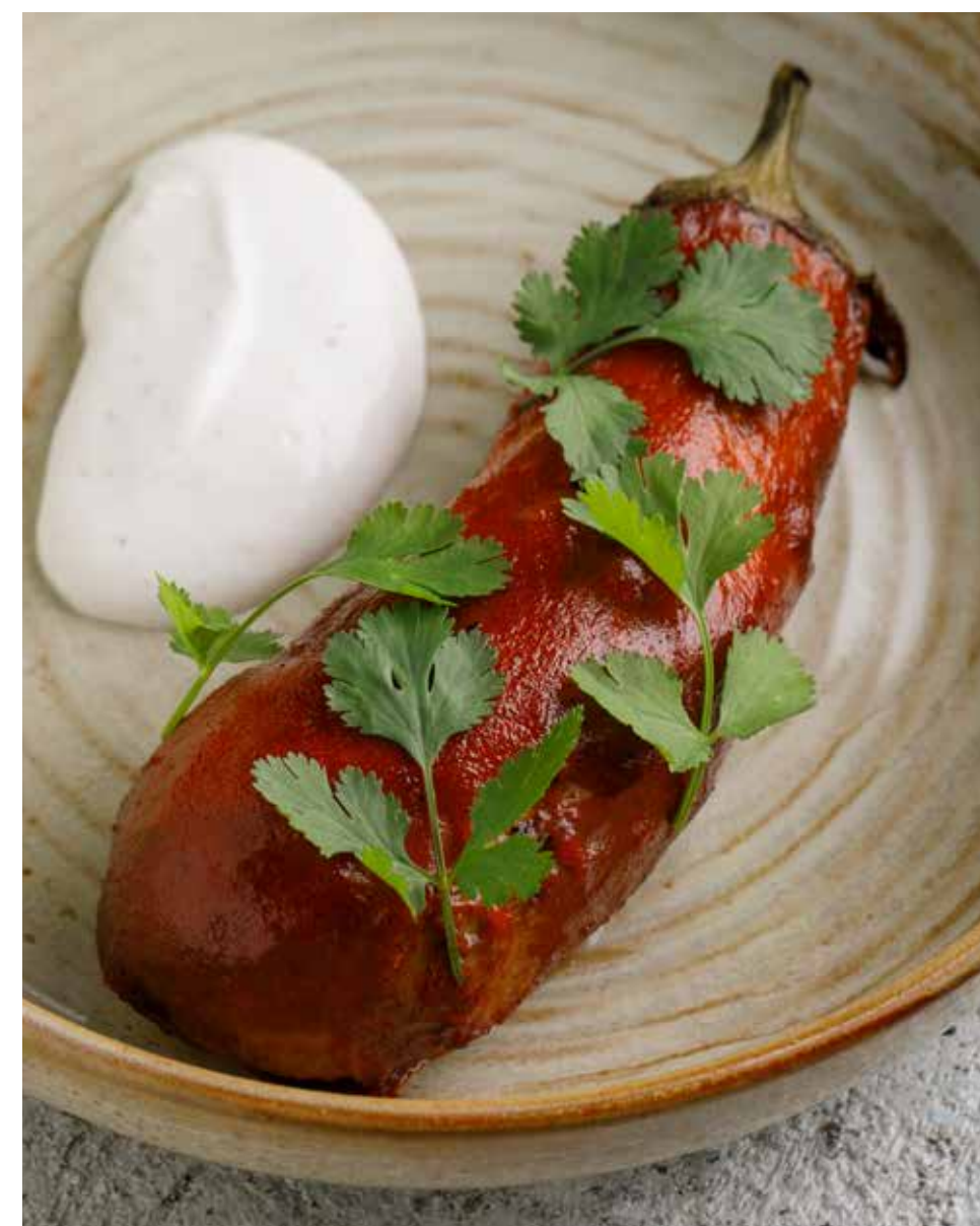
Баклажаны в перечном соусе со сливочным муссом 220 г 490 ₽ Eggplant in pepper sauce with cream mousse | 红油茄子配奶油慕斯