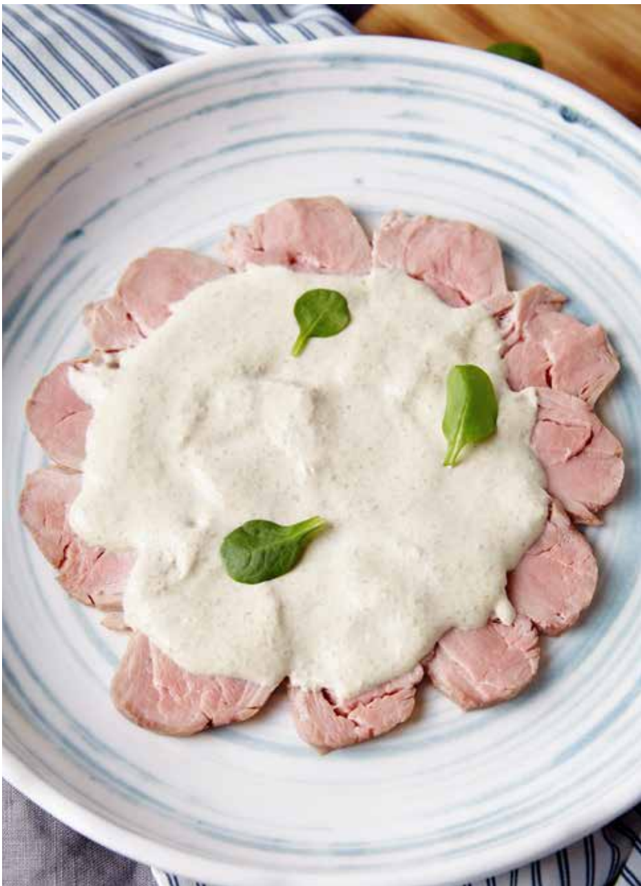
Вителло тоннато 135 г 650 ₽ Vitello tonnato | Vitello Tonnato(薄切牛仔肉配吞拿鱼汁)