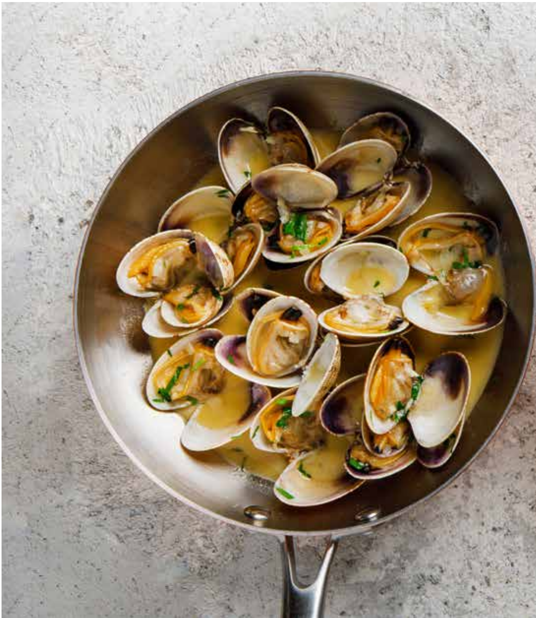
③ Соте из вонголе в красном или белом соусе 420 г 1590 ₽ Clams sautéed in red or white sauce | 蚌壳沙嗲配红或白酱