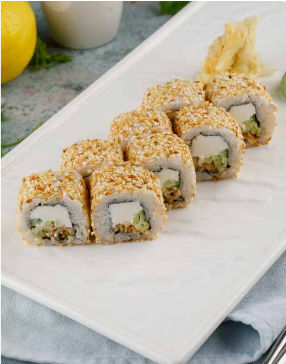
Ролл с угрем в кунжуте 8 шт. 720 Р Eel roll with sesame seeds | 鳗鱼芝麻卷