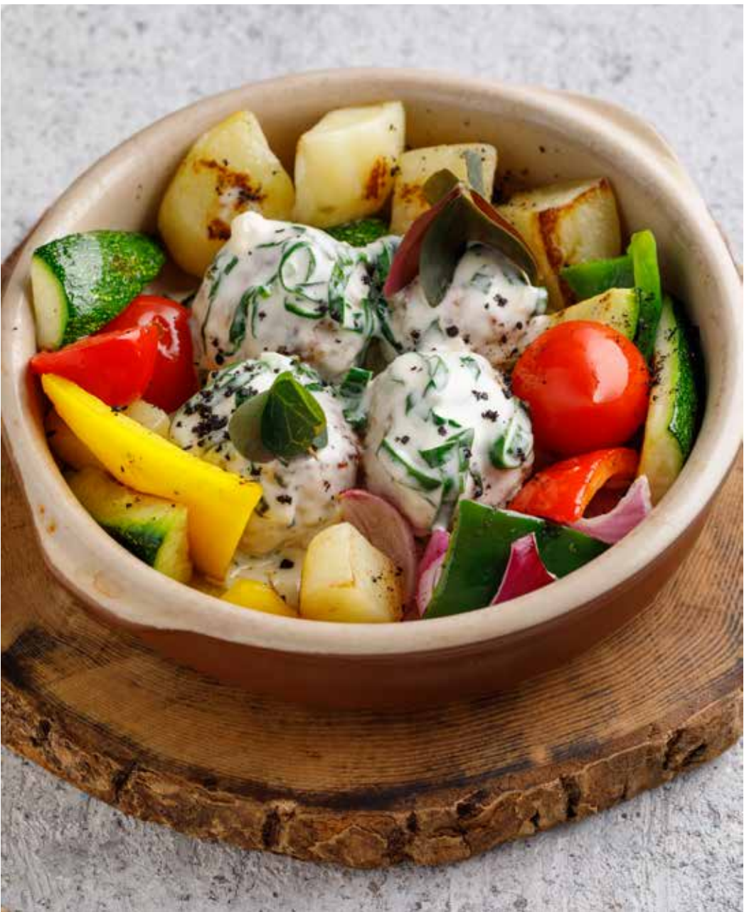
Котлеты из индейки с овощами 160/40/140 г 680 ₽ Turkey cutlets with vegetables | 火鸡肉蔬菜饼配