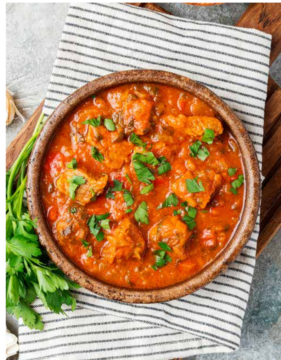
Чашушули 300 г 690 ₽ Chashushuli | 格鲁吉亚辣焖牛肉