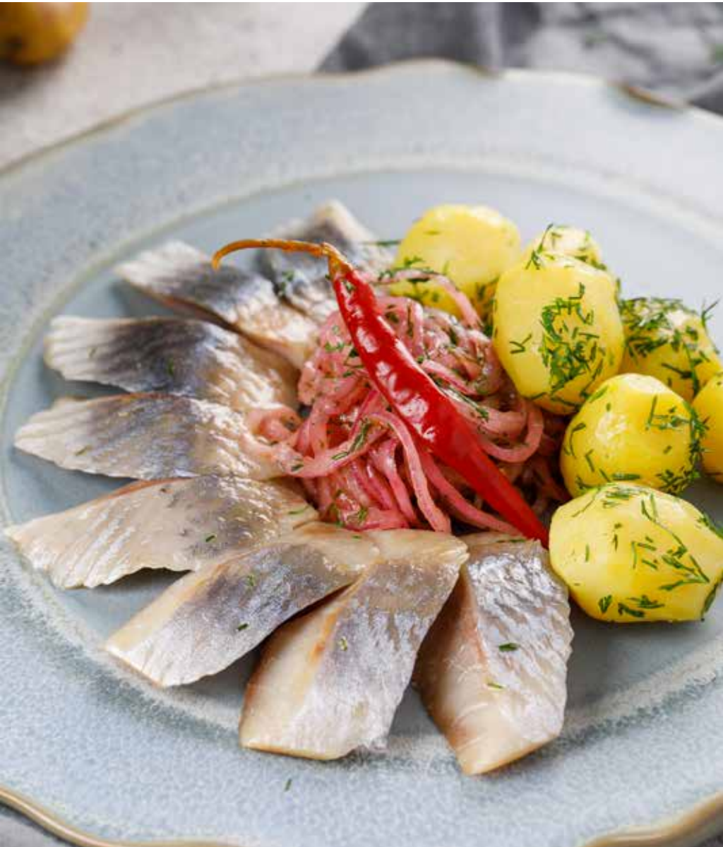
Балтийская сельдь с молодым картофелем 100/150/20 г 420 ₽ Baltic herring with young potatoes | 波罗地海鲱鱼配新马铃薯