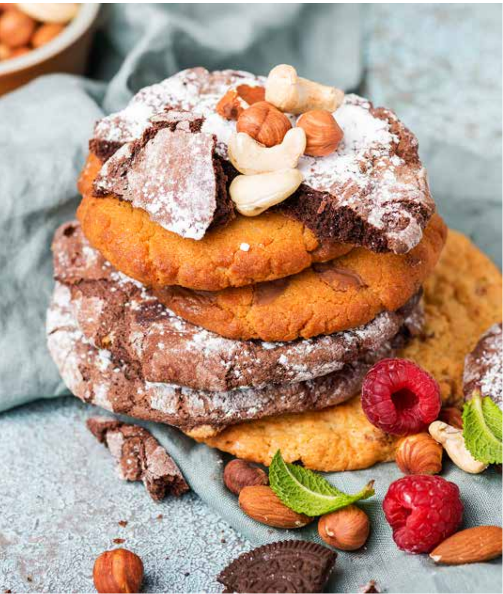
Печенье с арахисовой пастой / овсяное / двойной шоколад 55 г 150 ₺ Peanut butter cookies / oatmeal cookie / double chocolate 燕麦饼干 / 双重巧克力饼干 / 花生酱饼干