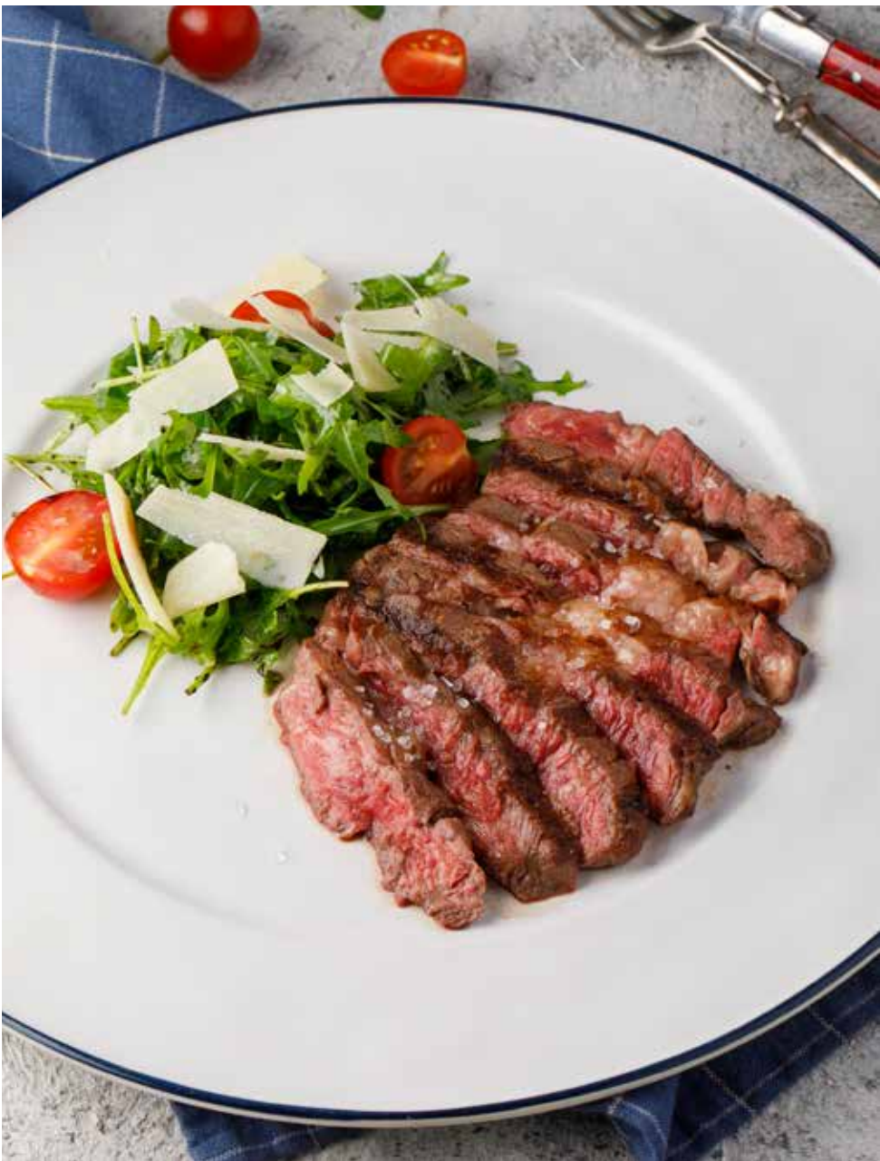
Тальятта из говядины 250 г 1650 ₽ Beef tagliata | 牛排配芝麻菜和巴马臣奶酪薄片