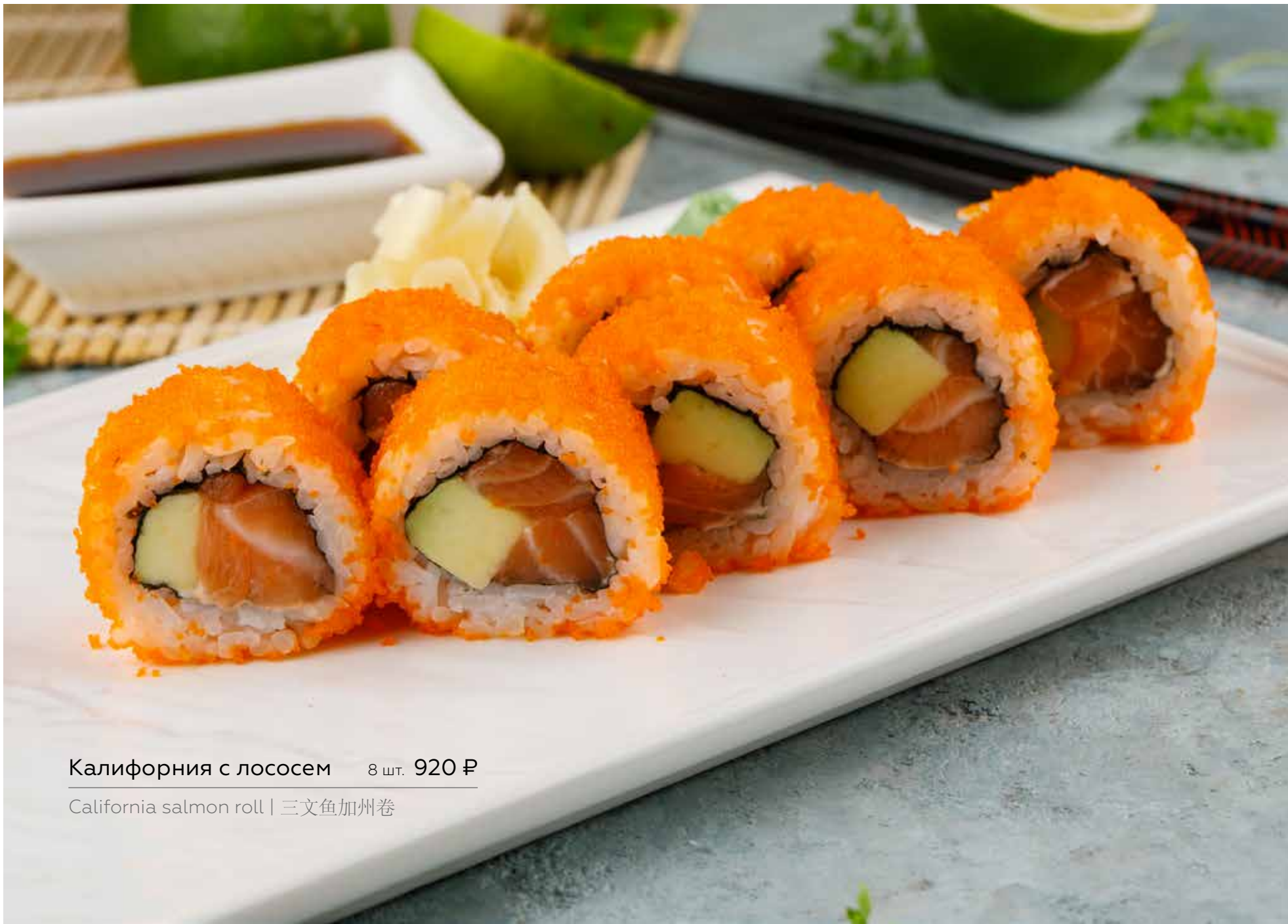
Калифорния с лососем 8 шт. 920 Р California salmon roll | 三文鱼加州卷