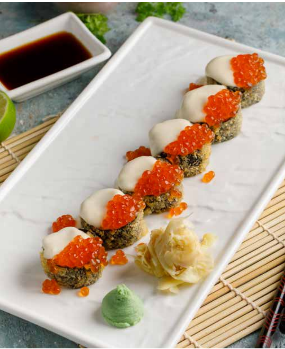
Горячий ролл с копченым лососем и красной икрой 6 шт. 1100 ₹

Hot roll with smoked salmon and red caviar 熏三文鱼红鱼子酱热卷