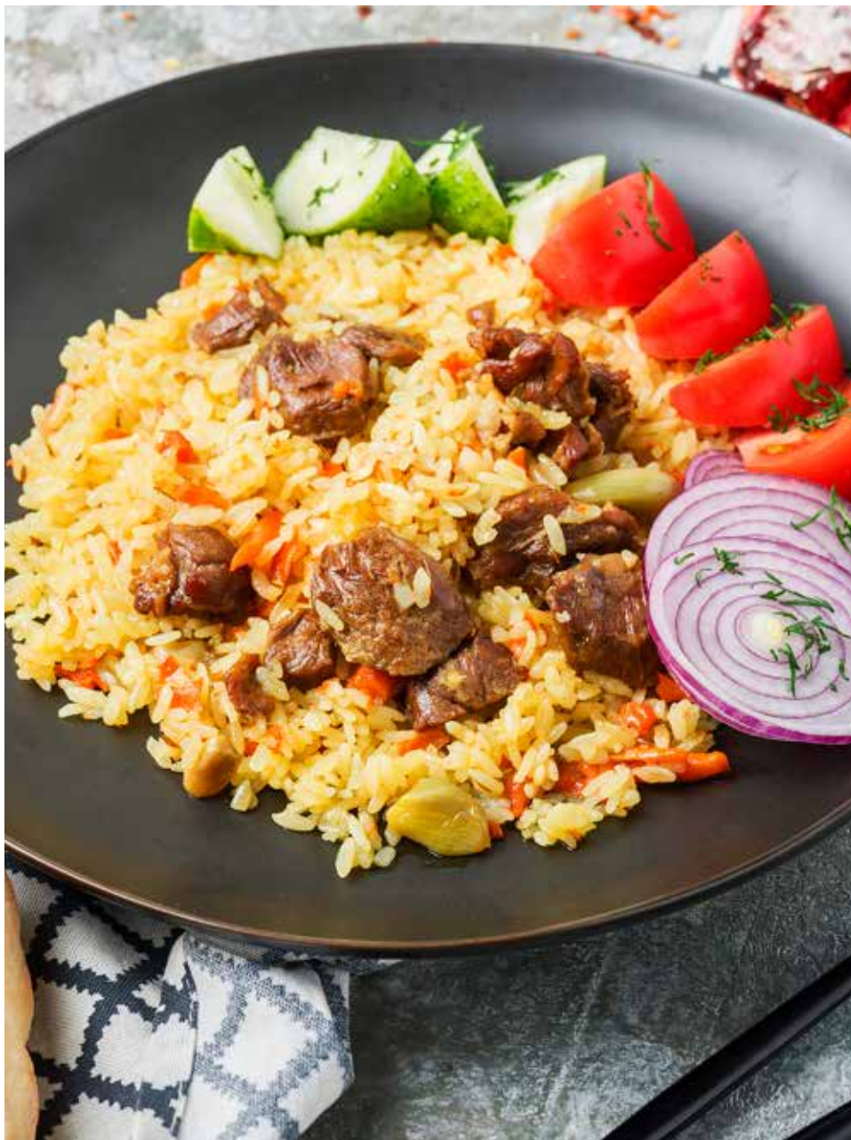
Плов с бараниной и овощами 300/40/40/15 г 570 ₽ Pilaf with mutton and vegetables | 羊肉蔬菜手抓饭