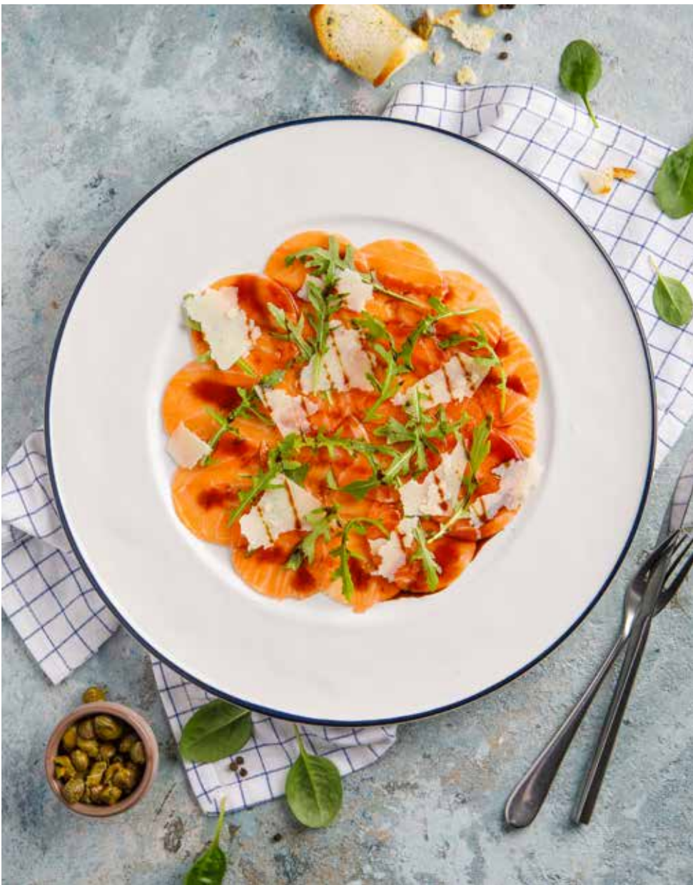
Карпаччо из лосося 110 г 790 ₽ Salmon carpaccio | 意式薄切三文鱼