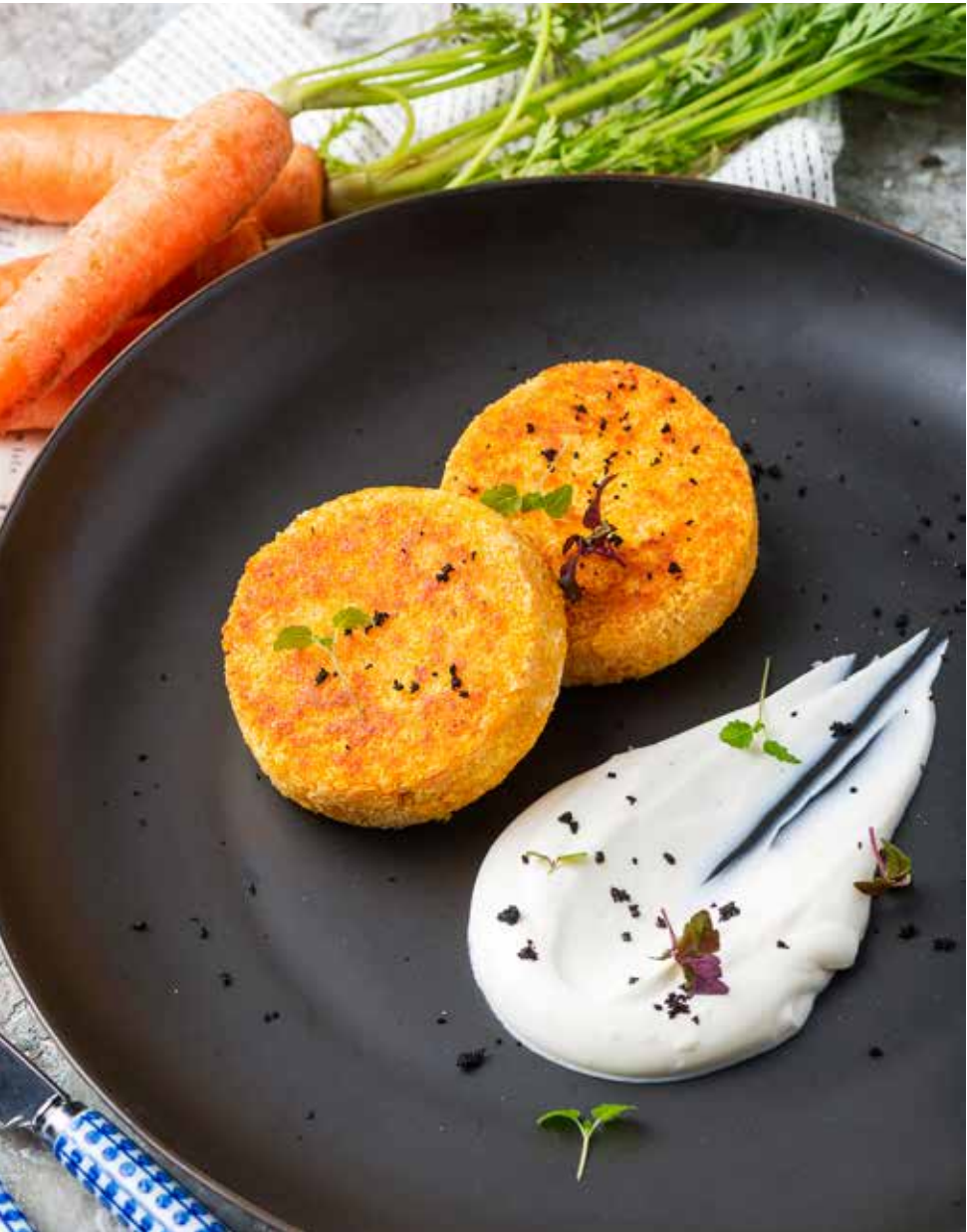
Морковные котлеты 180/40 г 350 ₽ Carrot patties | 胡萝卜饼