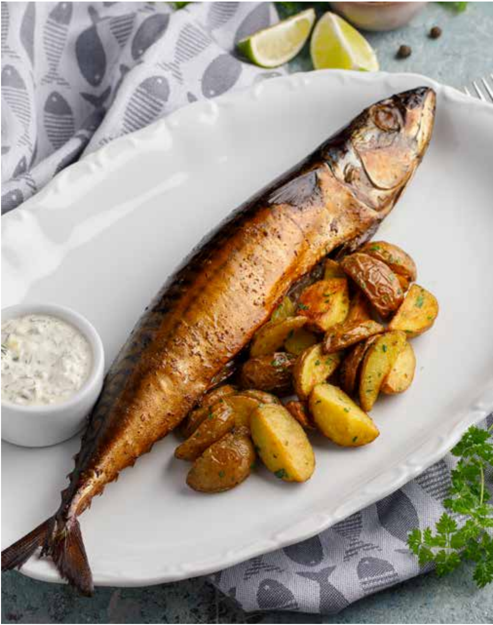
Скумбрия горячего копчения 1 шт./100/50 г 690 ₽ Hot smoked mackerel | 熏鲭鱼配香煎土豆块