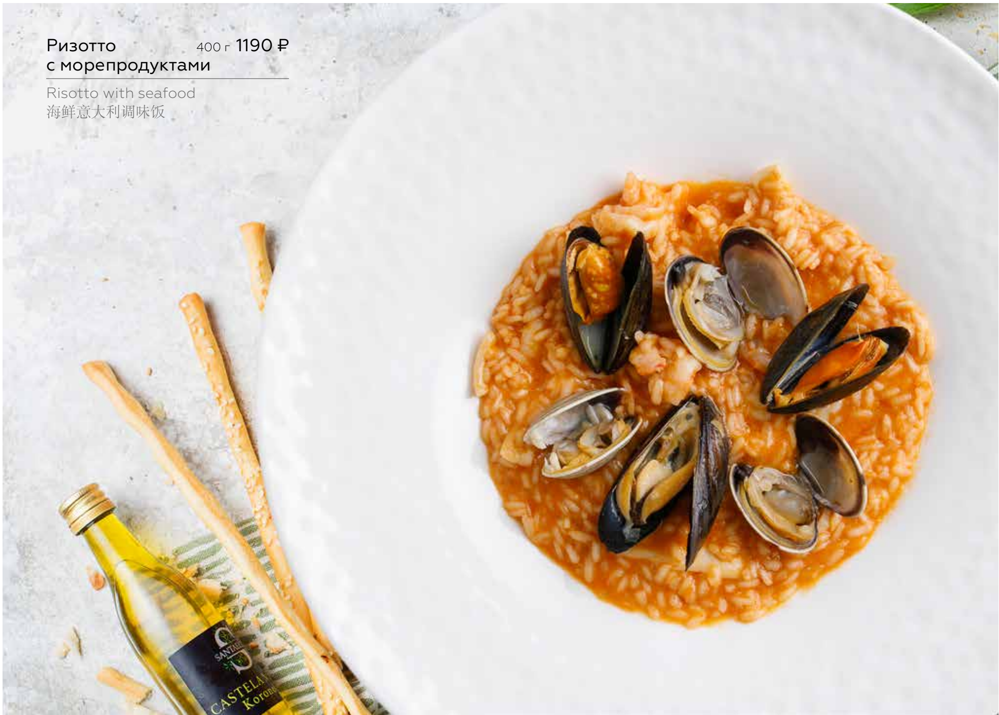
Ризотто с морепродуктами 400 г 1190 Р Risotto with seafood 海鲜意大利调味饭