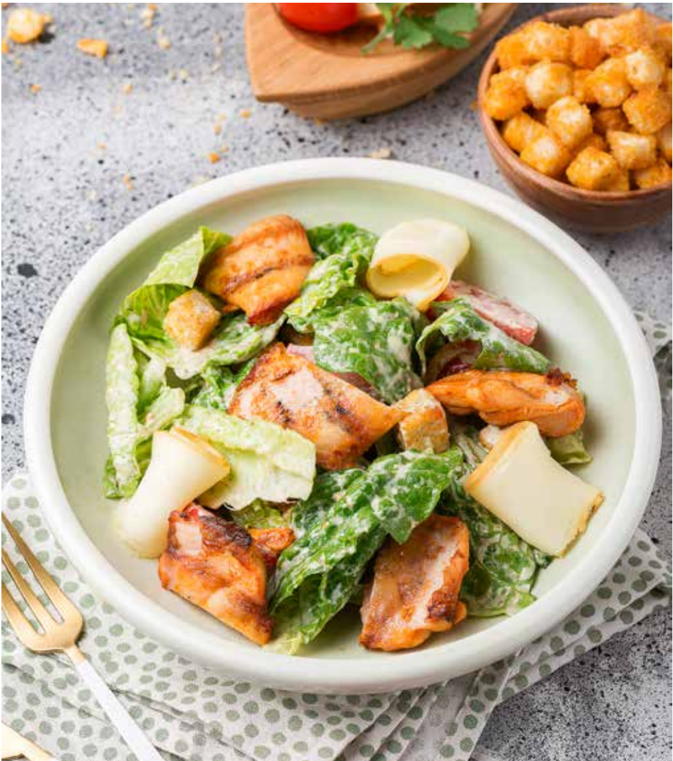
Теплый салат с курицей и копченым сулугуни