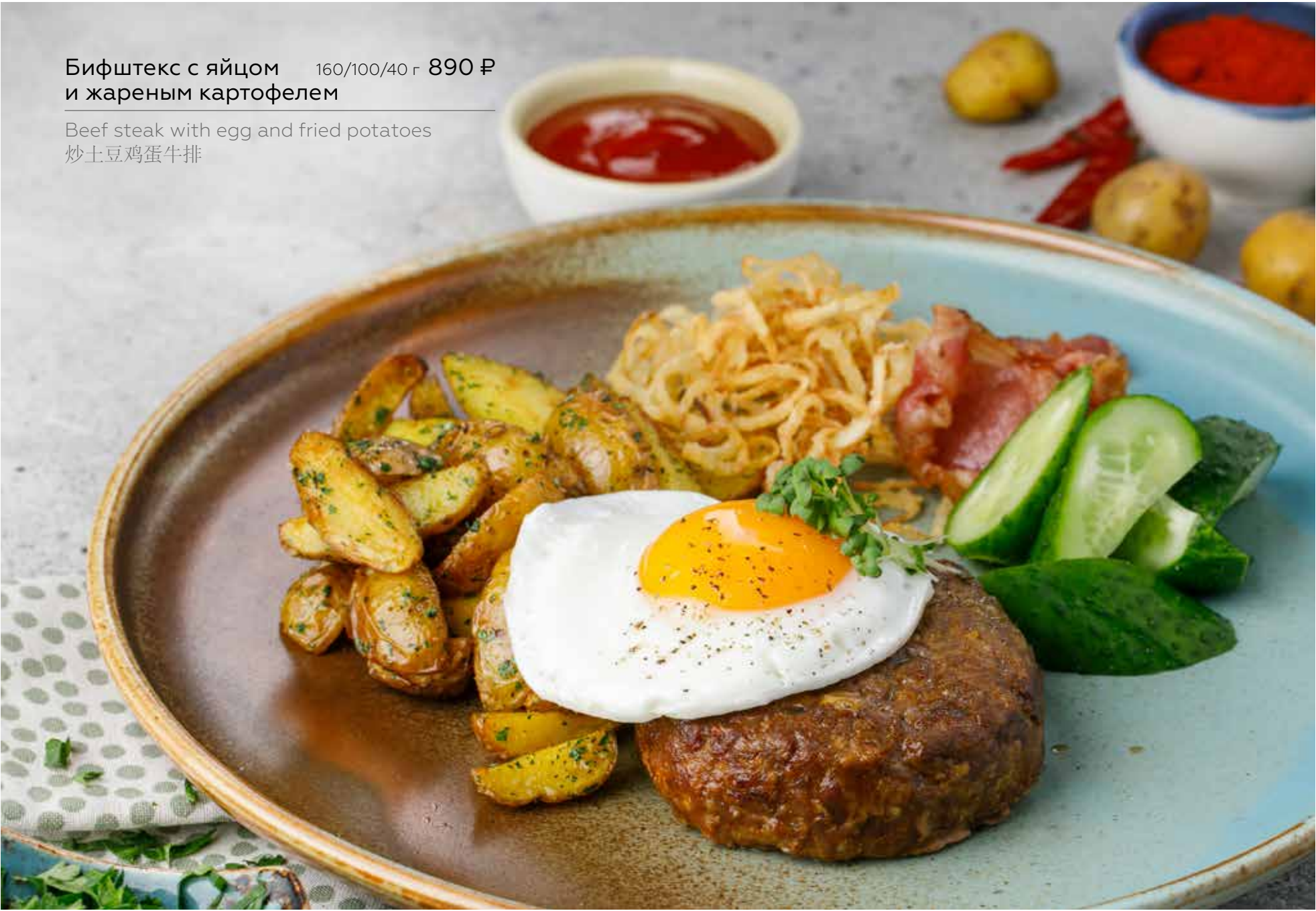
Бифштекс с яйцом и жареным картофелем 160/100/40 г 890 ₽ Beef steak with egg and fried potatoes 炒土豆鸡蛋牛排