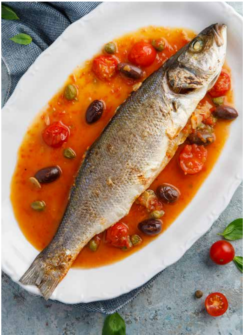
Сибас по-средиземноморски 230 г 1450 ₽ Mediterranean style sea bass | 地中海式烤海鲈鱼