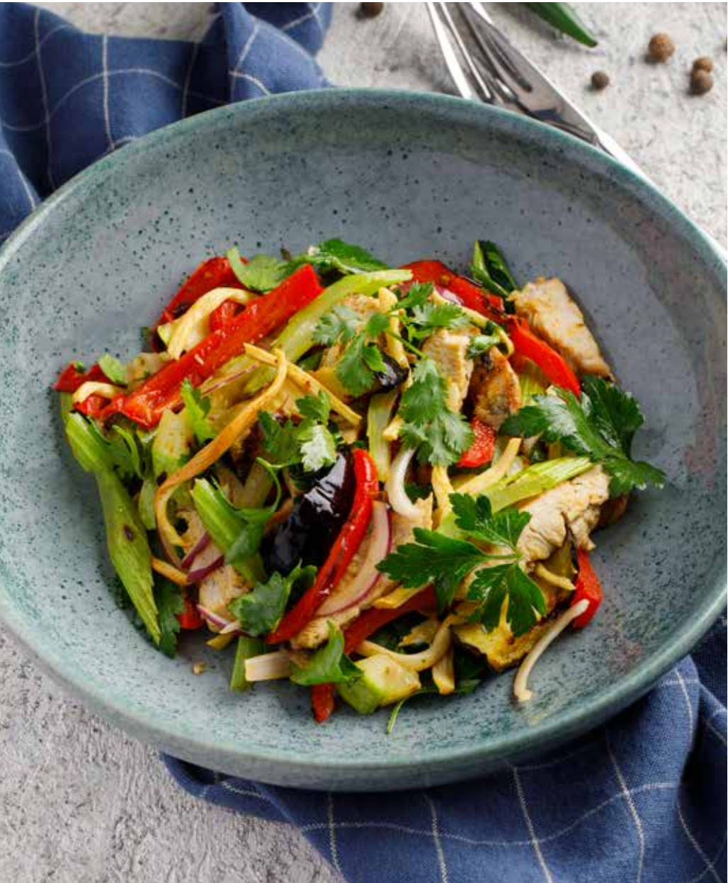
Гриль-салат Grilled salad | 烧烤沙拉