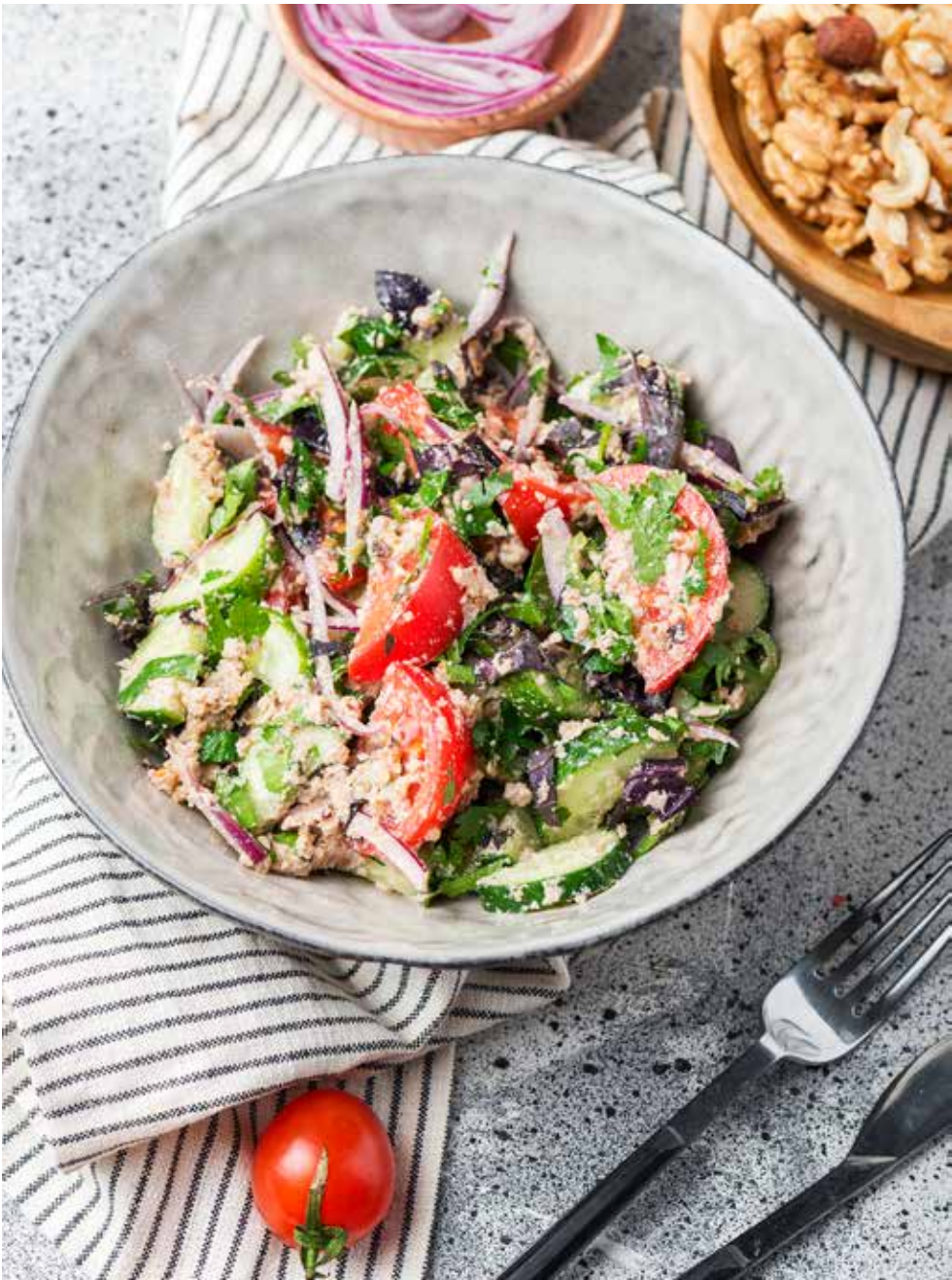
Овощной салат по-грузински с орехами

Georgian vegetable salad with spices | 格鲁吉亚式五香蔬菜沙拉