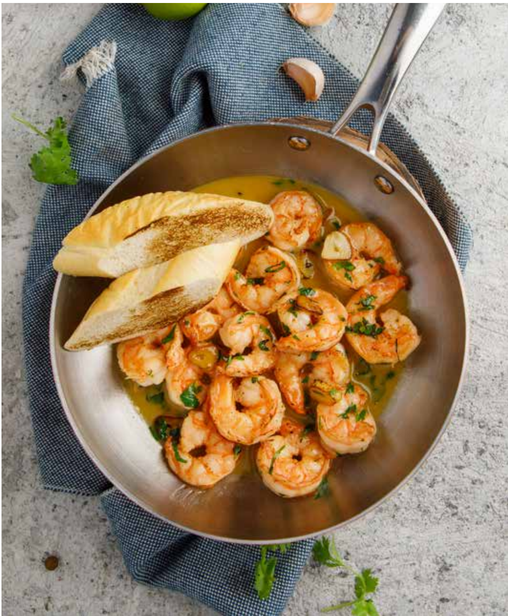
Креветки с чесноком и зеленью на сковороде 130 г 930 ₽ Shrimps with garlic and herbs in the pan | 蒜蓉鲜菜炒虾