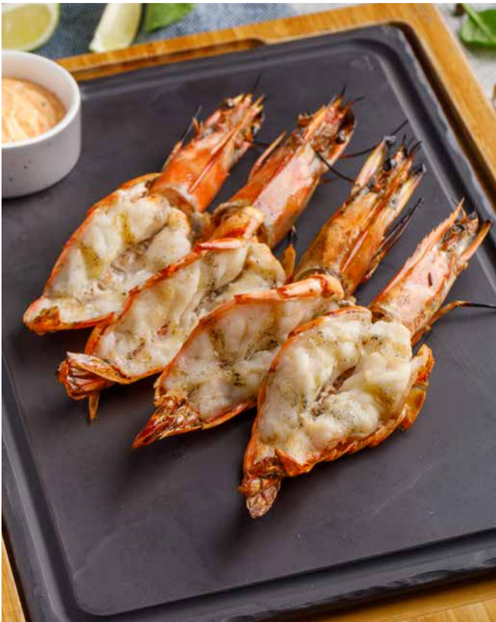
Креветки в панцире на гриле 350/50 г 2900 ₽ Grilled shell-on shrimps | 香烤虾