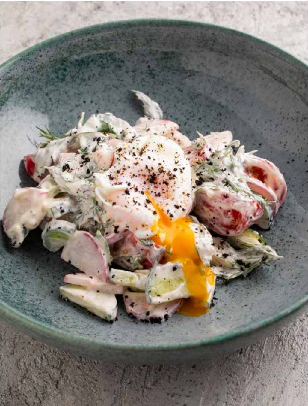
Салат из овощей с яйцом пашот