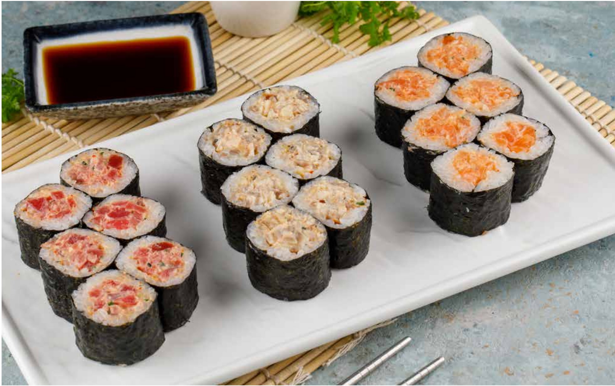
Острый ролл с тунцом 6 шт. 690 ₺ Spicy tuna roll | 金枪鱼辣卷