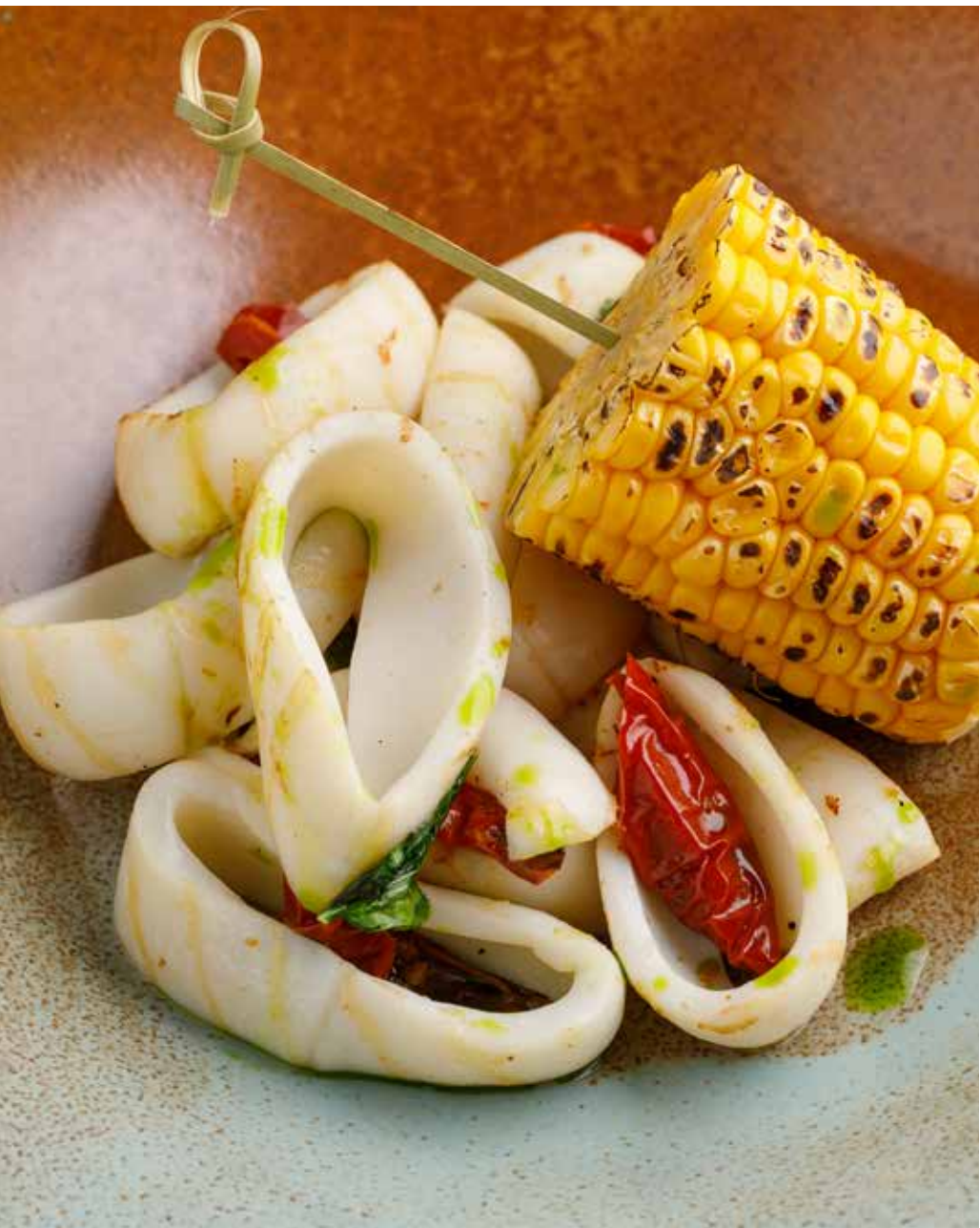
Кальмар, жаренный на гриле 230 г 950 ₽ Grilled squid | 烧烤鱿鱼