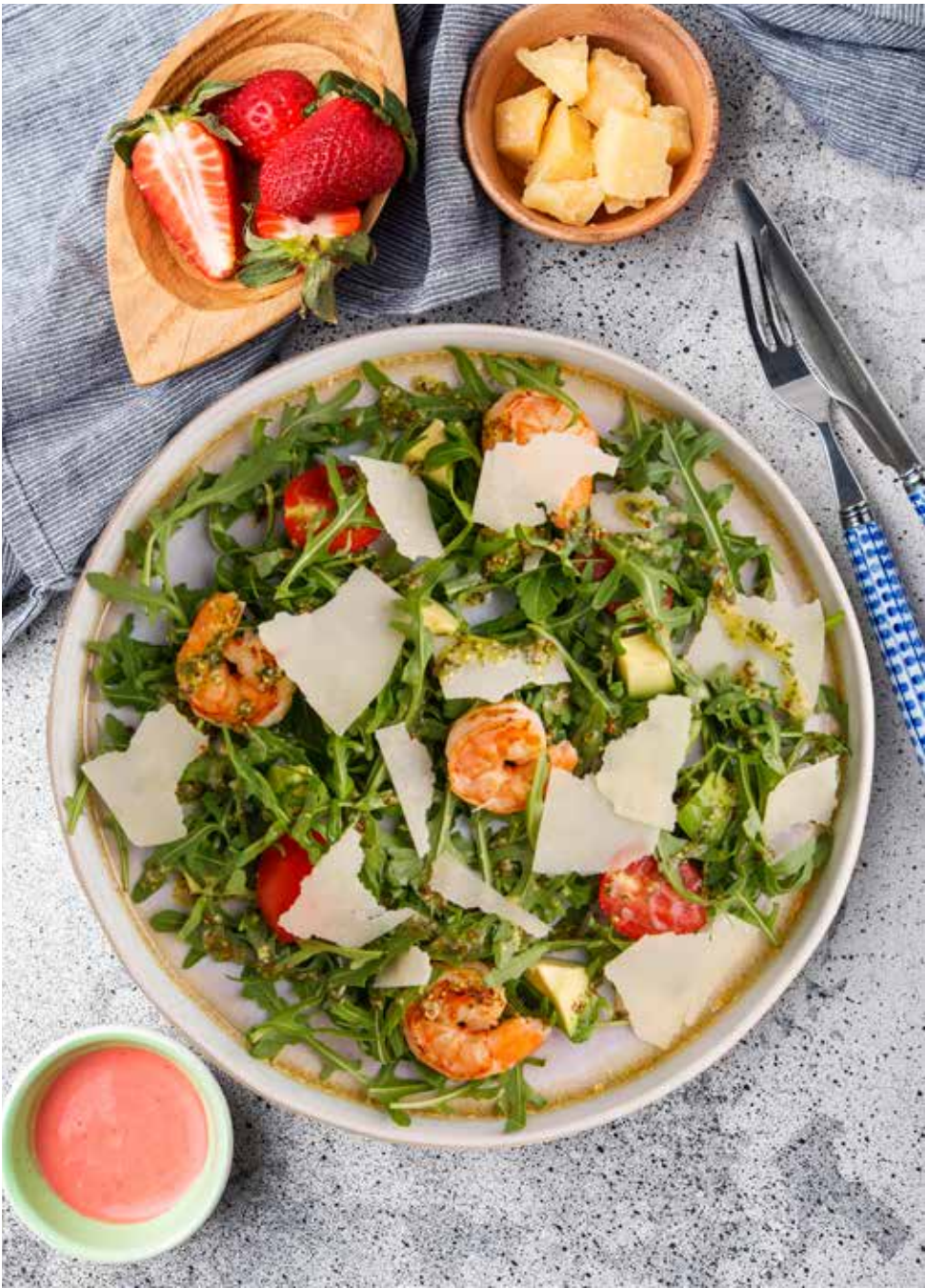
Салат с рукколой и креветками

Georgian vegetable salad with nuts | 格鲁吉亚式坚果蔬菜沙拉