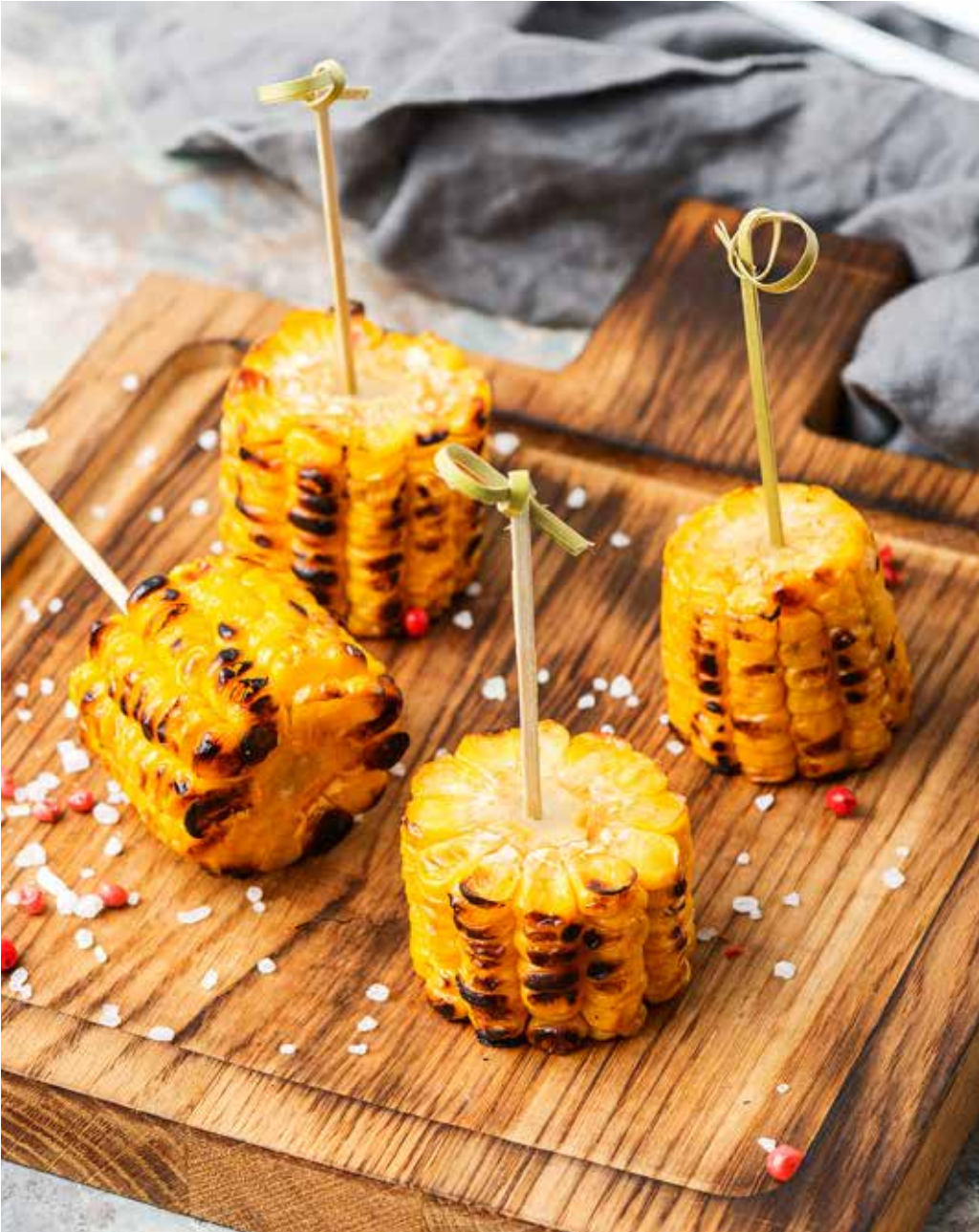
Кукуруза (отварная или на гриле) 225 г 220 ₺ Corn cob (boiled / grilled) | 玉米果穗 (煮/蒸)