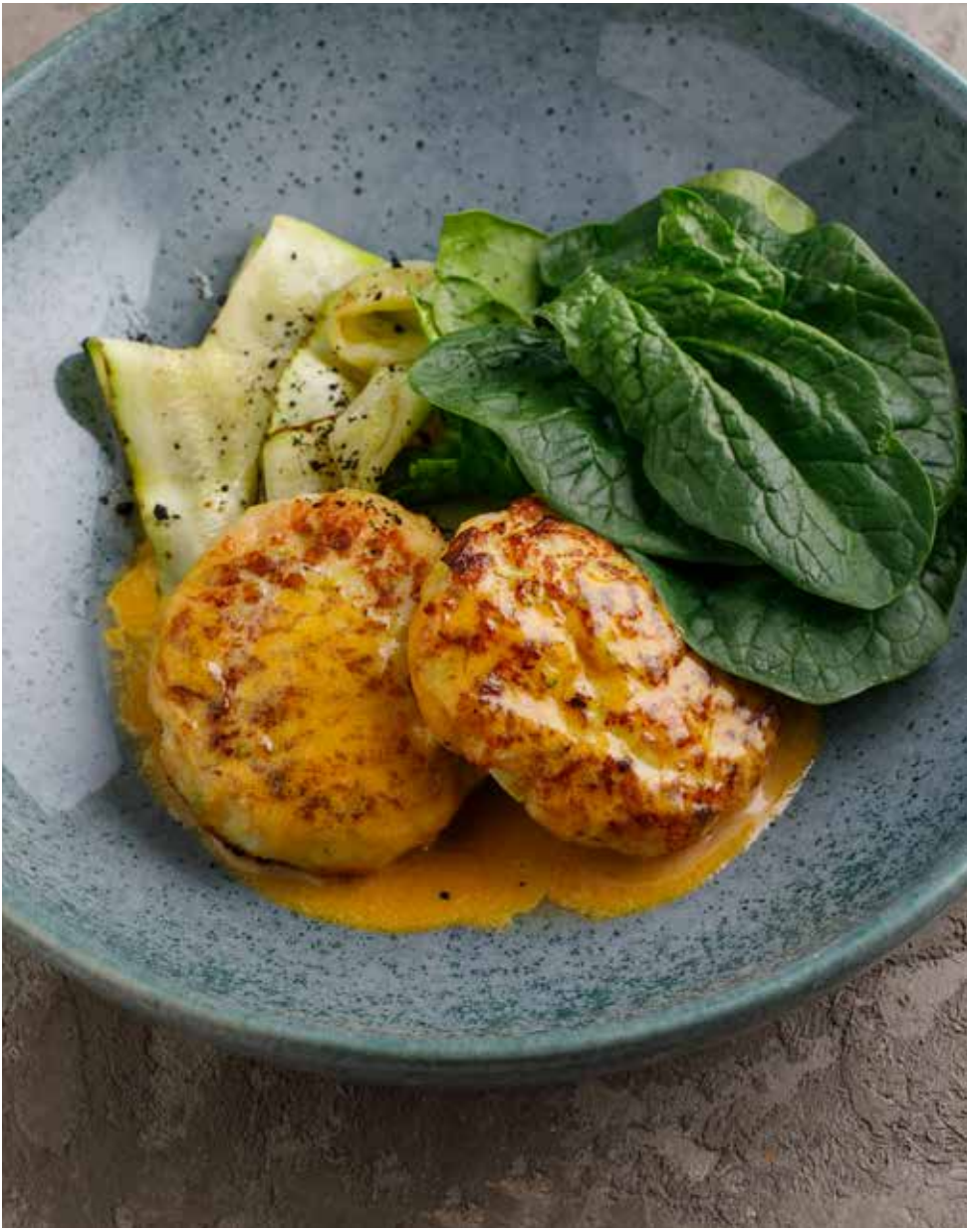
Рыбные котлеты 140/150 г 680 ₽ Fish cutlets | 鱼肉饼（狗鱼）