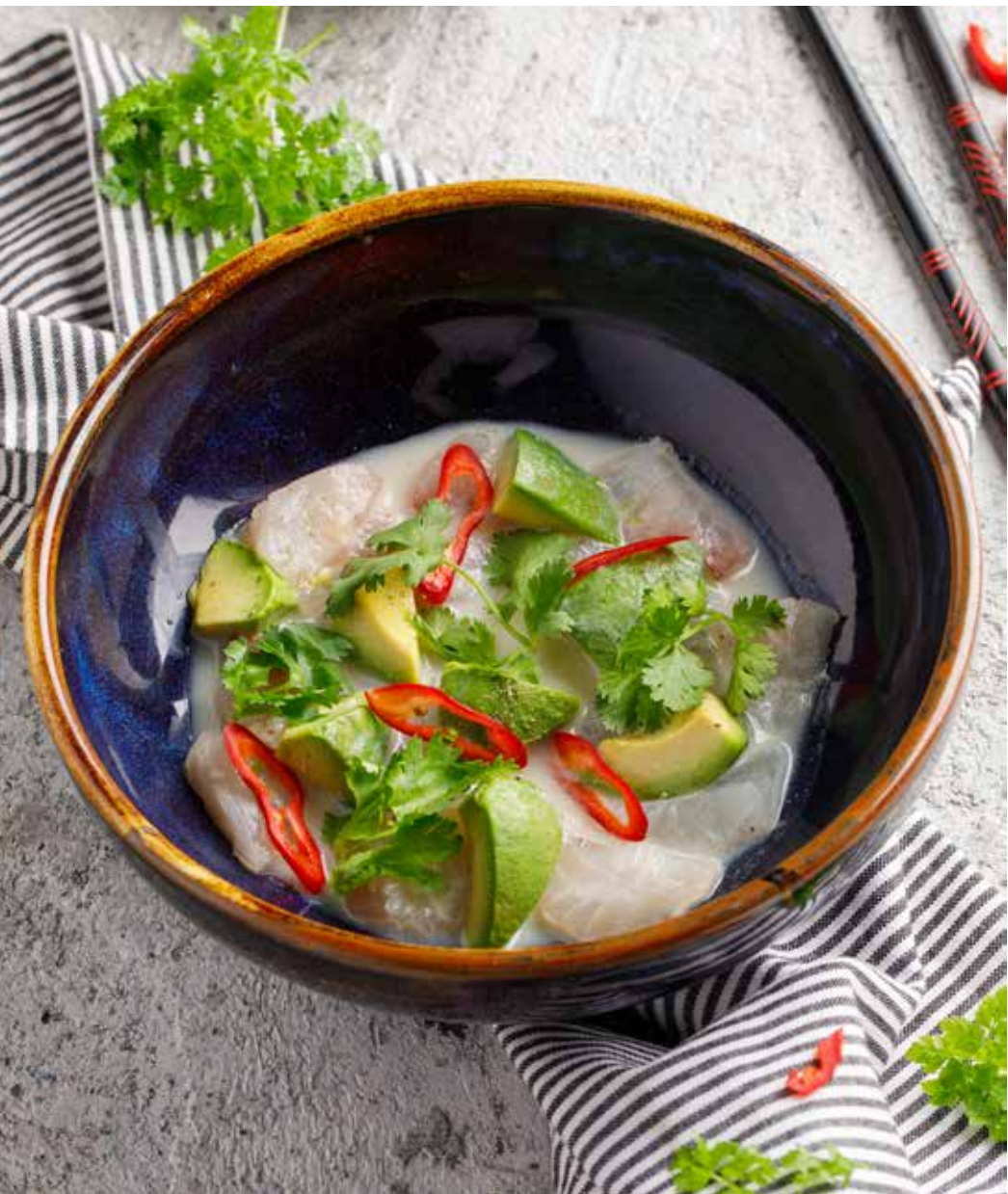
Севиче из дорадо 90/40/50 г 790 ₽ Dorado ceviche | 酸橘汁腌鲷