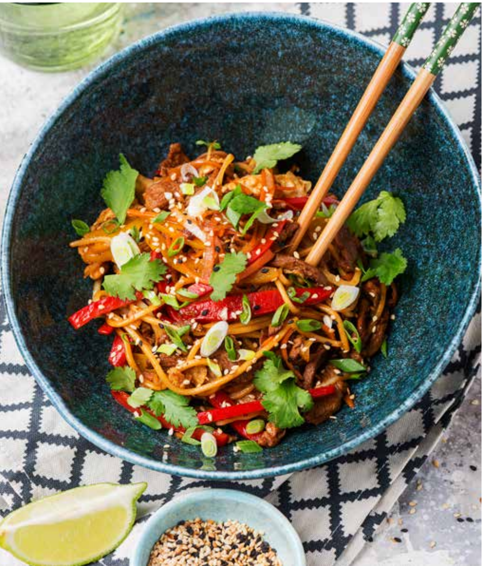
Рис с креветками wok 250 г 550 ₽ Rice with wok shrimps | 虾配米饭