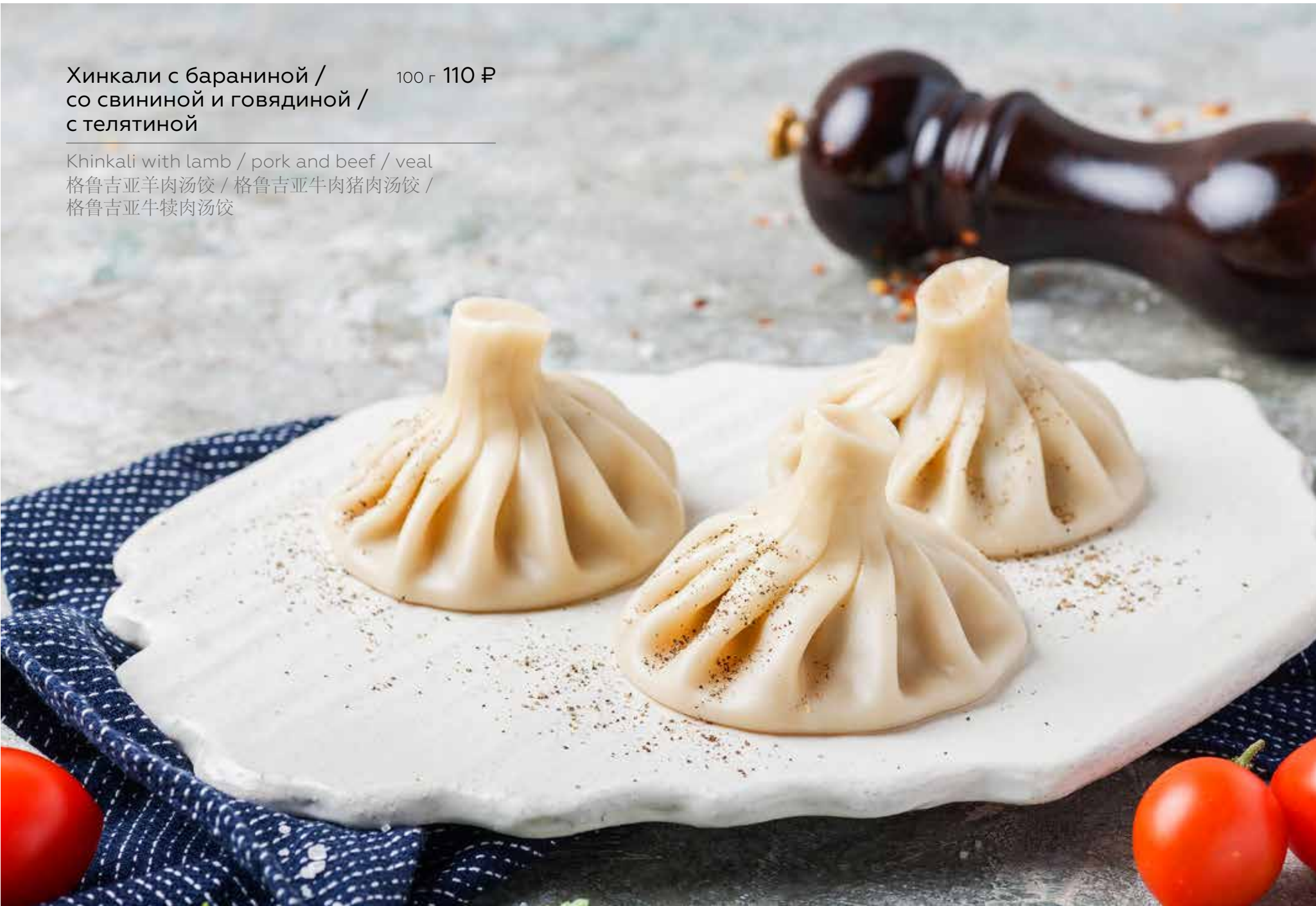
Хинкали с бараниной / со свининой и говядиной / с телятиной 100 г 110 ₽ Khinkali with lamb / pork and beef / veal 格鲁吉亚羊肉汤饺 / 格鲁吉亚牛肉猪肉肉汤饺 / 格鲁吉亚牛犊肉汤饺