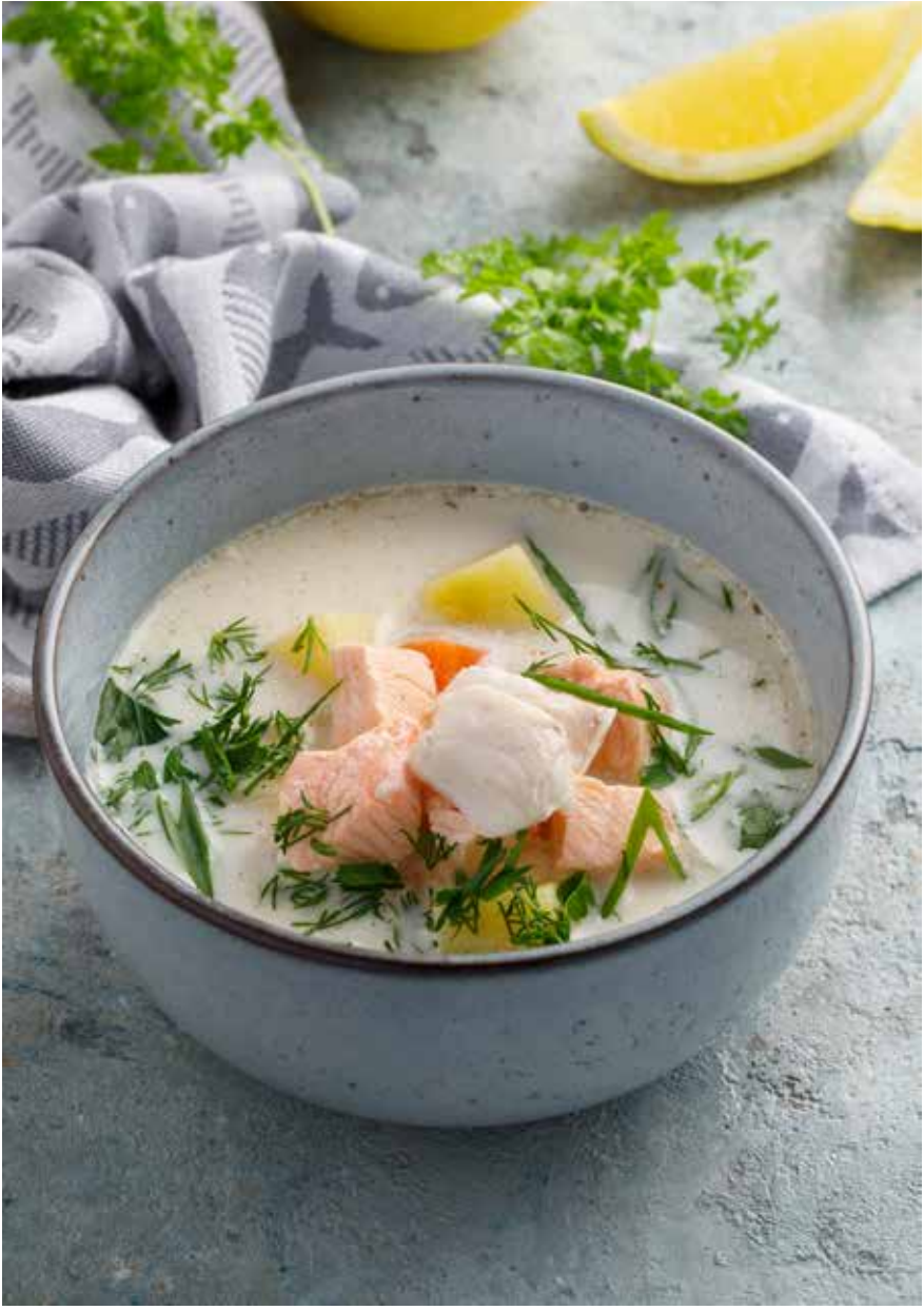
Уха с ржаными гренками 350/20 г 450 ₽ Fish soup with rye croutons | 鱼汤配油炸黑麦面包丁