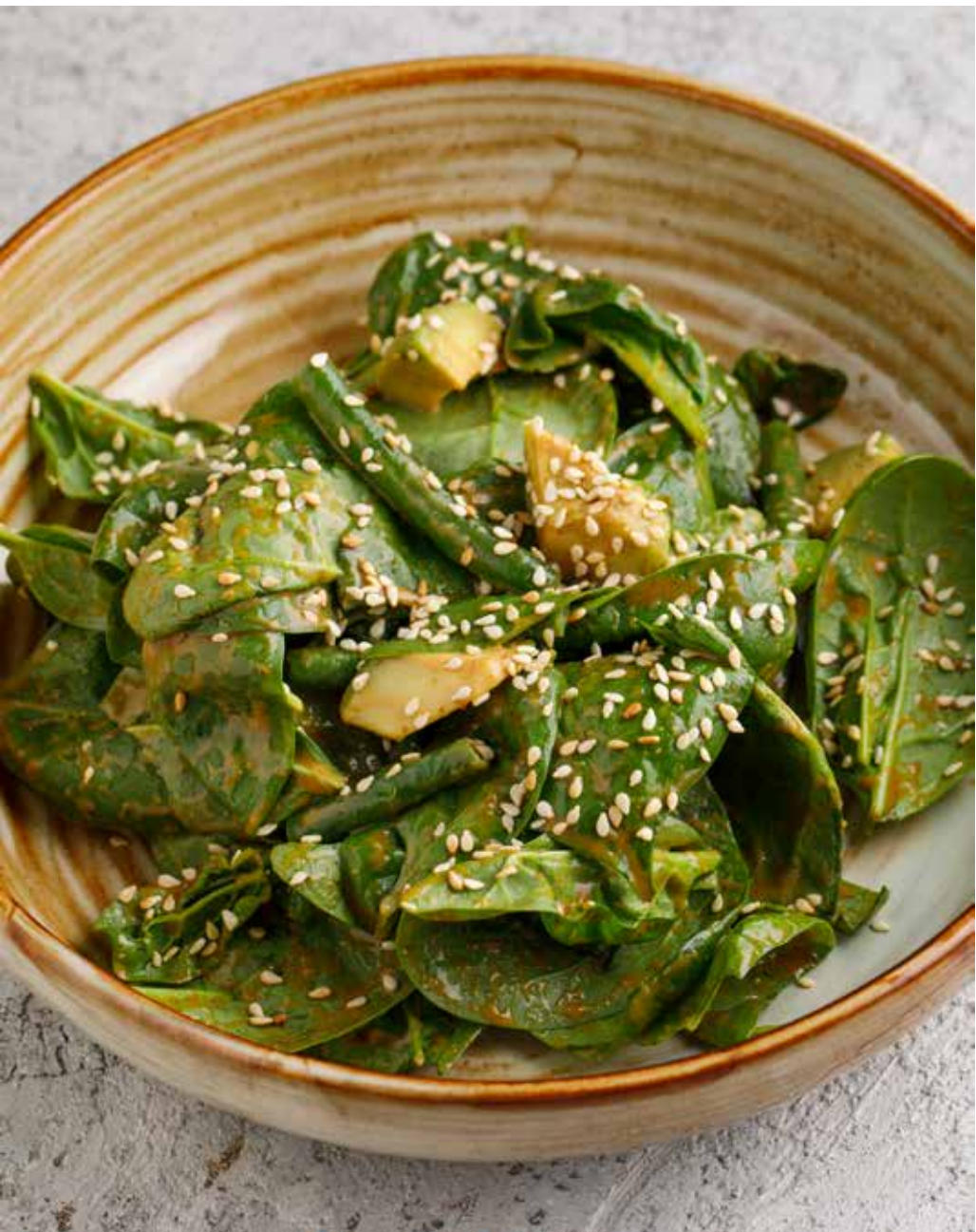
Зеленый салат с кунжутной заправкой Green salad with sesame dressing | 绿色沙拉配芝麻酱