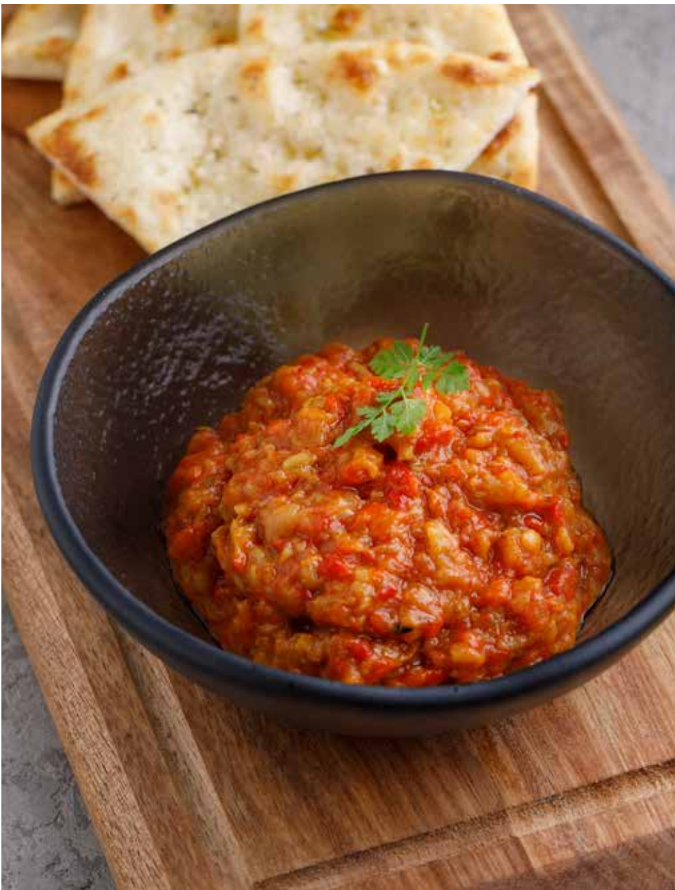
Баклажанная икра по-домашнему 170/60 г 540 ₽ Homemade eggplant pate | 家制茄子酱

Отварной говяжий язык 100/30 г 460 ₽ Boiled beef tongue | 煮牛舌 Ростбиф 100/30 г 640 ₽ Roast beef | 烤牛肉