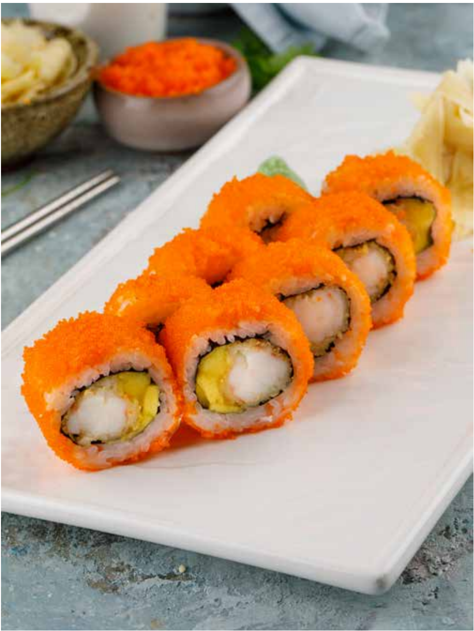
Ролл с креветкой темпура и манго 8 шт. 1200 Р Roll with tempura shrimp and mango | 酥炸虾仁芒果卷