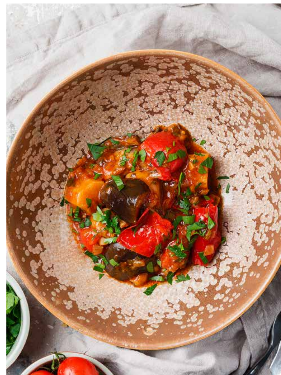
Аджапсандал 250 г 630 ₽ Ajapsandal | 格鲁吉亚式炖茄子

ЛОБИО «ХАРКАЛИЯ» KHARKALIYA LOBIO | 瓦罐焖 扁豆蔬菜 - 370 - 270 г