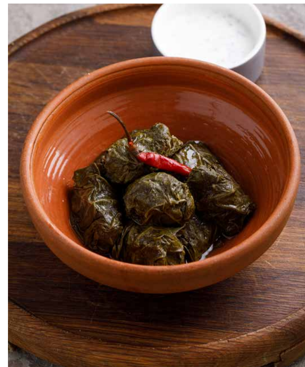
Долма с бараниной 370 г 580 ₽ Lamb dolma | 葡萄叶羊肉卷

ПРОСЬБА ПРЕДУПРЕЖДАТЬ ВАШЕГО ОФИЦИАНТА ОБ УИМОЩЕЯСЯ У ВАС АЛПЕРГУИ НА ОПРЕДЕЛЕННЫЕ ПРОДУКТЫ ПИТАНИЯ. ВСЕ ЦЕНЫ УКАЗАНЫ В РУБЛЯХ. НА ФОТО ИСПОЛЬЗОВАНЫ ЭЛЕМЕНТЫ ДЕКОРА. ДАННОЕ ИЗДАНИЕ ЯВЛЯЕТСЯ РЕКЛАМНЫМ МАТЕРИАЛОМ. С ПРЕЖКОУРАНТОМ, ВЫХОДОМ, ПИЩЕВОЙ И ЭНЕРГЕТИЧЕСКОЙ ЦЕННОСТЬЮ БЛЮД И ДРУГОЙ ИНФОРМАЦИЕЙ МОЖНО ОЗНАКОМИТЬСЯ В УГОЛКЕ ПОТРЕБИТЕЛЯ. PLEASE, TELL YOUR WAITER IF YOU HAVE ANY FOOD ALLERGY TO CERTAIN PRODUCTS. ALL PRICES ARE IN RUBLES. THE PICTURES HAVE DECORATIVE ELEMENTS. 如果您对某些饮食会有过敏反应, 请通知您的服务员. 所有价格为卢布价.