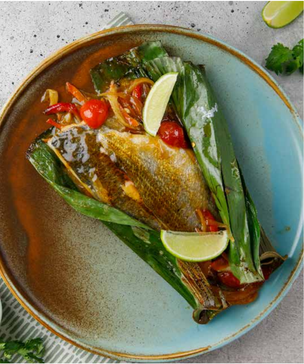
Дорадо в банановом листе 450 г 1450 ₽ Dorado in a banana leaf | 蕉叶烤金头鲷