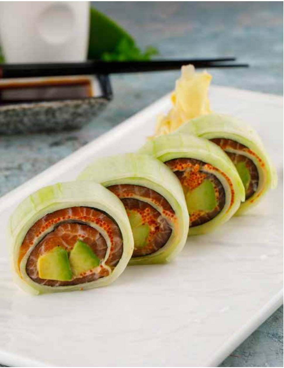
Фреш-ролл с лососем 4 шт. 950 ₹