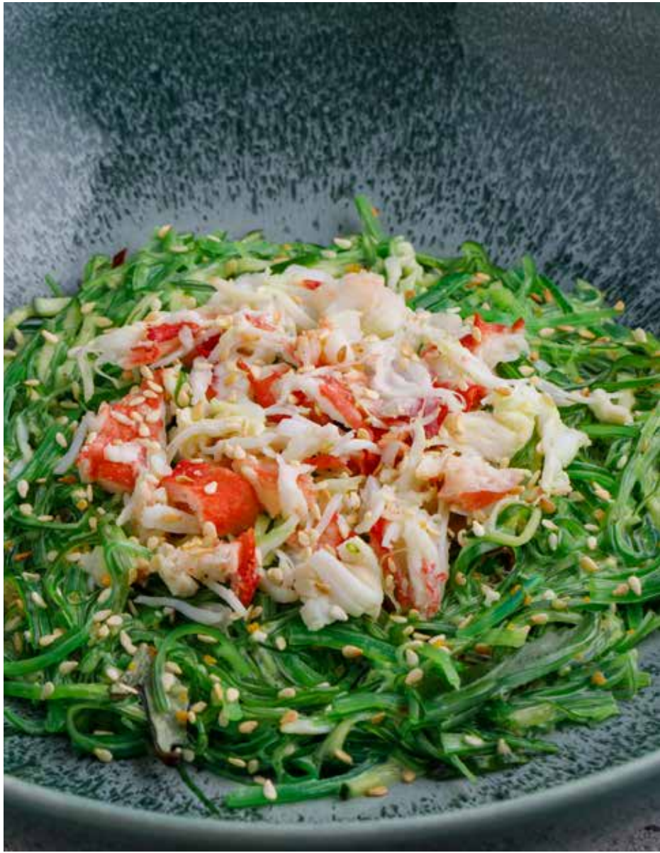
Салат «Кайсо» с ореховым соусом / крабом Kaiso salad with peanut sauce / crab | 果仁酱/螃蟹海糟沙拉