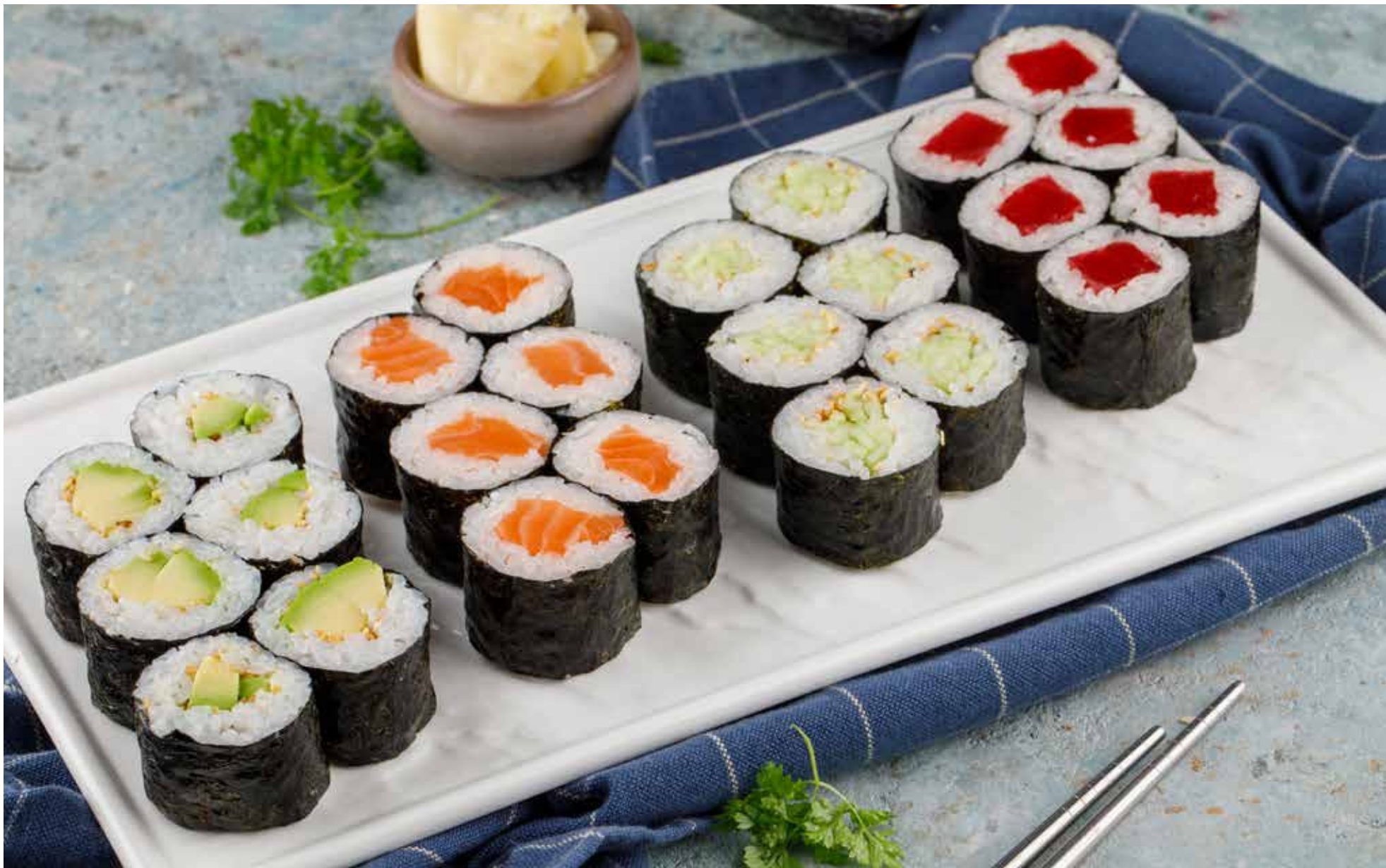
Ролл с авокадо 6 шт. 360 ₺ Avocado roll | 牛油果卷