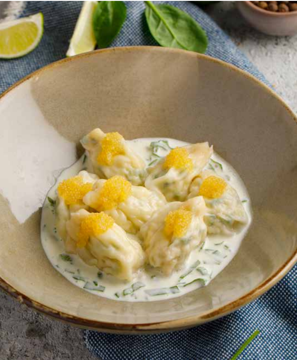
Патара со щукой 115/45/8 г 430 ₽ Patara with pike | 格鲁吉亚式狗鱼饺子