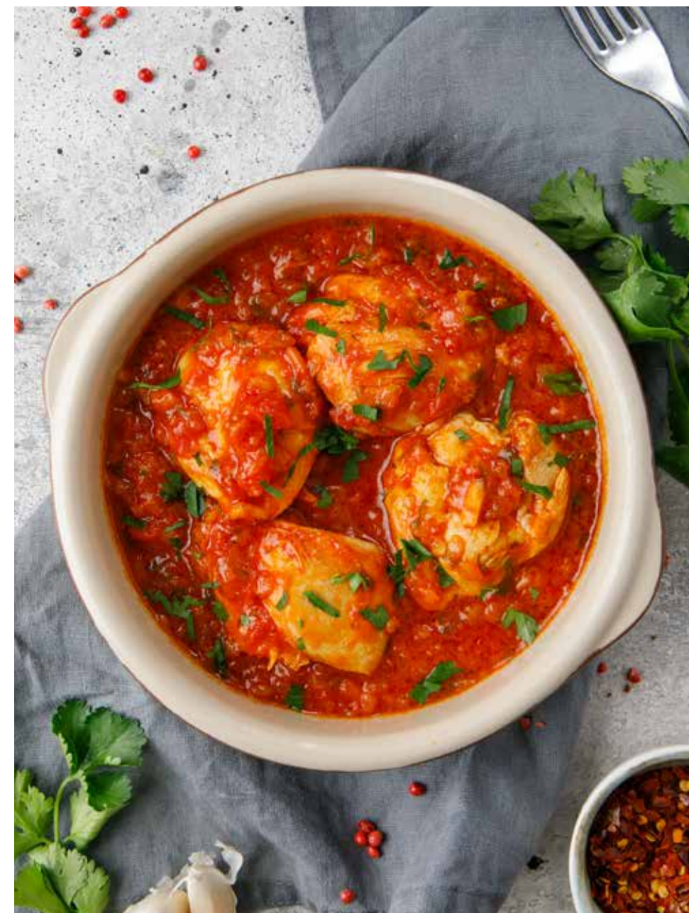
Чахохбили 300/2 г 430 ₽ Chakhokbili | 格鲁吉亚式家禽肉炖菜

ЦИЦИЛА ПО-ГАЛЬСКИ GALI CICILA 格鲁吉亚式烤雏鸡 - 740 - 1 шт./100/30/30 г