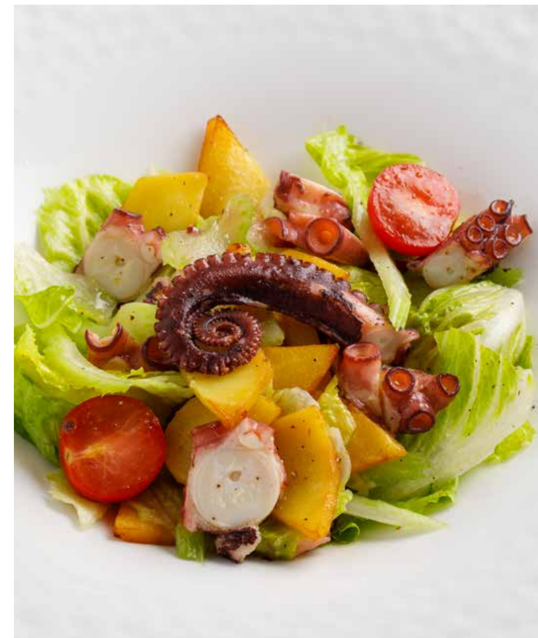
Салат с осьминогом 230 г 1530 ₽ Octopus salad | 章鱼沙拉