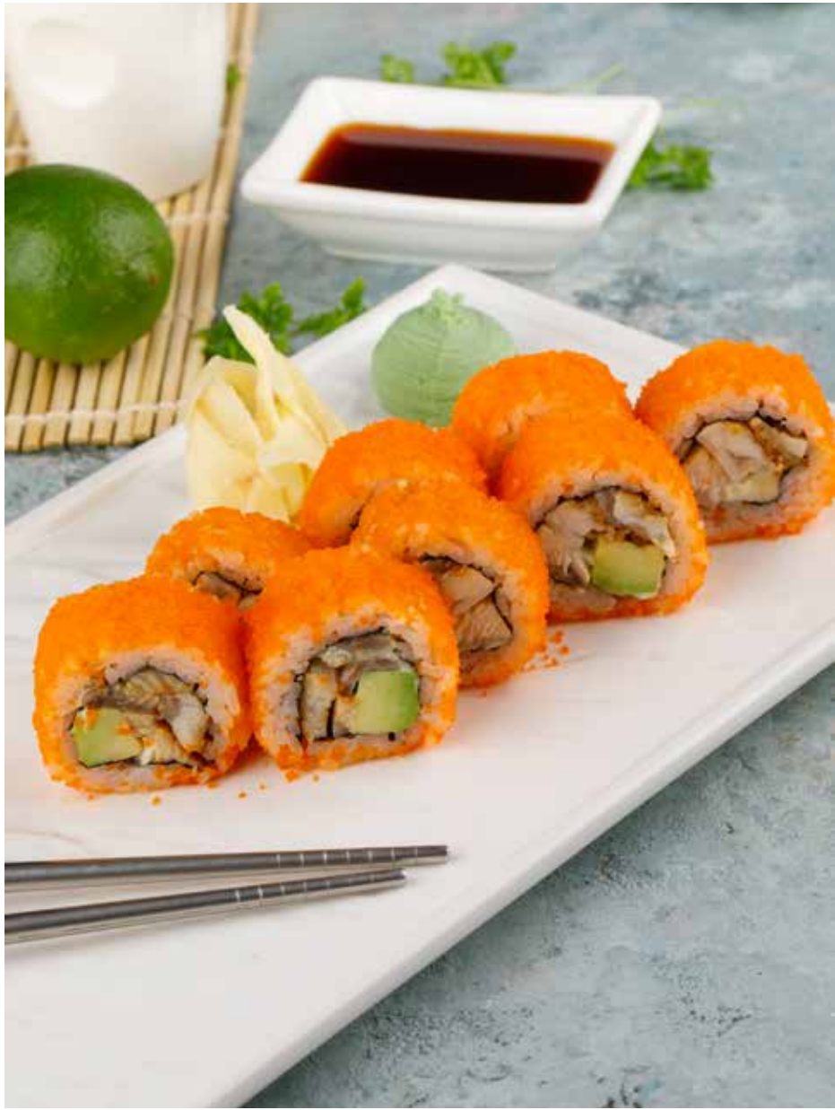
Калифорния с угрем 8 шт. 960 Р California roll with eel | 鳗鱼加州卷