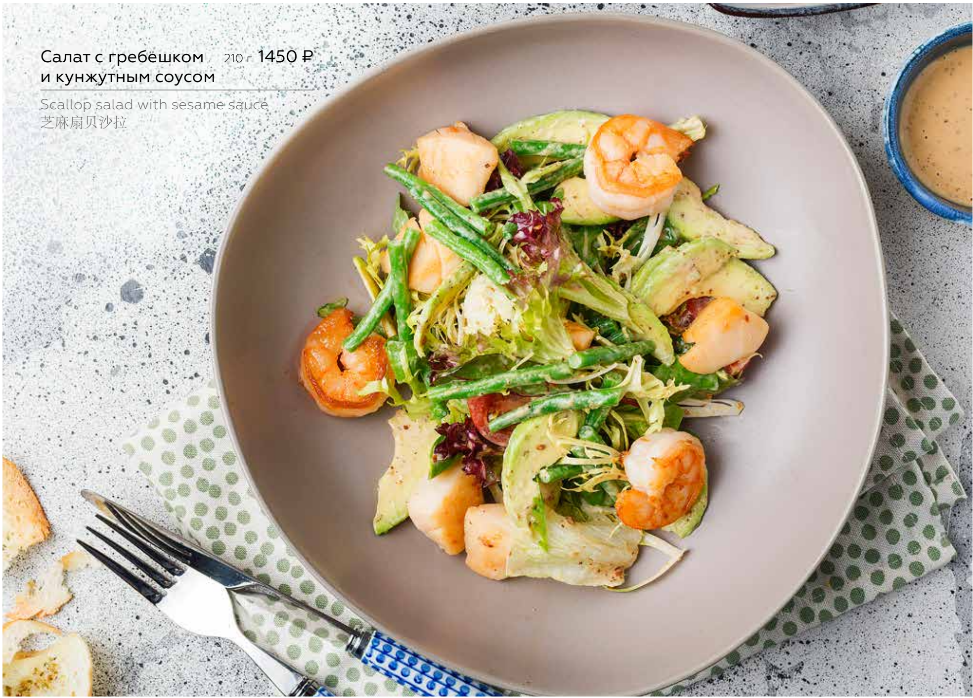
Салат с гребешком и кунжутным соусом Scallop salad with sesame sauce 芝麻扇贝沙拉