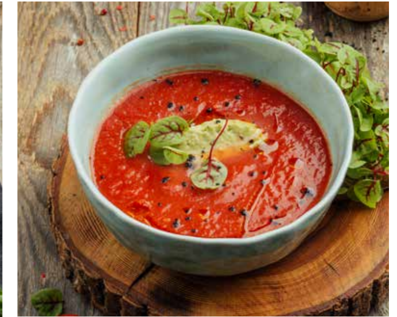
ГАСПАЧО С ГУАКАМОЛЕ