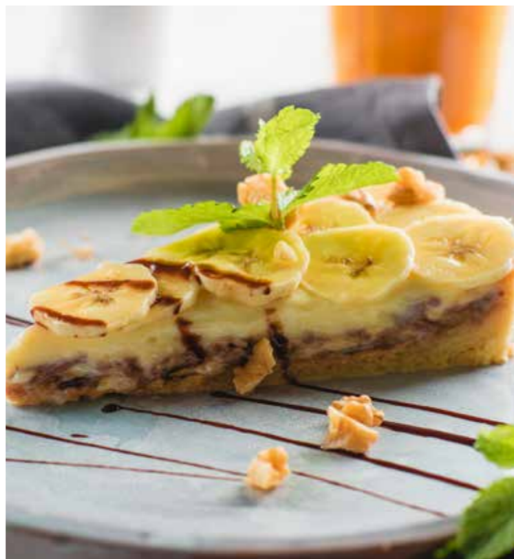
ШОКОЛАДНО-БАНАНОВЫЙ ТОРТ 🍷 150 410₽