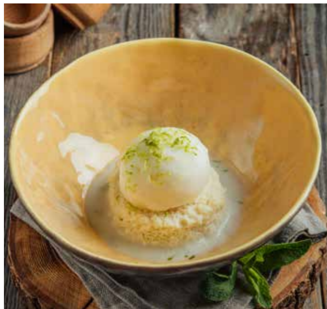
ДЕСЕРТ «ТРИ МОЛОКА» С ЛИМОННЫМ СОРБЕТОМ 🍷 170 390₽