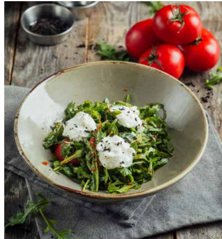
САЛАТ С РУККОЛОЙ И СТРАЧАТЕЛЛОЙ