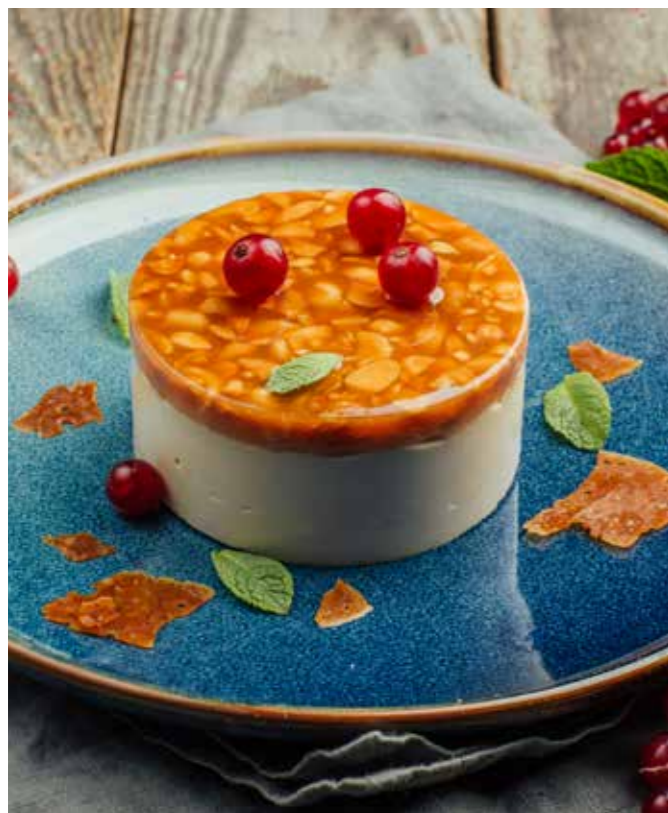
АРАХИСОВЫЙ ДЕСЕРТ 🍷 185 460₽