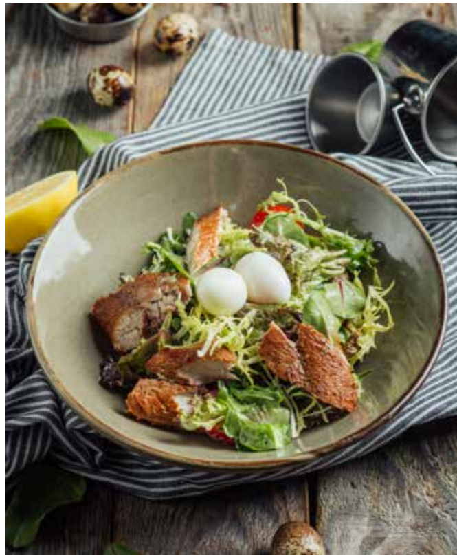
САЛАТ С ПОДКОПЧЕННОЙ СКУМБРИЕЙ