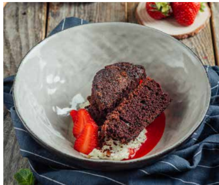
ШОКОЛАДНЫЙ ДЕСЕРТ С КОПЧЕНЫМИ ОРЕХАМИ 🍷 180 410₽