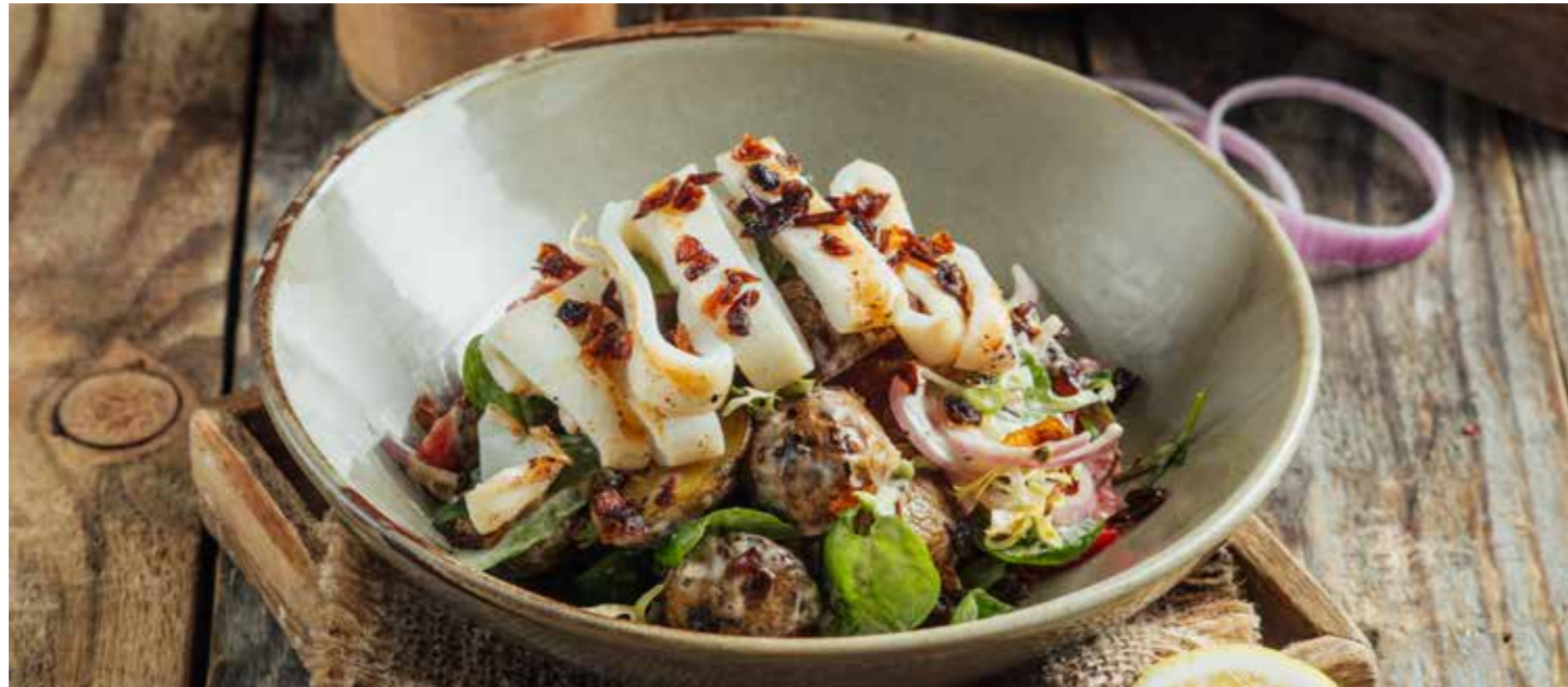
САЛАТ С ТЕПЛЫМ КАЛЬМАРОМ И БЕБИ-КАРТОФЕЛЕМ