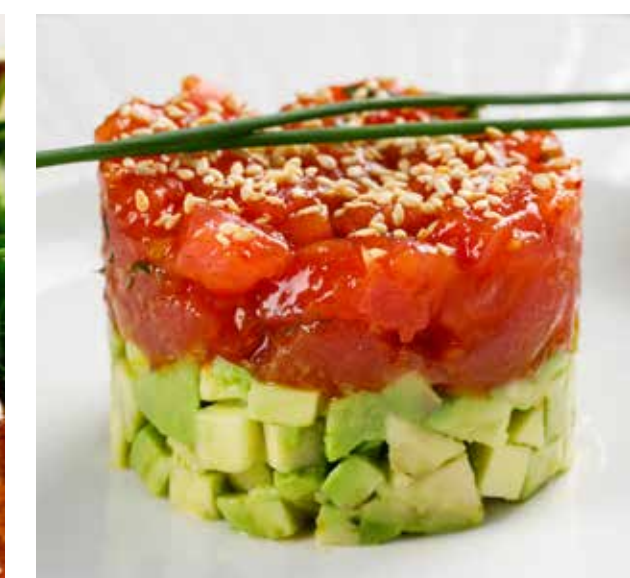
ТАРТАР ИЗ ТУНЦА С АВОКАДО