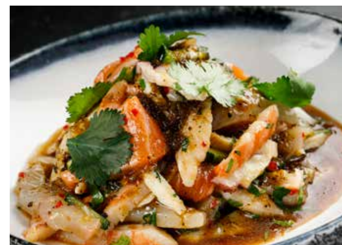
СЕВИЧЕ В ЯПОНСКОМ СТИЛЕ