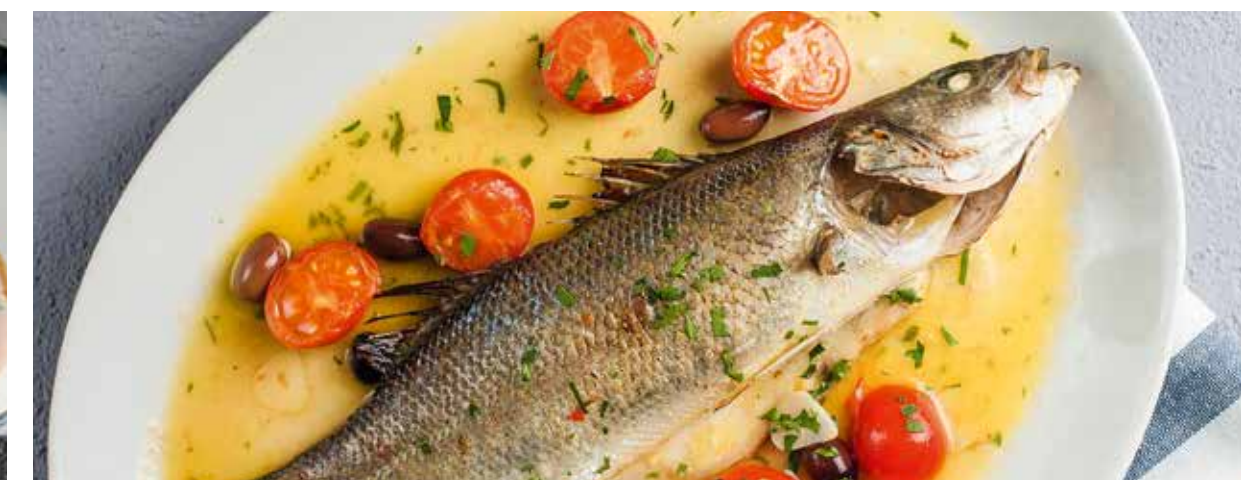
СИБАС АКВА ПАЦЦА