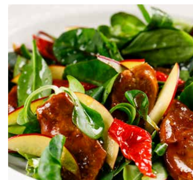
ТЕПЛЫЙ САЛАТ С УТКОЙ И ПЕРСИКАМИ